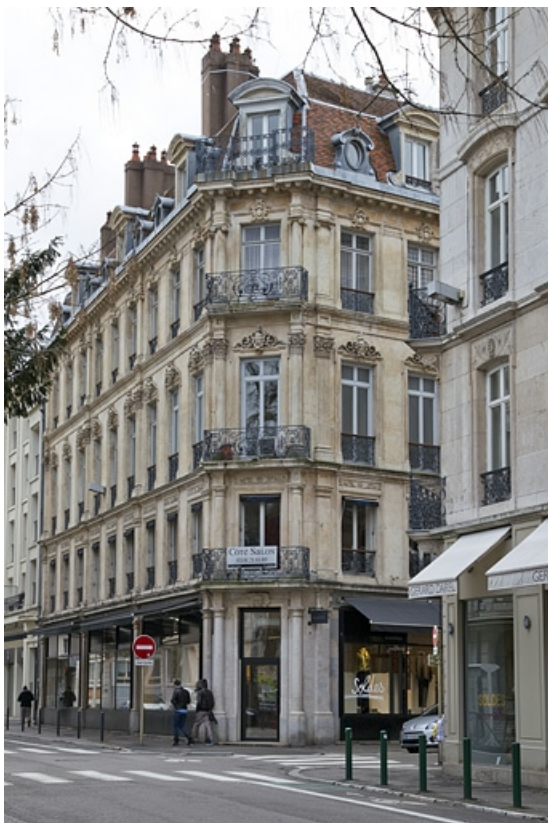
Vue d'ensemble de trois quarts droit depuis la rue Proudhon.

25, Besançon, 16 rue Morand, lieudit : îlot Proudhon