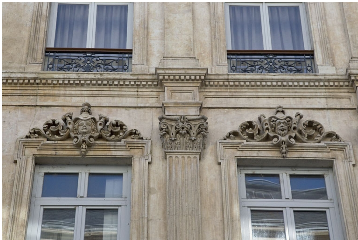
Façade antérieure : détail de deux mascarons sur les linteaux de deux fenêtres du deuxième étage.

25, Besançon, 16 rue Morand, lieudit : îlot Proudhon