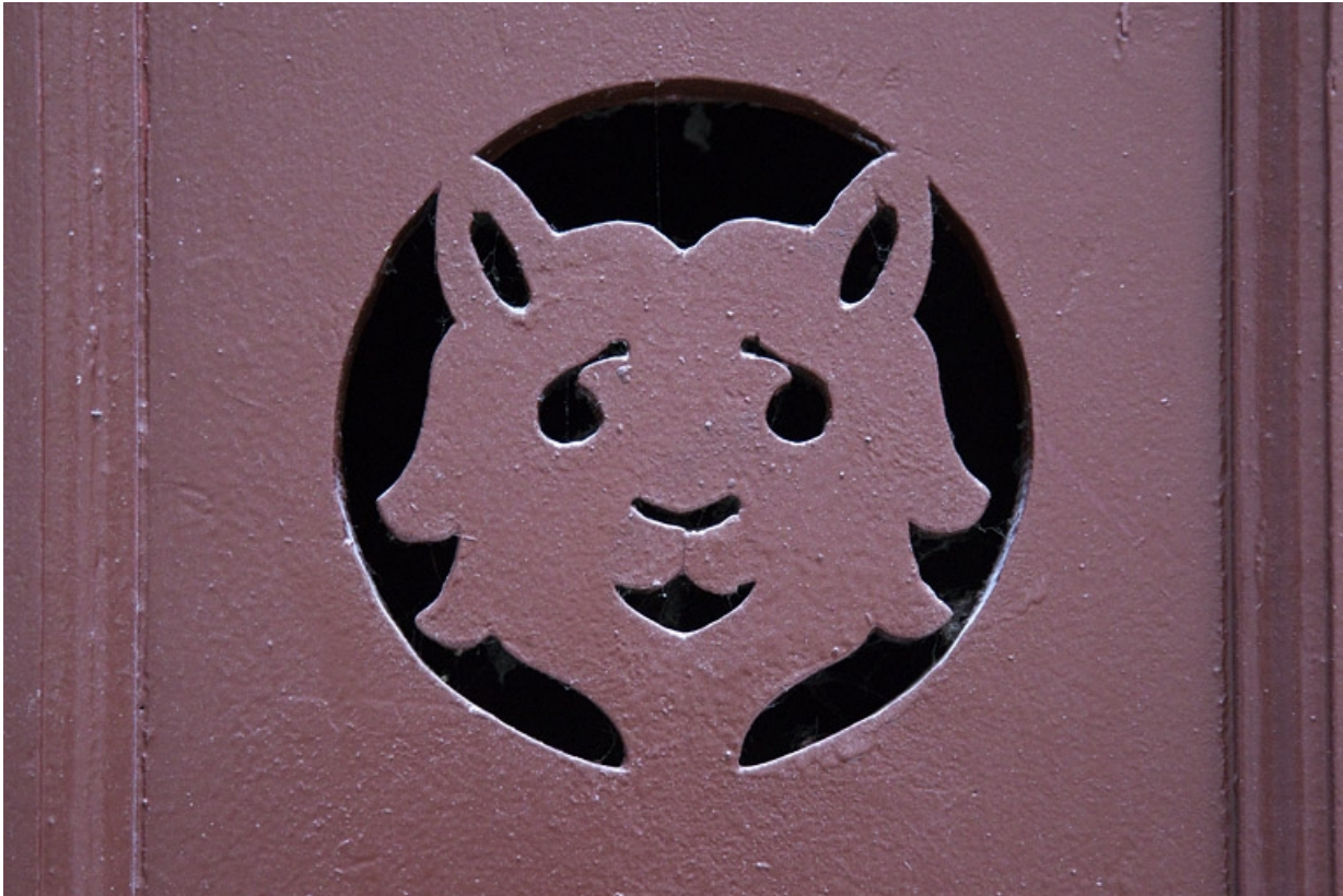
Bûcher : détail du décor de la porte représentant une tête de chat.

25, Besançon, 16 rue Morand, lieudit : îlot Proudhon