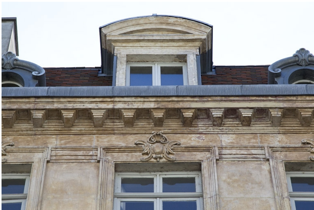
Façade antérieure : détail du décor d'un linteau de fenêtre du troisième étage.

25, Besançon, 16 rue Morand, lieudit : îlot Proudhon