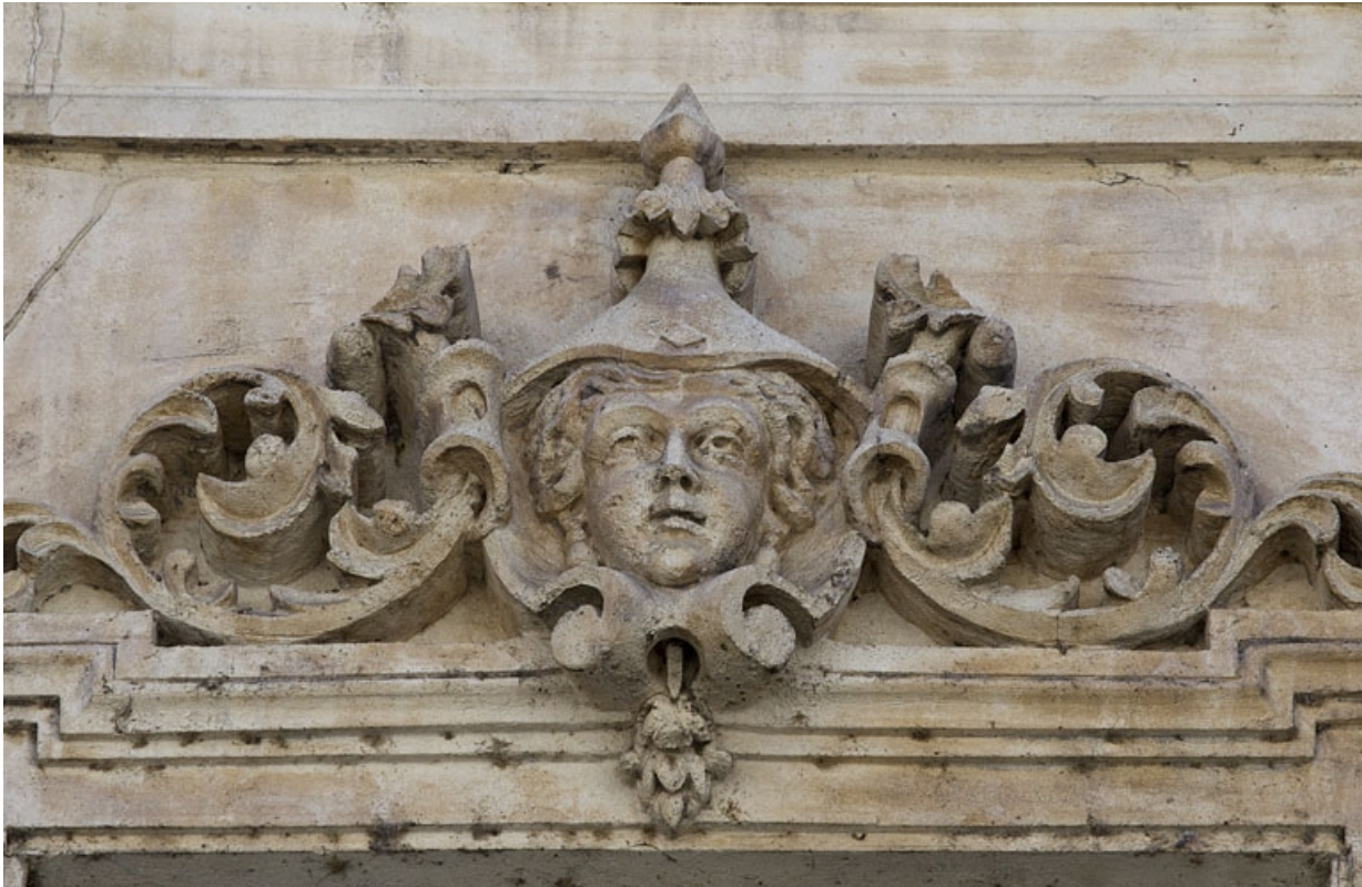
Façade antérieure, vue rapprochée d'un mascaron sur une fenêtre du deuxième étage : personnage féminin. 25, Besançon, 16 rue Morand, lieudit : îlot Proudhon