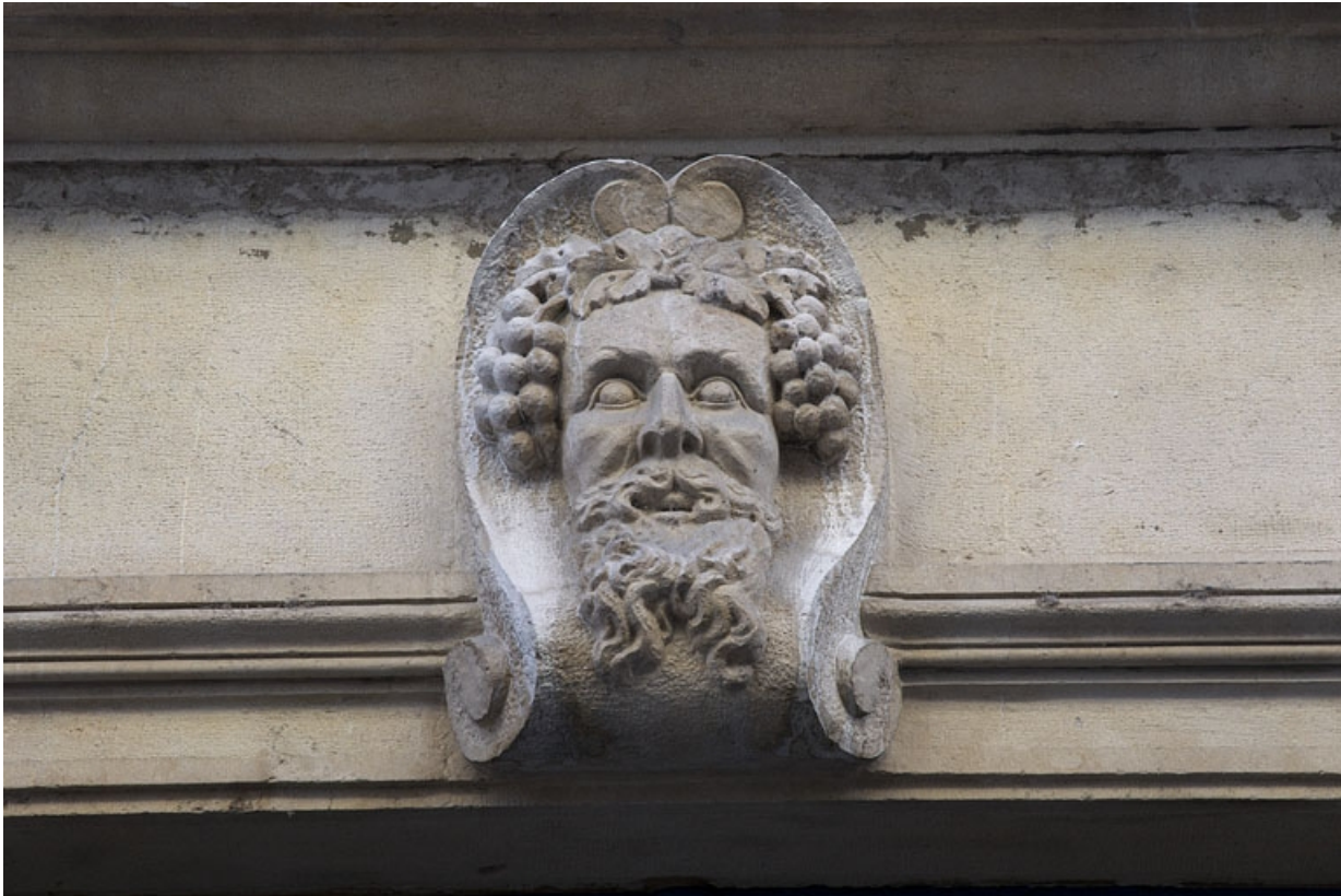
Façade antérieure : détail du mascarone ornant le linteau de la porte d'entrée.

25, Besançon, 16 rue Morand, lieudit : îlot Proudhon