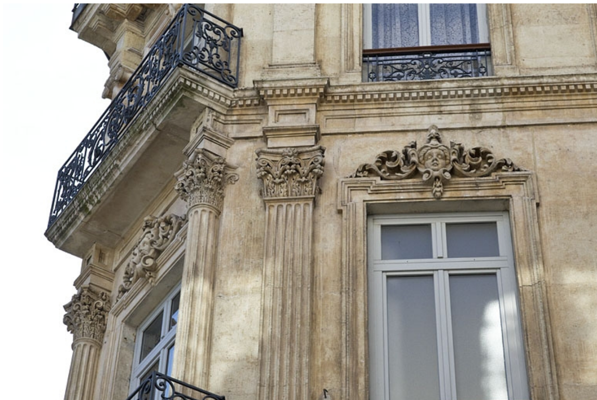
Façade antérieure : détail du pan coupé au niveau du deuxième étage.

25, Besançon, 16 rue Morand, lieudit : îlot Proudhon