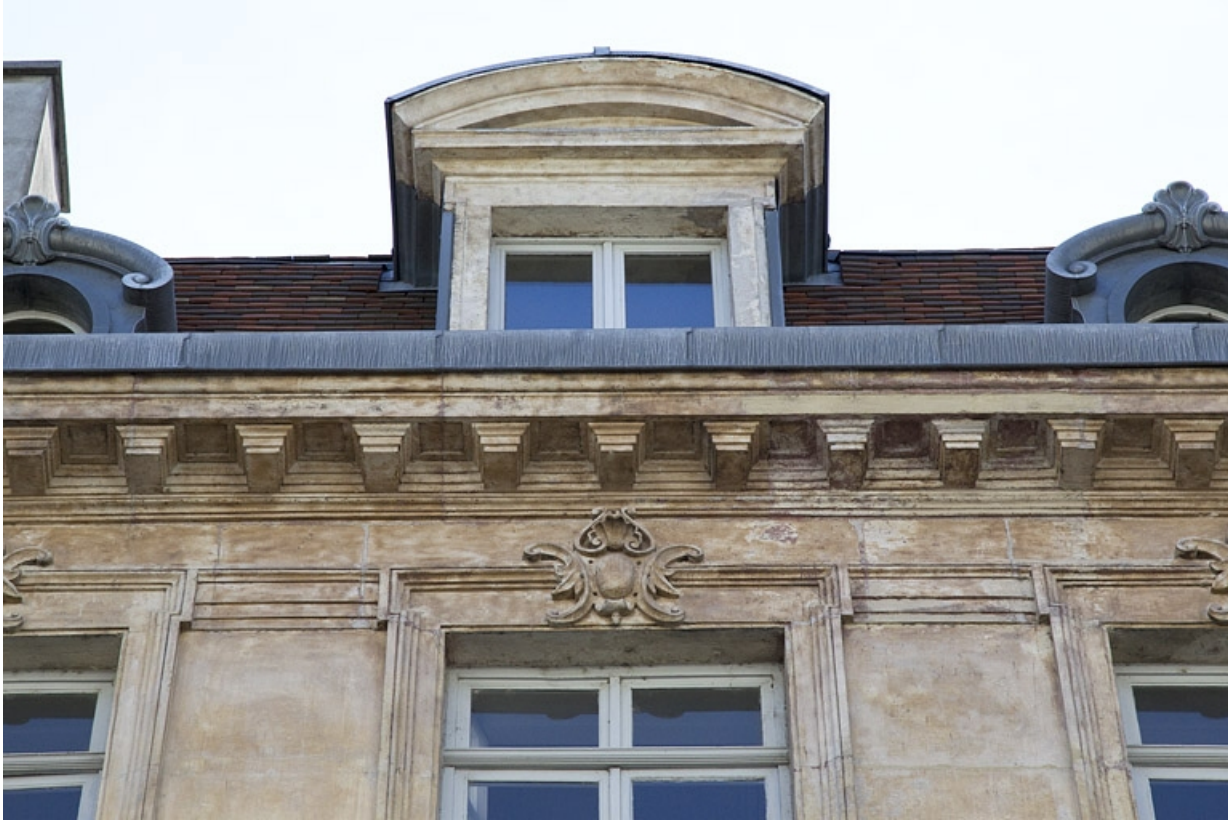
Façade antérieure : détail du décor d'un linteau de fenêtre du troisième étage.

25, Besançon, 16 rue Morand, lieudit : îlot Proudhon