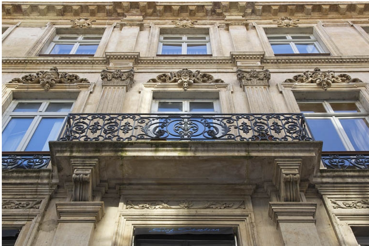
Façade antérieure, rue Morand : vue de la partie centrale en contre plongée.

25, Besançon, 16 rue Morand, lieudit : îlot Proudhon