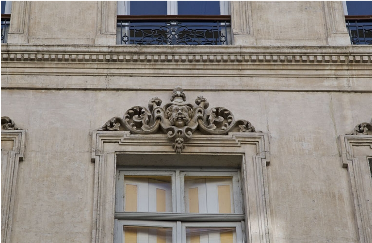
Façade antérieure : détail d'un mascaron sur le linteau d'une fenêtre du deuxième étage.

25, Besançon, 16 rue Morand, lieudit : îlot Proudhon