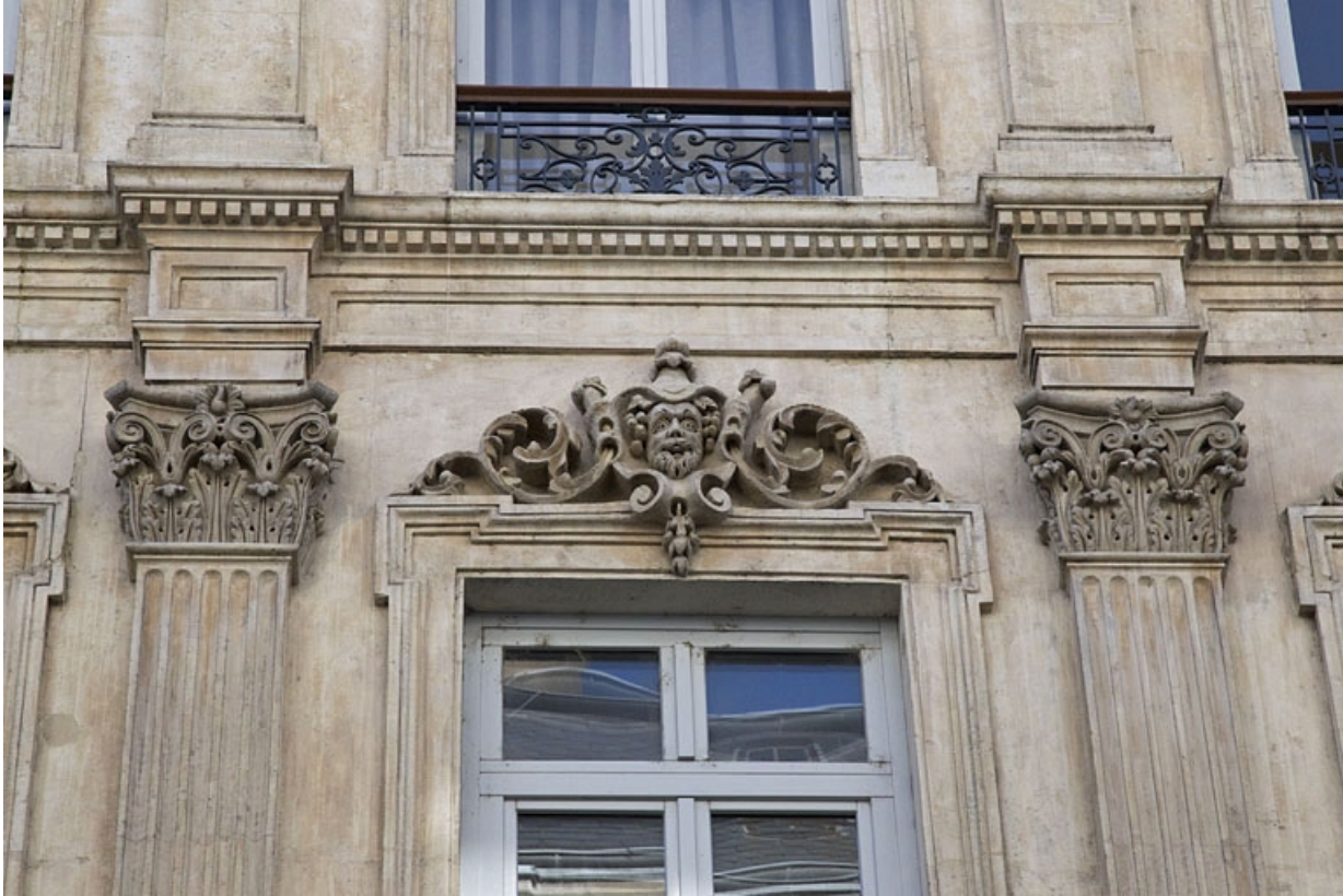
Façade antérieure : détail d'un mascaron sur le linteau d'une fenêtre du deuxième étage.

25, Besançon, 16 rue Morand, lieudit : îlot Proudhon