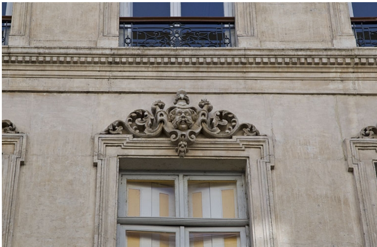
Façade antérieure : détail d'un mascaron sur le linteau d'une fenêtre du deuxième étage.

25, Besançon, 16 rue Morand, lieudit : îlot Proudhon