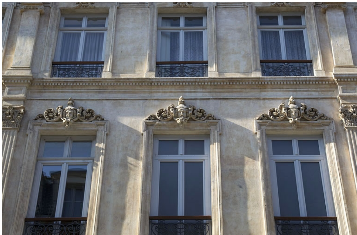
Façade antérieure, rue Proudhon, deuxième étage : détail des trois fenêtres de droite. 25, Besançon, 16 rue Morand, lieudit : îlot Proudhon