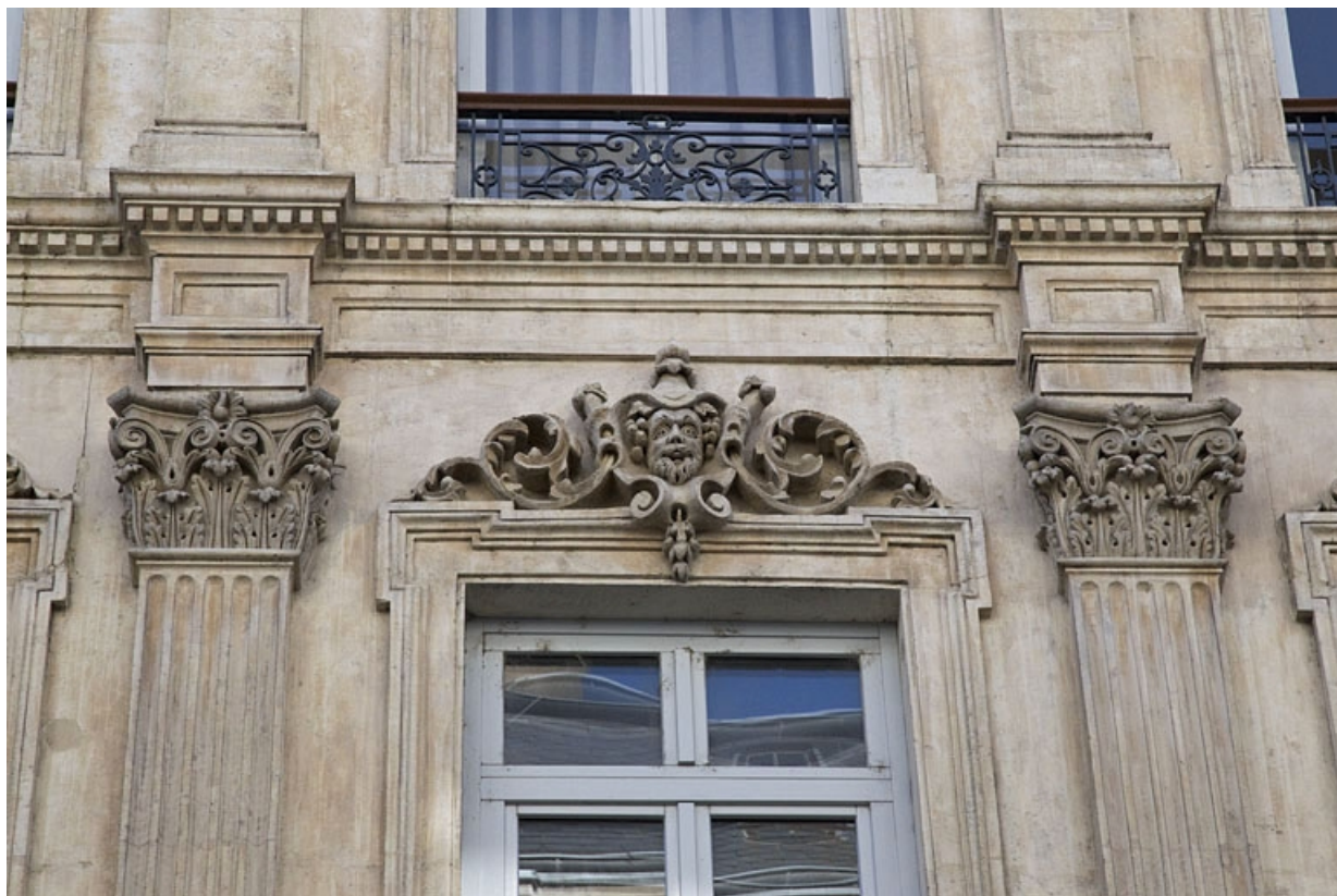
Façade antérieure : détail d'un mascarón sur le linteau d'une fenêtre du deuxième étage.

25, Besançon, 16 rue Morand, lieudit : îlot Proudhon