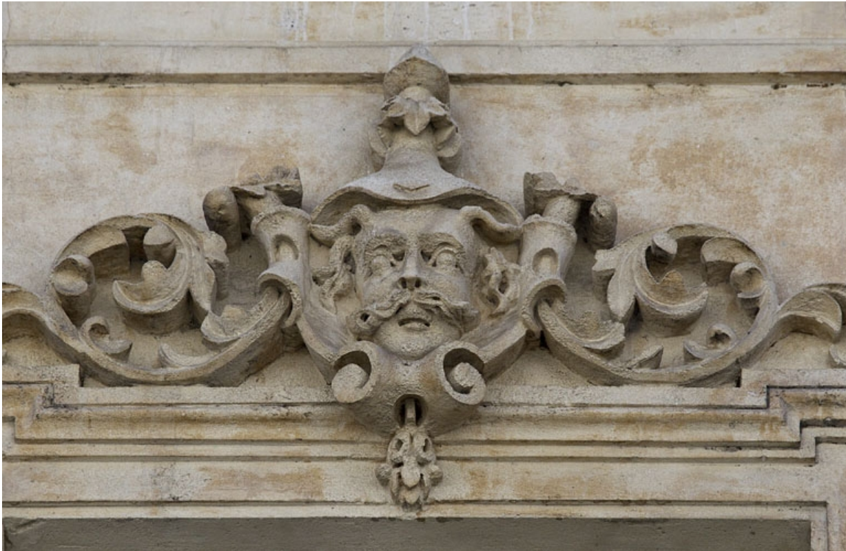
Façade antérieure, vue rapprochée d'un mascaron sur une fenêtre du deuxième étage : personnage masculin. 25, Besançon, 16 rue Morand, lieudit : îlot Proudhon