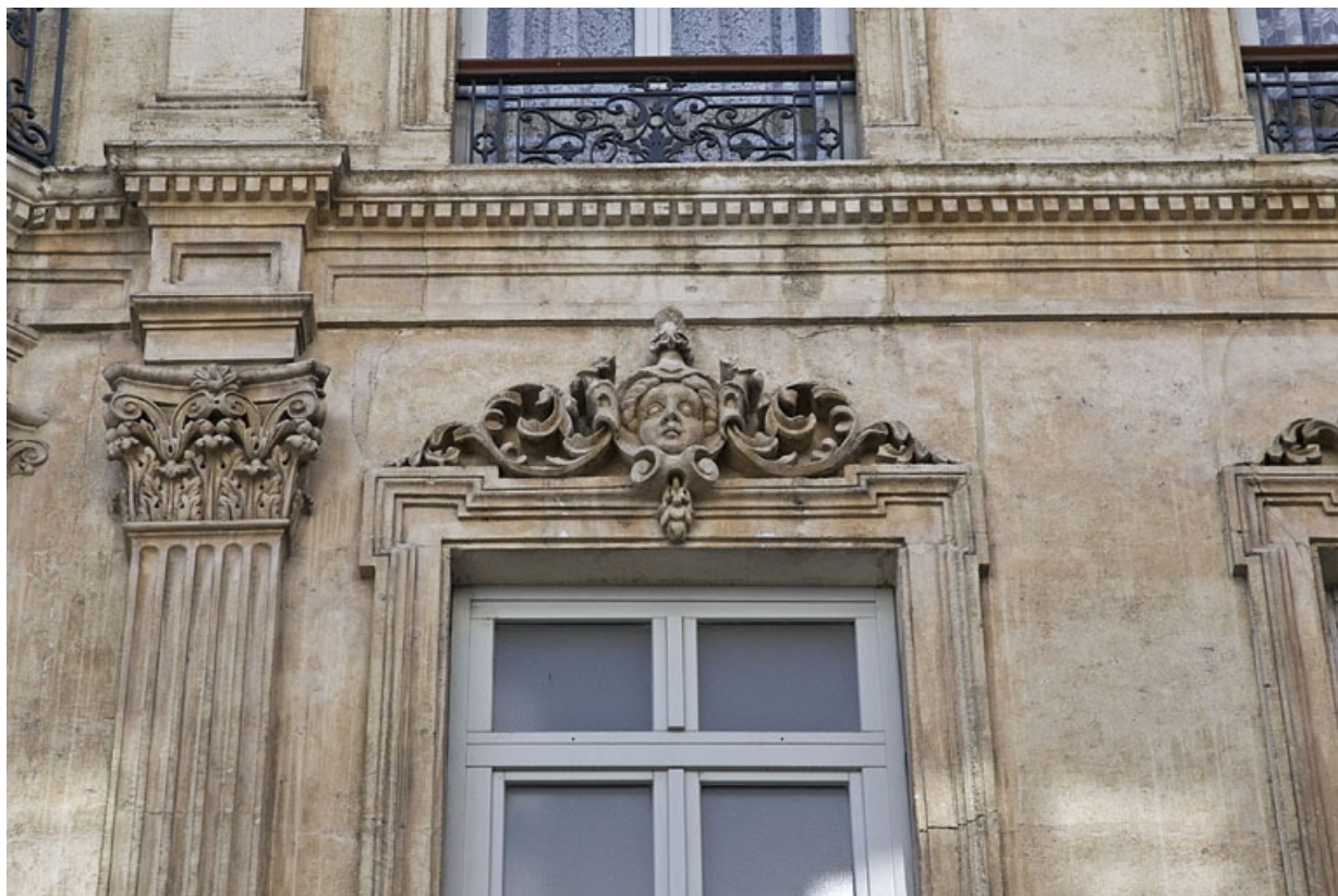
Façade antérieure : détail d'un mascaron sur le linteau d'une fenêtre du deuxième étage.

25, Besançon, 16 rue Morand, lieudit : îlot Proudhon