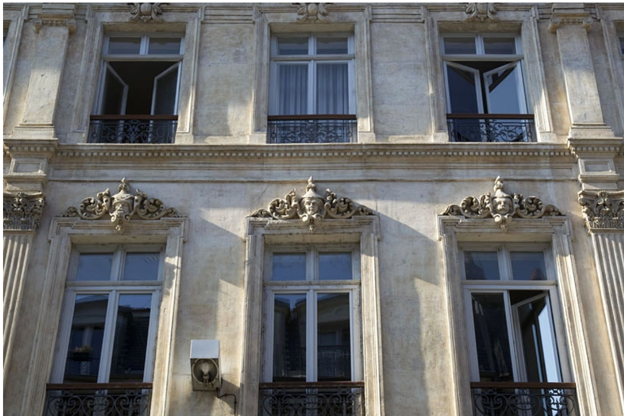
Façade antérieure, rue Proudhon, deuxième étage : détail des trois fenêtres du milieu.

25, Besançon, 16 rue Morand, lieudit : îlot Proudhon