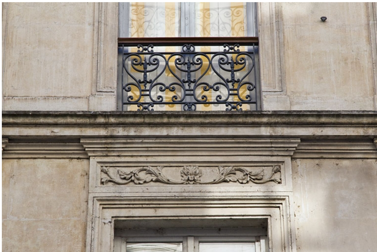
Façade antérieure : détail d'un garde-corps d'une fenêtre.

25, Besançon, 16 rue Morand, lieudit : îlot Proudhon