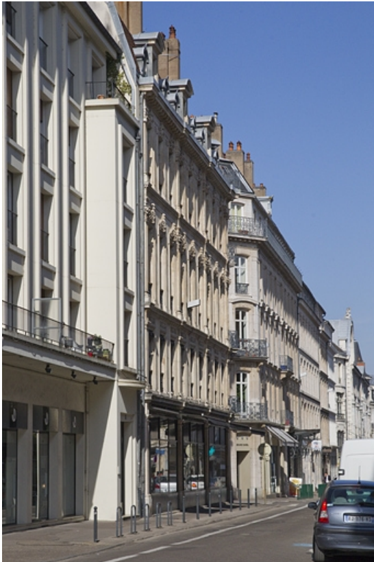
Vue d'ensemble éloignée de la façade donnant sur la rue Proudhon.

25, Besançon, 16 rue Morand, lieudit : îlot Proudhon