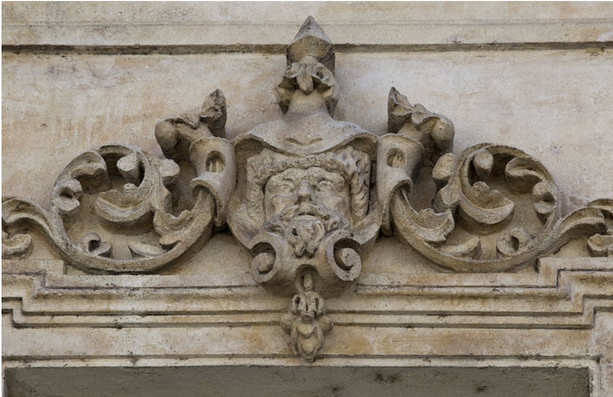
Façade antérieure, vue rapprochée d'un mascaron sur une fenêtre du deuxième étage : personnage masculin. 25, Besançon, 16 rue Morand, lieudit : îlot Proudhon