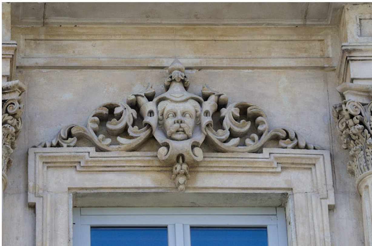
Façade antérieure, vue rapprochée d'un mascaron sur une fenêtre du deuxième étage : personnage masculin. 25, Besançon, 16 rue Morand, lieudit : îlot Proudhon