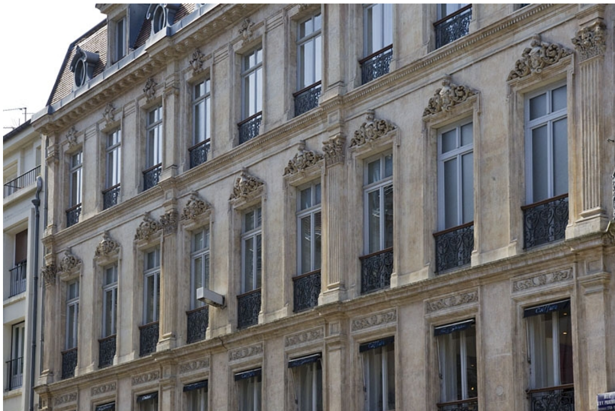
Façade antérieure, rue Proudhon : vue des deuxième et troisième étages, de trois quarts droit. 25, Besançon, 16 rue Morand, lieudit : îlot Proudhon