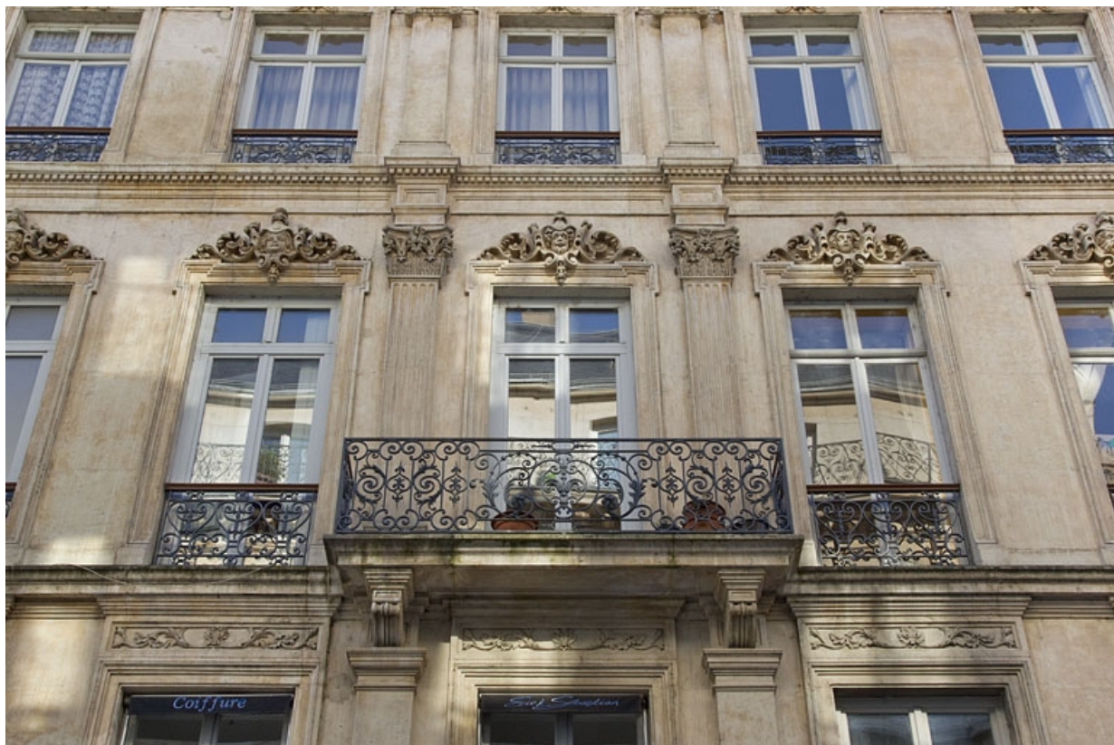
Façade antérieure, rue Morand, deuxième étage, partie centrale.

25, Besançon, 16 rue Morand, lieudit : îlot Proudhon