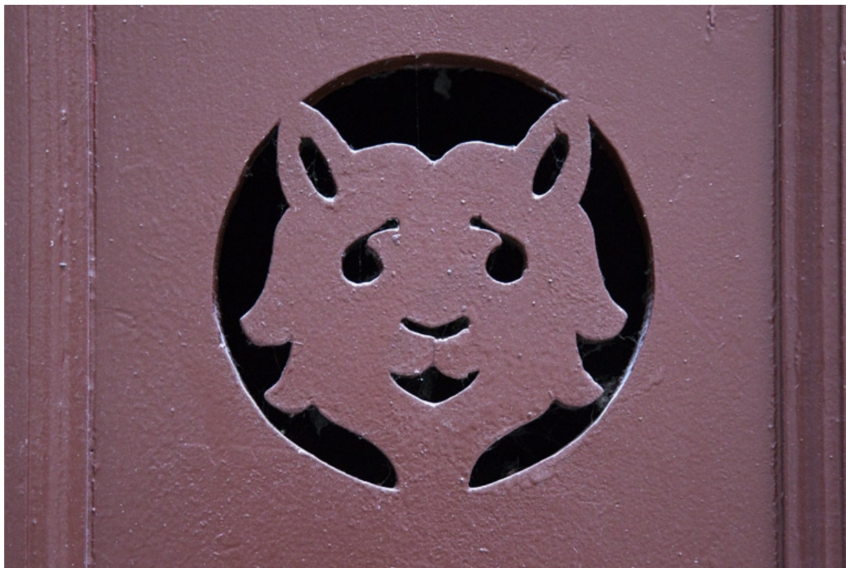
Bûcher : détail du décor de la porte représentant une tête de chat.

25, Besançon, 16 rue Morand, lieudit : îlot Proudhon