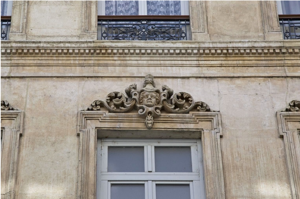
Façade antérieure : détail d'un mascaron sur le linteau d'une fenêtre du deuxième étage.

25, Besançon, 16 rue Morand, lieudit : îlot Proudhon