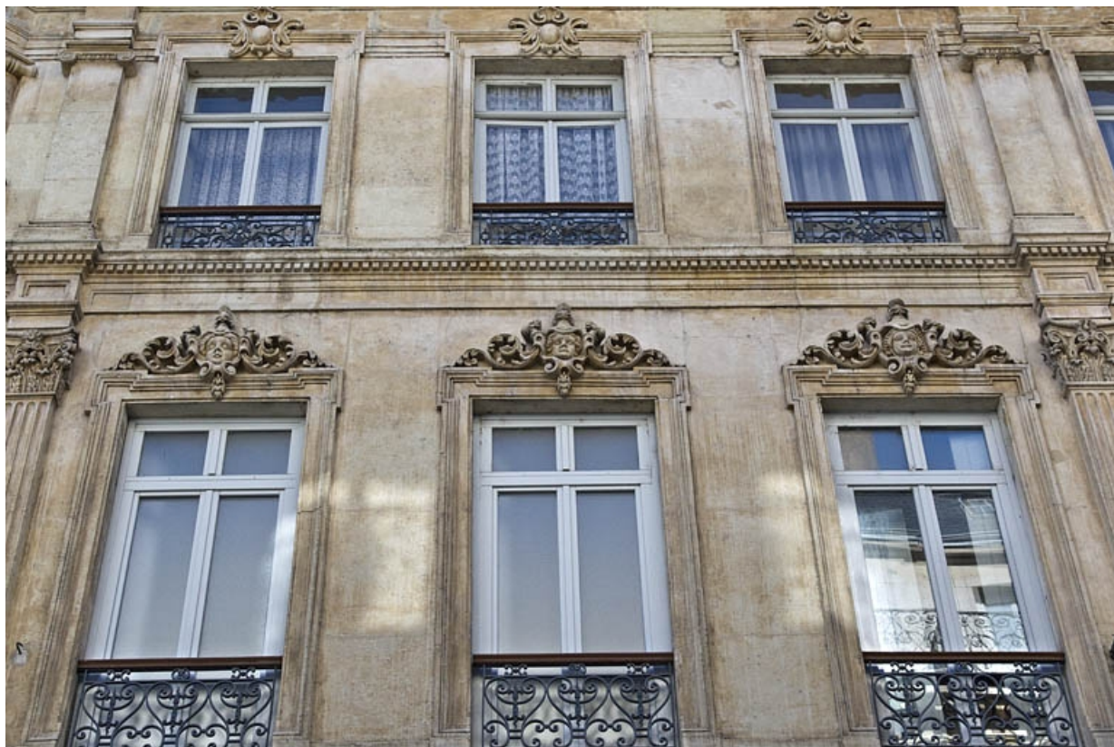
Façade antérieure : détail de trois fenêtres des deuxième et troisième étages. 25, Besançon, 16 rue Morand, lieudit : îlot Proudhon