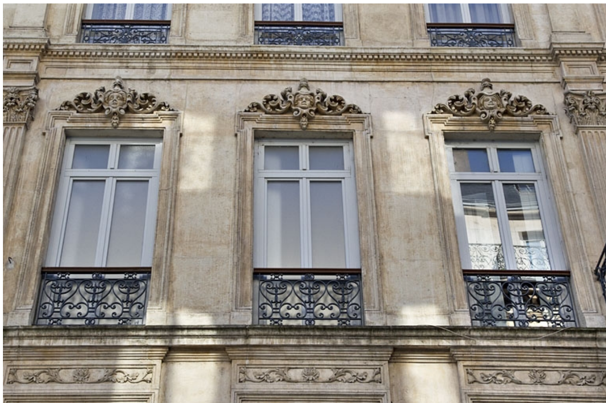
Façade antérieure : vue d'une partie du deuxième étage et des linteaux de fenêtres du premier étage.

25, Besançon, 16 rue Morand, lieudit : îlot Proudhon