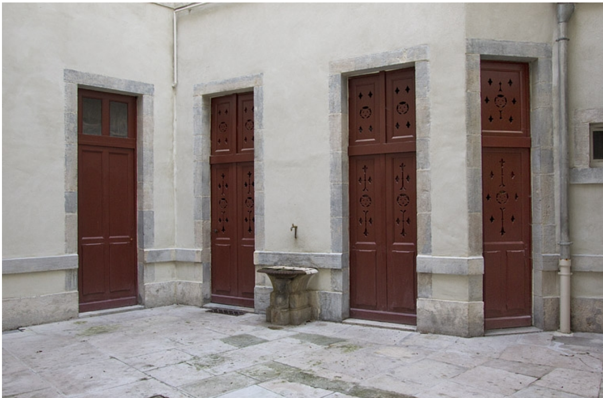
Vue d'une partie de la cour.

25, Besançon, 16 rue Morand, lieudit : îlot Proudhon