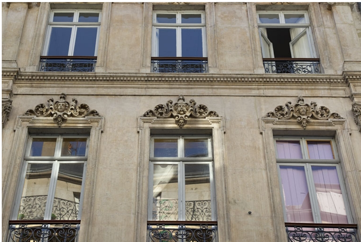
Façade antérieure, vue d'une partie du deuxième étage.

25, Besançon, 16 rue Morand, lieudit : îlot Proudhon