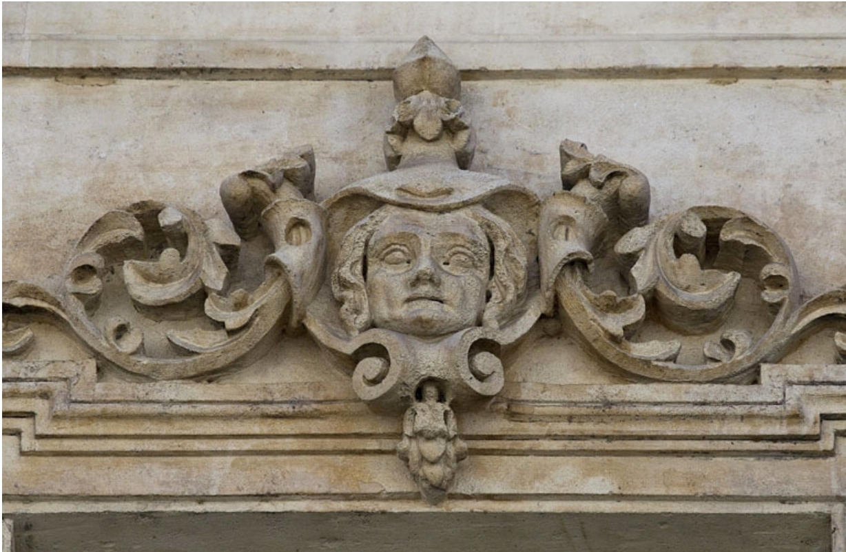
Façade antérieure, vue rapprochée d'un mascarón sur une fenêtre du deuxième étage : personnage féminin. 25, Besançon, 16 rue Morand, lieudit : îlot Proudhon