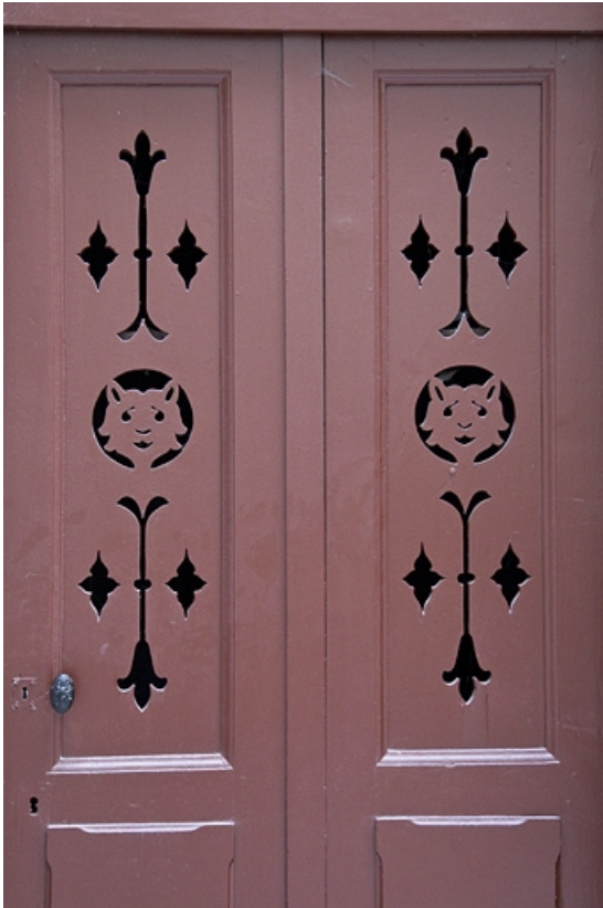
Bûcher : vue d'ensemble de la porte.

25, Besançon, 16 rue Morand, lieudit : îlot Proudhon