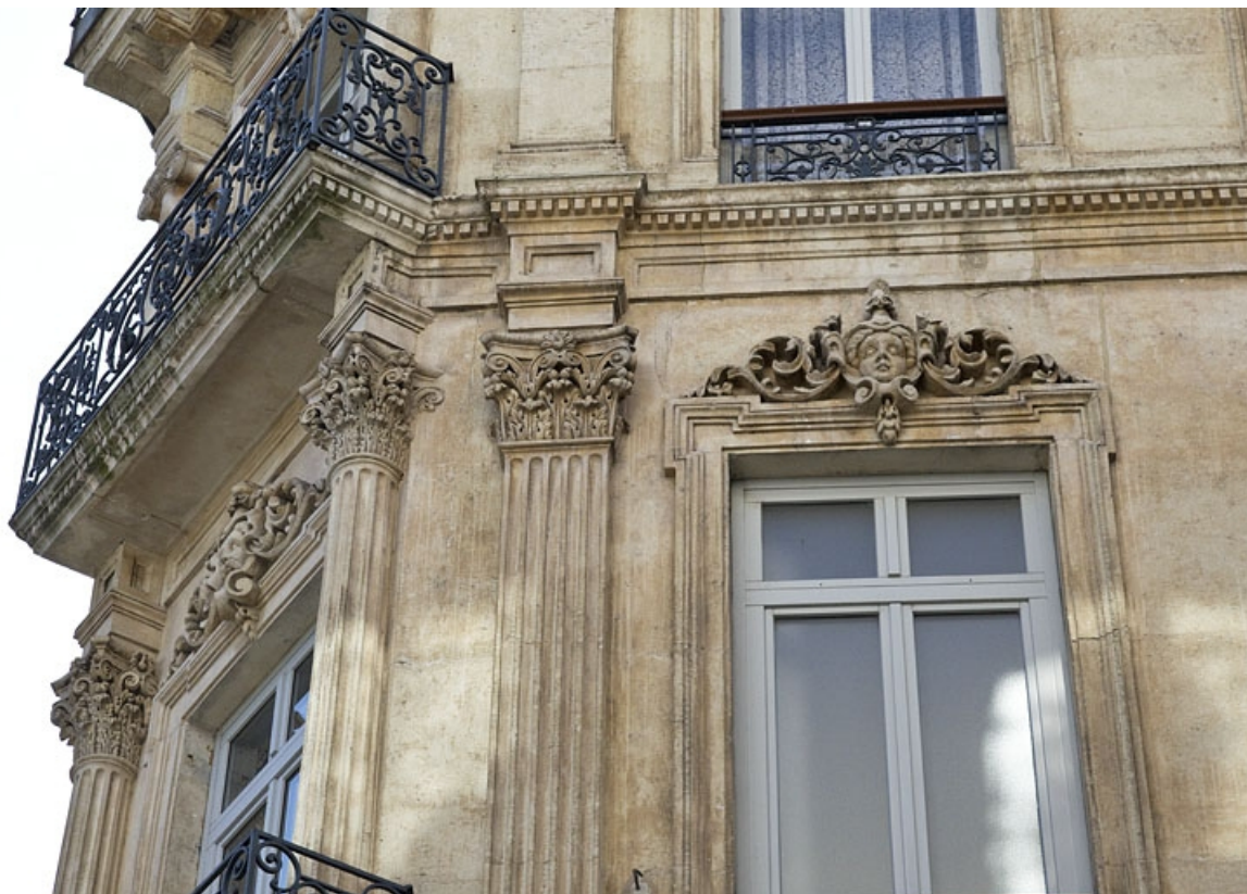
Façade antérieure : détail du pan coupé au niveau du deuxième étage. 25, Besançon, 16 rue Morand, lieudit : îlot Proudhon