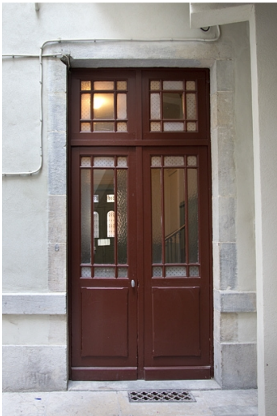
Détail de la porte donnant accès à la cour.

25, Besançon, 16 rue Morand, lieudit : îlot Proudhon