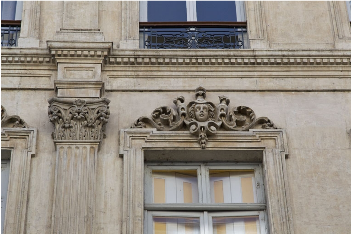
Façade antérieure : détail d'un mascaron sur le linteau d'une fenêtre du deuxième étage.

25, Besançon, 16 rue Morand, lieudit : îlot Proudhon