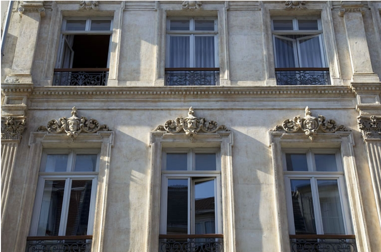
Façade antérieure, rue Proudhon, deuxième étage : détail des trois fenêtres de gauche.

25, Besançon, 16 rue Morand, lieudit : îlot Proudhon