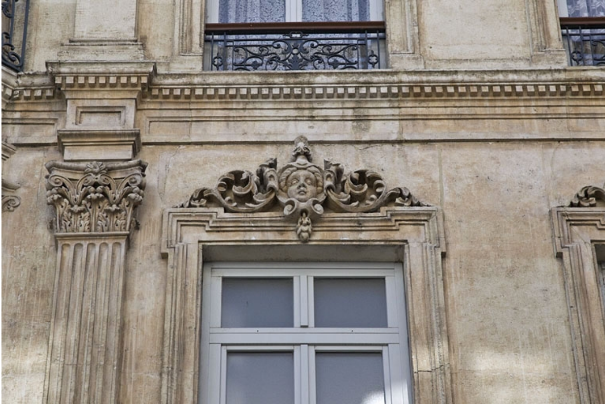
Façade antérieure : détail d'un mascaron sur le linteau d'une fenêtre du deuxième étage.

25, Besançon, 16 rue Morand, lieudit : îlot Proudhon