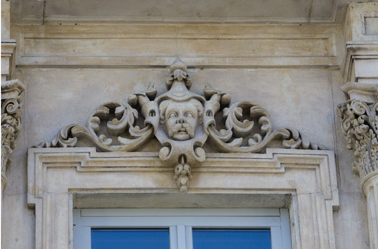
Façade antérieure, vue rapprochée d'un mascaron sur une fenêtre du deuxième étage : personnage masculin.

25, Besançon, 16 rue Morand, lieudit : îlot Proudhon