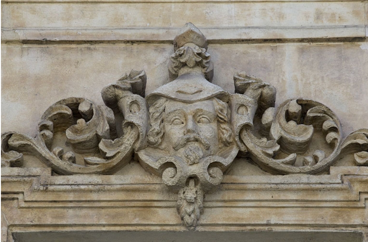
Façade antérieure, vue rapprochée d'un mascarón sur une fenêtre du deuxième étage : personnage masculin. 25, Besançon, 16 rue Morand, lieudit : îlot Proudhon