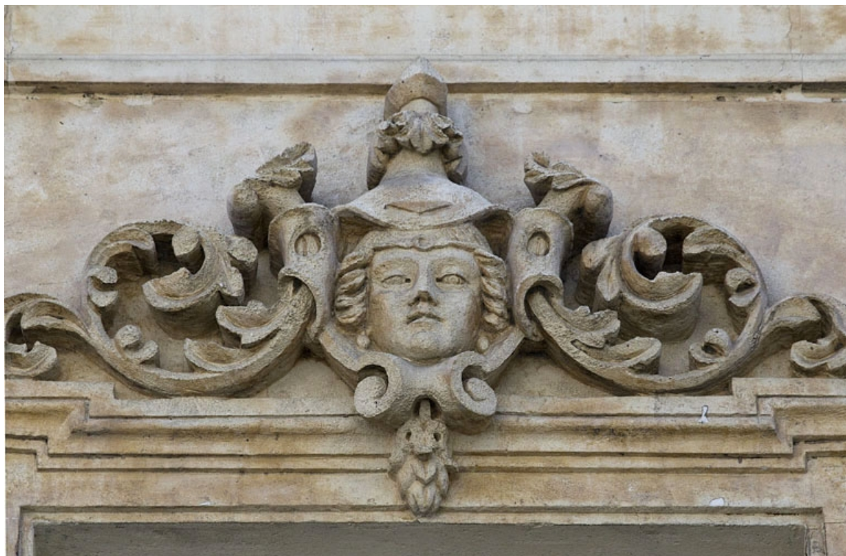
Façade antérieure, vue rapprochée d'un mascarone sur une fenêtre du deuxième étage : personnage féminin.

25, Besançon, 16 rue Morand, lieudit : îlot Proudhon