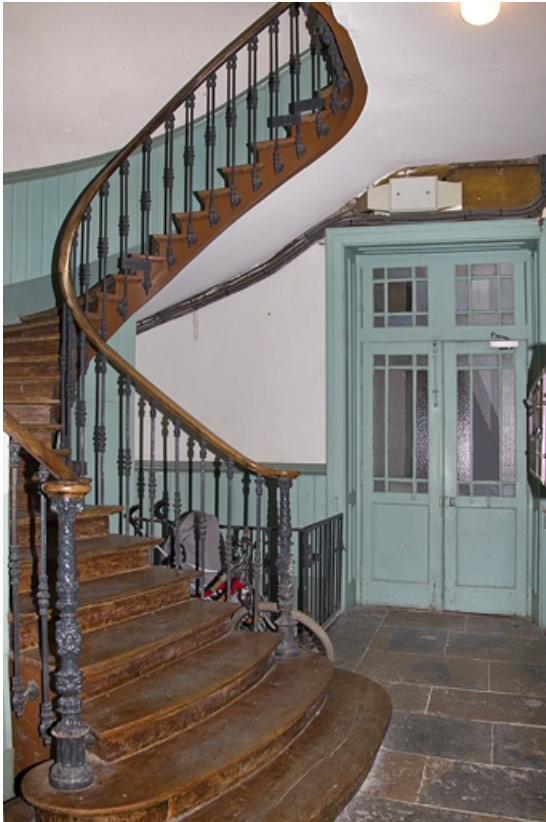
Intérieur : vue d'ensemble de l'escalier.

25, Besançon, 16 rue Morand, lieudit : îlot Proudhon