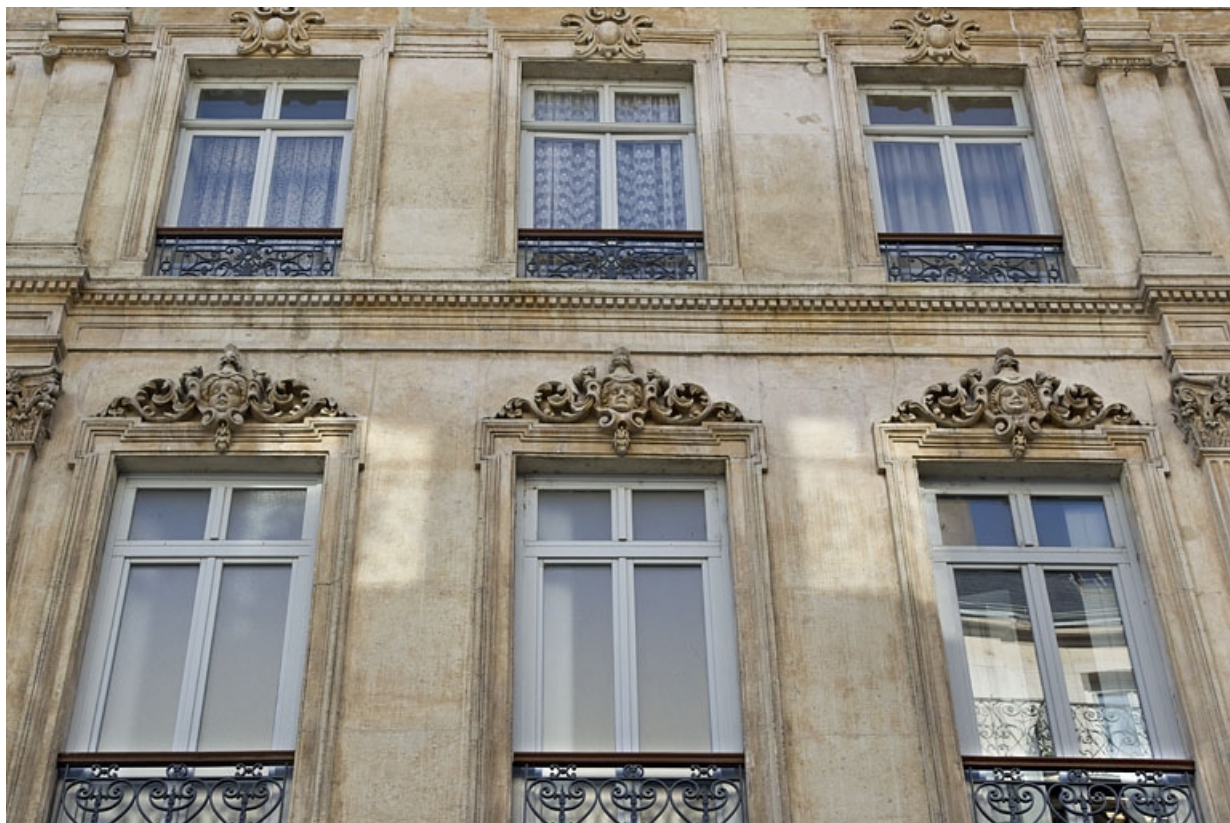
Façade antérieure : vue d'une partie du deuxième et du troisième étage.

25, Besançon, 16 rue Morand, lieudit : îlot Proudhon