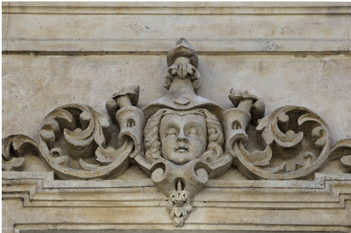
Façade antérieure, vue rapprochée d'un mascaron sur une fenêtre du deuxième étage : personnage féminin. 25, Besançon, 16 rue Morand, lieudit : îlot Proudhon