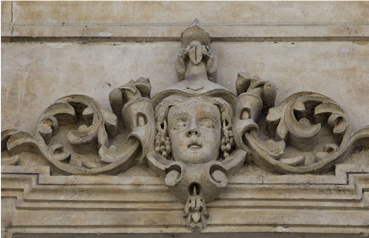
Façade antérieure, vue rapprochée d'un mascarón sur une fenêtre du deuxième étage : personnage féminin. 25, Besançon, 16 rue Morand, lieudit : îlot Proudhon