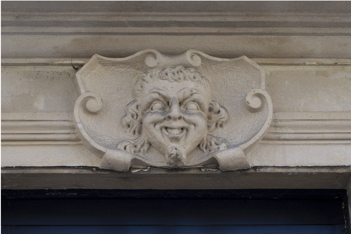
Façade antérieure, vue rapprochée d'un mascarón sur la porte d'entrée du magasin.

25, Besançon, 16 rue Morand, lieudit : îlot Proudhon