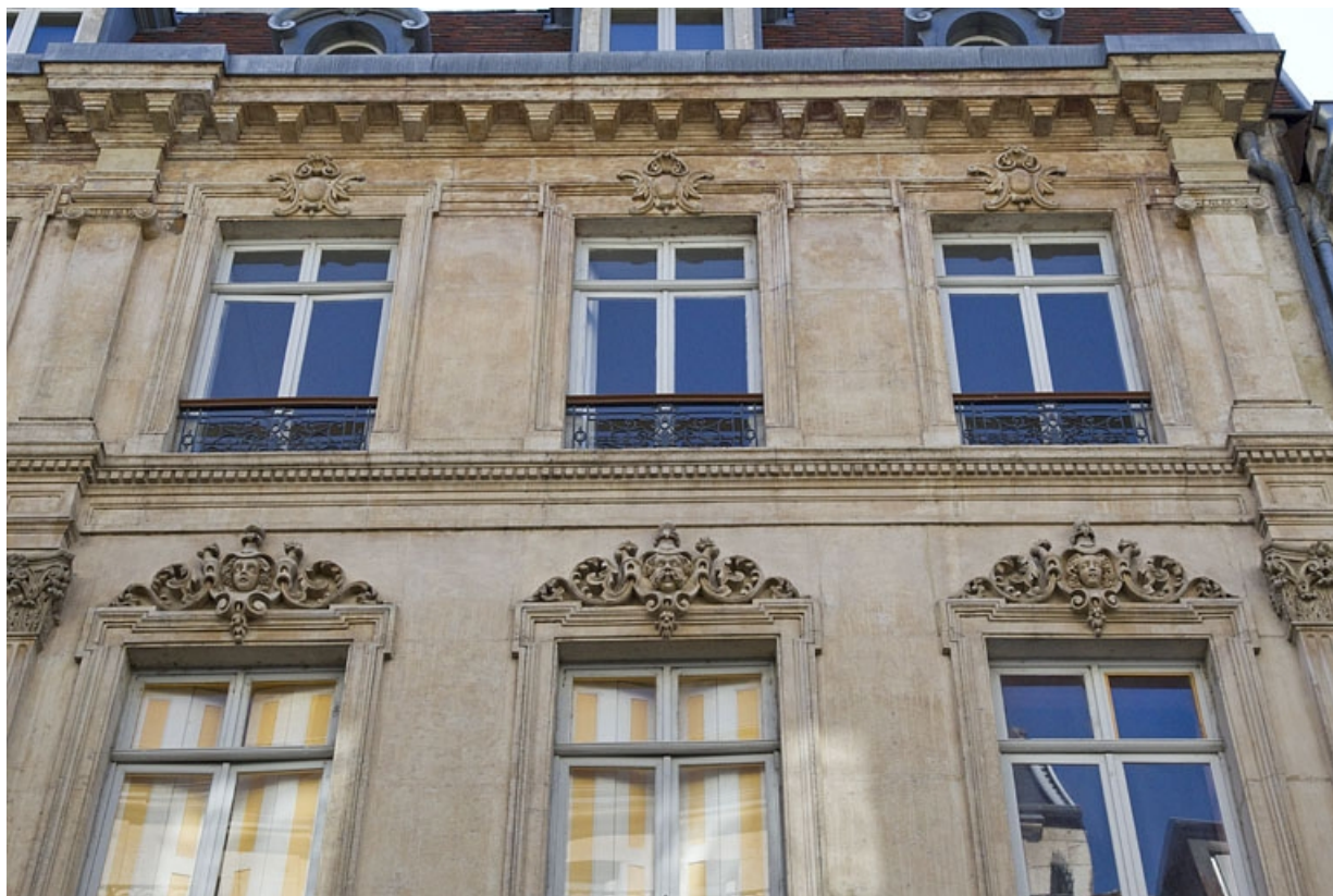
Façade antérieure : détail de trois fenêtres des deuxième et troisième étages. 25, Besançon, 16 rue Morand, lieudit : îlot Proudhon