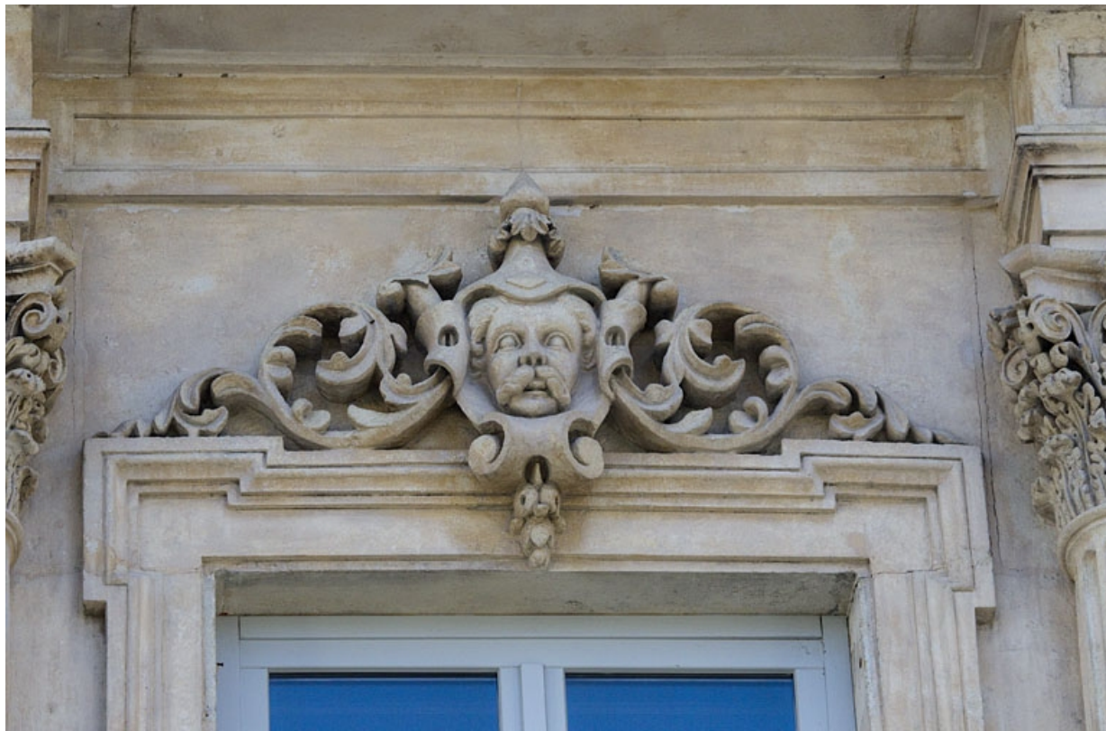
Façade antérieure, vue rapprochée d'un mascaron sur une fenêtre du deuxième étage : personnage masculin. 25, Besançon, 16 rue Morand, lieudit : îlot Proudhon