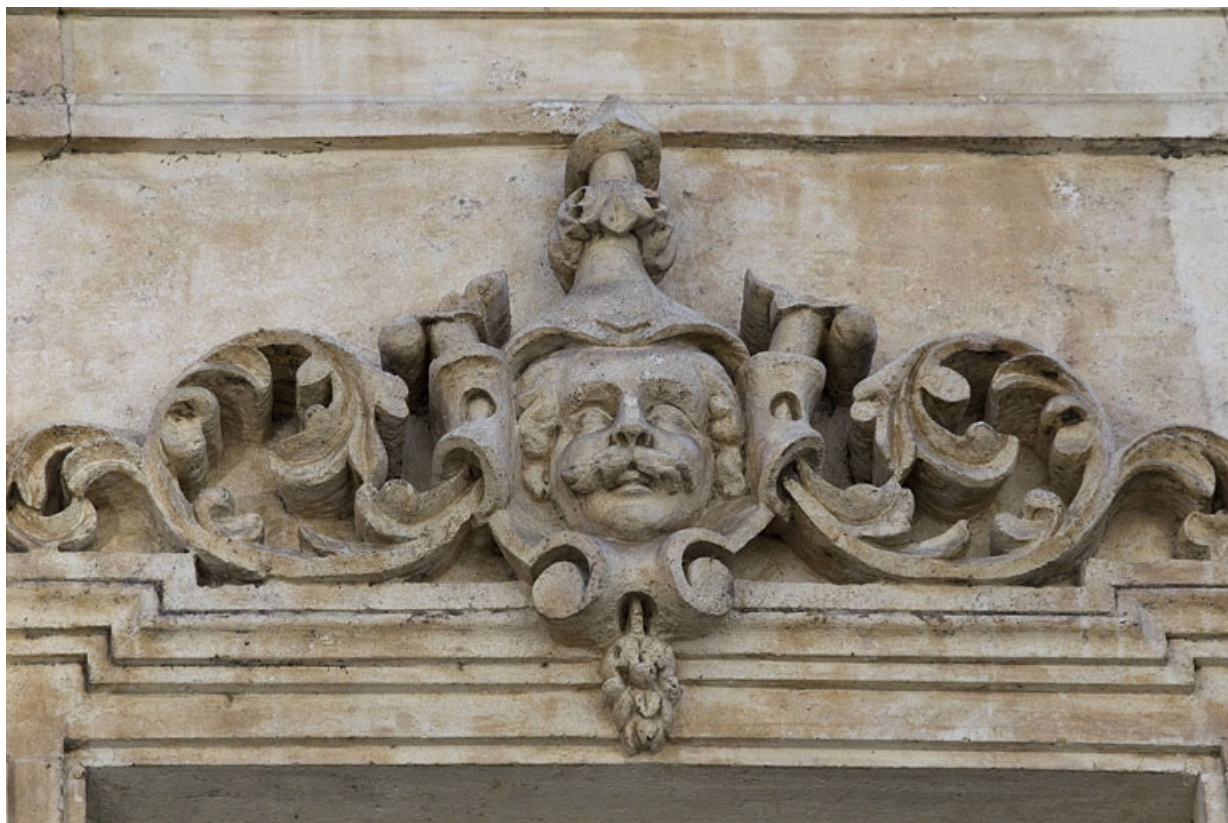
Façade antérieure, vue rapprochée d'un mascaron sur une fenêtre du deuxième étage : personnage masculin. 25, Besançon, 16 rue Morand, lieudit : îlot Proudhon