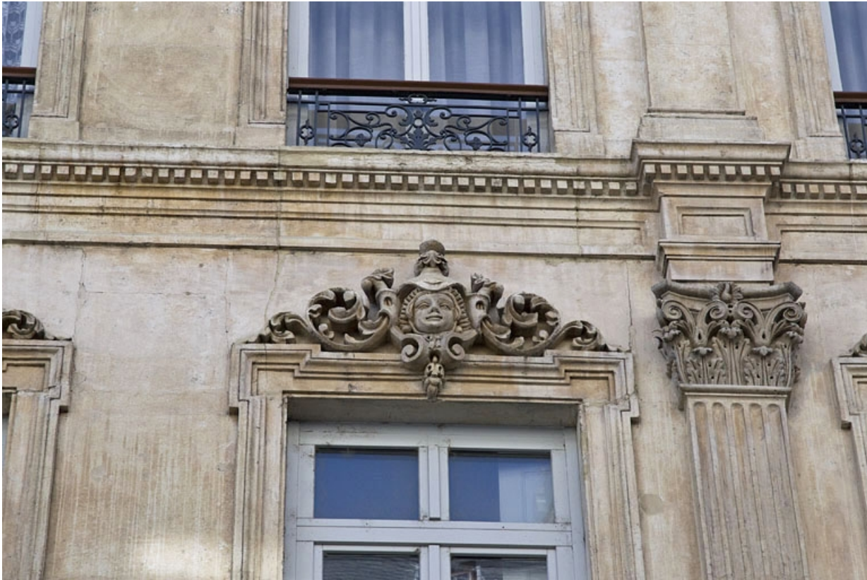
Façade antérieure : détail d'un mascarón sur le linteau d'une fenêtre du deuxième étage.

25, Besançon, 16 rue Morand, lieudit : îlot Proudhon