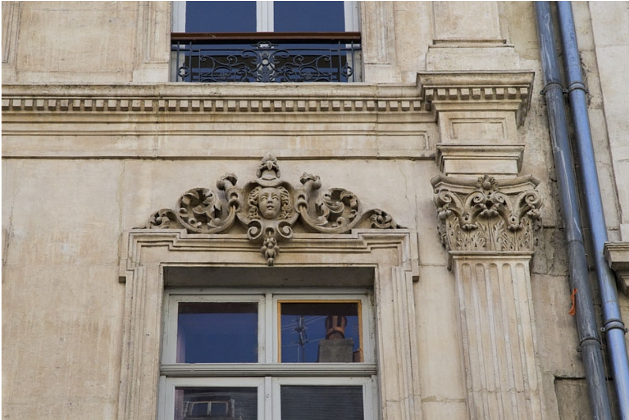
Façade antérieure : détail d'un mascaron sur le linteau d'une fenêtre du deuxième étage.

25, Besançon, 16 rue Morand, lieudit : îlot Proudhon