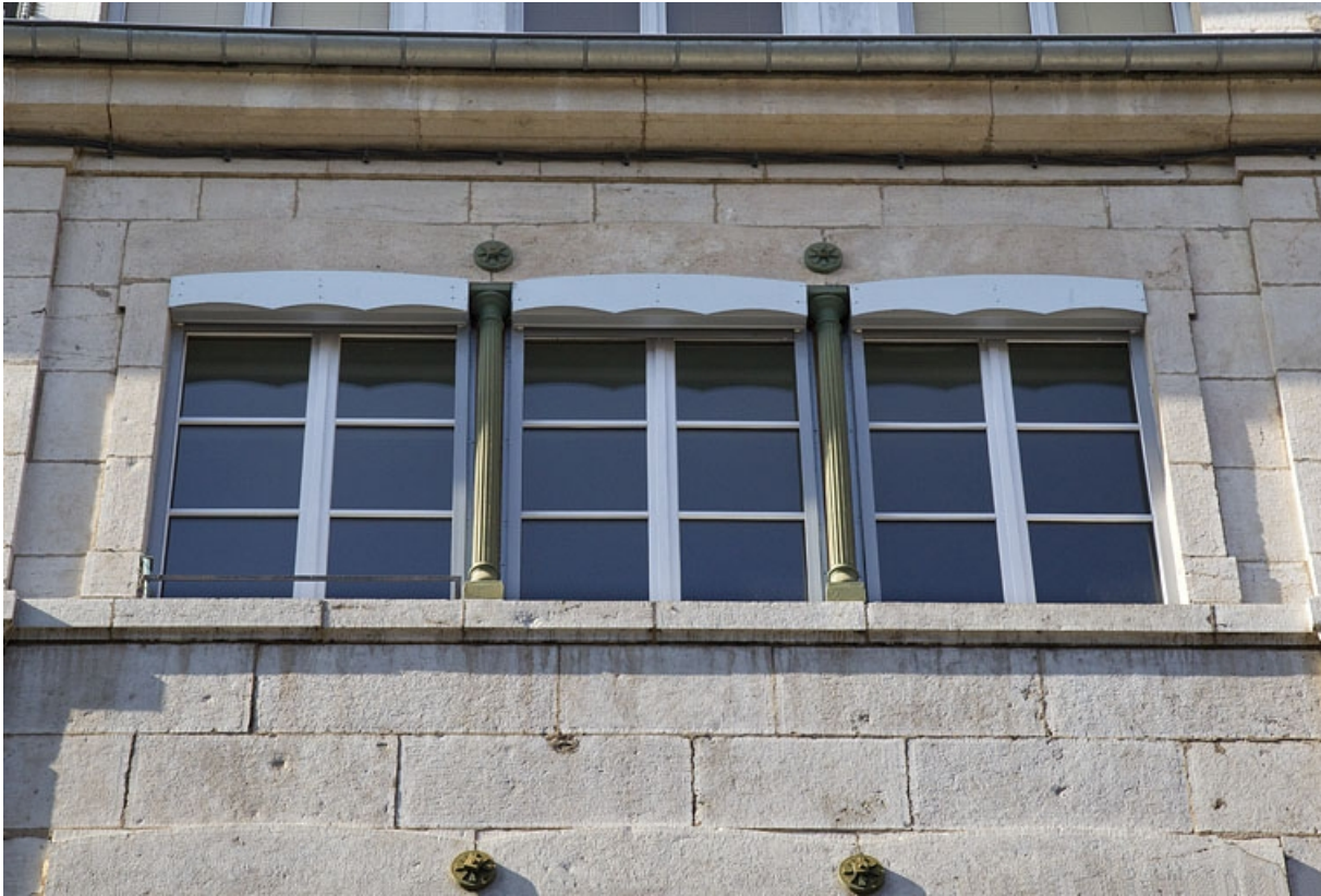
Détail d'une baie horlogère du deuxième étage.