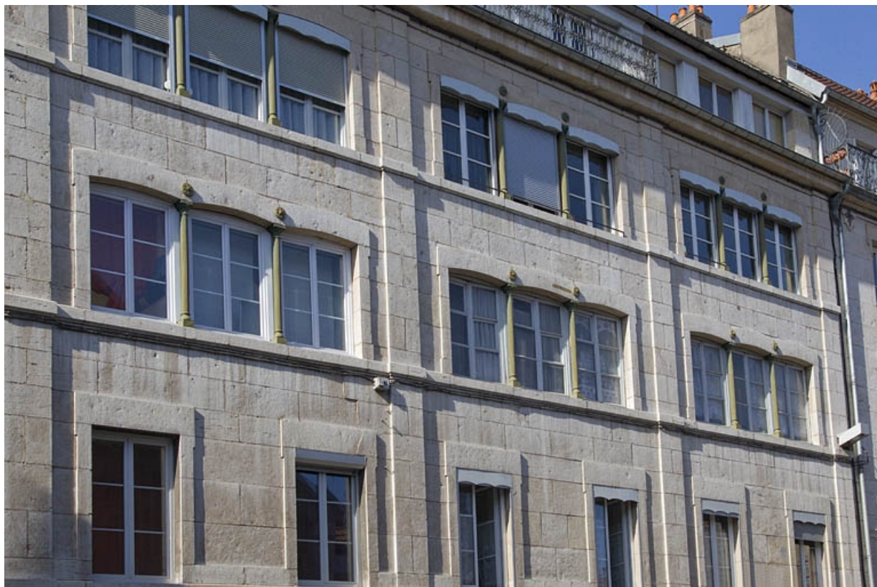
Vue d'ensemble de la façade antérieure, de trois quarts gauche.

25, Besançon, 1 rue Proudhon, lieudit : îlot Proudhon