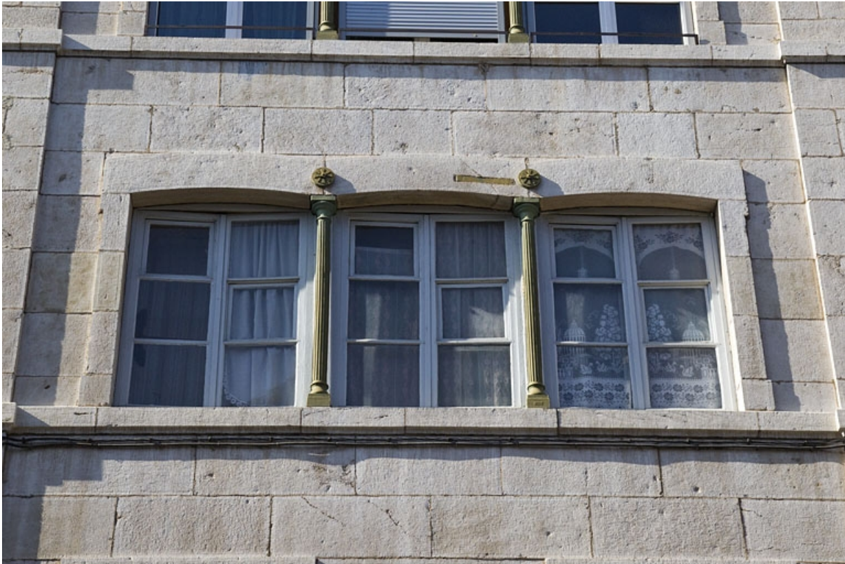
Détail d'une baie horlogère du premier étage.

25, Besançon, 1 rue Proudhon, lieudit : îlot Proudhon