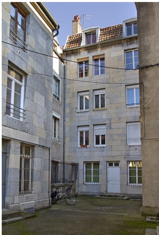
Deuxième logis secondaire, troisième cour : aile contenant l'escalier dans oeuvre. 25, Besançon, 33 rue Bersot, lieudit : îlot Proudhon