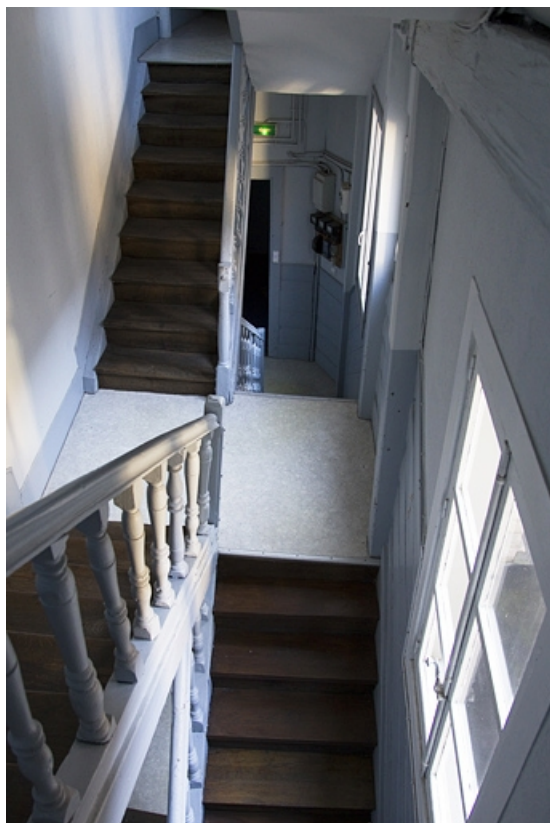
Détail de l'intérieur de l'escalier à cage ouverte. 25, Besançon, 33 rue Bersot, lieudit : îlot Proudhon