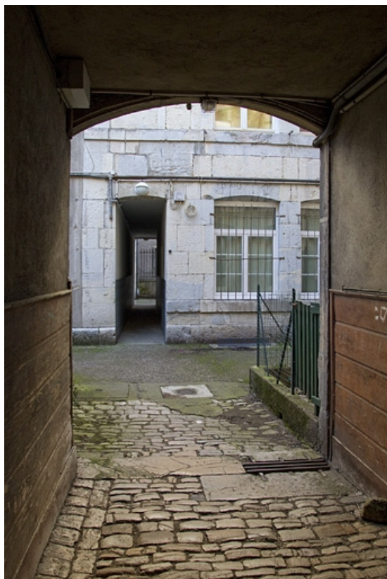
Deuxième logis secondaire : détail du couloir depuis le passage cocher du premier logis secondaire. 25, Besançon, 33 rue Bersot, lieudit : îlot Proudhon