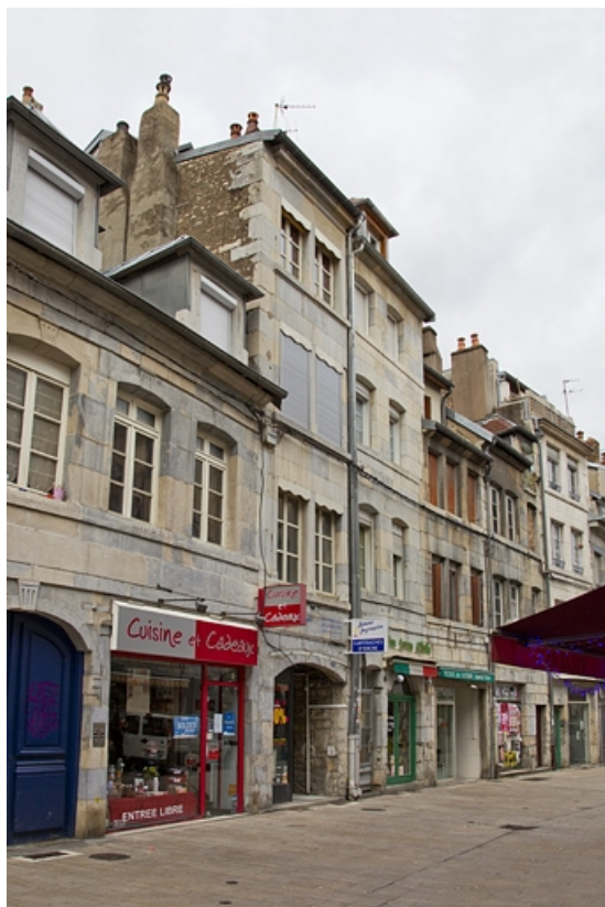
Vue d'ensemble du logis sur rue de trois quarts gauche.

25, Besançon, 15 rue Bersot, lieudit : îlot Proudhon