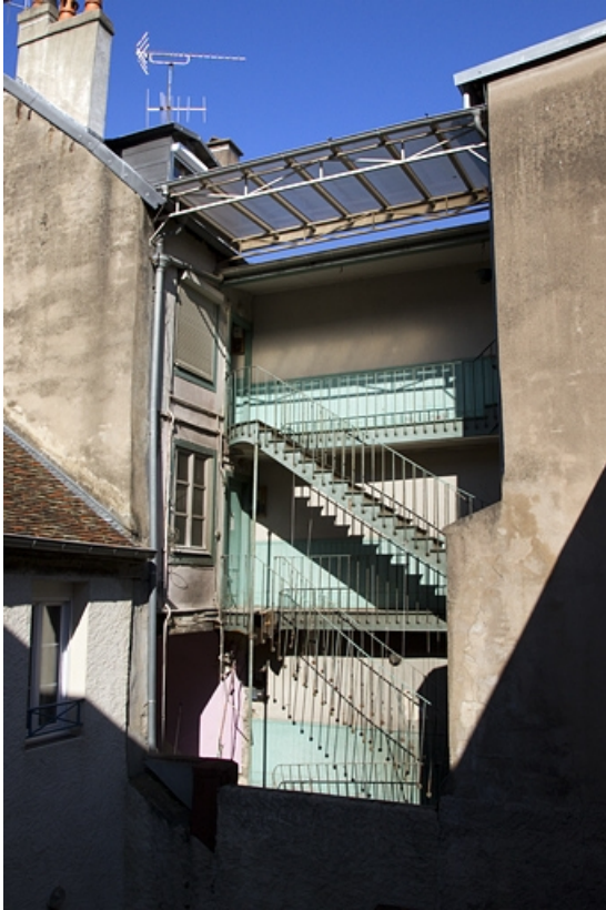
Vue d'ensemble de l'escalier à cage ouverte depuis une maison voisine.

25, Besançon, 15 rue Bersot, lieudit : îlot Proudhon