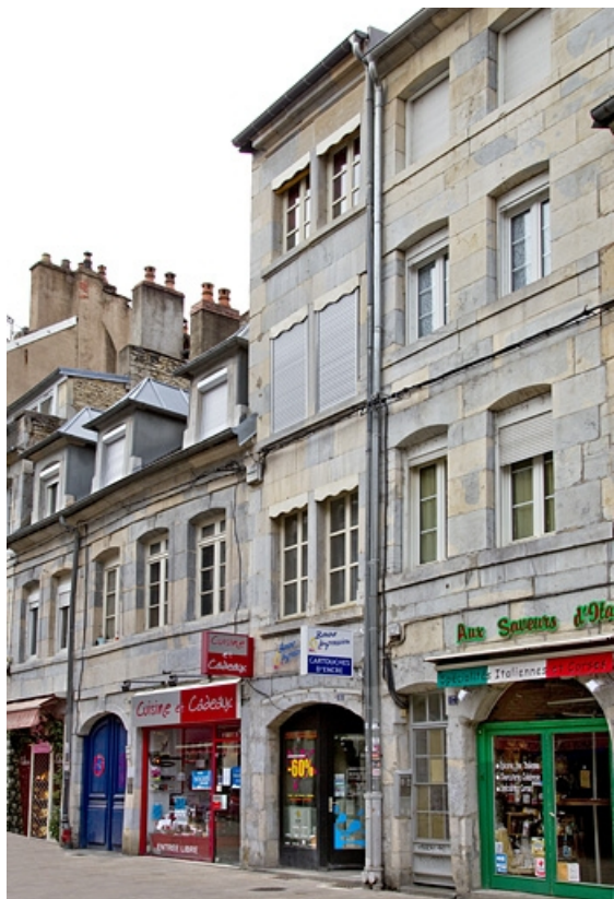
Vue d'ensemble du logis sur rue de trois quart droit.

25, Besançon, 15 rue Bersot, lieu-dit : îlot Proudhon