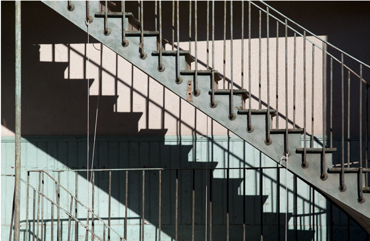
Détail de la rampe de l'escalier à cage ouverte depuis une maison voisine.

25, Besançon, 15 rue Bersot, lieudit : îlot Proudhon