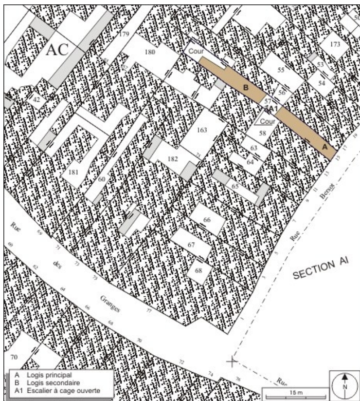
Plan masse et de situation. Extrait du plan cadastral, 1974, section AC. 25, Besançon, 15 rue Bersot, lieudit : îlot Proudhon