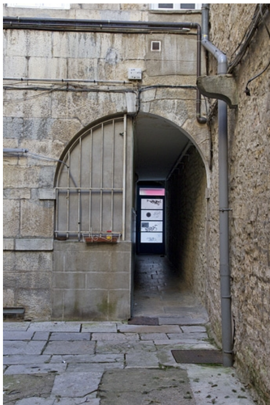
Logis principal, façade postérieure : détail de la porte cochère.

25, Besançon, 5 rue Bersot, lieudit : îlot Proudhon