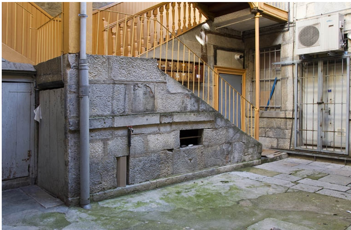
Vue du départ de l'escalier à cage ouverte sur cour.

25, Besançon, 5 rue Bersot, lieudit : îlot Proudhon