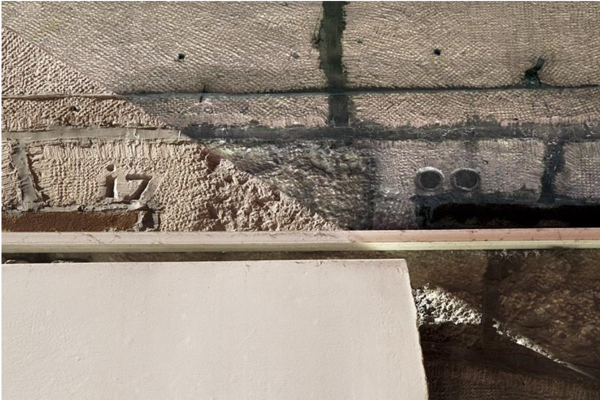
Façade antérieure : détail du chronogramme au-dessus de l'entrée.

25, Besançon, 5 rue Bersot, lieudit : îlot Proudhon