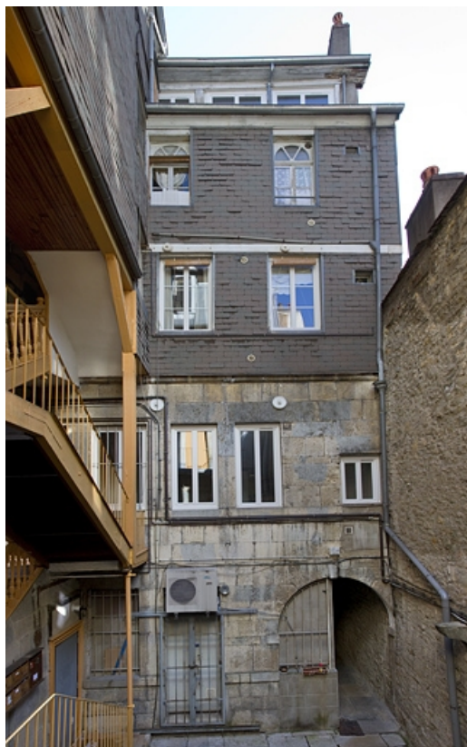
Logis principal, façade postérieure : de face. 25, Besançon, 5 rue Bersot, lieudit : îlot Proudhon