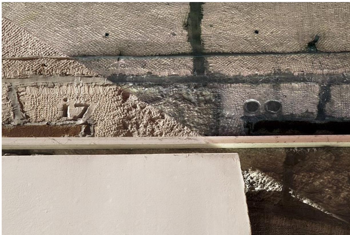
Façade antérieure : détail du chronogramme au-dessus de l'entrée.

25, Besançon, 5 rue Bersot, lieudit : îlot Proudhon