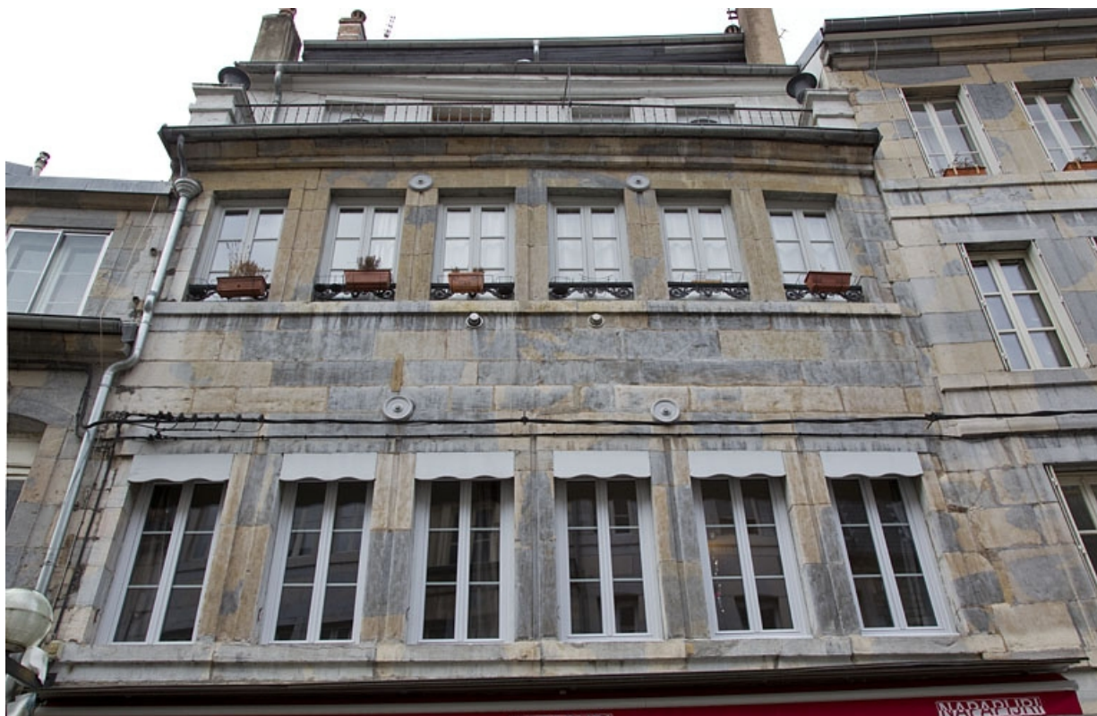
Logis principal, façade antérieure : détail de la partie supérieure à partir du premier étage.

25, Besançon, 5 rue Bersot, lieudit : îlot Proudhon