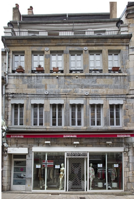
Logis principal, façade antérieure : de face.

25, Besançon, 5 rue Bersot, lieudit : îlot Proudhon