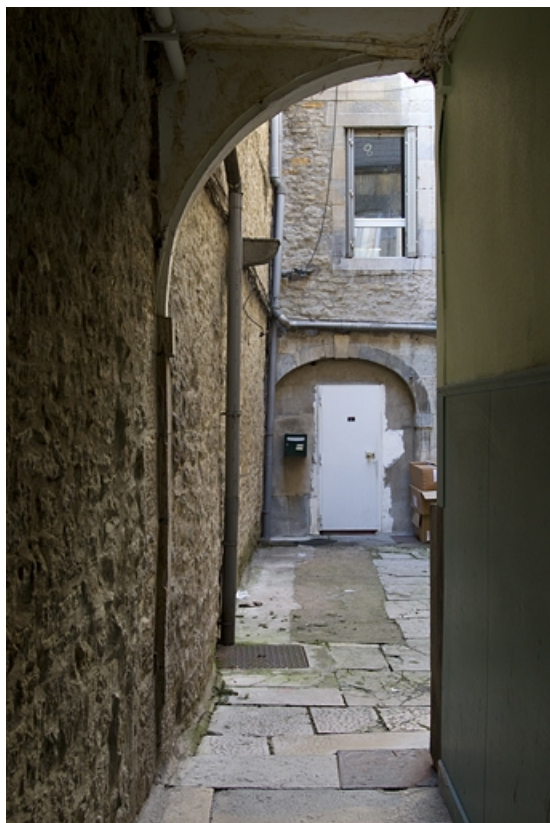
Logis secondaire : détail du porte cochère depuis le couloir du logis principal. 25, Besançon, 5 rue Bersot, lieudit : îlot Proudhon