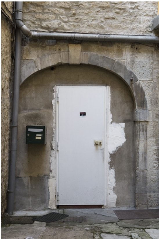
Logis secondaire, façade sur cour : détail de la porte cochère murée. 25, Besançon, 5 rue Bersot, lieudit : îlot Proudhon