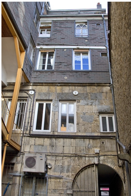
Logis principal, façade postérieure : détail de l'étage et de la surélévation. 25, Besançon, 5 rue Bersot, lieu dit : îlot Proudhon