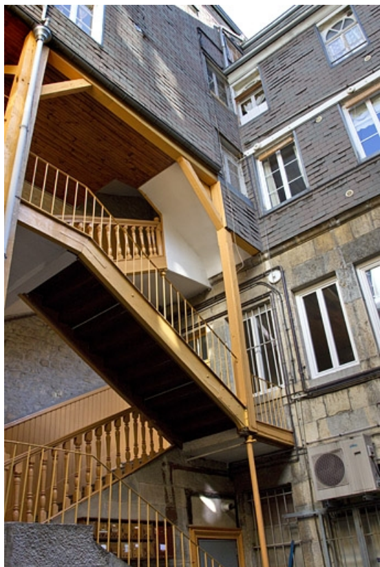
Vue d'ensemble de l'escalier à cage ouverte sur cour.

25, Besançon, 5 rue Bersot, lieudit : îlot Proudhon