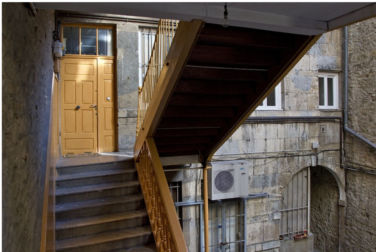
Logis principal : vue de l'intérieur de l'escalier à cage ouverte et de la porte d'entrée de l'appartement du premier étage. 25, Besançon, 5 rue Bersot, lieudit : îlot Proudhon