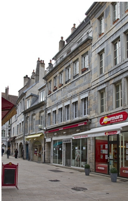
Logis principal, vue d'ensemble de trois quarts droit.

25, Besançon, 5 rue Bersot, lieudit : îlot Proudhon