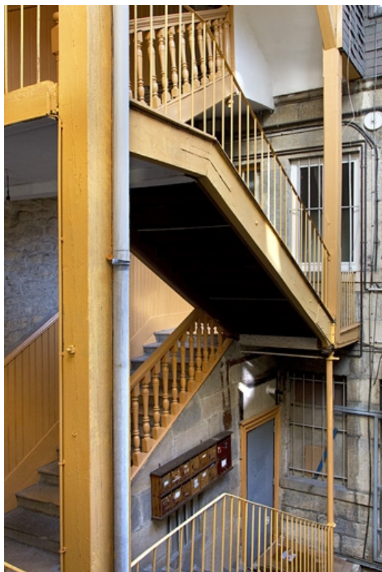
Vue de l'escalier à cage ouverte depuis la deuxième volée.

25, Besançon, 5 rue Bersot, lieudit : îlot Proudhon