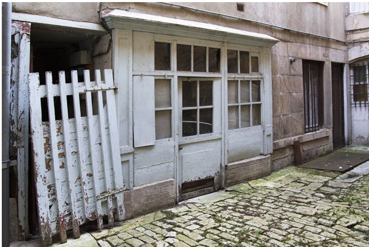
Aile droite sur cour : détail de la devanture en bois d'une ancienne boutique.

25, Besançon, 3 rue Bersot, lieudit : îlot Proudhon