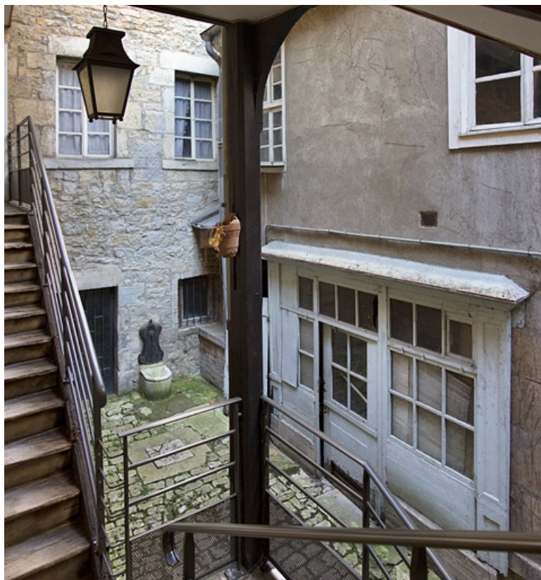
Vue de la devanture de la boutique, à droite de la cour, depuis l'escalier du logis. 25, Besançon, 3 rue Bersot, lieudit : îlot Proudhon