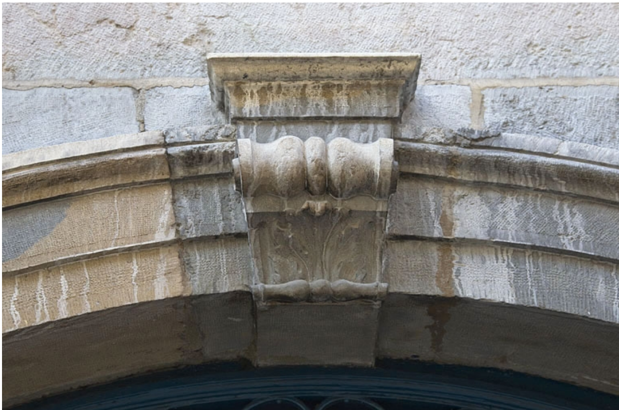
Façade sur rue : détail de la clé de la porte du couloir.

25, Besançon, 3 rue Bersot, lieudit : îlot Proudhon