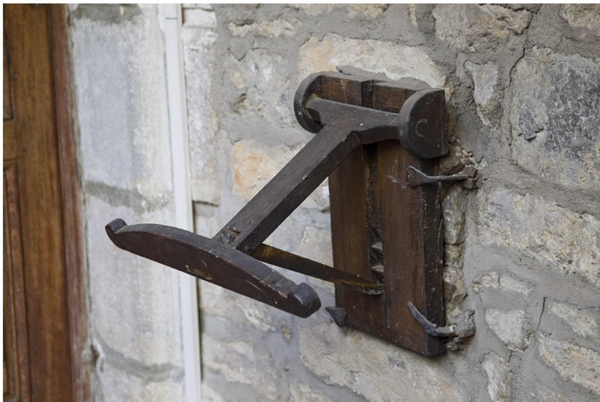
Logis principal, façade sur cour : détail d'un objet en bois non identifié (lutrין ?) situé à côté de la porte d'entrée de l'appartement du premier étage.

25, Besançon, 3 rue Bersot, lieudit : îlot Proudhon