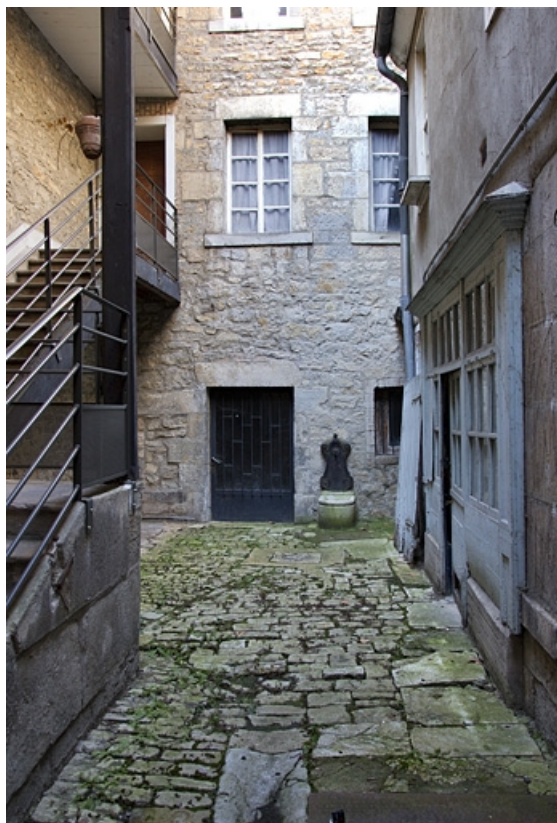
Vue d'ensemble du logis secondaire sur cour. 25, Besançon, 3 rue Bersot, lieudit : îlot Proudhon