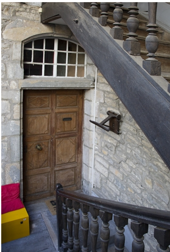
Logis principal, façade sur cour : détail de la porte d'entrée de l'appartement du premier étage. 25, Besançon, 3 rue Bersot, lieudit : îlot Proudhon