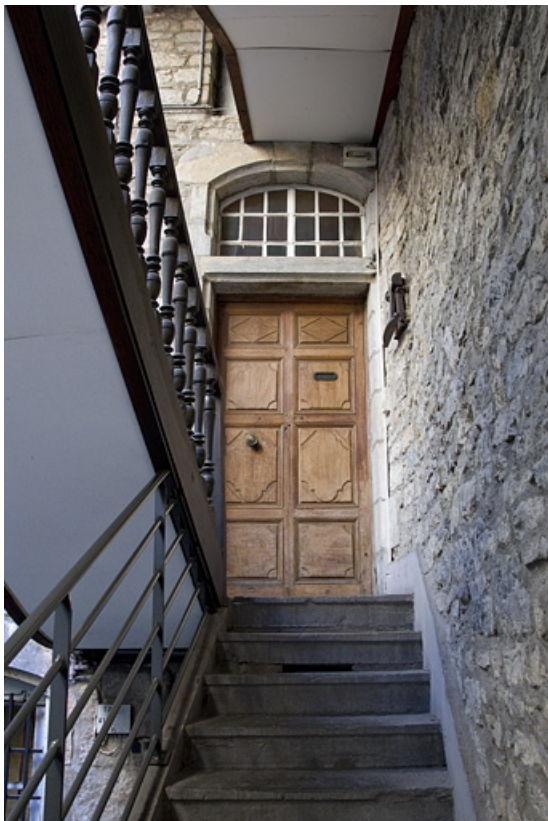
Logis principal, façade sur cour : détail de la porte d'entrée de l'appartement du premier étage depuis l'escalier à cage ouverte. 25, Besançon, 3 rue Bersot, lieudit : îlot Proudhon