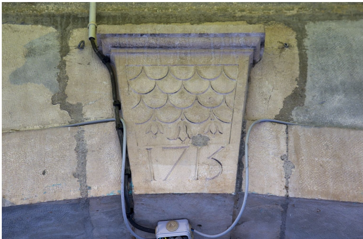
Façade sur rue : détail de la clé de l'arcade boutiquière.

25, Besançon, 3 rue Bersot, lieudit : îlot Proudhon