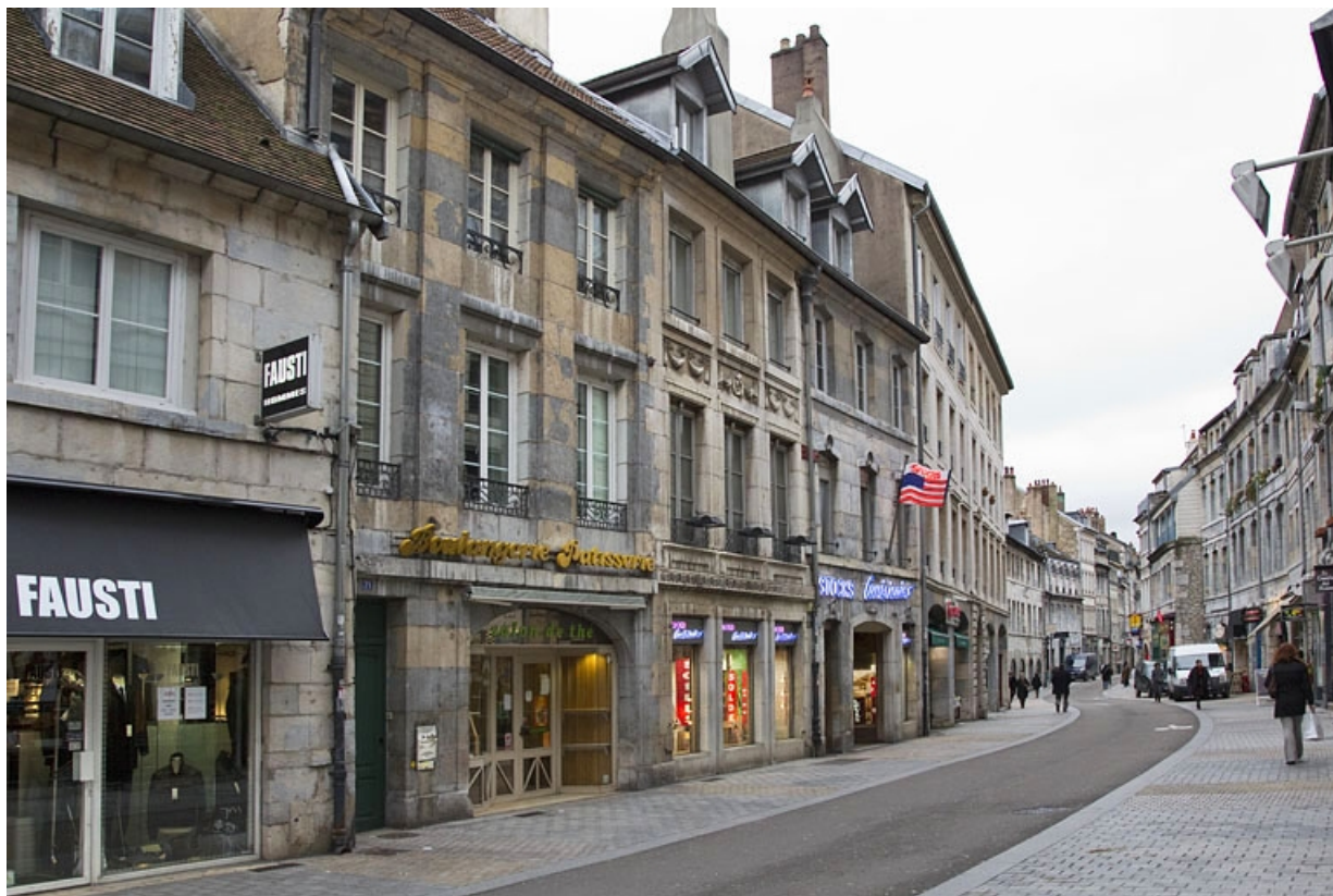
Logis principal : vue d'ensemble de trois quarts gauche. 25, Besançon, 73 rue des Granges, lieudit : îlot Proudhon