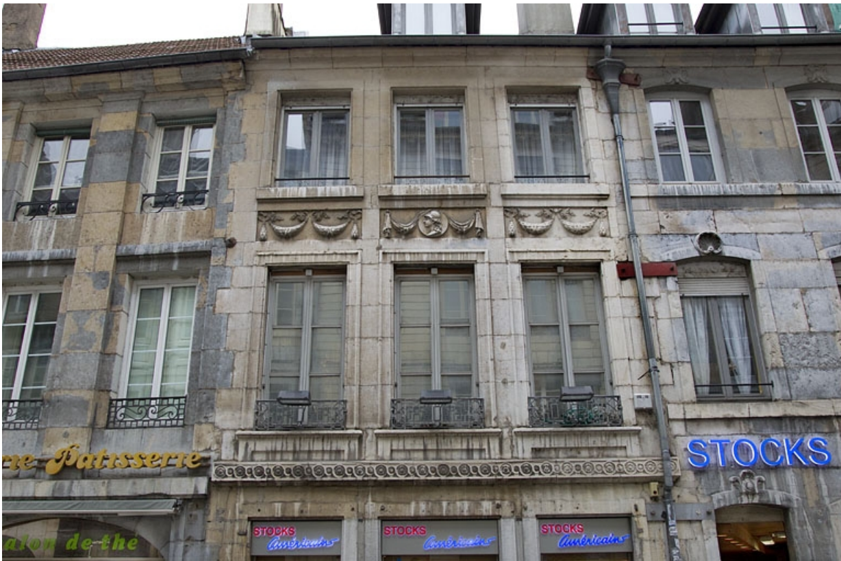
Logis principal, façade antérieure : vue des premier et deuxième étages. 25, Besançon, 73 rue des Granges, lieudit : îlot Proudhon