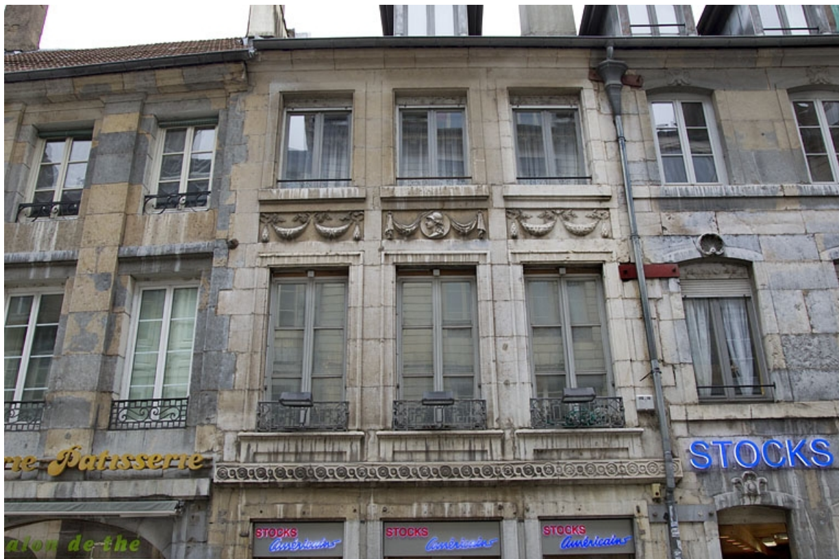
Logis principal, façade antérieure : vue des premier et deuxième étages.

25, Besançon, 73 rue des Granges, lieudit : îlot Proudhon