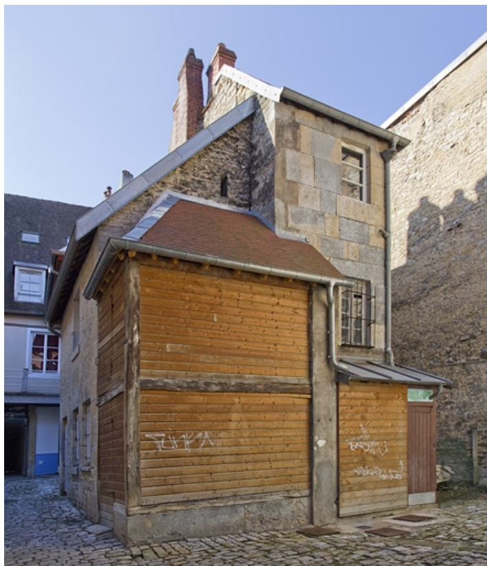
Première cour : vue de l'aile gauche depuis la deuxième cour.

25, Besançon, 69 rue des Granges, lieudit : îlot Proudhon