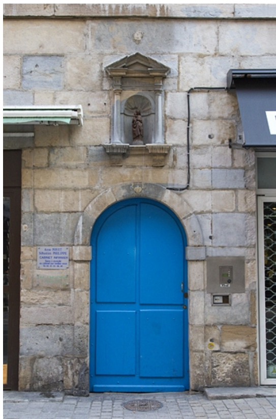
Logis principal, façade antérieure : détail du portail d'entrée.

25, Besançon, 69 rue des Granges, lieudit : îlot Proudhon