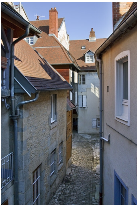
Vue d'ensemble des corps de bâtiment depuis l'entrée de la première cour.

25, Besançon, 69 rue des Granges, lieudit : îlot Proudhon