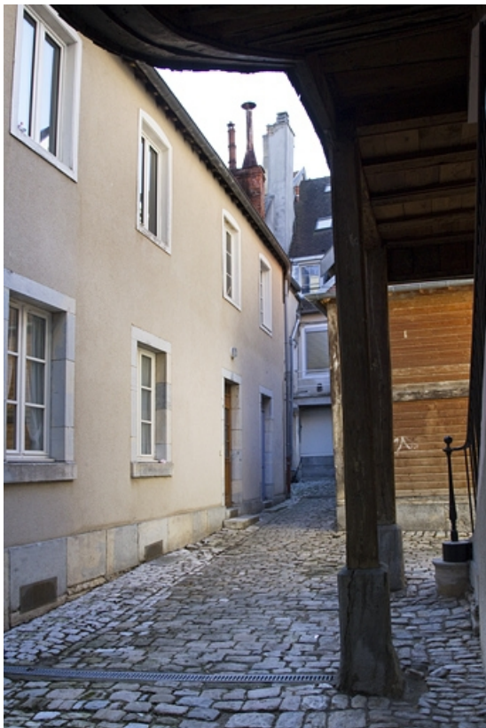
Détail de l'aile droite depuis la deuxième cour.

25, Besançon, 69 rue des Granges, lieudit : îlot Proudhon