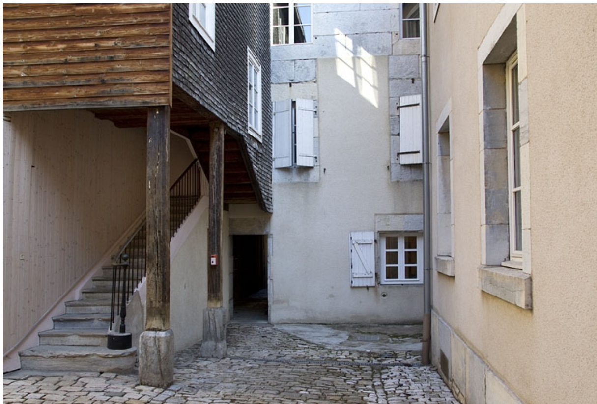
Logis secondaire : détail de la façade antérieure et du départ de l'escalier à cage ouverte.

25, Besançon, 69 rue des Granges, lieudit : îlot Proudhon