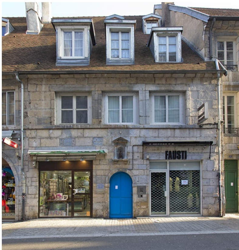
Logis principal, façade antérieure : de face.

25, Besançon, 69 rue des Granges, lieudit : îlot Proudhon