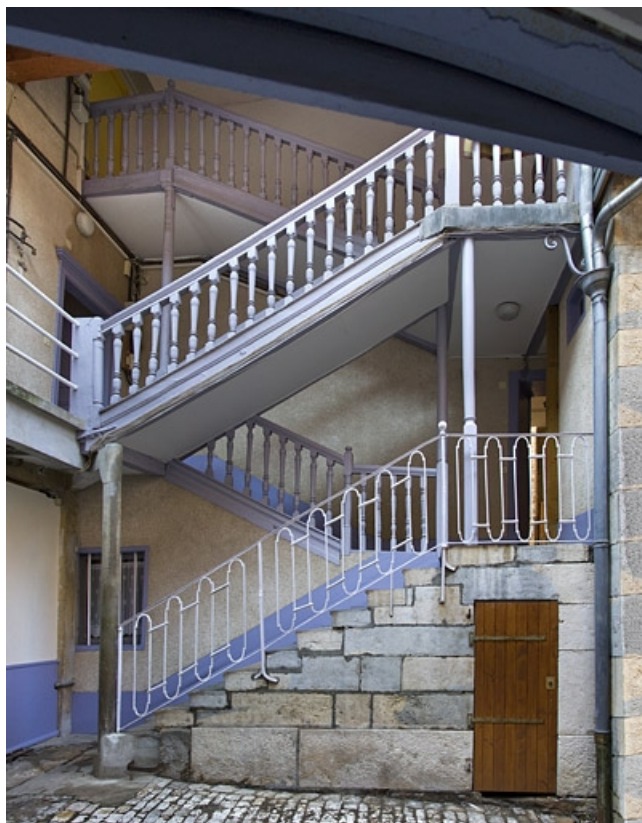
Vue d'ensemble de l'escalier à cage ouverte dans la première cour.

25, Besançon, 69 rue des Granges, lieudit : îlot Proudhon