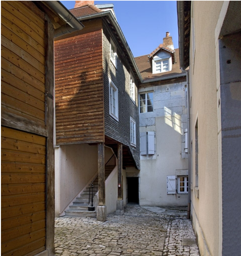
Logis secondaire : détail de l'escalier à cage ouverte.

25, Besançon, 69 rue des Granges, lieudit : îlot Proudhon