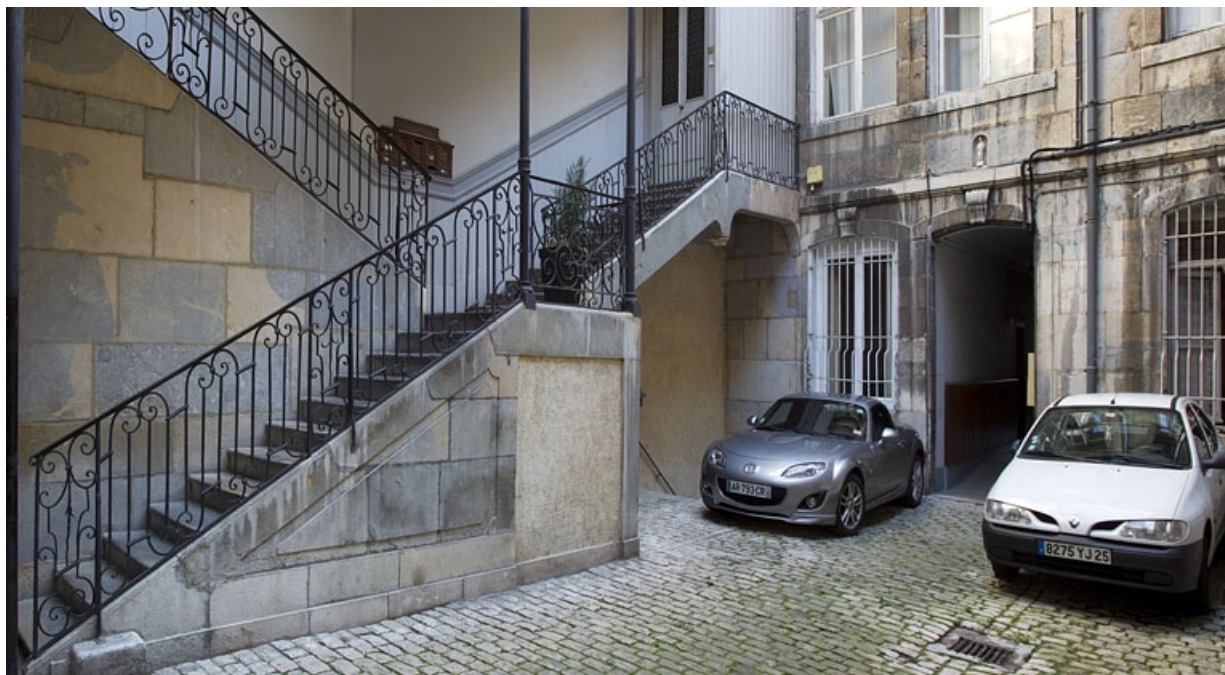
Vue d'ensemble des premières volées de l'escalier à cage ouverte sur cour : de trois quarts droit.

25, Besançon, 17 rue des Granges, lieudit : îlot Poste