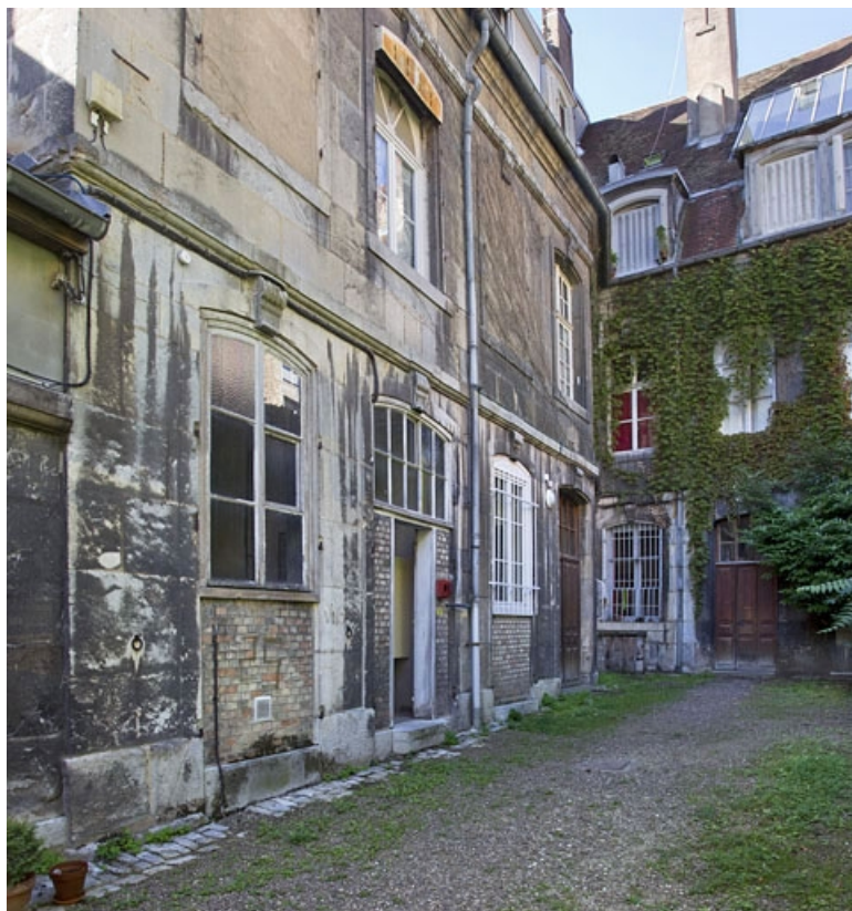
Vue d'ensemble de l'aile droite du logis principal depuis le fond de la cour : de trois quarts droit. 25, Besançon, 17 rue des Granges, lieudit : îlot Poste