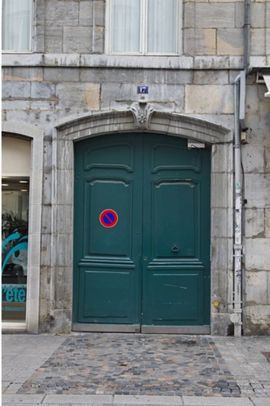
Logis principal, façade antérieure : détail du portail d'entrée, de face. 25, Besançon, 17 rue des Granges, lieudit : îlot Poste