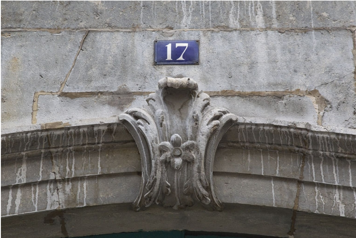
Logis principal, façade antérieure : détail de la clé du portail d'entrée.

25, Besançon, 17 rue des Granges, lieudit : îlot Poste