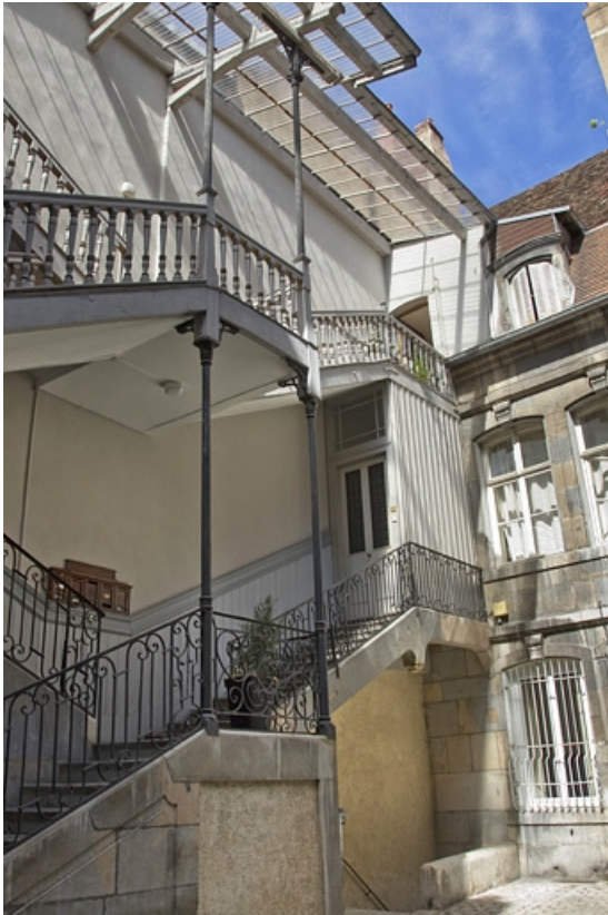
Vue d'ensemble de l'escalier à cage ouverte : de trois quarts gauche.

25, Besançon, 17 rue des Granges, lieudit : îlot Poste