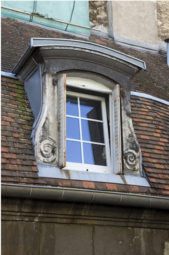
Première cour, logis principal : détail d'une lucarne, aile à droite de la cour. 25, Besançon, 17 rue des Granges, lieudit : îlot Poste