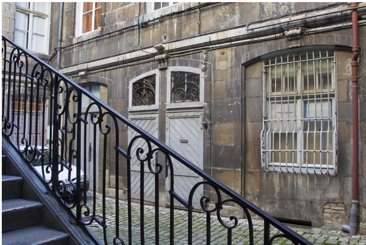
Logis principal : détail du rez-de-chaussée de l'aile droite, depuis l'escalier à cage ouverte.

25, Besançon, 17 rue des Granges, lieudit : îlot Poste