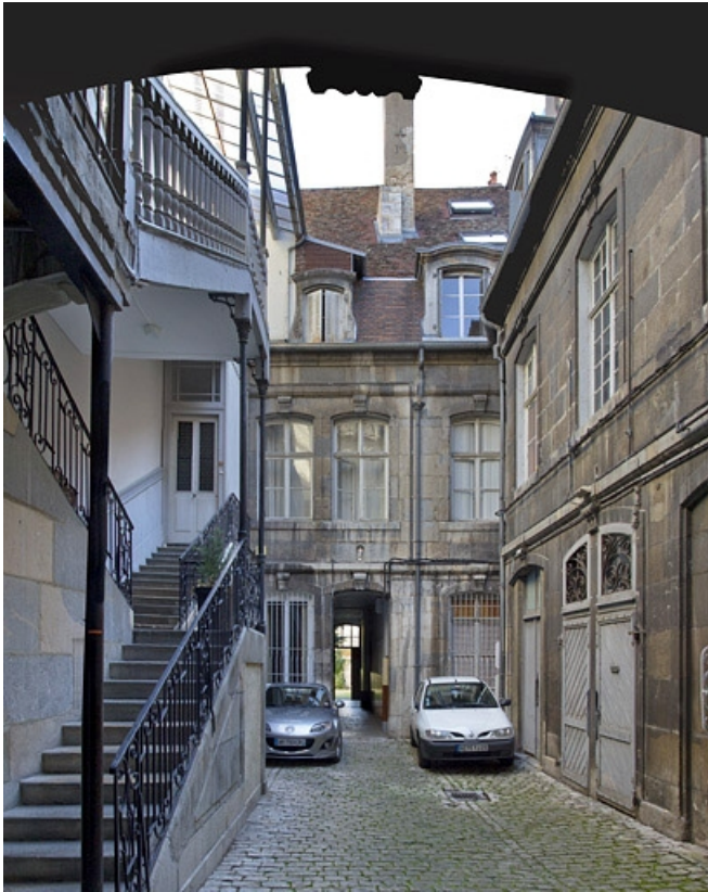
Vue d'ensemble de la première cour depuis l'entrée.

25, Besançon, 17 rue des Granges, lieudit : îlot Poste