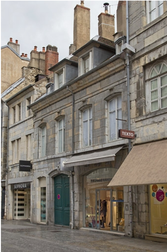
Vue d'ensemble depuis la rue : de trois quarts droit. 25, Besançon, 17 rue des Granges, lieudit : îlot Poste