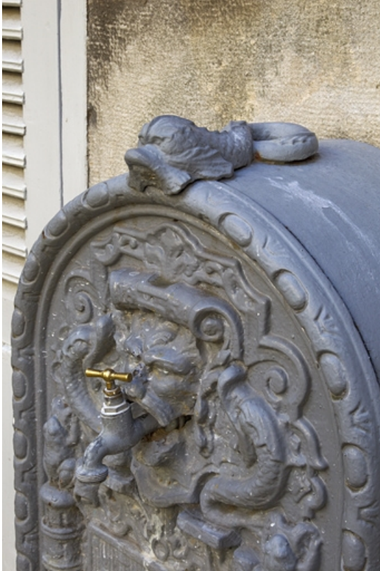
Détail de la partie supérieure de la borne fontaine située à droite de la cour, de trois quarts droit. 25, Besançon, 21 rue des Granges, lieudit : îlot Poste