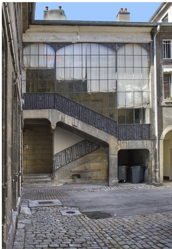
Vue d'ensemble de l'escalier à cage ouverte, de face. 25, Besançon, 21 rue des Granges, lieudit : îlot Poste