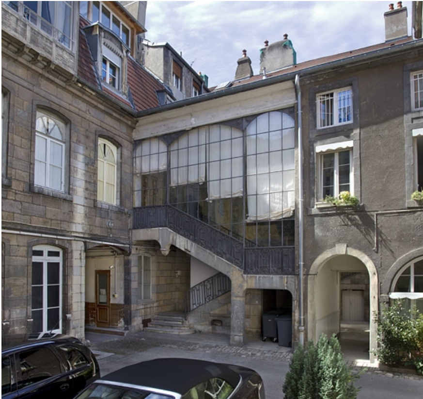
Vue d'ensemble de l'escalier à cage ouverte, de trois quarts droit.

25, Besançon, 21 rue des Granges, lieudit : îlot Poste