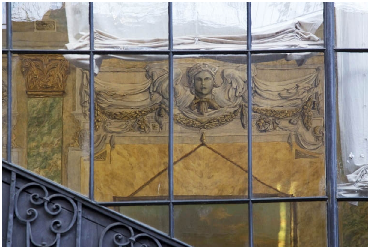
Escalier à cage ouverte : détail du décor intérieur, vue rapprochée, de face.

25, Besançon, 21 rue des Granges, lieudit : îlot Poste