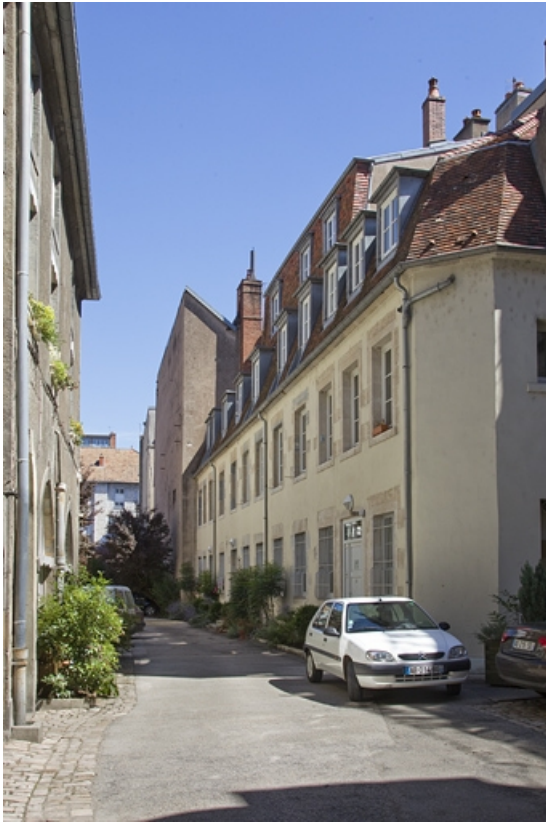
Deuxième logis secondaire : de trois quarts droit. 25, Besançon, 21 rue des Granges, lieudit : îlot Poste