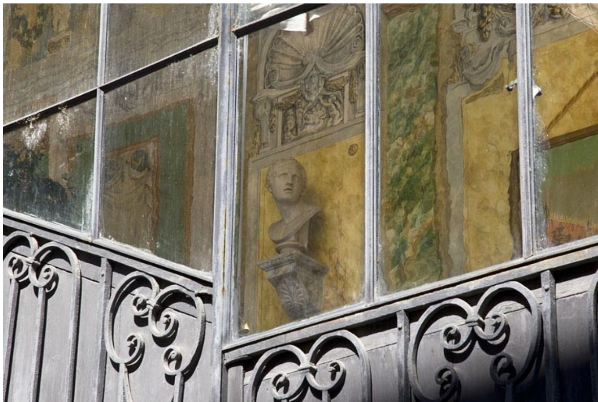
Escalier à cage ouverte : détail du décor de la cage depuis l'extérieur, de trois quarts droit. 25, Besançon, 21 rue des Granges, lieudit : îlot Poste