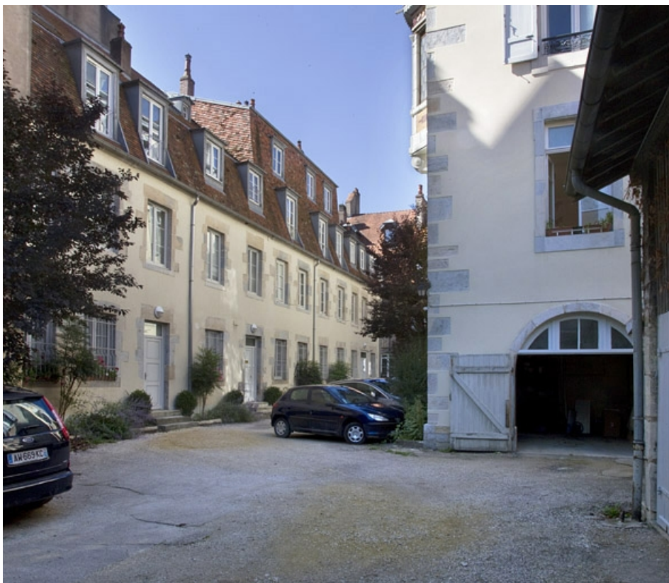
Vue d'ensemble de la cour depuis l'entrée.

25, Besançon, 21 rue des Granges, lieudit : îlot Poste