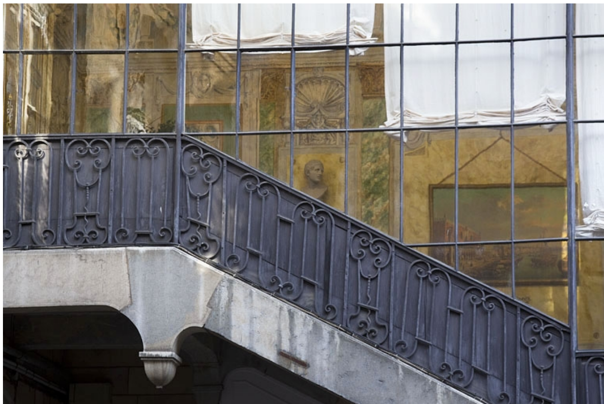
Escalier à cage ouverte : détail de la rampe en fer forgé : de face.

25, Besançon, 21 rue des Granges, lieudit : îlot Poste