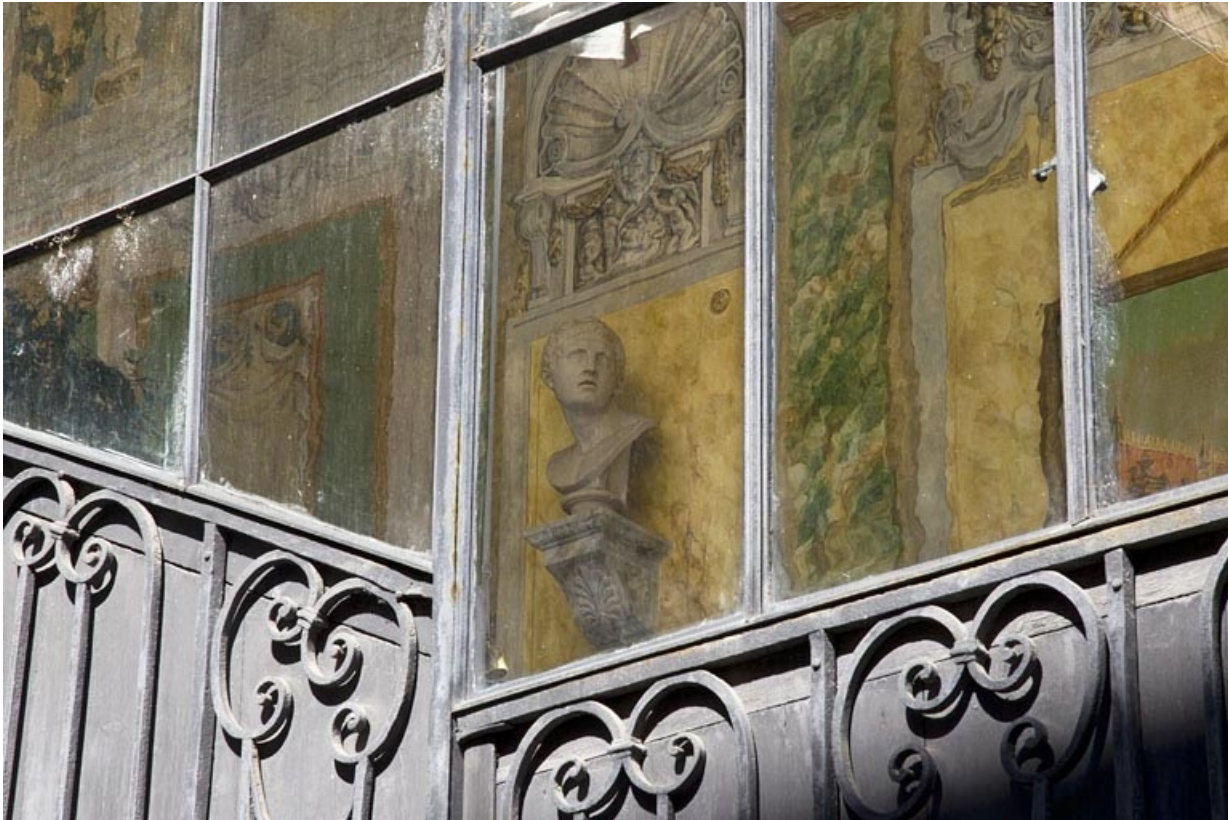
Escalier à cage ouverte : détail du décor de la cage depuis l'extérieur, de trois quarts droit.

25, Besançon, 21 rue des Granges, lieudit : îlot Poste