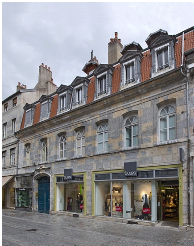
Vue d'ensemble rapprochée sur rue, de trois quarts droit.

25, Besançon, 21 rue des Granges, lieudit : îlot Poste