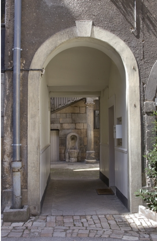
Aile des remises : détail de la porte de communication avec la parcelle voisine.

25, Besançon, 21 rue des Granges, lieudit : îlot Poste