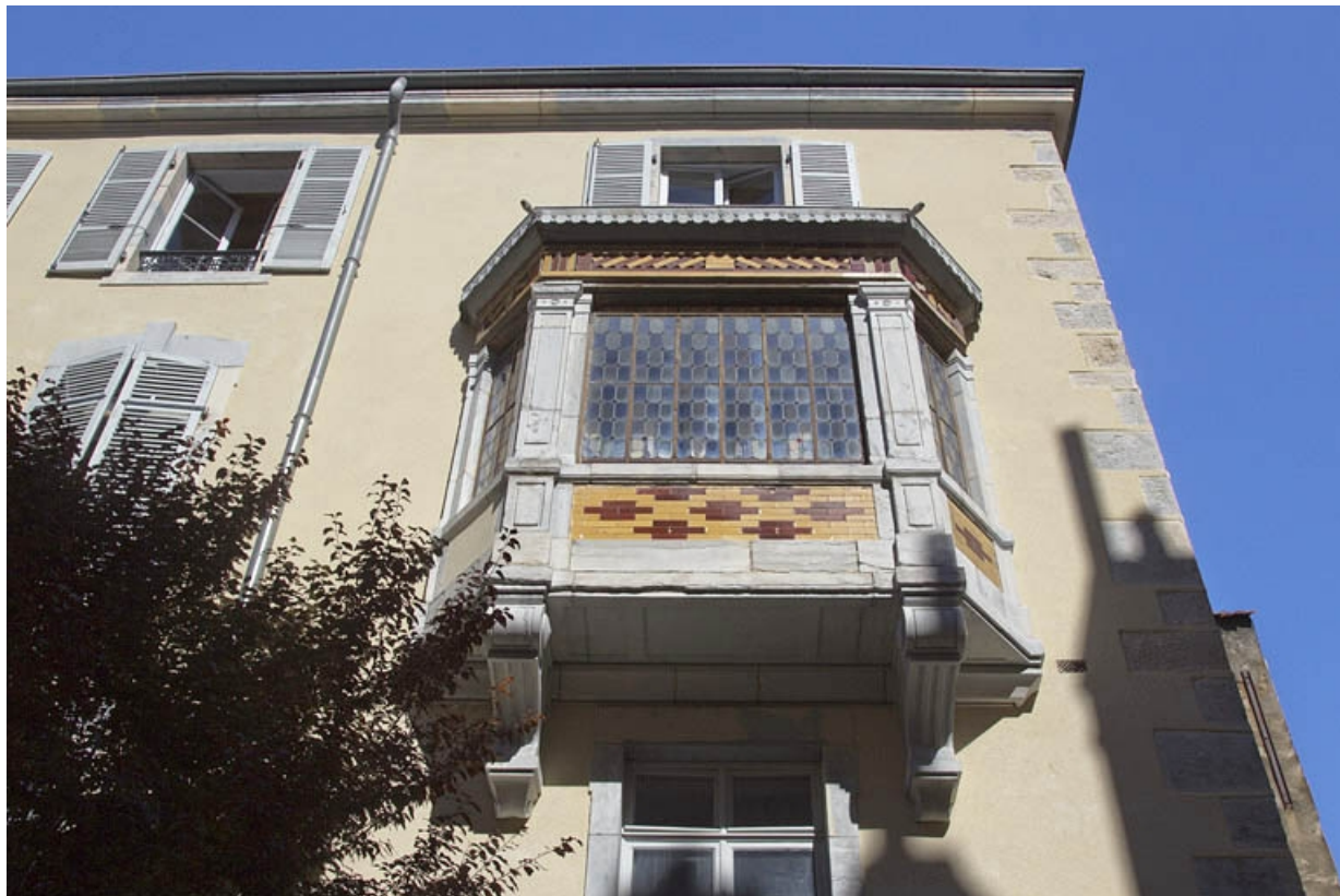
Premier logis secondaire : détail du bow window, de face.

25, Besançon, 21 rue des Granges, lieudit : îlot Poste