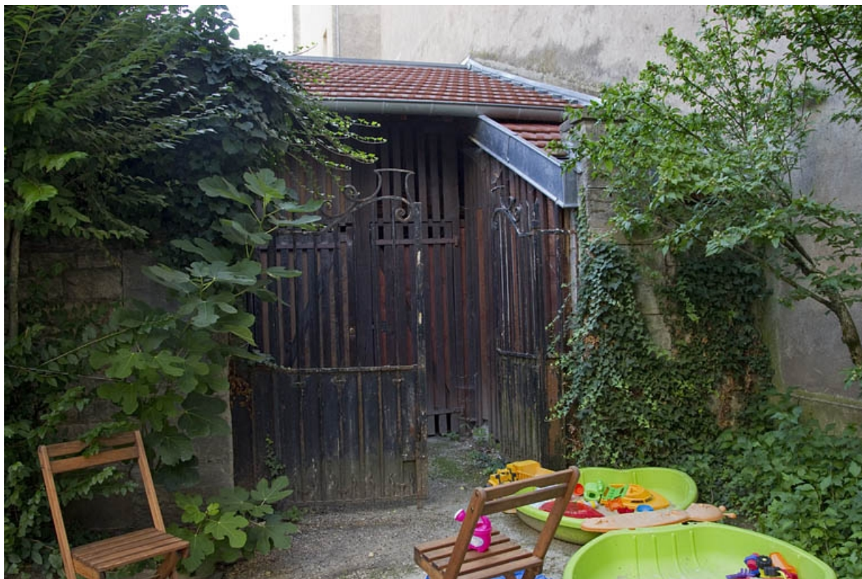
Vue du portail d'entrée de la courette des bûchers.

25, Besançon, 21 rue des Granges, lieudit : îlot Poste