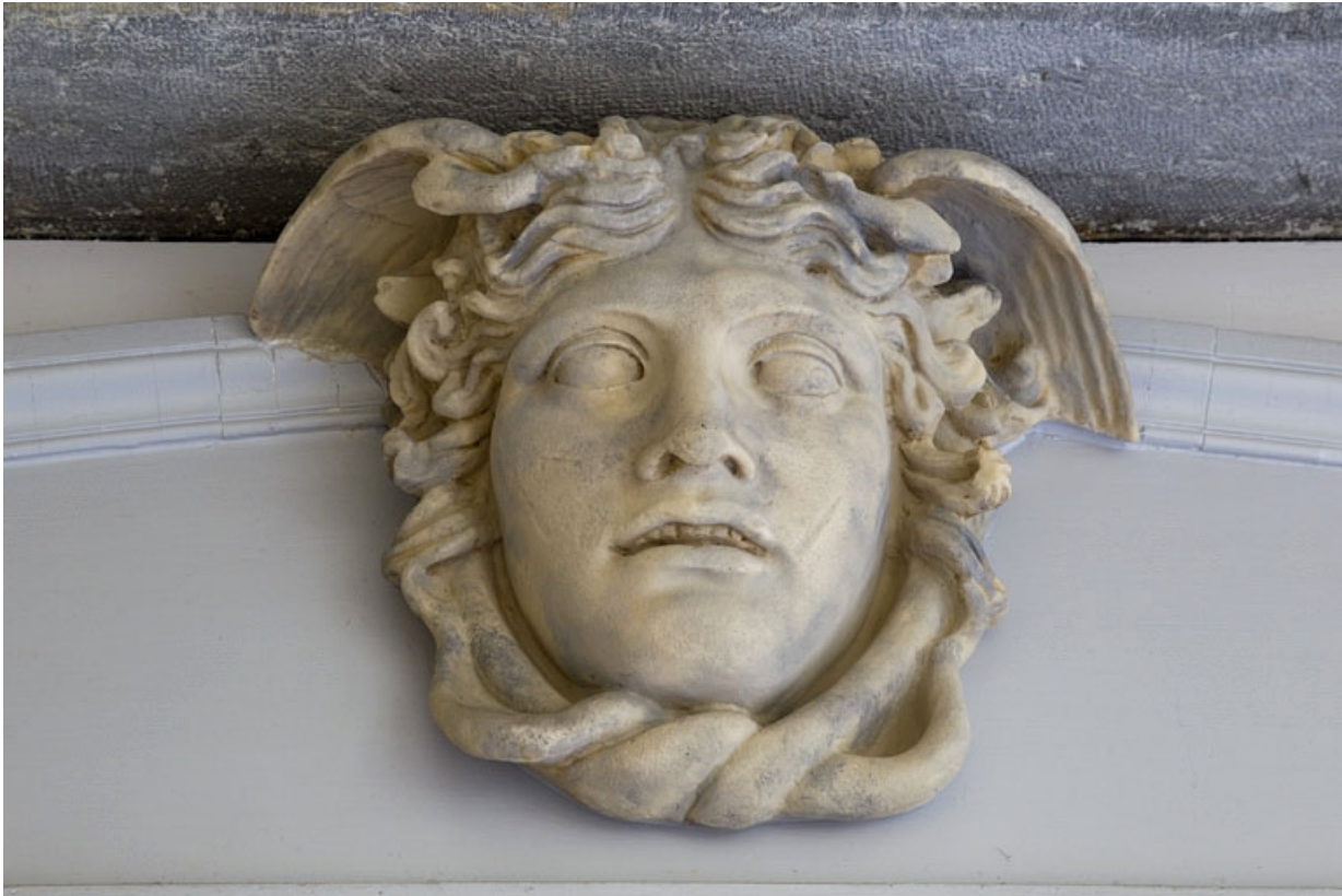
Escalier à cage ouverte, détail du décor d'un dessus de porte : sculpture représentant une tête ailée.

25, Besançon, 21 rue des Granges, lieudit : îlot Poste