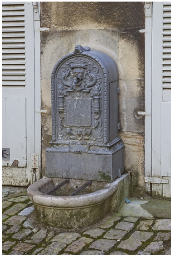
Détail de la borne fontaine située à droite de la cour, de trois quarts droit. 25, Besançon, 21 rue des Granges, lieudit : îlot Poste