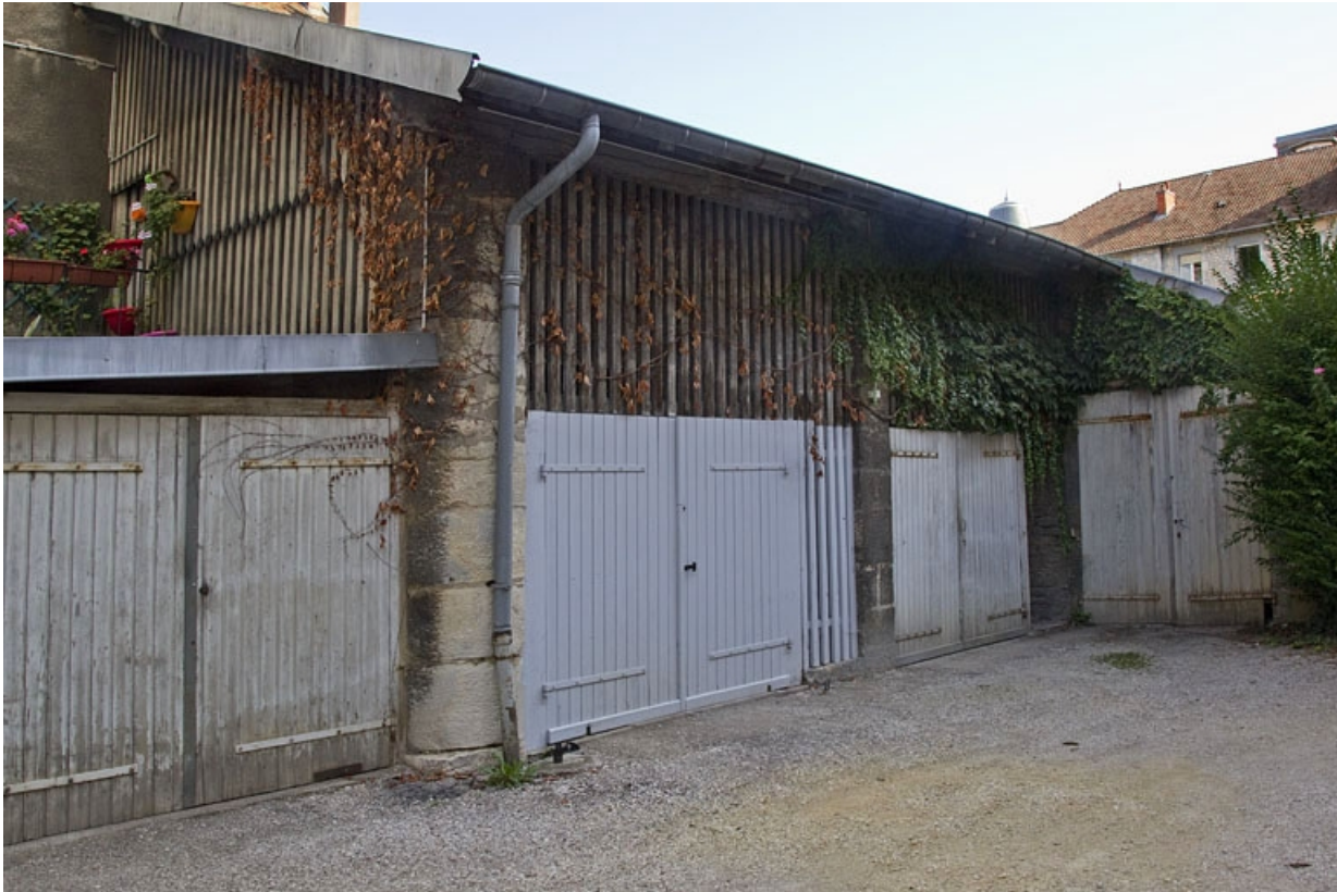
Vue des bûchers, de trois quarts gauche.

25, Besançon, 21 rue des Granges, lieudit : îlot Poste