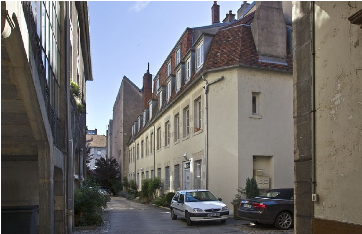
Deuxième logis secondaire : de trois quarts droit, vue rapprochée.

25, Besançon, 21 rue des Granges, lieudit : îlot Poste