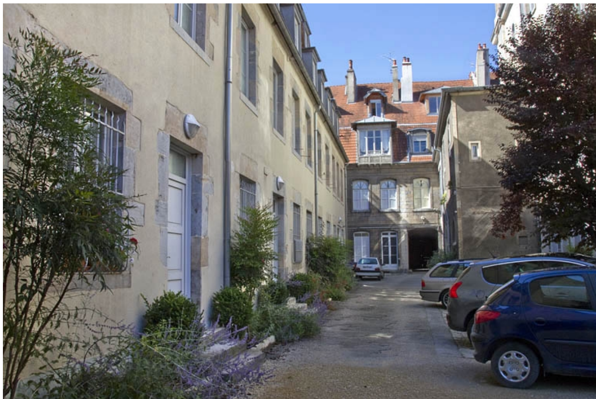
Vue d'ensemble de la cour depuis le fond.

25, Besançon, 21 rue des Granges, lieudit : îlot Poste