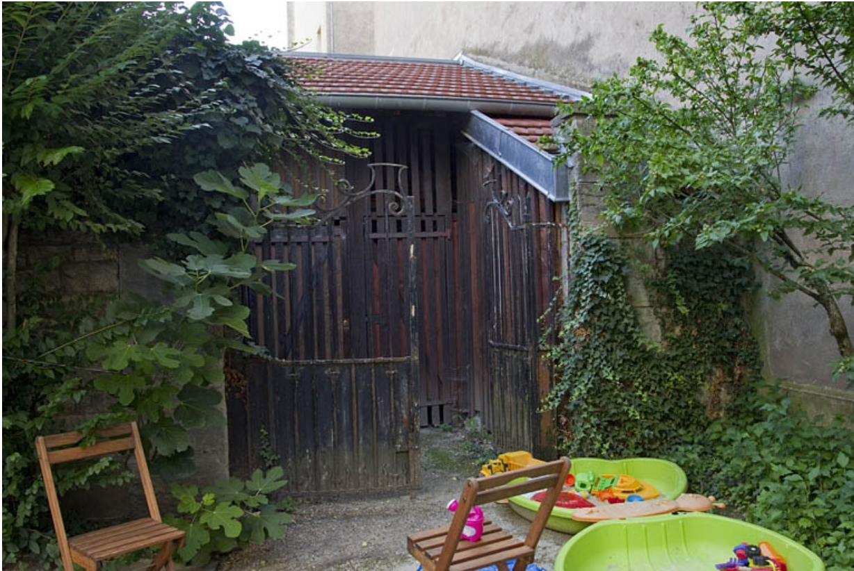
Vue du portail d'entrée de la courette des bûchers.

25, Besançon, 21 rue des Granges, lieudit : îlot Poste