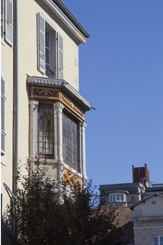
Premier logis secondaire : détail du bow window, de trois quarts gauche.

25, Besançon, 21 rue des Granges, lieudit : îlot Poste