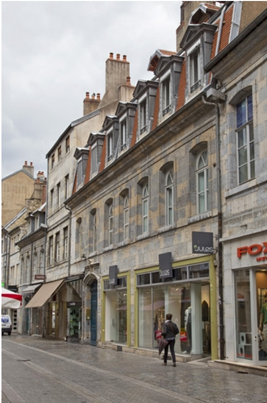
Vue d'ensemble sur rue, de trois quarts droit.

25, Besançon, 21 rue des Granges, lieudit : îlot Poste