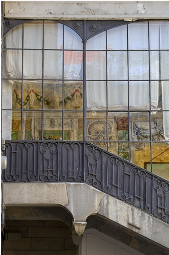
Escalier à cage ouverte, détail du décor peint depuis l'extérieur : de face.

25, Besançon, 21 rue des Granges, lieudit : îlot Poste