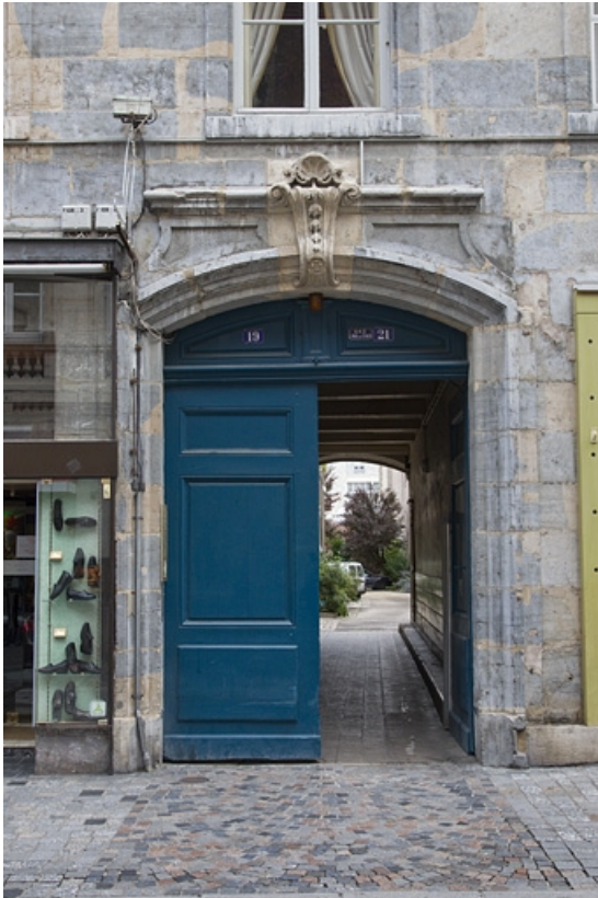
Logis principal, façade antérieure : détail du portail d'entrée.

25, Besançon, 21 rue des Granges, lieudit : îlot Poste