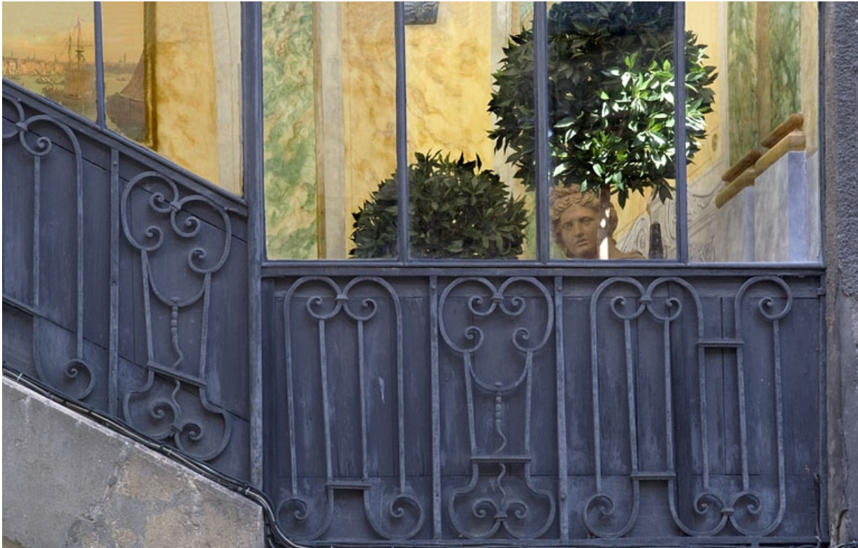
Escalier à cage ouverte sur cour : détail de la rampe en fer forgé.

25, Besançon, 21 rue des Granges, lieudit : îlot Poste