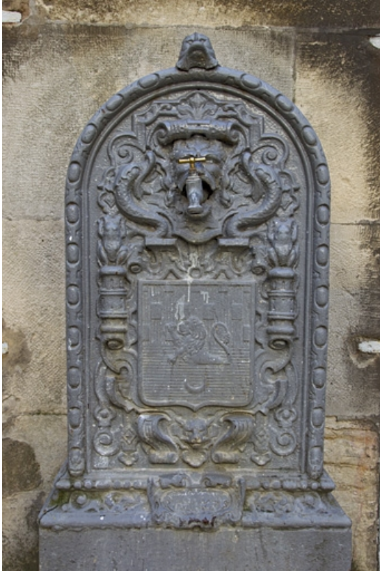
Détail de la borne fontaine située à droite de la cour, de face.

25, Besançon, 21 rue des Granges, lieudit : îlot Poste