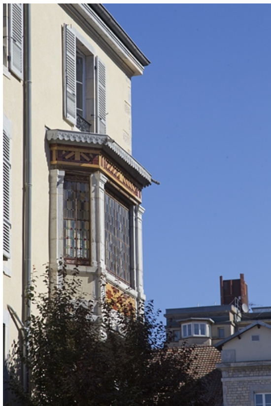
Premier logis secondaire : détail du bow window, de trois quarts gauche.

25, Besançon, 21 rue des Granges, lieudit : îlot Poste