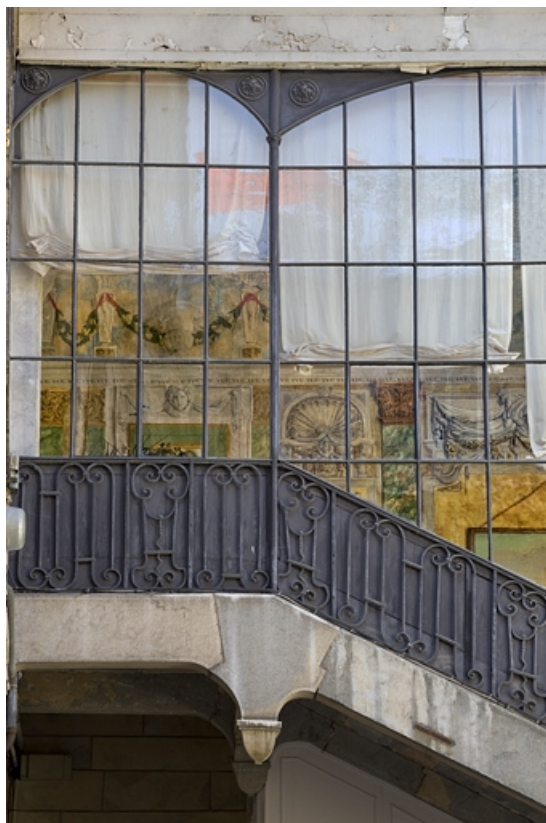
Escalier à cage ouverte, détail du décor peint depuis l'extérieur : de face.

25, Besançon, 21 rue des Granges, lieudit : îlot Poste