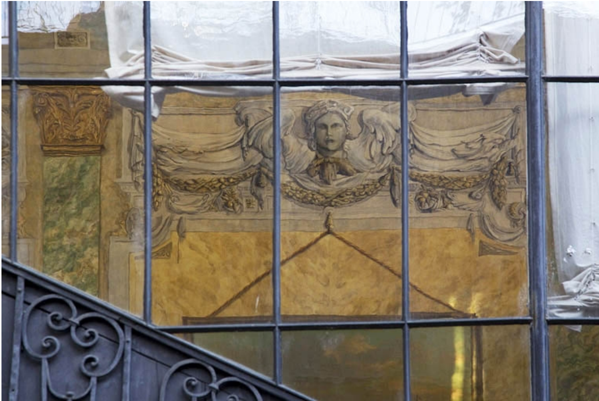
Escalier à cage ouverte : détail du décor intérieur, vue rapprochée, de face.

25, Besançon, 21 rue des Granges, lieudit : îlot Poste