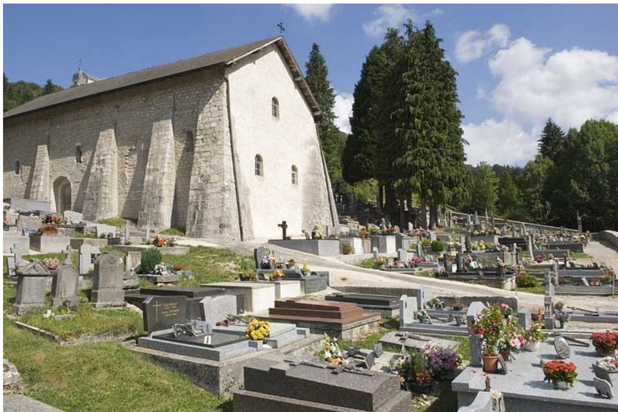
Le cimetière, vue du sud.

25, Jougne, lieudit : la Ferrière-sous-Jougne