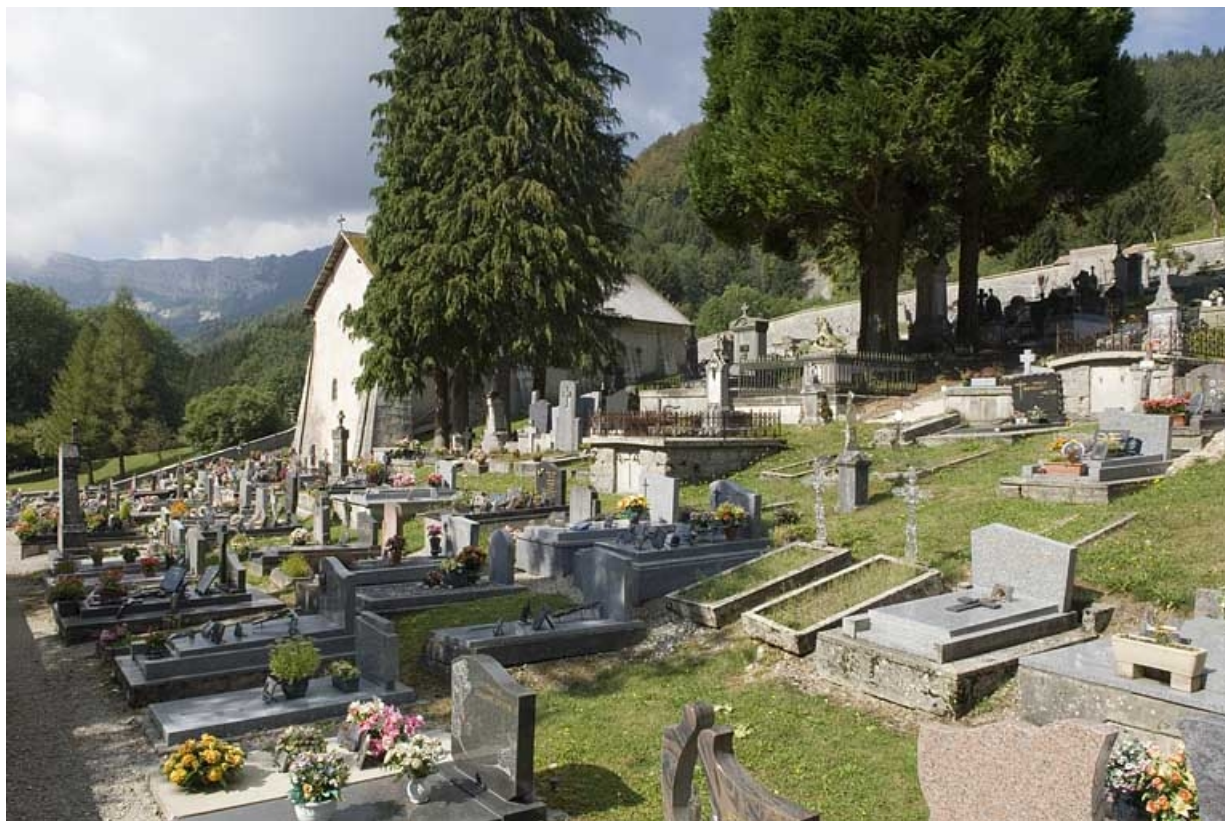
Le cimetière, vue du sud-est.

25, Jougne, lieu-dit : la Ferrière-sous-Jougne