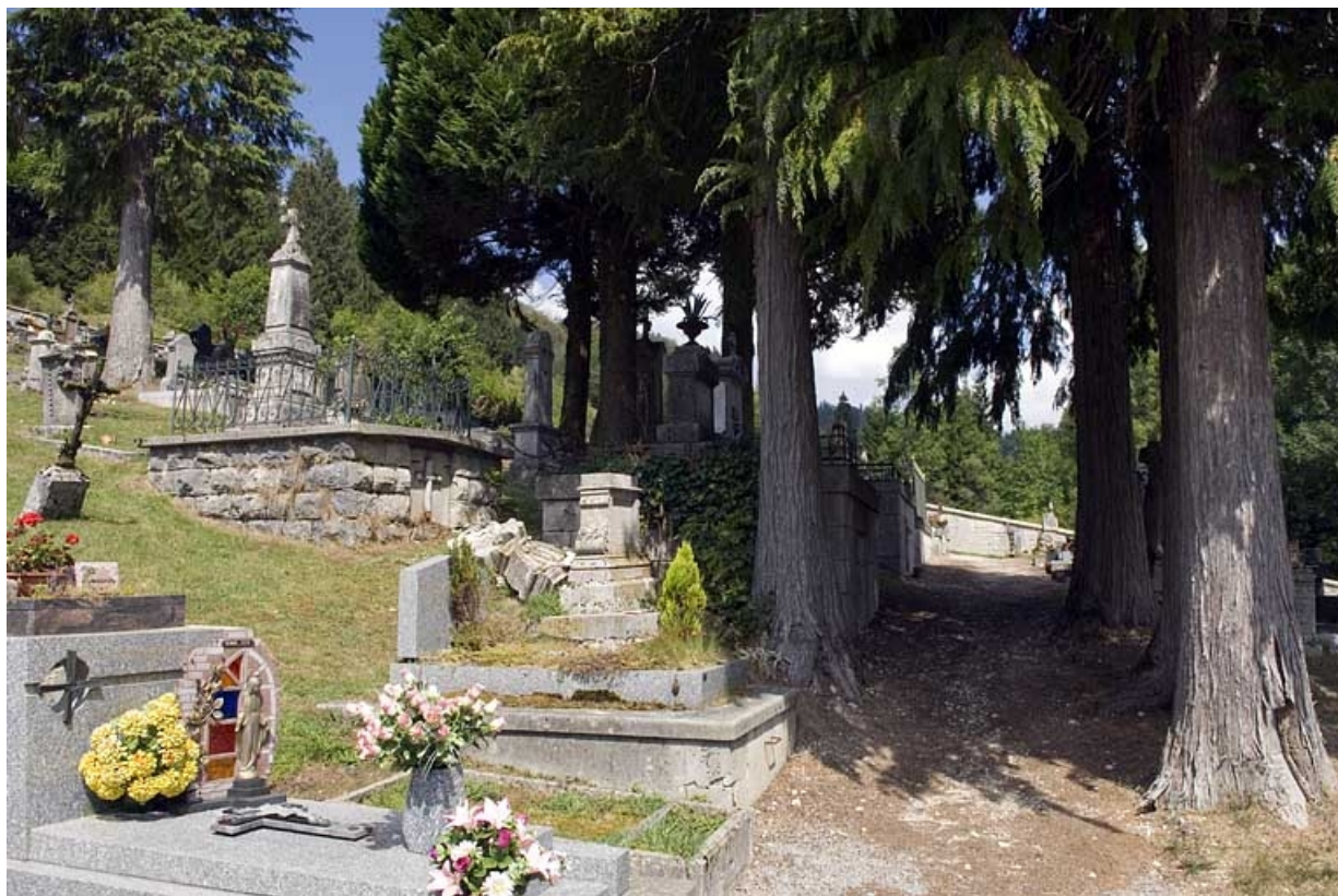
Le cimetière, vue de la partie centrale.

25, Jougne, lieudit : la Ferrière-sous-Jougne