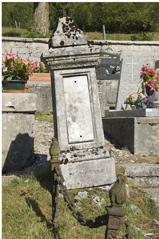
Tombeau d'Edmond Poix-Prévot (non étudié).

25, Jougne, lieudit : la Ferrière-sous-Jougne