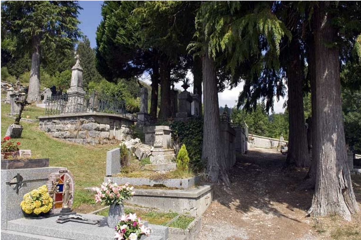
Le cimetière, vue de la partie centrale.

25, Jougne, lieudit : la Ferrière-sous-Jougne