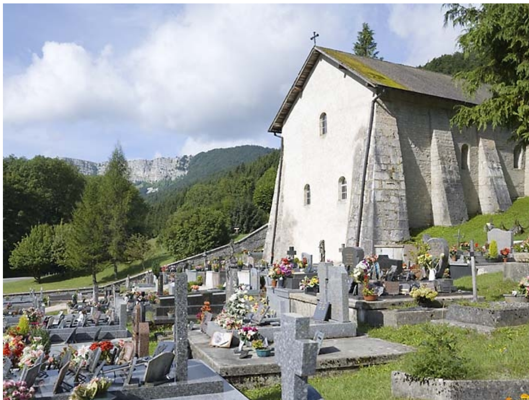
Vue générale du site, au second plan les falaises du Mont d'Or.

25, Jougne, lieudit : la Ferrière-sous-Jougne