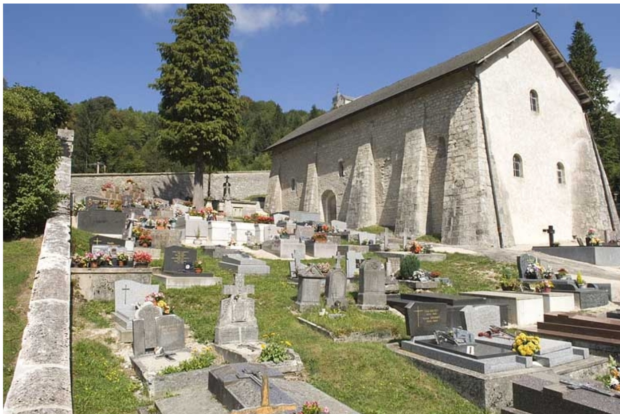
Le cimetière, vue du sud-ouest.

25, Jougne, lieudit : la Ferrière-sous-Jougne