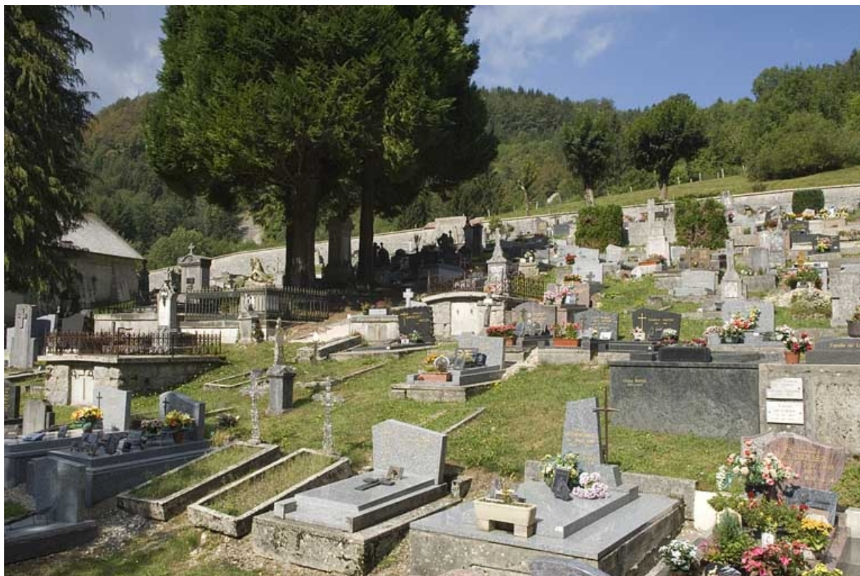
Le cimetière, vue depuis l'est.

25, Jougne, lieudit : la Ferrière-sous-Jougne