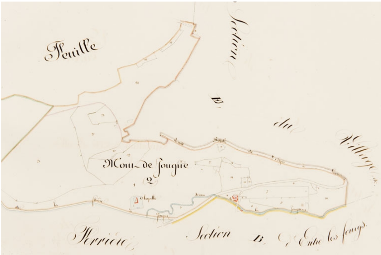
Plan masse et de situation. Extrait du plan cadastral, 1839, section D, échelle 1:4000

25, Jougne, lieudit : la Ferrière-sous-Jougne