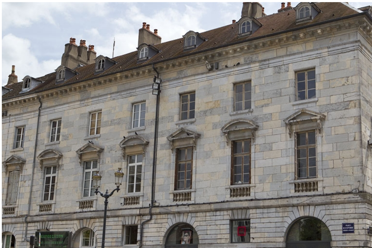
Détail de la façade antérieure de trois quarts droit.

25, Besançon, 2 place du Huit-Septembre, lieudit : îlot Saint-Pierre