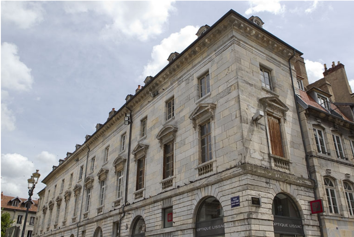
Vue d'ensemble de la façade antérieure à partir du premier étage, de trois quarts droit.

25, Besançon, 2 place du Huit-Septembre, lieudit : îlot Saint-Pierre