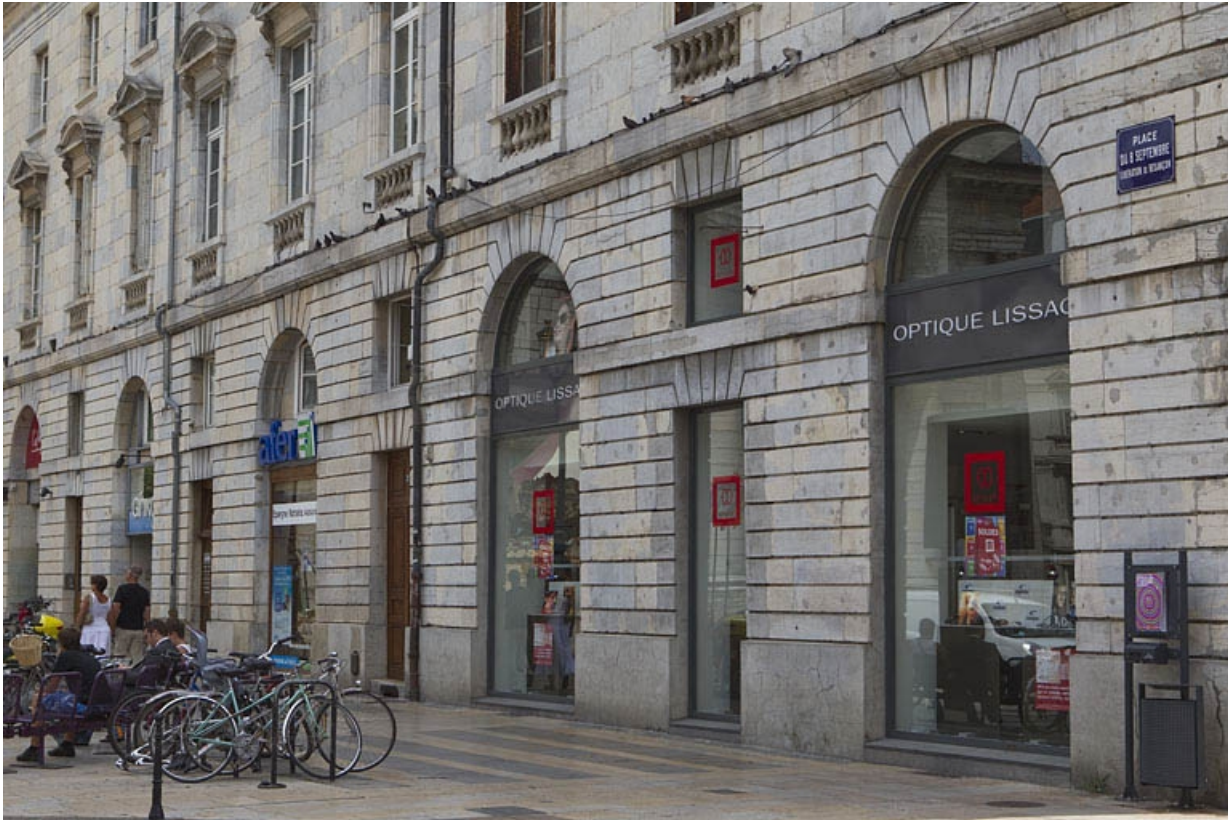
Détail du rez-de-chaussée de la façade antérieure, de trois quarts droit.

25, Besançon, 2 place du Huit-Septembre, lieudit : îlot Saint-Pierre