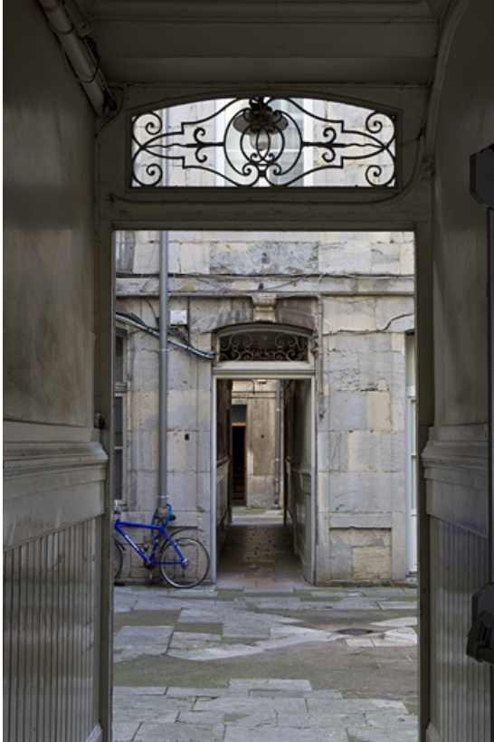
Vue du couloir traversant le premier logis secondaire depuis le couloir du logis principal.

25, Besançon Grande Rue 79, lieudit : îlot Saint-Pierre