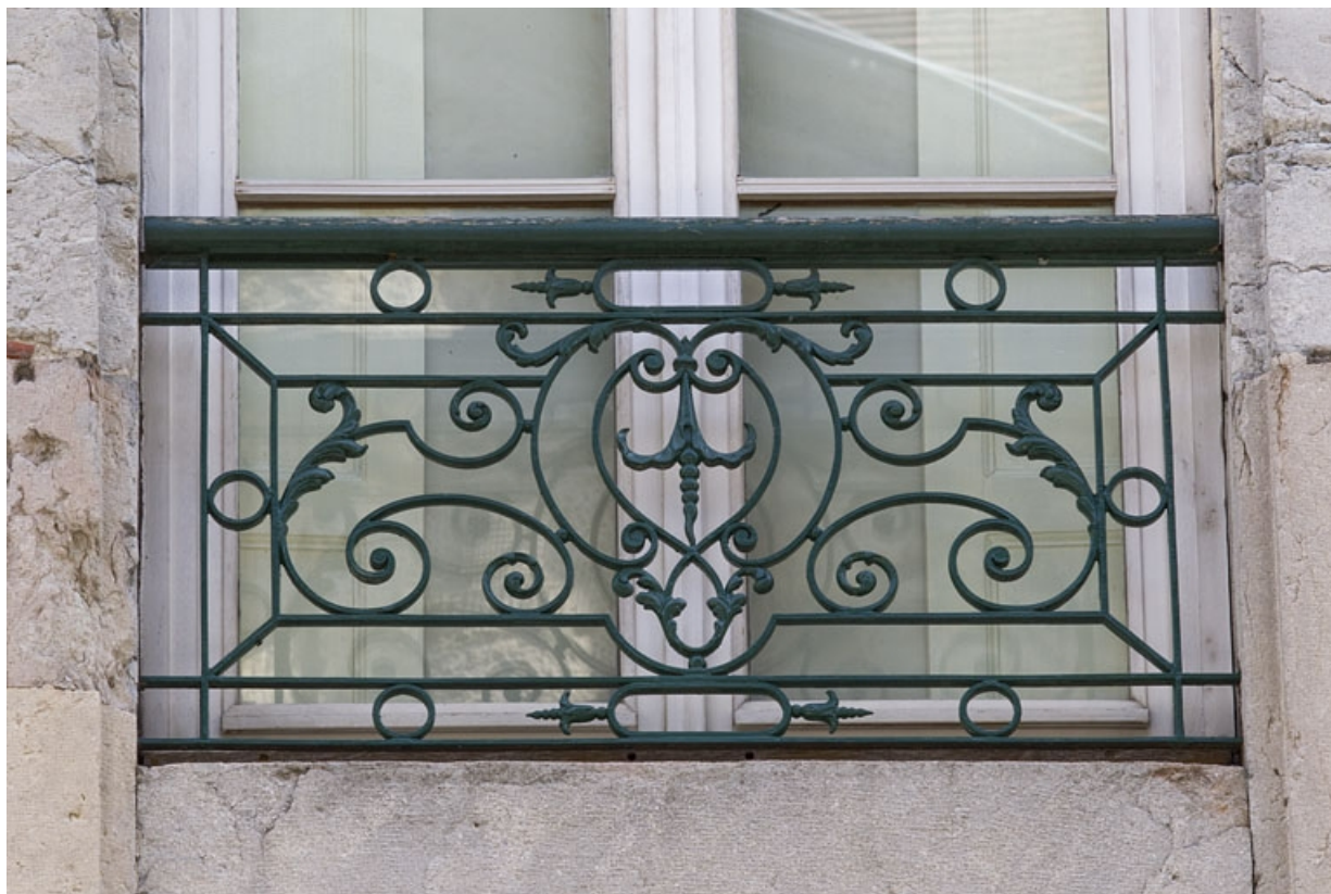
Logis principal, façade sur rue : détail d'un garde-corps en ferronnerie.

25, Besançon Grande Rue 79, lieudit : îlot Saint-Pierre