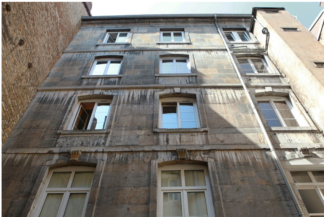
Deuxième cour : façade postérieure du premier logis secondaire, vue des étages. 25, Besançon Grande Rue 79, lieudit : îlot Saint-Pierre