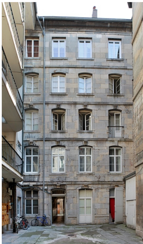
Première cour : façade antérieure du premier logis secondaire, de face. 25, Besançon Grande Rue 79, lieudit : îlot Saint-Pierre