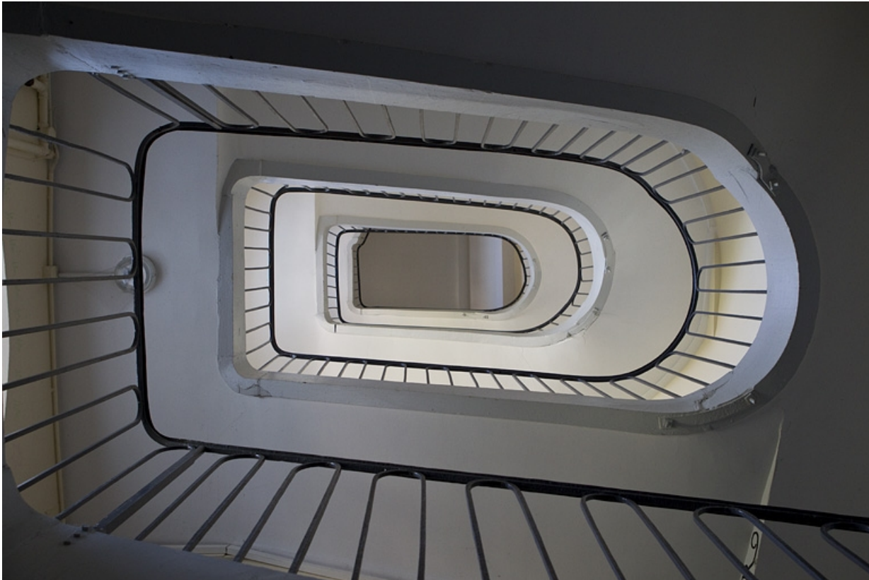
Deuxième cour, à droite : détail de l'escalier du deuxième logis secondaire.

25, Besançon Grande Rue 79, lieudit : îlot Saint-Pierre