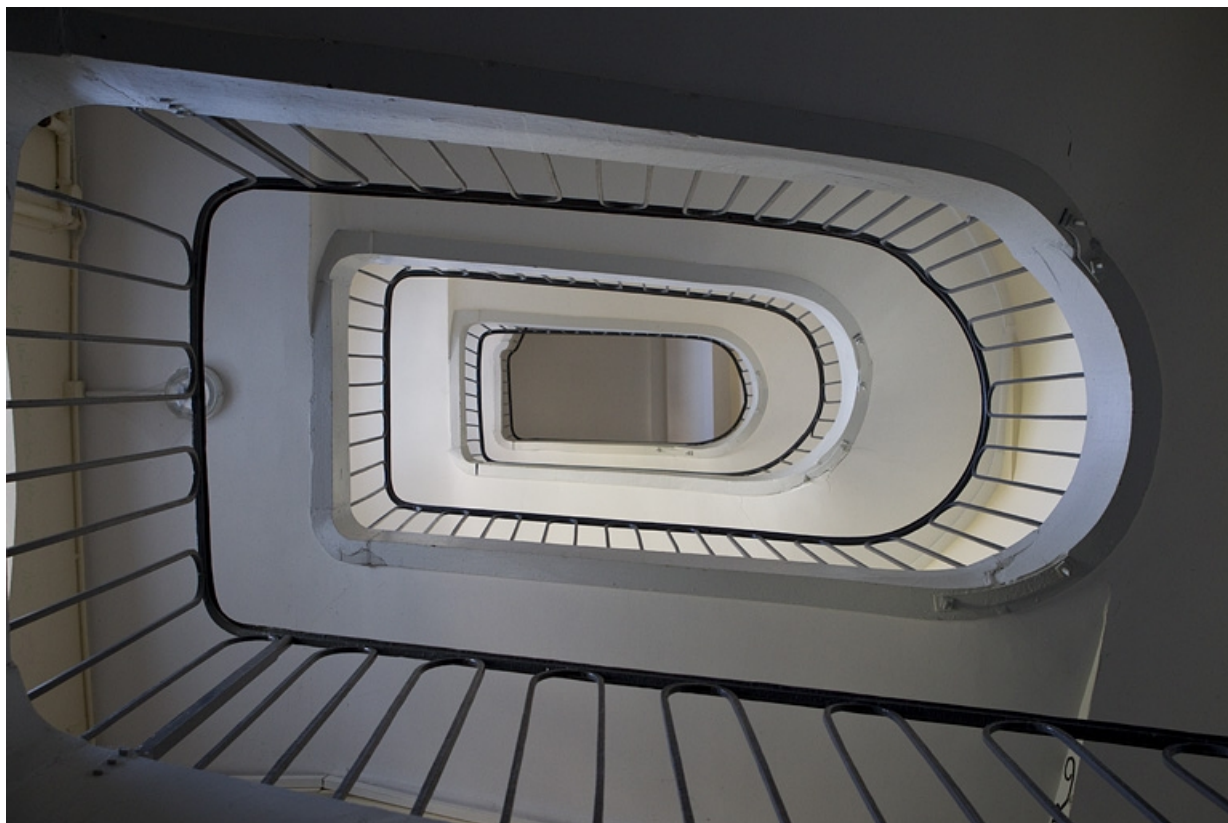
Deuxième cour, à droite : détail de l'escalier du deuxième logis secondaire.

25, Besançon Grande Rue 79, lieudit : îlot Saint-Pierre