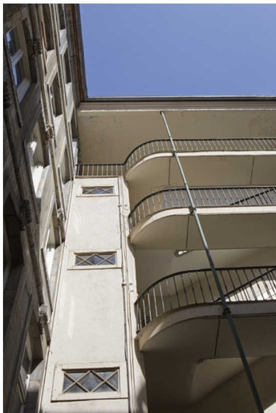
Escalier à cage ouverte de la première cour : détail de la travée à son extrémité gauche.

25, Besançon Grande Rue 79, lieudit : îlot Saint-Pierre