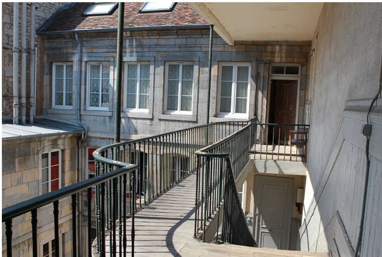
Première cour : escalier à cage ouverte, détail du palier supérieur.

25, Besançon Grande Rue 79, lieudit : îlot Saint-Pierre