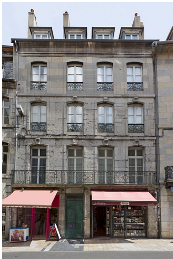
Logis principal : vue d'ensemble de la façade sur rue, de face.

25, Besançon Grande Rue 79, lieudit : îlot Saint-Pierre