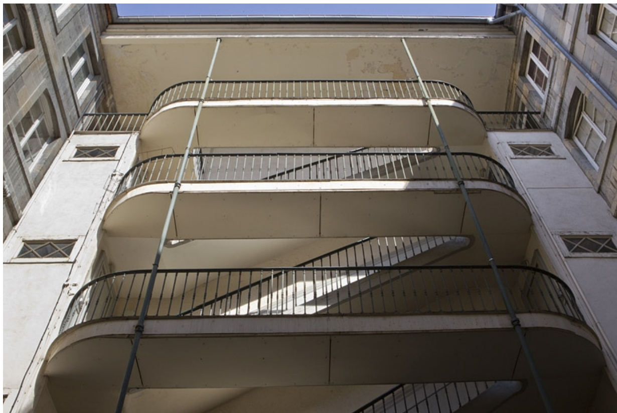
Escalier à cage ouverte de la première cour : vue d'ensemble.

25, Besançon Grande Rue 79, lieudit : îlot Saint-Pierre