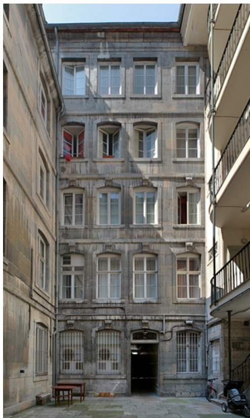
Première cour : façade postérieure du logis principal, de face.

25, Besançon Grande Rue 79, lieudit : îlot Saint-Pierre