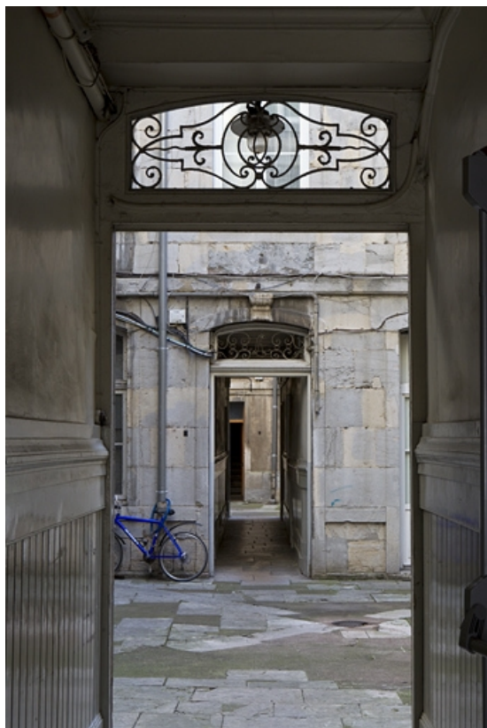
Vue du couloir traversant le premier logis secondaire depuis le couloir du logis principal.

25, Besançon Grande Rue 79, lieudit : îlot Saint-Pierre