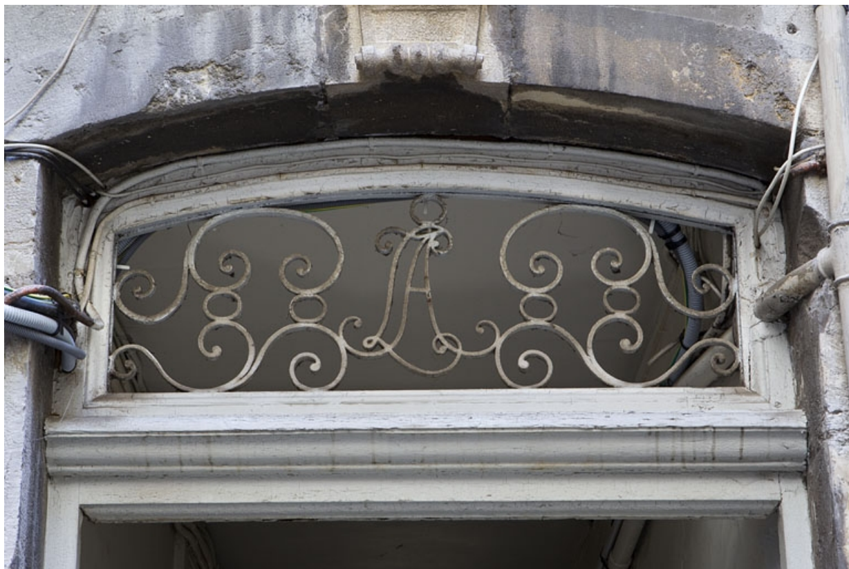
Couloir traversant le premier logis secondaire : détail du décor en ferronnerie du dessus de porte. 25, Besançon Grande Rue 79, lieudit : îlot Saint-Pierre