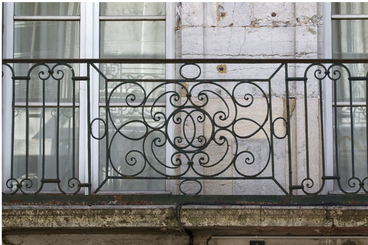
Logis principal, façade sur rue : détail de la ferronnerie du balcon.

25, Besançon Grande Rue 79, lieudit : îlot Saint-Pierre