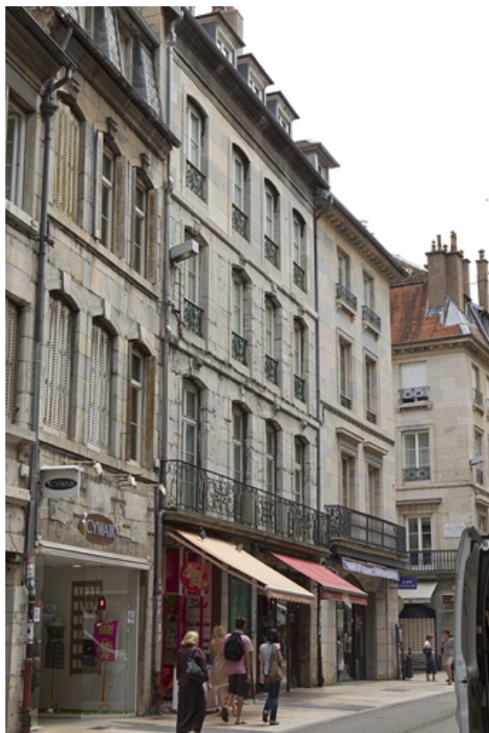
Logis principal, façade sur rue : vue d'ensemble, de trois quarts gauche. 25, Besançon Grande Rue 79, lieudit : îlot Saint-Pierre