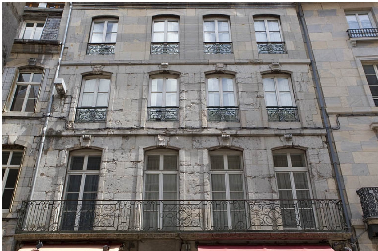
Logis principal, façade sur rue : détail des trois étages carrés, de face. 25, Besançon Grande Rue 79, lieudit : îlot Saint-Pierre