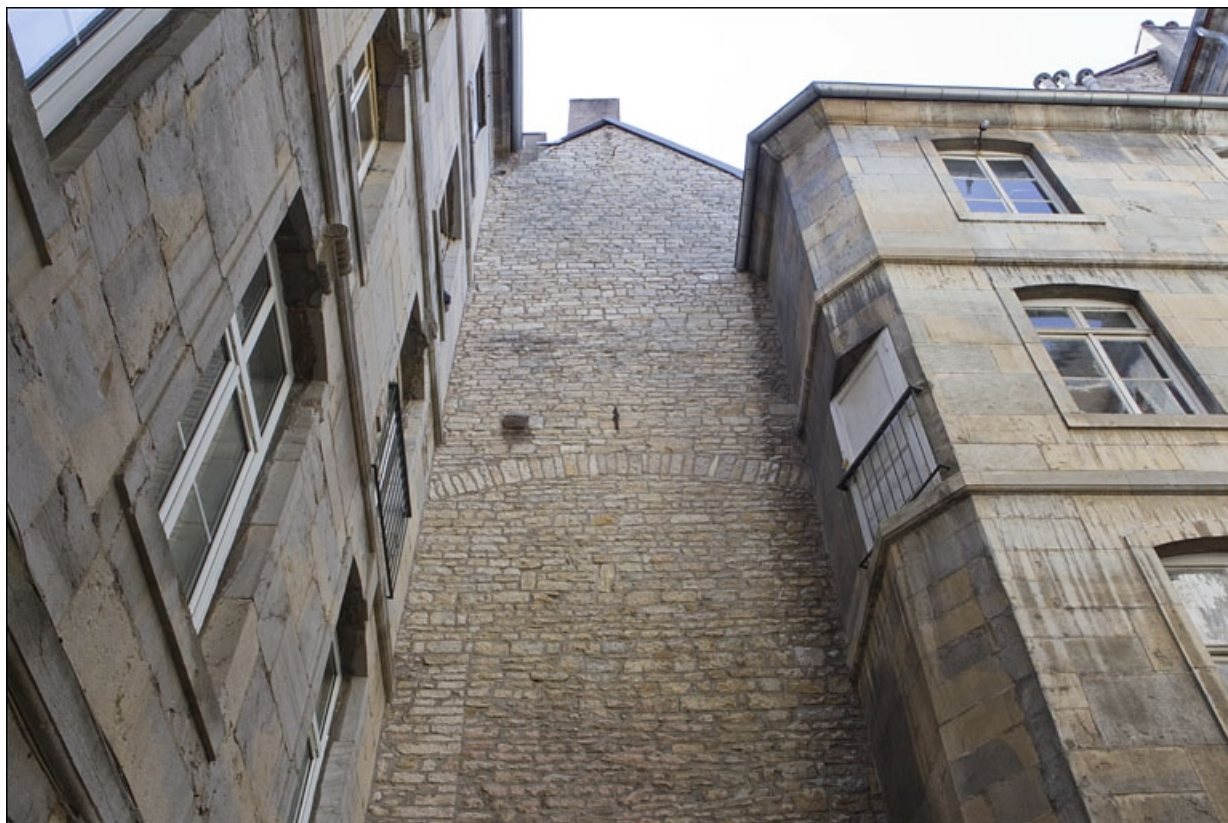
Première cour, à droite : détail du mur mitoyen de la maison voisine.

25, Besançon Grande Rue 79, lieudit : îlot Saint-Pierre