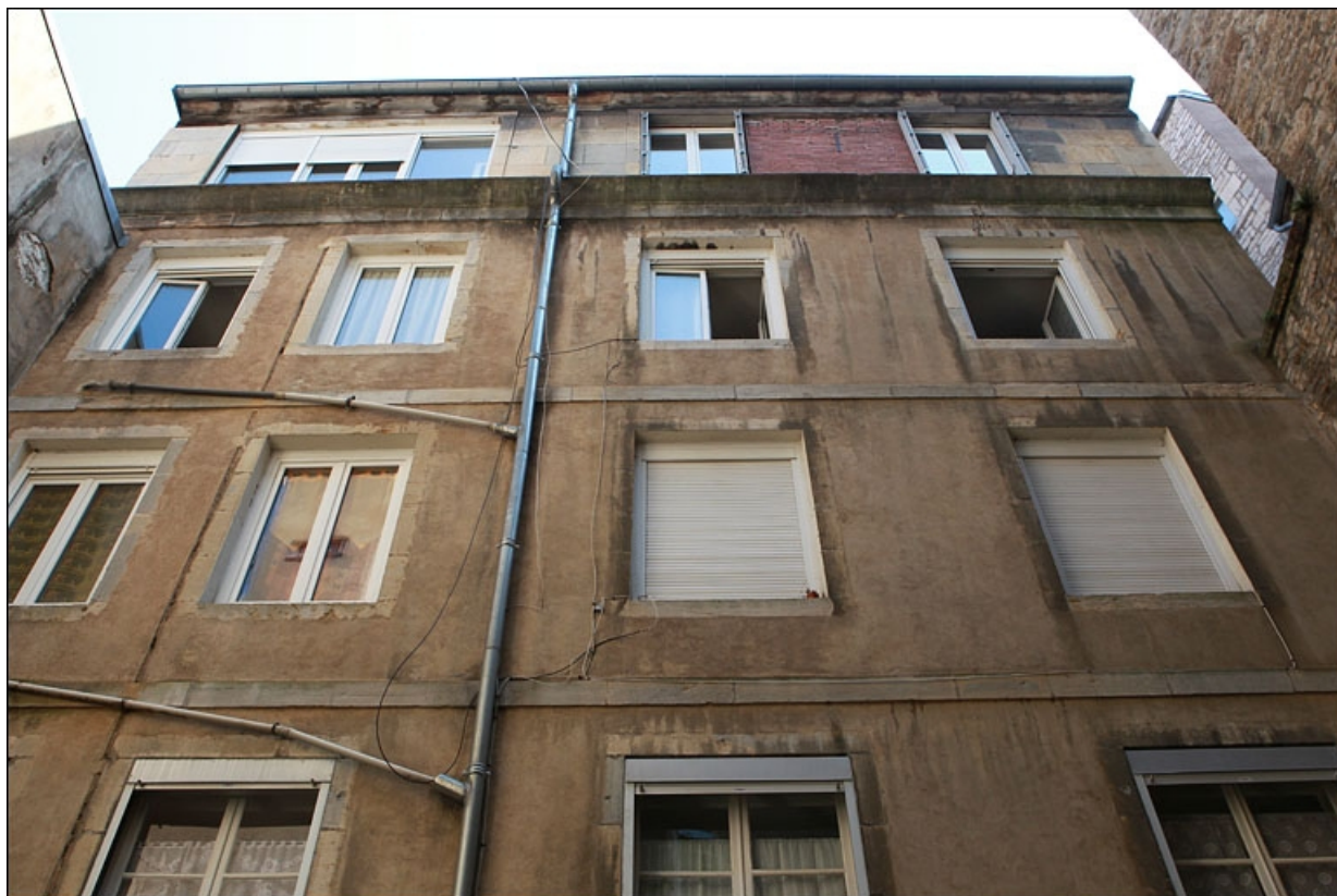
Deuxième cour : façade antérieure du deuxième logis secondaire, vue des étages. 25, Besançon Grande Rue 79, lieudit : îlot Saint-Pierre