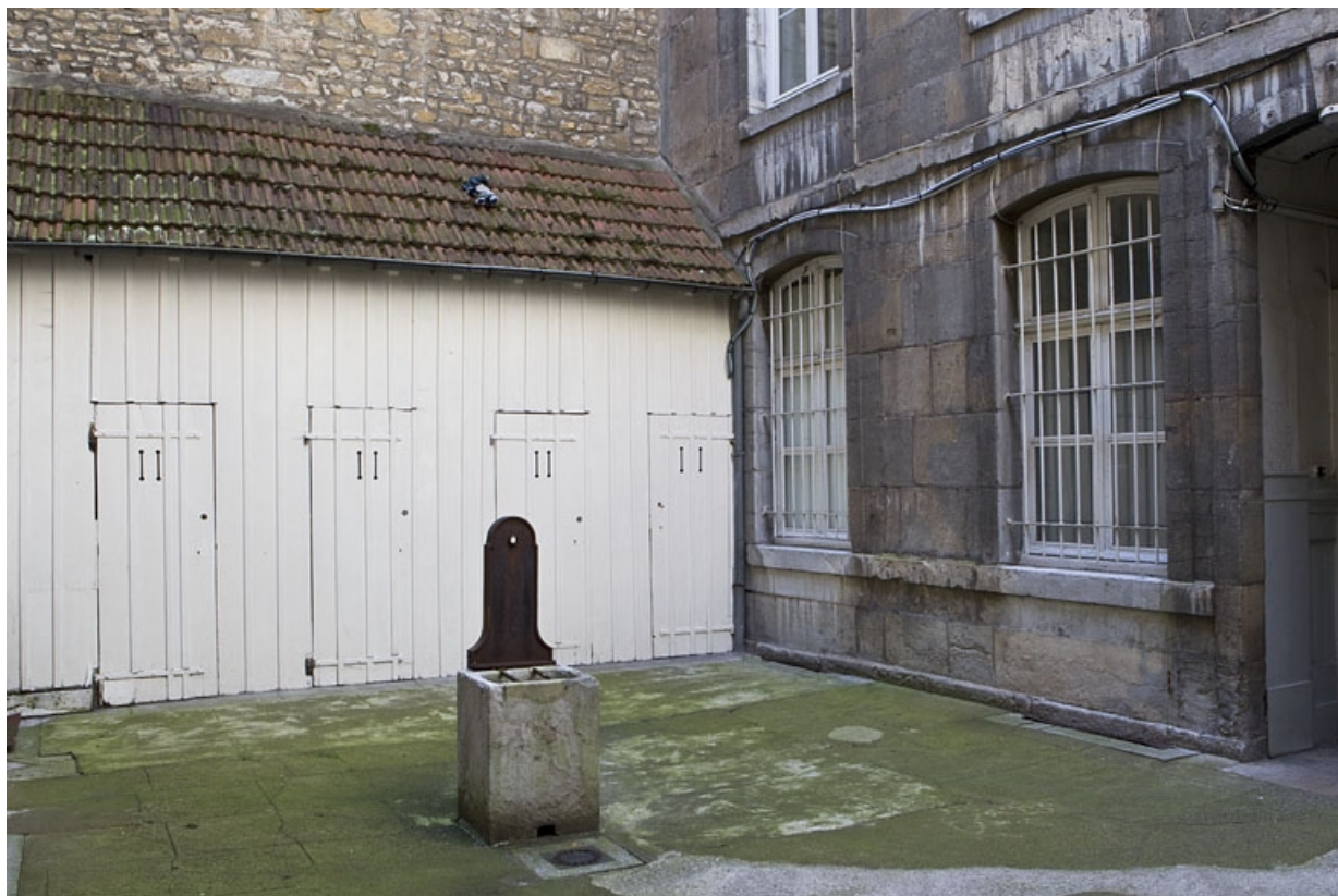
Deuxième cour : détail de la borne fontaine.

25, Besançon Grande Rue 79, lieudit : îlot Saint-Pierre