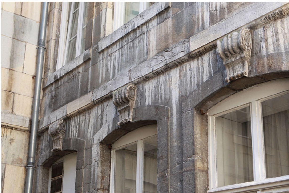
Logis principal, façade postérieure : détail des clés des fenêtres du premier étage. 25, Besançon Grande Rue 79, lieudit : îlot Saint-Pierre