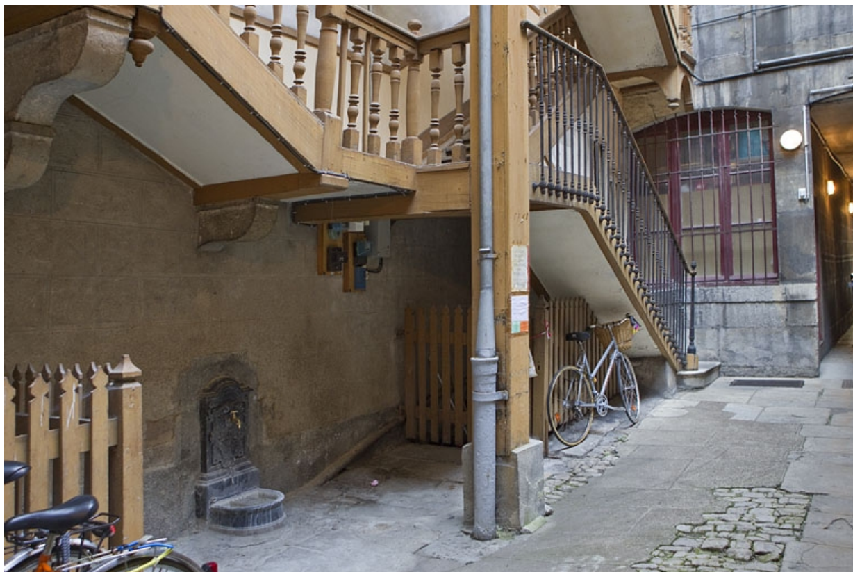
Escalier à cage ouverte de la première cour : détail du départ de l'escalier, de trois quarts gauche. 25, Besançon Grande Rue 77, lieudit : îlot Saint-Pierre