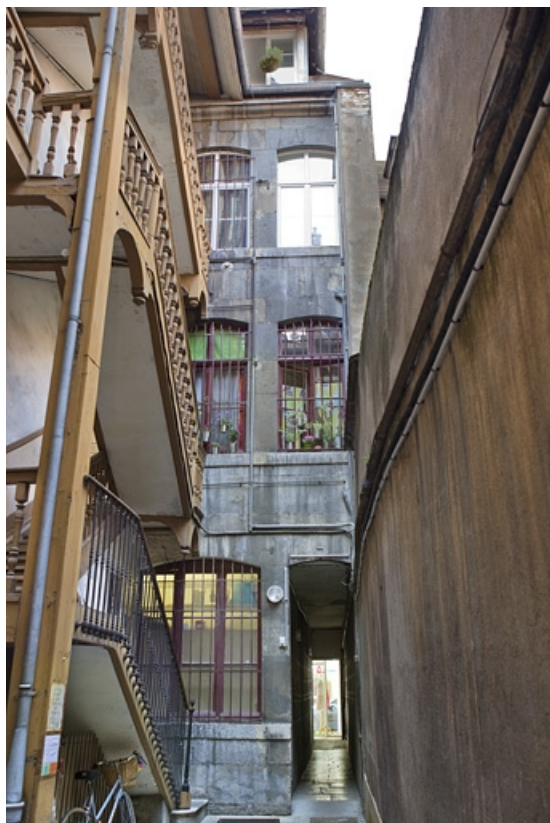
Logis principal sur rue : vue de la façade postérieure.

25, Besançon Grande Rue 77, lieudit : îlot Saint-Pierre