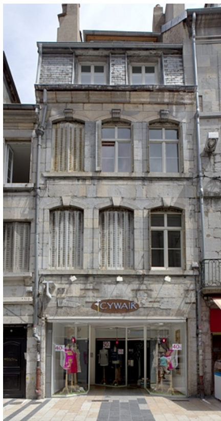
Logis principal, façade sur rue : de face.

25, Besançon Grande Rue 77, lieudit : îlot Saint-Pierre