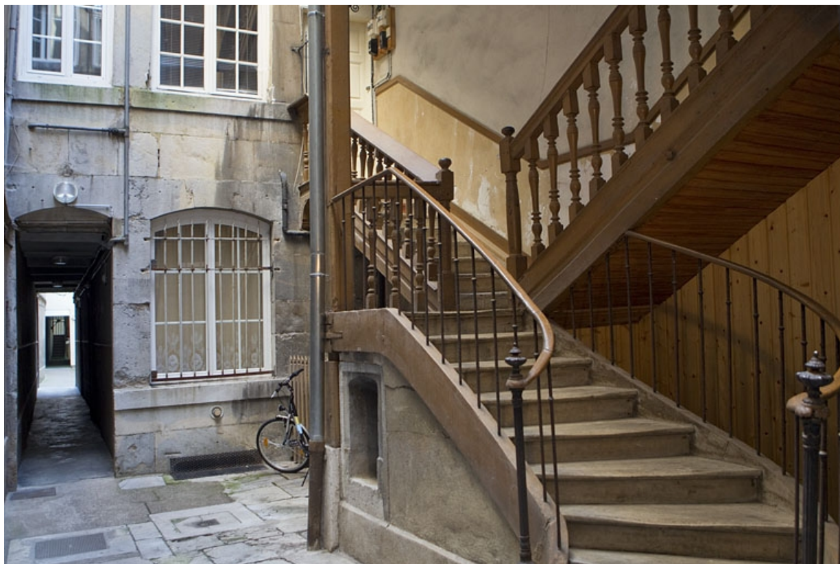
Escalier à cage ouverte de la deuxième cour : détail de la première volée.

25, Besançon Grande Rue 77, lieudit : îlot Saint-Pierre