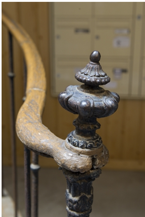
Escalier à cage ouverte de la deuxième cour : détail du décor du départ de rampe.

25, Besançon Grande Rue 77, lieudit : îlot Saint-Pierre