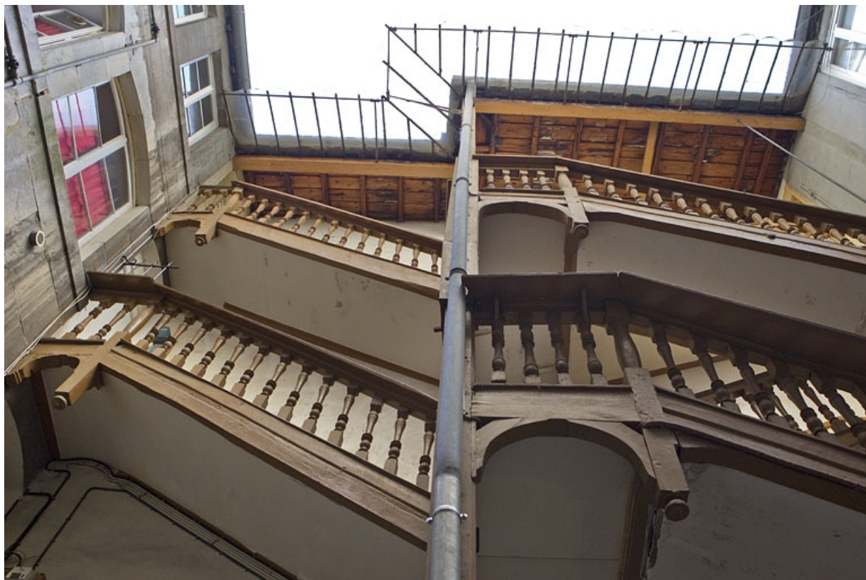
Escalier à cage ouverte de la deuxième cour : détail de la partie supérieure.

25, Besançon Grande Rue 77, lieudit : îlot Saint-Pierre