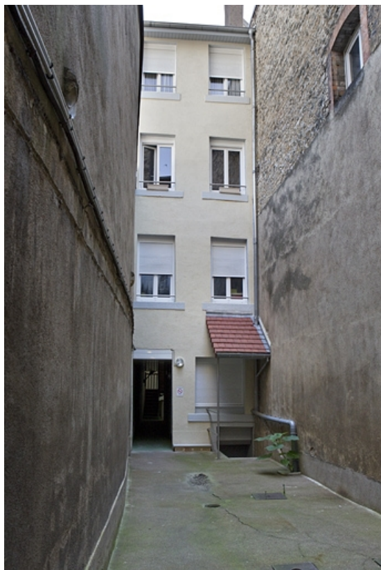
Façade antérieure du troisième logis secondaire située sur la troisième cour. 25, Besançon Grande Rue 77, lieudit : îlot Saint-Pierre