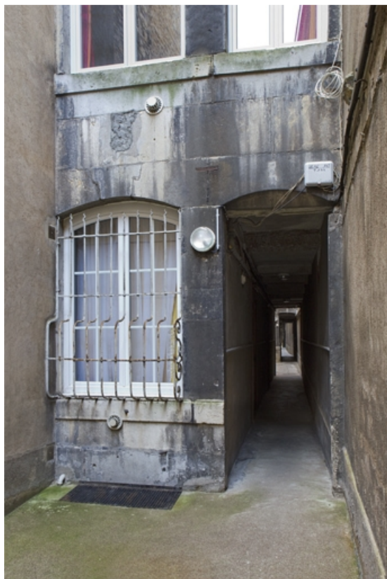
Façade postérieure du deuxième logis secondaire située sur la troisième cour : détail du rez-de-chaussée. 25, Besançon Grande Rue 77, lieudit : îlot Saint-Pierre