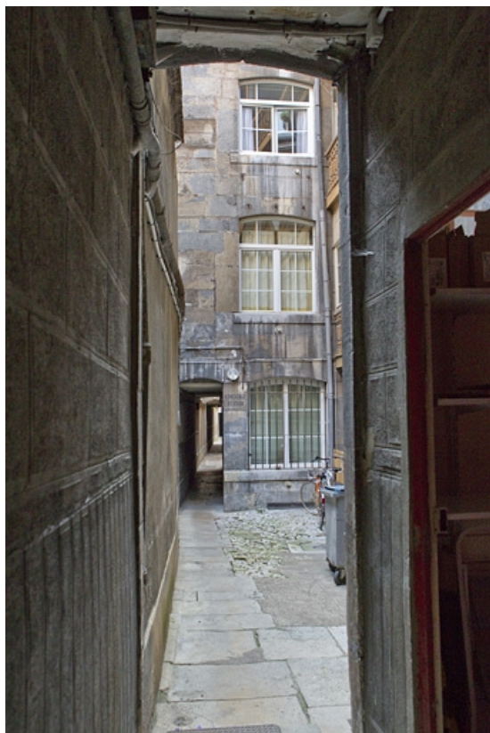
Vue de la façade antérieure du premier logis depuis le couloir d'entrée.

25, Besançon Grande Rue 77, lieudit : îlot Saint-Pierre