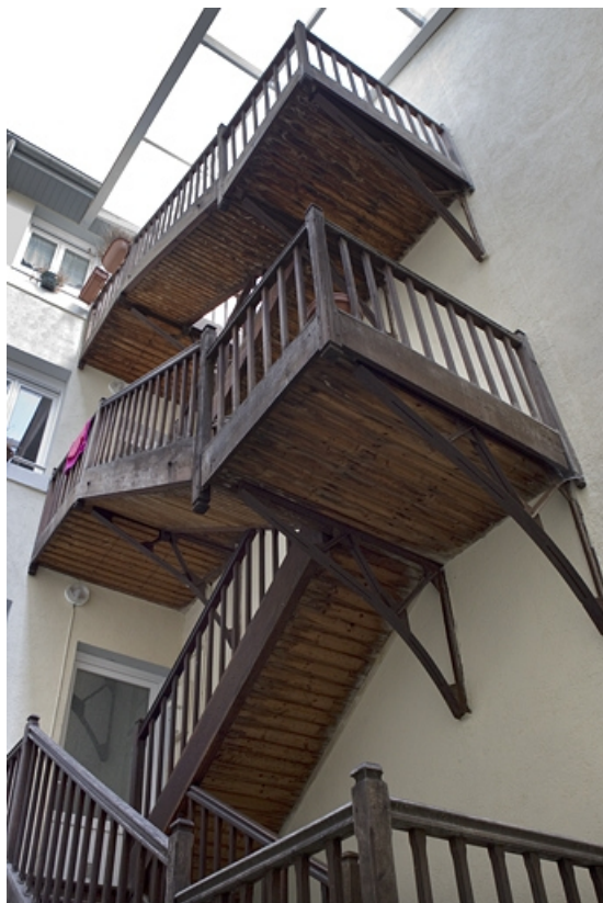
Quatrième cour : escalier extérieur du troisième logis secondaire : vue d'ensemble. 25, Besançon Grande Rue 77, lieudit : îlot Saint-Pierre