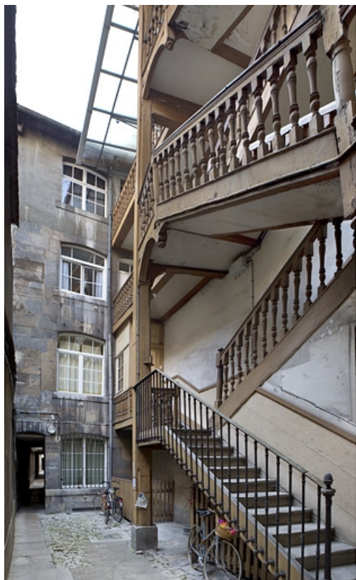
Escalier à cage ouverte de la première cour Vue d'ensemble de trois quarts droit. 25, Besançon Grande Rue 77, lieudit : îlot Saint-Pierre