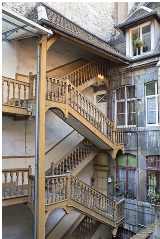
Escalier à cage ouverte de la première cour : vue d'ensemble.

25, Besançon Grande Rue 77, lieudit : îlot Saint-Pierre