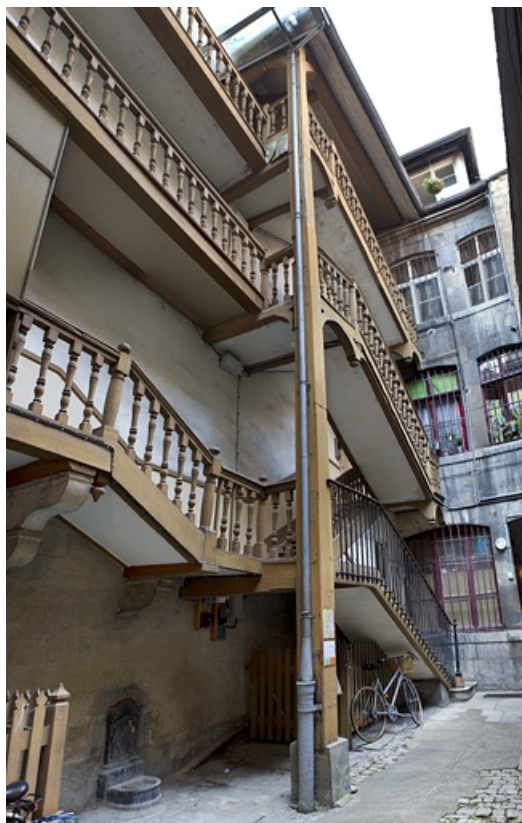
Escalier à cage ouverte de la première cour Vue d'ensemble de trois quarts gauche. 25, Besançon Grande Rue 77, lieudit : îlot Saint-Pierre