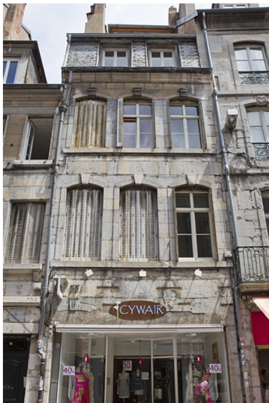
Logis principal, façade sur rue : de face.

25, Besançon Grande Rue 77, lieudit : îlot Saint-Pierre