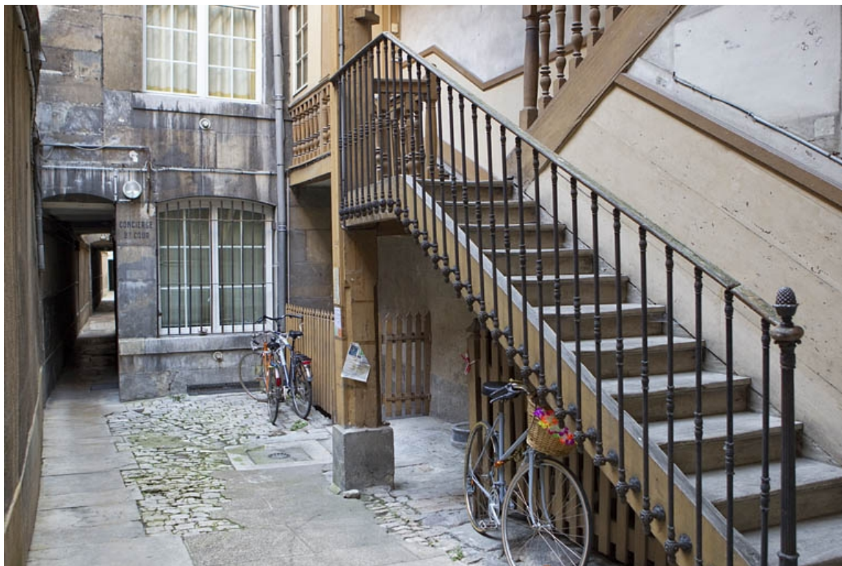
Escalier à cage ouverte de la première cour : vue de la première volée, de trois quarts droit. 25, Besançon Grande Rue 77, lieudit : îlot Saint-Pierre