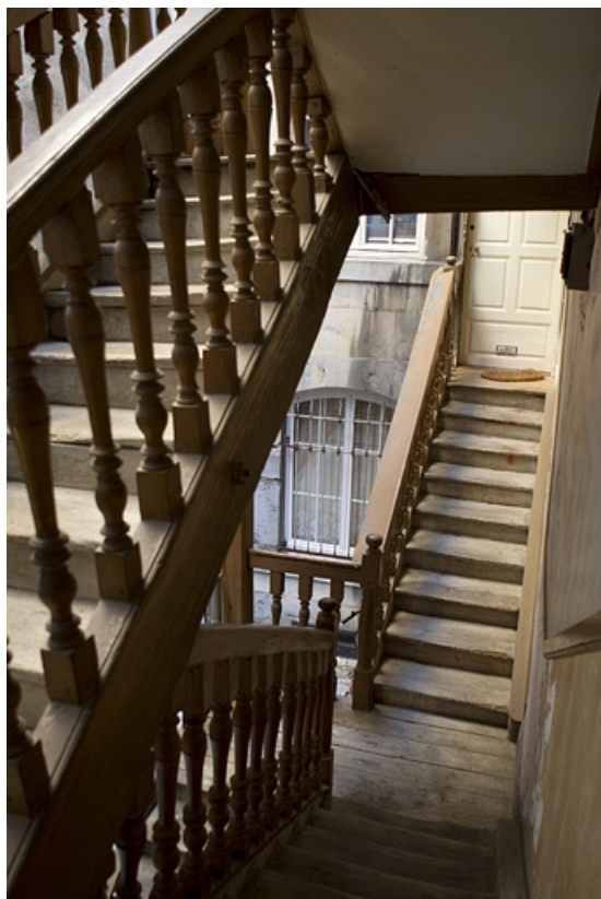
Escalier à cage ouverte de la deuxième cour : détail de l'intérieur de l'escalier. 25, Besançon Grande Rue 77, lieudit : îlot Saint-Pierre