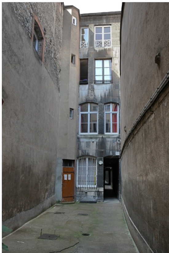
Façade postérieure du deuxième logis secondaire située sur la troisième cour : vue d'ensemble. 25, Besançon Grande Rue 77, lieudit : îlot Saint-Pierre