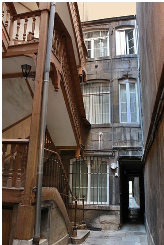
Vue d'ensemble de la façade postérieure du premier logis secondaire sur la deuxième cour. 25, Besançon Grande Rue 77, lieudit : îlot Saint-Pierre