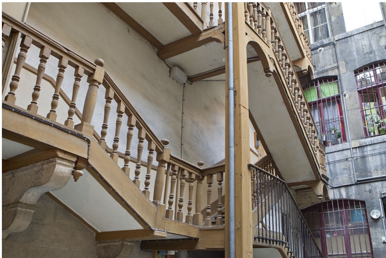
Escalier à cage ouverte de la première cour : détail de la rampe à balustres de bois.

25, Besançon Grande Rue 77, lieudit : îlot Saint-Pierre