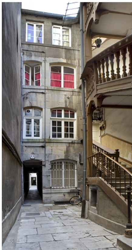
Façade antérieure du deuxième logis secondaire située sur la deuxième cour. 25, Besançon Grande Rue 77, lieudit : îlot Saint-Pierre