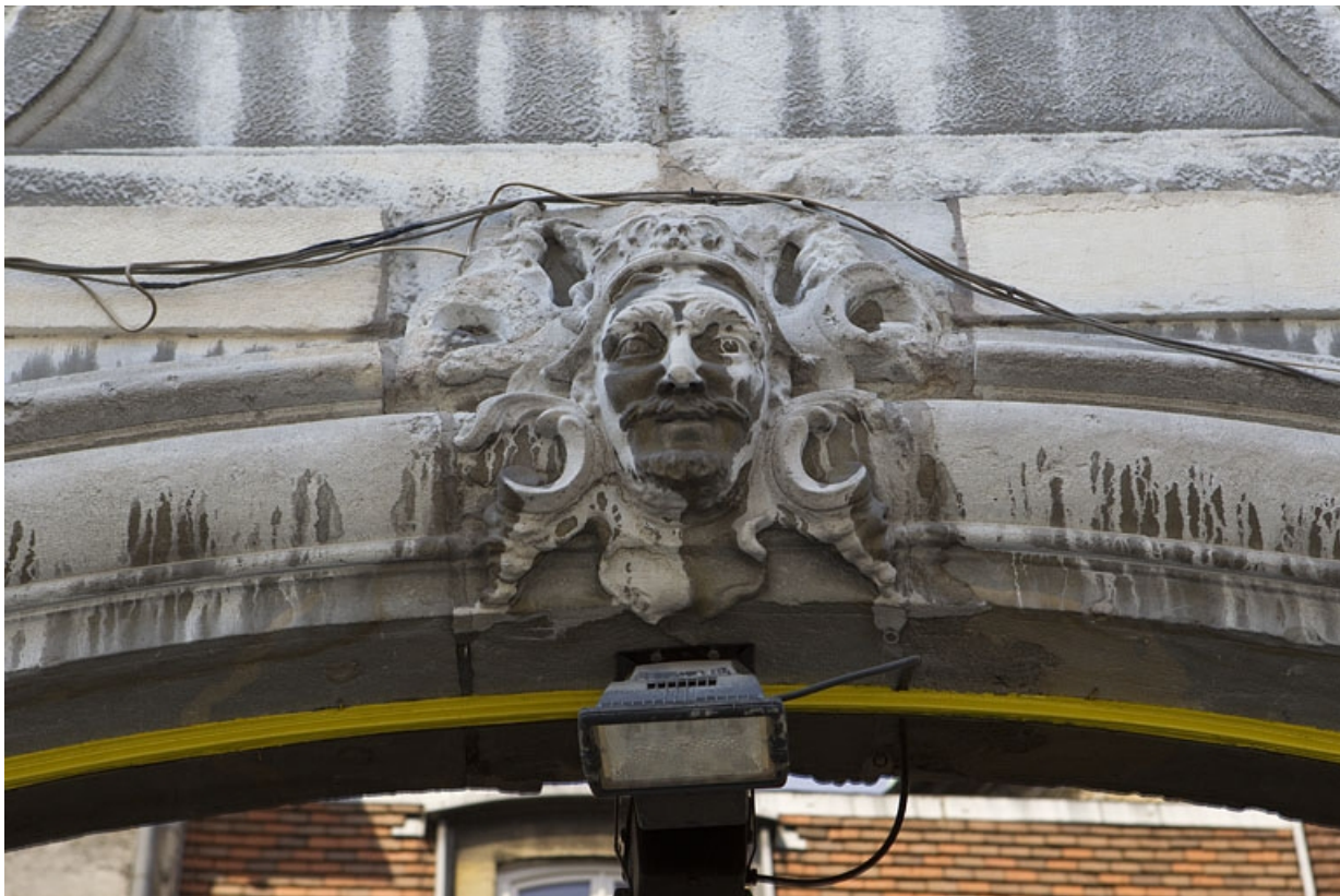
Portail d'entrée : détail du décor de la clé de l'arc.

25, Besançon, 50 rue des Granges, lieudit : îlot Saint-Pierre