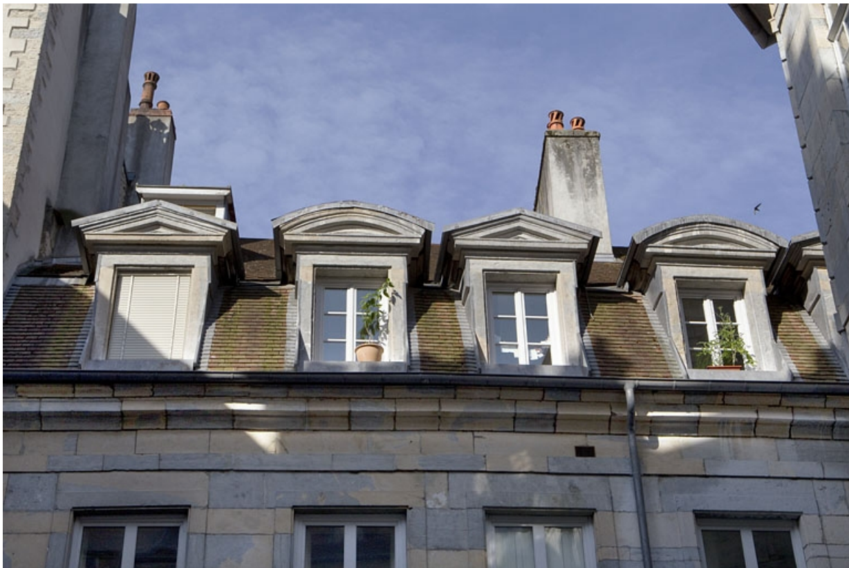
Premier logis secondaire : détail des lucarnes sur la première cour.

25, Besançon, 50 rue des Granges, lieudit : îlot Saint-Pierre