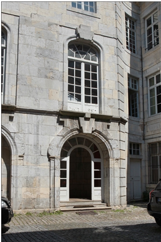
Logis principal, aile de l'escalier : détail de la porte d'entrée.

25, Besançon, 50 rue des Granges, lieudit : îlot Saint-Pierre