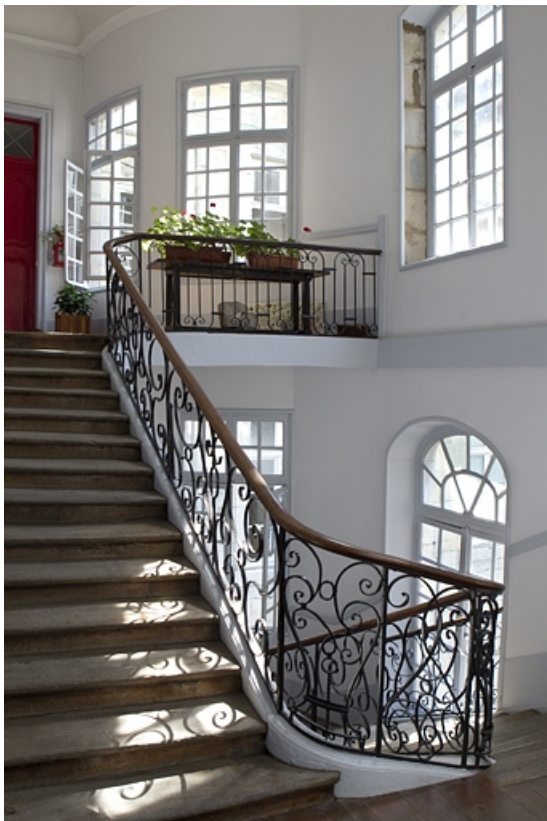
Escalier : détail de la rampe en fer forgé.

25, Besançon, 50 rue des Granges, lieudit : îlot Saint-Pierre