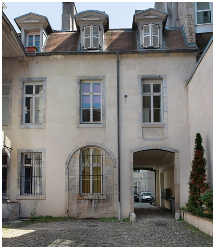
Vue d'ensemble de la façade postérieure du premier logis secondaire. 25, Besançon, 50 rue des Granges, lieudit : îlot Saint-Pierre