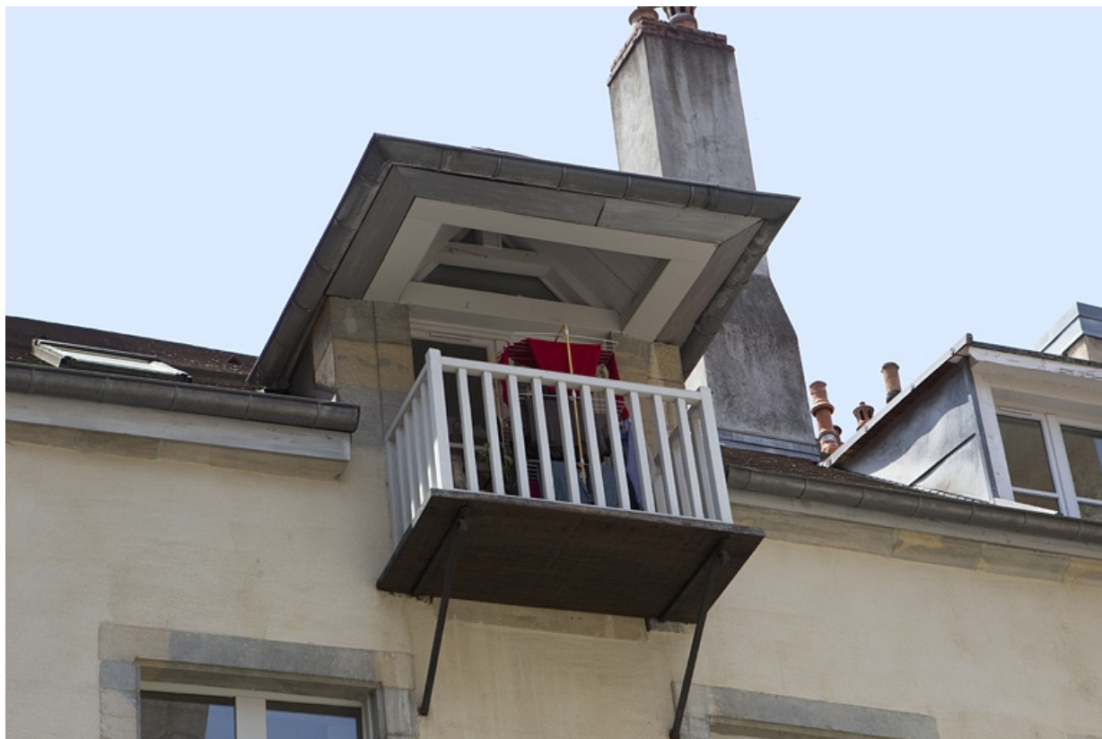
Logis secondaire au fond de la deuxième cour : détail de l'ancienne lucarne du grenier.

25, Besançon, 50 rue des Granges, lieudit : îlot Saint-Pierre