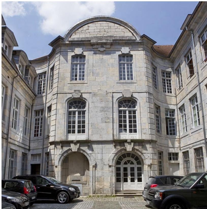
Logis principal : vue d'ensemble de l'aile de l'escalier.

25, Besançon, 50 rue des Granges, lieudit : îlot Saint-Pierre