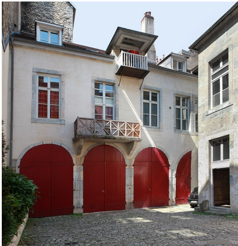
Vue d'ensemble du logis secondaire au fond de la deuxième cour, avec remises au rez-de-chaussée. 25, Besançon, 50 rue des Granges, lieudit : îlot Saint-Pierre