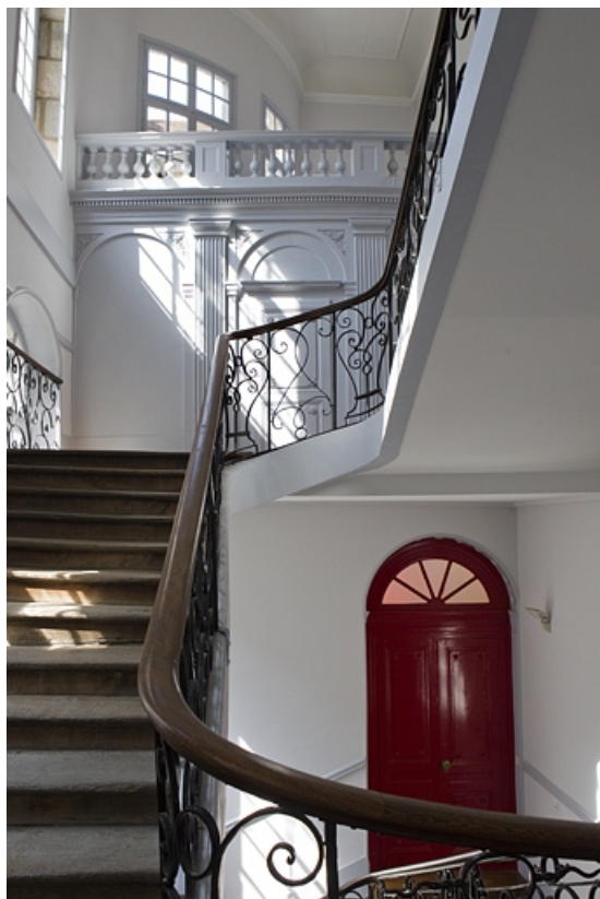
Escalier : détail des volées supérieures.

25, Besançon, 50 rue des Granges, lieudit : îlot Saint-Pierre