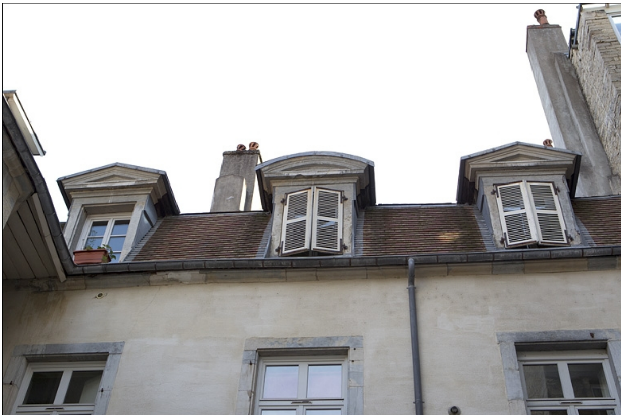
Premier logis secondaire : détail des lucarnes donnant sur la deuxième cour.

25, Besançon, 50 rue des Granges, lieudit : îlot Saint-Pierre