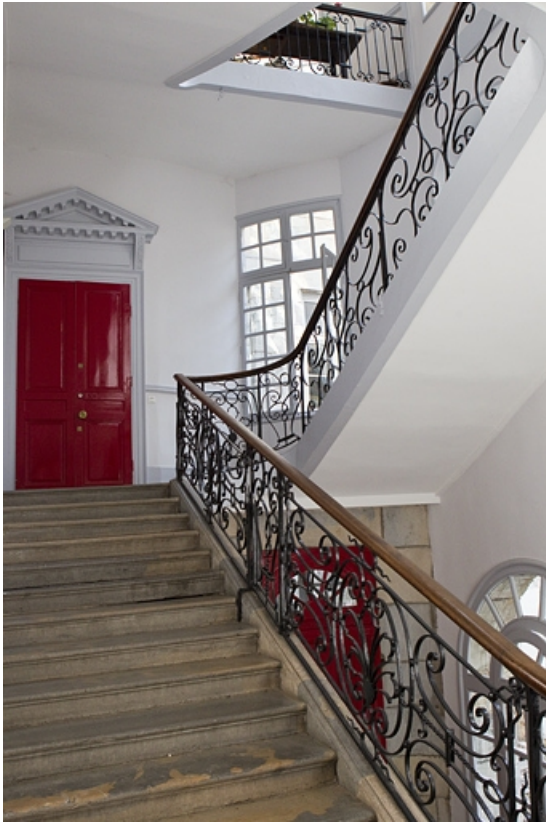
Escalier : détail de la volée desservant le premier étage.

25, Besançon, 50 rue des Granges, lieudit : îlot Saint-Pierre