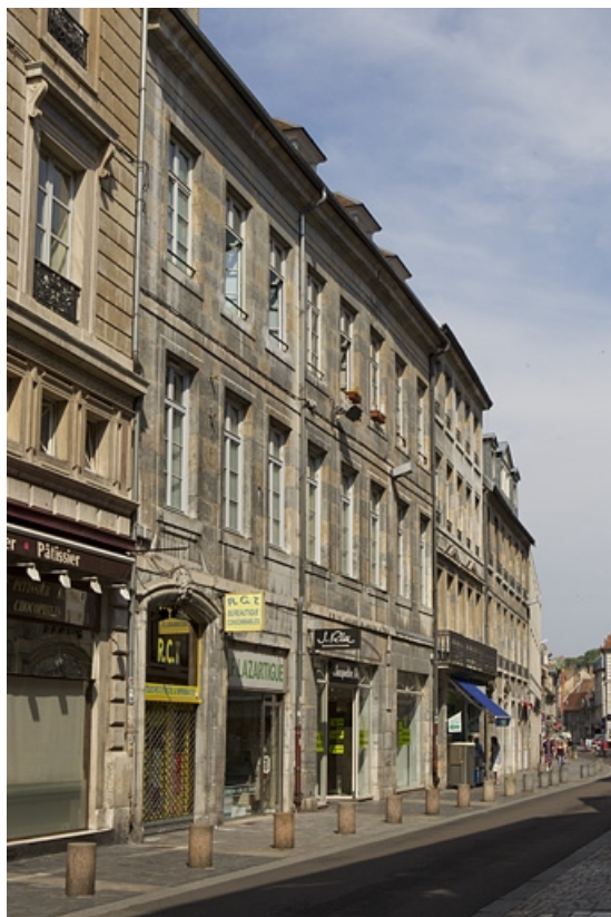
Vue d'ensemble depuis la rue, de trois quarts gauche.

25, Besançon, 50 rue des Granges, lieudit : îlot Saint-Pierre