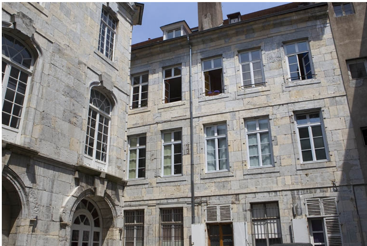
Logis principal : vue d'ensemble de la façade postérieure.

25, Besançon, 50 rue des Granges, lieudit : îlot Saint-Pierre