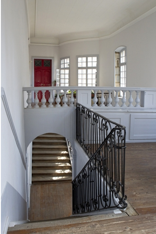
Détail de l'escalier secondaire depuis le palier.

25, Besançon, 50 rue des Granges, lieudit : îlot Saint-Pierre