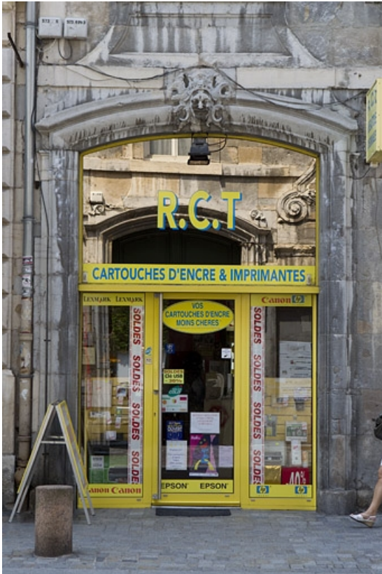
Vue d'ensemble du portail d'entrée.

25, Besançon, 50 rue des Granges, lieudit : îlot Saint-Pierre