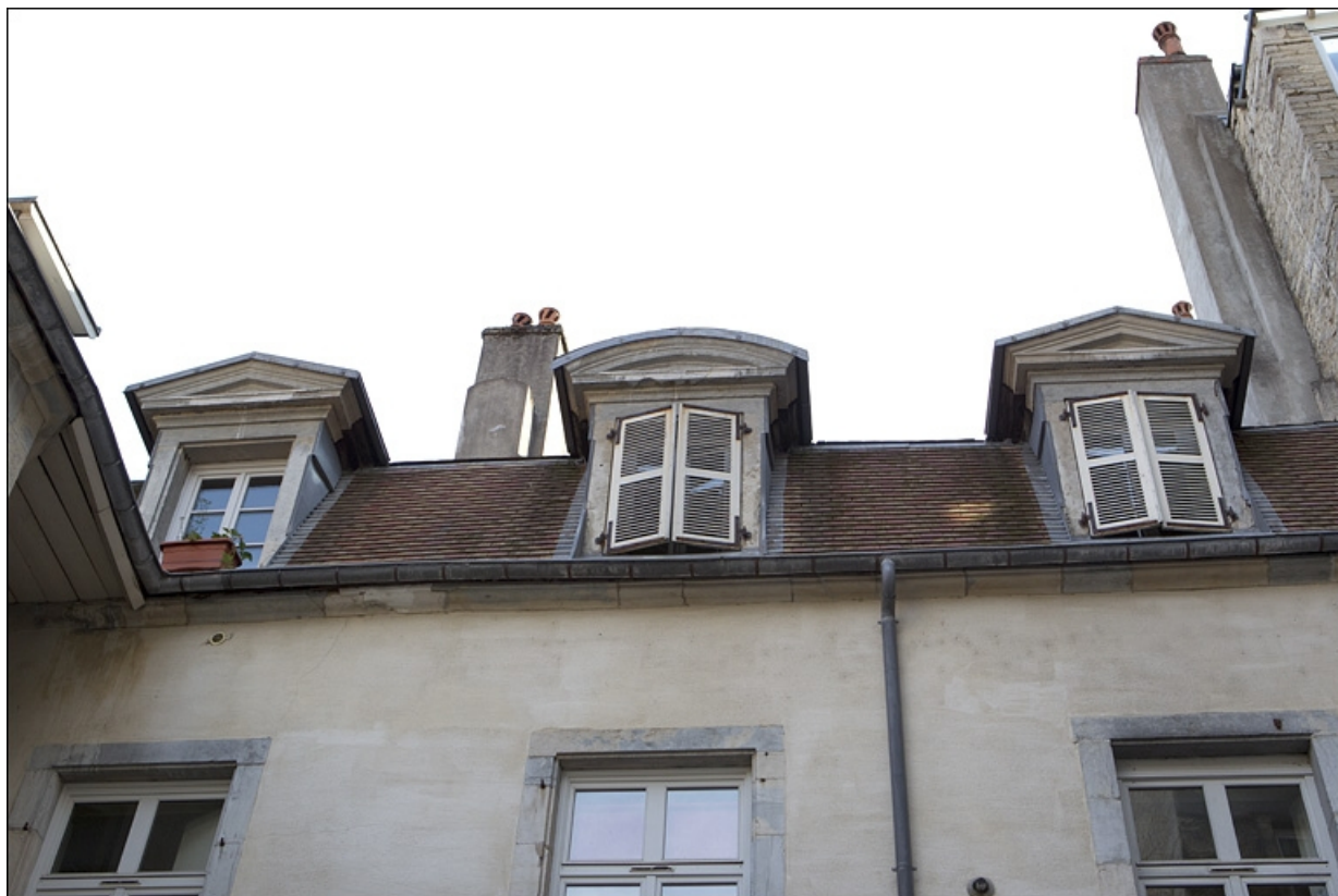
Premier logis secondaire : détail des lucarnes donnant sur la deuxième cour.

25, Besançon, 50 rue des Granges, lieudit : îlot Saint-Pierre