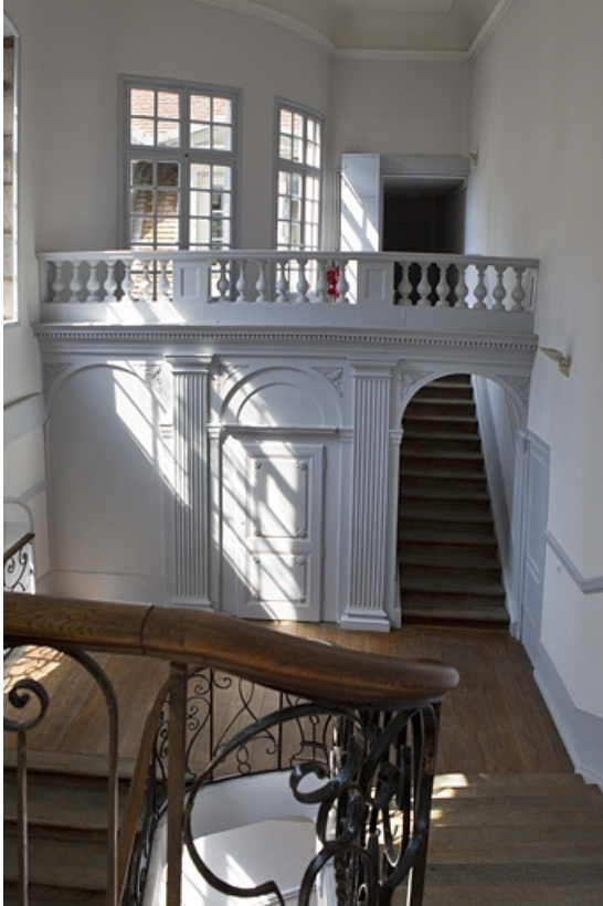
Escalier : détail de la cloison masquant l'escalier secondaire.

25, Besançon, 50 rue des Granges, lieudit : îlot Saint-Pierre