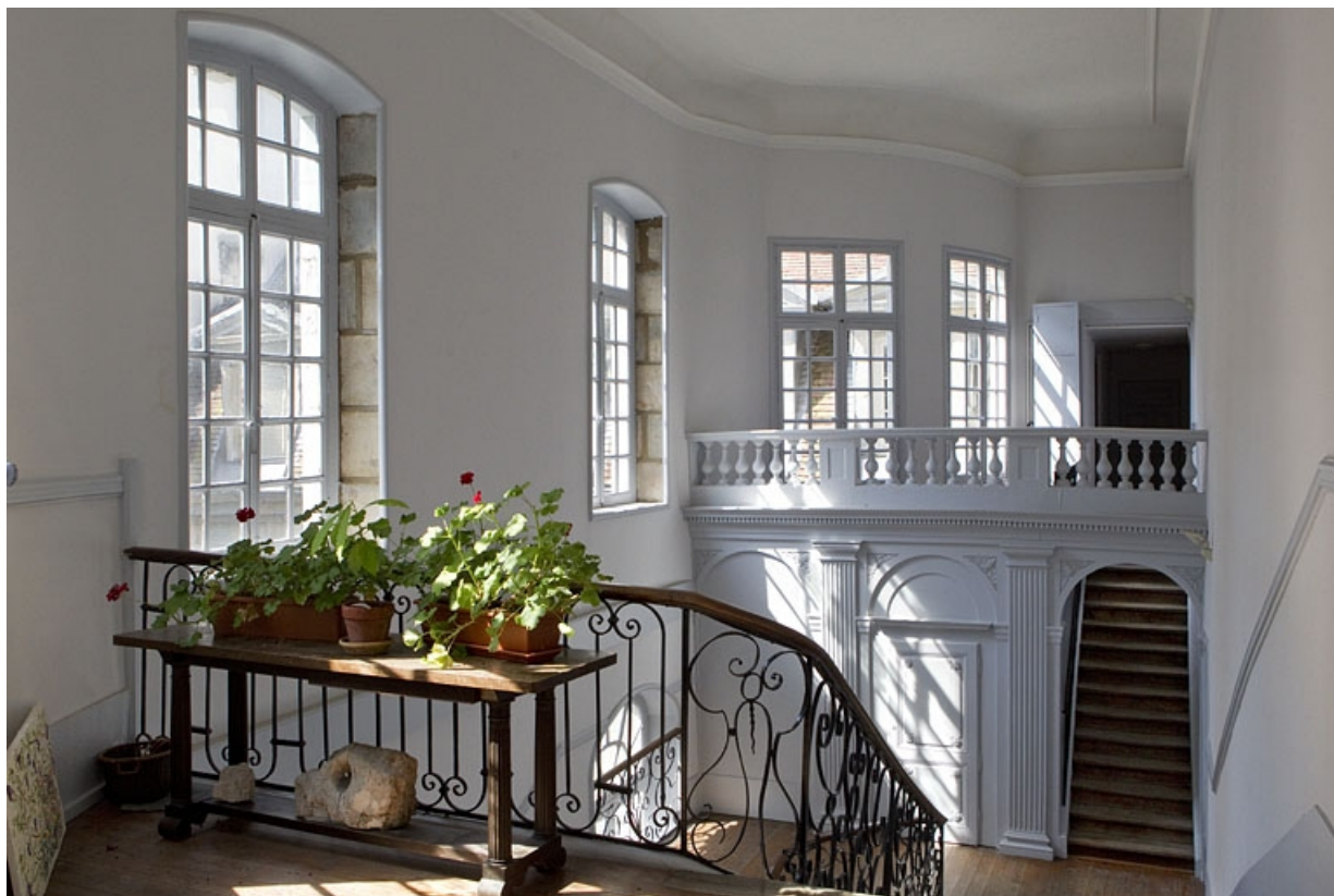
Vue d'ensemble de l'escalier secondaire depuis le premier palier de l'escalier d'honneur.

25, Besançon, 50 rue des Granges, lieudit : îlot Saint-Pierre