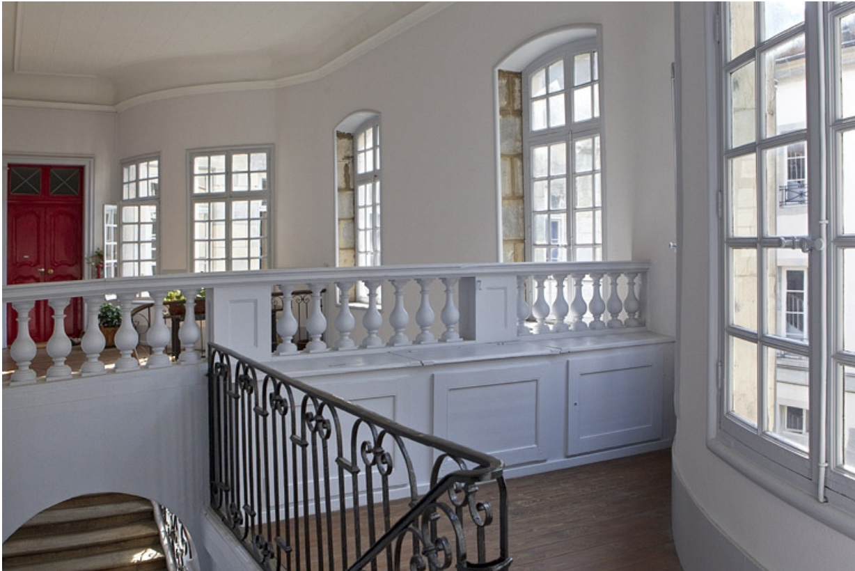
Détail du palier de l'escalier secondaire donnant sur l'escalier d'honneur.

25, Besançon, 50 rue des Granges, lieudit : îlot Saint-Pierre