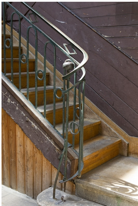
Détail du départ de rampe de l'escalier à cage ouverte. 25, Besançon, 40 rue des Granges, lieudit : îlot Saint-Pierre