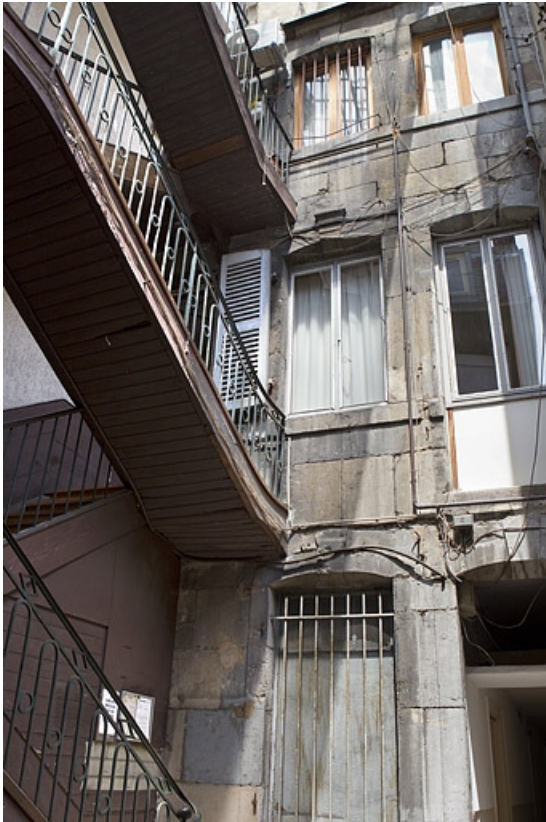
Détail de la façade postérieure du logis principal.

25, Besançon, 40 rue des Granges, lieudit : îlot Saint-Pierre