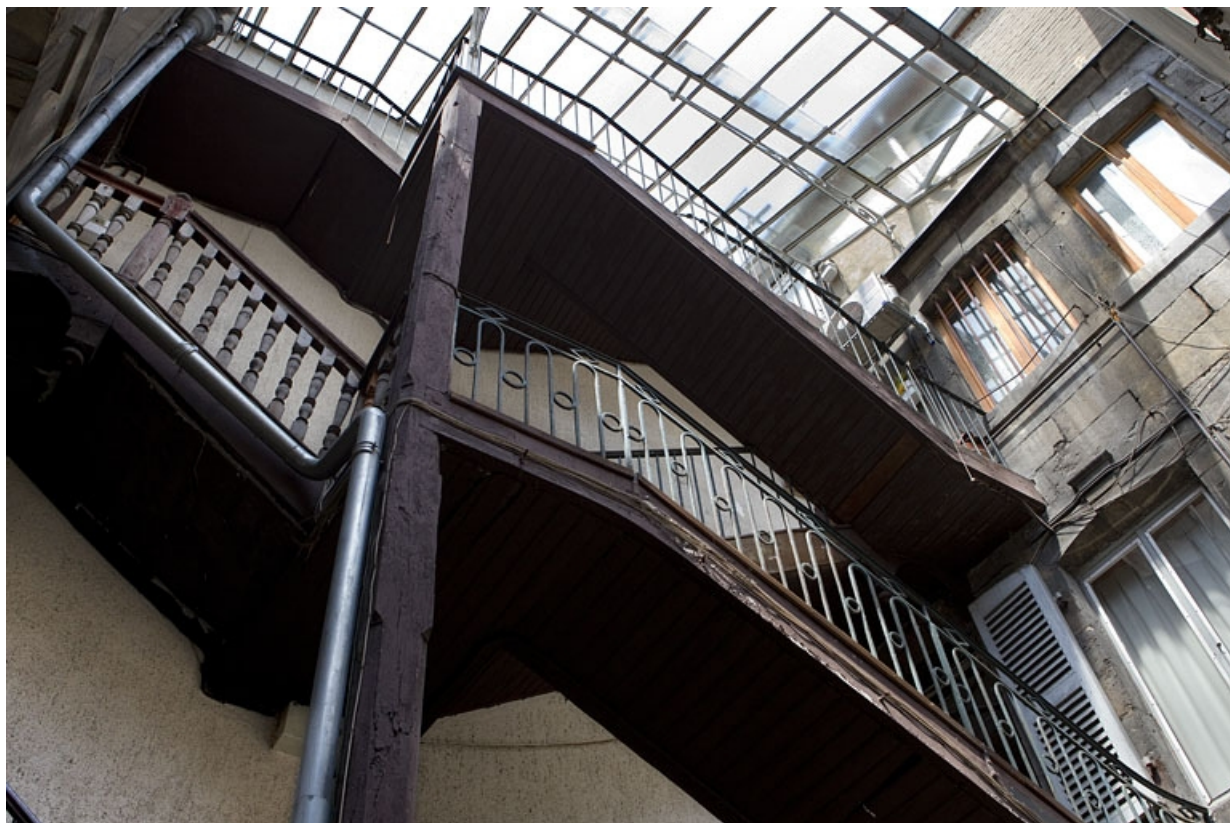
Détail de l'escalier à cage ouverte sur cour.

25, Besançon, 40 rue des Granges, lieudit : îlot Saint-Pierre