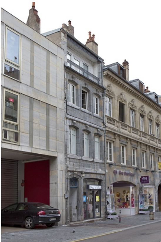
Vue d'ensemble depuis la rue de trois quarts gauche.

25, Besançon, 40 rue des Granges, lieudit : îlot Saint-Pierre