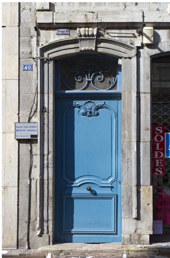
Détail de la porte du couloir d'entrée.

25, Besançon, 40 rue des Granges, lieudit : îlot Saint-Pierre