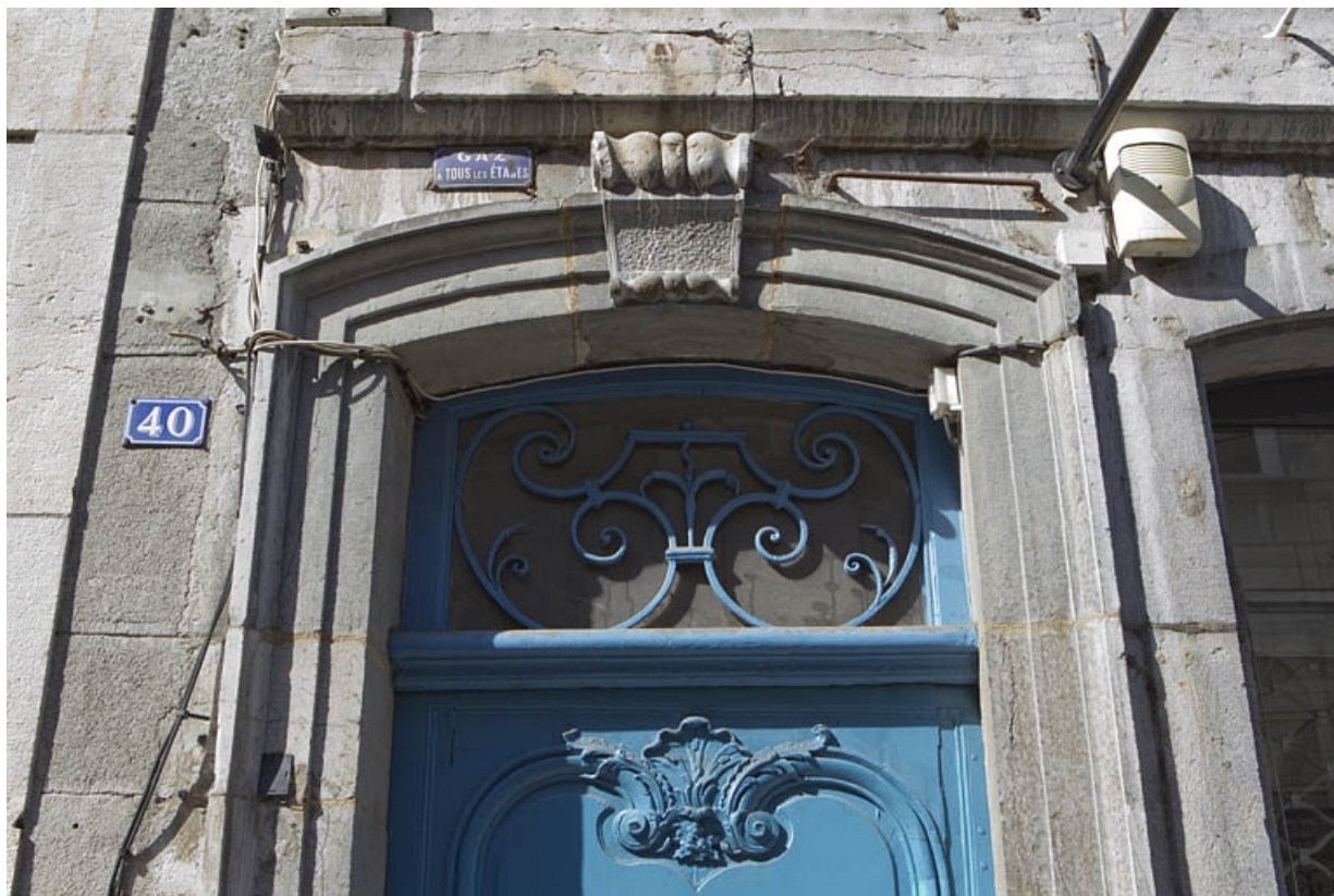
Porte d'entrée du couloir d'accès : détail de la ferronnerie du dessus de porte. 25, Besançon, 40 rue des Granges, lieudit : îlot Saint-Pierre