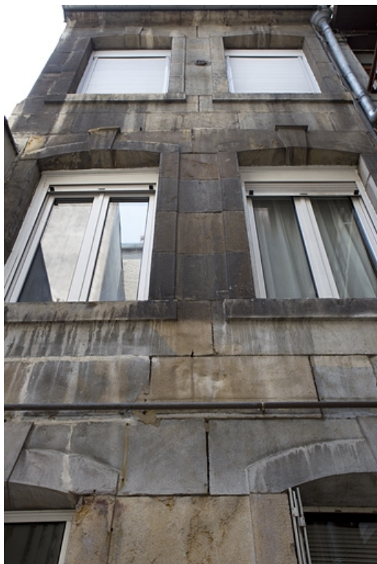
Détail de la façade antérieure du logis secondaire.

25, Besançon, 40 rue des Granges, lieudit : îlot Saint-Pierre