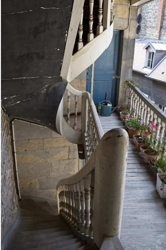
Détail de l'intérieur de l'escalier à cage ouverte gauche. 25, Besançon, 38 rue des Granges, lieudit : îlot Saint-Pierre