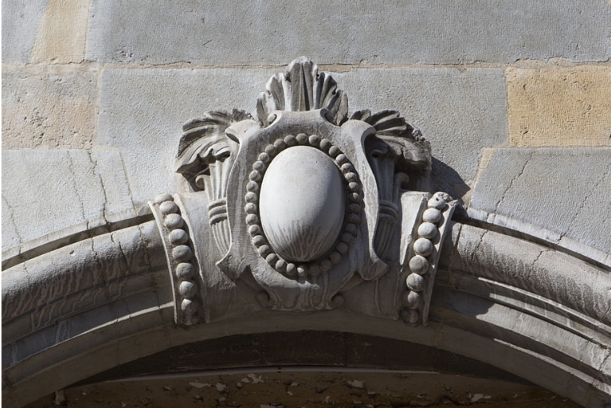
Détail de la clé ouvragée du portail d'entrée.

25, Besançon, 38 rue des Granges, lieudit : îlot Saint-Pierre