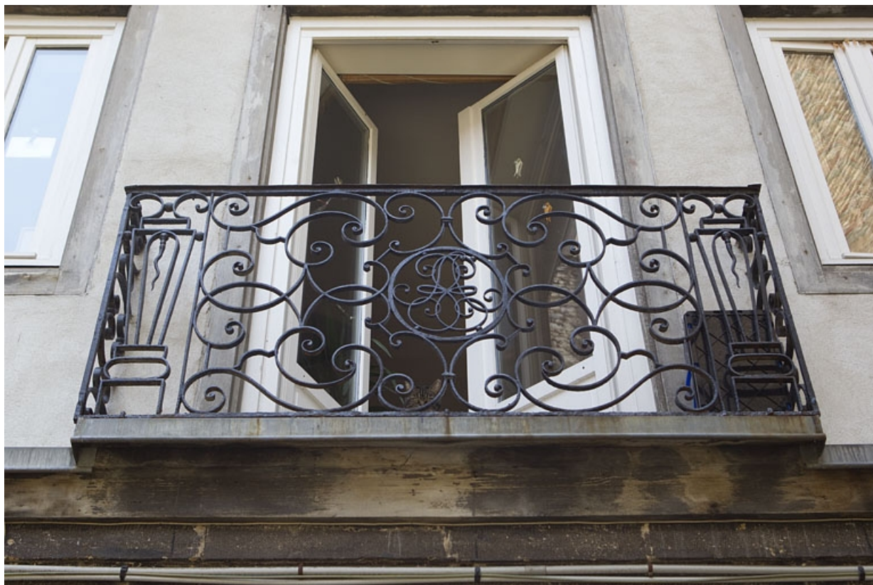
Détail de la ferronnerie d'un balcon dans l'aile en fond de cour.

25, Besançon, 38 rue des Granges, lieudit : îlot Saint-Pierre