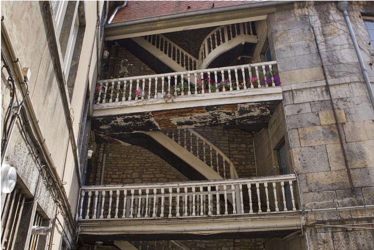
Escalier à cage ouverte à gauche de la cour, de face.

25, Besançon, 38 rue des Granges, lieudit : îlot Saint-Pierre