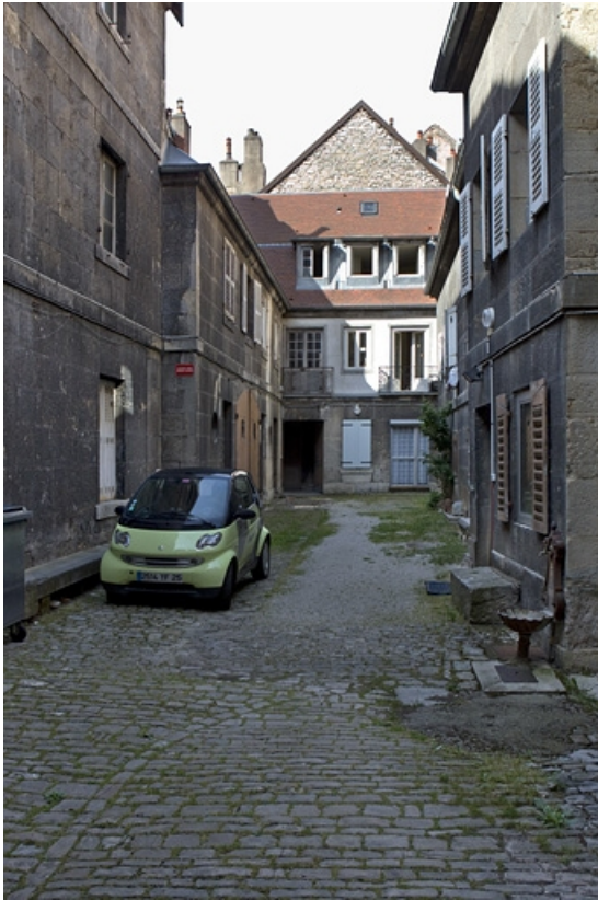
Vue d'ensemble des bâtiments depuis l'entrée de la cour.

25, Besançon, 38 rue des Granges, lieudit : îlot Saint-Pierre