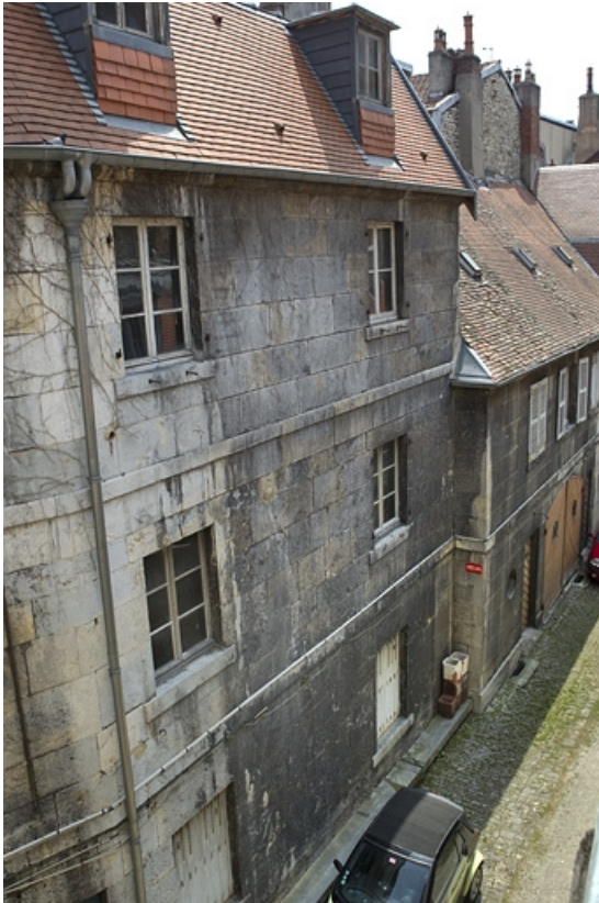
Logis secondaire à gauche de la cour, de trois quart gauche.

25, Besançon, 38 rue des Granges, lieudit : îlot Saint-Pierre