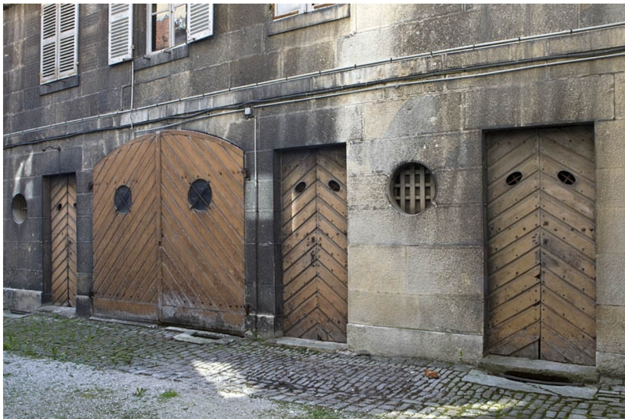
Détail des remises et écuries au rez-de-chaussée du logis secondaire gauche, de trois quarts droit. 25, Besançon, 38 rue des Granges, lieudit : îlot Saint-Pierre