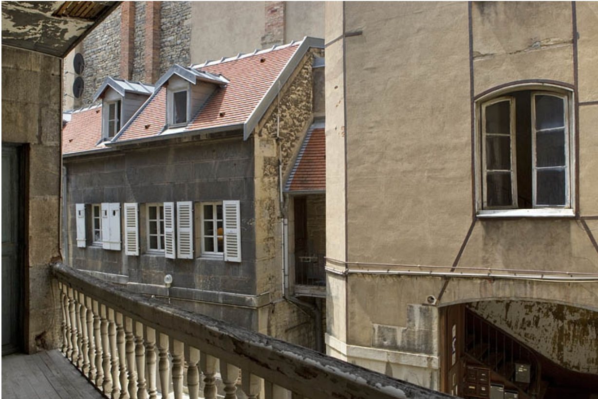
Logis secondaire à droite de la cour, depuis l'escalier à cage ouverte gauche. 25, Besançon, 38 rue des Granges, lieudit : îlot Saint-Pierre