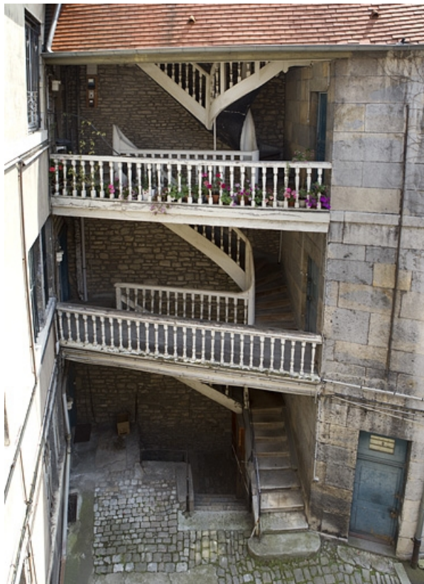
Vue d'ensemble de l'escalier à cage ouverte à gauche de la cour.

25, Besançon, 38 rue des Granges, lieudit : îlot Saint-Pierre