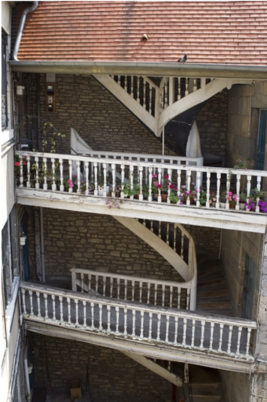
Escalier à cage ouverte à gauche de la cour, de trois quart droit.

25, Besançon, 38 rue des Granges, lieudit : îlot Saint-Pierre