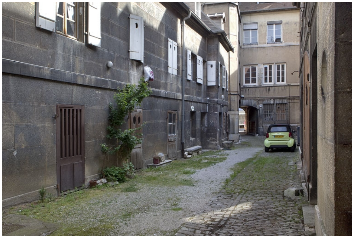
Détail de la façade antérieure du logis secondaire droit, depuis le fond de la cour.

25, Besançon, 38 rue des Granges, lieudit : îlot Saint-Pierre