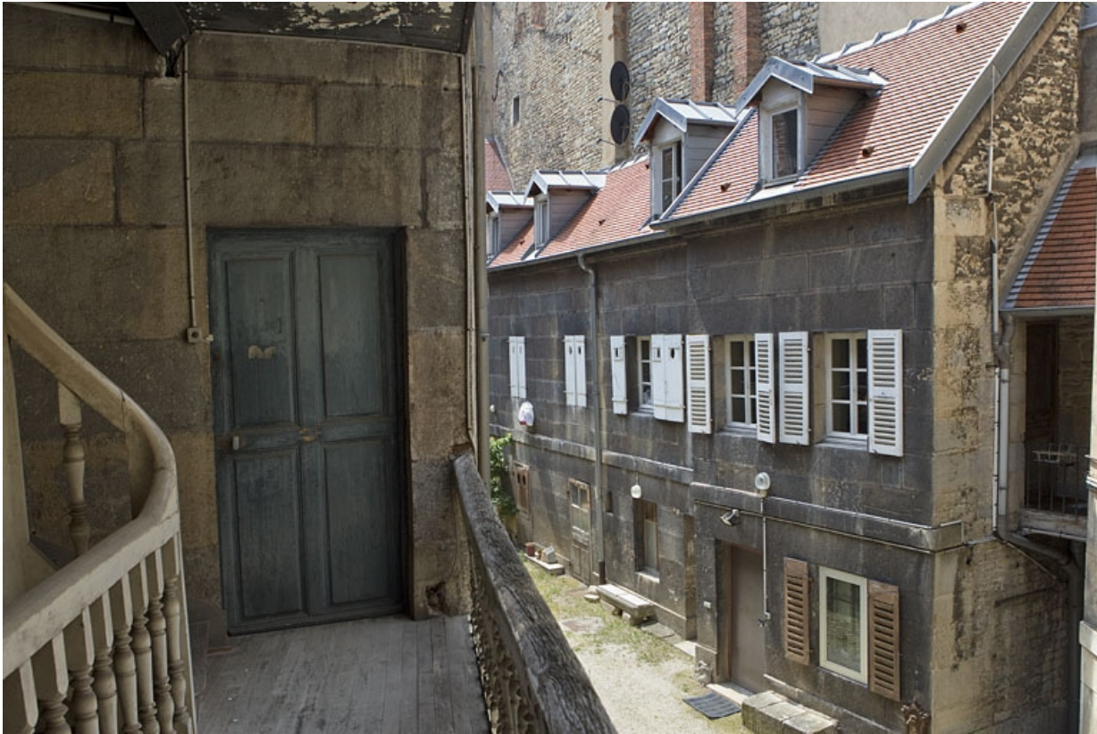
Détail de la façade du logis secondaire droit depuis l'escalier à cage ouverte gauche.

25, Besançon, 38 rue des Granges, lieudit : îlot Saint-Pierre