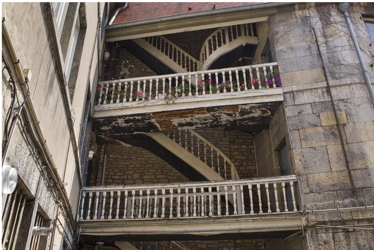
Escalier à cage ouverte à gauche de la cour, de face.

25, Besançon, 38 rue des Granges, lieudit : îlot Saint-Pierre