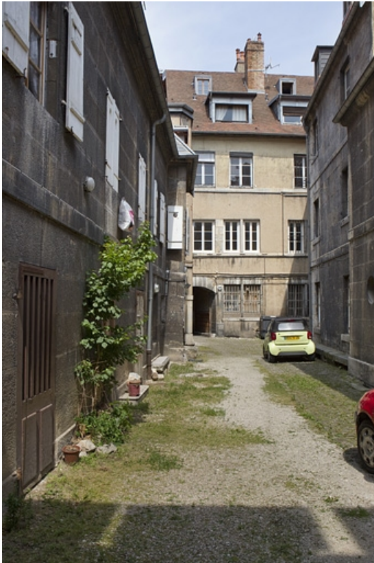
Vue d'ensemble des bâtiments depuis le fond de la cour.

25, Besançon, 38 rue des Granges, lieudit : îlot Saint-Pierre