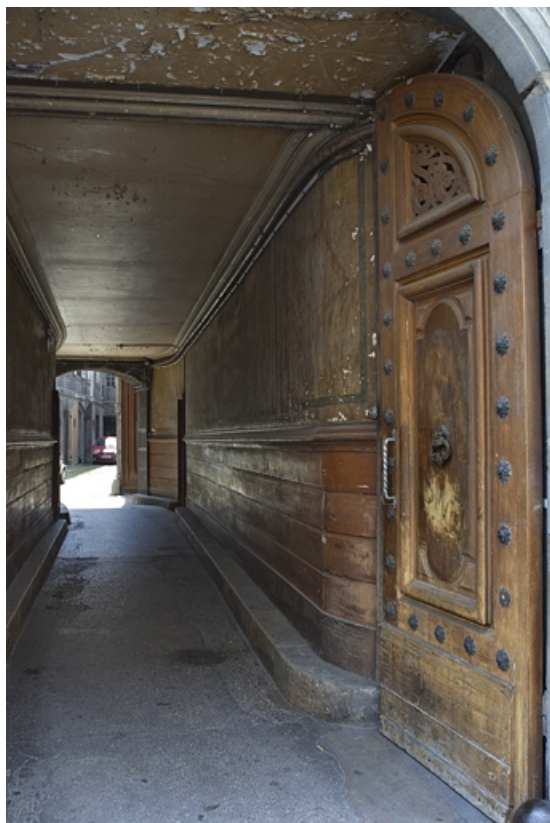
Vue d'ensemble du passage cocher depuis l'entrée.

25, Besançon, 38 rue des Granges, lieudit : îlot Saint-Pierre