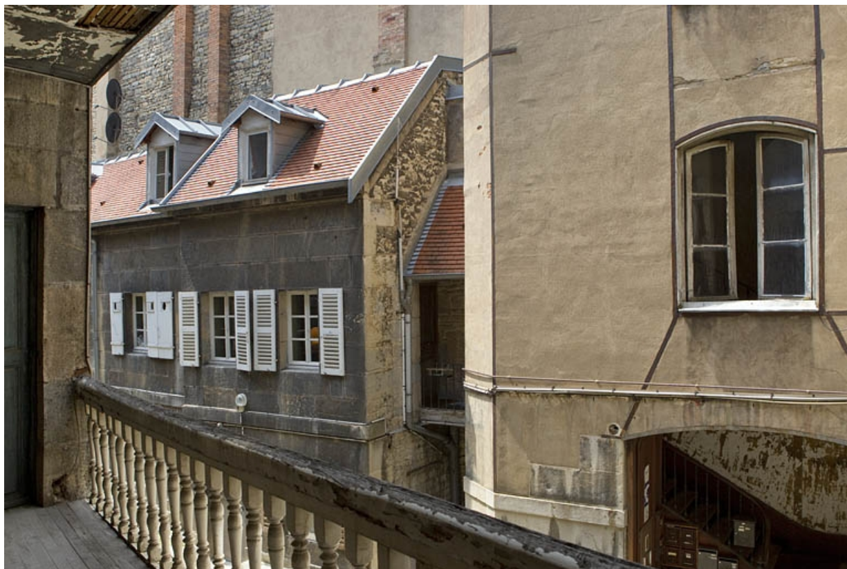
Logis secondaire à droite de la cour, depuis l'escalier à cage ouverte gauche. 25, Besançon, 38 rue des Granges, lieudit : îlot Saint-Pierre