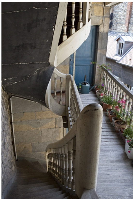
Détail de l'intérieur de l'escalier à cage ouverte gauche. 25, Besançon, 38 rue des Granges, lieu-dit : îlot Saint-Pierre