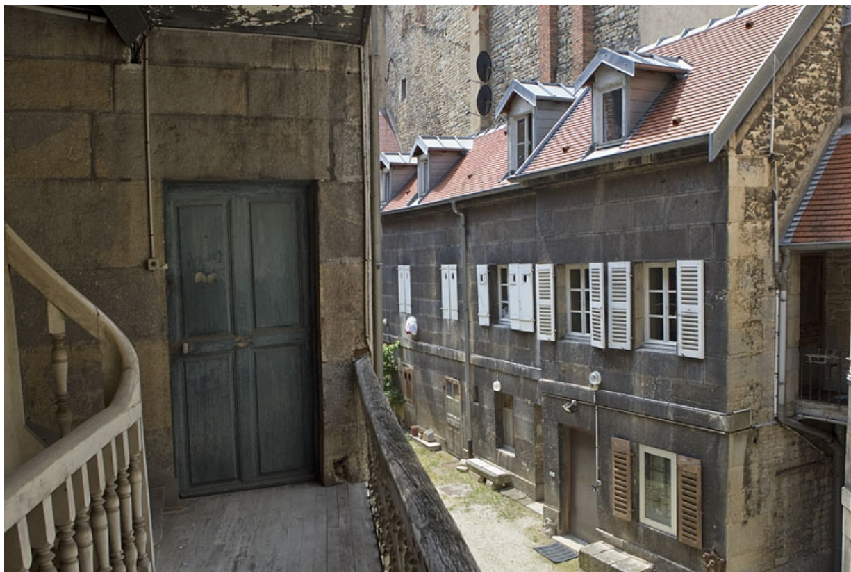
Détail de la façade du logis secondaire droit depuis l'escalier à cage ouverte gauche. 25, Besançon, 38 rue des Granges, lieudit : îlot Saint-Pierre