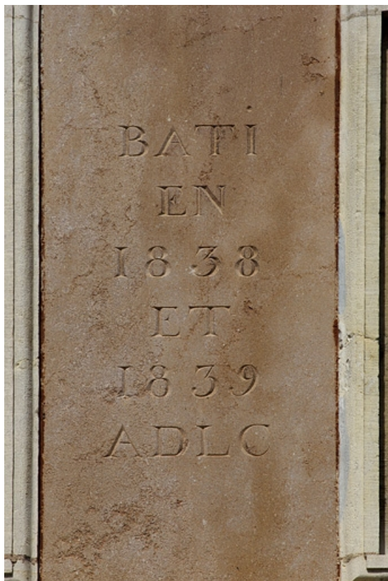
Angle du bâtiment : détail de l'inscription, vue rapprochée.

25, Besançon, 11 rue Moncey, lieudit : îlot Saint-Pierre