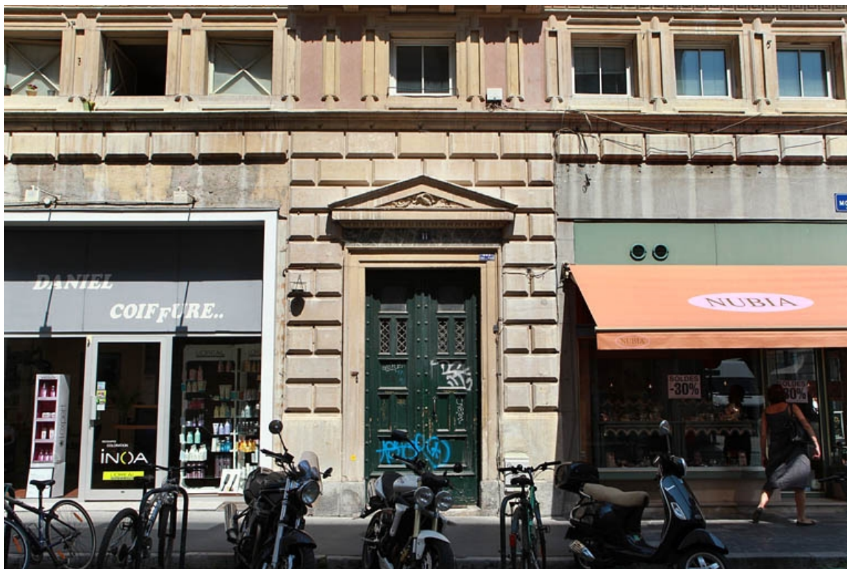
Façade antérieure : détail du rez-de-chaussée, de face.

25, Besançon, 11 rue Moncey, lieudit : îlot Saint-Pierre