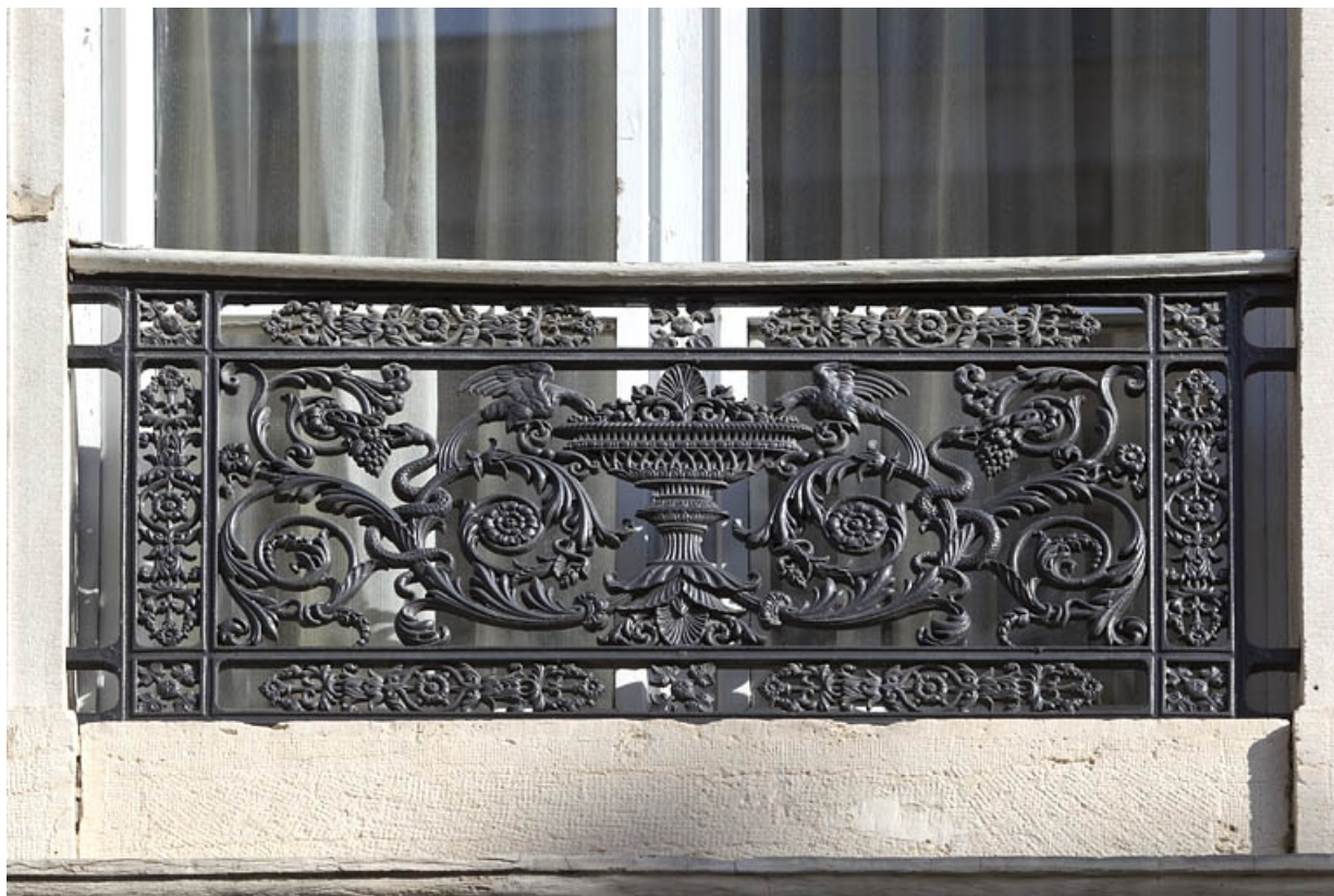
Façade antérieure, balcon : détail du décor du garde-corps.

25, Besançon, 11 rue Moncey, lieudit : îlot Saint-Pierre