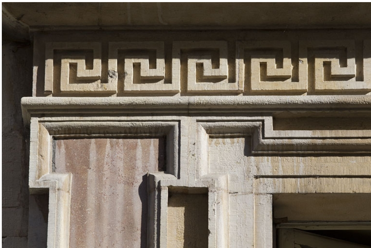
Façade antérieure : détail de la frise de grecques au-dessus de l'entresol.

25, Besançon, 11 rue Moncey, lieudit : îlot Saint-Pierre