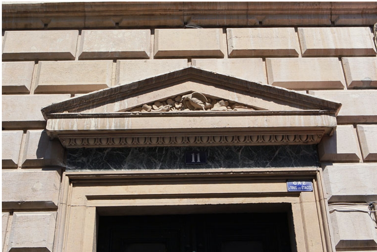
Façade antérieure : détail du fronton de la porte d'entrée.

25, Besançon, 11 rue Moncey, lieu-dit : îlot Saint-Pierre