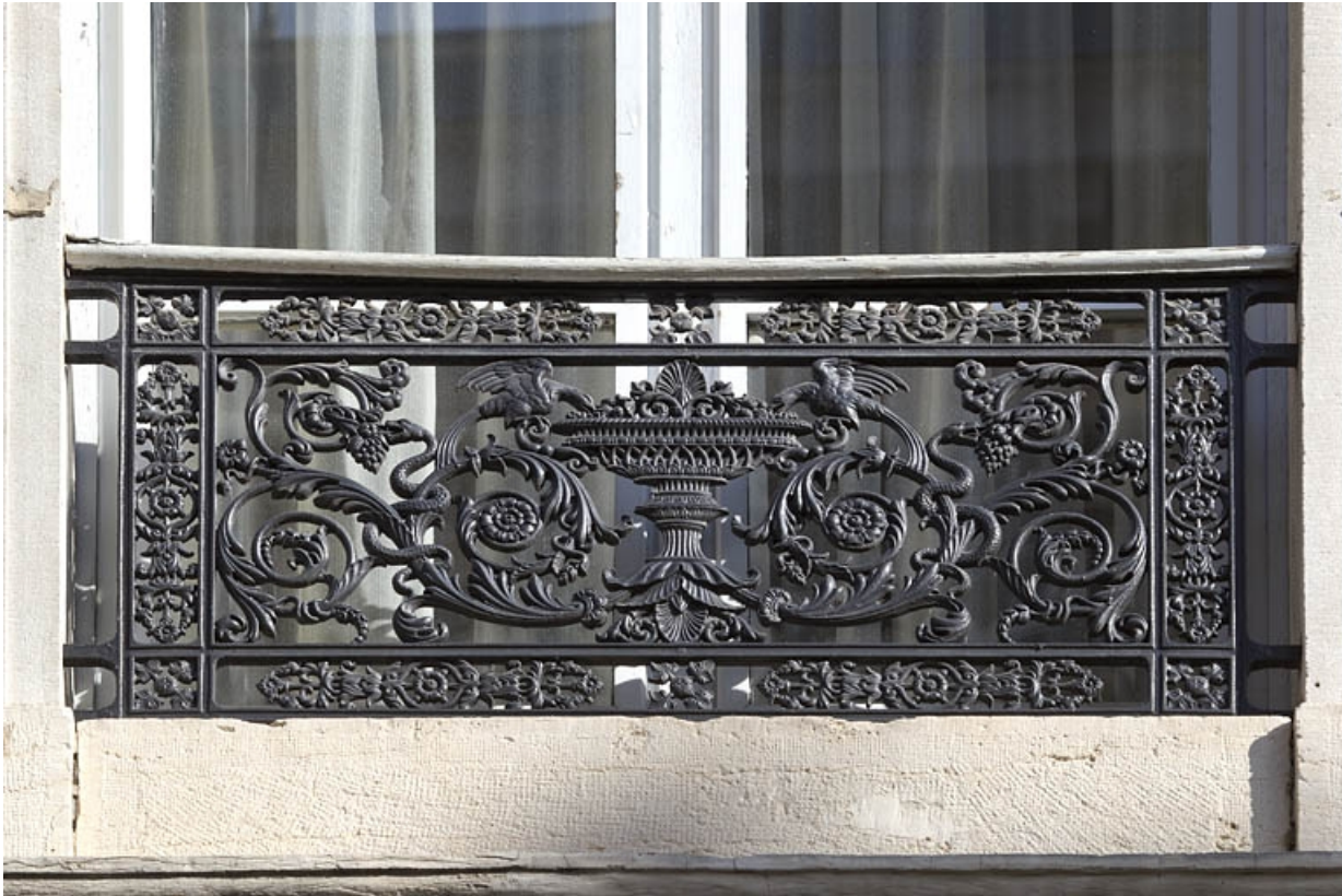
Façade antérieure, balcon : détail du décor du garde-corps.

25, Besançon, 11 rue Moncey, lieudit : îlot Saint-Pierre