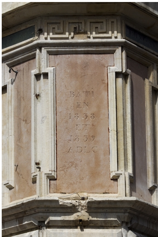
Angle du bâtiment : détail de l'inscription.

25, Besançon, 11 rue Moncey, lieudit : îlot Saint-Pierre