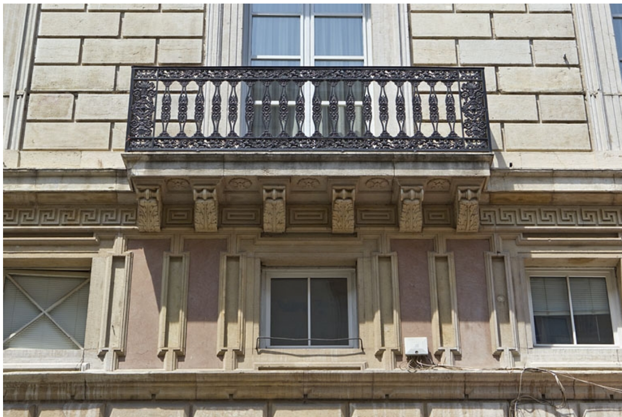
Façade antérieure : détail de l'entresol et du balcon.

25, Besançon, 11 rue Moncey, lieudit : îlot Saint-Pierre