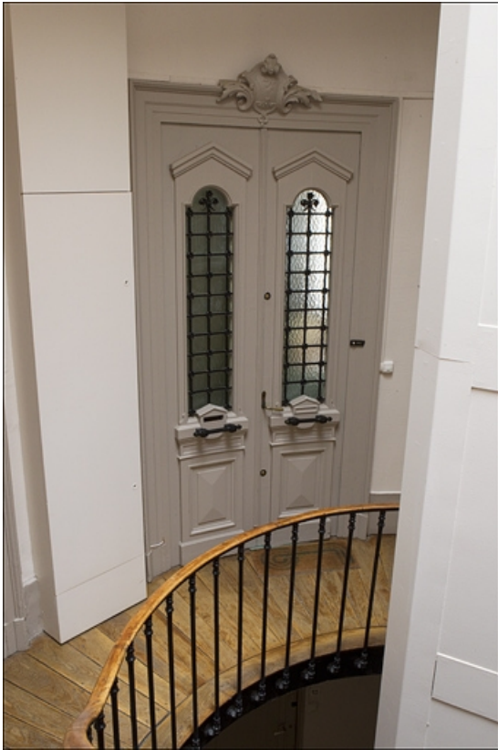
Intérieur : détail de la porte d'entrée de l'appartement du premier étage. 25, Besançon, 11 rue Moncey, lieudit : îlot Saint-Pierre