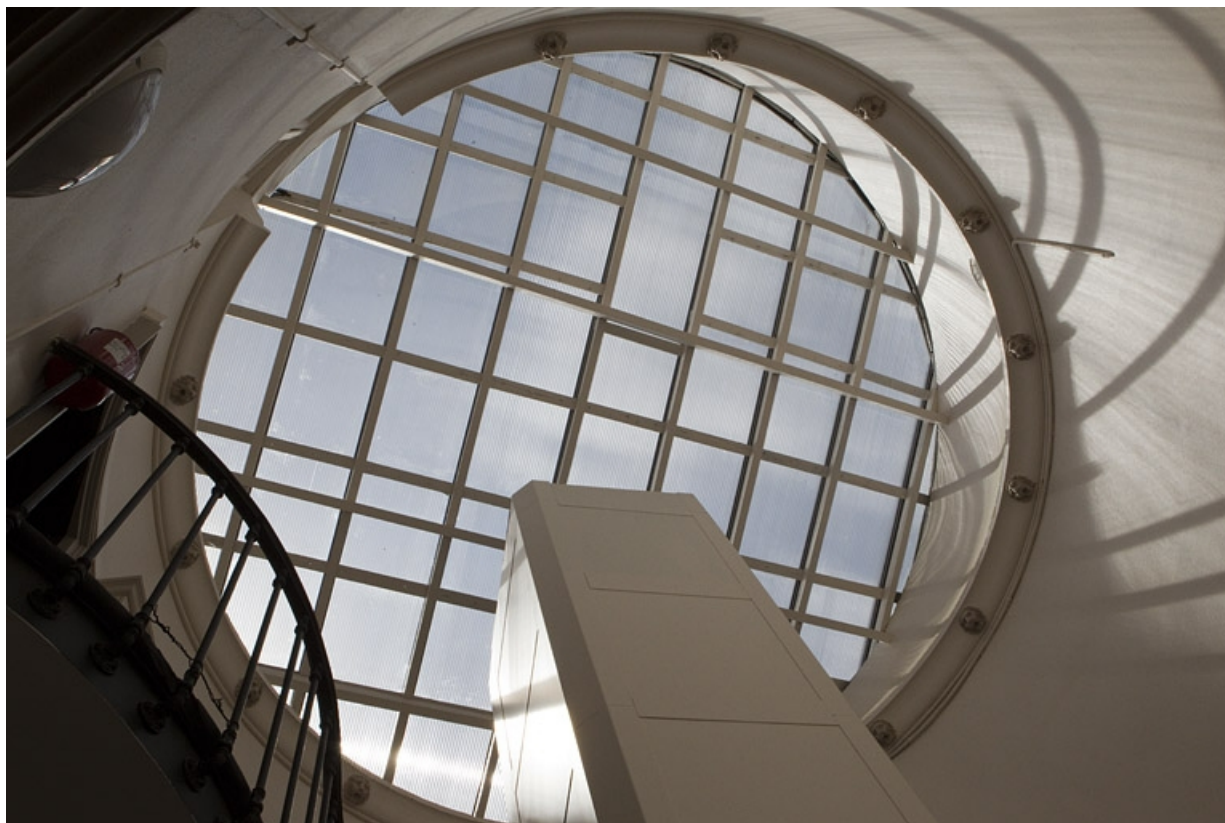
Intérieur : détail de la verrière éclairant la cage d'escalier.

25, Besançon, 11 rue Moncey, lieudit : îlot Saint-Pierre