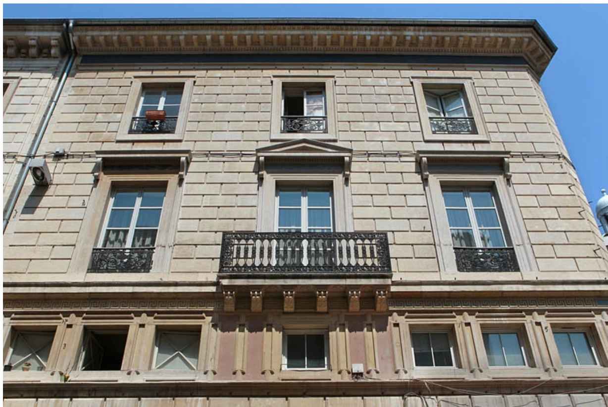
Vue de la façade antérieure à partir de l'entresol, de face.

25, Besançon, 11 rue Moncey, lieu-dit : îlot Saint-Pierre