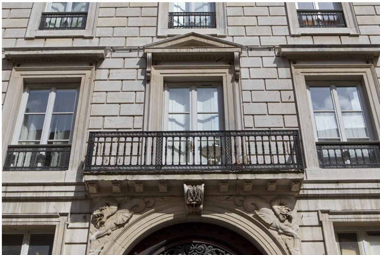
Détail de la fenêtre avec son balcon au-dessus du portail d'entrée.

25, Besançon, 9 rue Moncey, lieudit : îlot Saint-Pierre