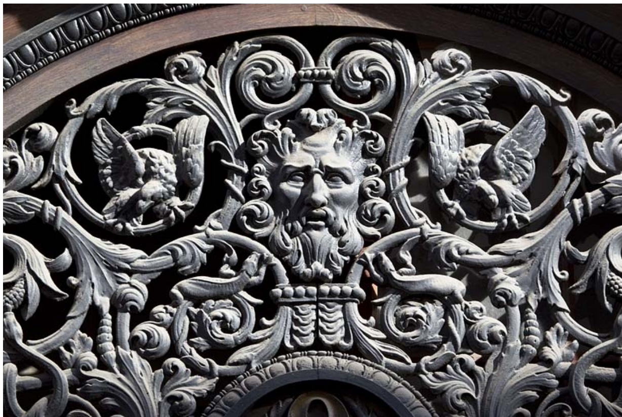
Portail d'entrée : détail du décor en fonte du tympan.

25, Besançon, 9 rue Moncey, lieudit : îlot Saint-Pierre