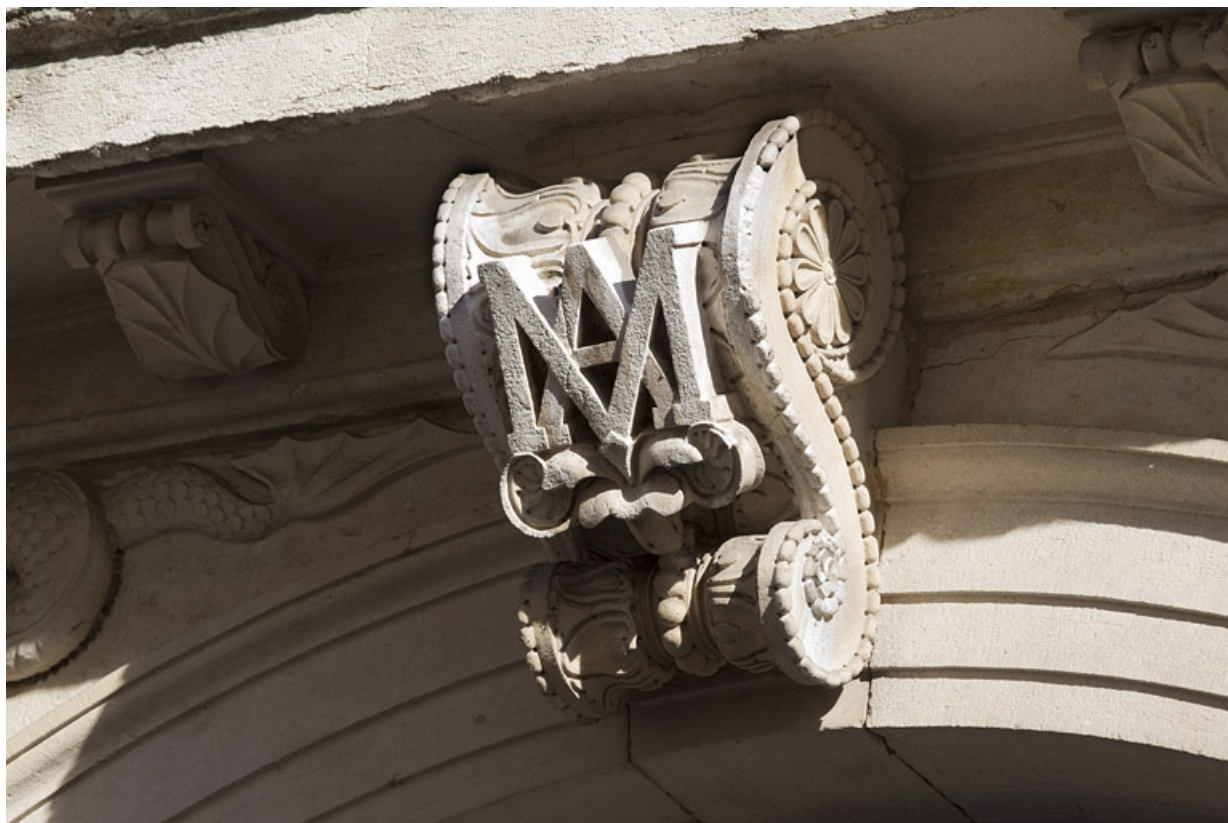
Portail d'entrée : détail du monogramme sur la clé de l'arc.

25, Besançon, 9 rue Moncey, lieudit : îlot Saint-Pierre