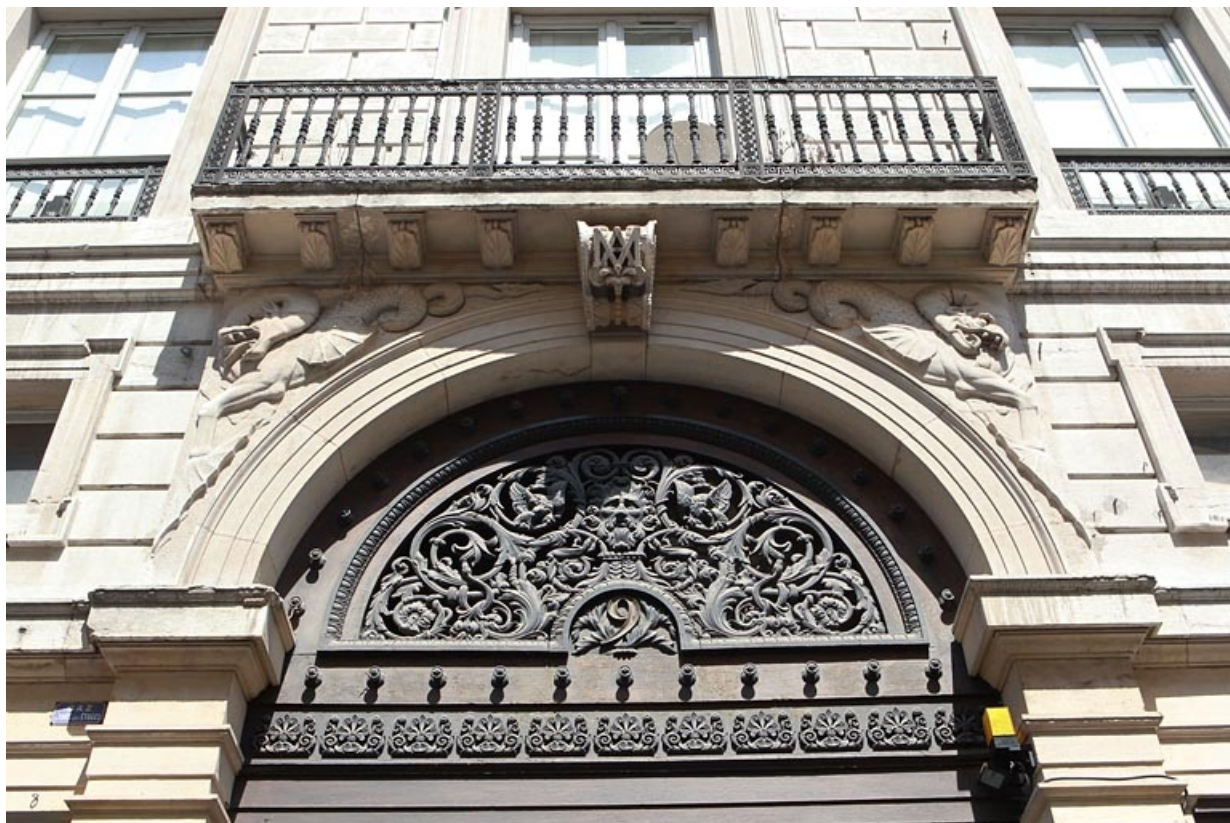
Portail d'entrée : détail du tympan avec le balcon du premier étage.

25, Besançon, 9 rue Moncey, lieudit : îlot Saint-Pierre