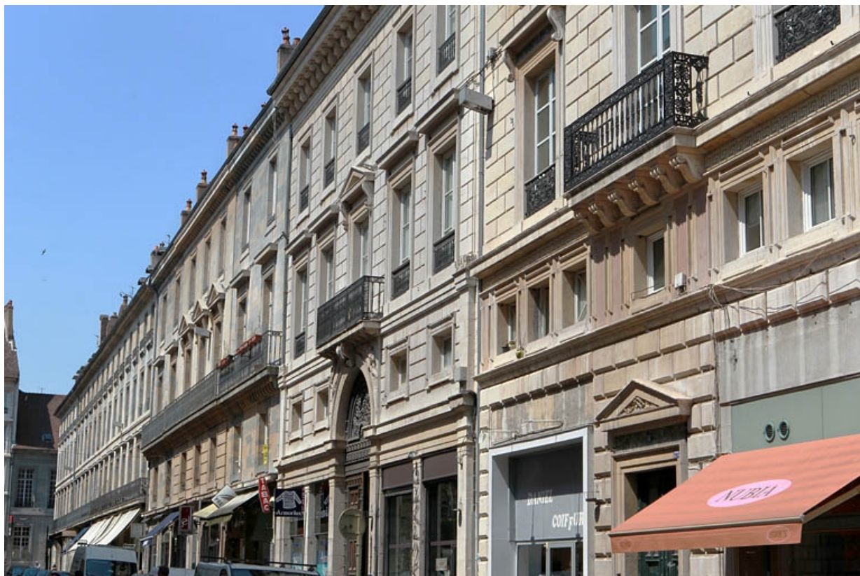
Vue d'ensemble depuis la rue de trois quarts droit. 25, Besançon, 9 rue Moncey, lieudit : îlot Saint-Pierre