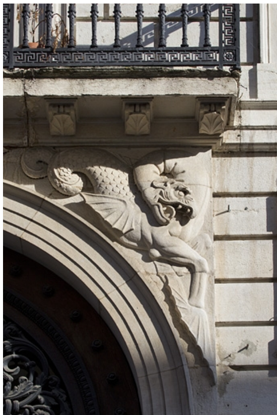
Portail d'entrée : détail du dragon dans l'écoinçon droit.

25, Besançon, 9 rue Moncey, lieudit : îlot Saint-Pierre