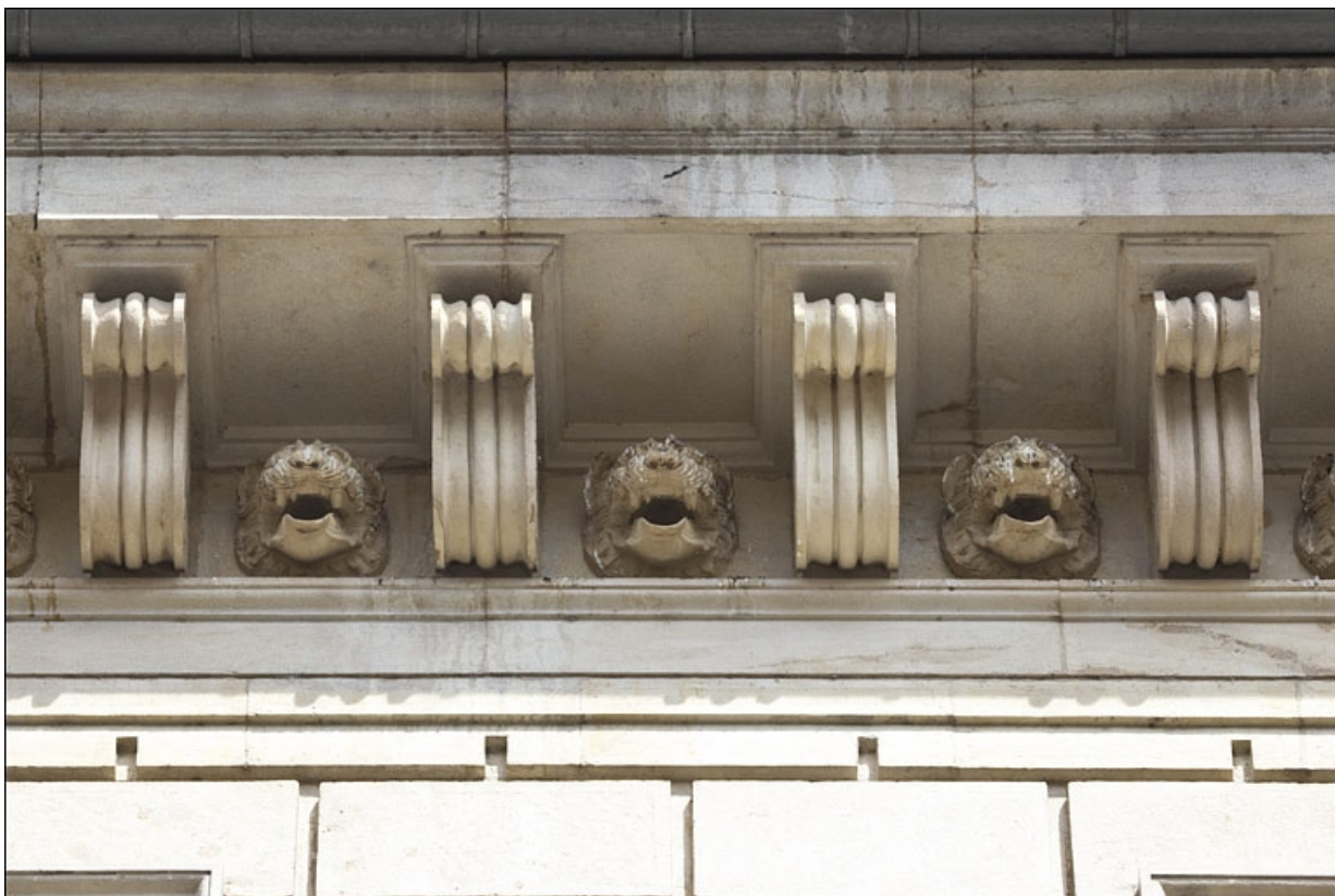
Façade antérieure : détail de la corniche de toit.

25, Besançon, 9 rue Moncey, lieudit : îlot Saint-Pierre