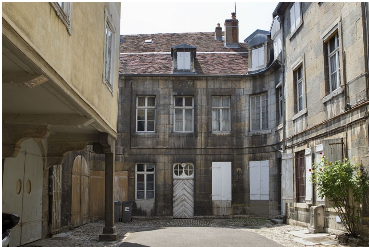
Logis principal : détail de l'aile en fond de cour.

25, Besançon, 46 rue des Granges, lieudit : îlot Saint-Pierre