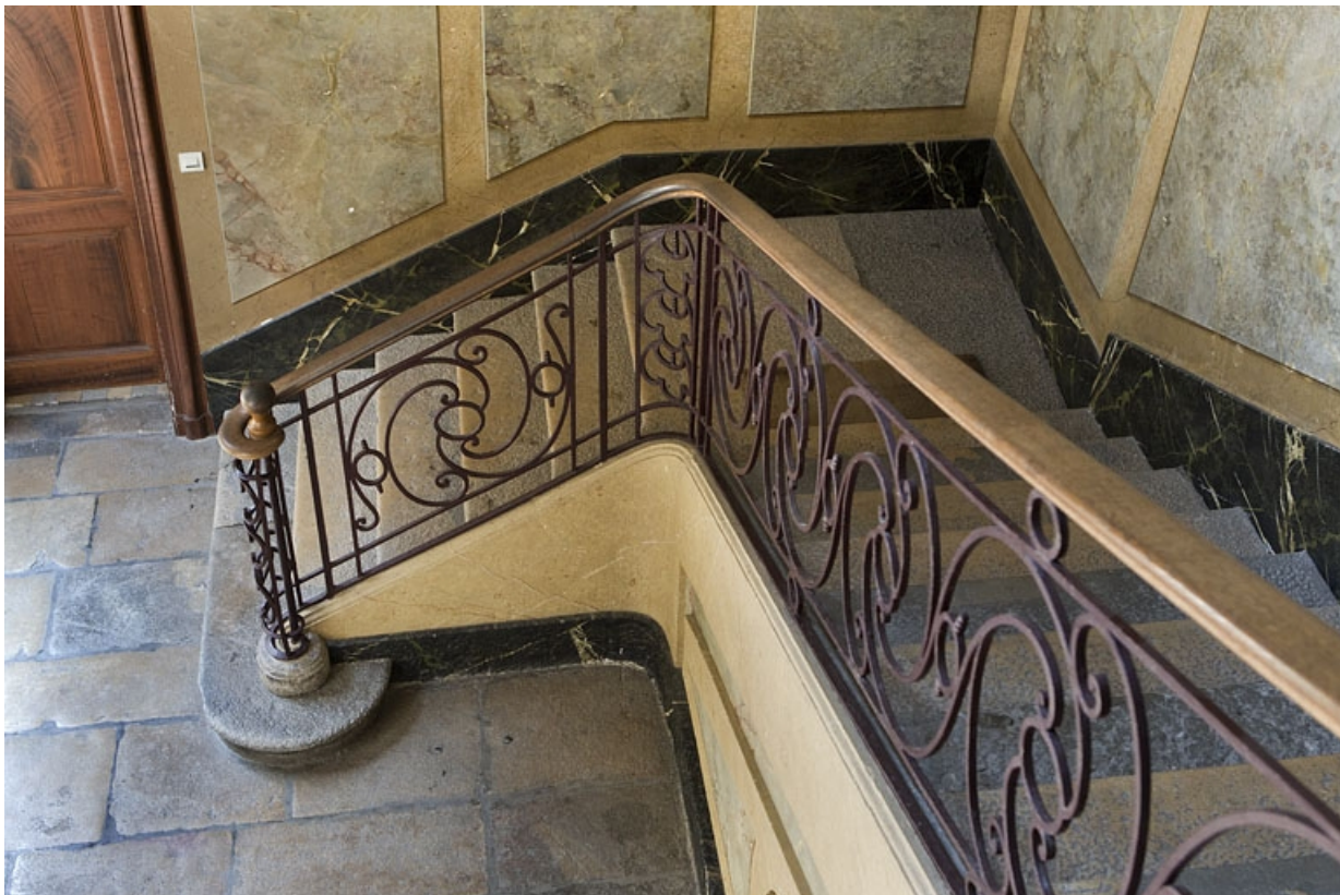
Logis principal, escalier : détail de la première volée.

25, Besançon, 46 rue des Granges, lieudit : îlot Saint-Pierre