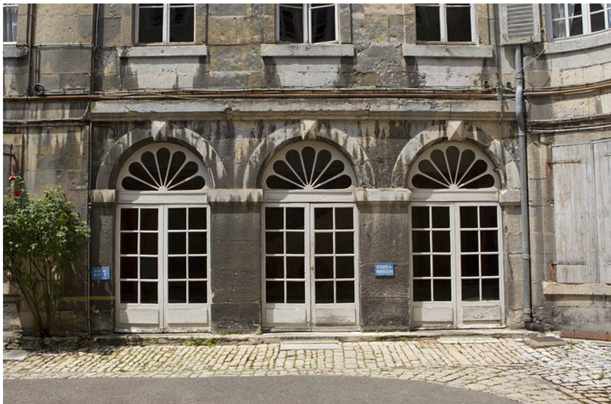
Logis principal, aile droite : détail des trois baies donnant accès à l'escalier.

25, Besançon, 46 rue des Granges, lieudit : îlot Saint-Pierre