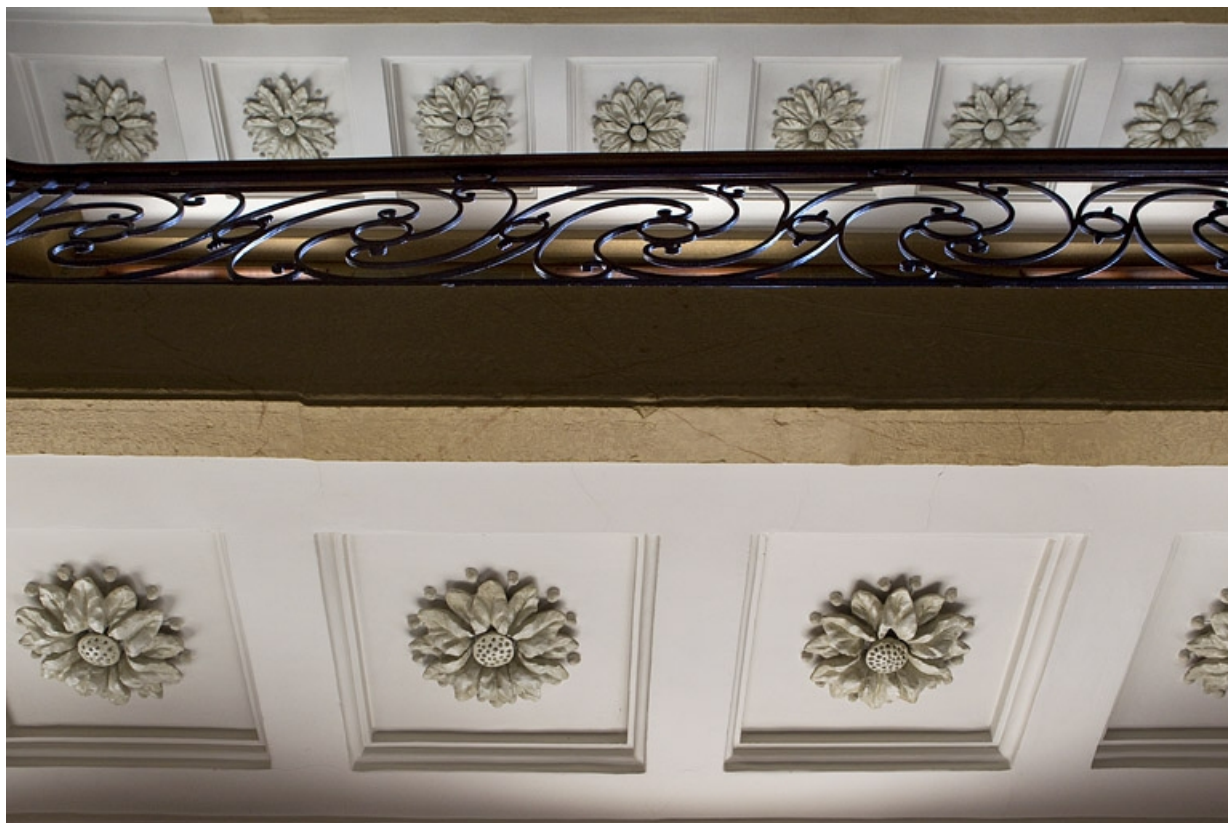
Logis principal, escalier : détail du décor sous le palier. 25, Besançon, 46 rue des Granges, lieudit : îlot Saint-Pierre