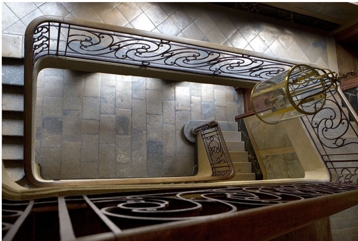
Logis principal, escalier : vue plongeante depuis le palier. 25, Besançon, 46 rue des Granges, lieudit : îlot Saint-Pierre