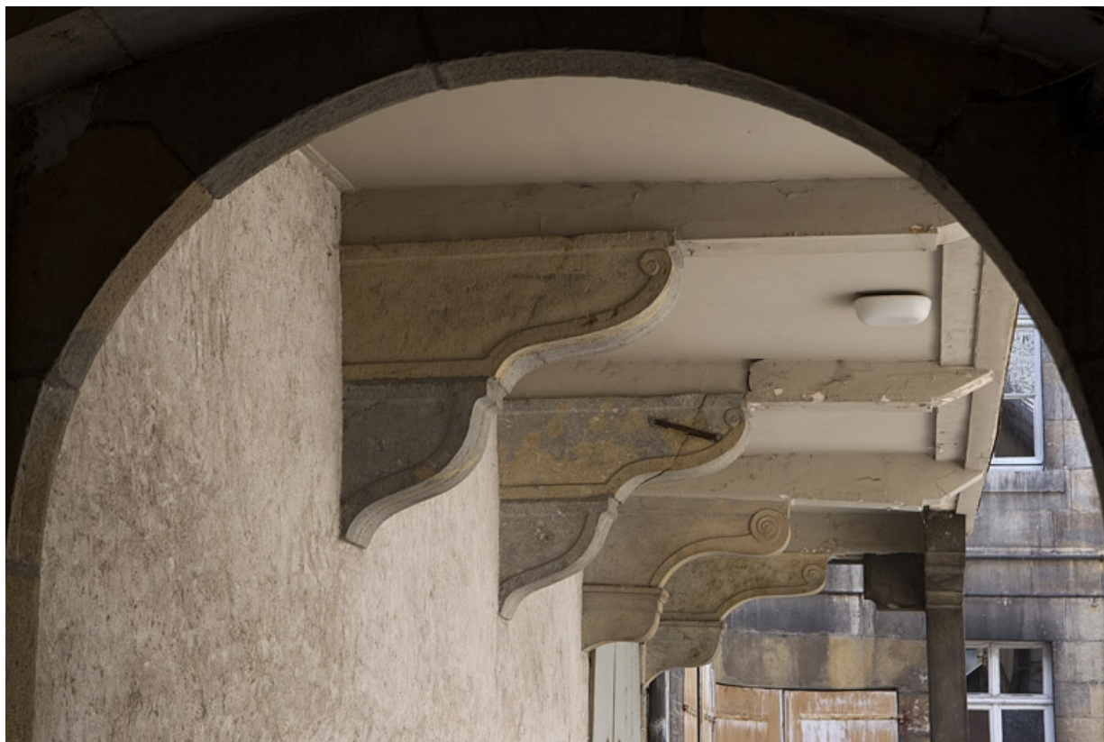
Extension en pan de bois : détail des consoles soutenant la construction.

25, Besançon, 46 rue des Granges, lieudit : îlot Saint-Pierre