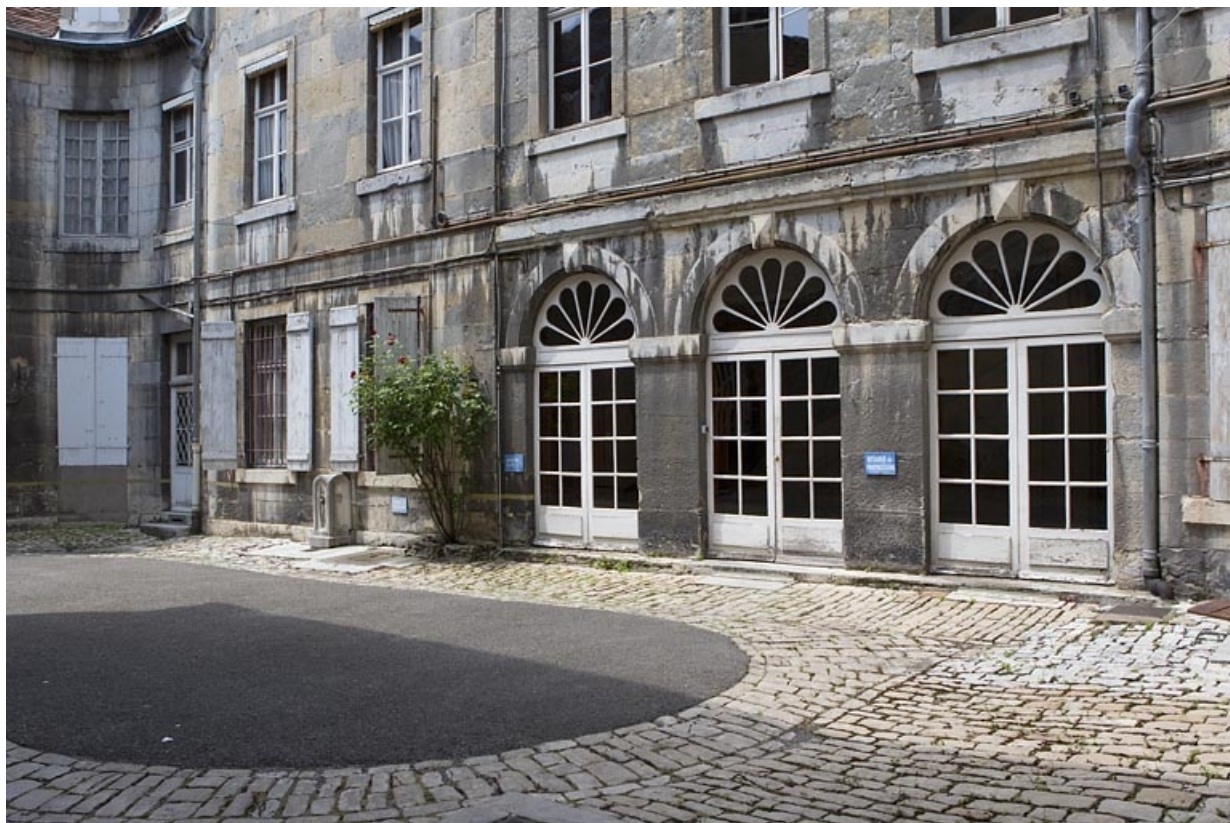
Logis principal : détail de la facade droite sur cour.

25, Besançon, 46 rue des Granges, lieudit : îlot Saint-Pierre