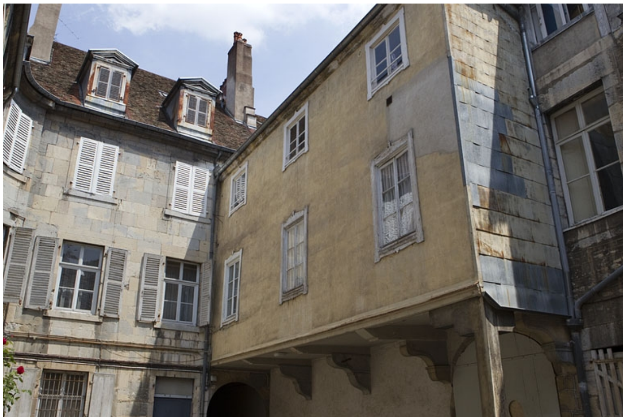
Vue d'ensemble de l'extension en pan de bois à gauche de la cour.

25, Besançon, 46 rue des Granges, lieudit : îlot Saint-Pierre