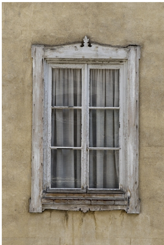
Extension en pan de bois : détail d'une fenêtre.

25, Besançon, 46 rue des Granges, lieudit : îlot Saint-Pierre