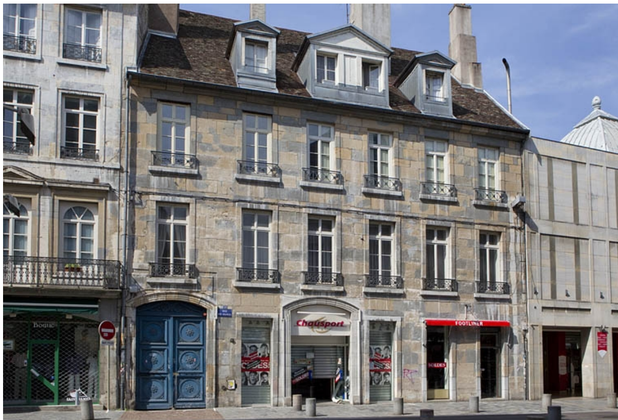
Vue d'ensemble de face depuis la rue.

25, Besançon, 46 rue des Granges, lieudit : îlot Saint-Pierre