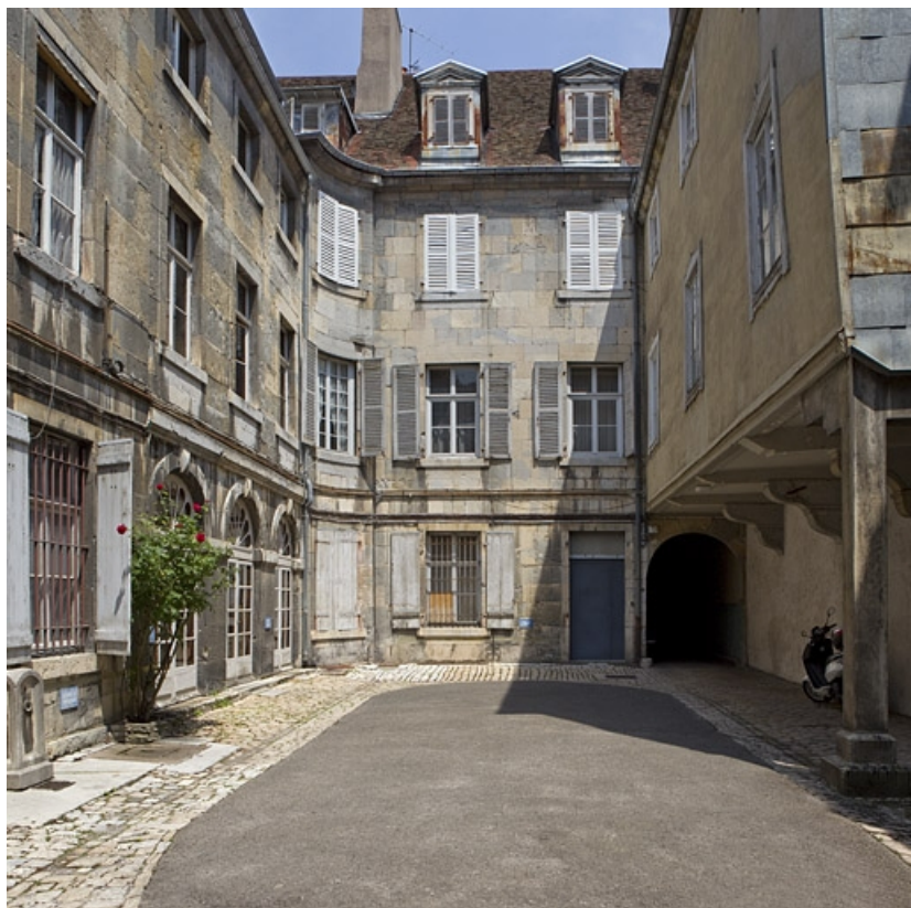
Vue du logis principal depuis le fond de la cour.

25, Besançon, 46 rue des Granges, lieudit : îlot Saint-Pierre