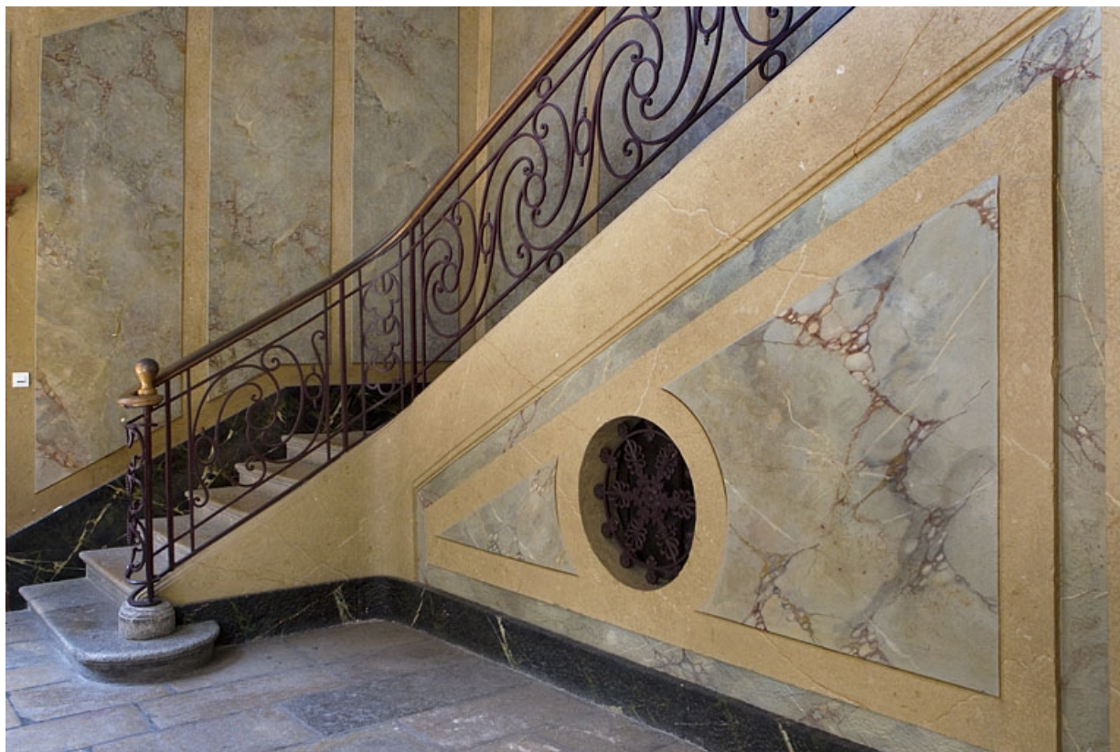
Logis principal, escalier : détail du mur d'échiffre.

25, Besançon, 46 rue des Granges, lieudit : îlot Saint-Pierre