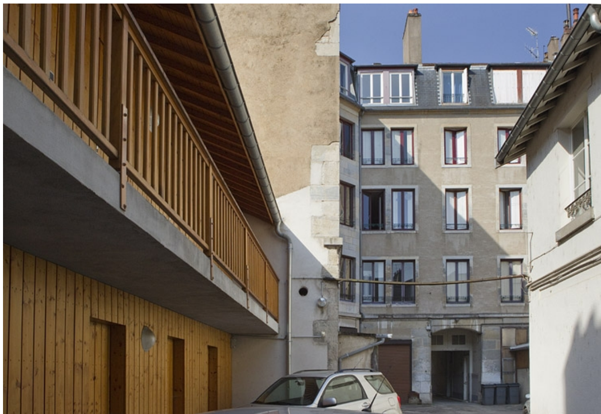
Détail des bûchers dans la deuxième cour, de trois quarts gauche.

25, Besançon Grande Rue 73, lieudit : îlot Saint-Pierre