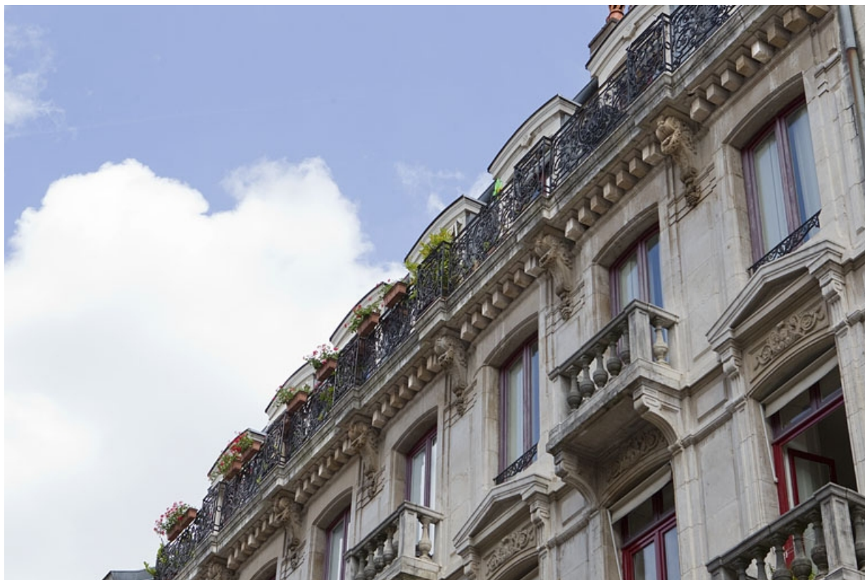
Logis principal, façade sur rue : détail de la surélévation, de trois quarts droit. 25, Besançon Grande Rue 73, lieudit : îlot Saint-Pierre