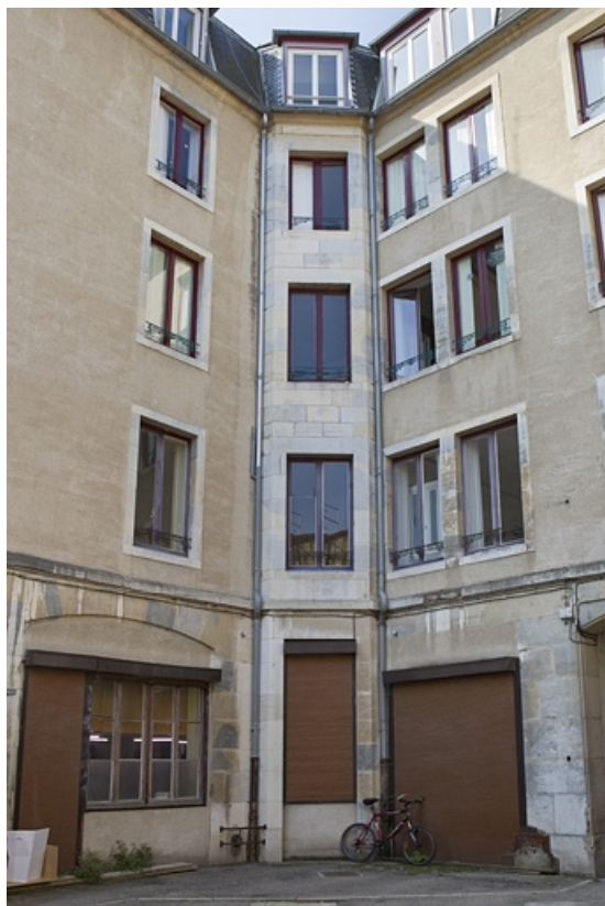
Détail d'un angle de la façade du logis principal dans la deuxième cour.

25, Besançon Grande Rue 73, lieudit : îlot Saint-Pierre