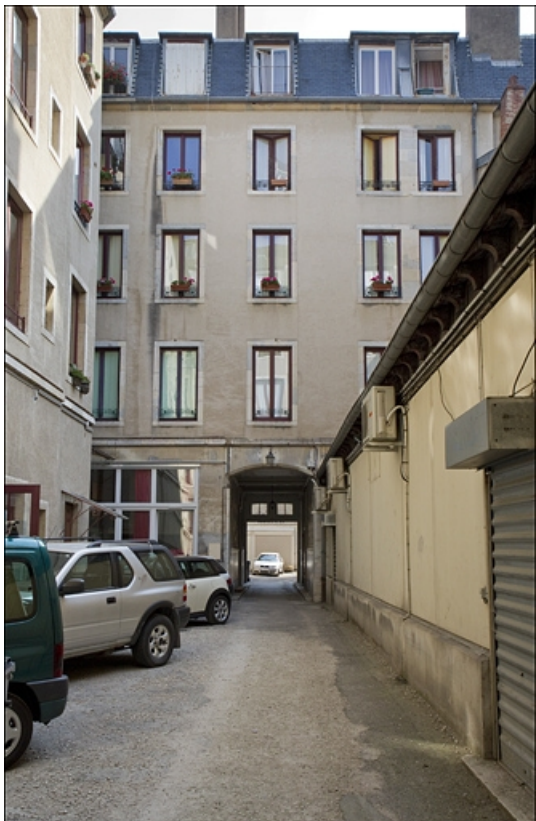
Vue d'ensemble de la façade du logis principal au fond de la première cour.

25, Besançon Grande Rue 73, lieudit : îlot Saint-Pierre