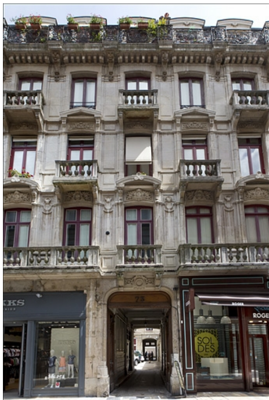
Façade sur rue : détail du rez-de-chaussée au troisième étage.

25, Besançon Grande Rue 73, lieudit : îlot Saint-Pierre