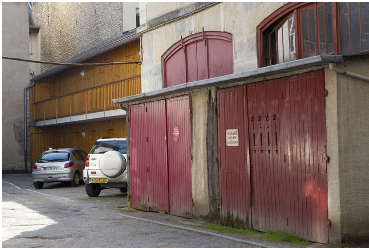
Détail des bûchers dans la deuxième cour, de trois quarts droit.

25, Besançon Grande Rue 73, lieudit : îlot Saint-Pierre