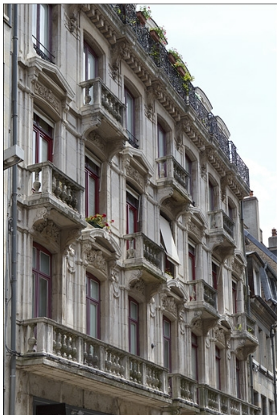
Logis principal, façade sur rue à partir du premier étage : de trois quarts gauche. 25, Besançon Grande Rue 73, lieudit : îlot Saint-Pierre