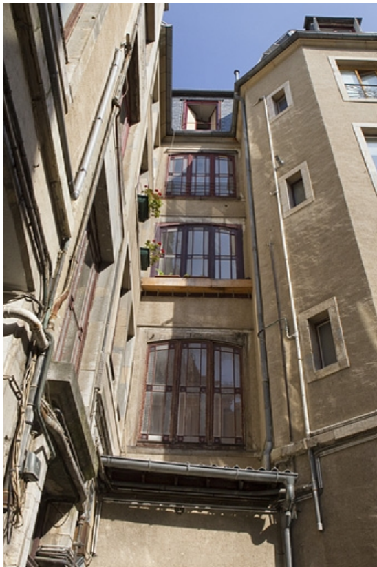
Façade postérieure du logis principal dans la première cour, travée de l'escalier.

25, Besançon Grande Rue 73, lieudit : îlot Saint-Pierre