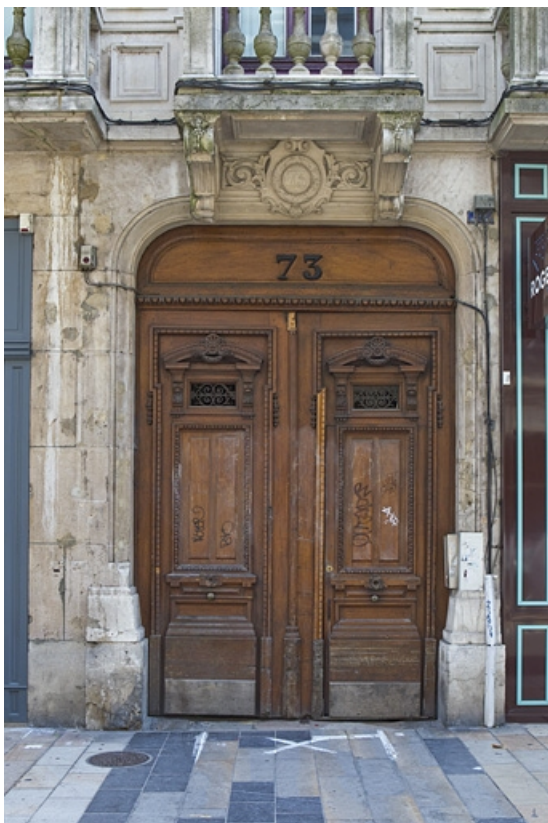
Logis principal, façade sur rue : détail des vantaux du portail d'entrée.

25, Besançon Grande Rue 73, lieudit : îlot Saint-Pierre