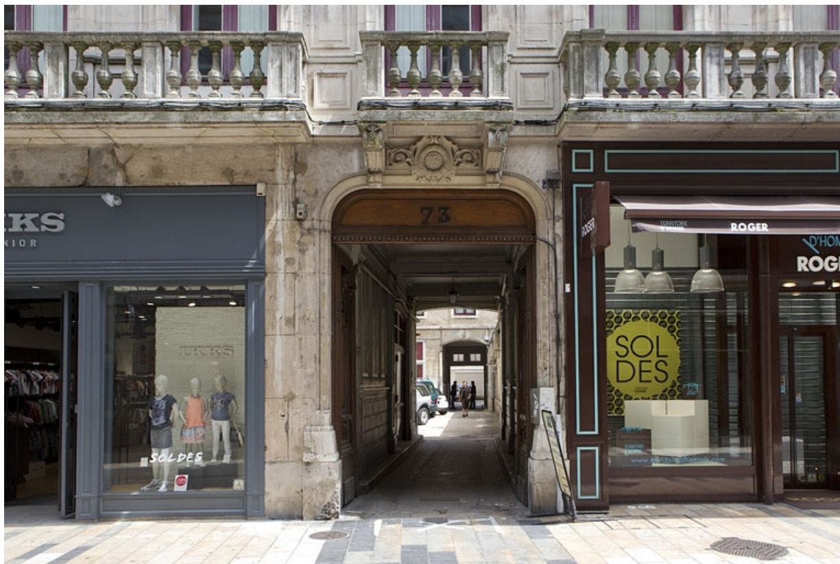
Logis principal, façade sur rue : détail du portail d'entrée.

25, Besançon Grande Rue 73, lieudit : îlot Saint-Pierre