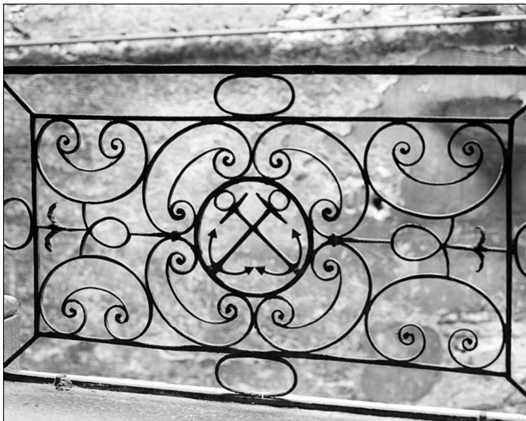
Escalier à cage ouverte : détail d'un panneau de ferronnerie, vue rapprochée. 25, Besançon Grande Rue 67, lieudit : îlot Saint-Pierre