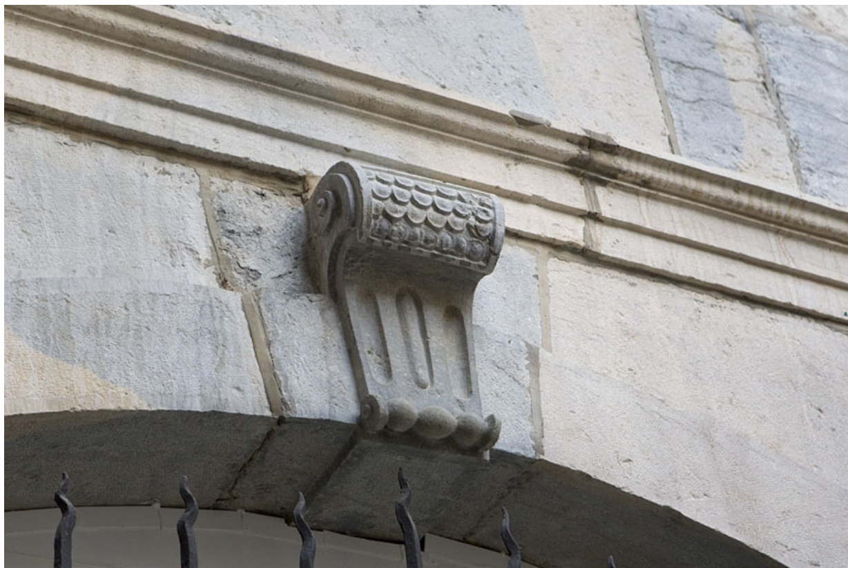
Façade antérieure en fond de cour : détail d'une clé de fenêtre.

25, Besançon Grande Rue 67, lieudit : îlot Saint-Pierre