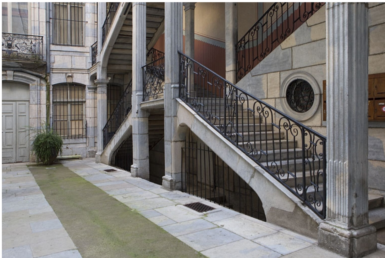
Escalier à cage ouverte : détail du rez-de-chaussée, de trois quarts droit. 25, Besançon Grande Rue 67, lieudit : îlot Saint-Pierre