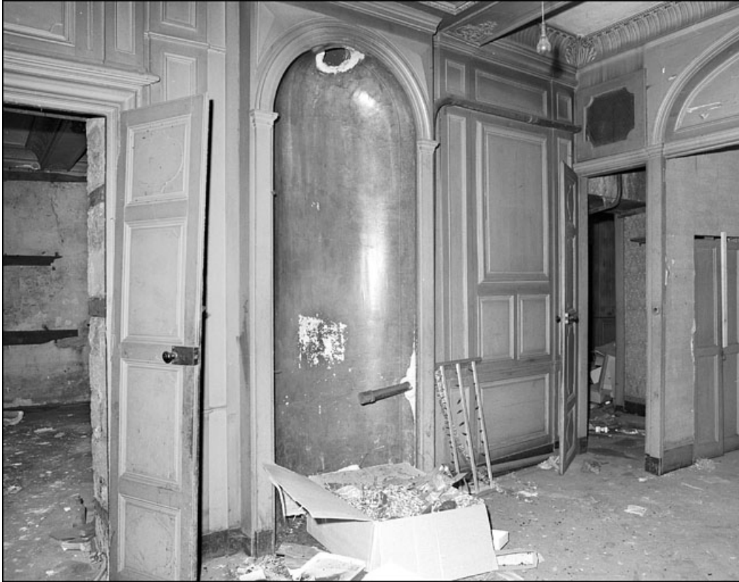
Intérieur : détail d'une niche de poêle.

25, Besançon Grande Rue 67, lieudit : îlot Saint-Pierre