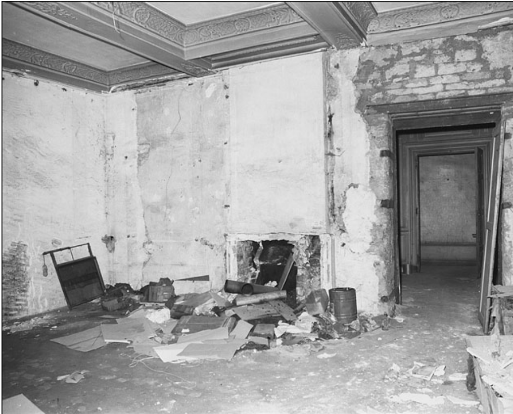
Intérieur : détail de l'angle d'une pièce avec le plafond.

25, Besançon Grande Rue 67, lieudit : îlot Saint-Pierre