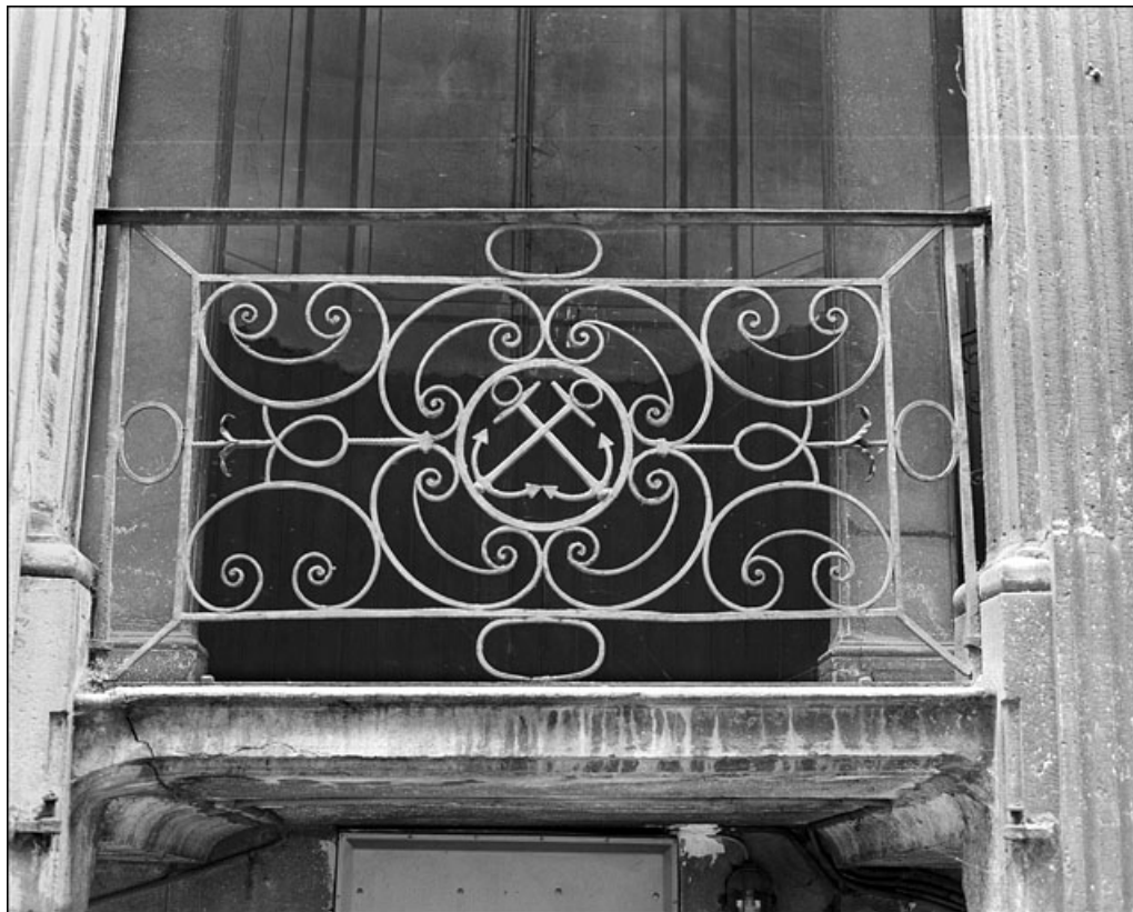
Escalier à cage ouverte : détail d'un panneau de ferronnerie, de face.

25, Besançon Grande Rue 67, lieudit : îlot Saint-Pierre