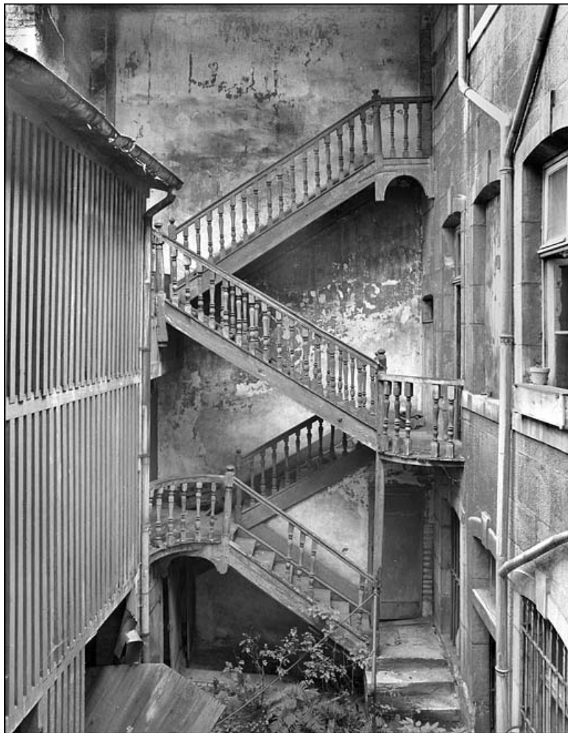
Vue rapprochée de l'escalier détruit situé dans la deuxième cour.

25, Besançon Grande Rue 67, lieudit : îlot Saint-Pierre