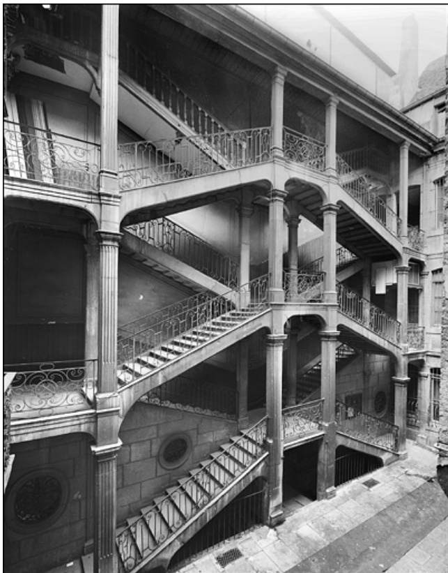
Vue d'ensemble de l'escalier à cage ouverte depuis le fond de la cour.

25, Besançon Grande Rue 67, lieudit : îlot Saint-Pierre