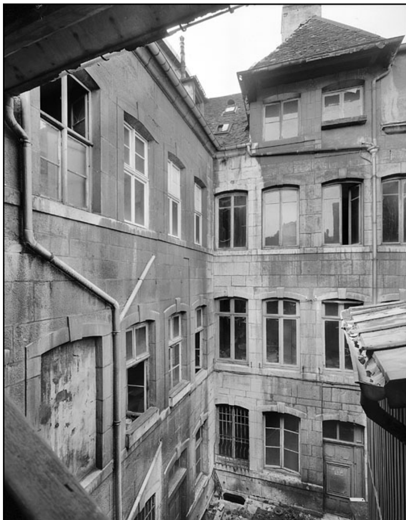
Vue d'ensemble des bâtiments détruits depuis le fond de la deuxième cour, de trois quarts droit. 25, Besançon Grande Rue 67, lieudit : îlot Saint-Pierre