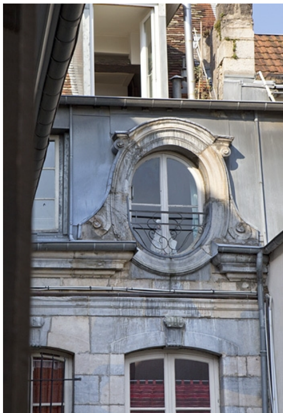
Façade antérieure du logis en fond de cour : détail de la lucarne centrale.

25, Besançon Grande Rue 67, lieudit : îlot Saint-Pierre