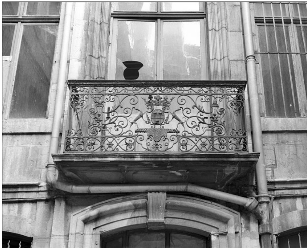
Logis en fond de cour : détail du balcon en ferronnerie.

25, Besançon Grande Rue 67, lieudit : îlot Saint-Pierre