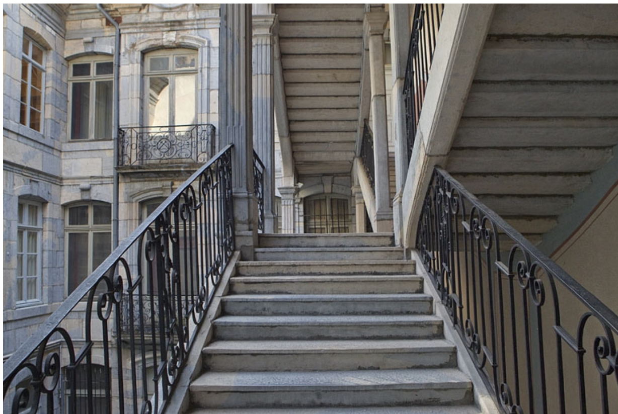
Escalier à cage ouverte : détail de l'intérieur de l'escalier.

25, Besançon Grande Rue 67, lieudit : îlot Saint-Pierre