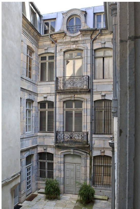
Vue d'ensemble de la façade en fond de cour, de trois quarts droit.

25, Besançon Grande Rue 67, lieudit : îlot Saint-Pierre