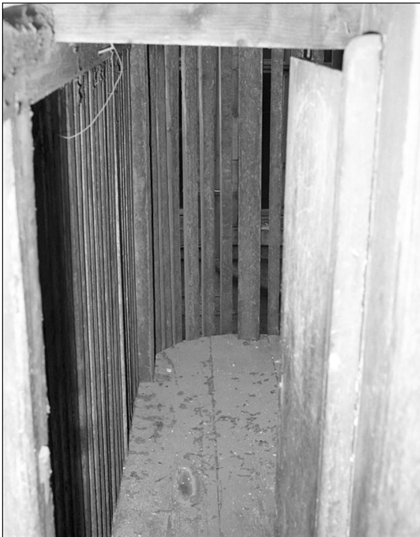
Détail de l'intérieur du bûcher.

25, Besançon Grande Rue 67, lieudit : îlot Saint-Pierre