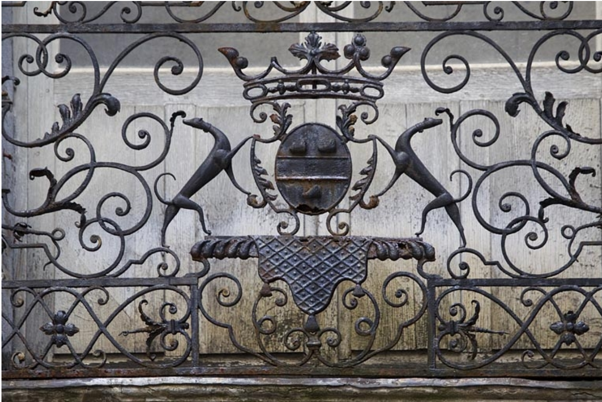
Façade antérieure en fond de cour : détail des armoiries, balcon du premier étage.

25, Besançon Grande Rue 67, lieudit : îlot Saint-Pierre