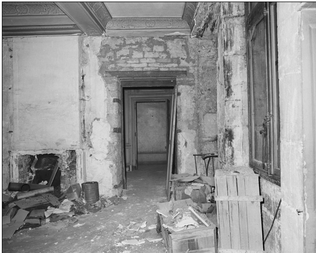
Intérieur : détail d'une pièce avec la porte d'entrée. 25, Besançon Grande Rue 67, lieudit : îlot Saint-Pierre