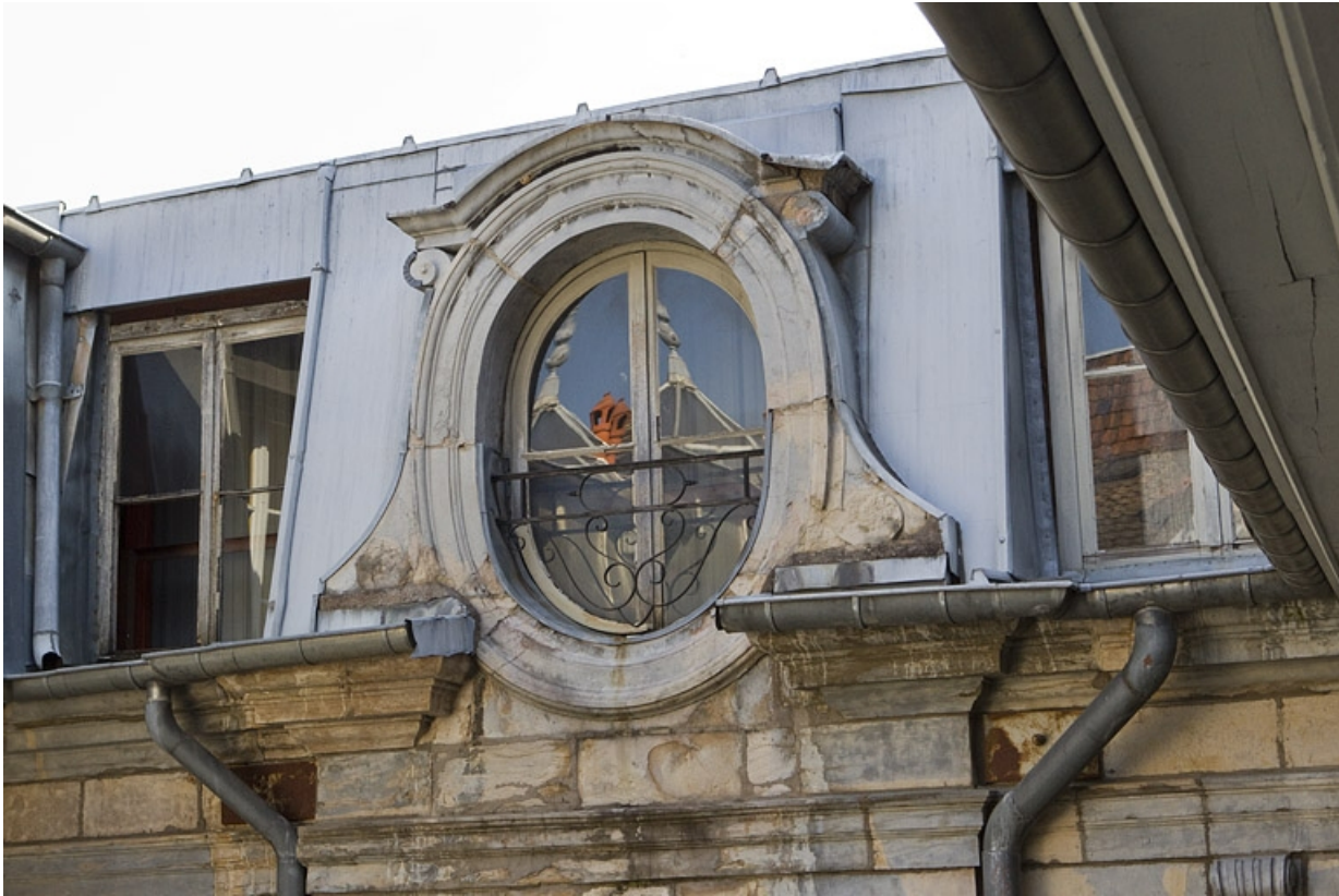
Façade en fond de cour : détail de la lucarne centrale, vue rapprochée.

25, Besançon Grande Rue 67, lieudit : îlot Saint-Pierre