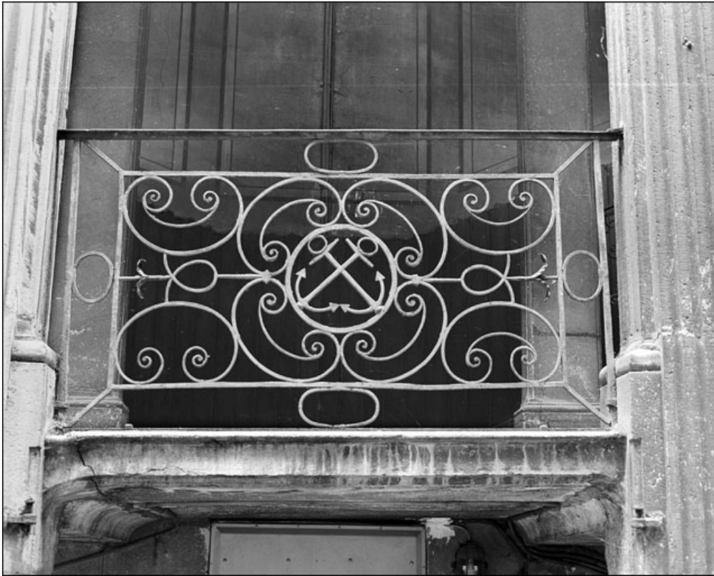
Escalier à cage ouverte : détail d'un panneau de ferronnerie, de face.

25, Besançon Grande Rue 67, lieudit : îlot Saint-Pierre