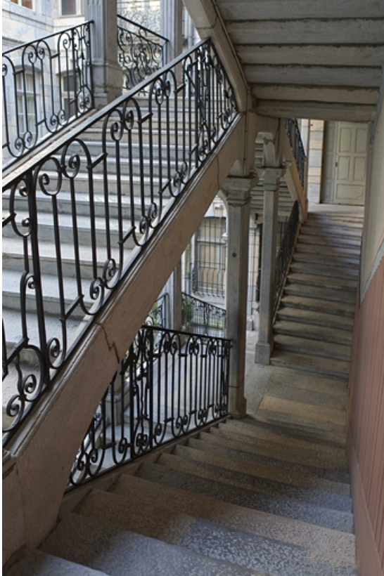
Escalier à cage ouverte : détail de la rampe en fer forgé depuis l'intérieur de l'escalier. 25, Besançon Grande Rue 67, lieudit : îlot Saint-Pierre