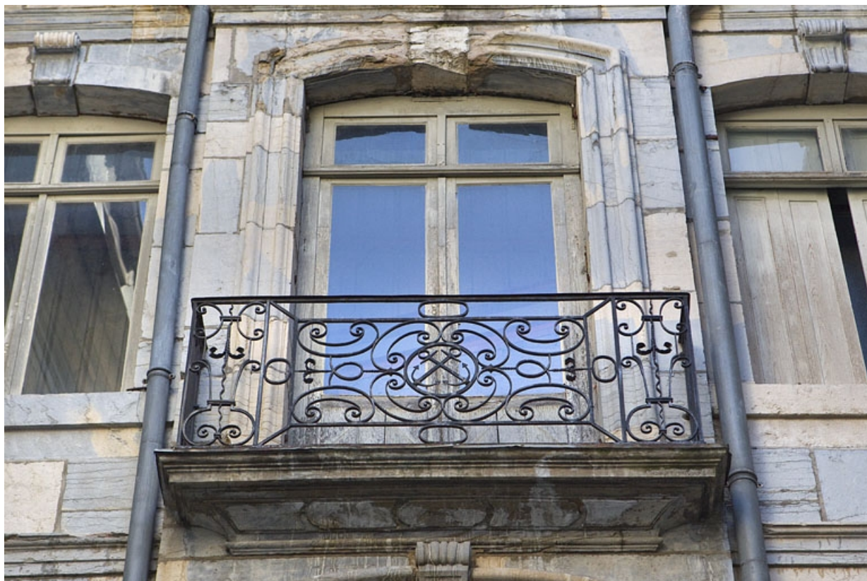
Façade antérieure en fond de cour : détail du balcon du deuxième étage.

25, Besançon Grande Rue 67, lieudit : îlot Saint-Pierre