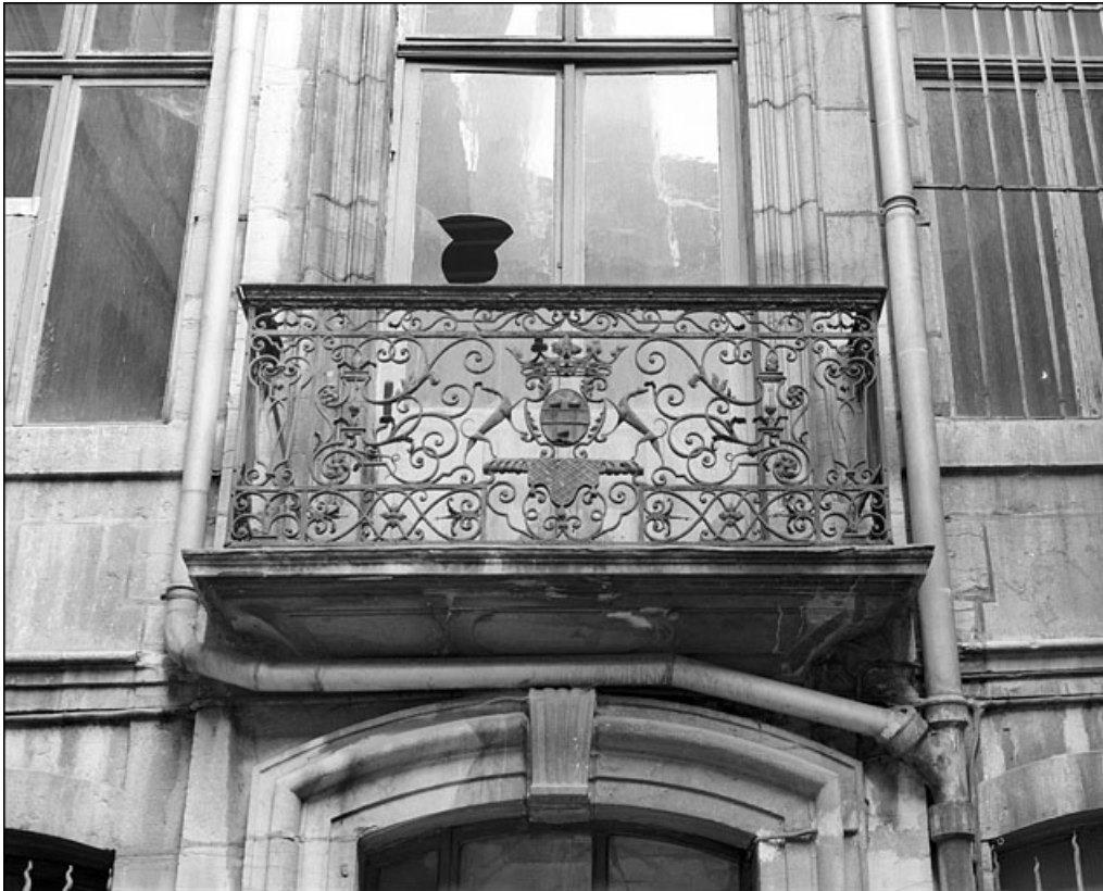
Logis en fond de cour : détail du balcon en ferronnerie.

25, Besançon Grande Rue 67, lieudit : îlot Saint-Pierre