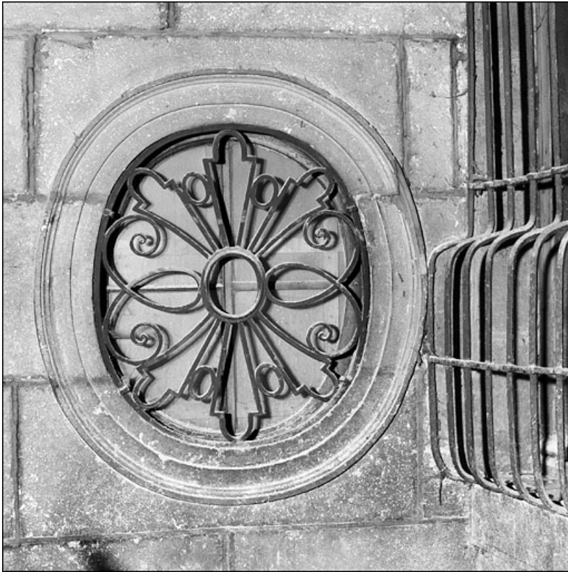
Escalier à cage ouverte : détail d'un oculus, de face.

25, Besançon Grande Rue 67, lieudit : îlot Saint-Pierre