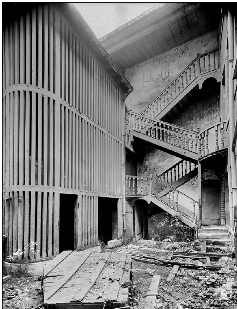
Vue du bûcher et de l'escalier détruits situés dans la deuxième cour. 25, Besançon Grande Rue 67, lieudit : îlot Saint-Pierre