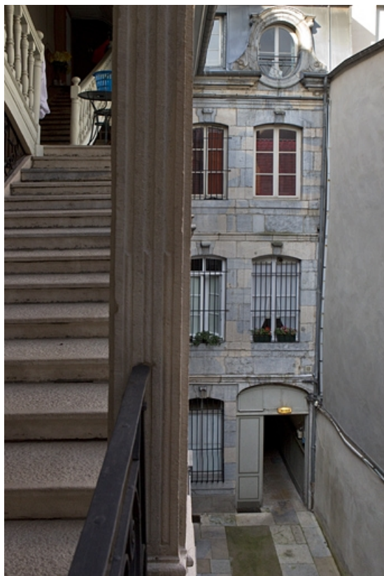
Vue d'ensemble de la façade postérieure du logis sur rue.

25, Besançon Grande Rue 67, lieudit : îlot Saint-Pierre