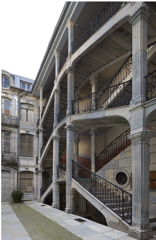
Vue d'ensemble de l'escalier à cage ouverte de trois quarts droit.

25, Besançon Grande Rue 67, lieudit : îlot Saint-Pierre