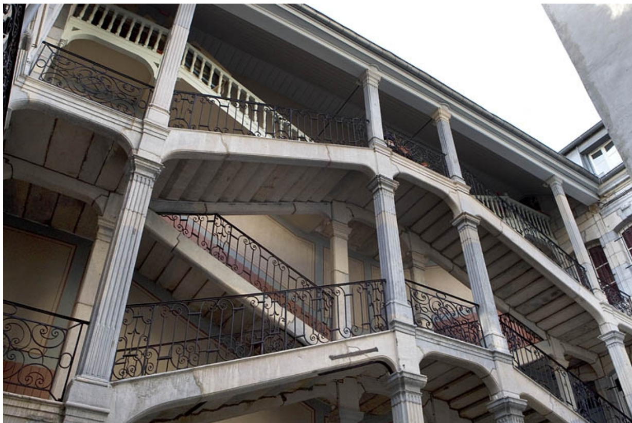
Escalier à cage ouverte : détail de la partie supérieure, de trois quarts gauche. 25, Besançon Grande Rue 67, lieudit : îlot Saint-Pierre