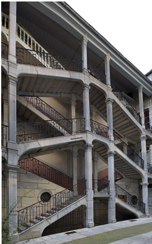
Vue d'ensemble de l'escalier à cage ouverte de trois quarts gauche.

25, Besançon Grande Rue 67, lieudit : îlot Saint-Pierre