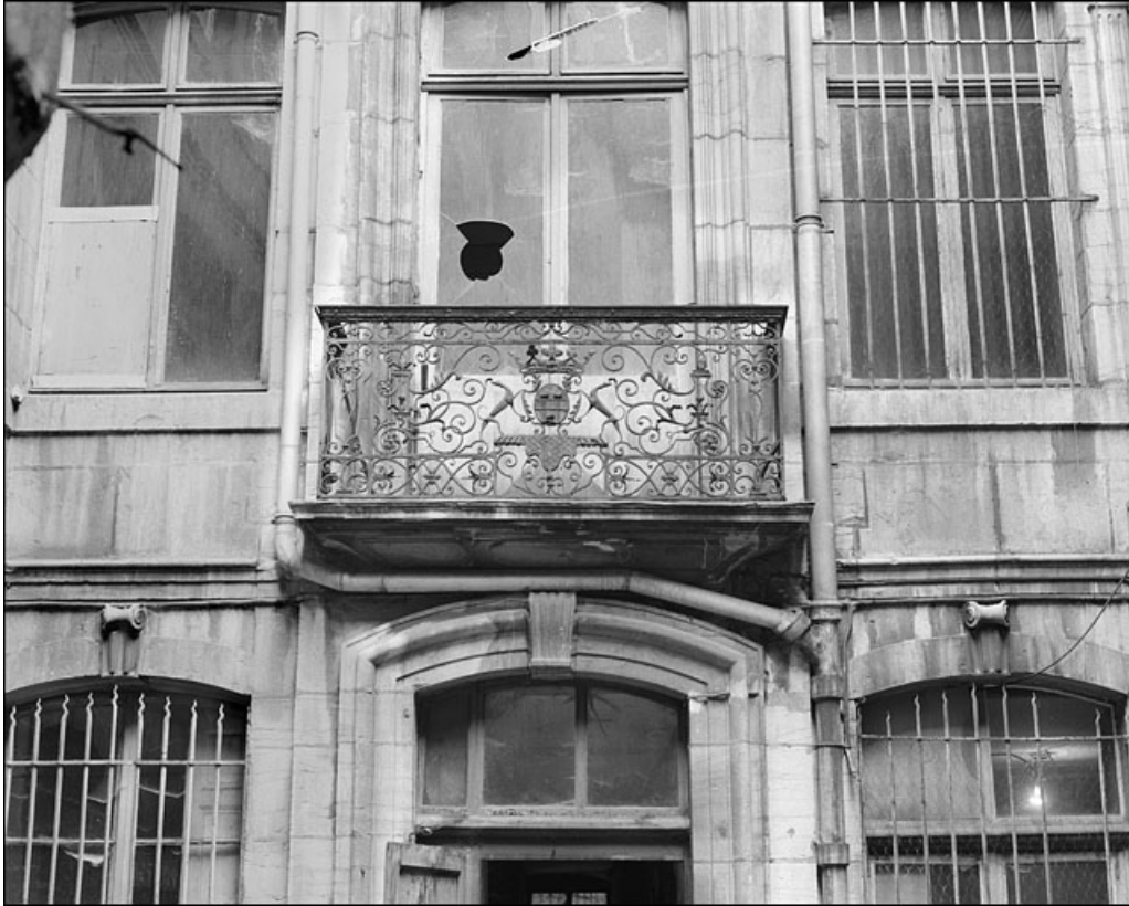
Logis en fond de cour : détail du balcon en ferronnerie, vue éloignée.

25, Besançon Grande Rue 67, lieudit : îlot Saint-Pierre