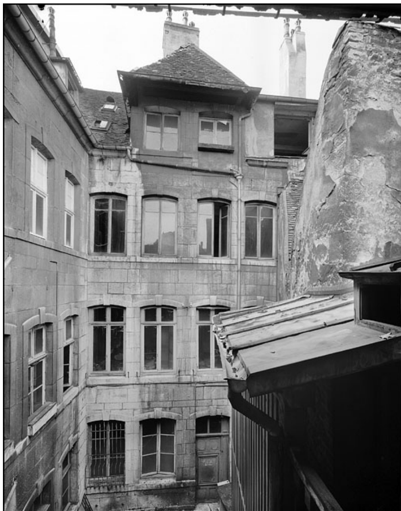
Vue d'ensemble des bâtiments détruits depuis le fond de la deuxième cour, de face. 25, Besançon Grande Rue 67, lieudit : îlot Saint-Pierre