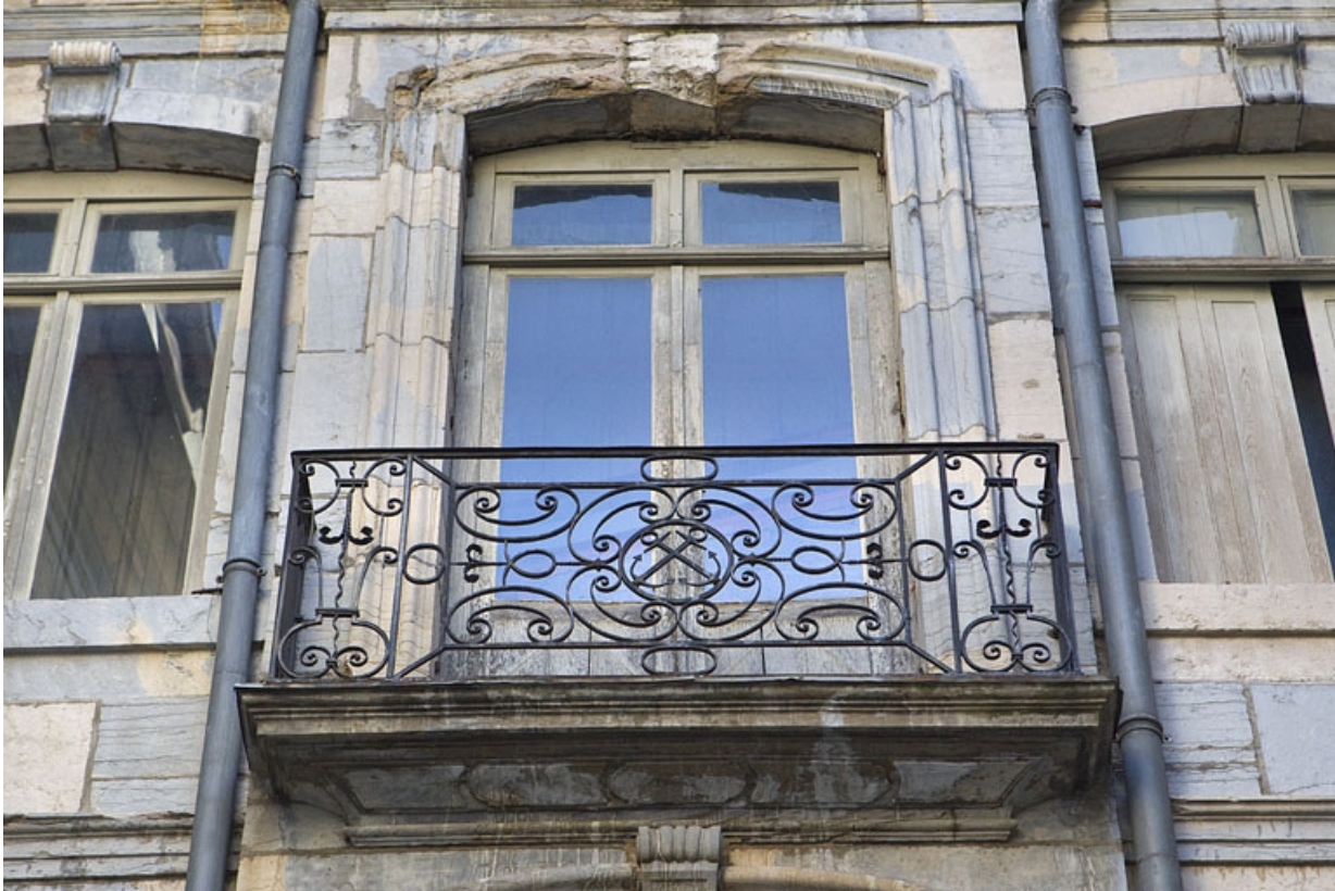
Façade antérieure en fond de cour : détail du balcon du deuxième étage.

25, Besançon Grande Rue 67, lieudit : îlot Saint-Pierre