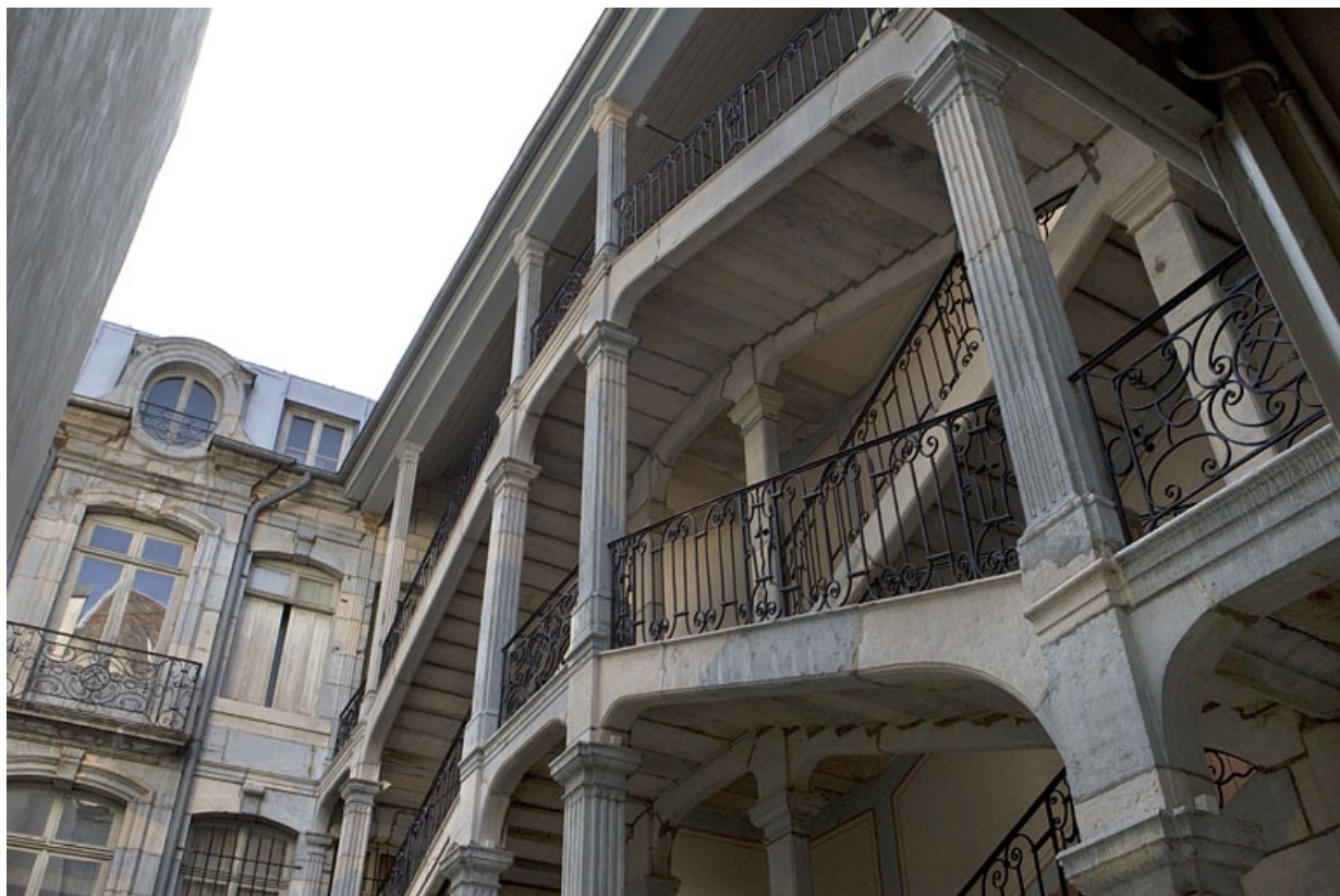
Escalier à cage ouverte : détail de la partie supérieure, de trois quarts droit.

25, Besançon Grande Rue 67, lieudit : îlot Saint-Pierre