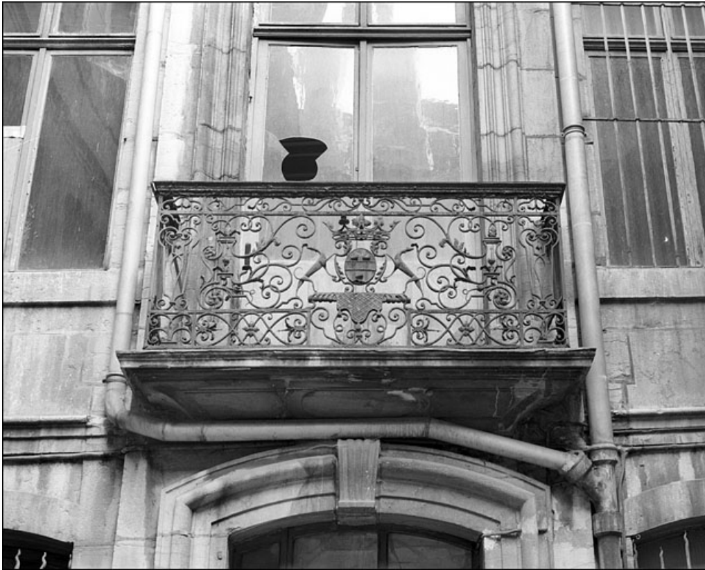
Logis en fond de cour : détail du balcon en ferronnerie.

25, Besançon Grande Rue 67, lieudit : îlot Saint-Pierre