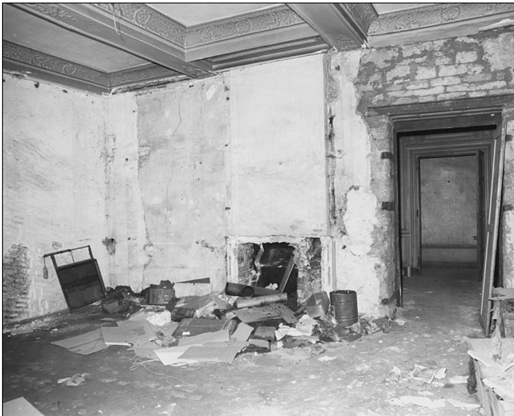
Intérieur : détail de l'angle d'une pièce avec le plafond.

25, Besançon Grande Rue 67, lieudit : îlot Saint-Pierre