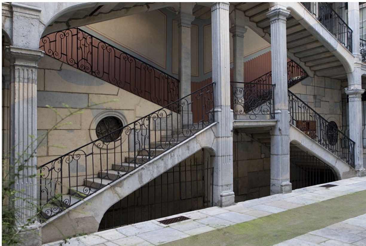
Escalier à cage ouverte : détail du rez-de-chaussée, de trois quarts gauche. 25, Besançon Grande Rue 67, lieudit : îlot Saint-Pierre