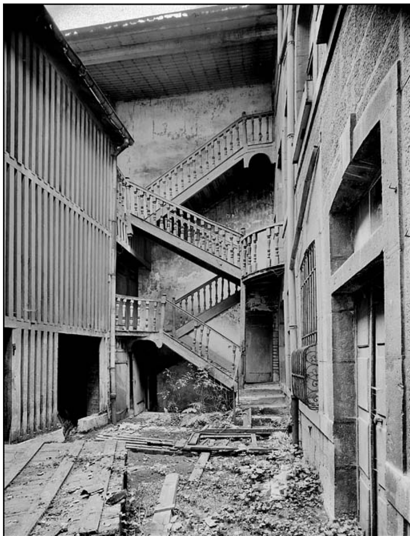
Vue éloignée du bûcher et de l'escalier détruits situés dans la deuxième cour. 25, Besançon Grande Rue 67, lieudit : îlot Saint-Pierre