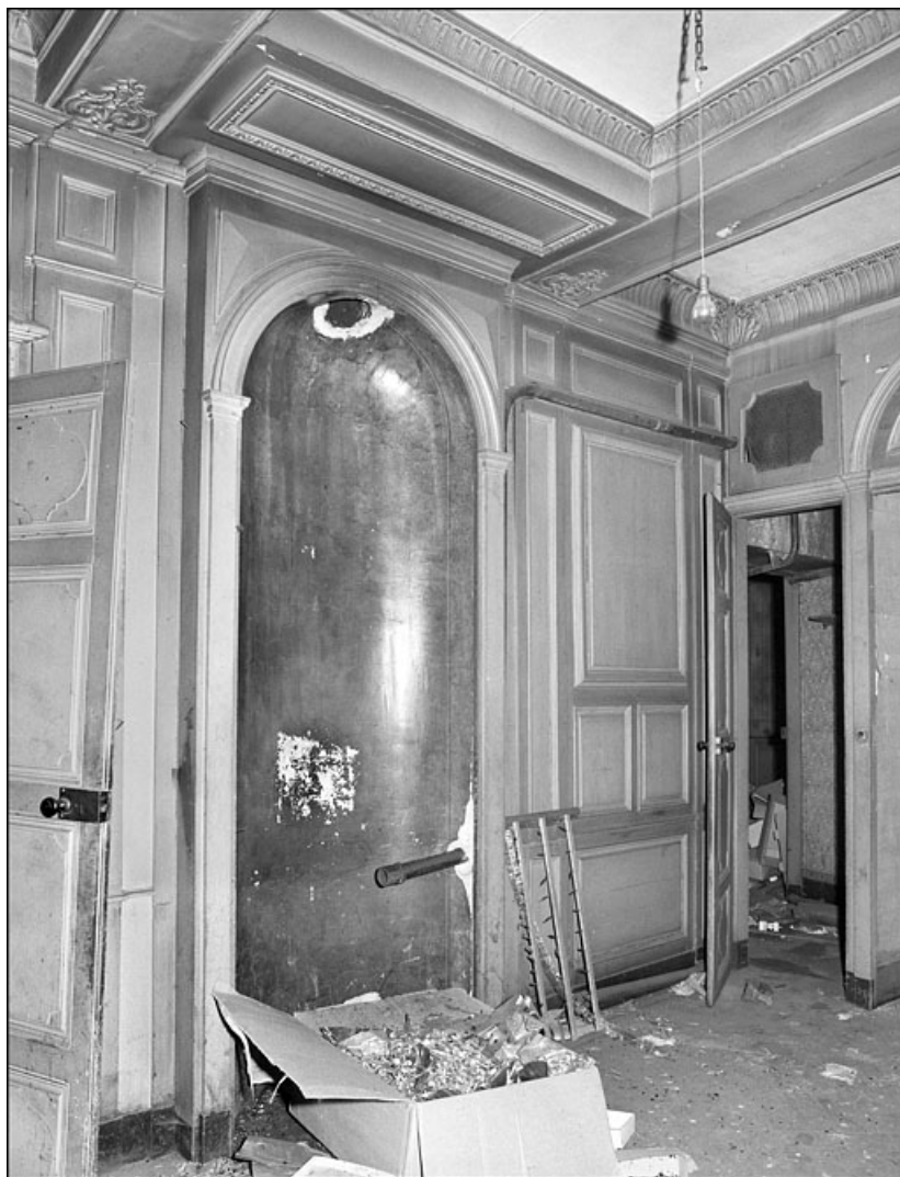
Intérieur : détail d'une niche de poêle, vue éloignée. 25, Besançon Grande Rue 67, lieudit : îlot Saint-Pierre