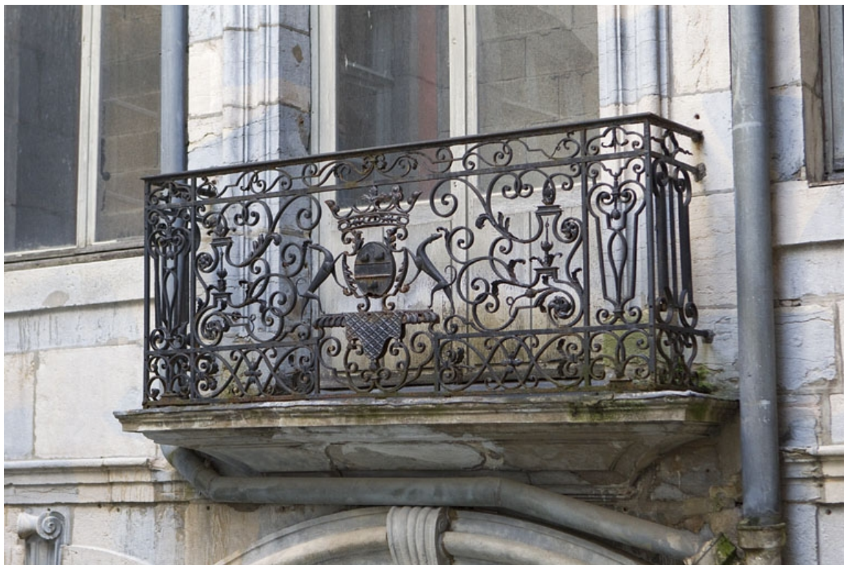
Façade antérieure en fond de cour : détail du balcon du premier étage.

25, Besançon Grande Rue 67, lieudit : îlot Saint-Pierre