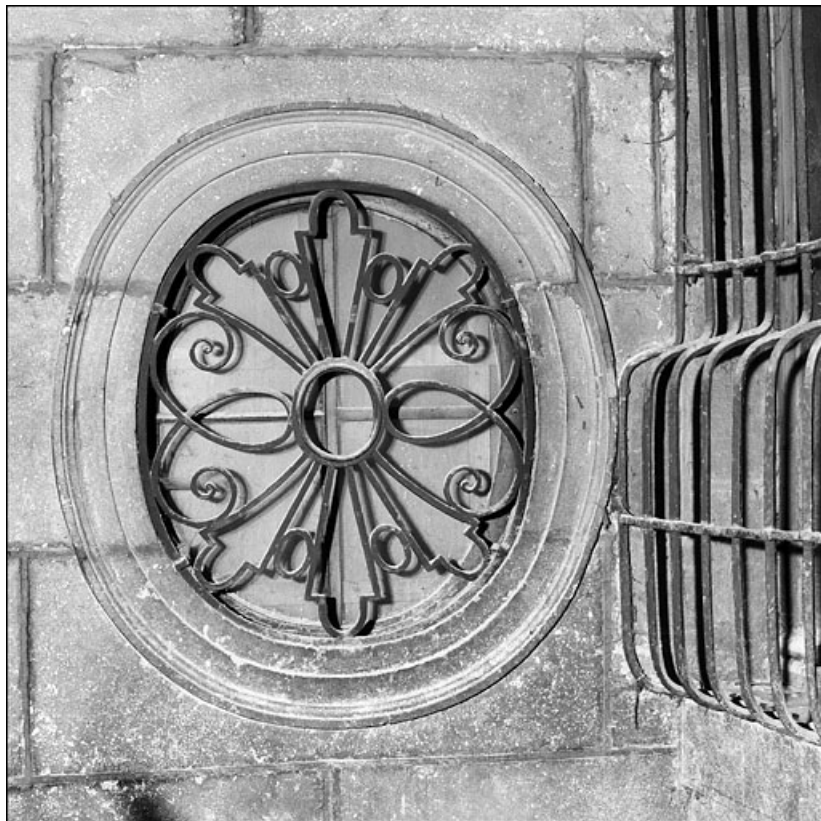
Escalier à cage ouverte : détail d'un oculus, de face.

25, Besançon Grande Rue 67, lieudit : îlot Saint-Pierre