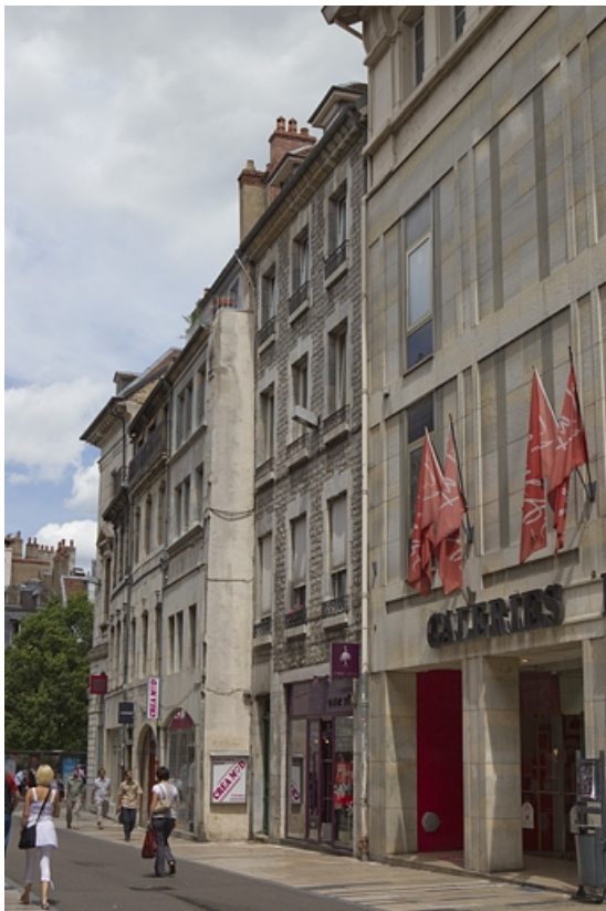
Vue d'ensemble de la façade sur rue de trois quarts droit.

25, Besançon Grande Rue 67, lieudit : îlot Saint-Pierre