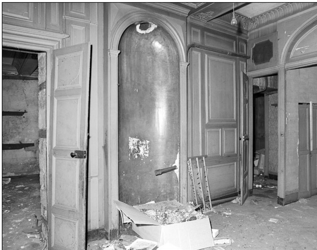
Intérieur : détail d'une niche de poêle.

25, Besançon Grande Rue 67, lieudit : îlot Saint-Pierre