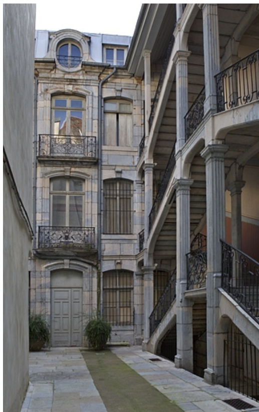
Vue d'ensemble de la façade en fond de cour, de face.

25, Besançon Grande Rue 67, lieudit : îlot Saint-Pierre