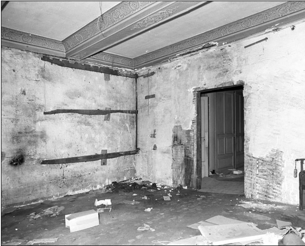
Intérieur : détail de l'angle d'une pièce.

25, Besançon Grande Rue 67, lieudit : îlot Saint-Pierre