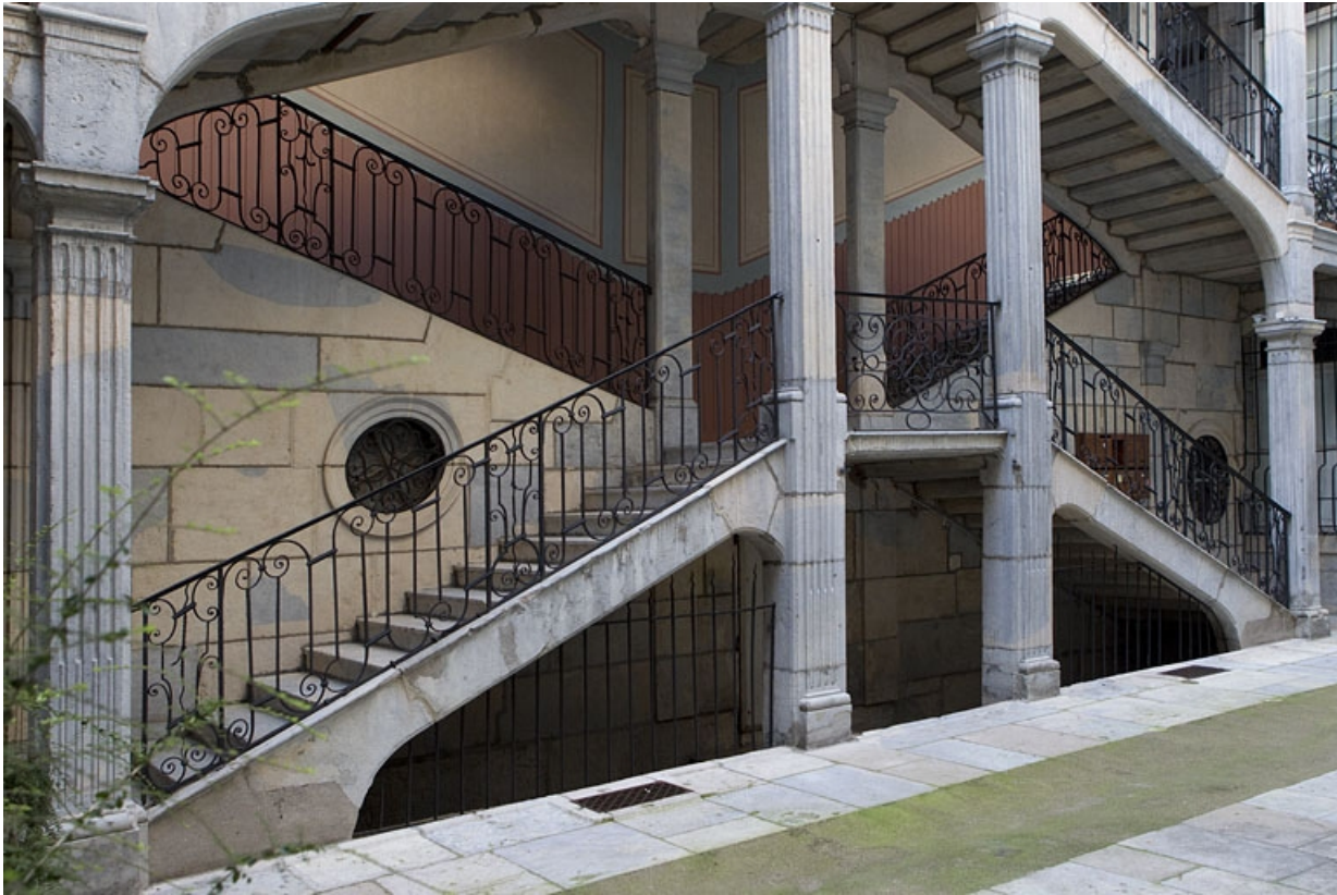
Escalier à cage ouverte : détail du rez-de-chaussée, de trois quarts gauche. 25, Besançon Grande Rue 67, lieudit : îlot Saint-Pierre