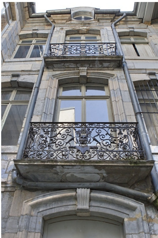
Façade antérieure en fond de cour : détail des balcon de la travée centrale.

25, Besançon Grande Rue 67, lieudit : îlot Saint-Pierre