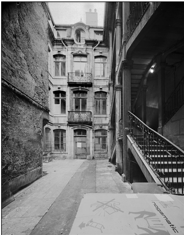
Vue d'ensemble du logis en fond de cour.

25, Besançon Grande Rue 67, lieudit : îlot Saint-Pierre