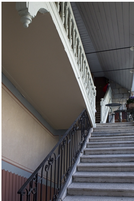
Escalier à cage ouverte : détail de la dernière volée en charpente.

25, Besançon Grande Rue 67, lieudit : îlot Saint-Pierre