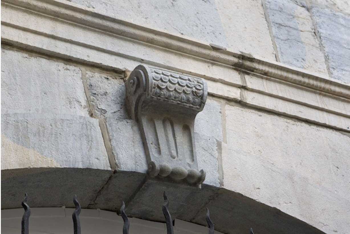
Façade antérieure en fond de cour : détail d'une clé de fenêtre.

25, Besançon Grande Rue 67, lieudit : îlot Saint-Pierre