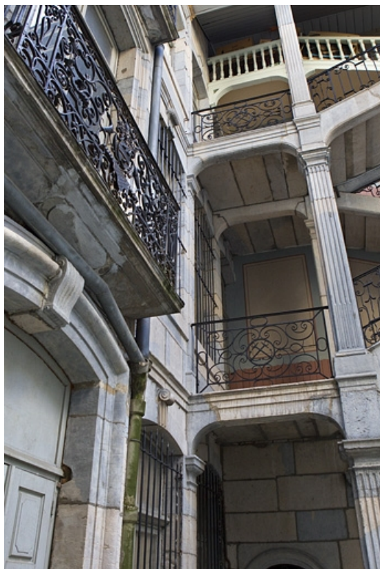
Escalier à cage ouverte : détail de la travée contre la façade du logis en fond de cour.

25, Besançon Grande Rue 67, lieudit : îlot Saint-Pierre