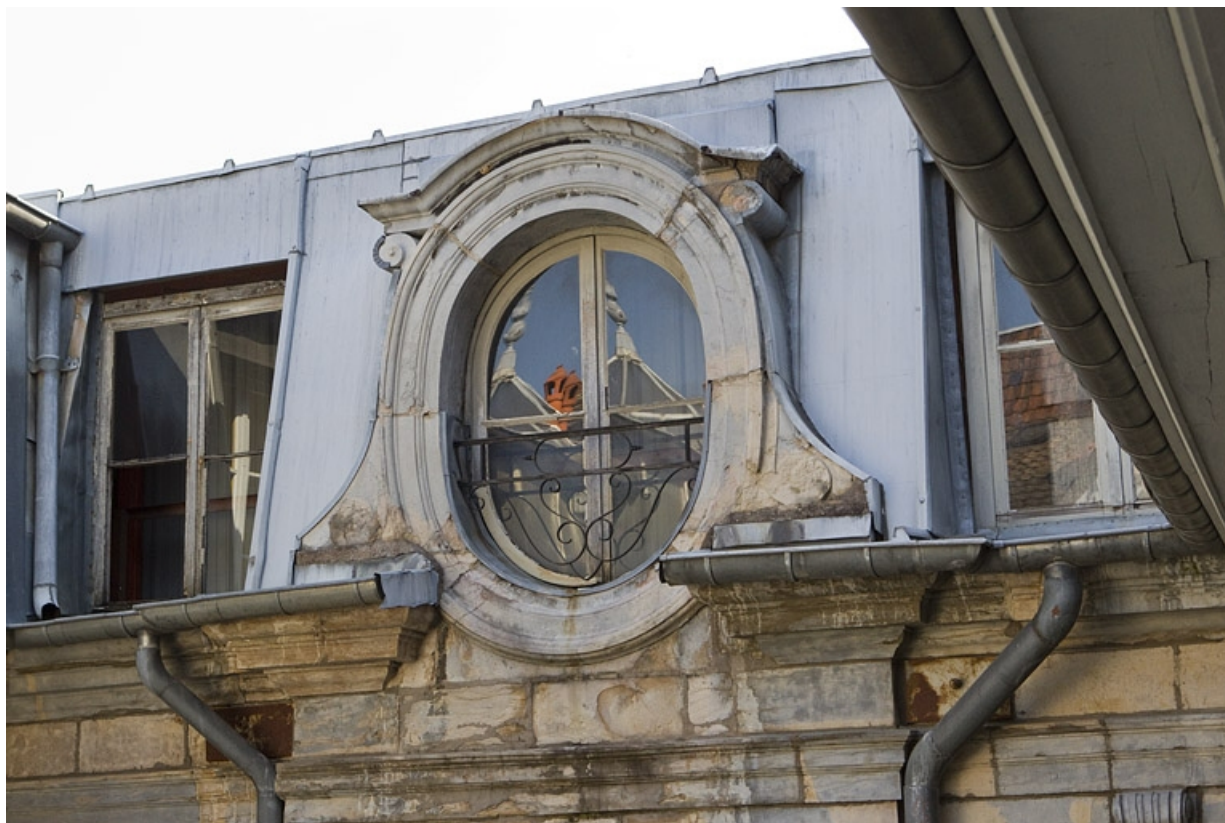
Façade en fond de cour : détail de la lucarne centrale, vue rapprochée.

25, Besançon Grande Rue 67, lieudit : îlot Saint-Pierre