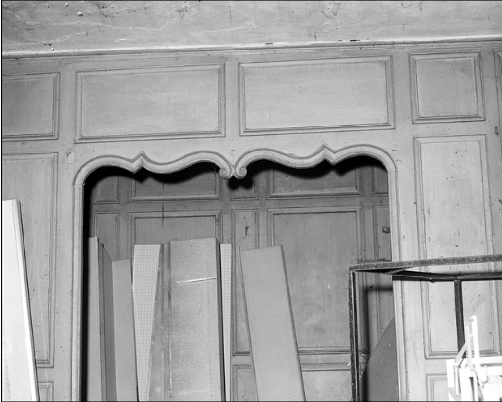
Intérieur : détail d'une alcôve.

25, Besançon Grande Rue 67, lieudit : îlot Saint-Pierre