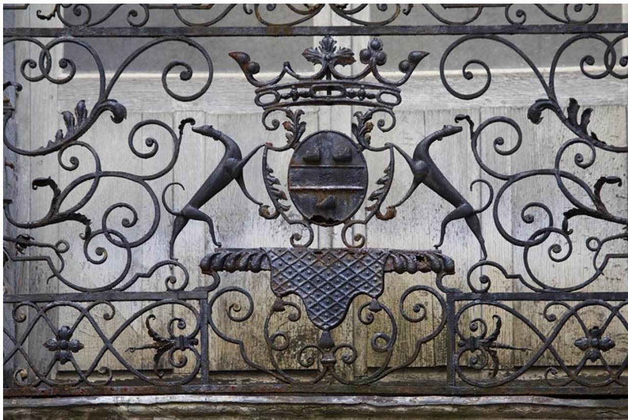
Façade antérieure en fond de cour : détail des armoiries, balcon du premier étage.

25, Besançon Grande Rue 67, lieudit : îlot Saint-Pierre