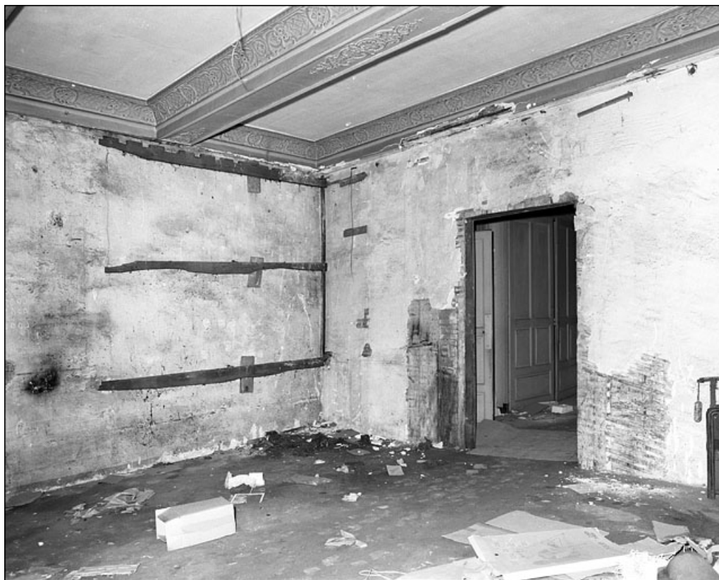
Intérieur : détail de l'angle d'une pièce.

25, Besançon Grande Rue 67, lieudit : îlot Saint-Pierre