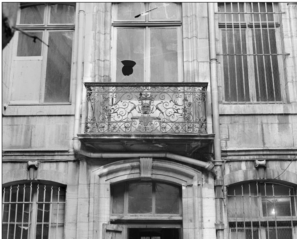
Logis en fond de cour : détail du balcon en ferronnerie, vue éloignée.

25, Besançon Grande Rue 67, lieudit : îlot Saint-Pierre