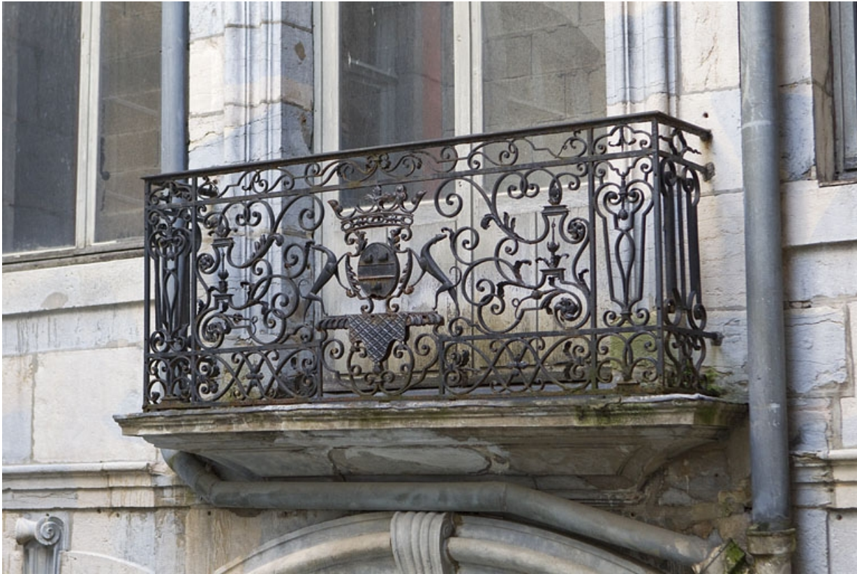
Façade antérieure en fond de cour : détail du balcon du premier étage.

25, Besançon Grande Rue 67, lieudit : îlot Saint-Pierre