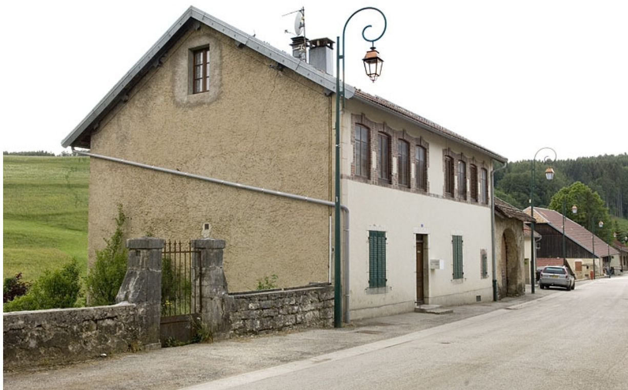
Façade antérieure et façade latérale gauche, côté rue du Faubourg. 25, Jougne, 7 rue du Faubourg