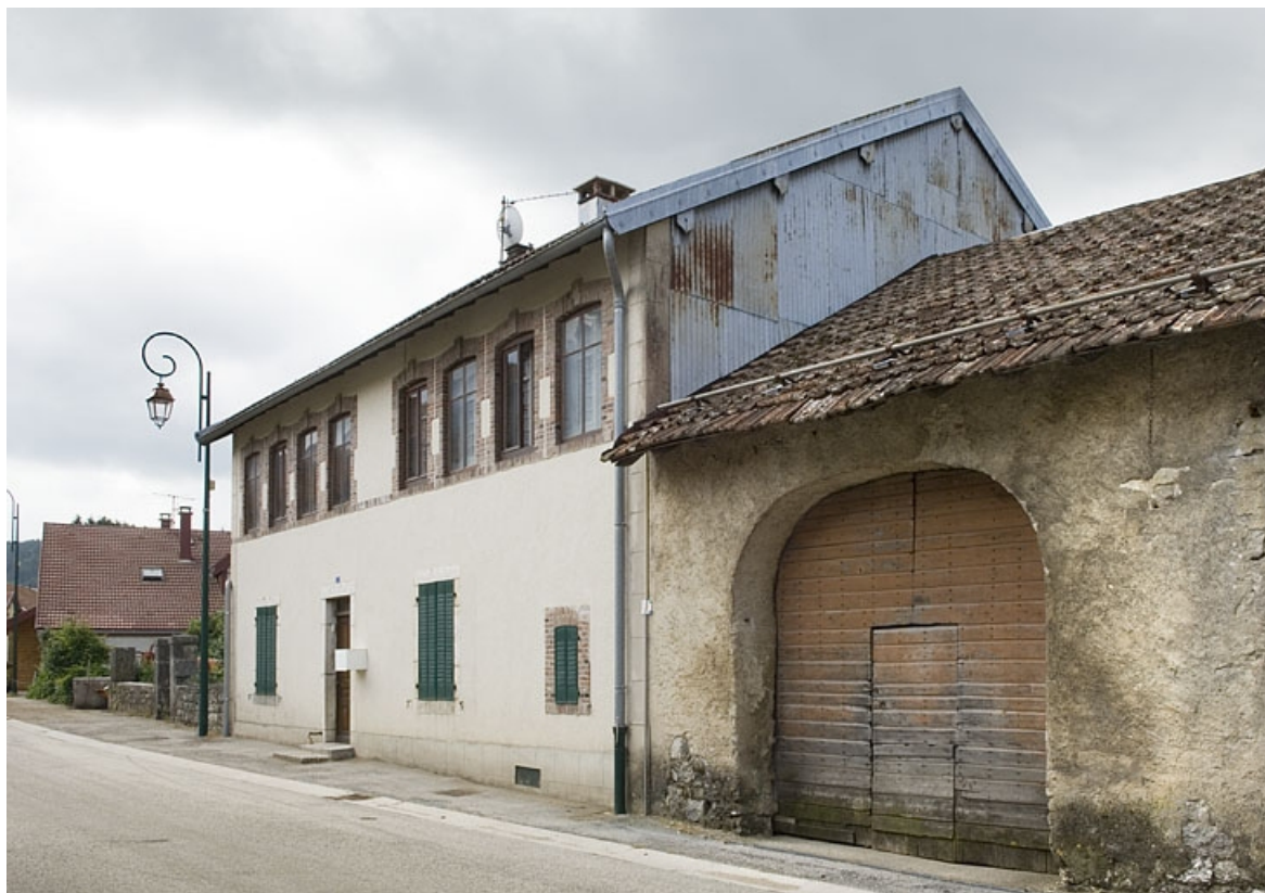
Vue de trois quart droit du côté de la rue du Faubourg. 25, Jougne, 7 rue du Faubourg