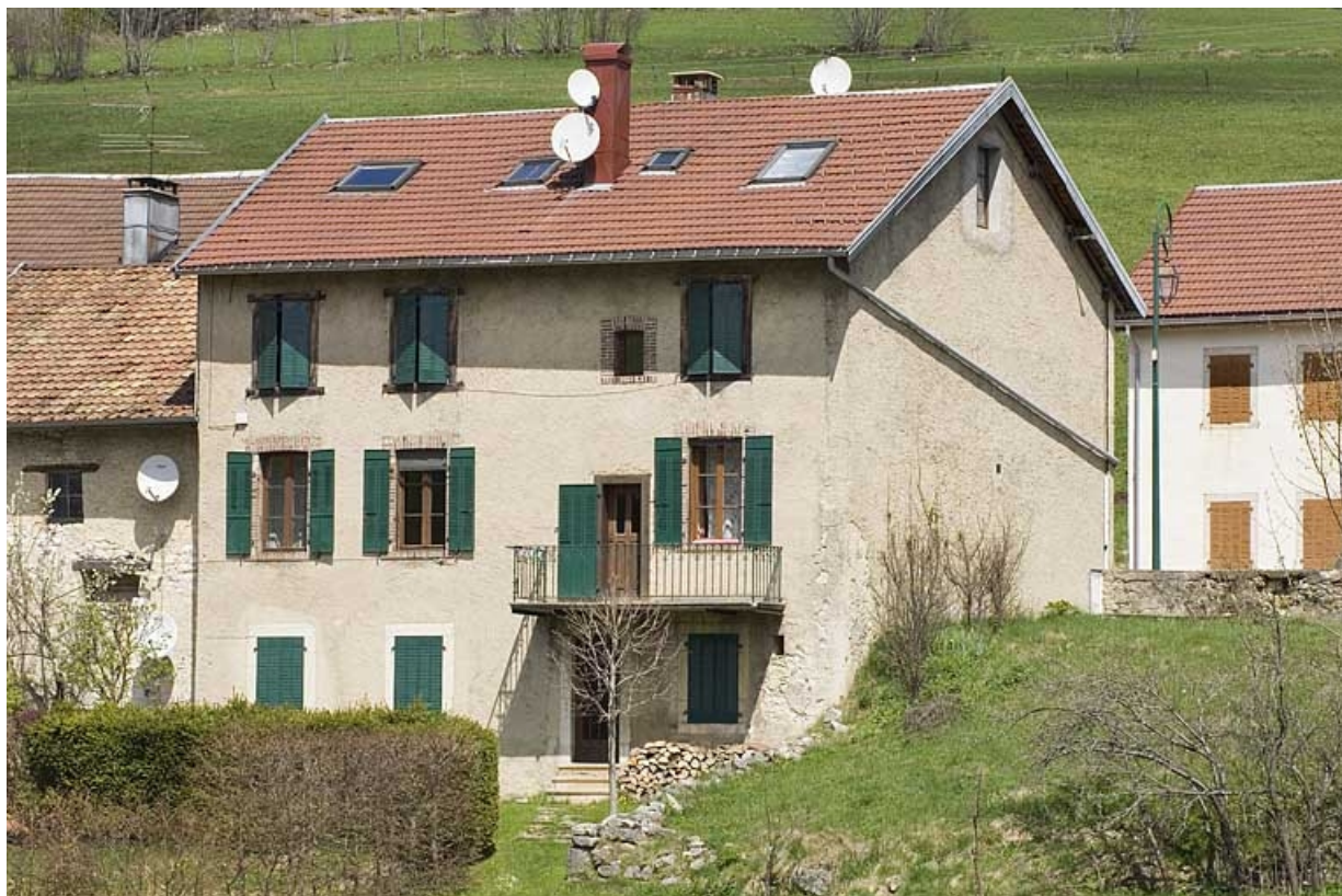
Façade postérieure du côté de la route des Alpes.