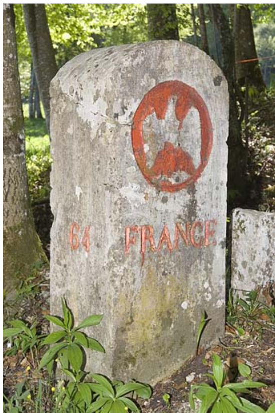
Borne frontalière n° 64 ornée de l'aigle impérial, côté France. 25, Jougne