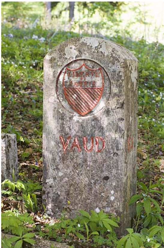
Borne frontalière n° 64 ornée de l'écu du Pays de Vaud, côté Suisse. 25, Jougne