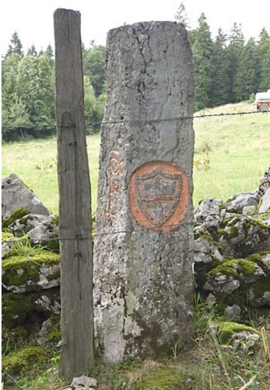
Borne n° 43 : écu du canton de Vaud côté Suisse. 25, Jougne