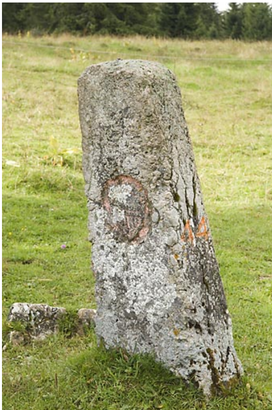
Borne n° 44 : écu du canton de Vaud côté Suisse. 25, Jougne