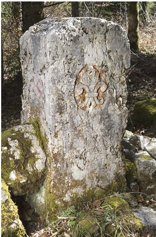
Borne frontalière n°19 ornée de la fleur de lys, côté France. 25, Jougne