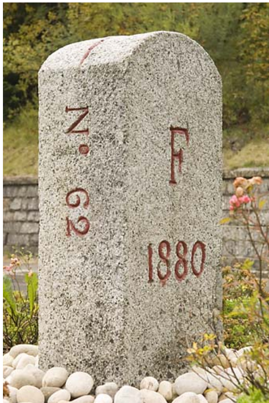
Borne n° 62, en granite : côté France. 25, Jougne