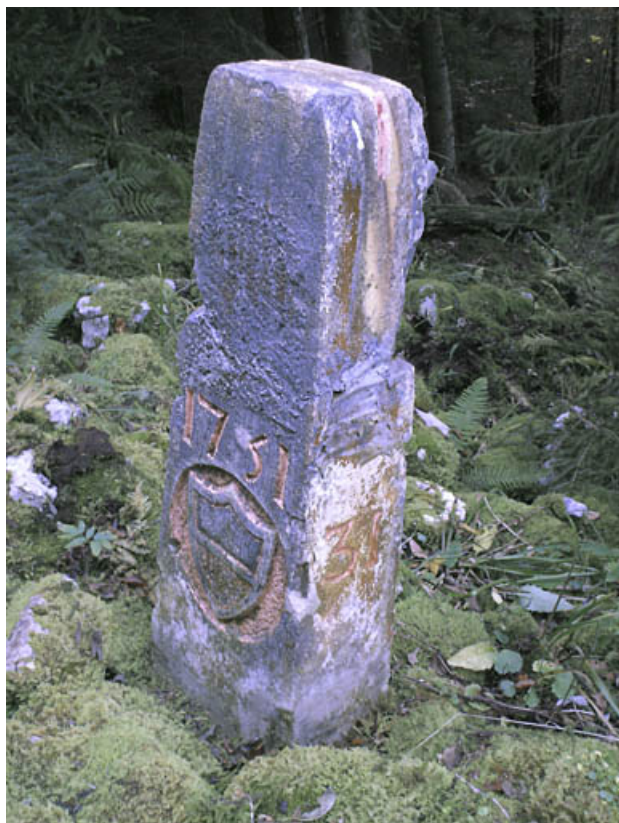
Borne n° 31 : écu du canton de Vaud côté Suisse. 25, Jougne