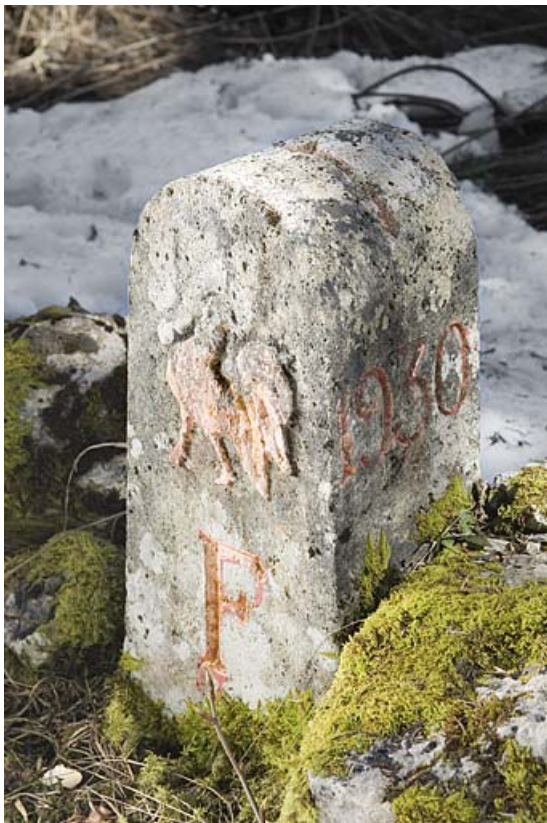
borne frontalière n° 20.