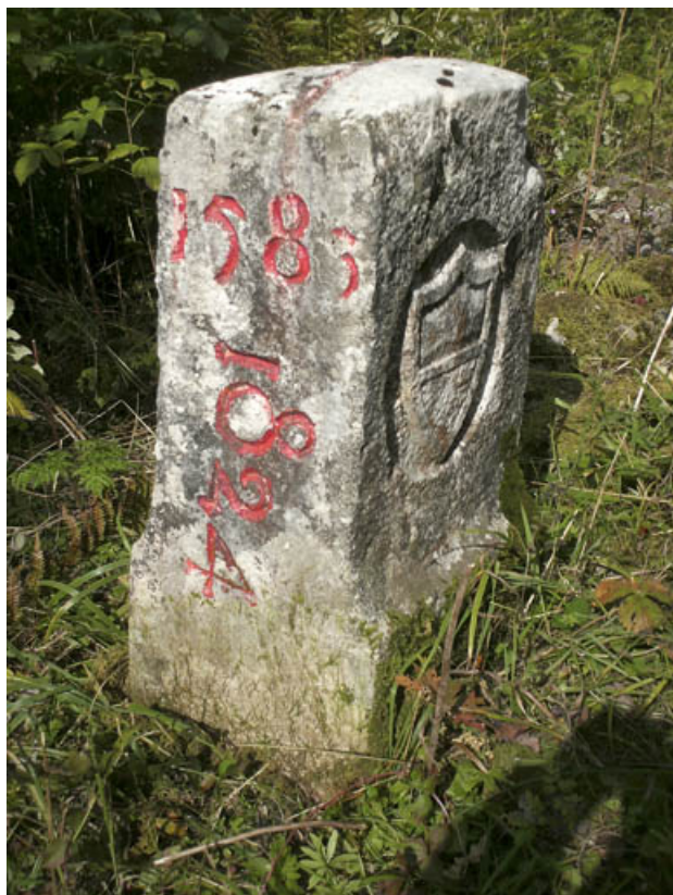
Borne n° 27 : écu du canton de Vaud côté Suisse. 25, Jougne