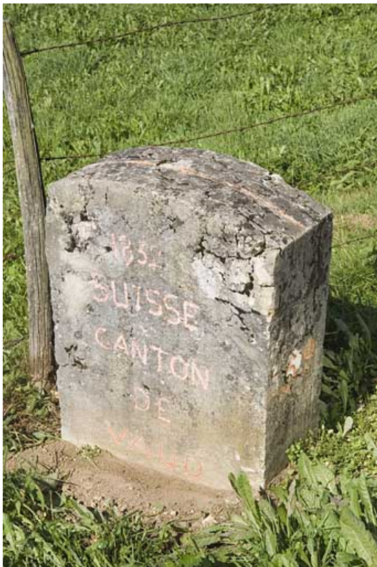
Borne n° 59 : inscription côté Suisse.