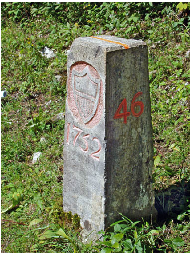
Borne n° 46 : écu du canton de Vaud côté Suisse. 25, Jougne