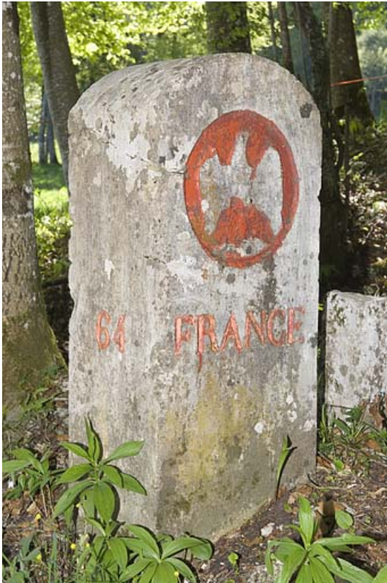
Borne frontalière n° 64 ornée de l'aigle impérial, côté France. 25, Jougne