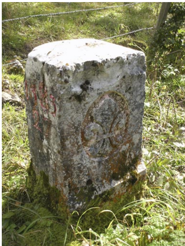
Borne n° 27 : fleur de lys côté France.