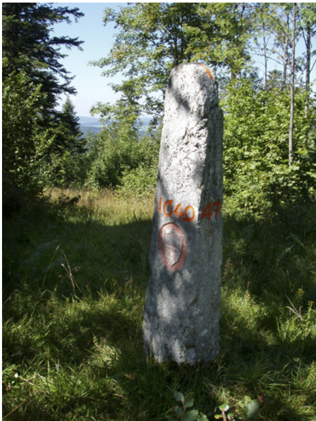
Borne n° 47 : écu du canton de Vaud côté Suisse. 25, Jougne