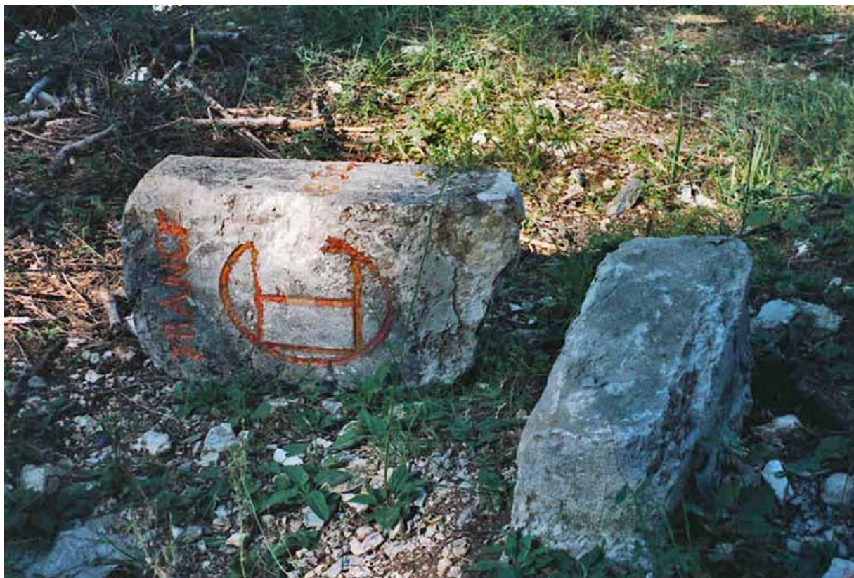
Borne cassée : décor au livre ouvert, côté France.