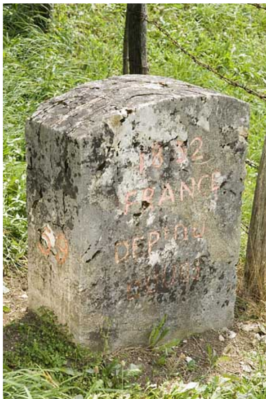
Borne n° 59 : inscription côté France. 25, Jougne