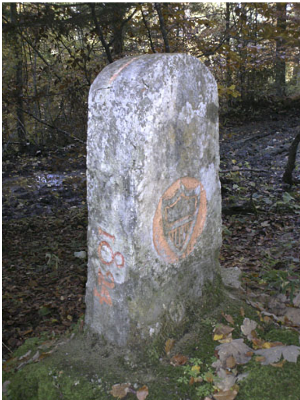
Borne n° 34 : écu du canton de Vaud côté Suisse. 25, Jougne