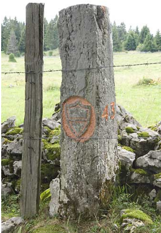
Borne n° 43 : écu du canton de Vaud côté Suisse. 25, Jougne