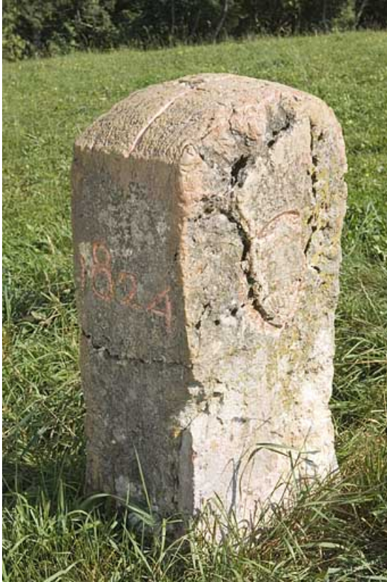
Borne n° 60 : côté Suisse.