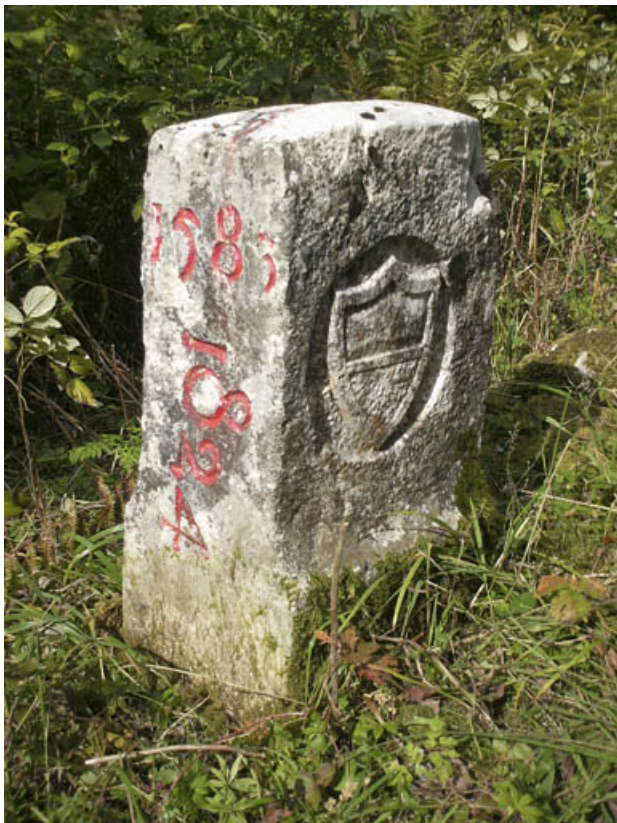
Borne n° 27 : écu du canton de Vaud côté Suisse. 25, Jougne