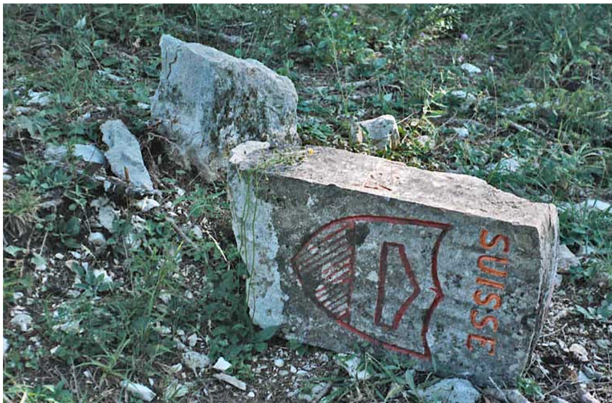
Borne cassée : écu côté Suisse.