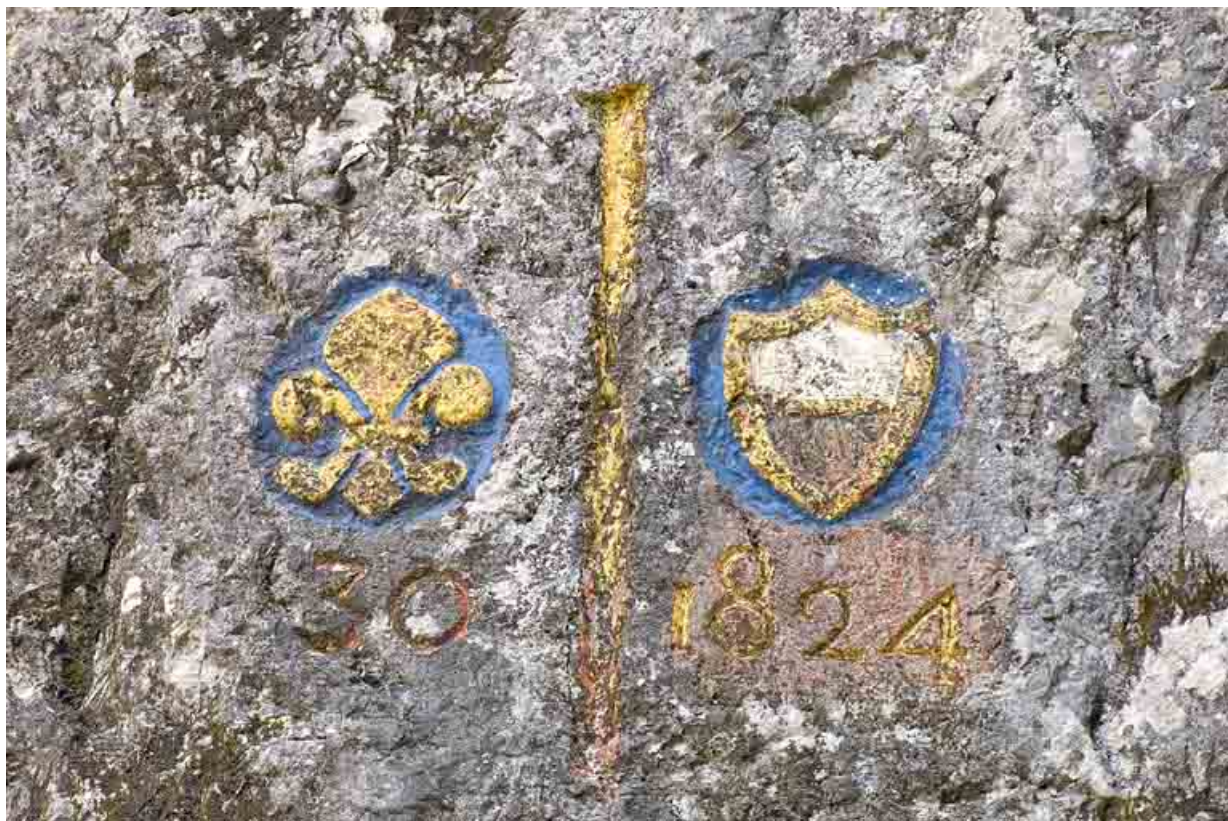
Borne frontalière n° 30.