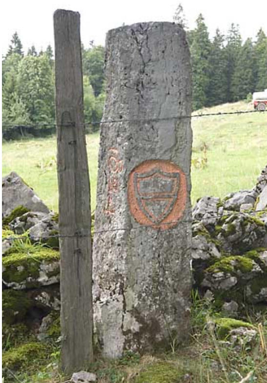
Borne n° 43 : écu du canton de Vaud côté Suisse. 25, Jougne