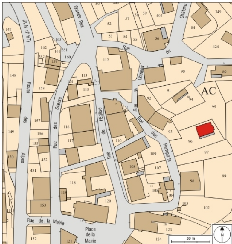
Plan masse et de situation. Extrait du plan cadastral, 2008, section AC, échelle 1:1 000. 25, Jougne, 6 rue des Remparts