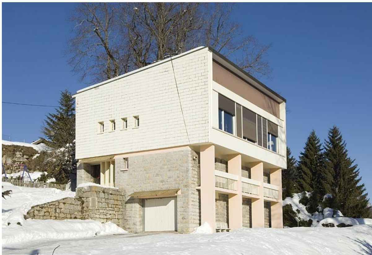
Vue de trois quarts depuis la cour.