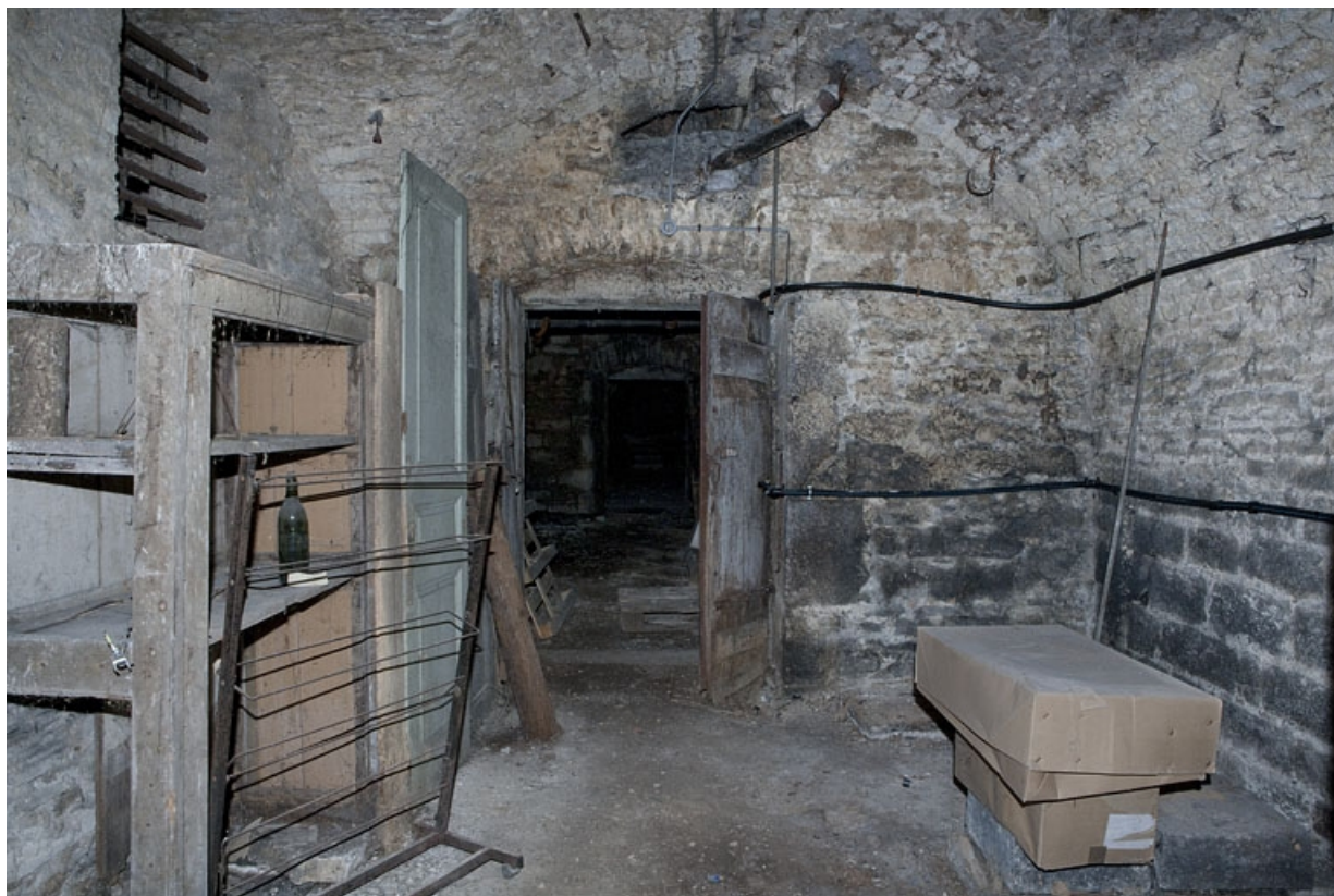
Logis principal, sous-sol : cave A, vue en direction de la porte d'entrée.

25, Besançon Grande Rue 53, lieudit : îlot Bouteiller