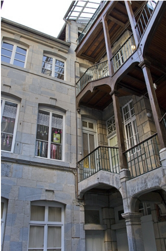
Façade antérieure du premier logis secondaire : vue d'ensemble avec l'escalier à cage ouverte.

25, Besançon Grande Rue 53, lieudit : îlot Bouteiller