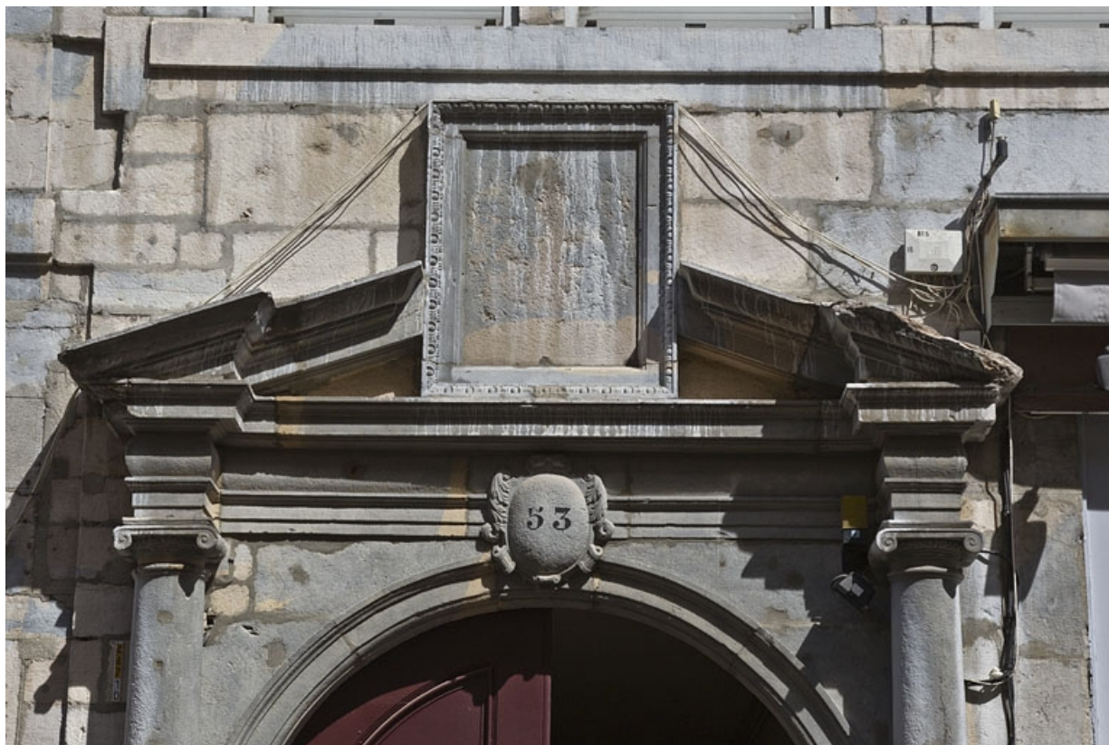
Façade antérieure du logis principal, portail d'entrée : détail du fronton interrompu à tabernacle. 25, Besançon Grande Rue 53, lieudit : îlot Bouteiller