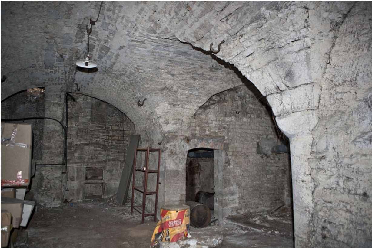
Logis principal, sous-sol : cave A depuis le fond de trois quarts droit.

25, Besançon Grande Rue 53, lieudit : îlot Bouteiller