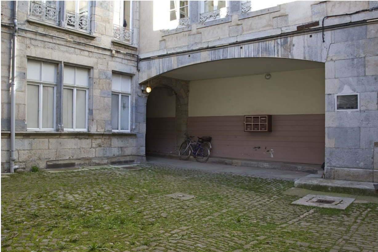
Débouché du passage cocher sur la deuxième cour.

25, Besançon Grande Rue 53, lieudit : îlot Bouteiller