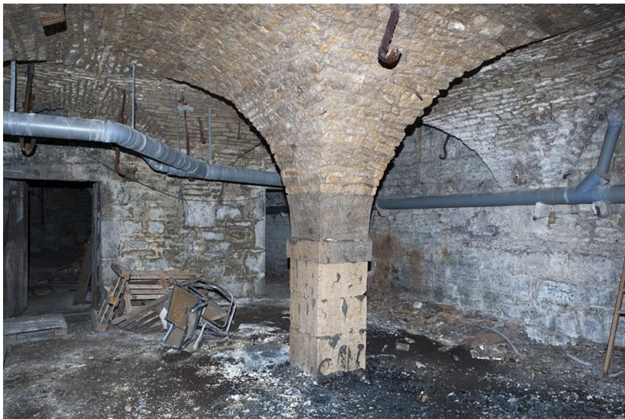
Logis principal, sous-sol : cave B, vue d'ensemble, depuis le fond.

25, Besançon Grande Rue 53, lieudit : îlot Bouteiller