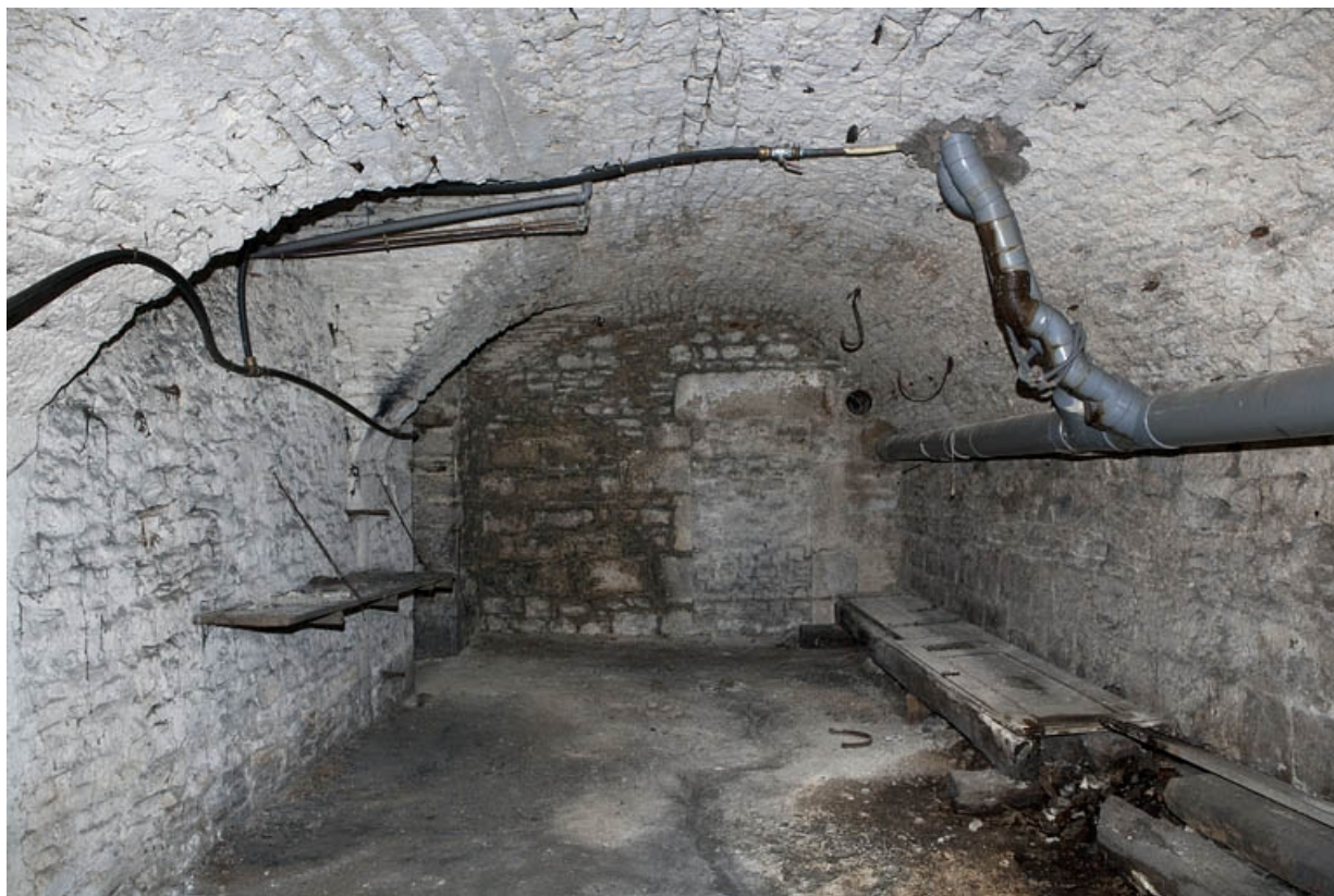
Logis principal, sous-sol : cave C, partie gauche, vue d'ensemble. 25, Besançon Grande Rue 53, lieudit : îlot Bouteiller