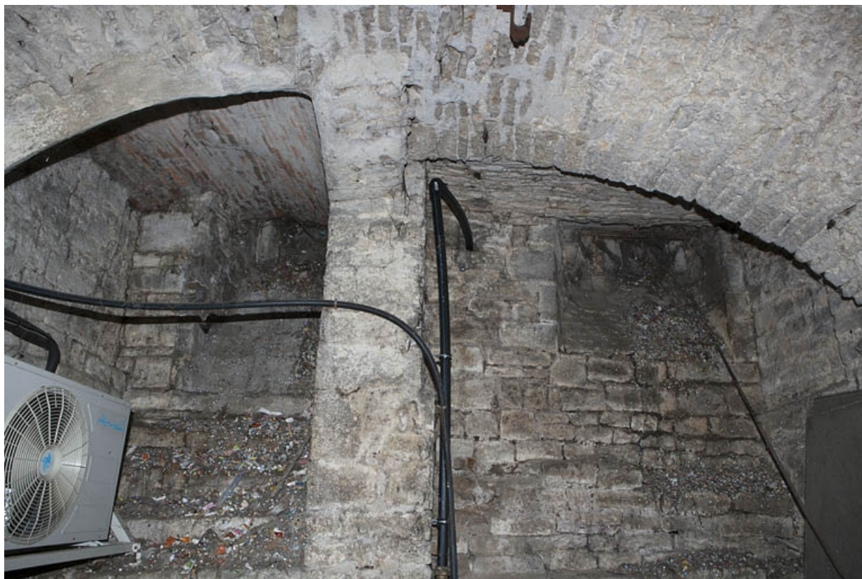
Logis principal, sous-sol : cave A, détail du sopirail sur rue.

25, Besançon Grande Rue 53, lieudit : îlot Bouteiller