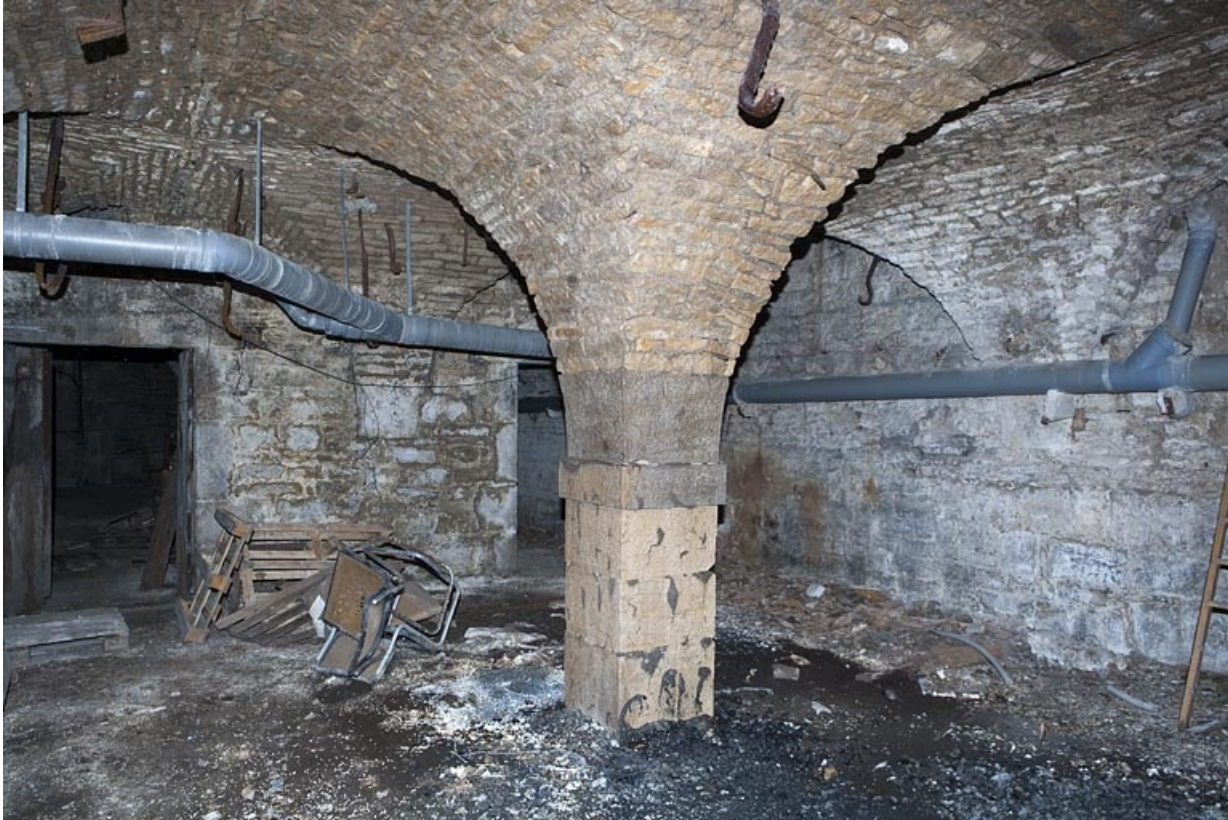
Logis principal, sous-sol : cave B, vue d'ensemble, depuis le fond.

25, Besançon Grande Rue 53, lieudit : îlot Bouteiller