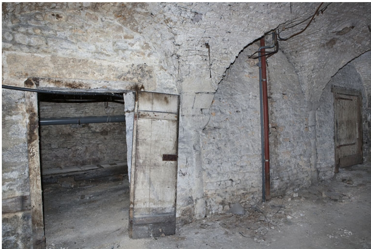
Logis principal, sous-sol : cave C, partie droite, détail de la porte de communication avec la partie gauche. 25, Besançon Grande Rue 53, lieudit : îlot Bouteiller