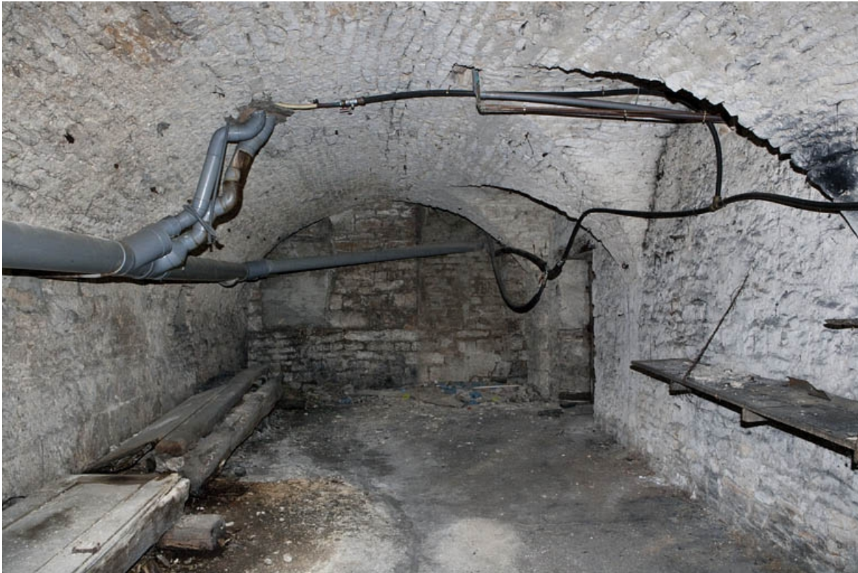
Logis principal, sous-sol : cave C, partie gauche. 25, Besançon Grande Rue 53, lieudit : îlot Bouteiller