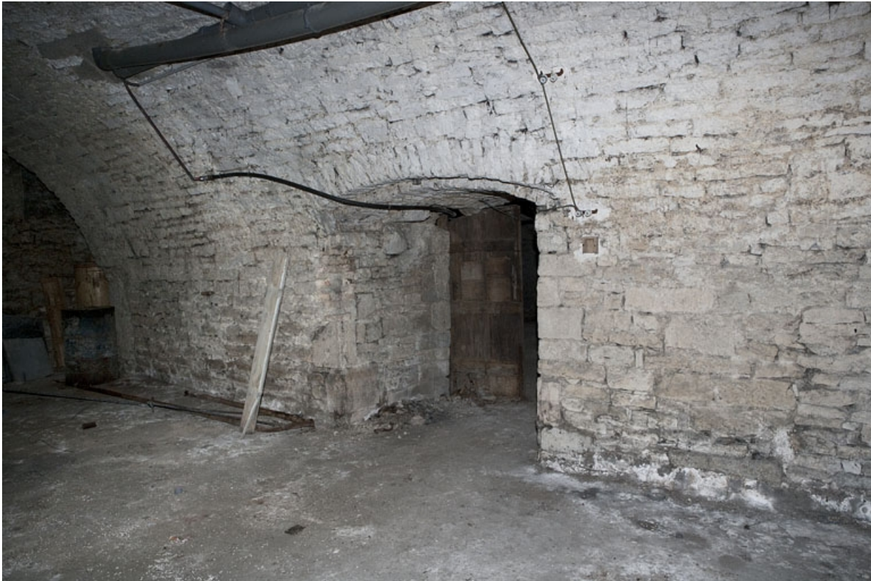
Logis principal, sous-sol : cave D, détail de la porte de communication avec la cave C. 25, Besançon Grande Rue 53, lieudit : îlot Bouteiller