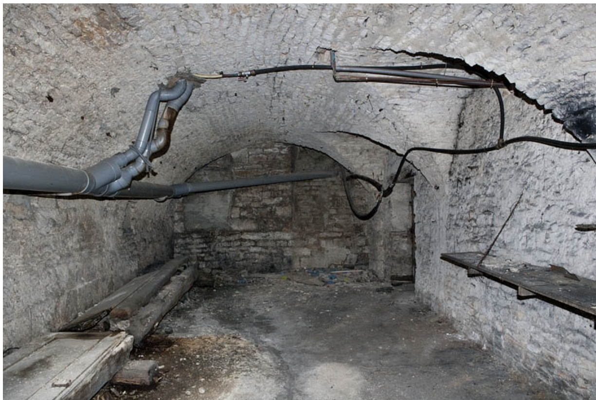
Logis principal, sous-sol : cave C, partie gauche. 25, Besançon Grande Rue 53, lieudit : îlot Bouteiller