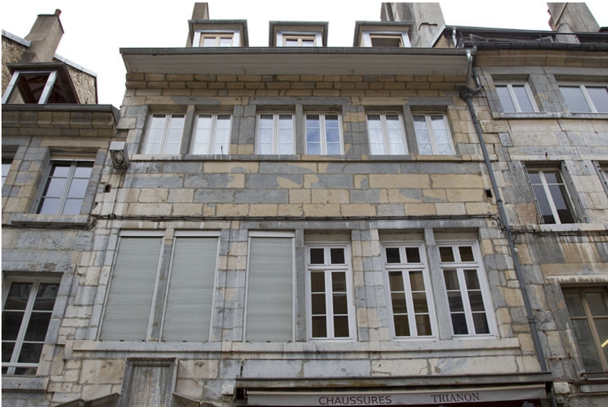
Façade antérieure du logis principal : détail des étages.

25, Besançon Grande Rue 53, lieudit : îlot Bouteiller