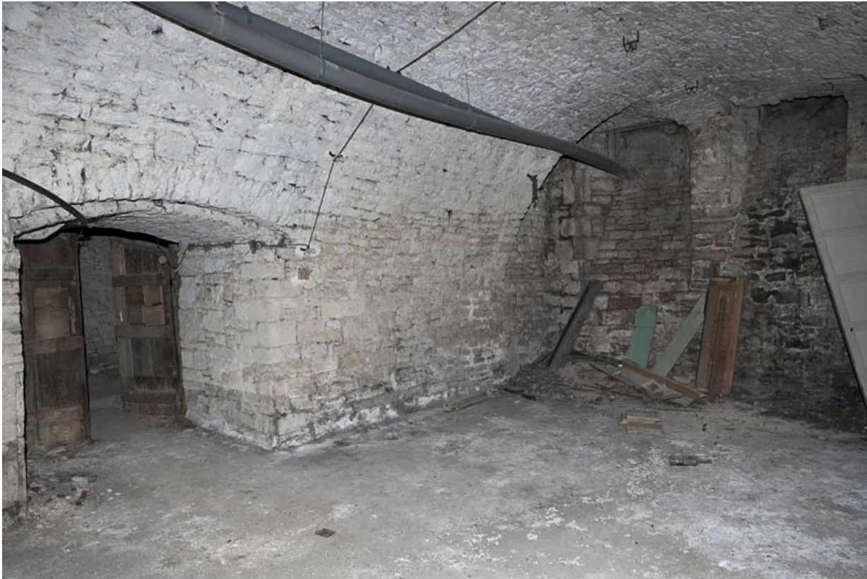
Logis principal, sous-sol : cave D, depuis le fond, de trois quart gauche.

25, Besançon Grande Rue 53, lieudit : îlot Bouteiller