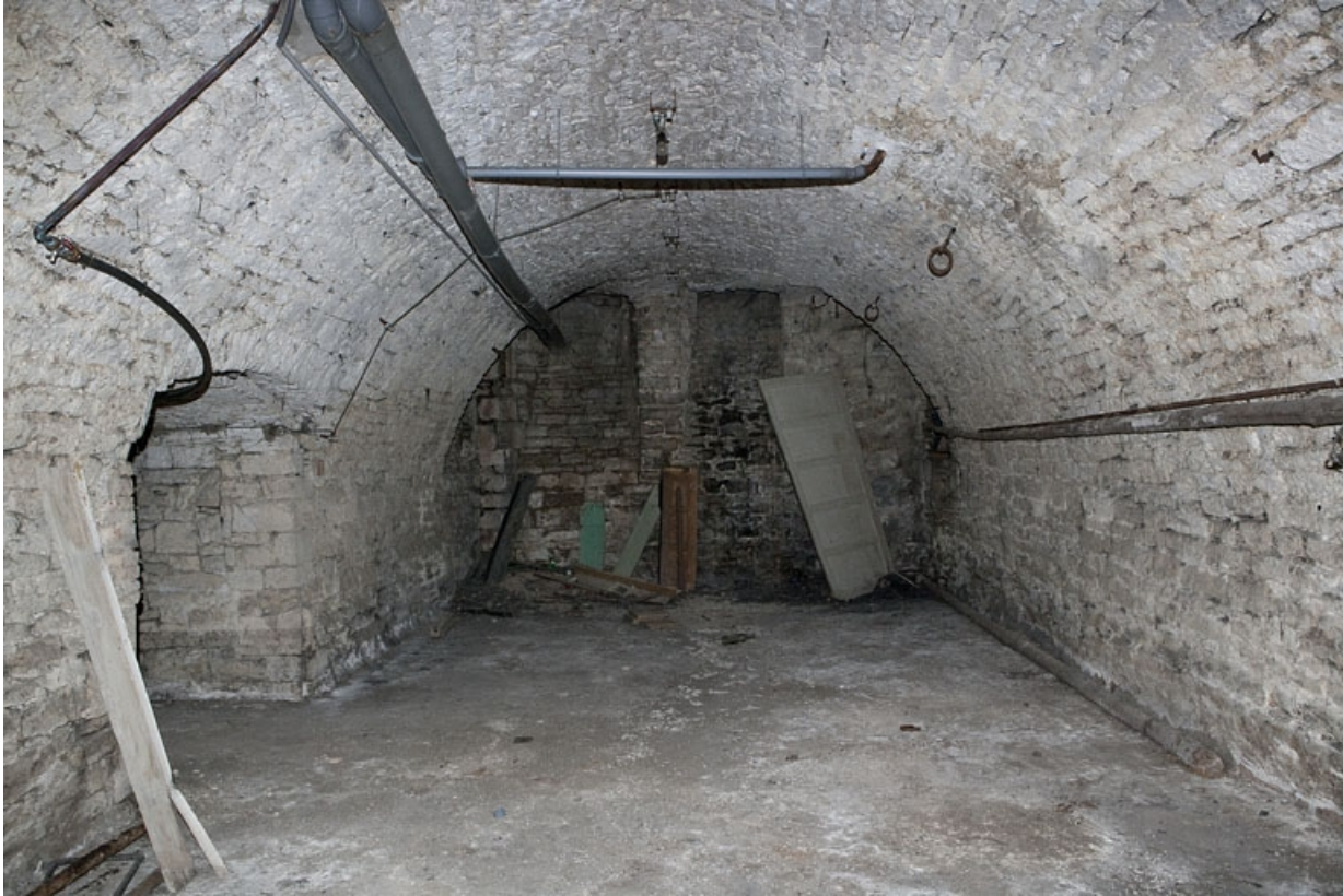
Logis principal, sous-sol : cave D, depuis le fond.

25, Besançon Grande Rue 53, lieudit : îlot Bouteiller