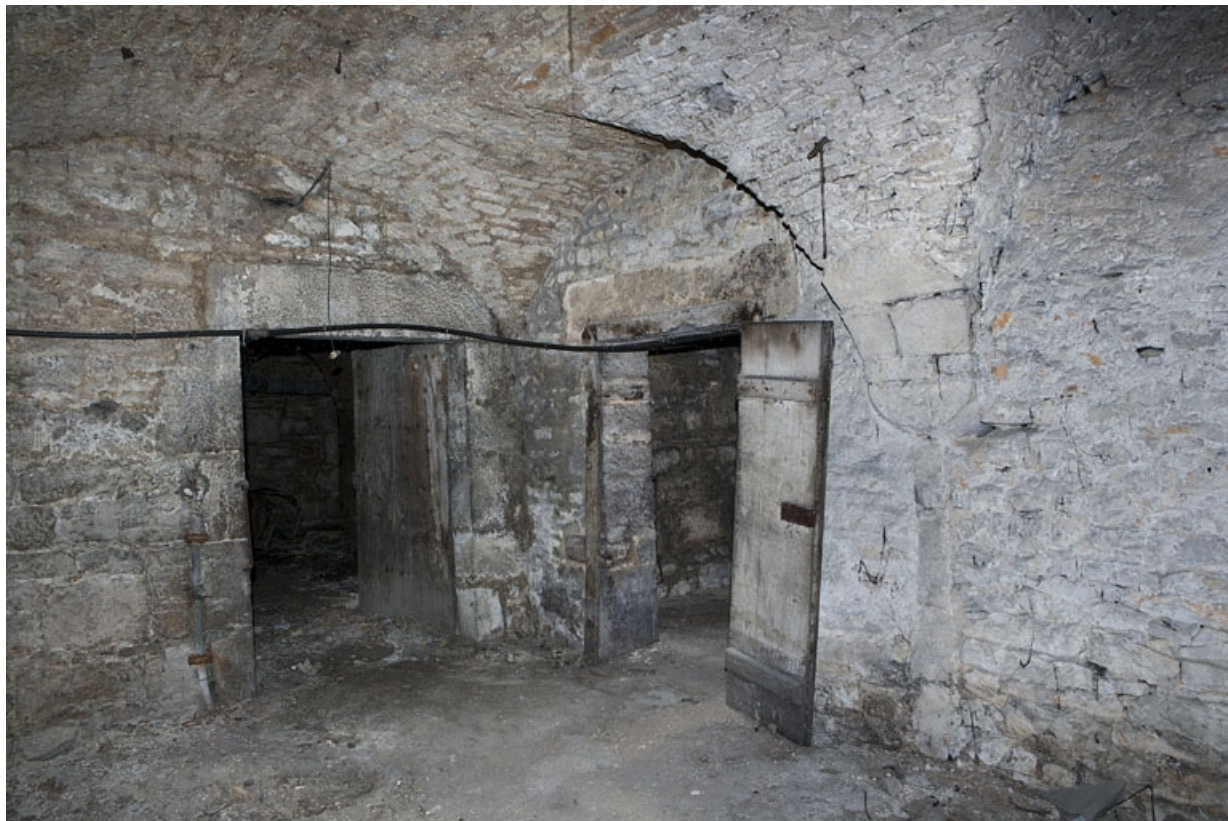
Logis principal, sous-sol : cave C.

25, Besançon Grande Rue 53, lieudit : îlot Bouteiller