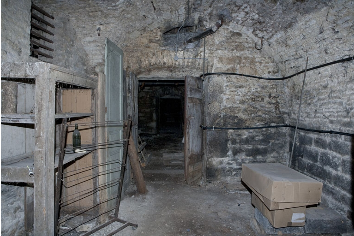
Logis principal, sous-sol : cave A, vue en direction de la porte d'entrée.

25, Besançon Grande Rue 53, lieudit : îlot Bouteiller