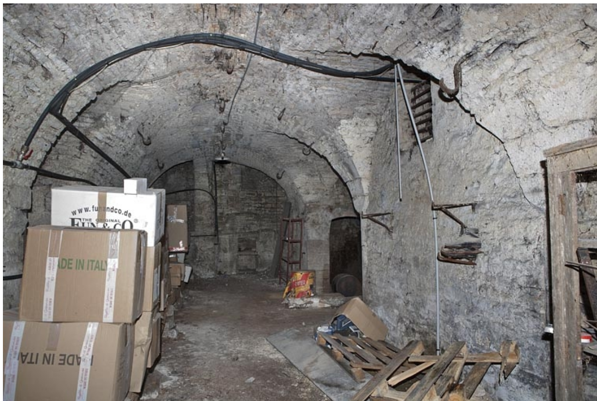
Logis principal, sous-sol : cave A depuis l'entrée. 25, Besançon Grande Rue 53, lieudit : îlot Bouteiller