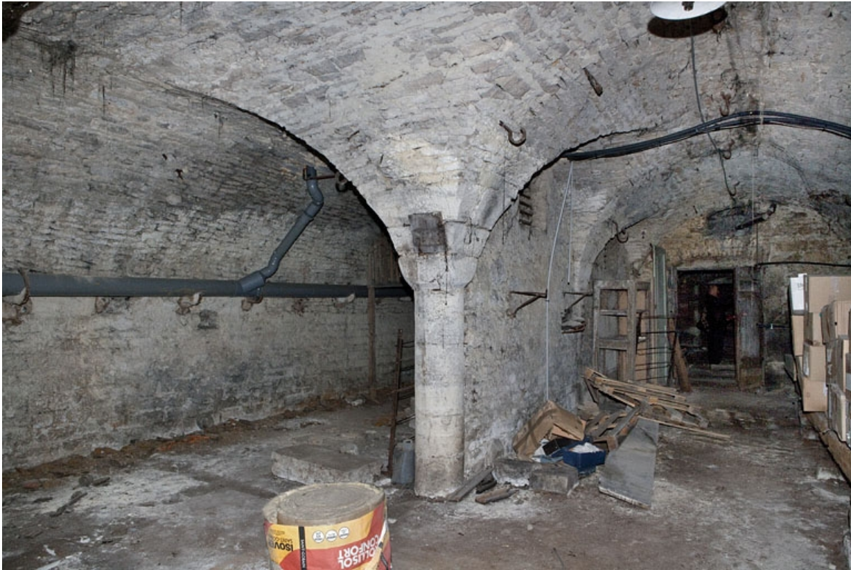
Logis principal, sous-sol : cave A, vue d'ensemble depuis le fond.

25, Besançon Grande Rue 53, lieudit : îlot Bouteiller