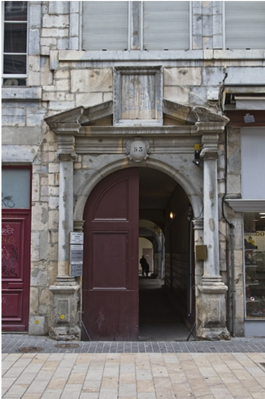
Façade antérieure du logis principal : portail d'entrée, de face.

25, Besançon Grande Rue 53, lieudit : îlot Bouteiller