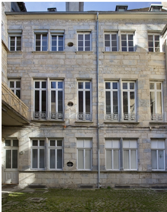
Façade postérieure du premier logis secondaire sur la deuxième cour : de face. 25, Besançon Grande Rue 53, lieu dit : îlot Bouteiller