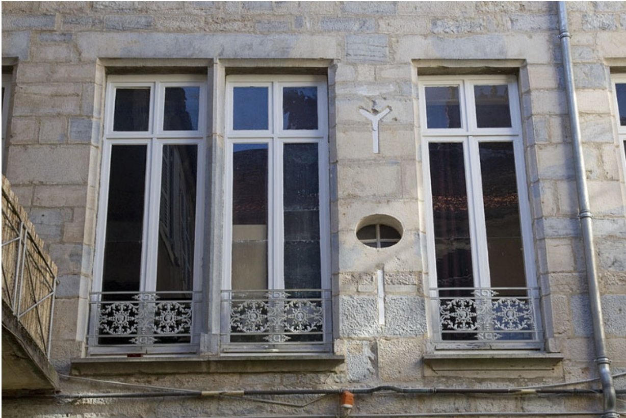
Premier logis secondaire : détail de la forme des fenêtres de la façade postérieure.

25, Besançon Grande Rue 53, lieudit : îlot Bouteiller