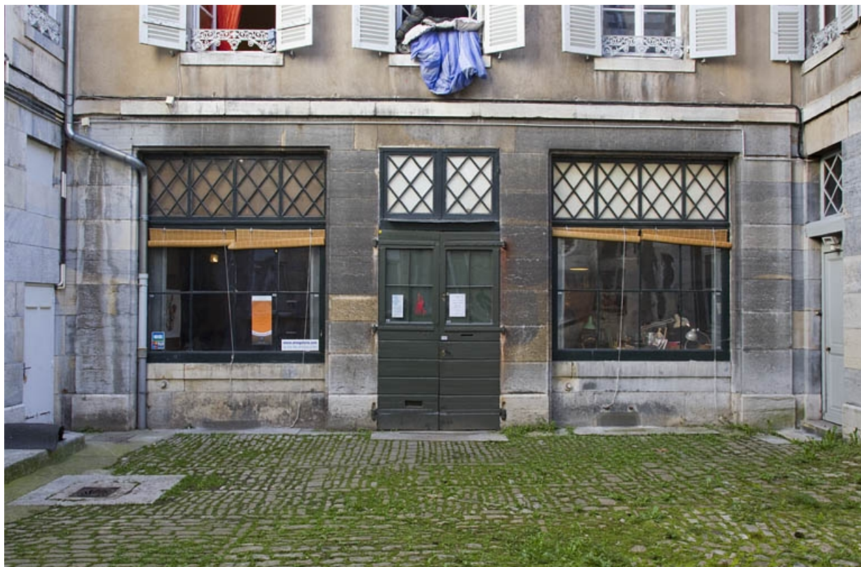
Façade antérieure du deuxième logis secondaire : détail du rez-de-chaussée.

25, Besançon Grande Rue 53, lieudit : îlot Bouteiller