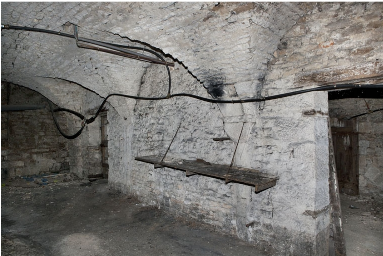
Logis principal, sous-sol : cave C, partie gauche, mur droit.

25, Besançon Grande Rue 53, lieudit : îlot Bouteiller