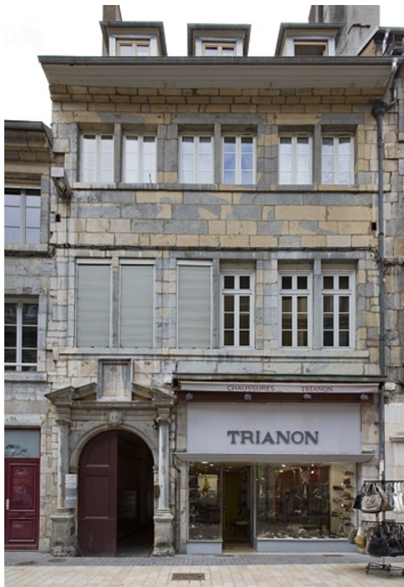
Façade antérieure du logis principal : de face.

25, Besançon Grande Rue 53, lieudit : îlot Bouteiller