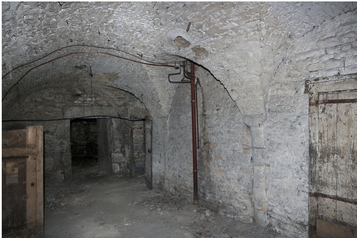
Logis principal, sous-sol : cave C.

25, Besançon Grande Rue 53, lieudit : îlot Bouteiller