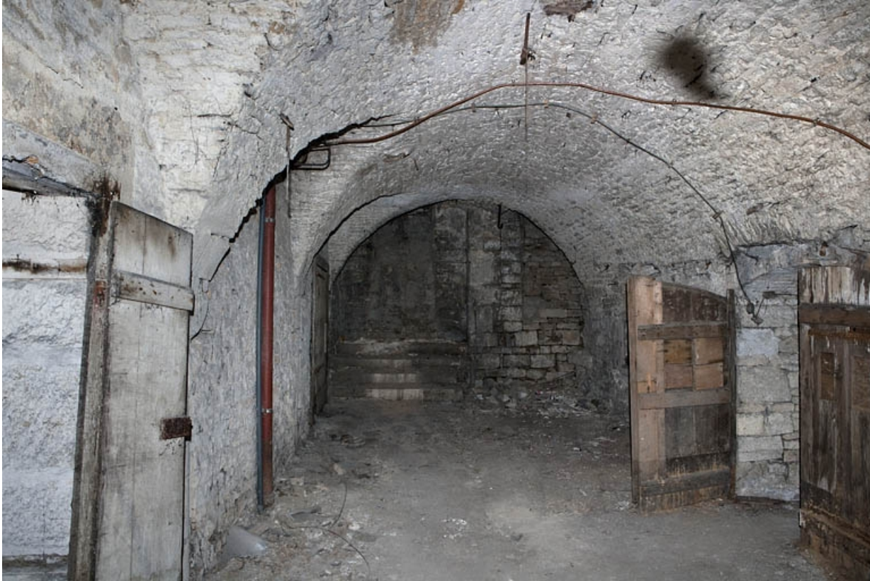
Logis principal, sous-sol : cave C, partie droite depuis le fond.

25, Besançon Grande Rue 53, lieudit : îlot Bouteiller