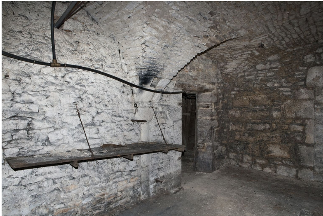
Logis principal, sous-sol : cave C.

25, Besançon Grande Rue 53, lieudit : îlot Bouteiller