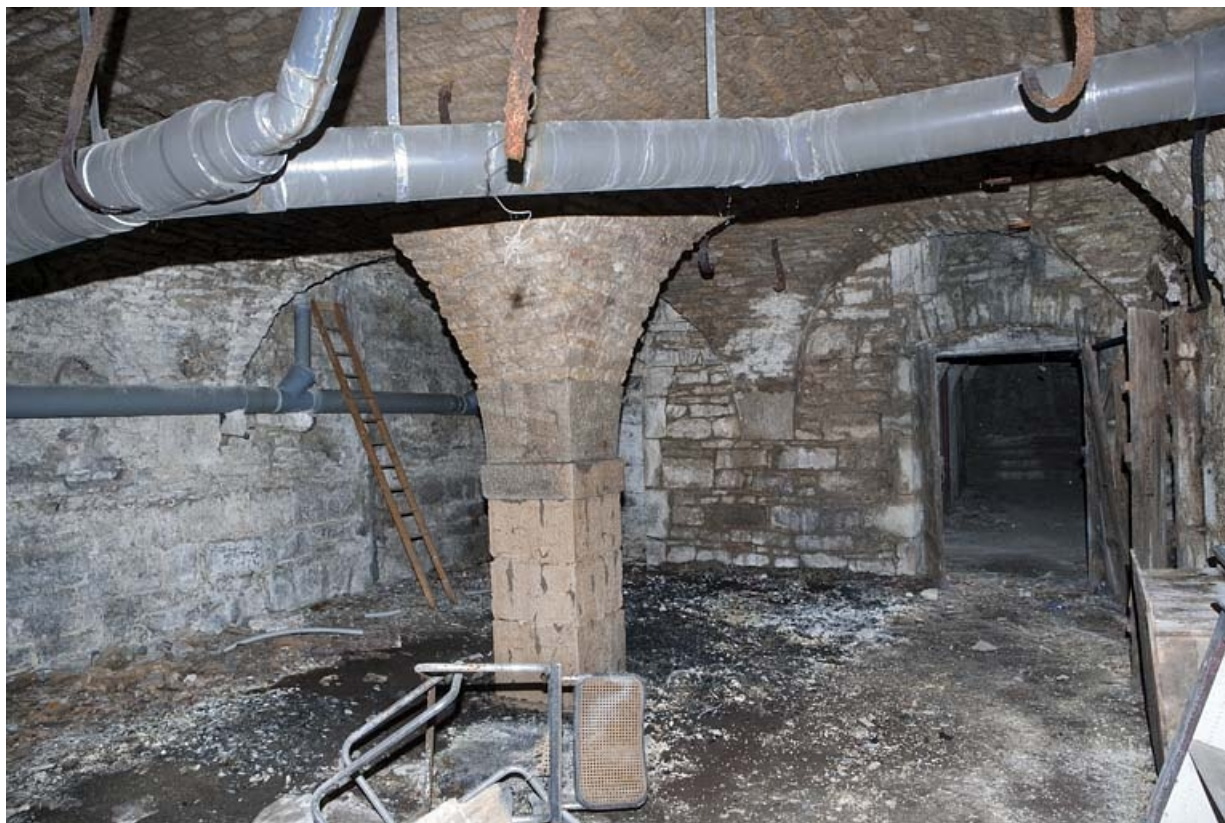
Logis principal, sous-sol : cave B, vue d'ensemble. 25, Besançon Grande Rue 53, lieudit : îlot Bouteiller