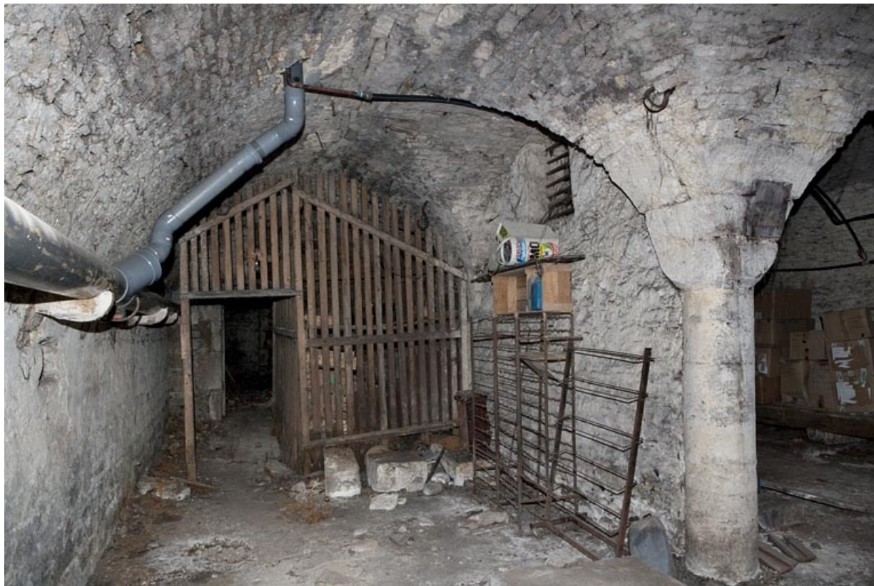
Logis principal, sous-sol : cave A, vue de la partie droite depuis le fond.

25, Besançon Grande Rue 53, lieudit : îlot Bouteiller