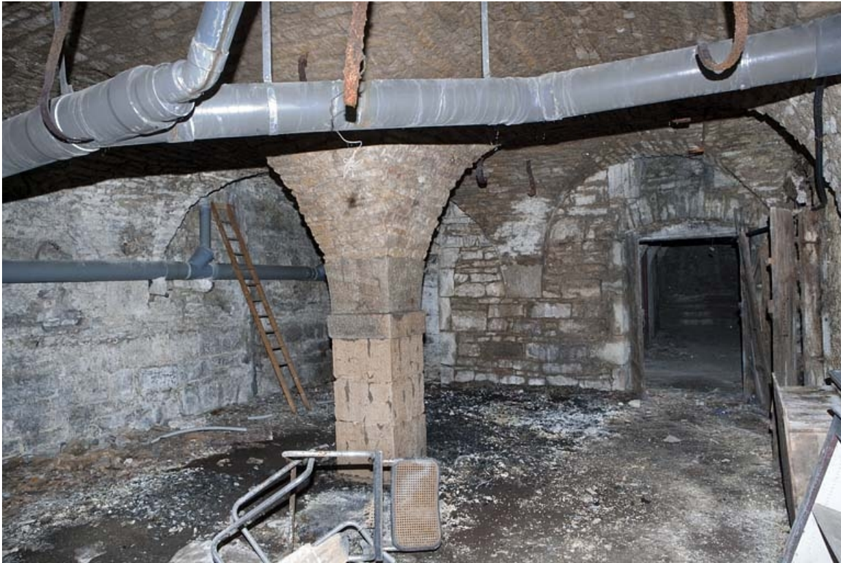
Logis principal, sous-sol : cave B, vue d'ensemble.

25, Besançon Grande Rue 53, lieudit : îlot Bouteiller