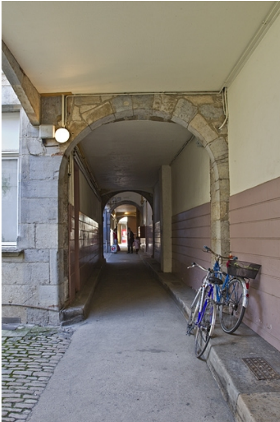
Vue du passage cocher depuis la première cour. 25, Besançon Grande Rue 53, lieudit : îlot Bouteiller