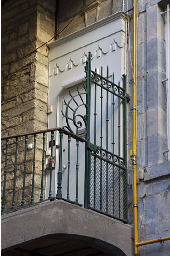
Logis principal : détail de la porte du premier étage sur la façade postérieure. 25, Besançon Grande Rue 53, lieudit : îlot Bouteiller