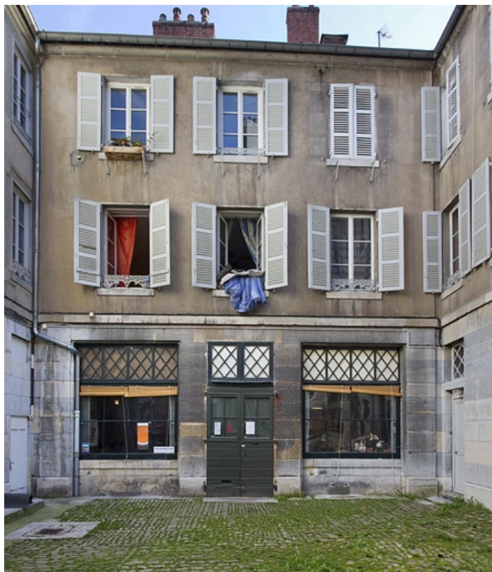
Deuxième logis secondaire sur la deuxième cour : de face.

25, Besançon Grande Rue 53, lieudit : îlot Bouteiller