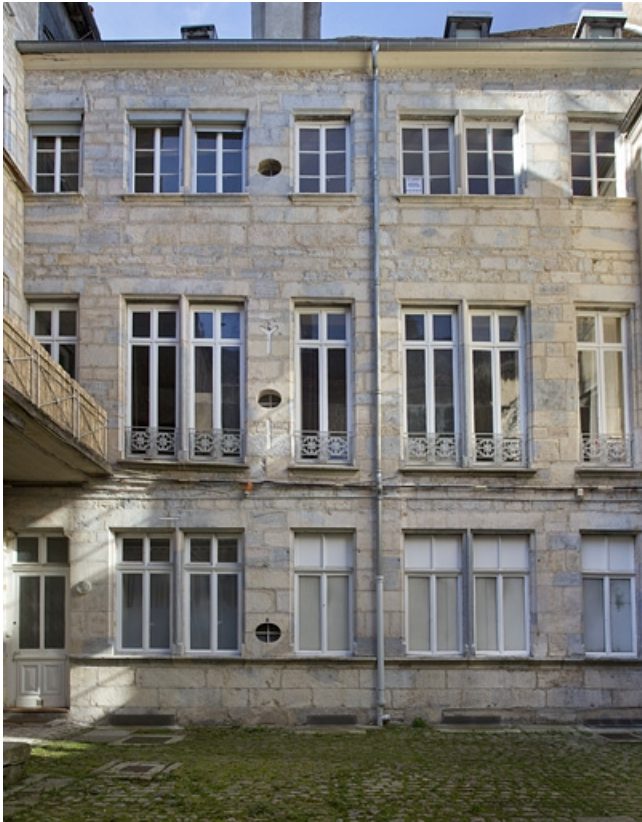
Façade postérieure du premier logis secondaire sur la deuxième cour : de face. 25, Besançon Grande Rue 53, lieudit : îlot Bouteiller