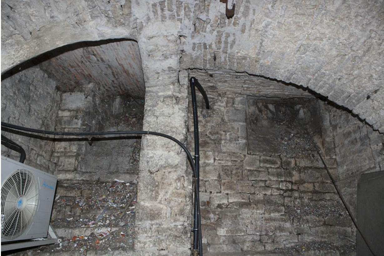
Logis principal, sous-sol : cave A, détail du soubirail sur rue.

25, Besançon Grande Rue 53, lieudit : îlot Bouteiller