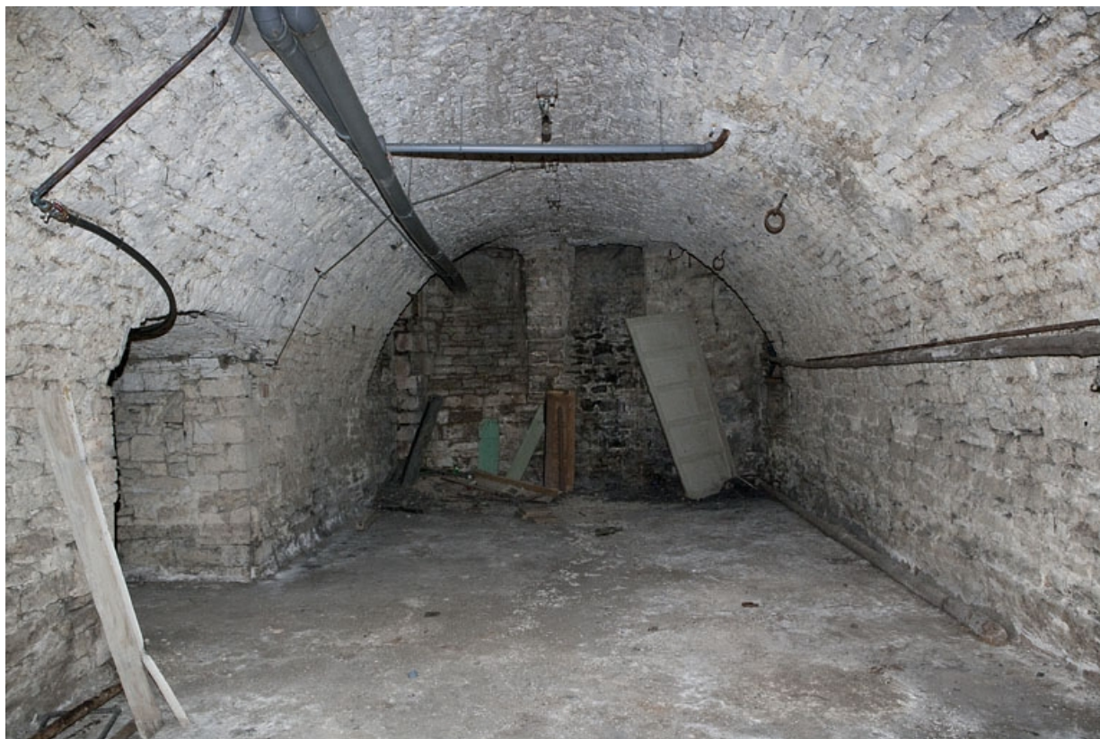
Logis principal, sous-sol : cave D, depuis le fond.

25, Besançon Grande Rue 53, lieudit : îlot Bouteiller