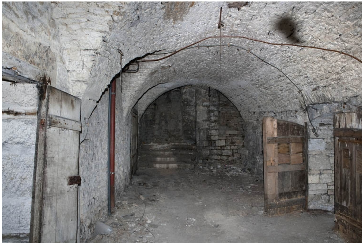
Logis principal, sous-sol : cave C, partie droite depuis le fond. 25, Besançon Grande Rue 53, lieudit : îlot Bouteiller