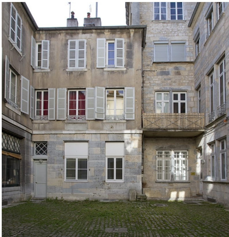
Aile droite du deuxième logis secondaire sur la deuxième cour : de face. 25, Besançon Grande Rue 53, lieudit : îlot Bouteiller