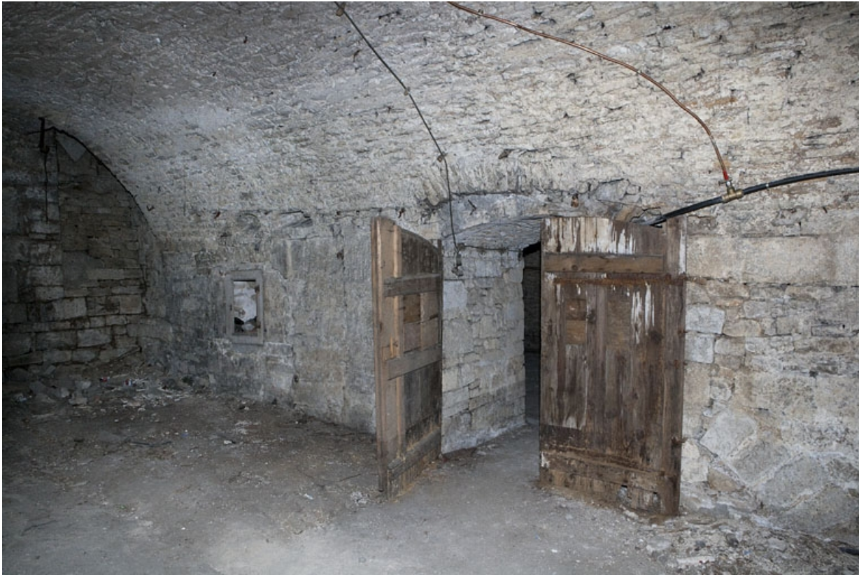
Logis principal, sous-sol : cave C.

25, Besançon Grande Rue 53, lieudit : îlot Bouteiller