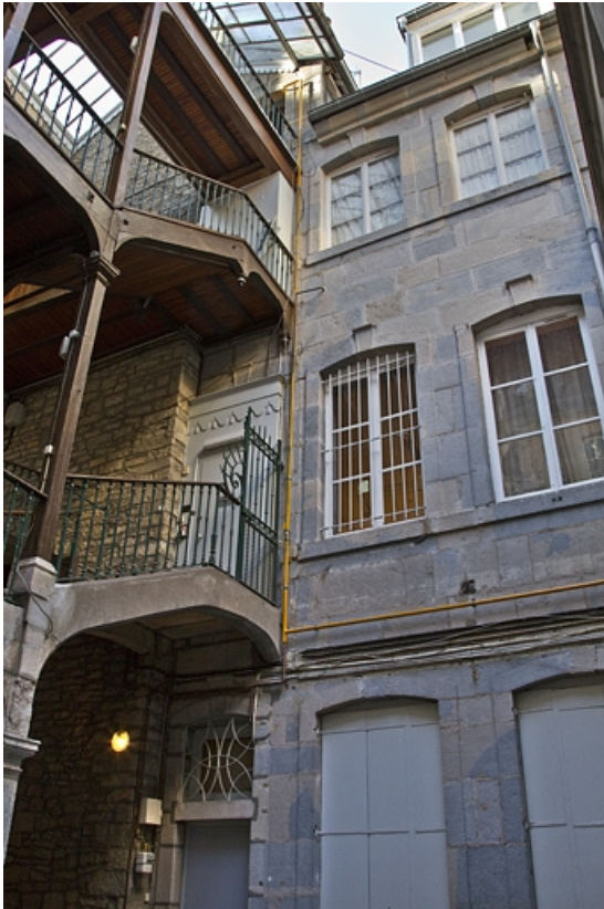
Façade postérieure du logis principal : vue d'ensemble.

25, Besançon Grande Rue 53, lieudit : îlot Bouteiller