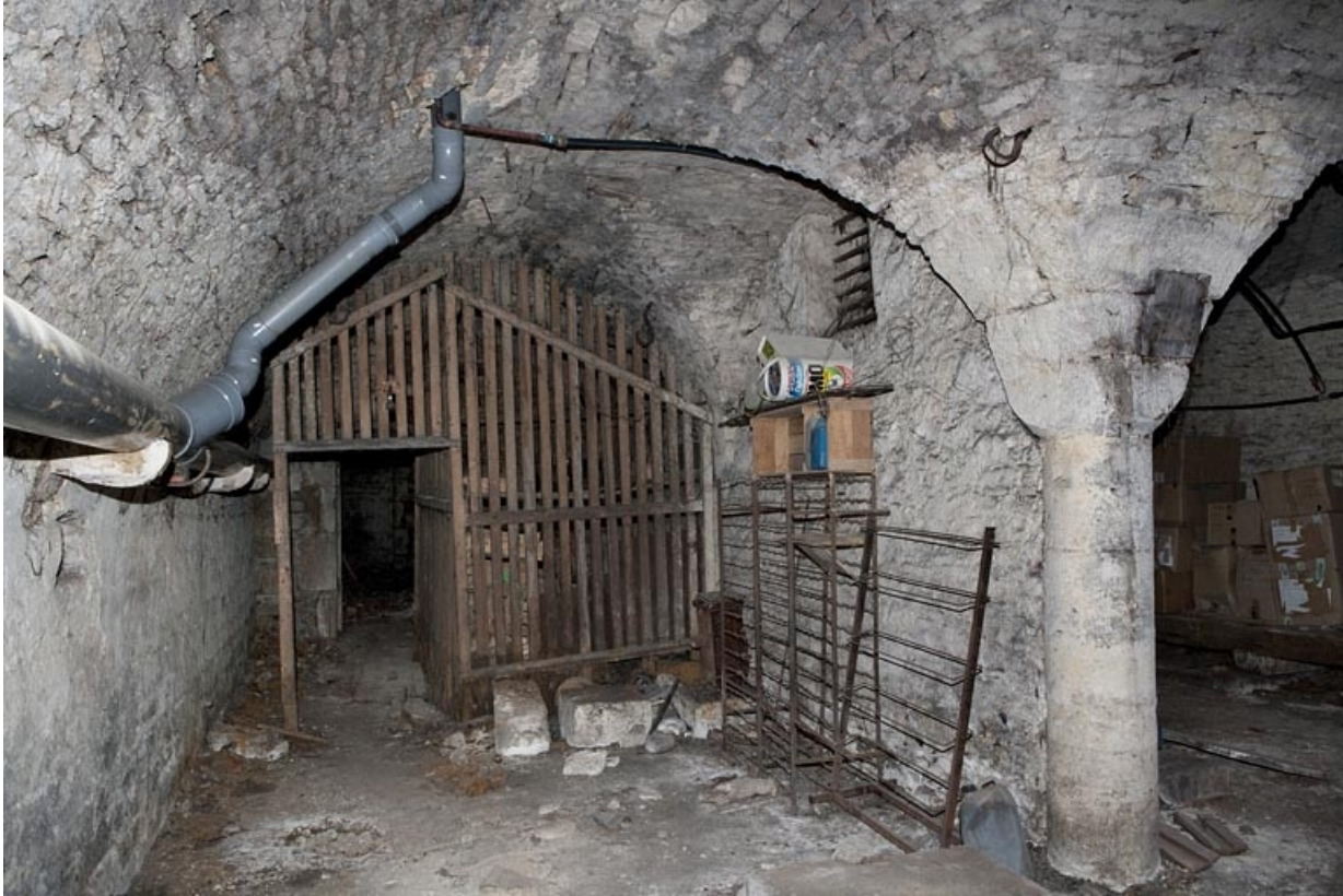
Logis principal, sous-sol : cave A, vue de la partie droite depuis le fond.

25, Besançon Grande Rue 53, lieudit : îlot Bouteiller