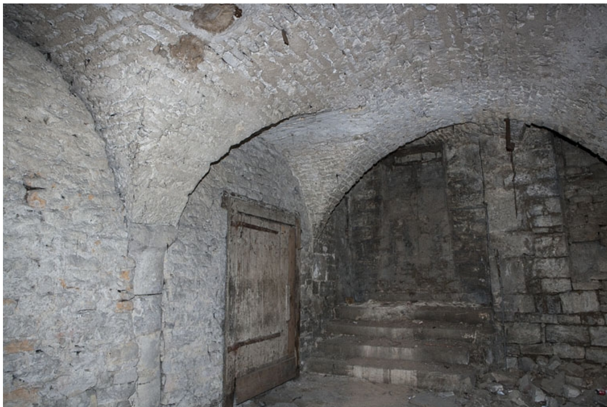
Logis principal, sous-sol : cave C.

25, Besançon Grande Rue 53, lieudit : îlot Bouteiller