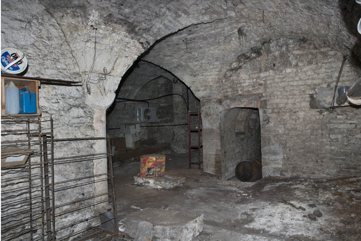
Logis principal, sous-sol : cave A, vue d'ensemble.

25, Besançon Grande Rue 53, lieudit : îlot Bouteiller