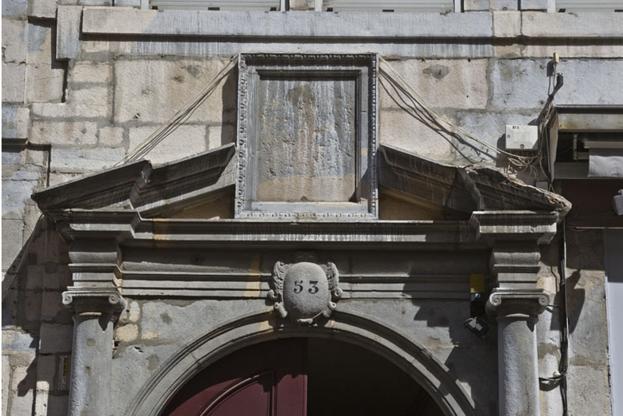
Façade antérieure du logis principal, portail d'entrée : détail du fronton interrompu à tabernacle.

25, Besançon Grande Rue 53, lieudit : îlot Bouteiller