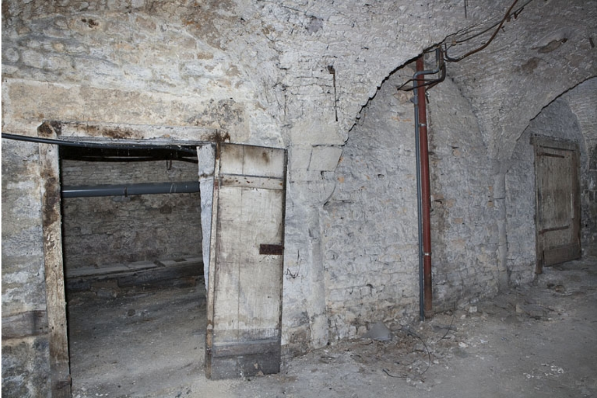
Logis principal, sous-sol : cave C, partie droite, détail de la porte de communication avec la partie gauche. 25, Besançon Grande Rue 53, lieudit : îlot Bouteiller