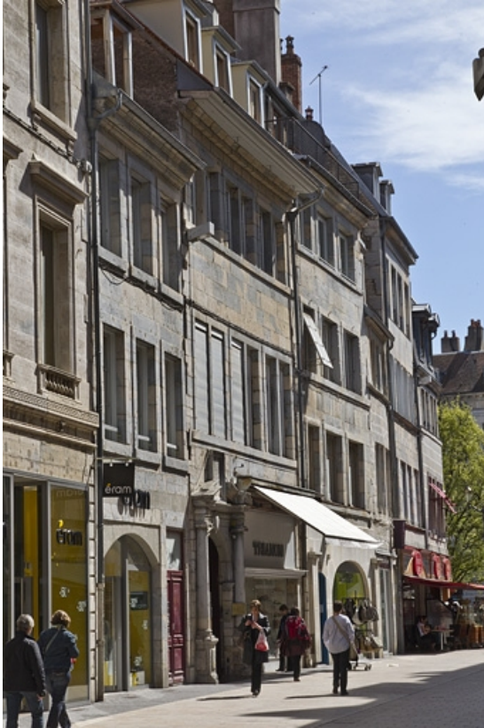
Façade antérieure du logis principal : de trois quarts gauche.

25, Besançon Grande Rue 53, lieudit : îlot Bouteiller