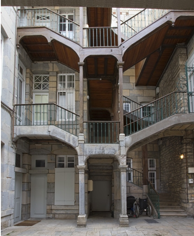
Escalier à cage ouverte sur la première cour : vue d'ensemble, de face.

25, Besançon Grande Rue 53, lieudit : îlot Bouteiller