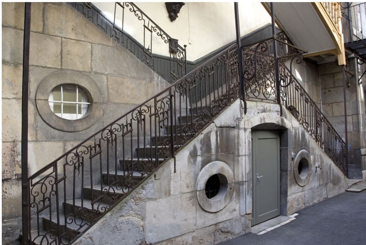
Première cour : détail du départ de l'escalier à cage ouverte.

25, Besançon Grande Rue 33, lieudit : îlot Bouteiller