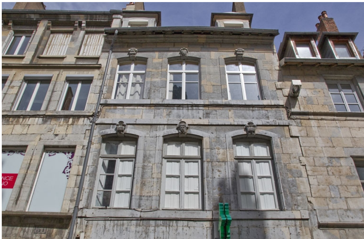
Logis principal : détail de la façade antérieure depuis le premier étage, de face.

25, Besançon Grande Rue 33, lieudit : îlot Bouteiller