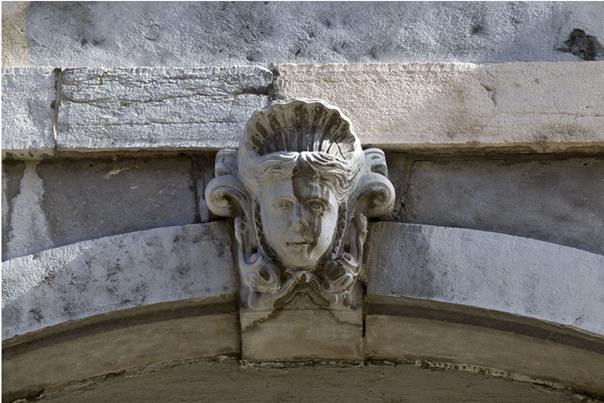
Logis principal, façade sur rue : détail d'un mascaron ornant la clé de l'arc de la boutique.

25, Besançon Grande Rue 33, lieudit : îlot Bouteiller