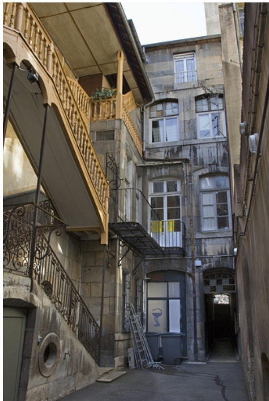
Vue d'ensemble de la façade postérieure du logis principal.

25, Besançon Grande Rue 33, lieudit : îlot Bouteiller