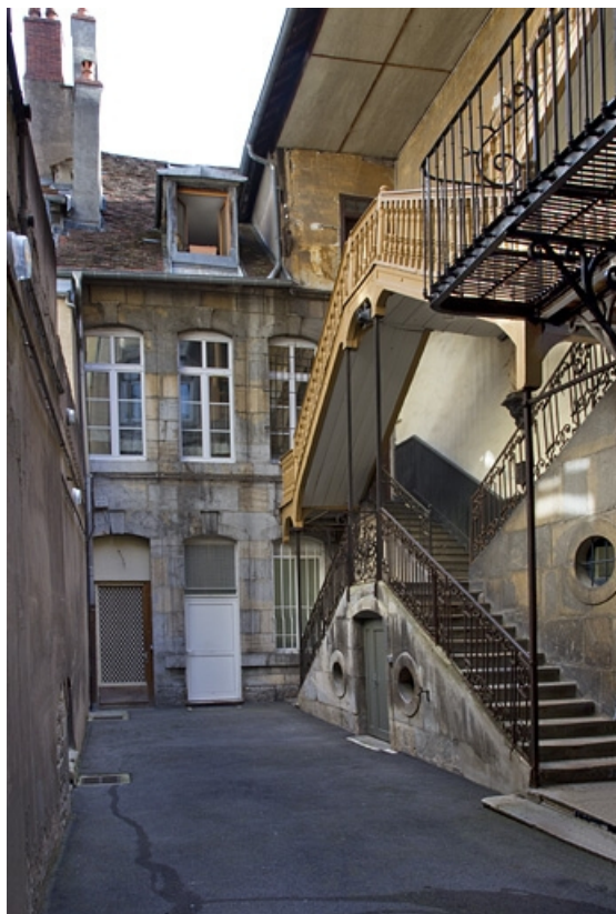
Première cour : vue d'ensemble du logis secondaire et de l'escalier à cage ouverte.

25, Besançon Grande Rue 33, lieudit : îlot Bouteiller