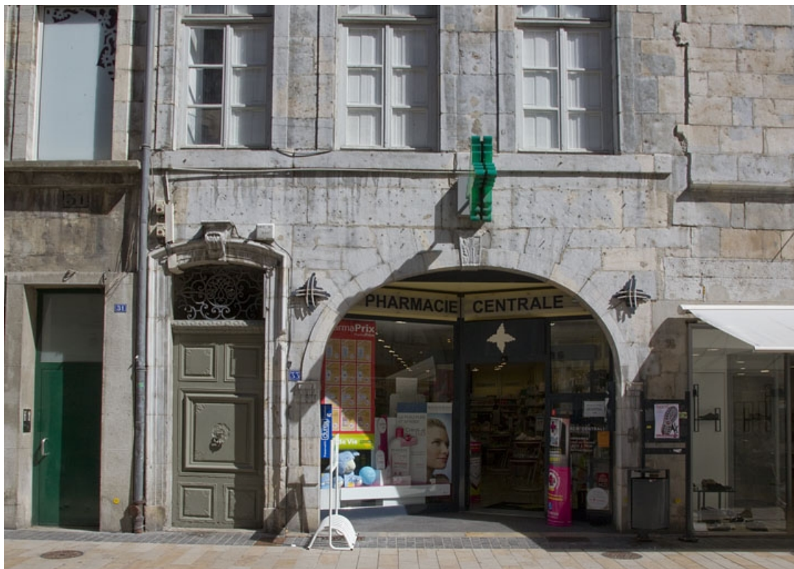
Logis principal, façade antérieure : détail du rez-de-chaussée.

25, Besançon Grande Rue 33, lieudit : îlot Bouteiller