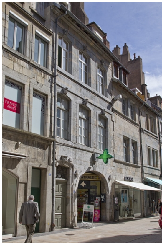
Logis principal : vue d'ensemble depuis la rue, de trois quarts gauche.

25, Besançon Grande Rue 33, lieudit : îlot Bouteiller