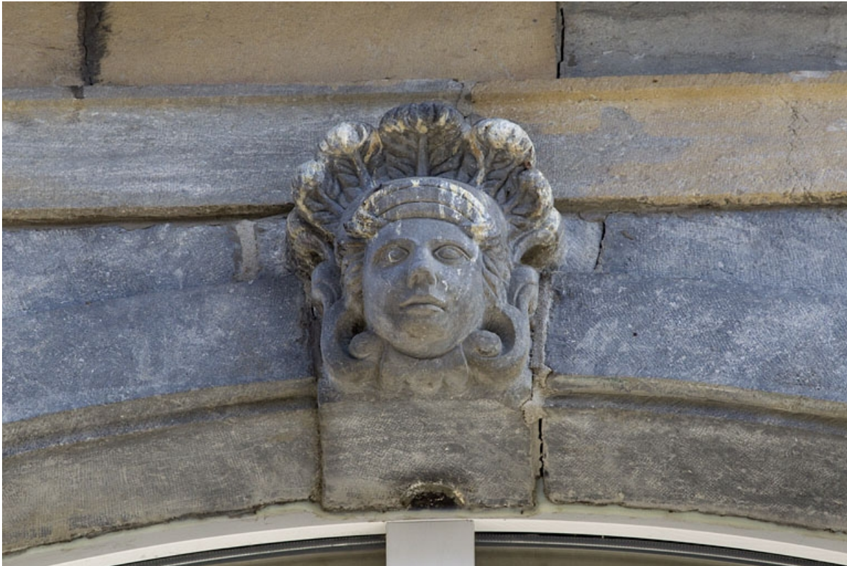
Logis principal, façade sur rue : détail d'un mascaron ornant la clé de l'arc d'une fenêtre du premier étage. 25, Besançon Grande Rue 33, lieudit : îlot Bouteiller