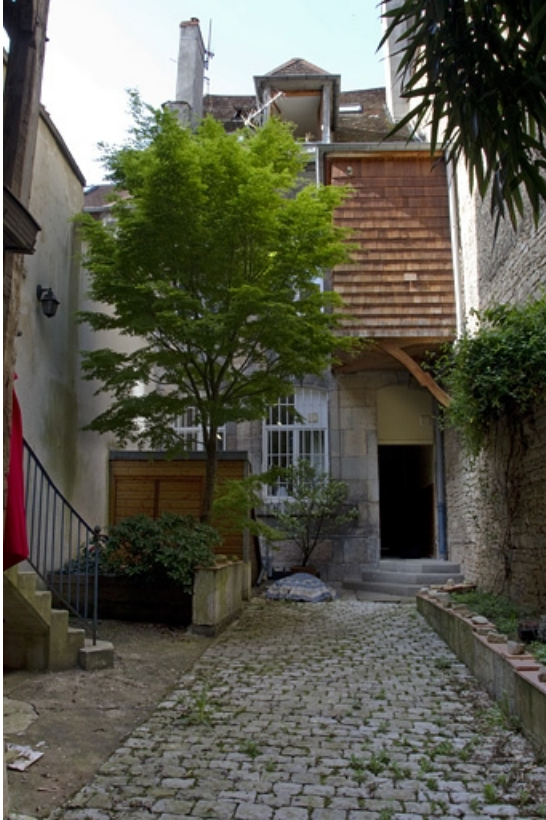
Deuxième cour : vue d'ensemble de la façade postérieure du premier logis secondaire.

25, Besançon Grande Rue 33, lieudit : îlot Bouteiller