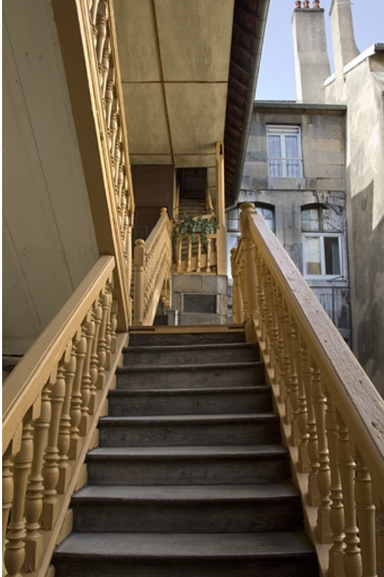
Première cour, escalier à cage ouverte : détail des dernières volées avec une rampe à balustres de bois tourné.

25, Besançon Grande Rue 33, lieudit : îlot Bouteiller