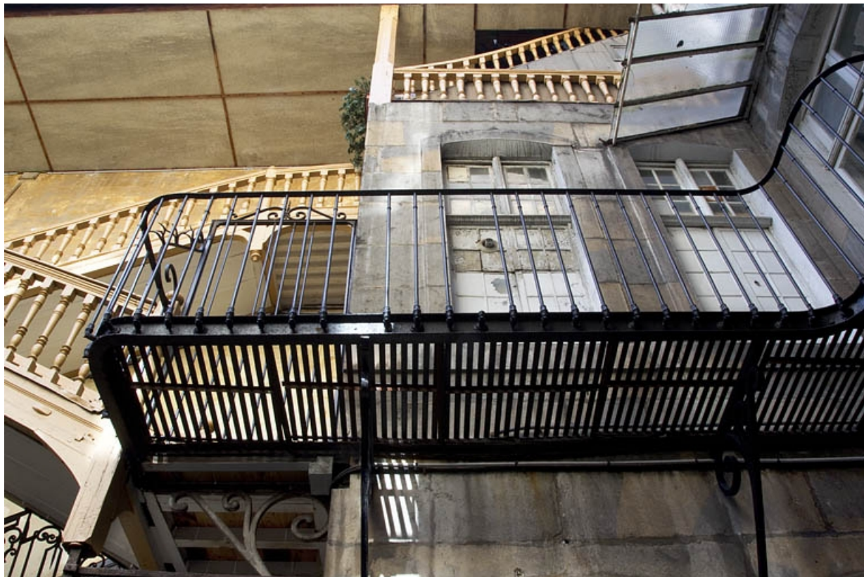
Première cour : détail de la coursière prolongeant l'escalier à cage ouverte.

25, Besançon Grande Rue 33, lieudit : îlot Bouteiller