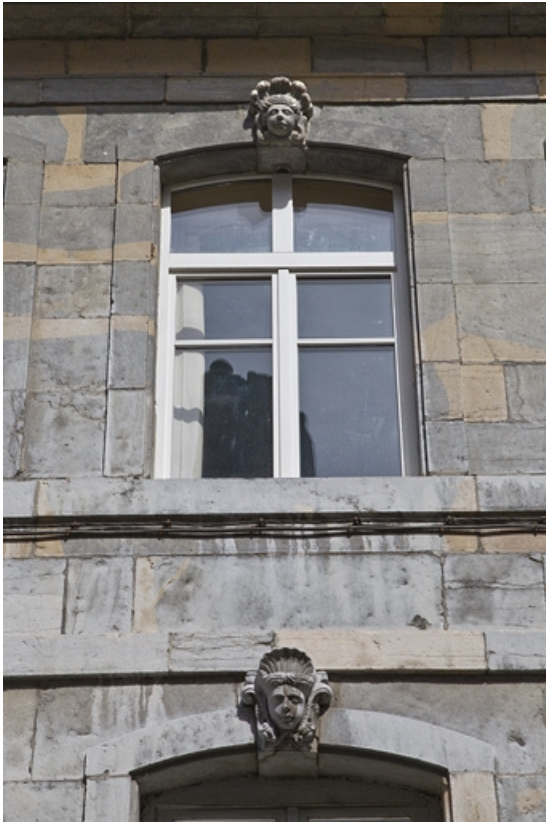
Logis principal, façade antérieure : détail d'une fenêtre du premier étage décorée d'un mascaron.

25, Besançon Grande Rue 33, lieudit : îlot Bouteiller