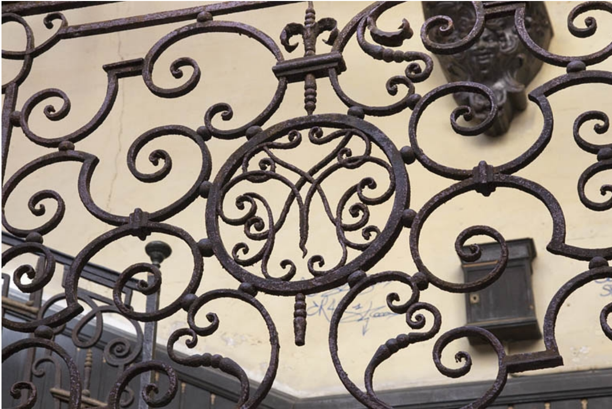
Première cour : détail de la ferronnerie de l'escalier à cage ouverte ornée d'un monogramme.

25, Besançon Grande Rue 33, lieudit : îlot Bouteiller