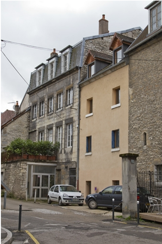
Logis secondaire au fond de la deuxième cour : façade postérieure donnant sur l'impasse, de trois quarts droit. 25, Besançon Grande Rue 33, lieudit : îlot Bouteiller