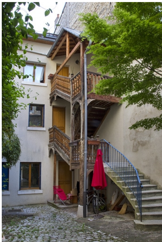
Deuxième cour : vue d'ensemble de l'escalier à cage ouverte, de trois quarts gauche.

25, Besançon Grande Rue 33, lieudit : îlot Bouteiller