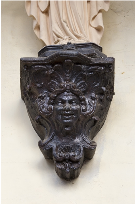
Première cour, escalier à cage ouverte : détail de la console supportant une statue dans la cage de l'escalier. 25, Besançon Grande Rue 33, lieudit : îlot Bouteiller