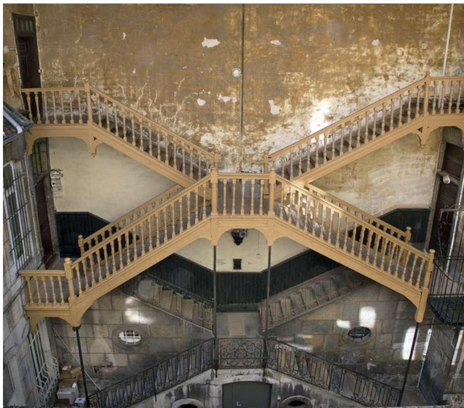
Première cour, vue d'ensemble de l'escalier à cage ouverte : de face.

25, Besançon Grande Rue 33, lieudit : îlot Bouteiller