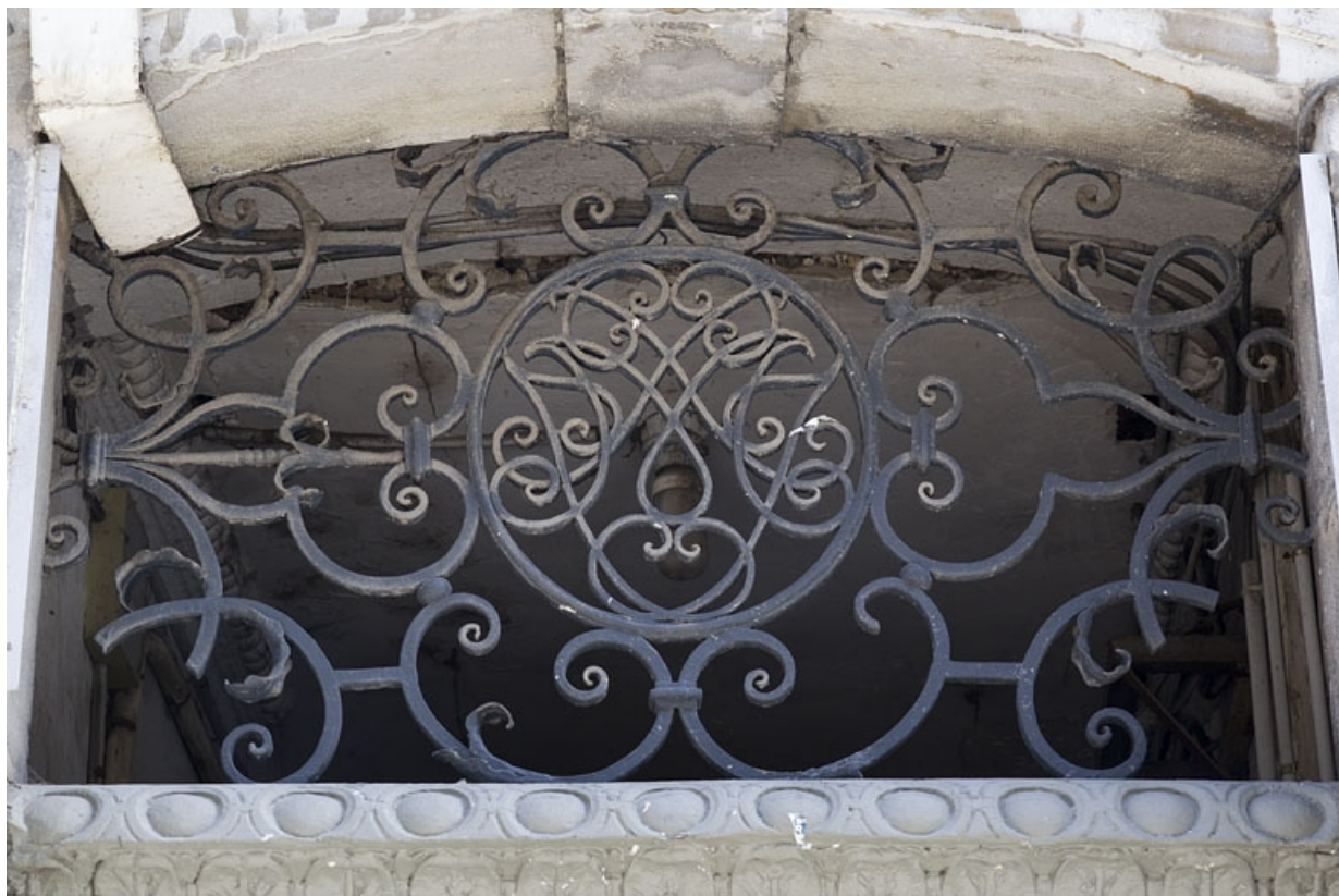
Logis principal, façade sur rue : détail du dessus de porte en ferronnerie de la porte du couloir.

25, Besançon Grande Rue 33, lieudit : îlot Bouteiller