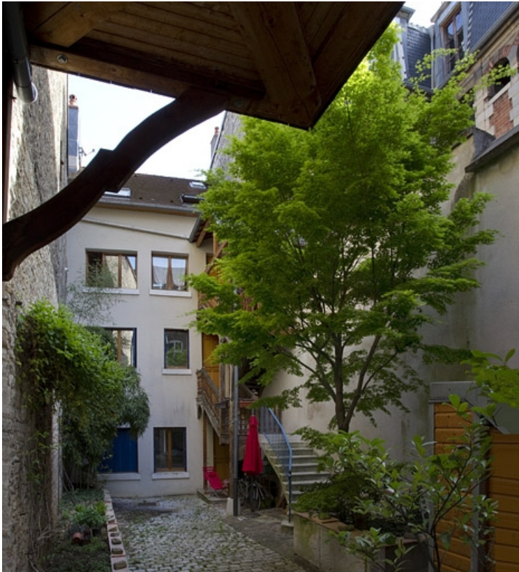
Deuxième cour : vue d'ensemble du logis secondaire : de face.

25, Besançon Grande Rue 33, lieudit : îlot Bouteiller