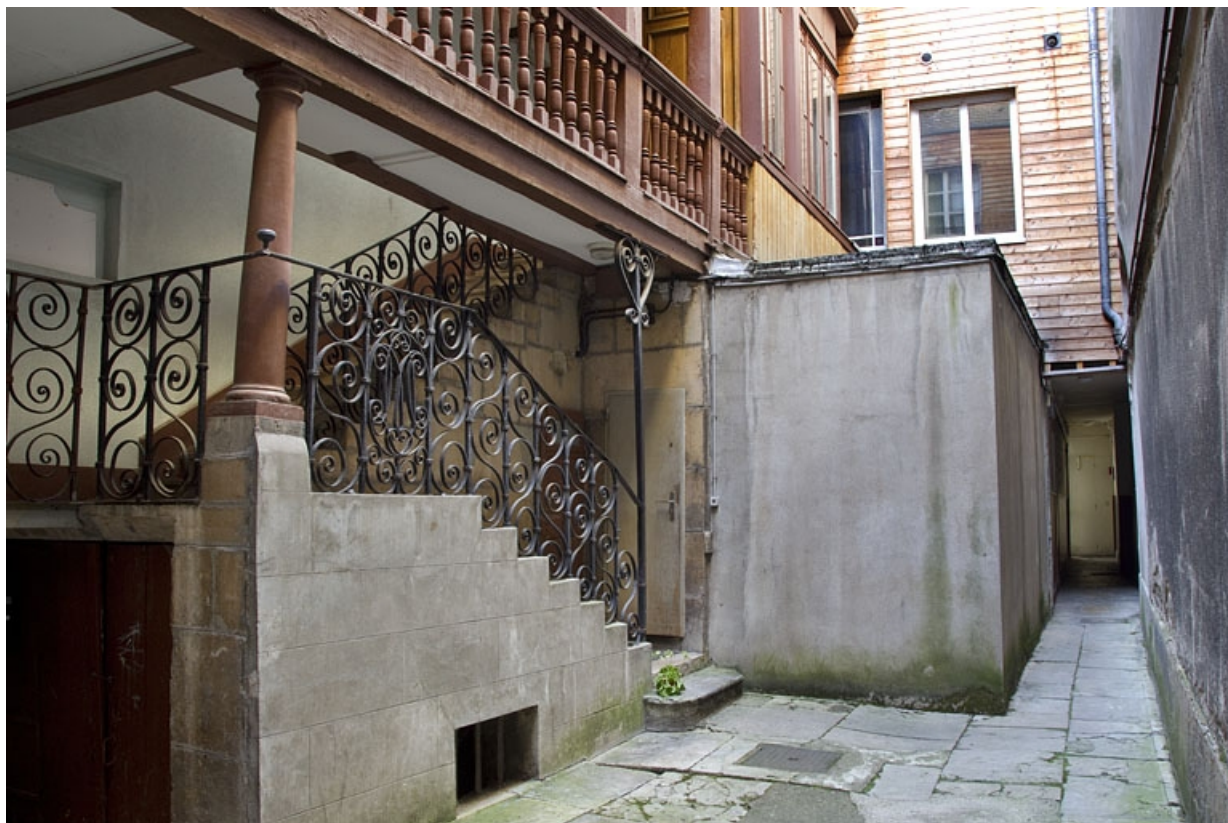
Première cour, escalier à cage ouverte : détail de la ferronnerie des deux premières volées, de trois quarts gauche. 25, Besançon Grande Rue 35, lieudit : îlot Bouteiller