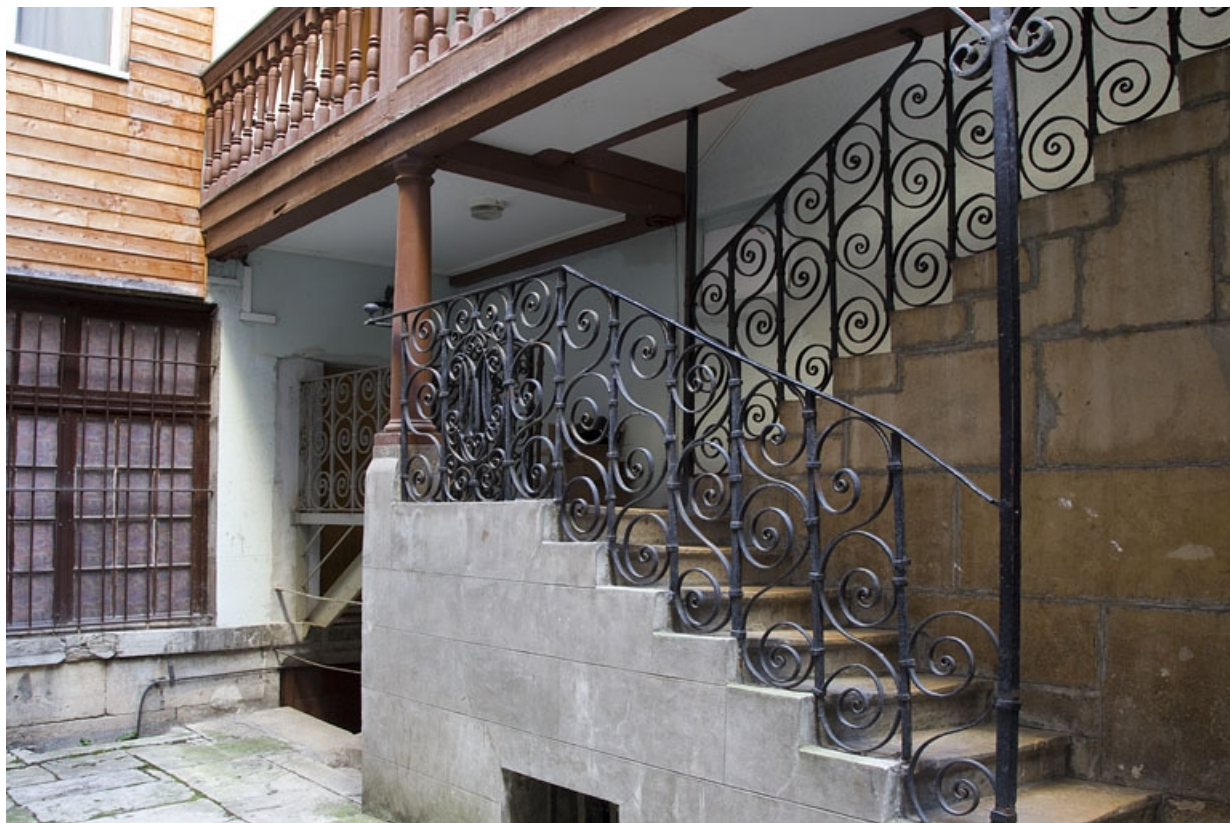
Première cour, escalier à cage ouverte : détail de la ferronnerie des deux premières volées, de trois quarts droit. 25, Besançon Grande Rue 35, lieudit : îlot Bouteiller