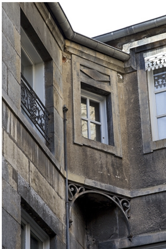
Deuxième cour, façade postérieure du premier logis secondaire : détail d'angle au niveau du premier étage. 25, Besançon Grande Rue 35, lieudit : îlot Bouteiller