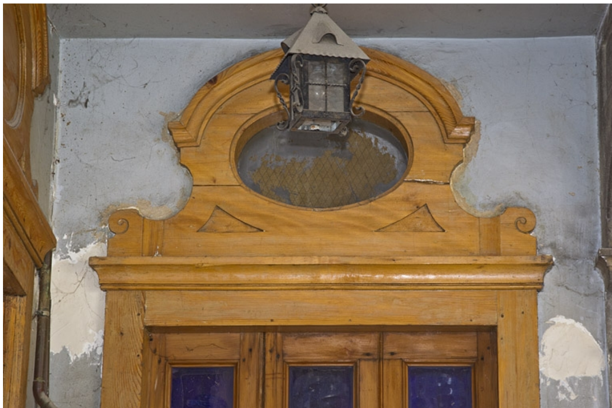
Deuxième cour, logis secondaire en fond de cour : détail de la partie supérieure de la porte d'entrée. 25, Besançon Grande Rue 35, lieudit : îlot Bouteiller