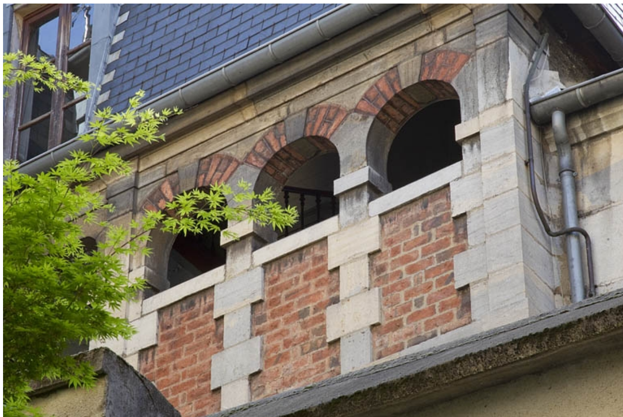
Deuxième cour, logis secondaire en fond de parcelle : façade de l'escalier, partie supérieure. 25, Besançon Grande Rue 35, lieudit : îlot Bouteiller