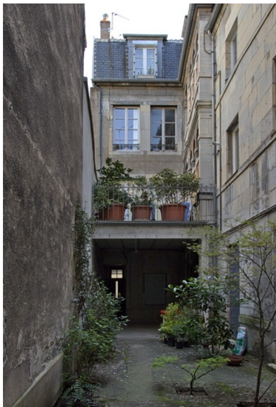
Deuxième cour : vue d'ensemble du logis secondaire en fond de cour.

25, Besançon Grande Rue 35, lieudit : îlot Bouteiller