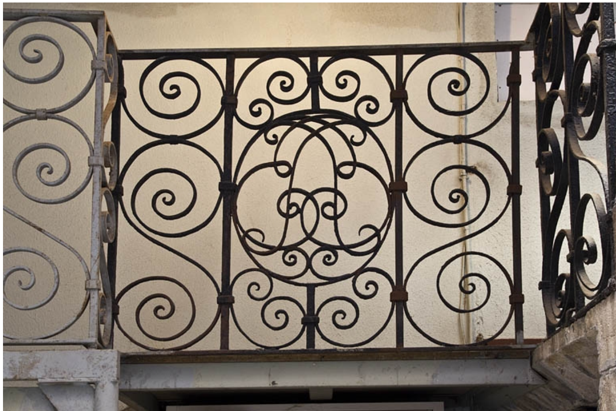
Première cour, escalier à cage ouverte : détail d'un panneau de la rampe en fer forgé avec un monogramme.

25, Besançon Grande Rue 35, lieudit : îlot Bouteiller