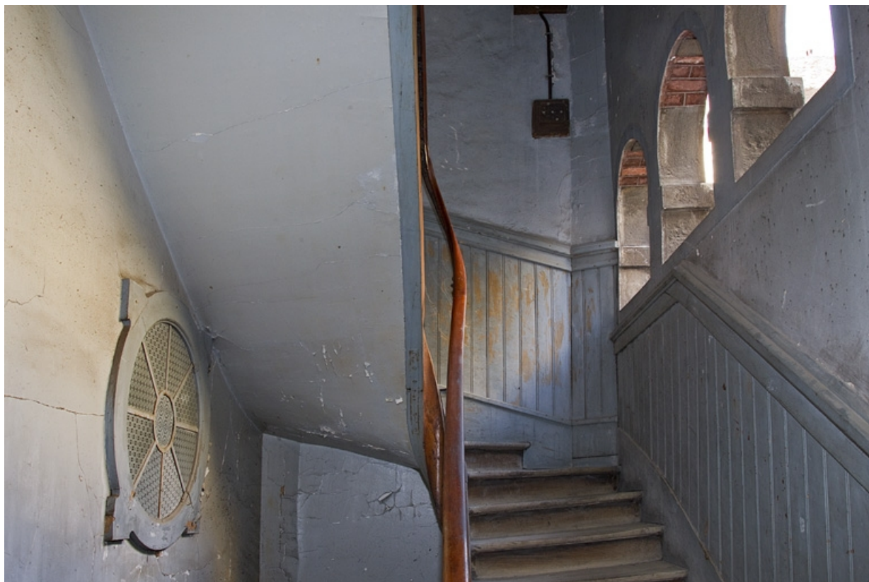
Deuxième cour, logis secondaire en fond de cour : détail de l'intérieur de l'escalier.

25, Besançon Grande Rue 35, lieudit : îlot Bouteiller