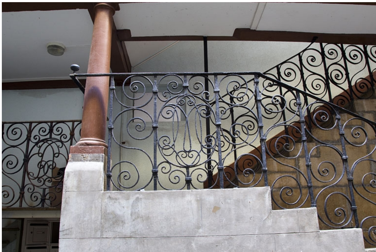
Première cour, escalier à cage ouverte : détail de la rampe en fer forgé.

25, Besançon Grande Rue 35, lieudit : îlot Bouteiller