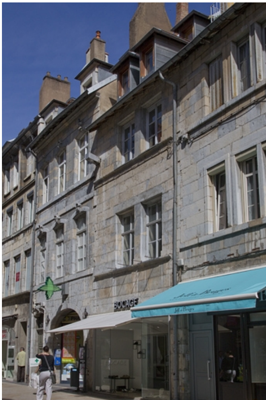
Logis principal : vue d'ensemble depuis la rue, de trois quarts droit.

25, Besançon Grande Rue 35, lieudit : îlot Bouteiller