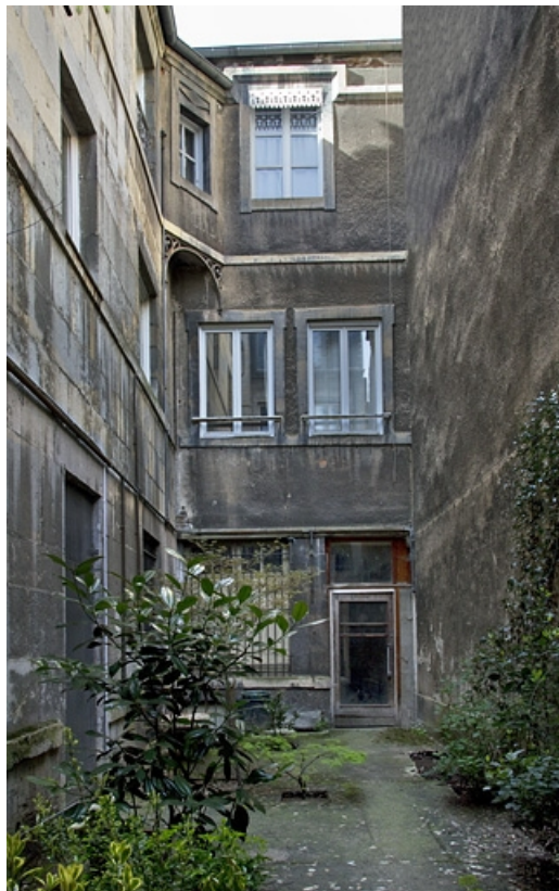
Deuxième cour, façade postérieure du premier logis secondaire : vue d'ensemble.

25, Besançon Grande Rue 35, lieudit : îlot Bouteiller