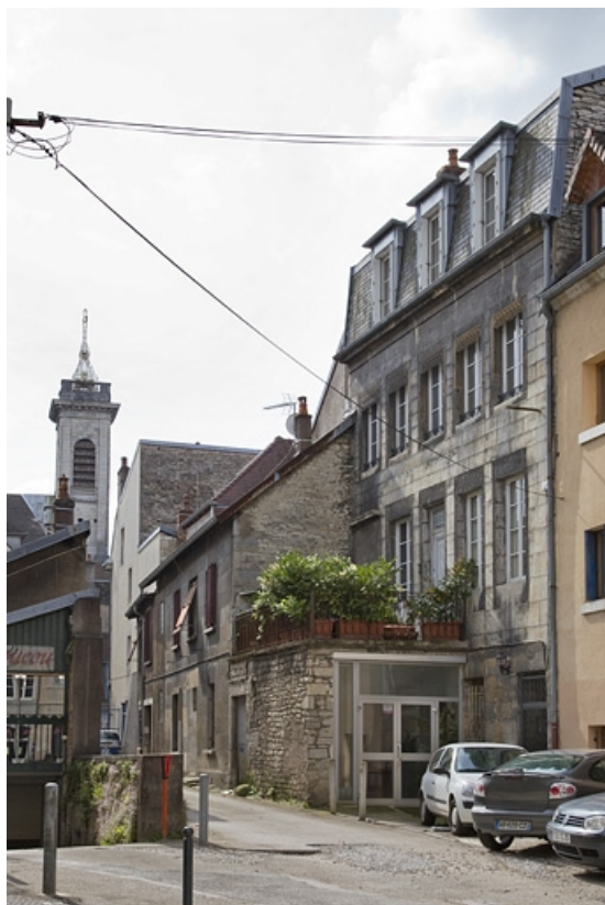
Logis secondaire en fond de parcelle : façade postérieure de trois quarts droit. 25, Besançon Grande Rue 35, lieudit : îlot Bouteiller