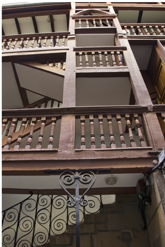
Première cour, escalier à cage ouverte : détail de la partie médiane, de face.

25, Besançon Grande Rue 35, lieudit : îlot Bouteiller