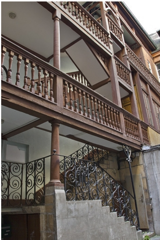
Première cour, escalier à cage ouverte : vue d'ensemble.

25, Besançon Grande Rue 35, lieudit : îlot Bouteiller