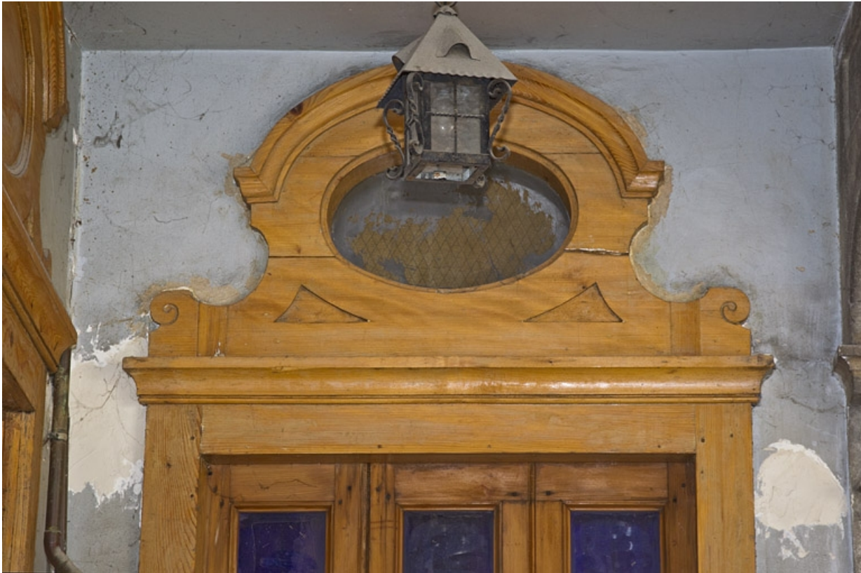
Deuxième cour, logis secondaire en fond de cour : détail de la partie supérieure de la porte d'entrée. 25, Besançon Grande Rue 35, lieudit : îlot Bouteiller