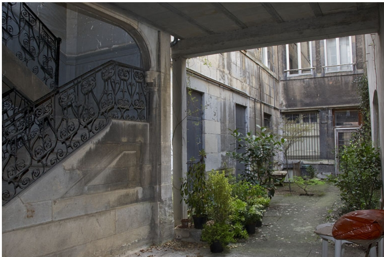
Vue de la deuxième cour depuis le logis secondaire en fond de parcelle.

25, Besançon Grande Rue 35, lieudit : îlot Bouteiller