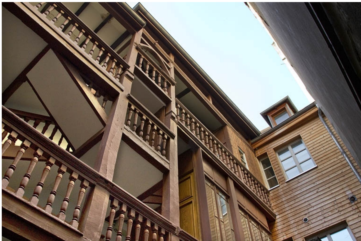
Première cour, escalier à cage ouverte : détail de la partie supérieure en charpente.

25, Besançon Grande Rue 35, lieudit : îlot Bouteiller