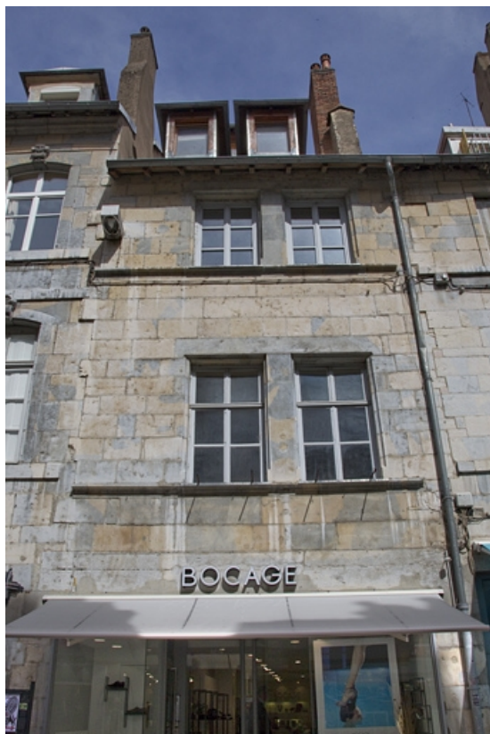
Logis principal, façade sur rue : de face.

25, Besançon Grande Rue 35, lieudit : îlot Bouteiller