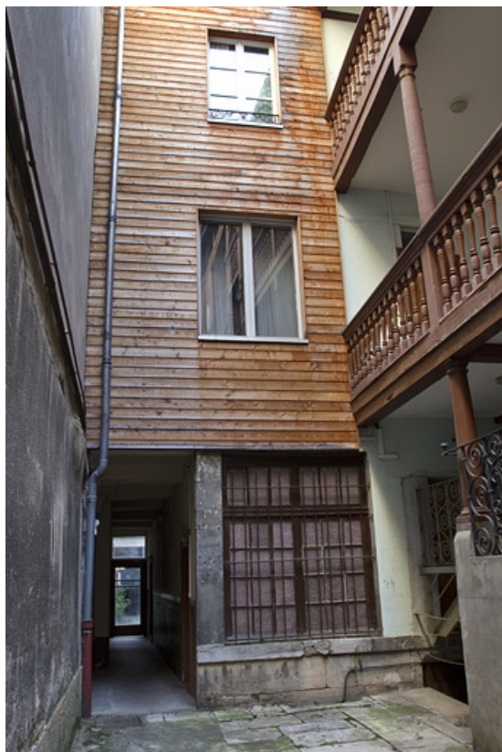
Première cour, logis secondaire : vue de la façade antérieure.

25, Besançon Grande Rue 35, lieudit : îlot Bouteiller