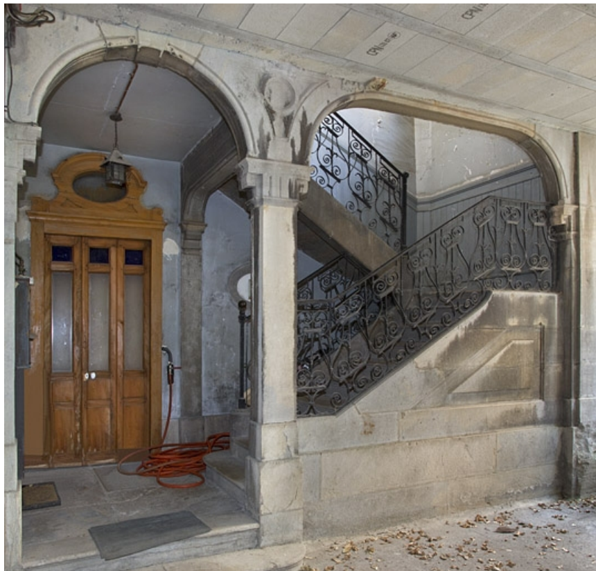
Deuxième cour, logis secondaire en fond de parcelle : détail de l'escalier et de la porte d'entrée.

25, Besançon Grande Rue 35, lieudit : îlot Bouteiller