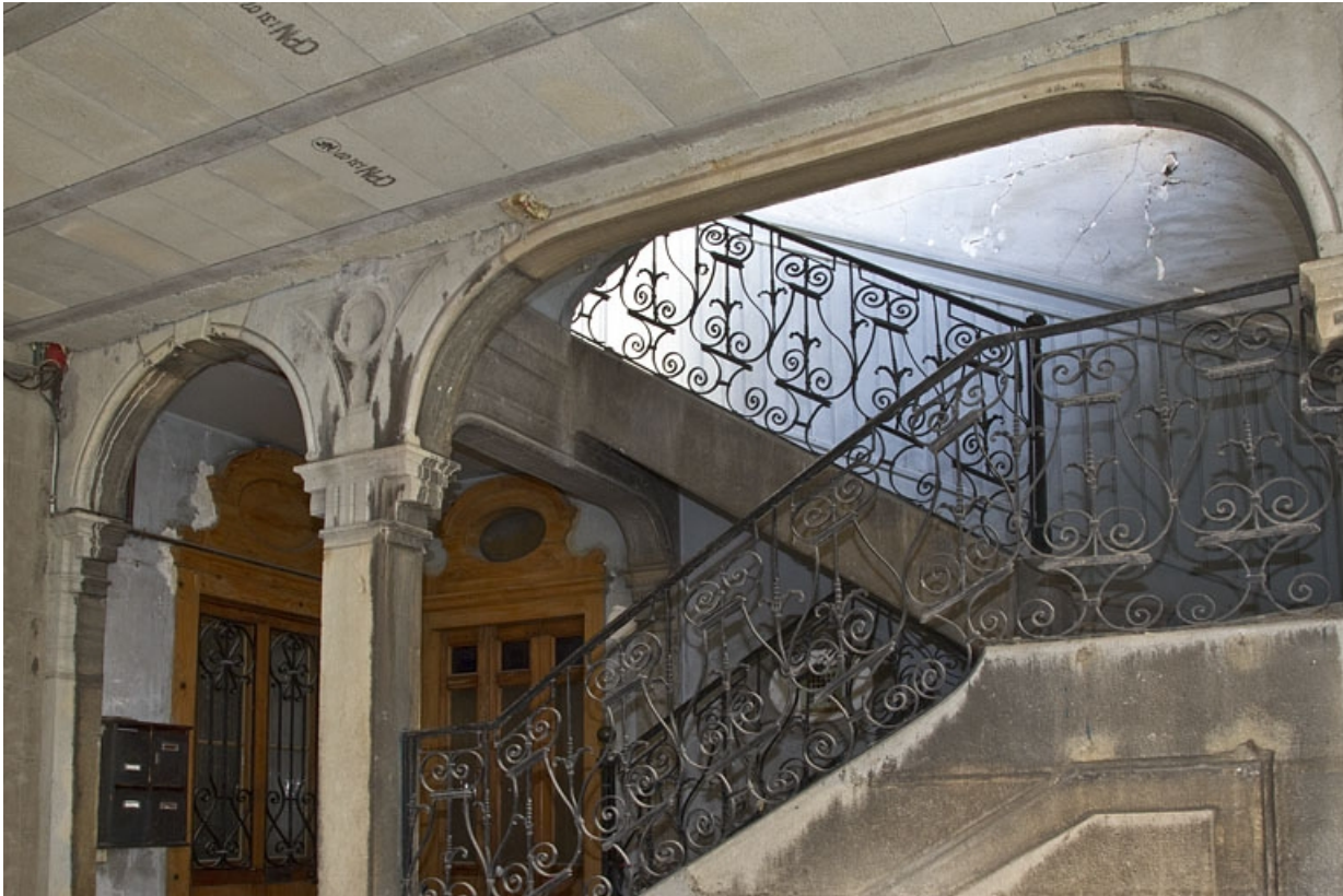
Deuxième cour, logis secondaire en fond de parcelle : détail des premières volées de l'escalier.

25, Besançon Grande Rue 35, lieudit : îlot Bouteiller