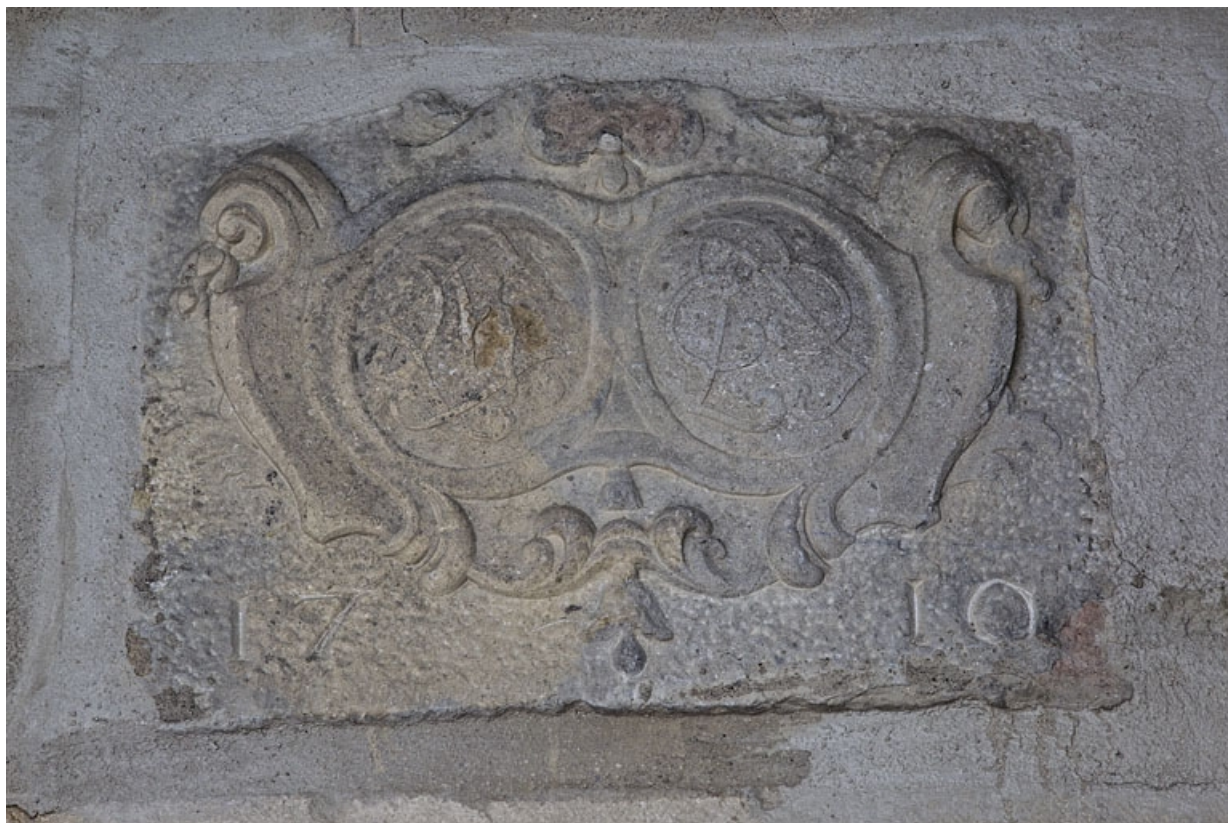
Deuxième cour, logis secondaire en fond de parcelle : détail des monogrammes et de la date.

25, Besançon Grande Rue 35, lieudit : îlot Bouteiller