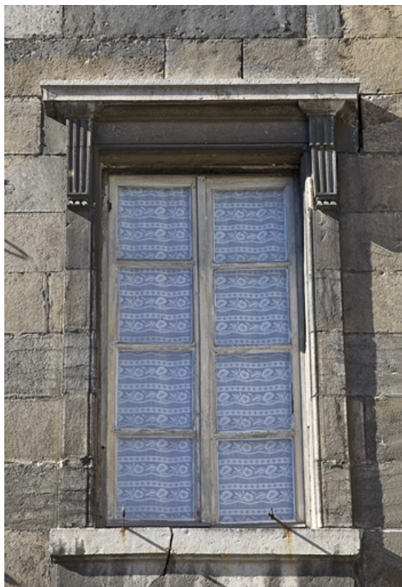
Aile droite : détail d'une fenêtre, de face.

25, Besançon Grande Rue 49, lieudit : îlot Bouteiller