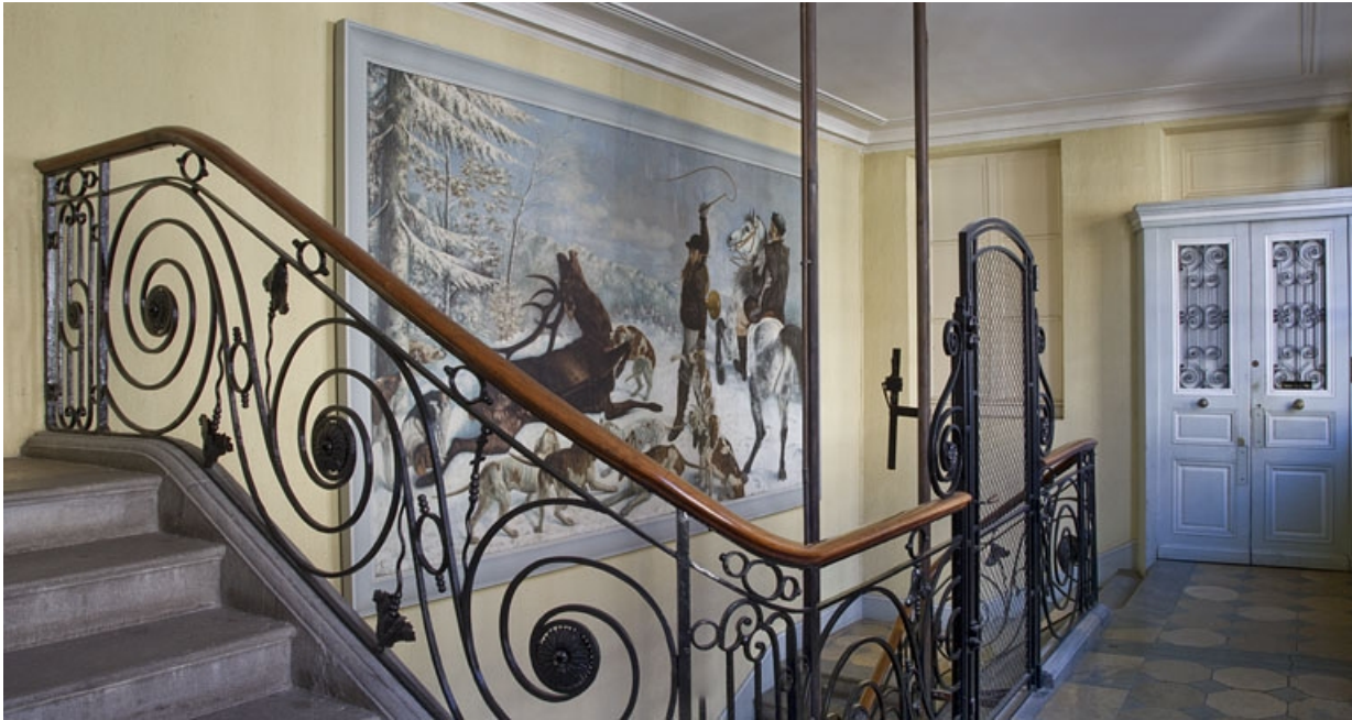
Aile droite : vue d'ensemble de la peinture murale de la cage d'escalier, copie de "La chasse au cerf" de Gustave Courbet. 25, Besançon Grande Rue 49, lieudit : îlot Bouteiller