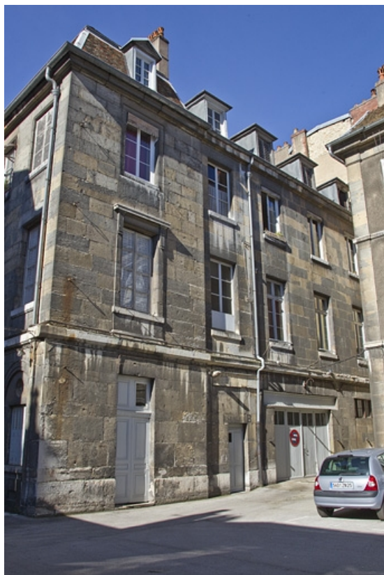
Aile droite et écurie : vue d'ensemble, de trois quarts gauche.

25, Besançon Grande Rue 49, lieudit : îlot Bouteiller