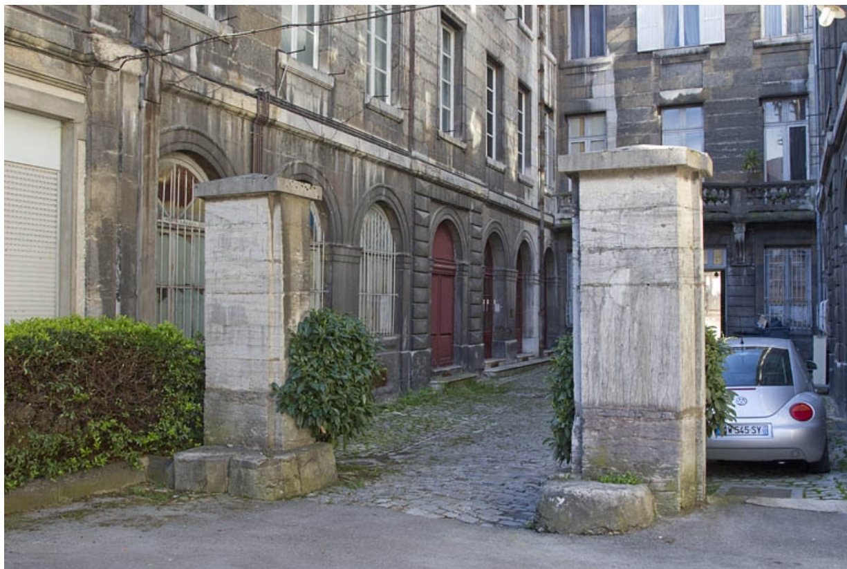
Aile droite : détail du rez-de-chaussée, de trois quarts gauche.

25, Besançon Grande Rue 49, lieudit : îlot Bouteiller