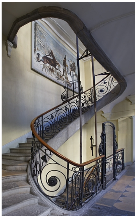
Aile droite : vue d'ensemble de la cage d'escalier depuis le premier étage.

25, Besançon Grande Rue 49, lieudit : îlot Bouteiller