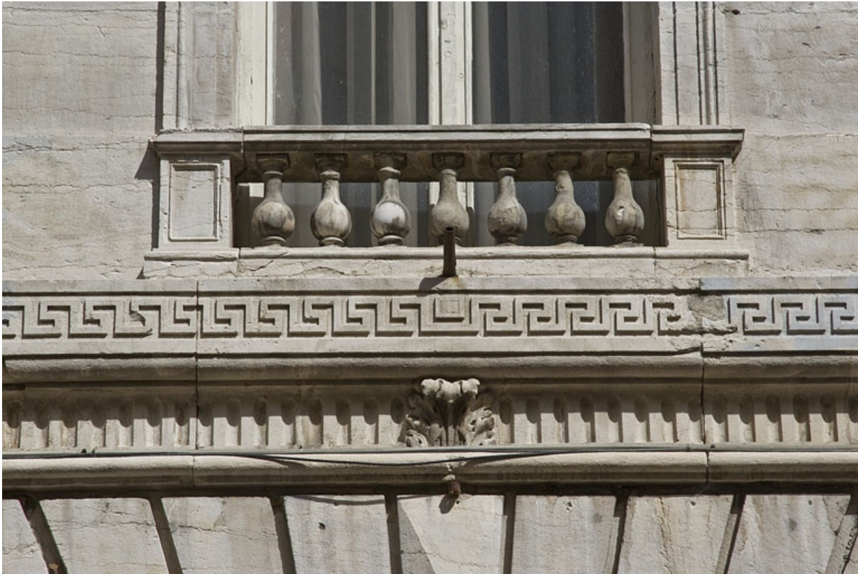
Logis principal, façade antérieure : détail de la frise de grecques et d'un garde corps.

25, Besançon Grande Rue 49, lieudit : îlot Bouteiller