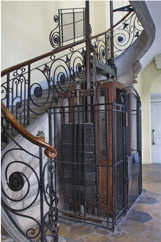
Aile droite : détail du départ de l'escalier et de l'ascenseur, vue rapprochée.

25, Besançon Grande Rue 49, lieudit : îlot Bouteiller