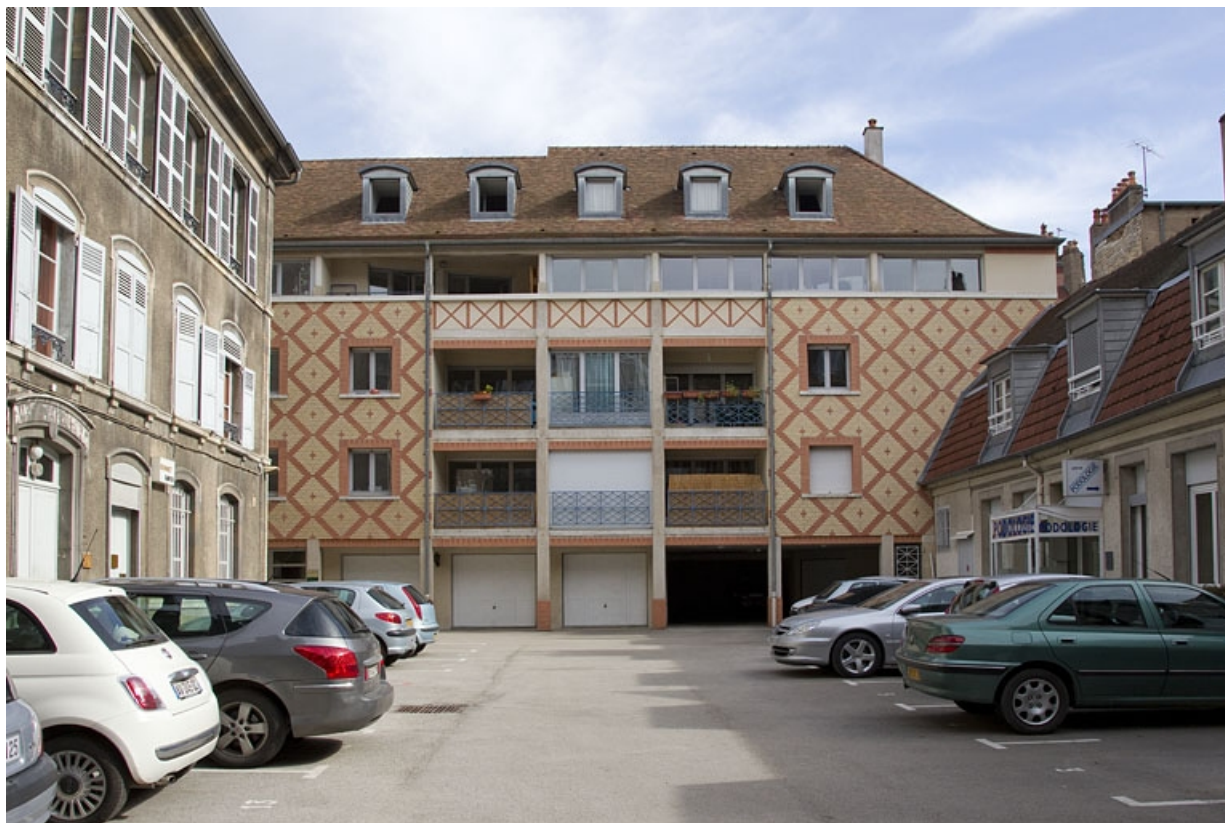
Vue d'ensemble d'immeuble récent en fond de parcelle.

25, Besançon Grande Rue 49, lieudit : îlot Bouteiller