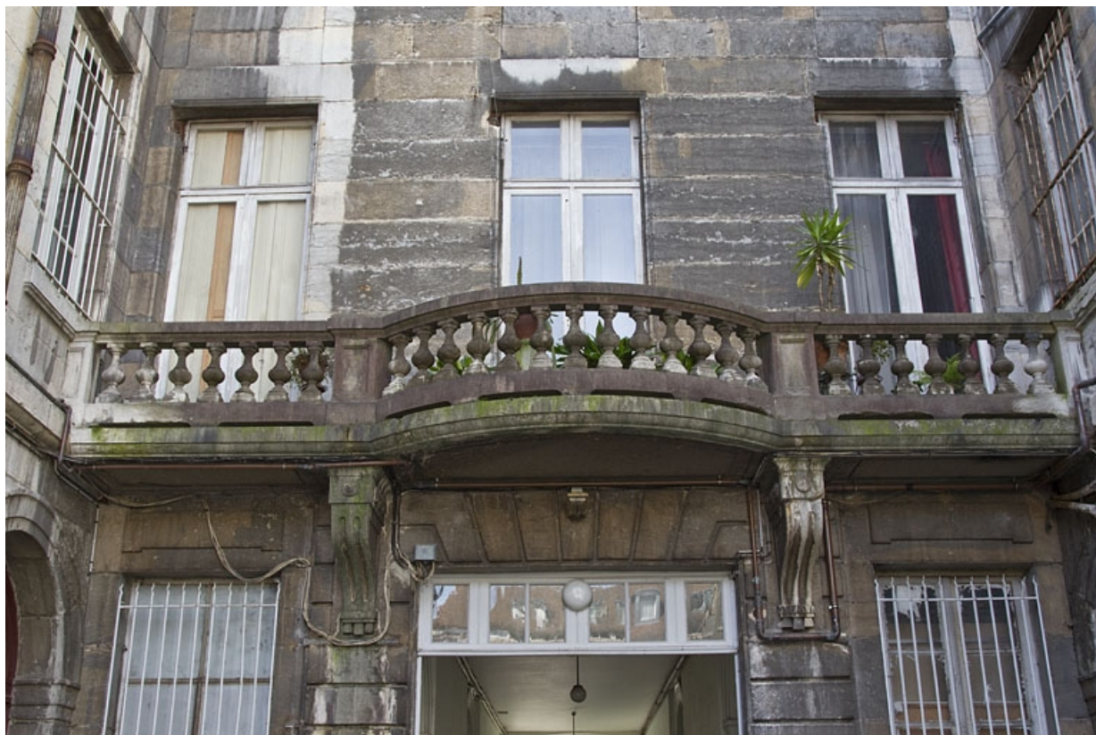
Logis principal, façade postérieure : détail du balcon du premier étage.

25, Besançon Grande Rue 49, lieudit : îlot Bouteiller