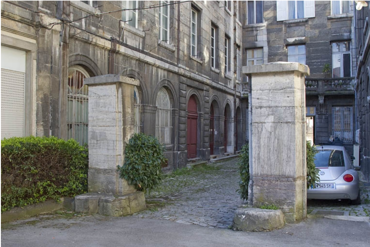
Aile droite : détail du rez-de-chaussée, de trois quarts gauche.

25, Besançon Grande Rue 49, lieudit : îlot Bouteiller