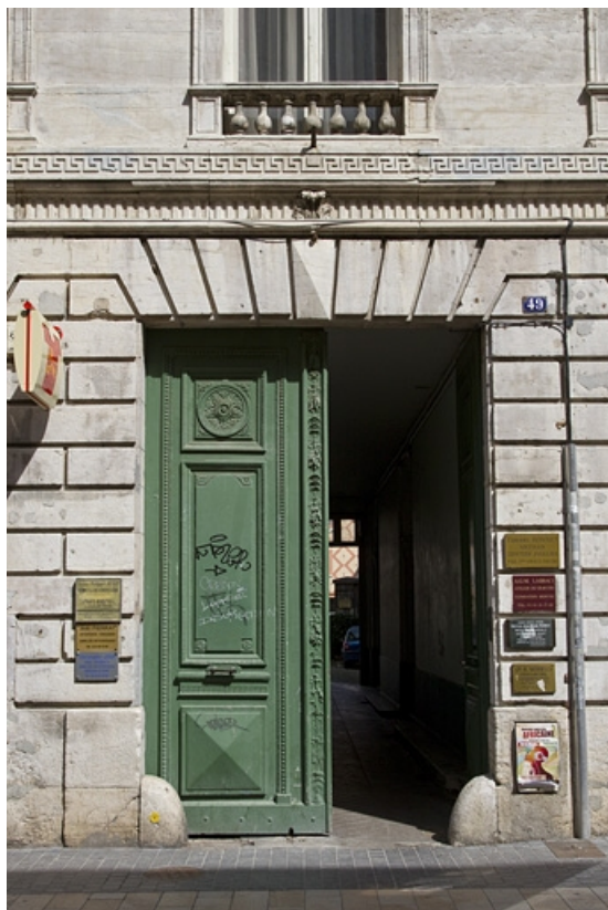
Logis principal, façade antérieure : détail du portail d'entrée.

25, Besançon Grande Rue 49, lieudit : îlot Bouteiller