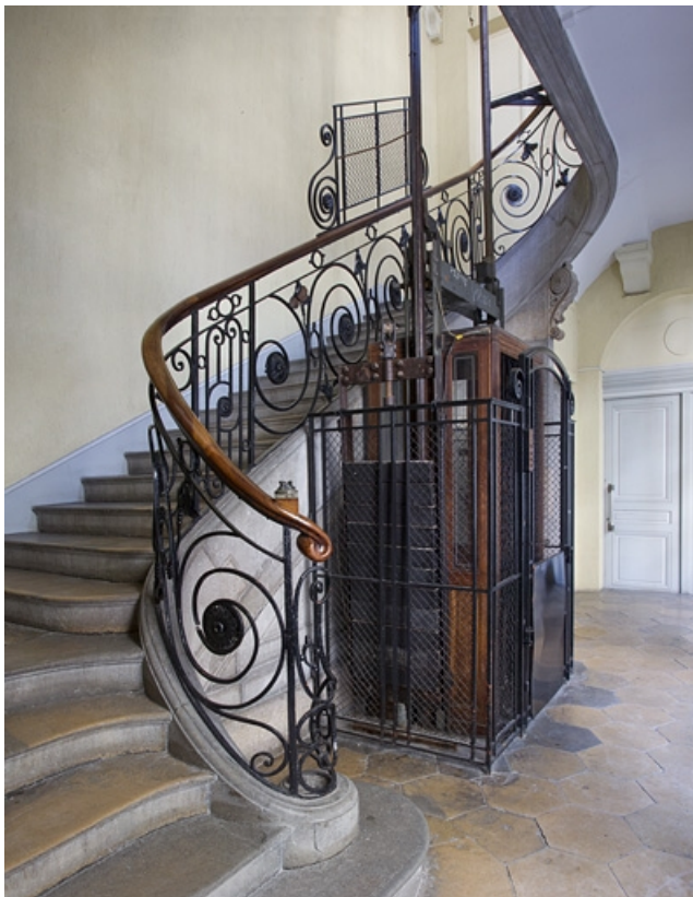
Aile droite : détail du départ de l'escalier et de l'ascenseur, vue éloignée de trois quart gauche. 25, Besançon Grande Rue 49, lieudit : îlot Bouteiller