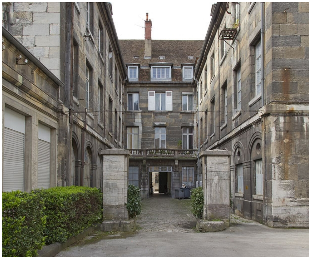
Logis principal : vue d'ensemble de la façade postérieure et des deux ailes sur cour.

25, Besançon Grande Rue 49, lieudit : îlot Bouteiller