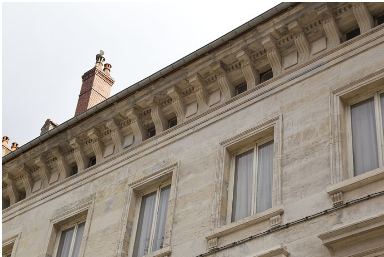
Logis principal : détail de la corniche du toit, de trois quarts droit.

25, Besançon Grande Rue 49, lieudit : îlot Bouteiller