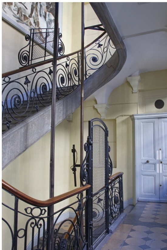
Aile droite, escalier : vue d'ensemble de la rampe en fer forgé.

25, Besançon Grande Rue 49, lieudit : îlot Bouteiller