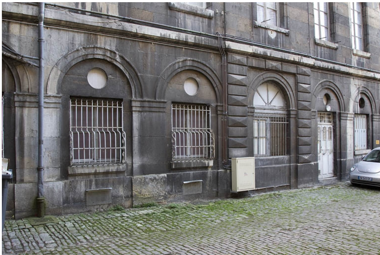
Aile gauche : détail du rez-de-chaussée, de trois quarts droit.

25, Besançon Grande Rue 49, lieudit : îlot Bouteiller