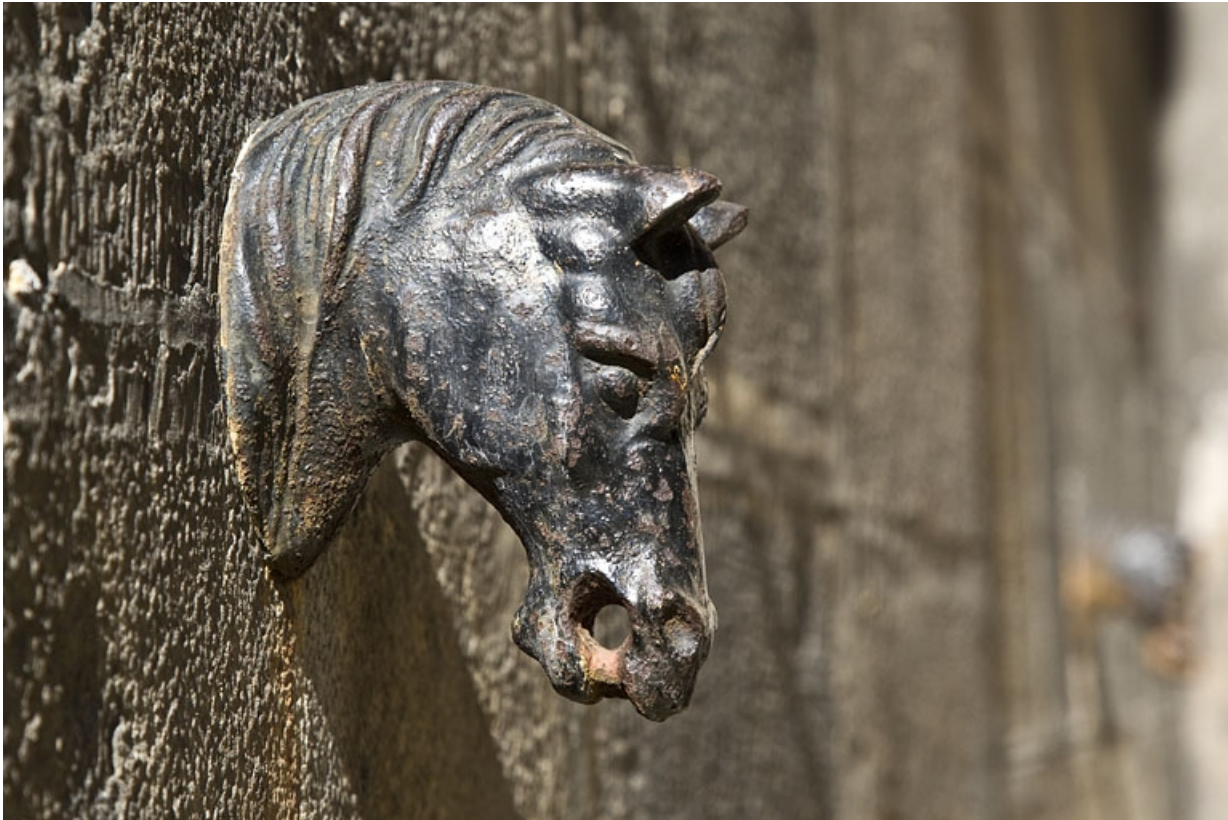
Aile des écuries : détail d'une attache en forme de tête de cheval.

25, Besançon Grande Rue 49, lieudit : îlot Bouteiller