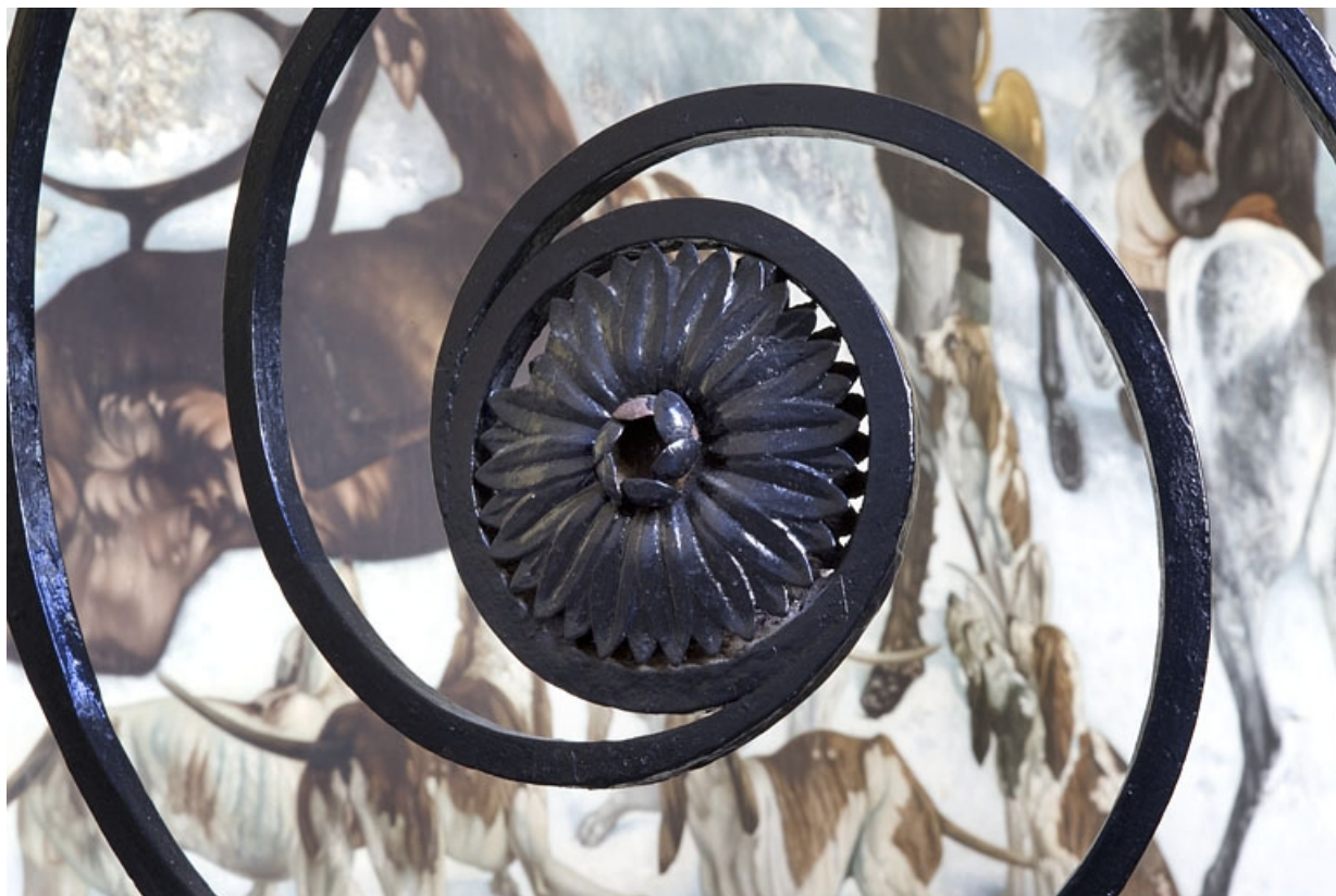
Aile droite, escalier : détail d'un mascarón de la rampe en fer forgé. 25, Besançon Grande Rue 49, lieudit : îlot Bouteiller