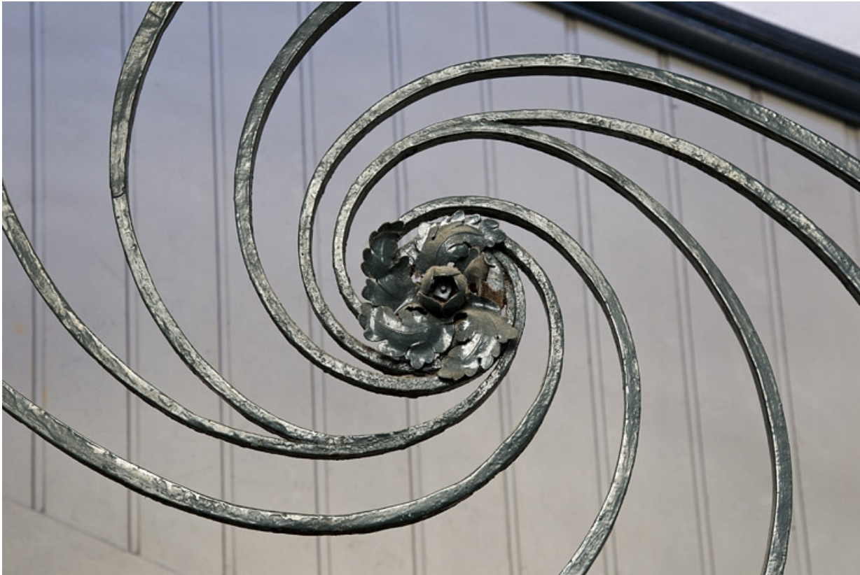
Logis principal, escalier : détail d'un motif en tourbillon de la rampe en fer forgé.

25, Besançon Grande Rue 39, lieudit : îlot Bouteiller