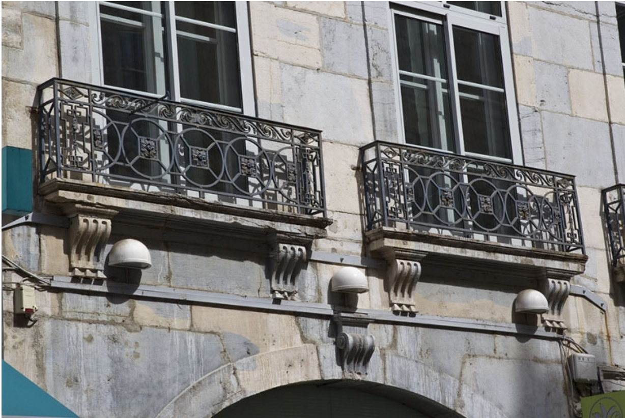
Logis principal, façade antérieure : détail de deux garde-corps en ferronnerie, fenêtres du premier étage. 25, Besançon Grande Rue 39, lieudit : îlot Bouteiller