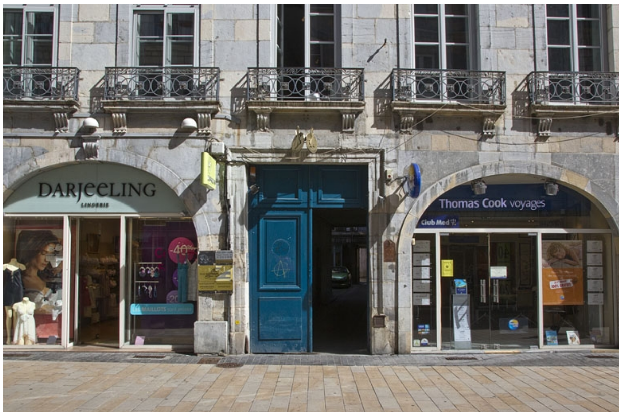
Logis principal, façade antérieure : détail du portail d'entrée.

25, Besançon Grande Rue 39, lieudit : îlot Bouteiller