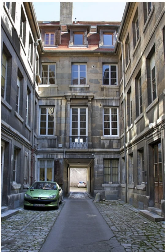
Logis principal : vue d'ensemble des façades en fond de cour.

25, Besançon Grande Rue 39, lieudit : îlot Bouteiller