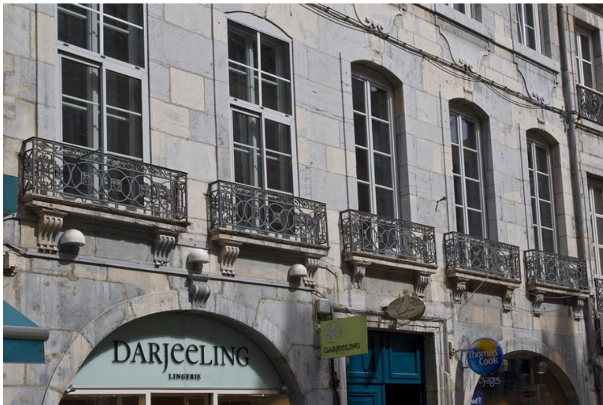
Logis principal, façade antérieure : détail des fenêtres du premier étage, de trois quarts gauche. 25, Besançon Grande Rue 39, lieudit : îlot Bouteiller