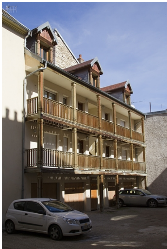
Deuxième cour : vue d'ensemble du logis secondaire gauche, de trois quarts gauche. 25, Besançon Grande Rue 39, lieudit : îlot Bouteiller