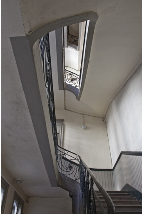
Logis principal : vue d'ensemble de l'escalier depuis le bas.

25, Besançon Grande Rue 39, lieudit : îlot Bouteiller