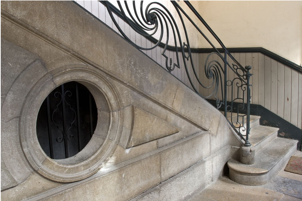
Logis principal : détail du départ de l'escalier.

25, Besançon Grande Rue 39, lieudit : îlot Bouteiller