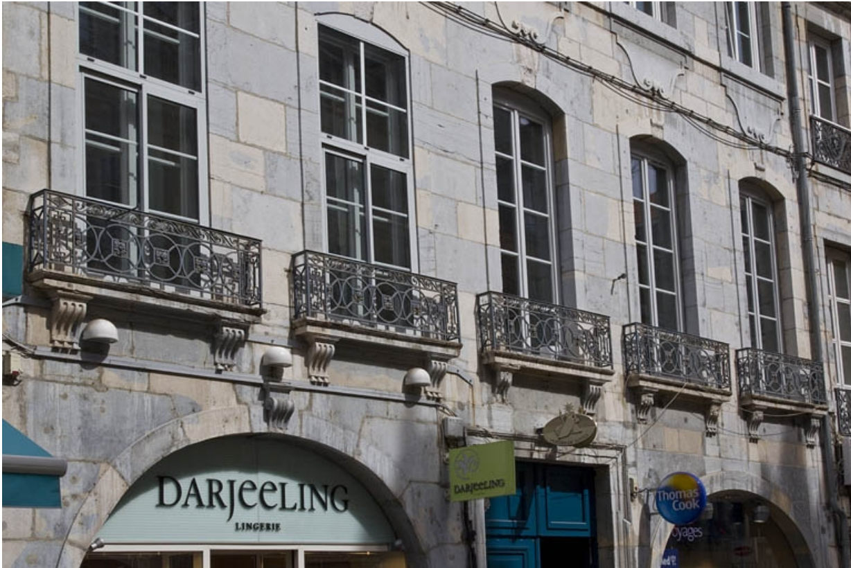
Logis principal, façade antérieure : détail des fenêtres du premier étage, de trois quarts gauche.

25, Besançon Grande Rue 39, lieudit : îlot Bouteiller