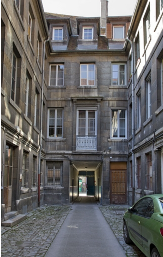
Logis principal : vue d'ensemble des façades depuis le fond de la cour.

25, Besançon Grande Rue 39, lieudit : îlot Bouteiller