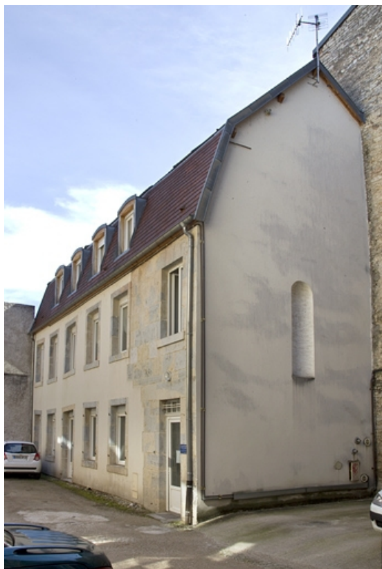
Deuxième cour : vue d'ensemble du logis secondaire droit, de trois quarts droit. 25, Besançon Grande Rue 39, lieudit : îlot Bouteiller