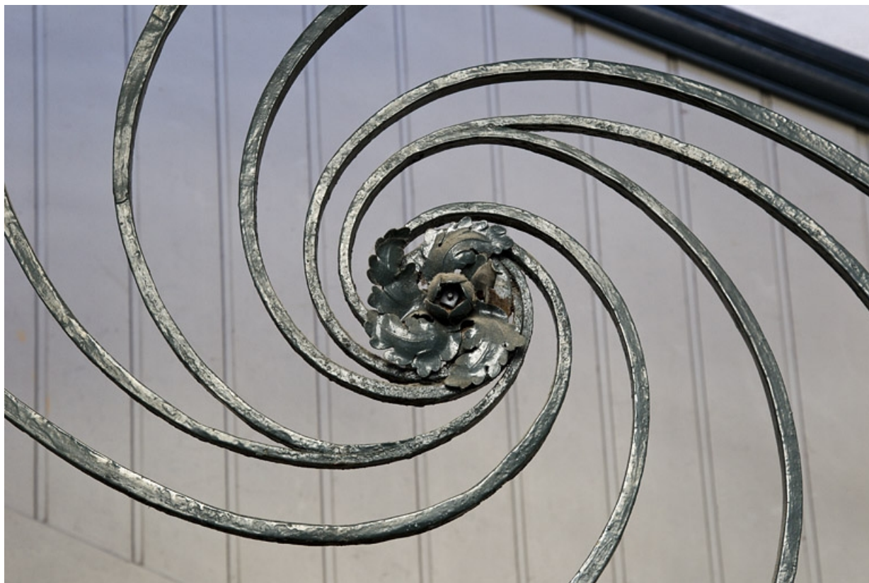
Logis principal, escalier : détail d'un motif en tourbillon de la rampe en fer forgé. 25, Besançon Grande Rue 39, lieudit : îlot Bouteiller