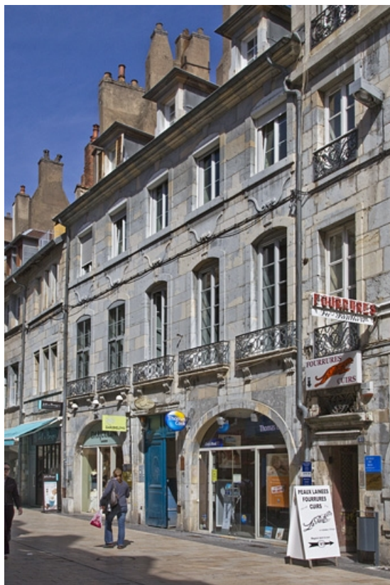
Logis principal : vue d'ensemble depuis la rue, de trois quarts droit. 25, Besançon Grande Rue 39, lieudit : îlot Bouteiller