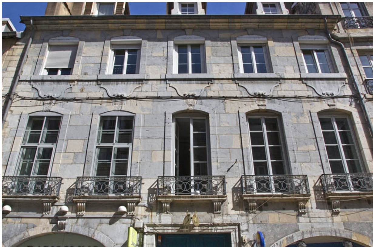
Logis principal, façade antérieure : détail de la partie supérieure.

25, Besançon Grande Rue 39, lieudit : îlot Bouteiller