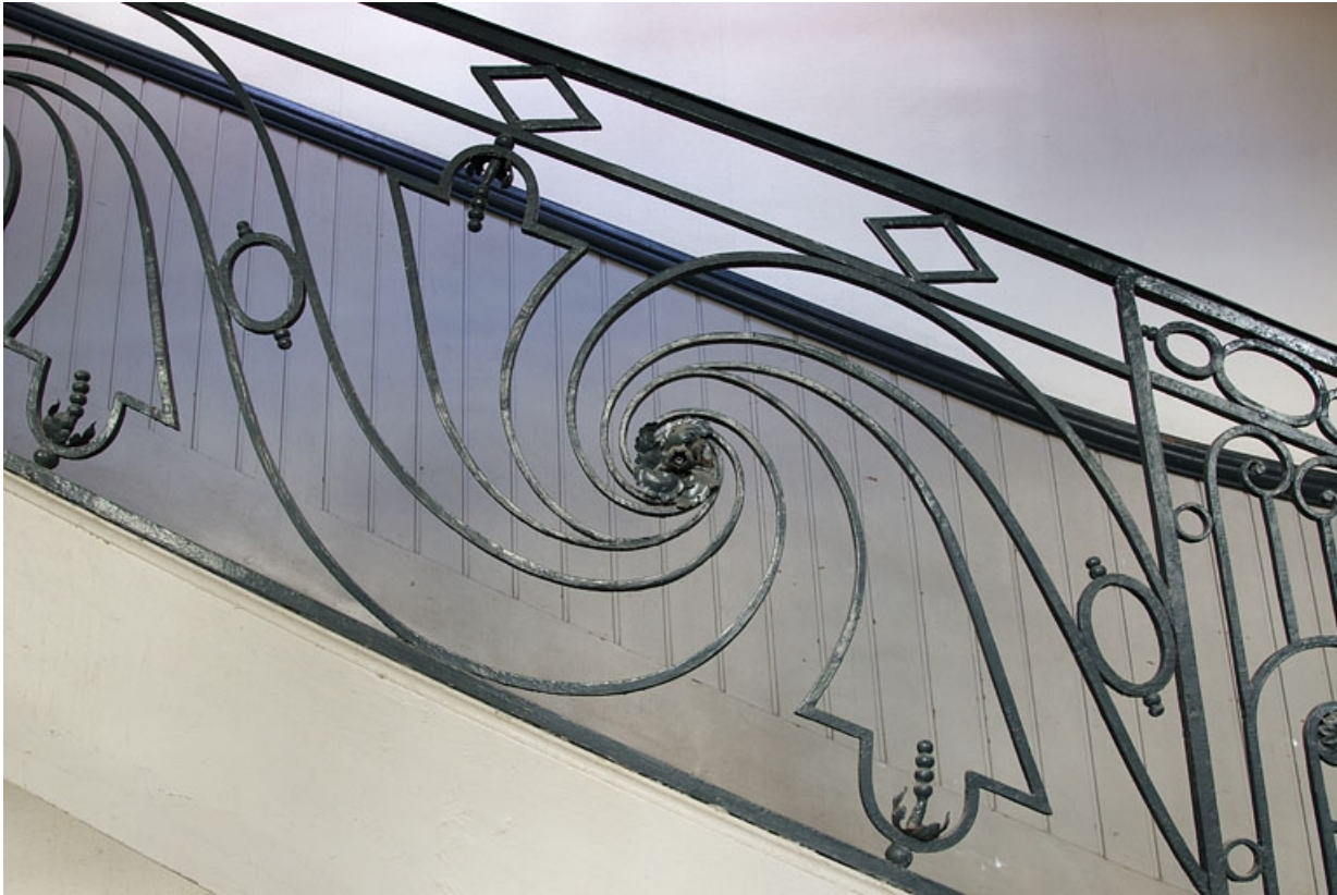
Logis principal, escalier : détail d'une partie de la rampe en fer forgé.

25, Besançon Grande Rue 39, lieudit : îlot Bouteiller