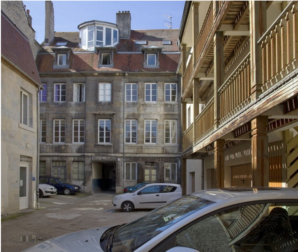
Logis principal : vue d'ensemble de la façade postérieure, depuis le fond de la deuxième cour. 25, Besançon Grande Rue 39, lieudit : îlot Bouteiller