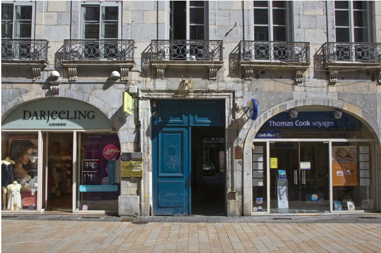
Logis principal, façade antérieure : détail du portail d'entrée.

25, Besançon Grande Rue 39, lieudit : îlot Bouteiller