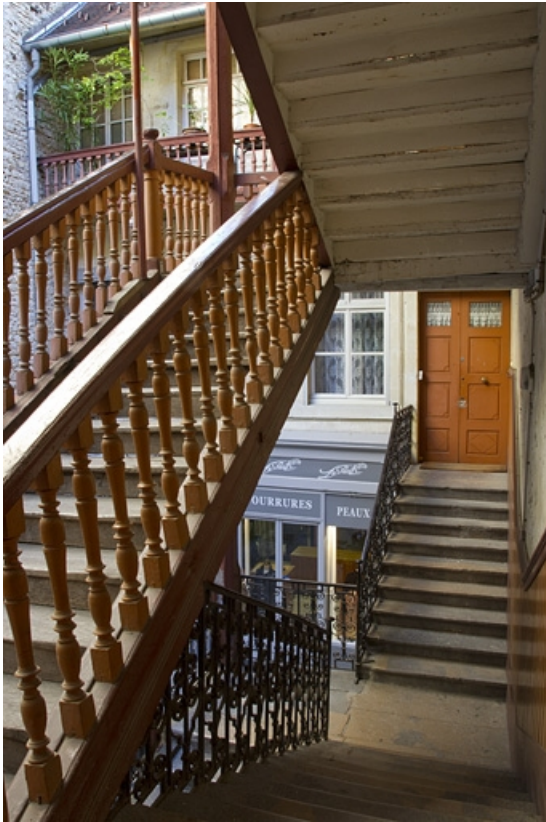
Escalier à cage ouverte : vue des volées depuis l'intérieur.

25, Besançon, 41 Grande Rue, lieudit : îlot Bouteiller