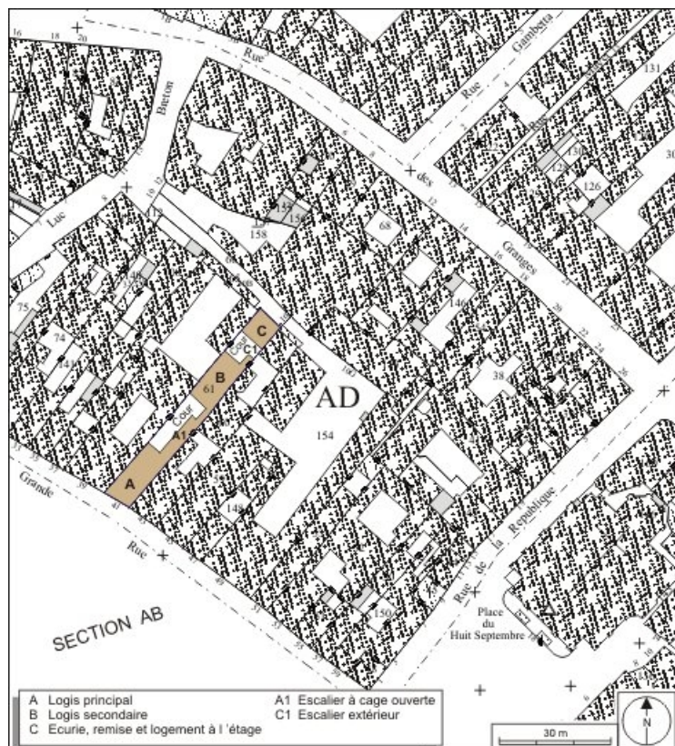
Plan masse et de situation. Extrait du plan cadastral, 1974, section AD. 25, Besançon, 41 Grande Rue, lieudit : îlot Bouteiller