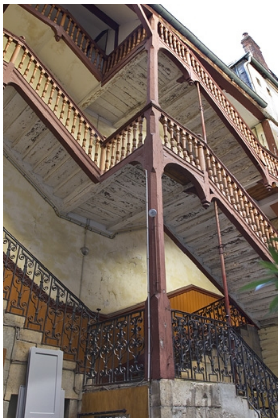
Vue d'ensemble de l'escalier à cage ouverte, de trois quarts gauche.

25, Besançon, 41 Grande Rue, lieudit : îlot Bouteiller