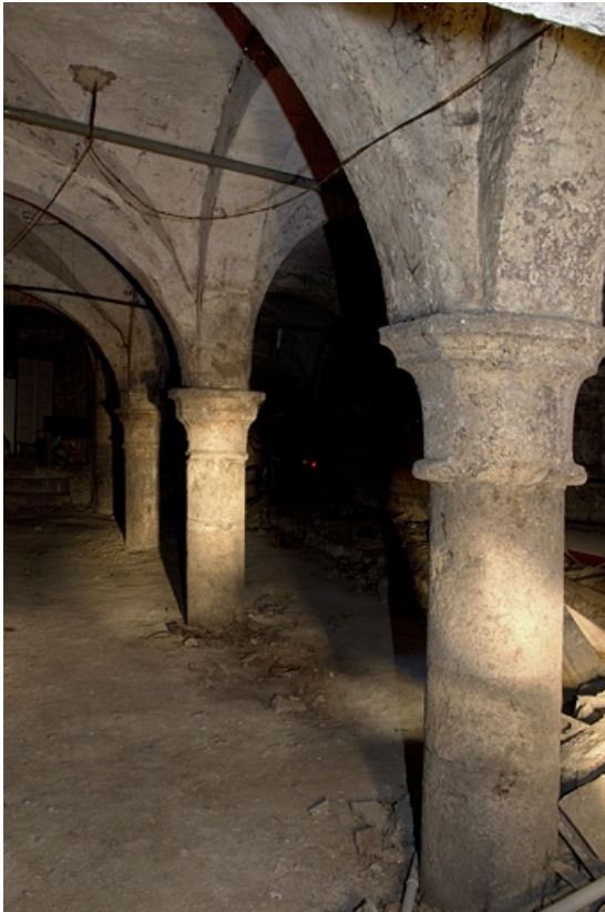
Logis principal : détail d'une rangée de colonnes de la cave.

25, Besançon, 41 Grande Rue, lieudit : îlot Bouteiller