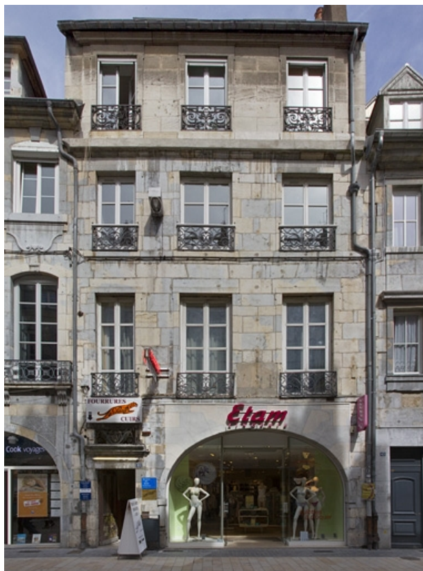
Logis principal : vue d'ensemble de la façade antérieure, de face.

25, Besançon, 41 Grande Rue, lieudit : îlot Bouteiller