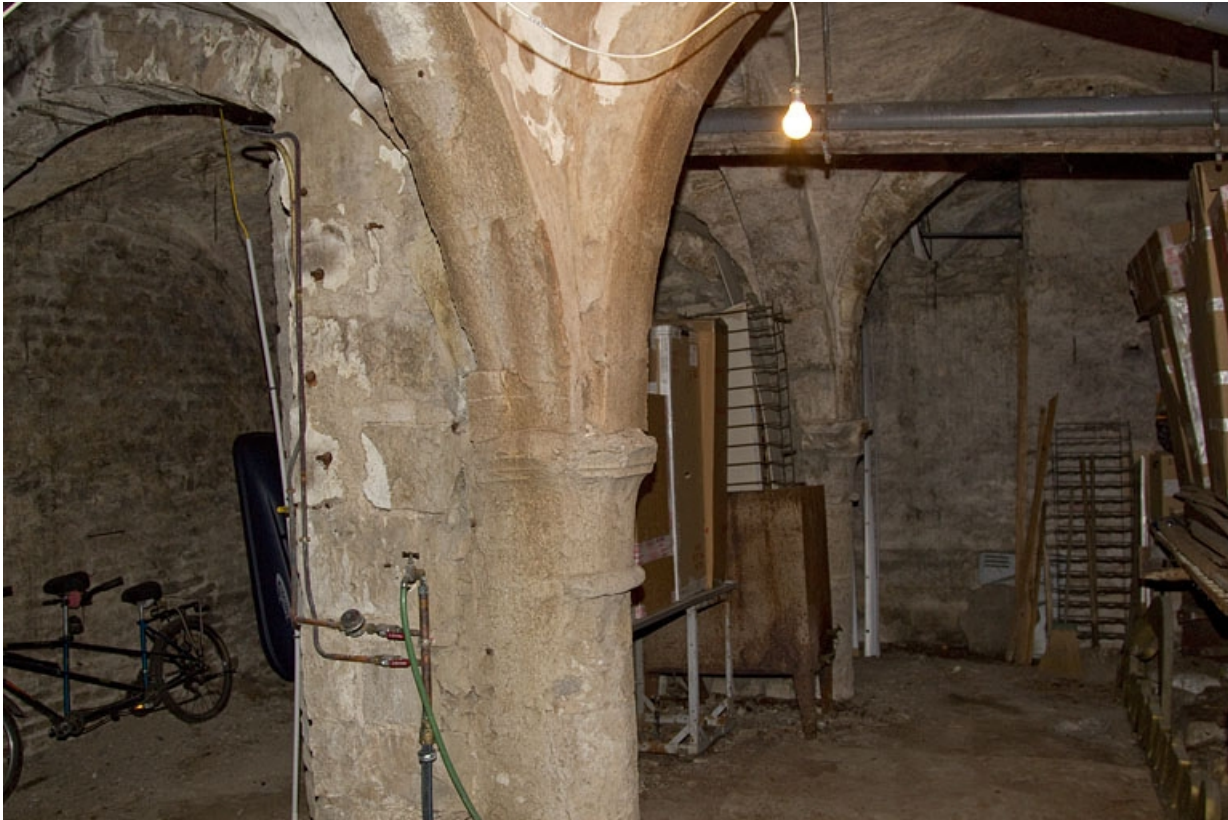
Logis principal : vue d'ensemble d'une partie de la cave.

25, Besançon, 41 Grande Rue, lieudit : îlot Bouteiller