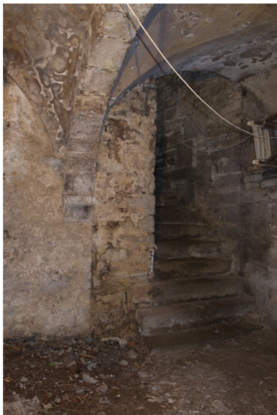
Logis principal : détail de l'escalier de la cave.

25, Besançon, 41 Grande Rue, lieudit : îlot Bouteiller