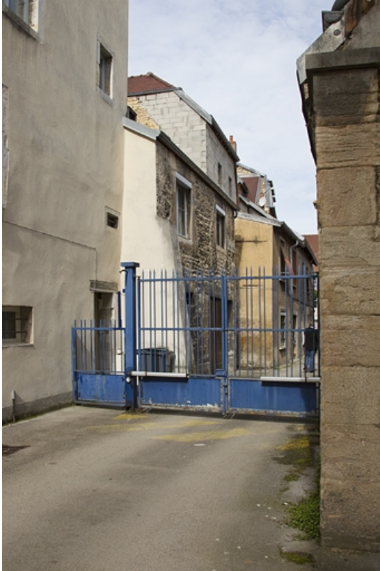
Logis principal, façade postérieure du bâtiment des remise et écurie, de trois quarts gauche. 25, Besançon, 41 Grande Rue, lieudit : îlot Bouteiller