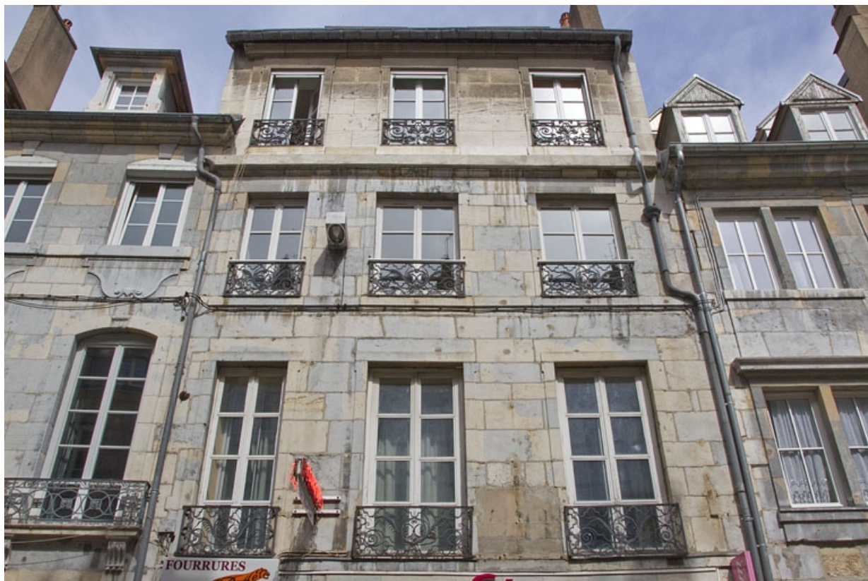
Logis principal, façade antérieure : détail des étages, de face.

25, Besançon, 41 Grande Rue, lieudit : îlot Bouteiller