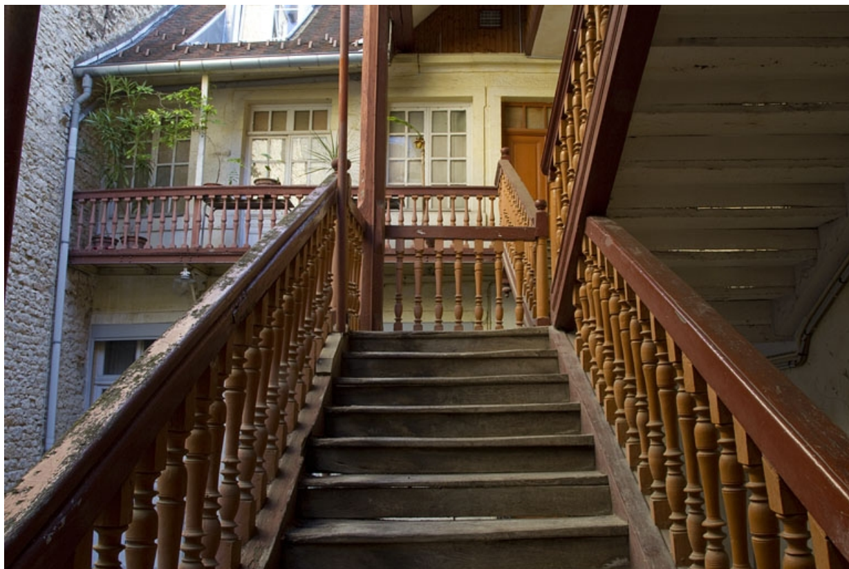
Vue d'ensemble du balcon de l'étage du logis secondaire et de l'intérieur de l'escalier à cage ouverte.

25, Besançon, 41 Grande Rue, lieudit : îlot Bouteiller