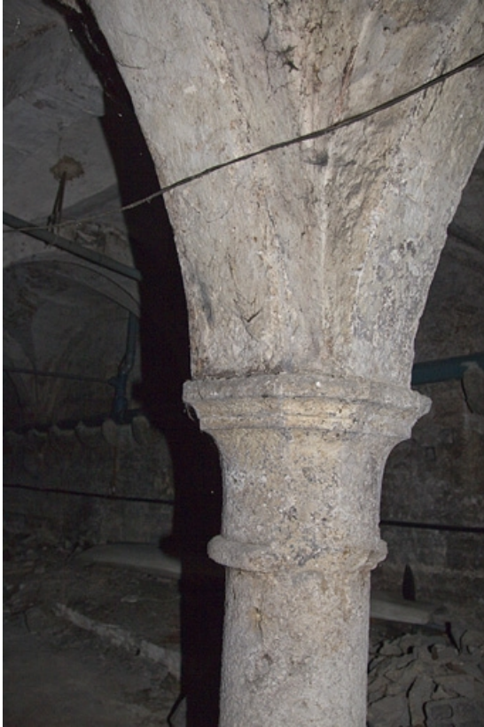
Logis principal : détail du chapiteau d'une colonne soutenant les voûtes de de la cave.

25, Besançon, 41 Grande Rue, lieudit : îlot Bouteiller