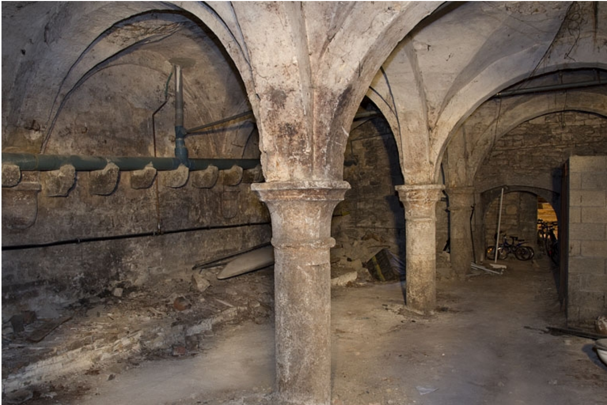
Logis principal : vue d'ensemble d'une partie de la cave, depuis le fond.

25, Besançon, 41 Grande Rue, lieudit : îlot Bouteiller