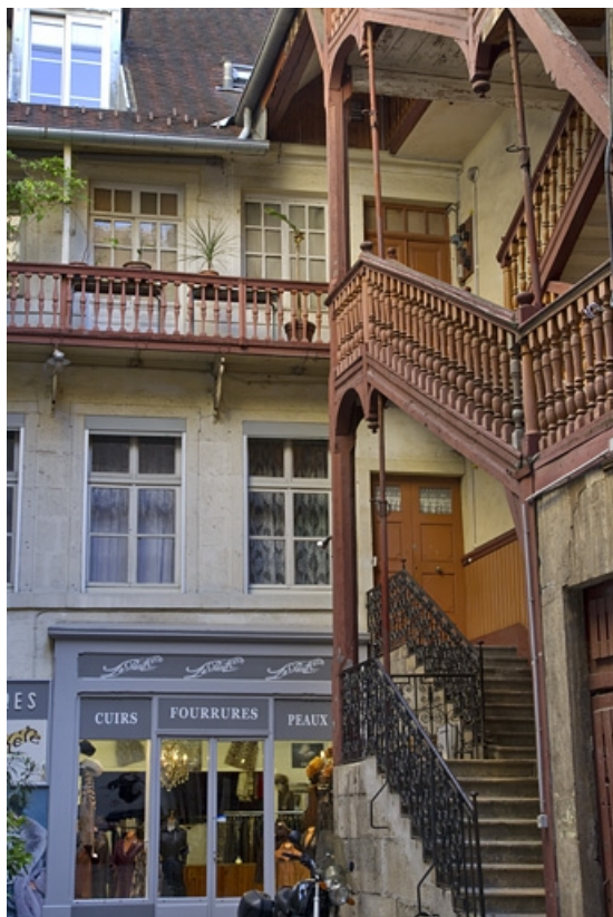
Logis secondaire : détail de la façade antérieure avec l'escalier à cage ouverte.

25, Besançon, 41 Grande Rue, lieudit : îlot Bouteiller