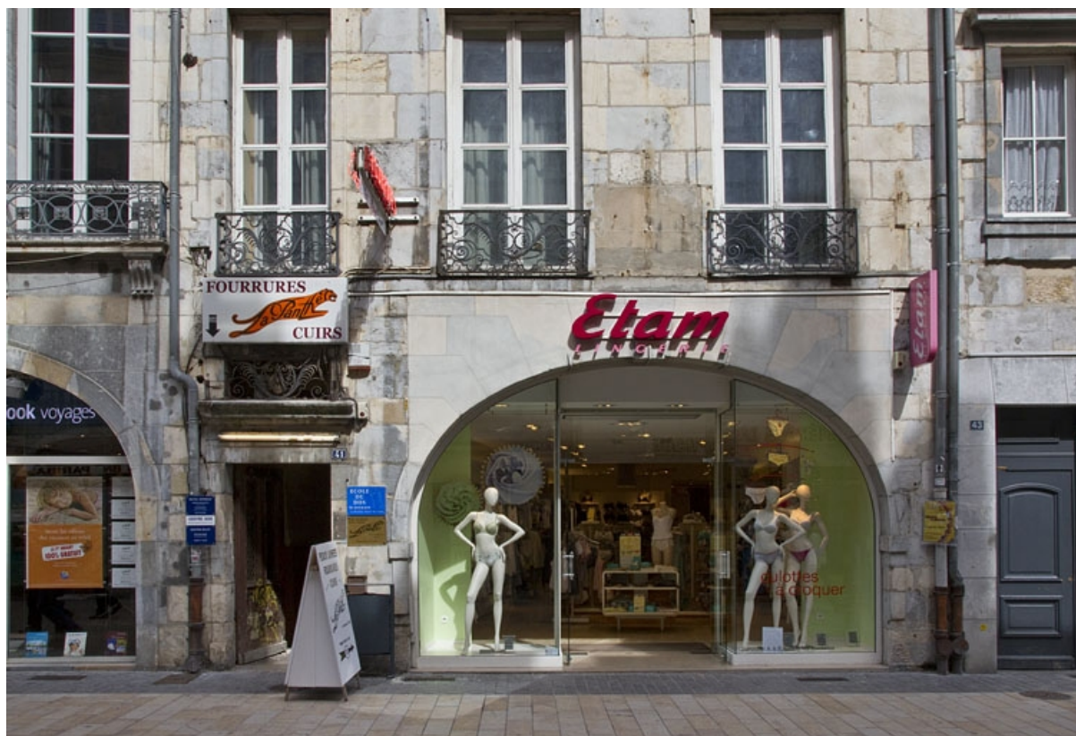
Logis principal, façade antérieure : détail du rez-de-chaussée, de face. 25, Besançon, 41 Grande Rue, lieudit : îlot Bouteiller