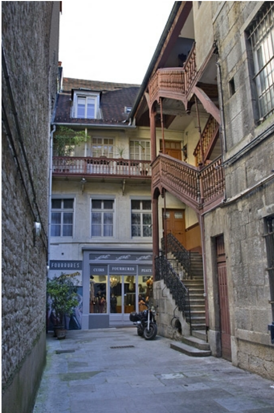
Logis secondaire : vue d'ensemble depuis l'entrée de la cour.

25, Besançon, 41 Grande Rue, lieudit : îlot Bouteiller