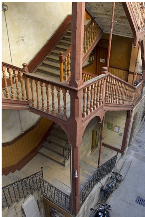
Vue d'ensemble de l'escalier à cage ouverte, en plongée.

25, Besançon, 41 Grande Rue, lieudit : îlot Bouteiller