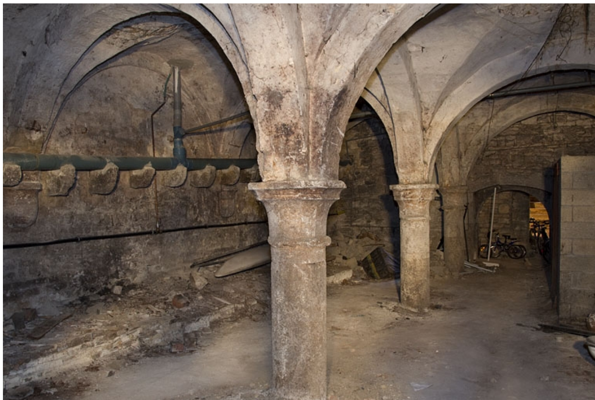
Logis principal : vue d'ensemble d'une partie de la cave, depuis le fond.

25, Besançon, 41 Grande Rue, lieudit : îlot Bouteiller