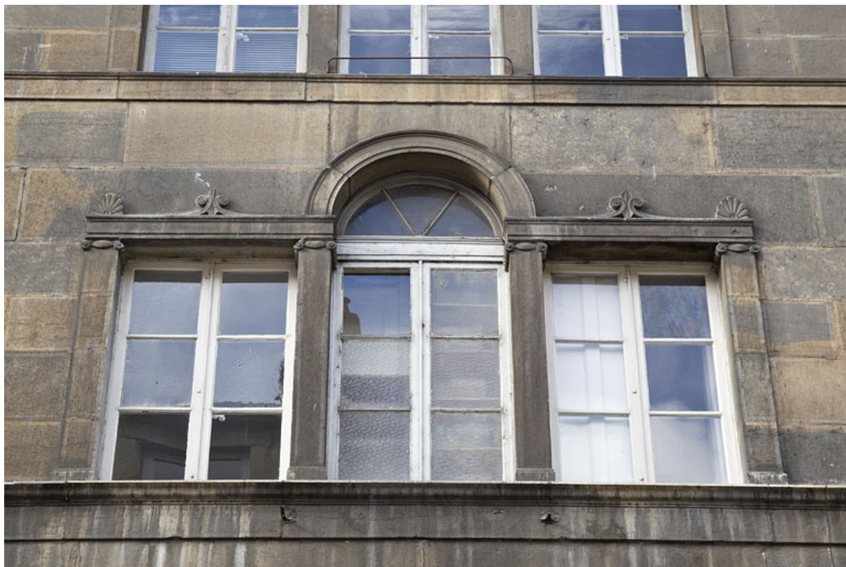
Logis principal, façade sur rue : détail de la serlienne du deuxième étage.

25, Besançon, 16 rue des Granges, lieudit : îlot Bouteiller