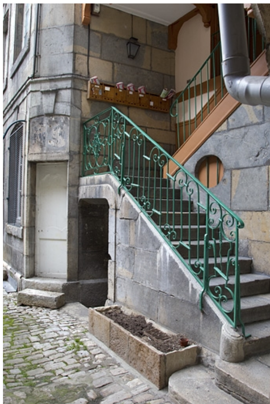
Escalier à cage ouverte sur cour : détail de la rampe en fer forgé de la première volée. 25, Besançon, 16 rue des Granges, lieudit : îlot Bouteiller