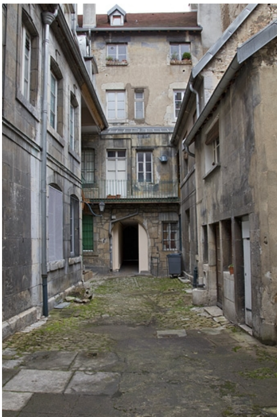
Vue d'ensemble des bâtiments depuis le fond de la cour.

25, Besançon, 16 rue des Granges, lieudit : îlot Bouteiller