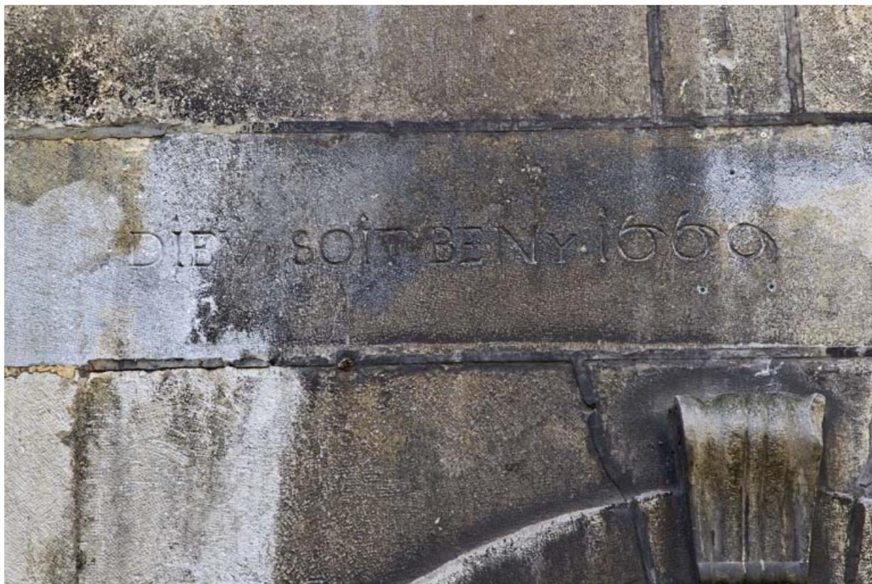
Logis secondaire en fond de cour : détail de l'inscription et de la date.

25, Besançon, 16 rue des Granges, lieudit : îlot Bouteiller