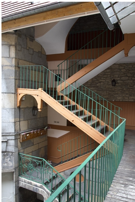
Vue d'ensemble de l'escalier à cage ouverte sur cour. 25, Besançon, 16 rue des Granges, lieudit : îlot Bouteiller