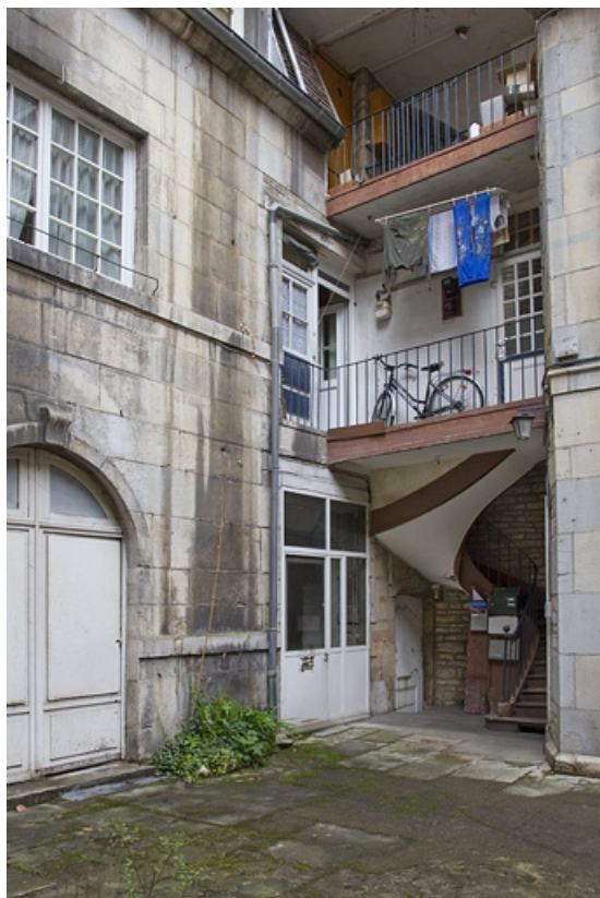
Vue d'ensemble de l'escalier secondaire à cage ouverte, à droite au fond de la cour. 25, Besançon, 16 rue des Granges, lieudit : îlot Bouteiller