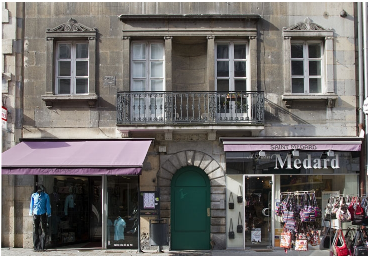
Logis principal : détail du rez-de-chaussée sur rue. 25, Besançon, 16 rue des Granges, lieudit : îlot Bouteiller