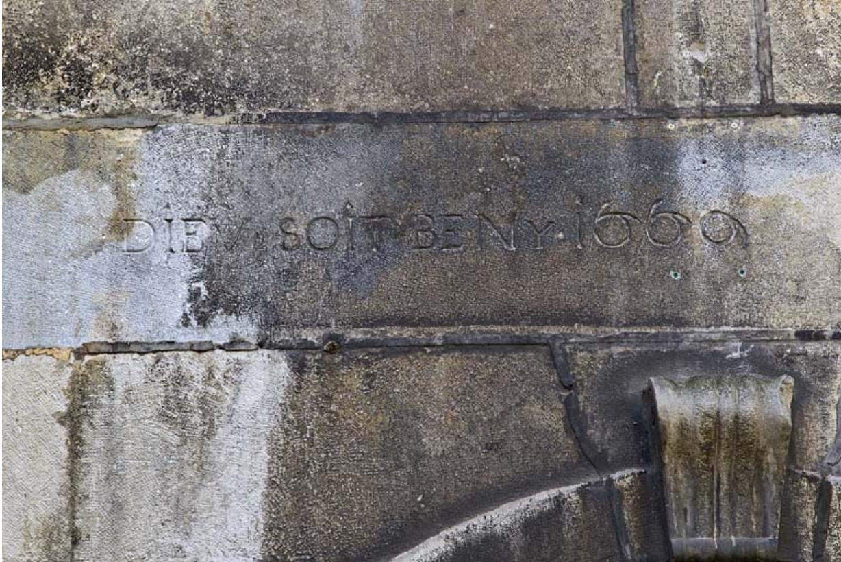
Logis secondaire en fond de cour : détail de l'inscription et de la date.

25, Besançon, 16 rue des Granges, lieudit : îlot Bouteiller