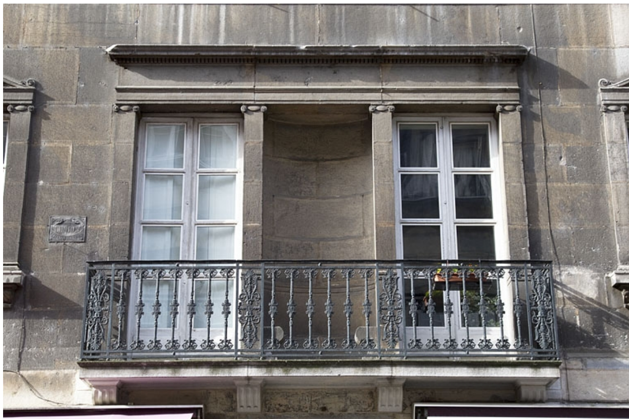
Logis principal, façade sur rue : détail de la serlienne du premier étage.

25, Besançon, 16 rue des Granges, lieudit : îlot Bouteiller