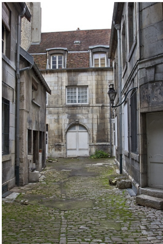
Vue d'ensemble des bâtiments sur cour depuis l'entrée.

25, Besançon, 16 rue des Granges, lieudit : îlot Bouteiller