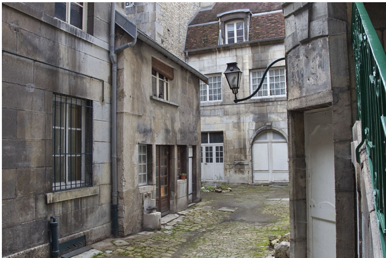
Logis secondaire gauche : détail de l'extrémité de l'aile, de trois quarts gauche. 25, Besançon, 16 rue des Granges, lieudit : îlot Bouteiller