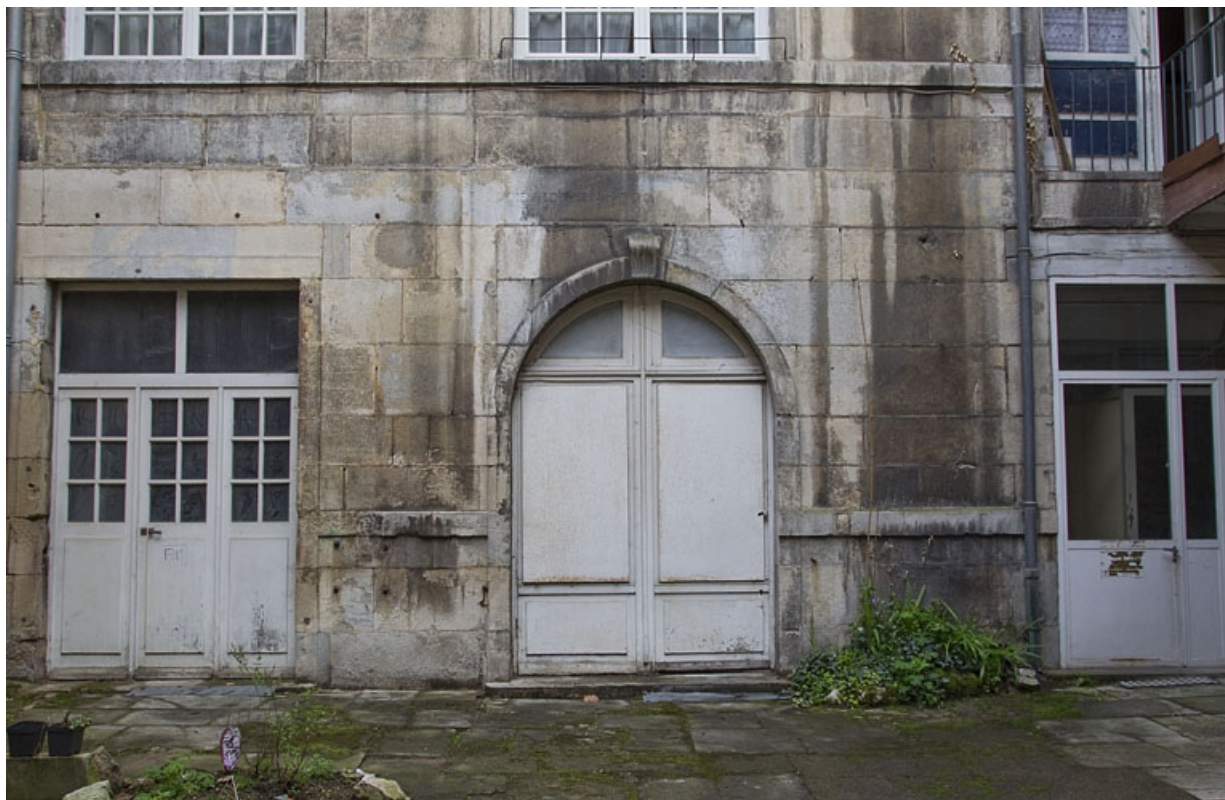
Logis secondaire en fond de cour : détail du rez-de-chaussée.

25, Besançon, 16 rue des Granges, lieudit : îlot Bouteiller