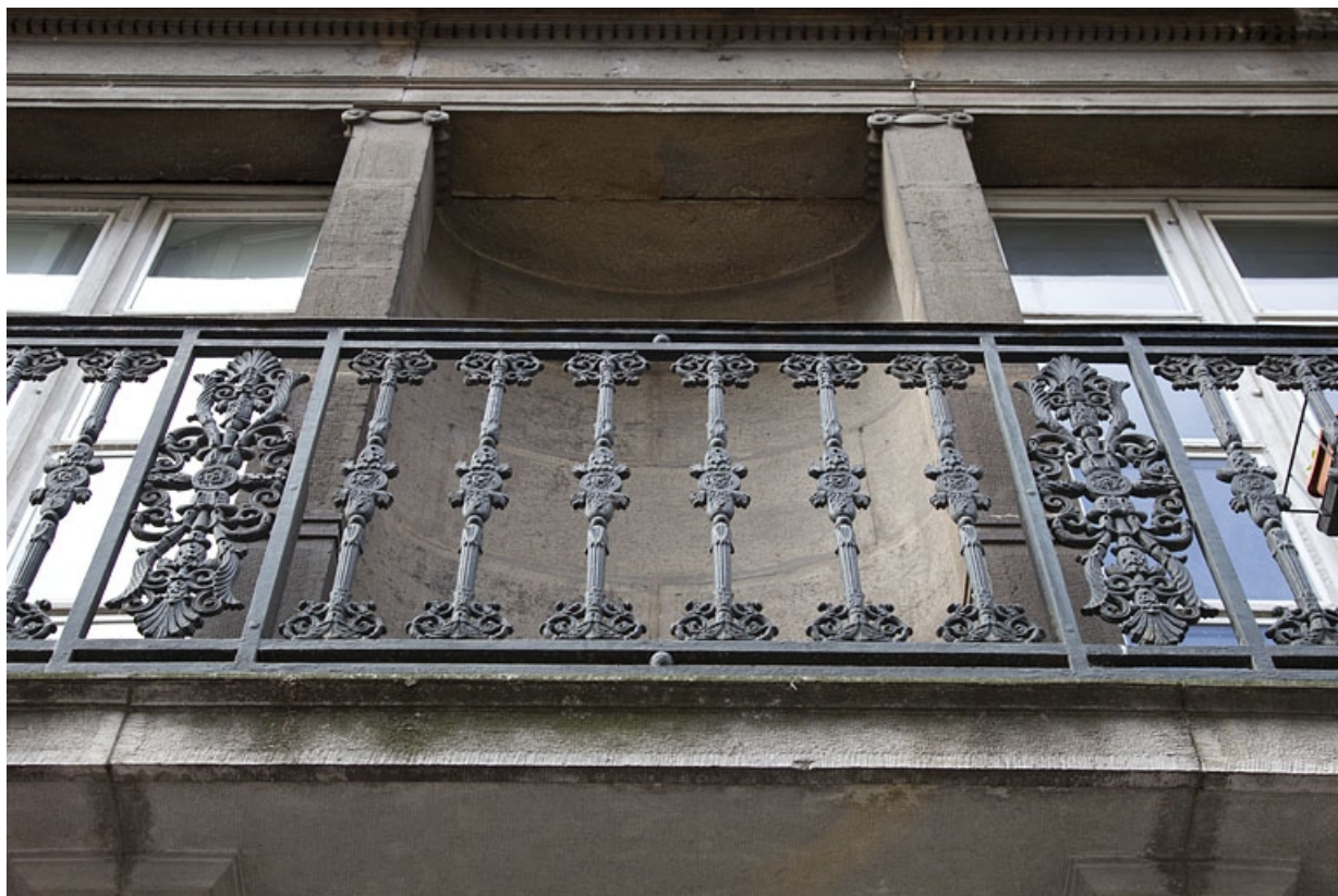
Logis principal, façade sur rue : détail du balcon en fonte du premier étage.

25, Besançon, 16 rue des Granges, lieudit : îlot Bouteiller