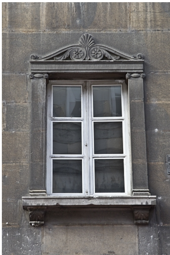
Logis principal, façade sur rue : détail d'une fenêtre du premier étage.

25, Besançon, 16 rue des Granges, lieudit : îlot Bouteiller