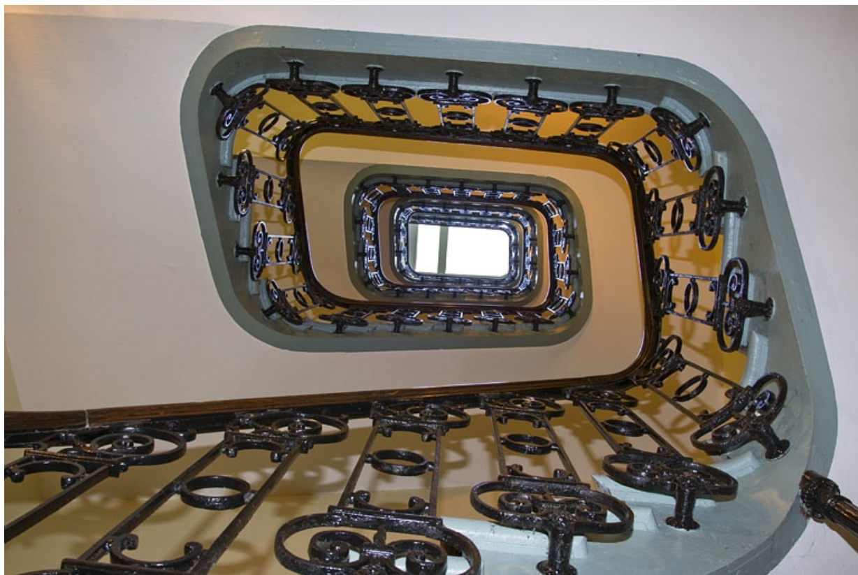
Logis principal droit : vue d'ensemble de l'escalier, en contre-plongée.

25, Besançon, 17, 19 place du Huit Septembre, lieudit : îlot Bouteiller