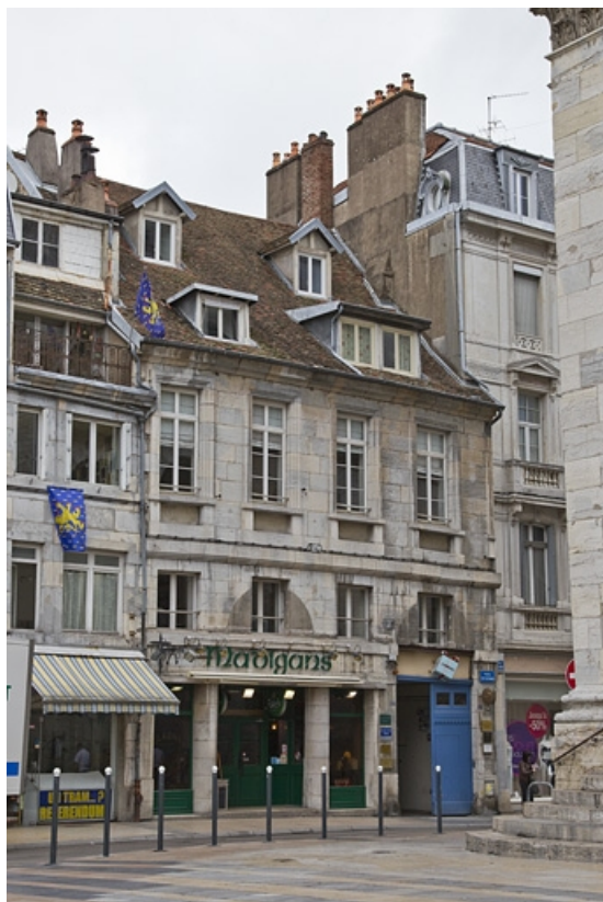
Logis principal gauche : vue d'ensemble depuis la rue, de trois quarts gauche. 25, Besançon, 17, 19 place du Huit Septembre, lieudit : îlot Bouteiller