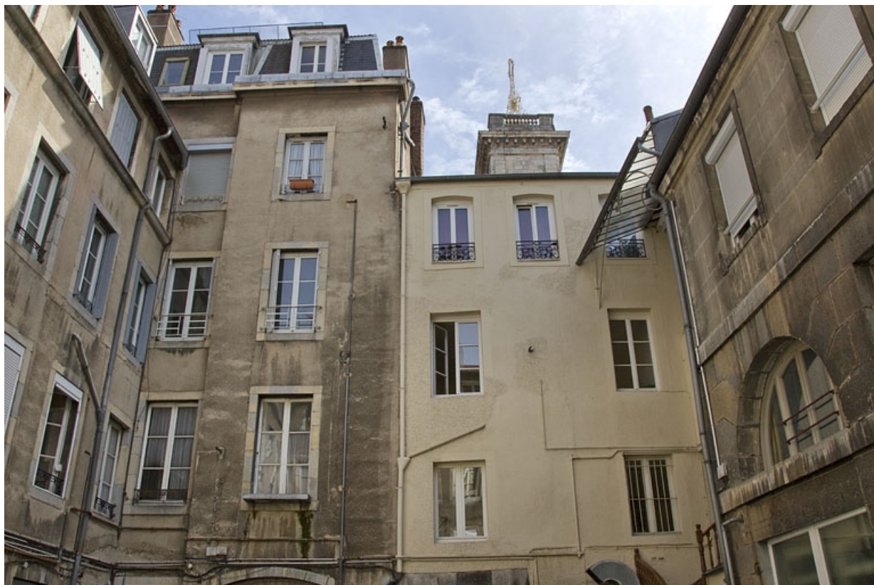
Vue d'ensemble des façade postérieures des deux logis principaux, de face. 25, Besançon, 17, 19 place du Huit Septembre, lieudit : îlot Bouteiller