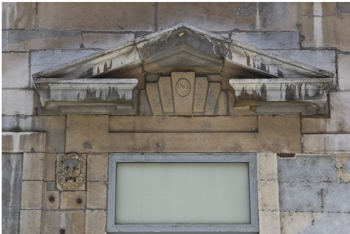
Façade antérieure, partie droite, rez-de-chaussée : détail du fronton de la troisième fenêtres à partir de la droite. 25, Besançon, 2, 4 rue des Granges, lieudit : îlot Bouteiller