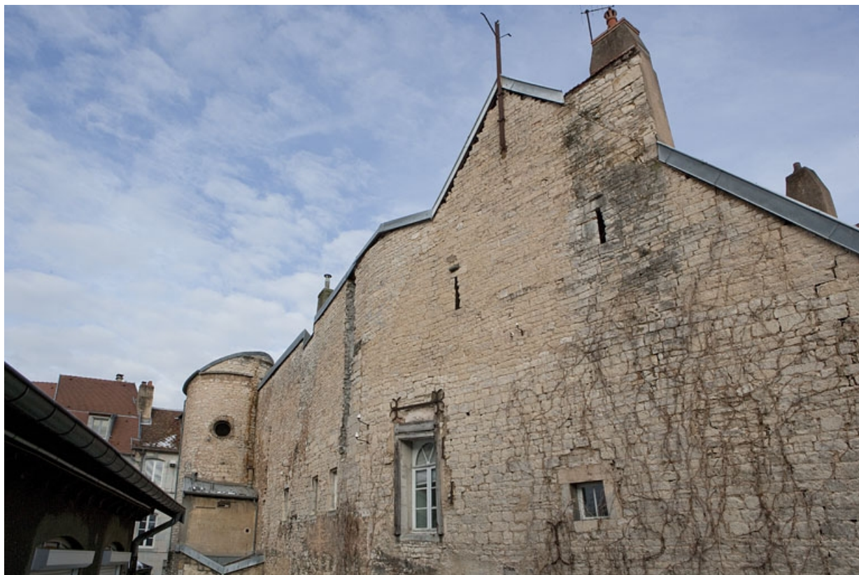
Façade postérieure donnant sur l'impasse : vue de la partie supérieure, de trois quarts droit. 25, Besançon, 2, 4 rue des Granges, lieudit : îlot Bouteiller