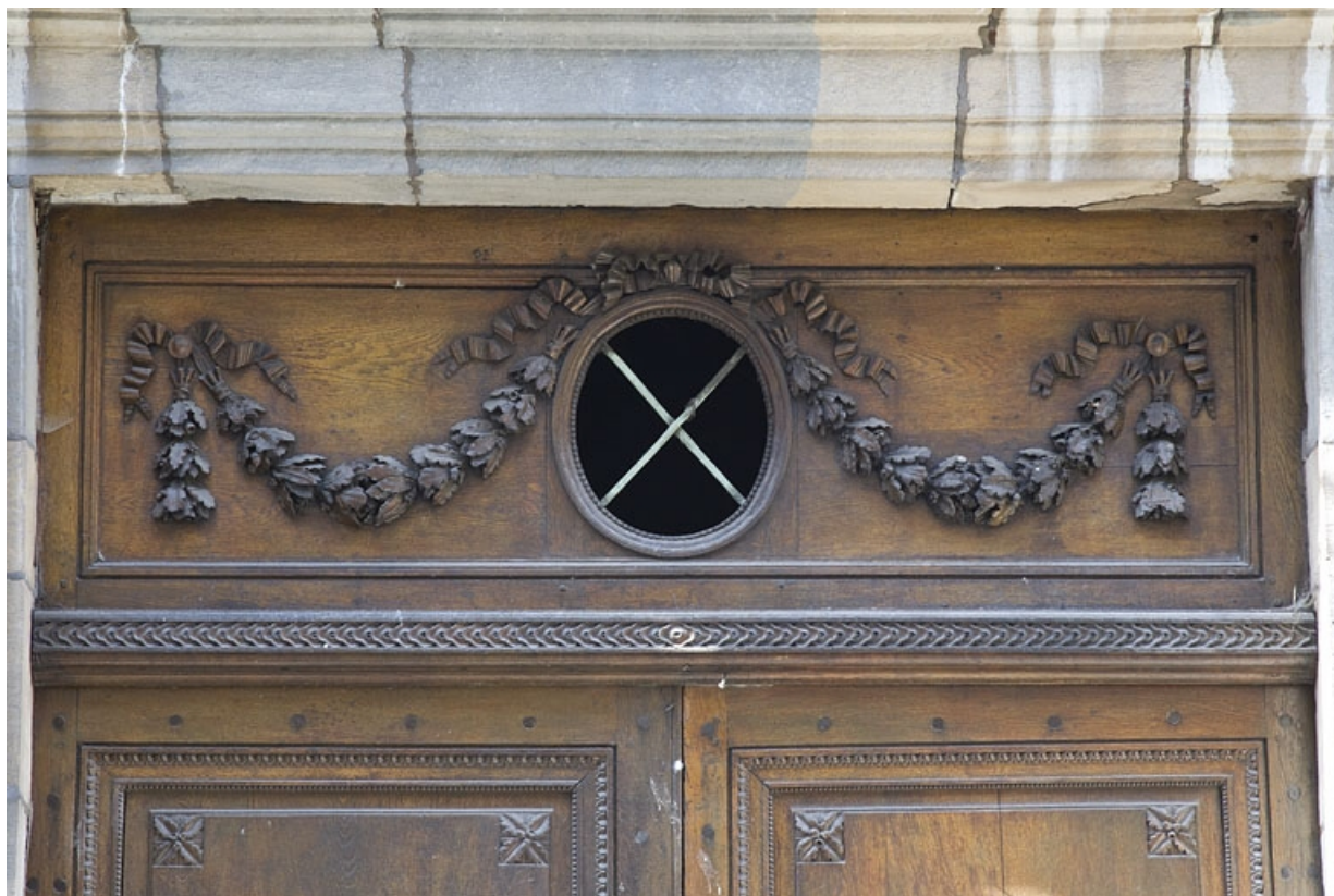
Façade antérieure, partie gauche, portail d'entrée : détail du décor de la partie supérieure.

25, Besançon, 2, 4 rue des Granges, lieudit : îlot Bouteiller