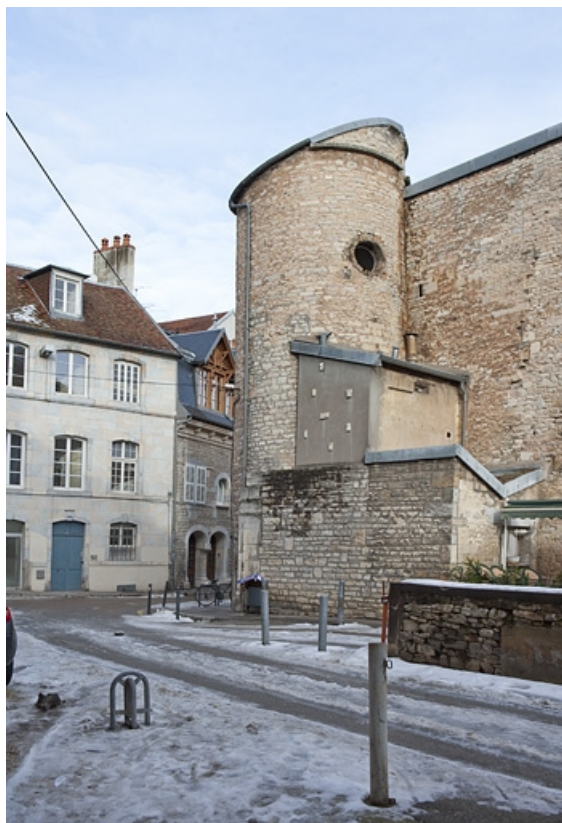
Vue d'ensemble du pigeonnier depuis l'impasse.

25, Besançon, 2, 4 rue des Granges, lieudit : îlot Bouteiller