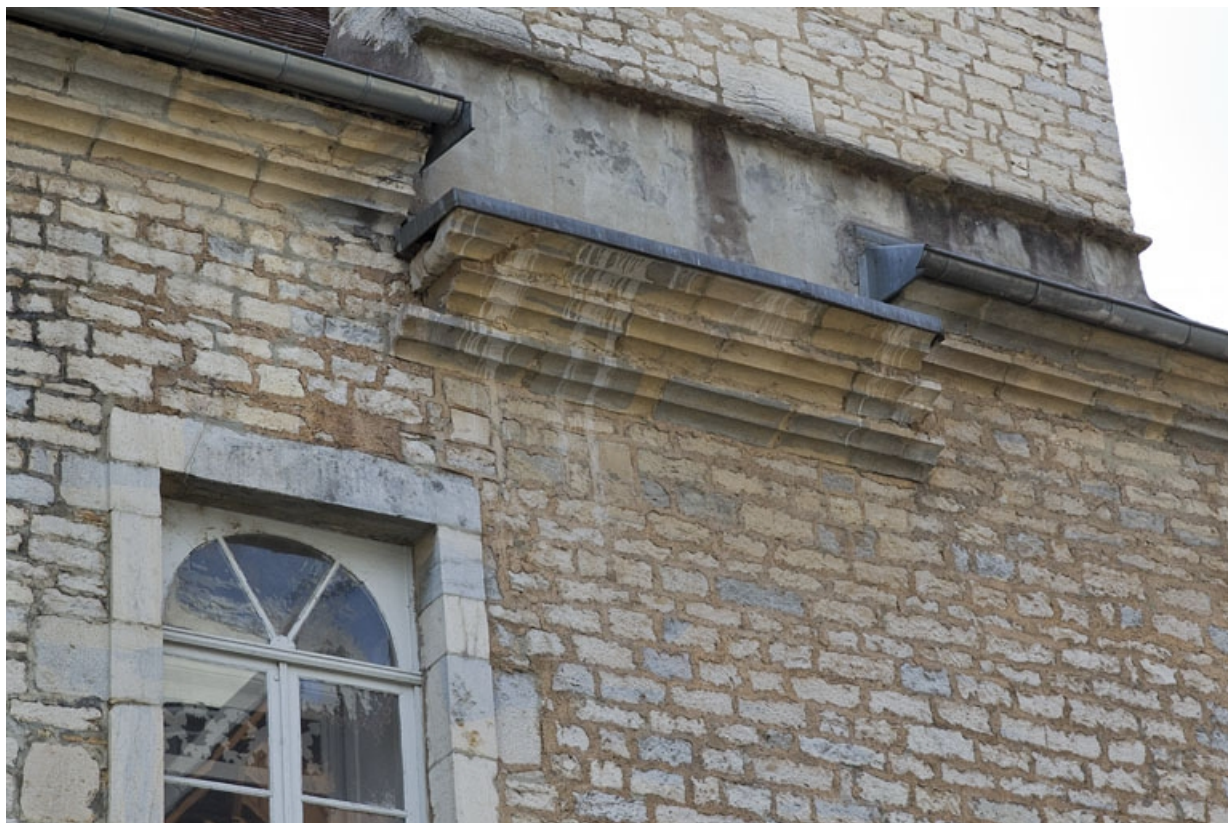
Façade latérale droite : détail de la corniche sous le toit.

25, Besançon, 2, 4 rue des Granges, lieudit : îlot Bouteiller