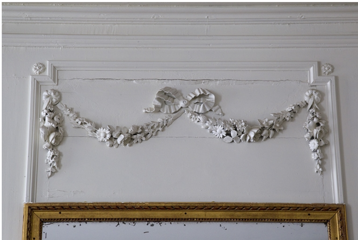
Intérieur, chambre à gauche du salon : partie supérieure d'un lambris, détail d'une guirlande de fleurs.

25, Besançon, 2, 4 rue des Granges, lieudit : îlot Bouteiller