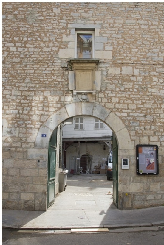
Façade latérale droite : détail du portail d'entrée.

25, Besançon, 2, 4 rue des Granges, lieudit : îlot Bouteiller