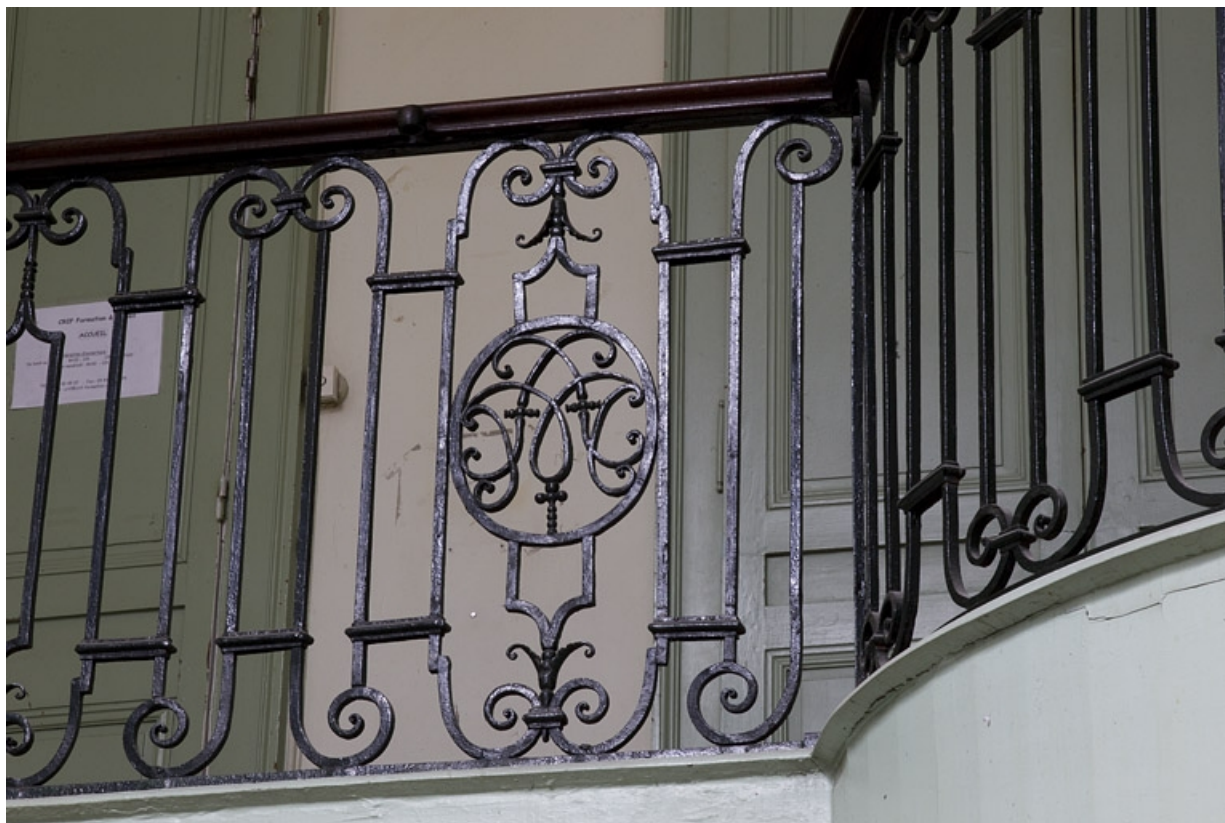
Intérieur, escalier d'honneur : détail du monogramme sur la rampe en fer forgé. 25, Besançon, 2, 4 rue des Granges, lieudit : îlot Bouteiller