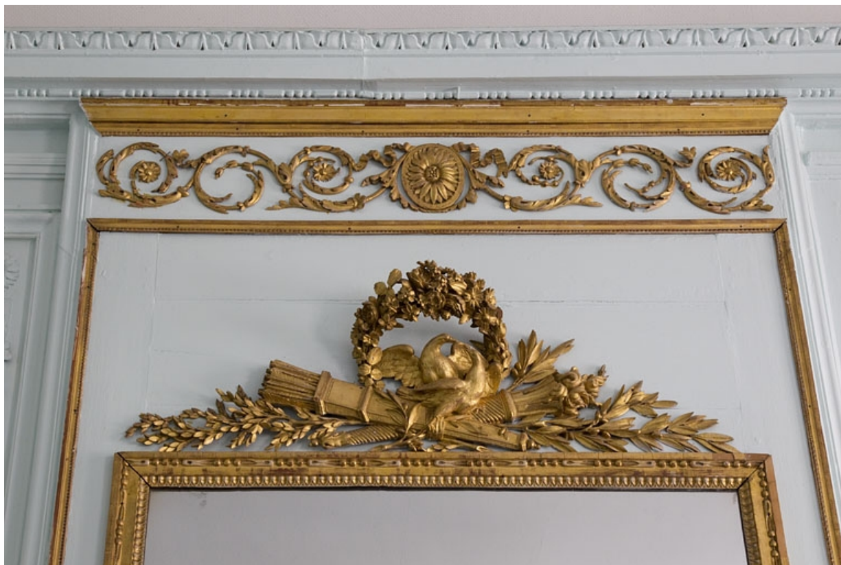
Intérieur, salon : détail du décor de la glace de cheminée et de la partie supérieure du trumeau.

25, Besançon, 2, 4 rue des Granges, lieudit : îlot Bouteiller