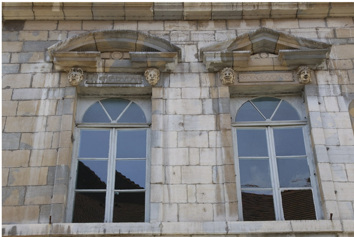
Façade antérieure, partie droite, premier étage : vue d'ensemble de la cinquième et sixième fenêtres à partir de la droite. 25, Besançon, 2, 4 rue des Granges, lieudit : îlot Bouteiller