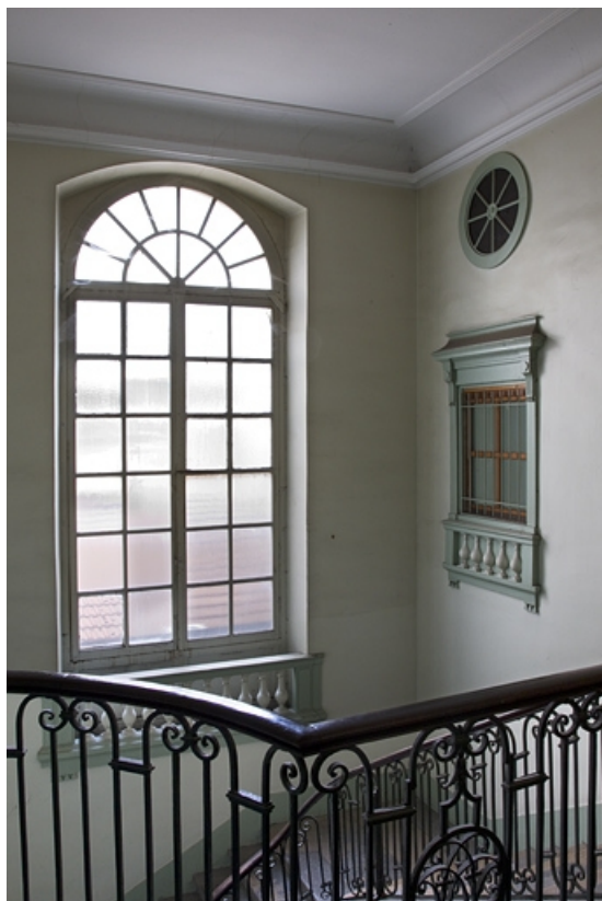
Intérieur, escalier d'honneur : détail de la cage d'escalier.

25, Besançon, 2, 4 rue des Granges, lieudit : îlot Bouteiller