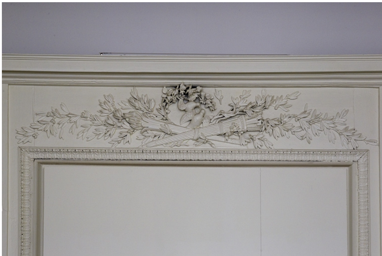
Intérieur, chambre à gauche du salon : détail d'un décor.

25, Besançon, 2, 4 rue des Granges, lieudit : îlot Bouteiller