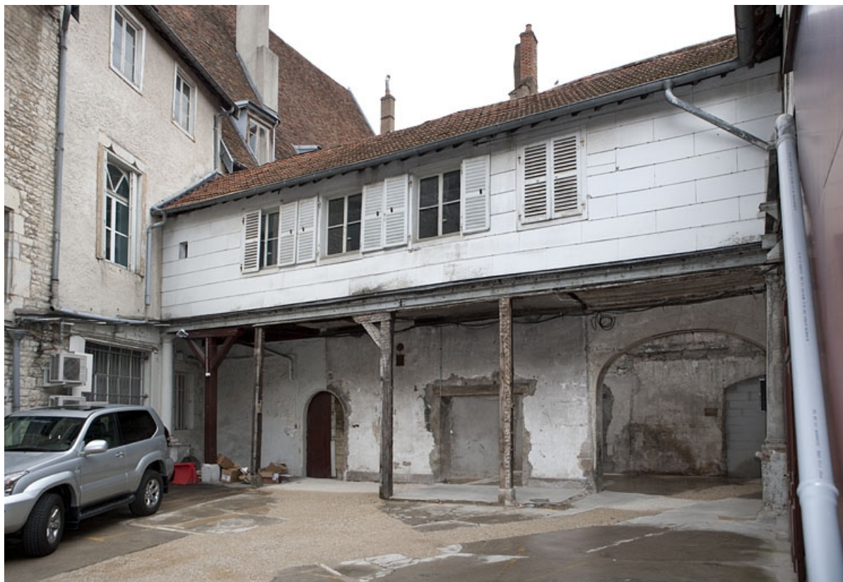
Galerie, partie en fond de cour : vue d'ensemble, de trois quarts droit.

25, Besançon, 2, 4 rue des Granges, lieudit : îlot Bouteiller