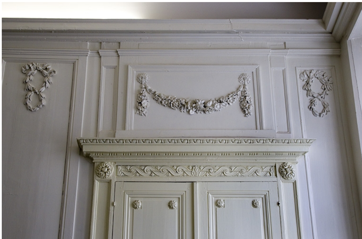
Intérieur, chambre à gauche du salon : détail d'un dessus de porte.

25, Besançon, 2, 4 rue des Granges, lieudit : îlot Bouteiller