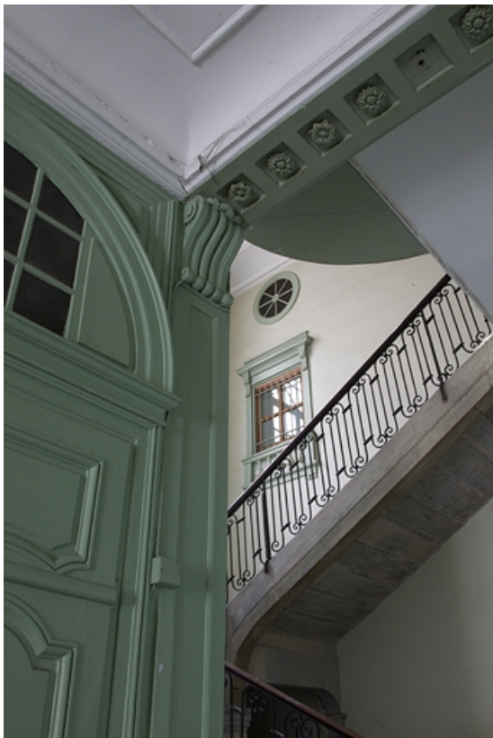
Intérieur, escalier d'honneur : vue depuis le rez-de-chaussée.

25, Besançon, 2, 4 rue des Granges, lieudit : îlot Bouteiller