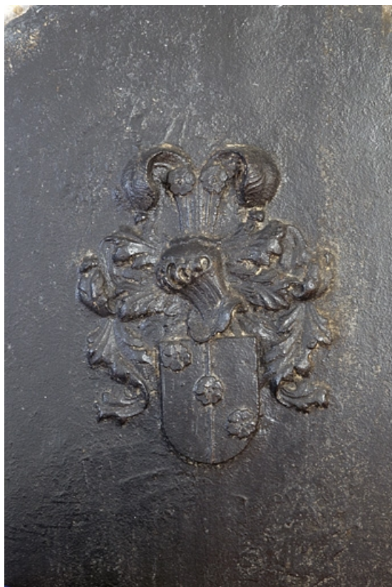
Intérieur, galerie, cheminée :détail de la plaque de cheminée.

25, Besançon, 2, 4 rue des Granges, lieudit : îlot Bouteiller