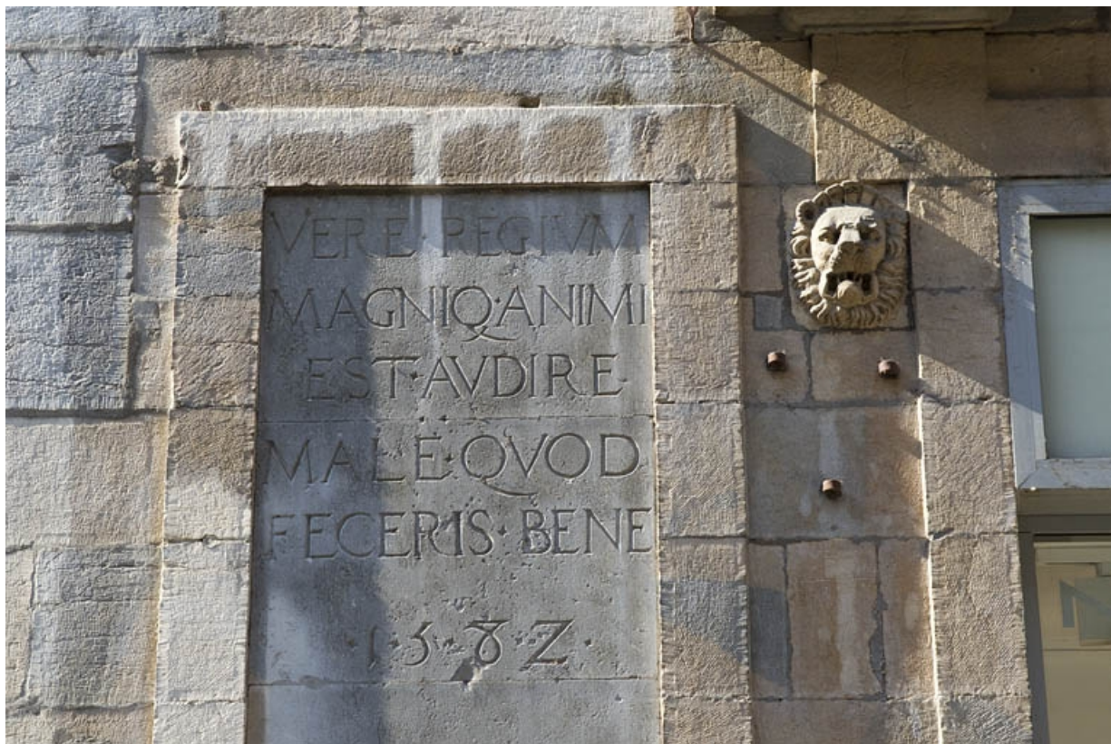
Façade antérieure, partie droite, rez-de-chaussée : détail de l'inscription.

25, Besançon, 2, 4 rue des Granges, lieudit : îlot Bouteiller