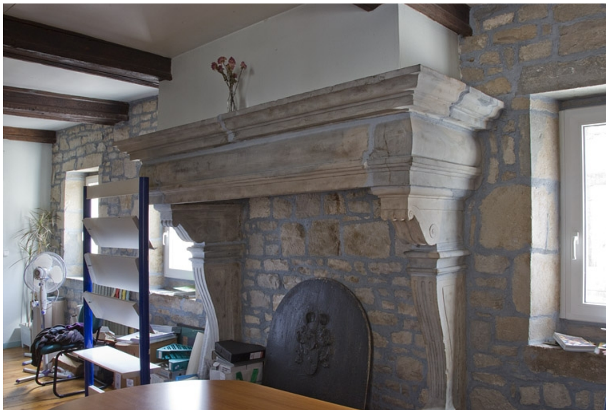
Intérieur, galerie : détail d'une cheminée.

25, Besançon, 2, 4 rue des Granges, lieudit : îlot Bouteiller