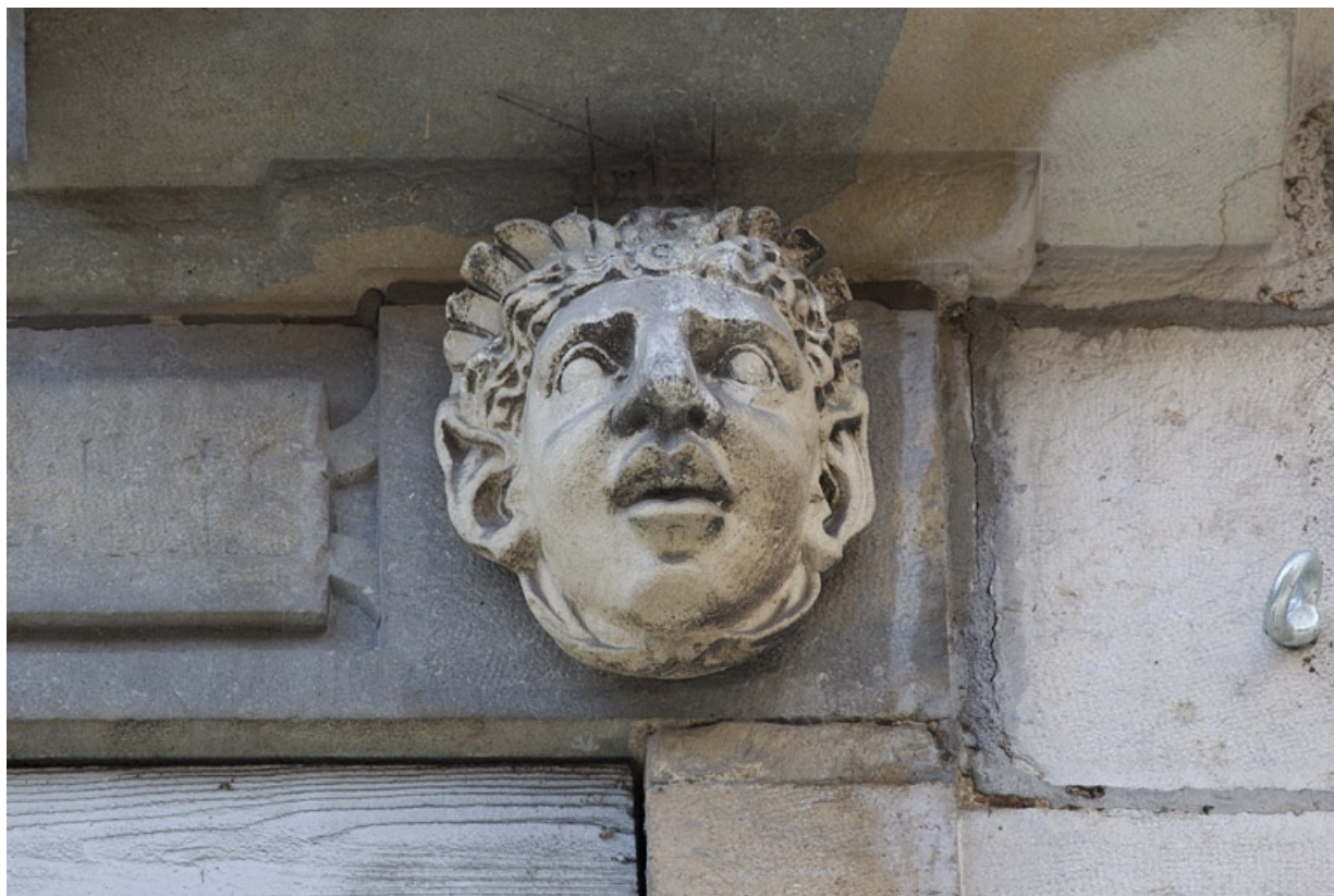
Façade antérieure, partie droite, troisième fenêtre de l'étage à partir de la droite : détail du mascarone droit. 25, Besançon, 2, 4 rue des Granges, lieudit : îlot Bouteiller