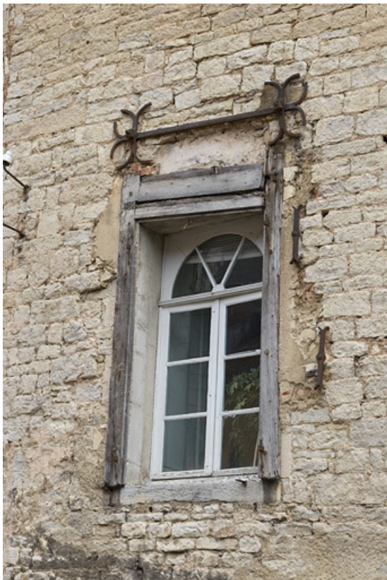
Façade postérieure donnant sur l'impasse : détail d'une ouverture.

25, Besançon, 2, 4 rue des Granges, lieudit : îlot Bouteiller