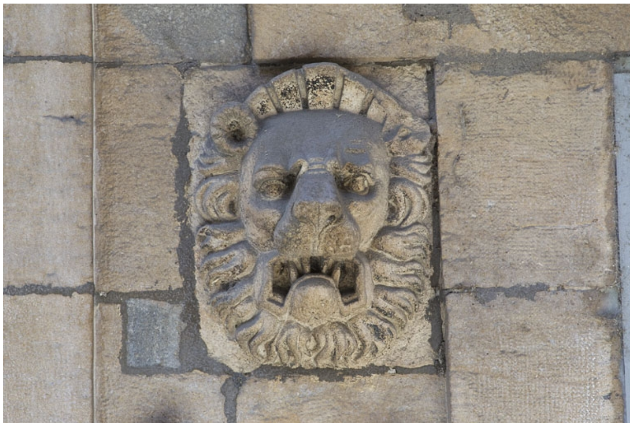
Façade antérieure, partie droite, rez-de-chaussée : détail du mascaron, troisième fenêtre à partir de la droite. 25, Besançon, 2, 4 rue des Granges, lieudit : îlot Bouteiller