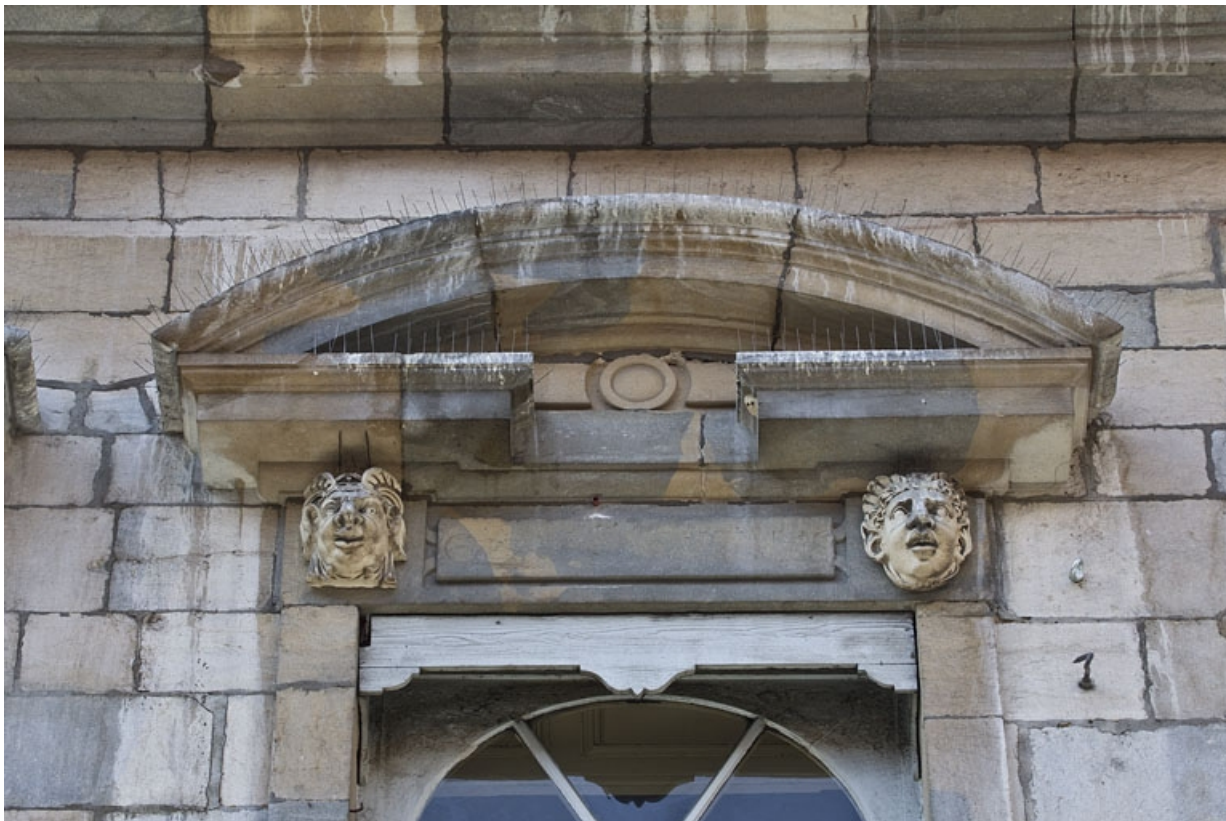
Façade antérieure, partie droite, troisième fenêtre de l'étage à partir de la droite : détail du fronton cintré. 25, Besançon, 2, 4 rue des Granges, lieudit : îlot Bouteiller