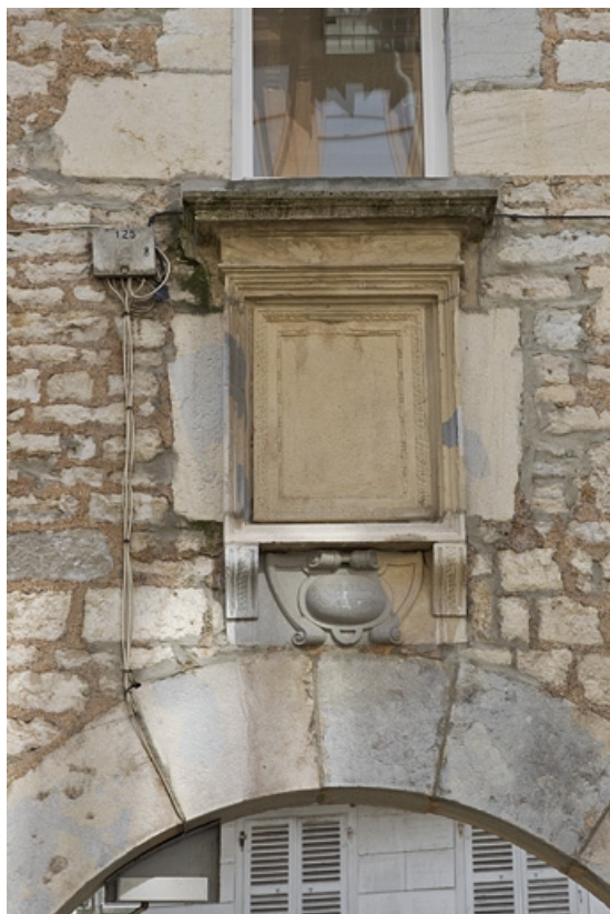
Façade latérale droite : détail du décor en table au-dessus du portail d'entrée. 25, Besançon, 2, 4 rue des Granges, lieudit : îlot Bouteiller