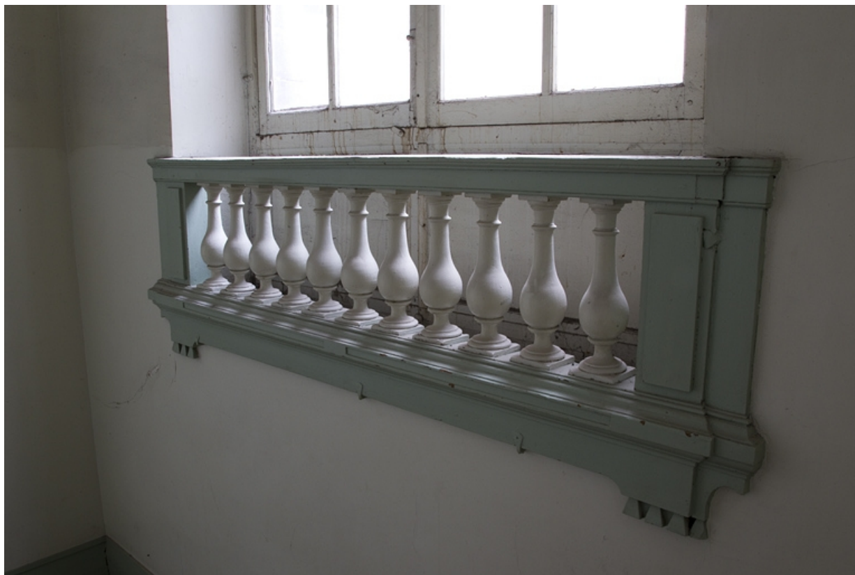
Intérieur, escalier d'honneur : détail du garde-corps de la fenêtre de la cage d'escalier.

25, Besançon, 2, 4 rue des Granges, lieudit : îlot Bouteiller