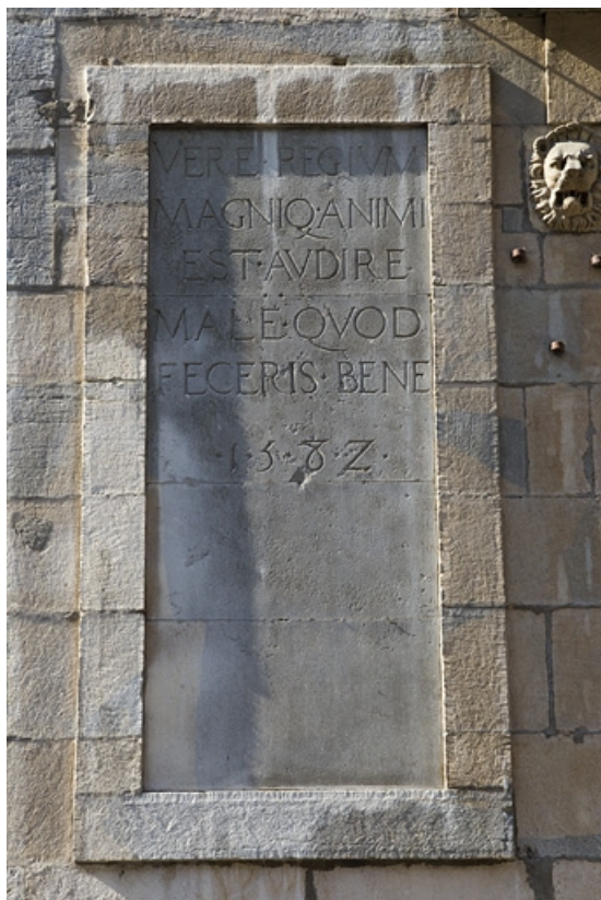
Façade antérieure, partie droite, rez-de-chaussée : vue d'ensemble de l'inscription.

25, Besançon, 2, 4 rue des Granges, lieudit : îlot Bouteiller