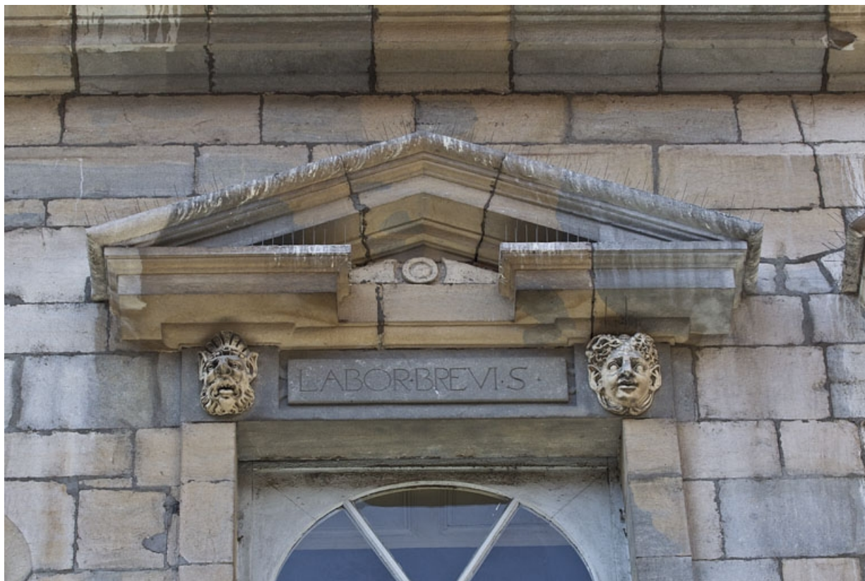
Façade antérieure, partie droite, quatrième fenêtre de l'étage à partir de la droite : détail du fronton triangulaire. 25, Besançon, 2, 4 rue des Granges, lieudit : îlot Bouteiller