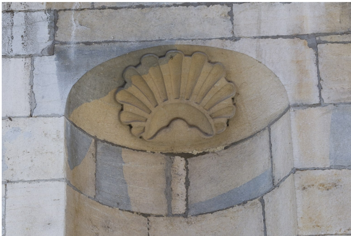
Façade antérieure, partie droite, premier étage : détail de la coquille de la niche. 25, Besançon, 2, 4 rue des Granges, lieudit : îlot Bouteiller