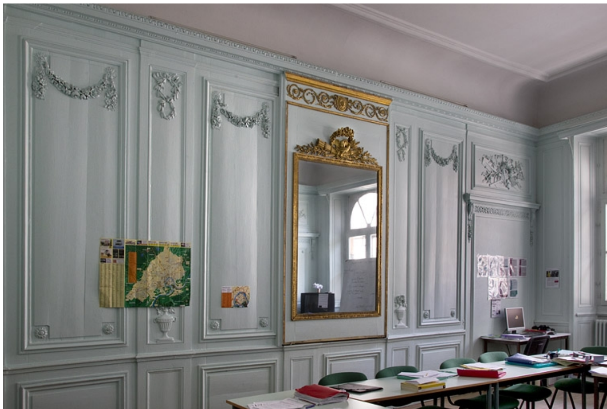
Intérieur, salon : détail des lambris du mur opposé à la cheminée.

25, Besançon, 2, 4 rue des Granges, lieudit : îlot Bouteiller