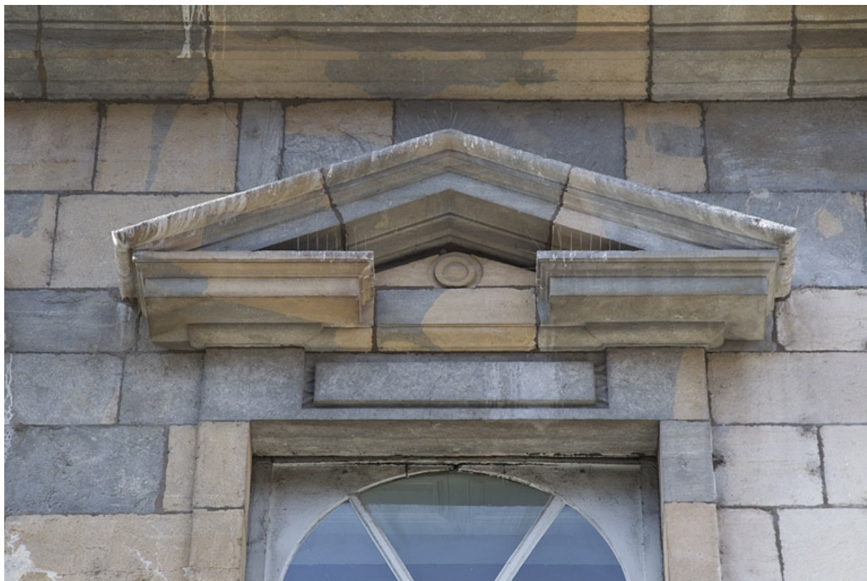
Façade antérieure, partie gauche, premier étage : détail du fronton d'une fenêtre. 25, Besançon, 2, 4 rue des Granges, lieudit : îlot Bouteiller