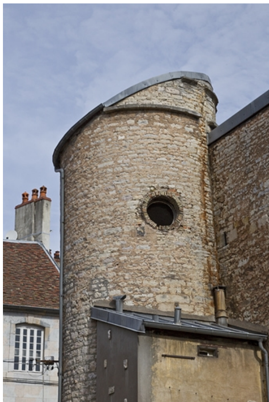
Partie droite : détail de la partie supérieure du pigeonnier depuis l'impasse.

25, Besançon, 2, 4 rue des Granges, lieudit : îlot Bouteiller