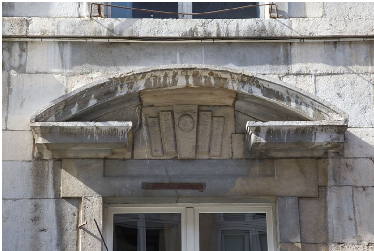
Façade antérieure, partie droite, rez-de-chaussée : détail du fronton de la deuxième fenêtre à partir de la droite. 25, Besançon, 2, 4 rue des Granges, lieudit : îlot Bouteiller