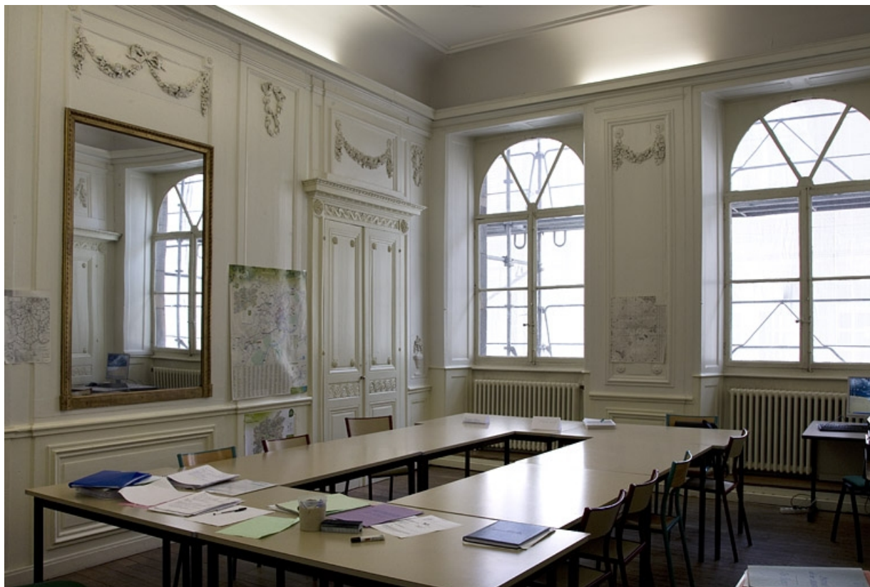
Intérieur, chambre à gauche du salon : depuis le fond de la pièce, de trois quart droit. 25, Besançon, 2, 4 rue des Granges, lieudit : îlot Bouteiller