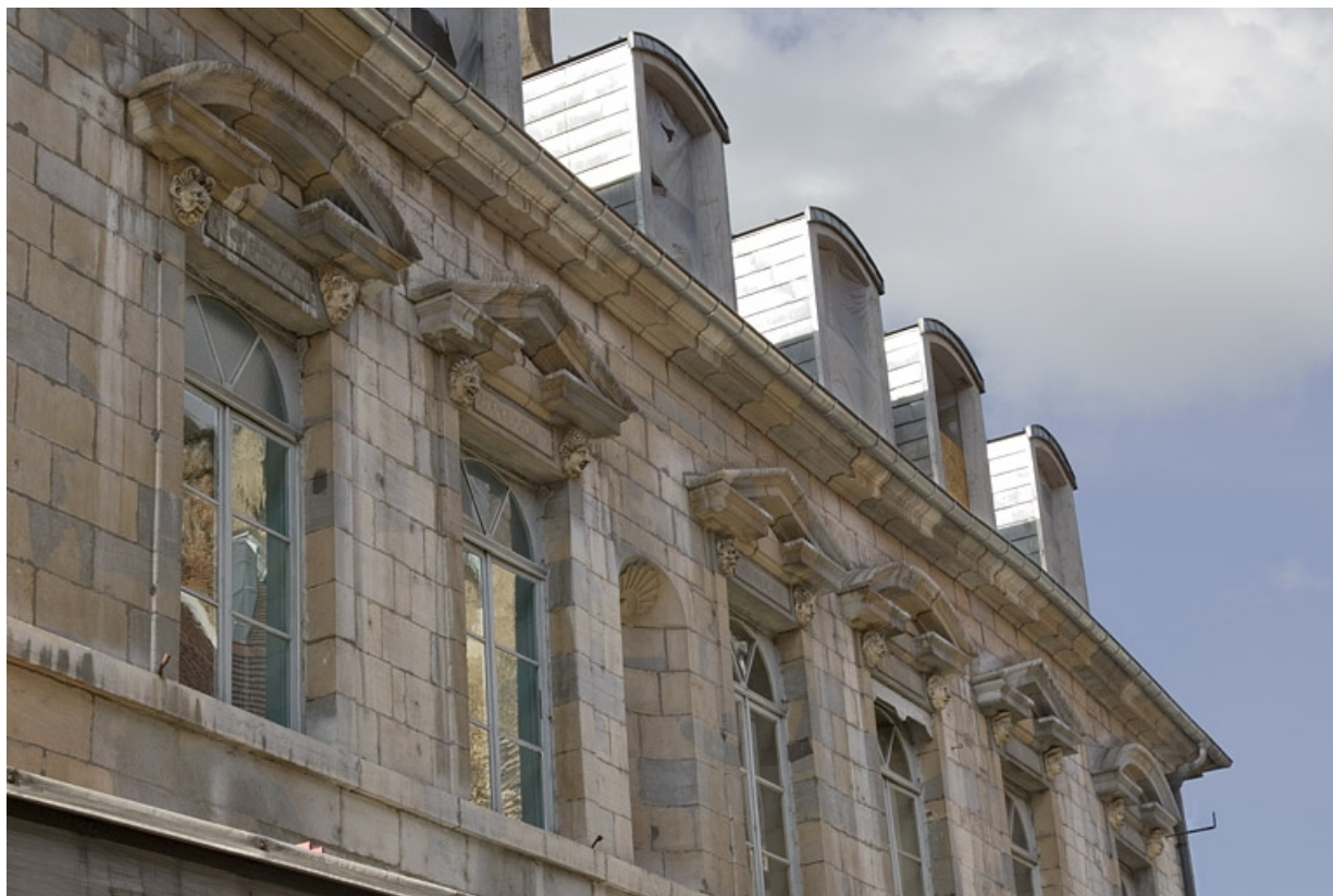
Façade antérieure, partie droite, premier étage : vue d'ensemble des fenêtres. 25, Besançon, 2, 4 rue des Granges, lieudit : îlot Bouteiller