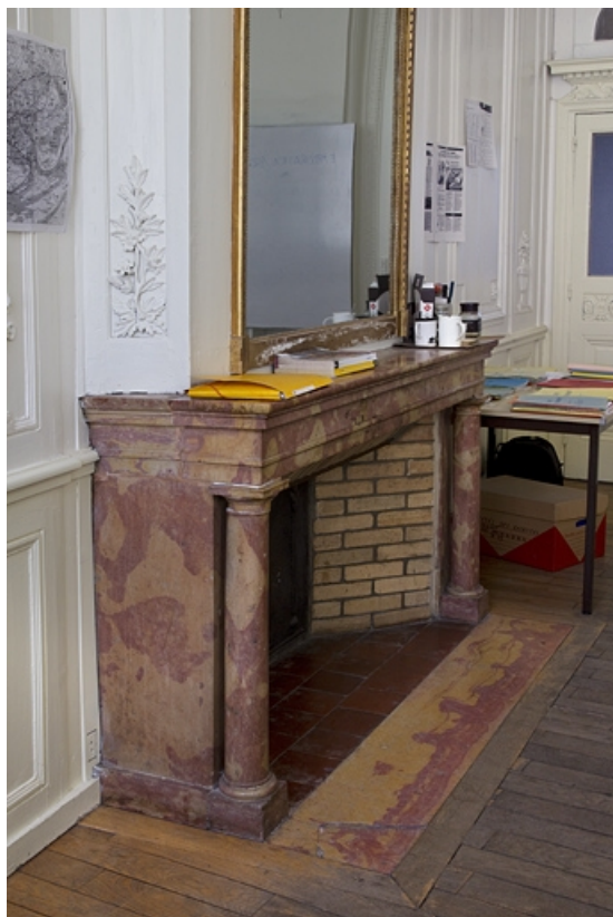
Intérieur, chambre à gauche du salon : détail de la cheminée.

25, Besançon, 2, 4 rue des Granges, lieudit : îlot Bouteiller