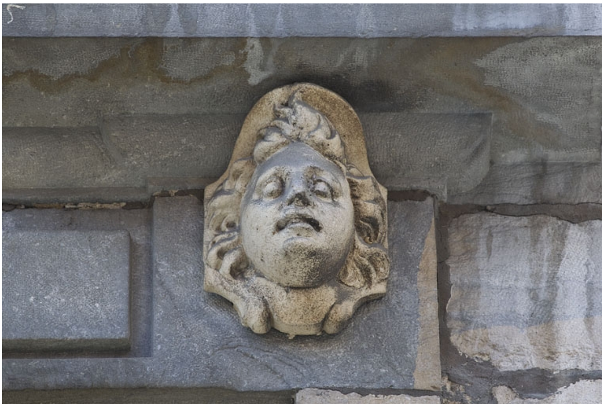
Façade antérieure, partie droite, deuxième fenêtre de l'étage à partir de la droite : détail du mascaron droit. 25, Besançon, 2, 4 rue des Granges, lieudit : îlot Bouteiller