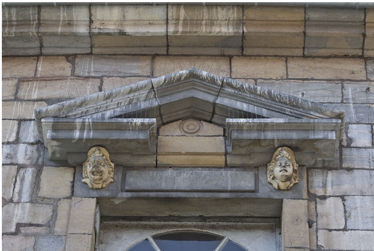
Façade antérieure, partie droite, deuxième fenêtre de l'étage à partir de la droite : détail du fronton triangulaire. 25, Besançon, 2, 4 rue des Granges, lieudit : îlot Bouteiller