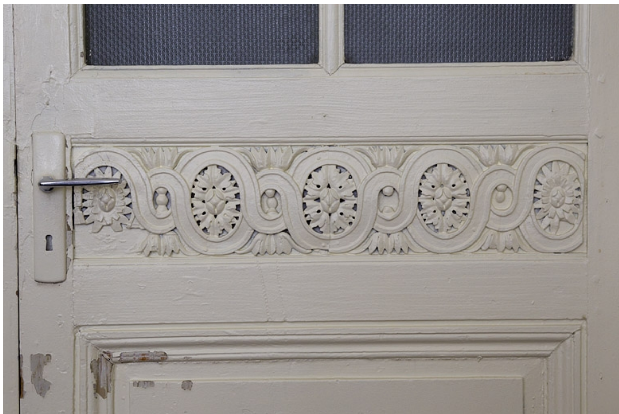
Intérieur, chambre à gauche du salon : détail du décor d'une porte.

25, Besançon, 2, 4 rue des Granges, lieudit : îlot Bouteiller