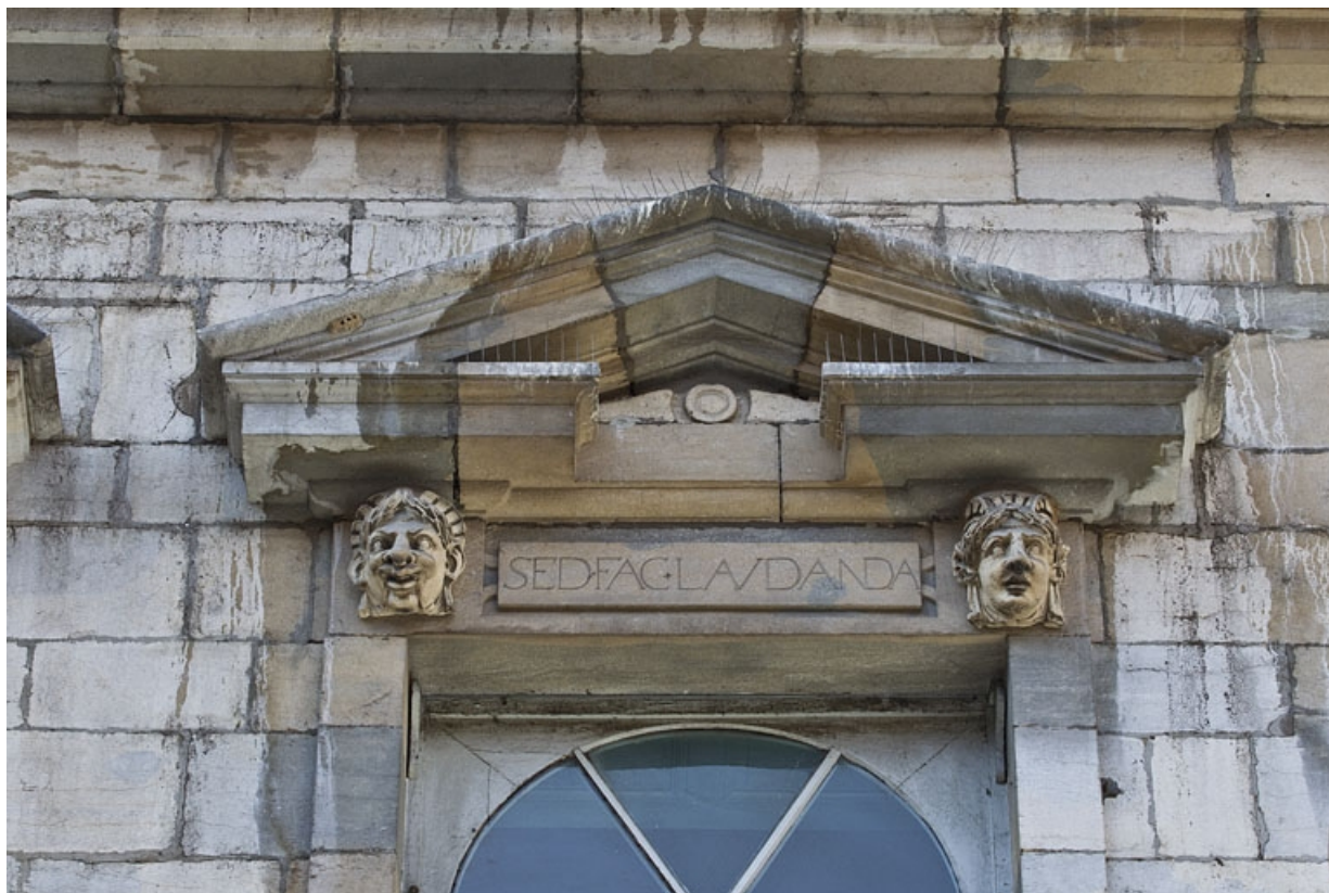
Façade antérieure, partie droite, cinquième fenêtre de l'étage à partir de la droite : détail du fronton triangulaire. 25, Besançon, 2, 4 rue des Granges, lieudit : îlot Bouteiller