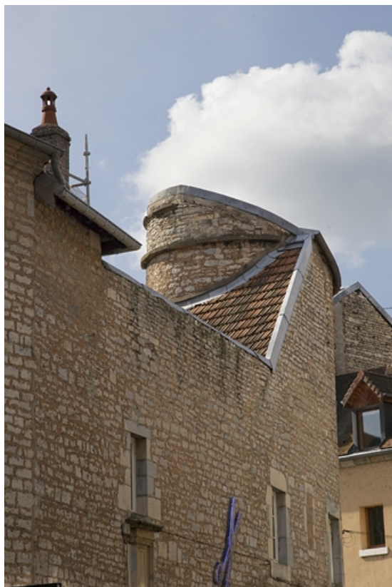
Façade latérale droite : détail de la tour du pigeonier. 25, Besançon, 2, 4 rue des Granges, lieudit : îlot Bouteiller