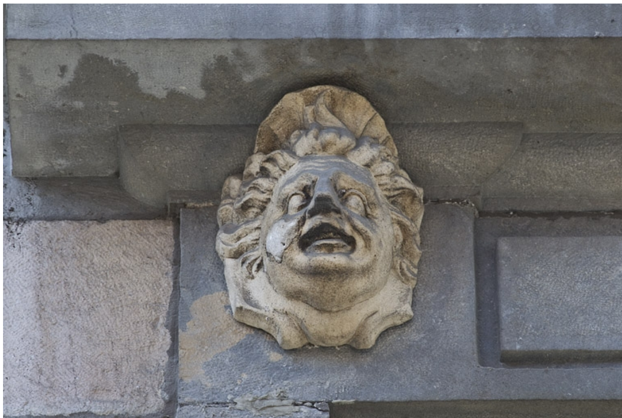
Façade antérieure, partie droite, première fenêtre de l'étage à partir de la droite : détail du mascarone gauche. 25, Besançon, 2, 4 rue des Granges, lieudit : îlot Bouteiller