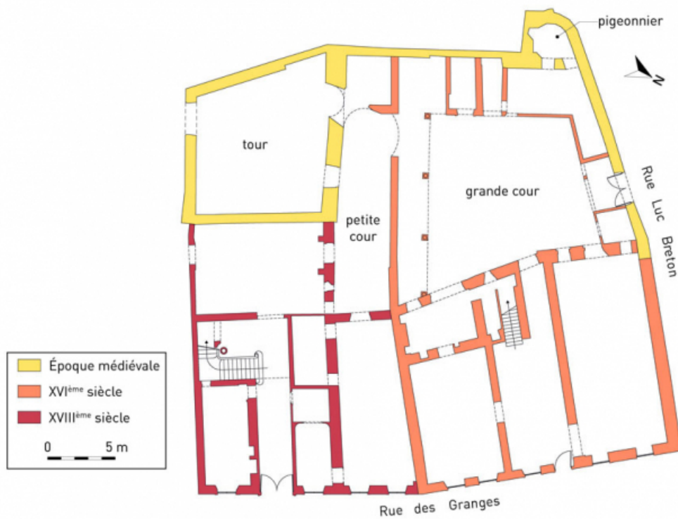
Plan au sol de l'évolution du bâti entre le Moyen Âge et le XVIIIe siècle. Fond de plan : agence Courtois, Besançon 25, Besançon, 2, 4 rue des Granges, lieudit : îlot Bouteiller