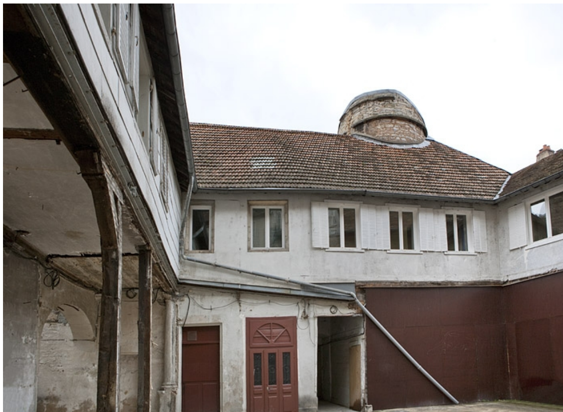
Galerie sur cour, partie à droite de l'entrée : vue d'ensemble, de face.

25, Besançon, 2, 4 rue des Granges, lieudit : îlot Bouteiller