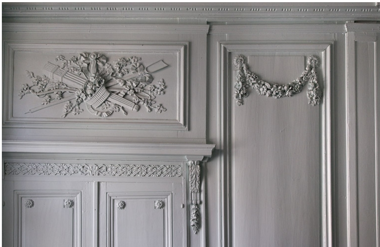
Intérieur, salon : détail du décor d'un dessus de porte et de la partie supérieure d'un lambris. 25, Besançon, 2, 4 rue des Granges, lieudit : îlot Bouteiller