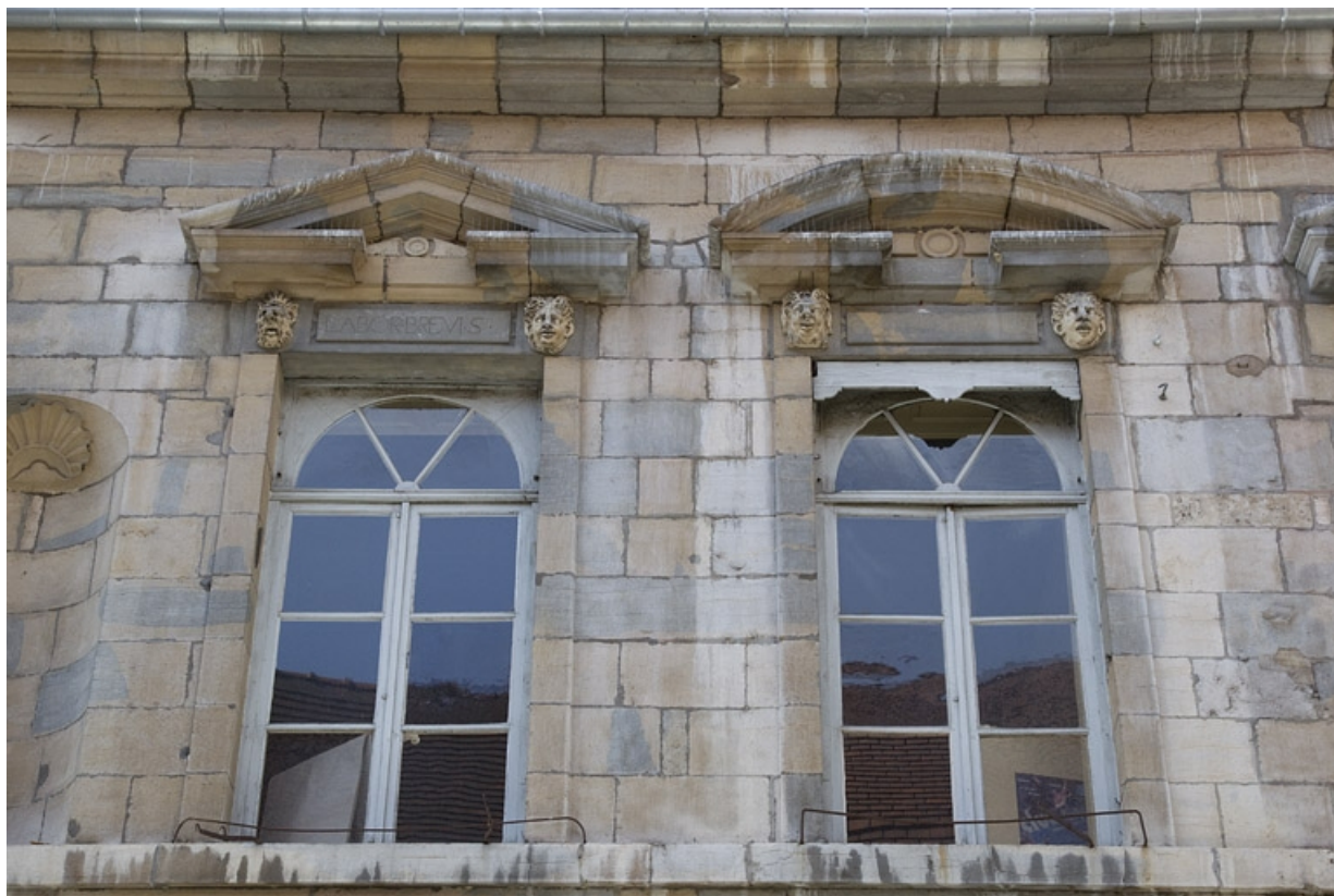
Façade antérieure, partie droite, premier étage : vue d'ensemble de la troisième et quatrième fenêtres à partir de la droite. 25, Besançon, 2, 4 rue des Granges, lieudit : îlot Bouteiller