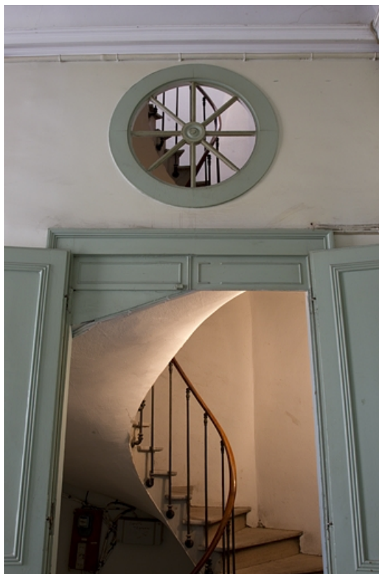
Intérieur, escalier secondaire : vue d'ensemble depuis l'escalier d'honneur.

25, Besançon, 2, 4 rue des Granges, lieudit : îlot Bouteiller