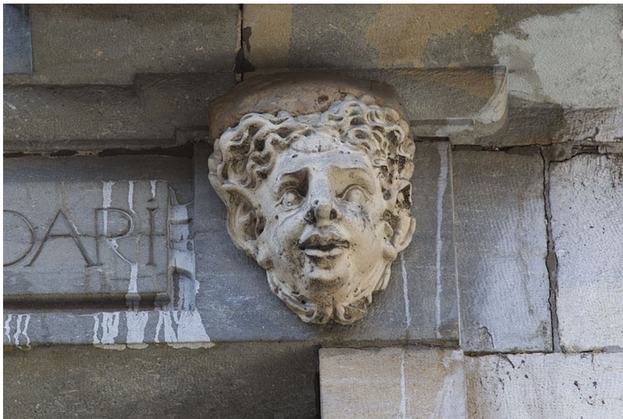
Façade antérieure, partie droite, sixième fenêtre de l'étage à partir de la droite : détail du mascarone droit. 25, Besançon, 2, 4 rue des Granges, lieudit : îlot Bouteiller