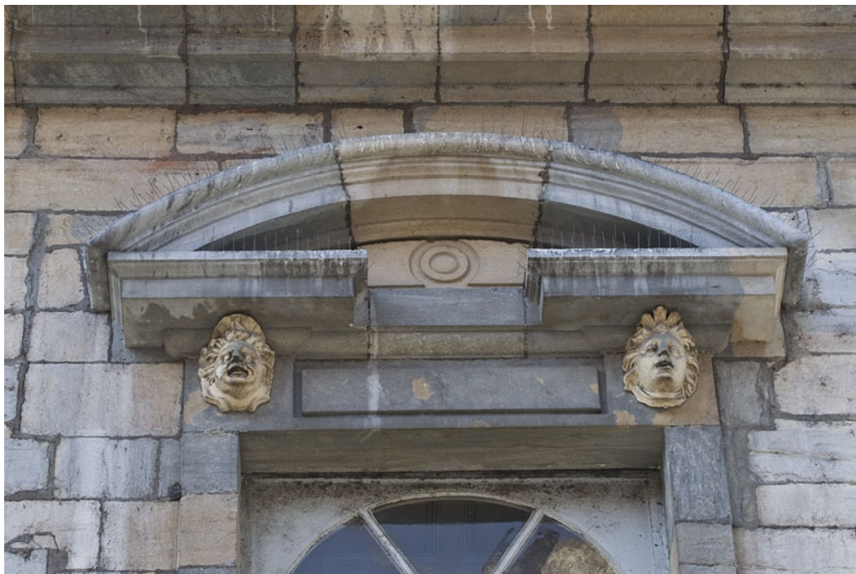
Façade antérieure, partie droite, première fenêtre de l'étage à partir de la droite : détail du fronton cintré. 25, Besançon, 2, 4 rue des Granges, lieudit : îlot Bouteiller