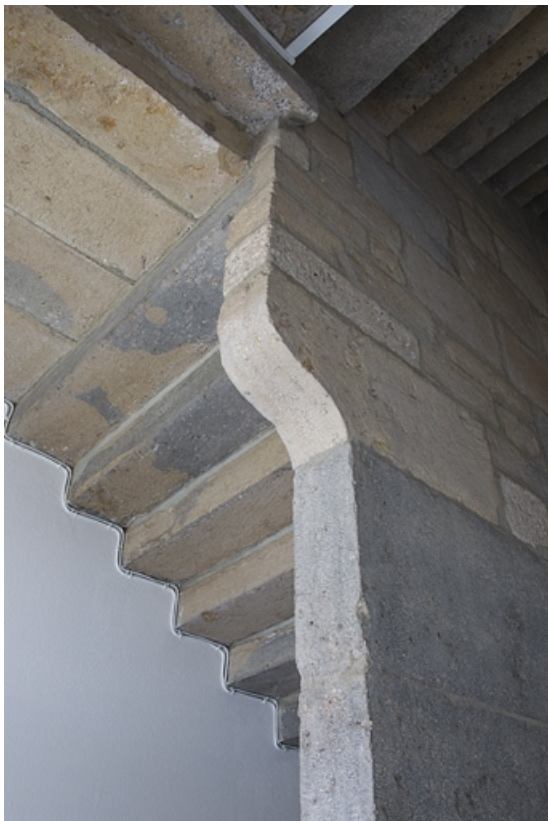
Partie droite : détail de l'escalier en pierre rampe sur rampe.

25, Besançon, 2, 4 rue des Granges, lieudit : îlot Bouteiller