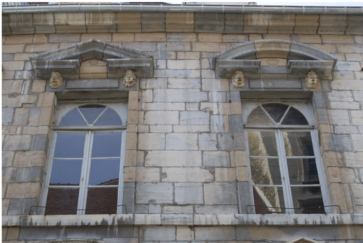
Façade antérieure, partie droite, premier étage : vue d'ensemble des première et deuxième fenêtres à partir de la droite. 25, Besançon, 2, 4 rue des Granges, lieudit : îlot Bouteiller