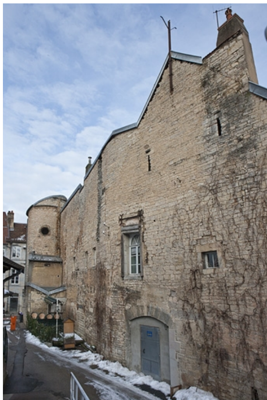
Façade postérieure donnant sur l'impasse : vue d'ensemble, de trois quarts droit. 25, Besançon, 2, 4 rue des Granges, lieudit : îlot Bouteiller