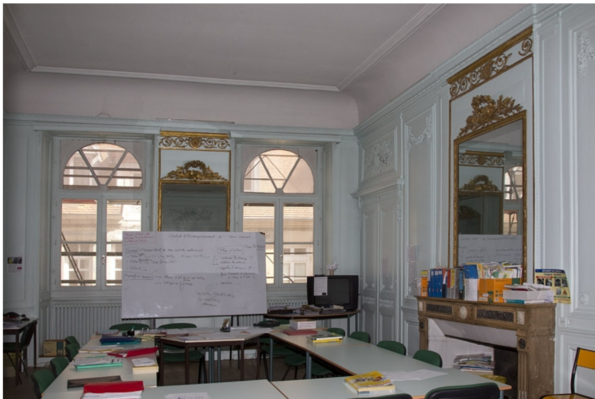
Intérieur, salon : vue d'ensemble depuis le fond de la pièce.

25, Besançon, 2, 4 rue des Granges, lieu-dit : îlot Bouteiller