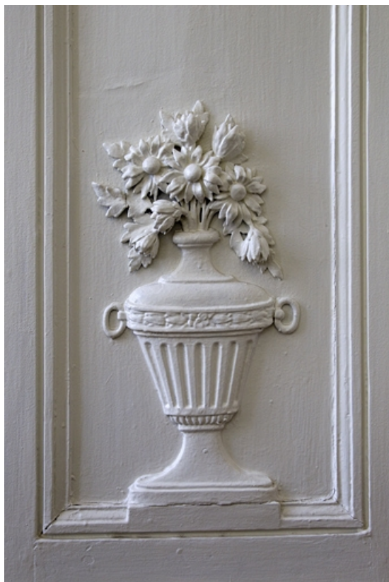
Intérieur, chambre à gauche du salon : lambris, détail d'un pot à fleurs.

25, Besançon, 2, 4 rue des Granges, lieudit : îlot Bouteiller