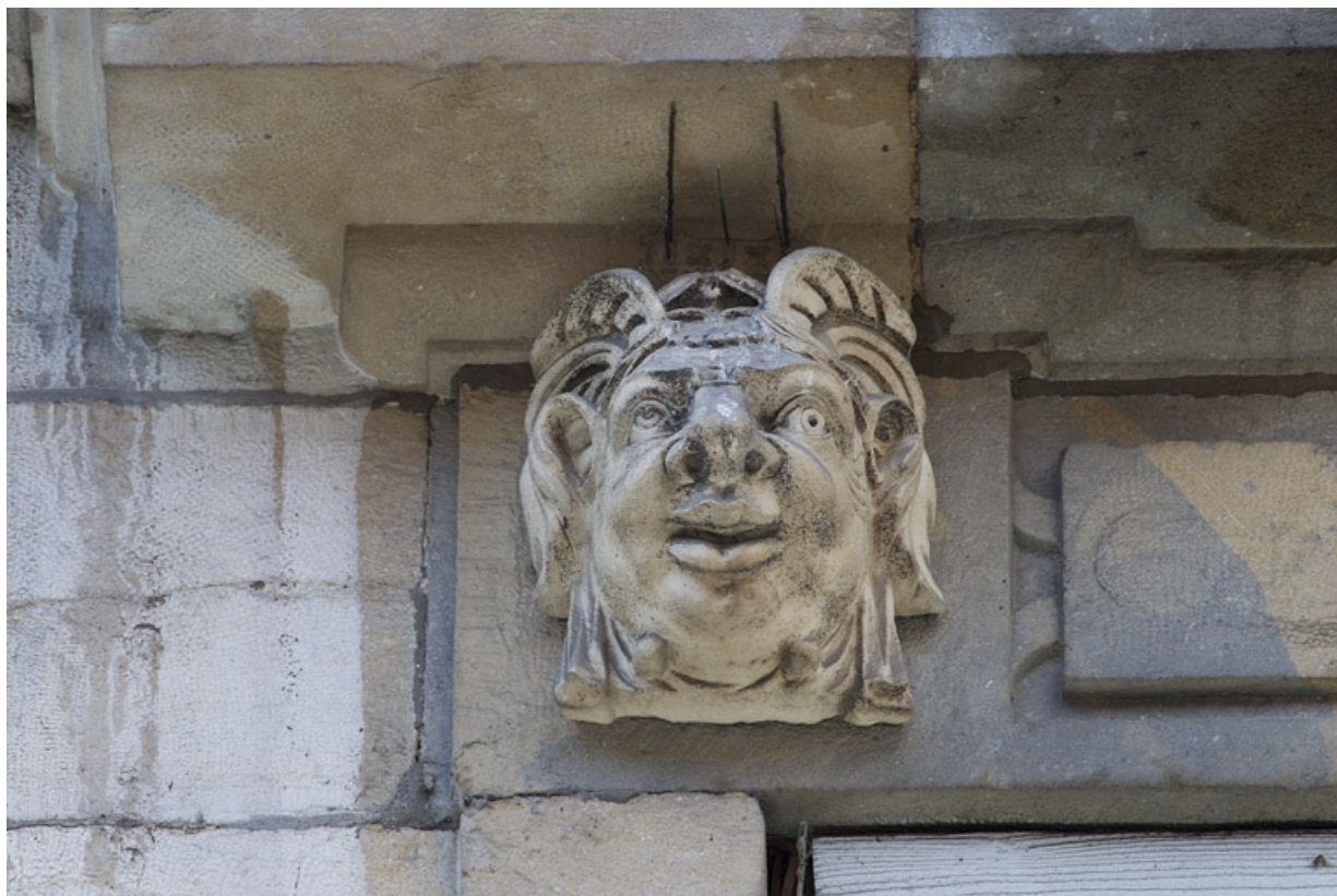
Façade antérieure, partie droite, troisième fenêtre de l'étage à partir de la droite : détail du mascaroon gauche. 25, Besançon, 2, 4 rue des Granges, lieudit : îlot Bouteiller