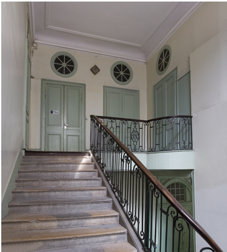
Intérieur, escalier d'honneur : détail de la partie supérieure droite.

25, Besançon, 2, 4 rue des Granges, lieudit : îlot Bouteiller