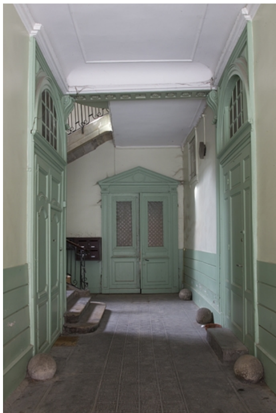
Intérieur : vue du passage cocher.

25, Besançon, 2, 4 rue des Granges, lieudit : îlot Bouteiller