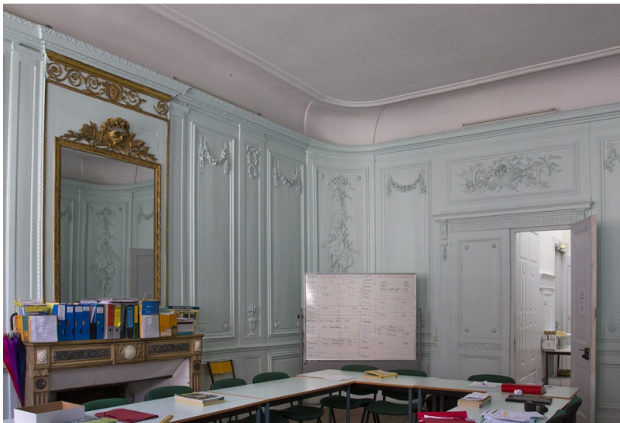
Intérieur, salon : détail de l'entrée et de la cheminée.

25, Besançon, 2, 4 rue des Granges, lieudit : îlot Bouteiller