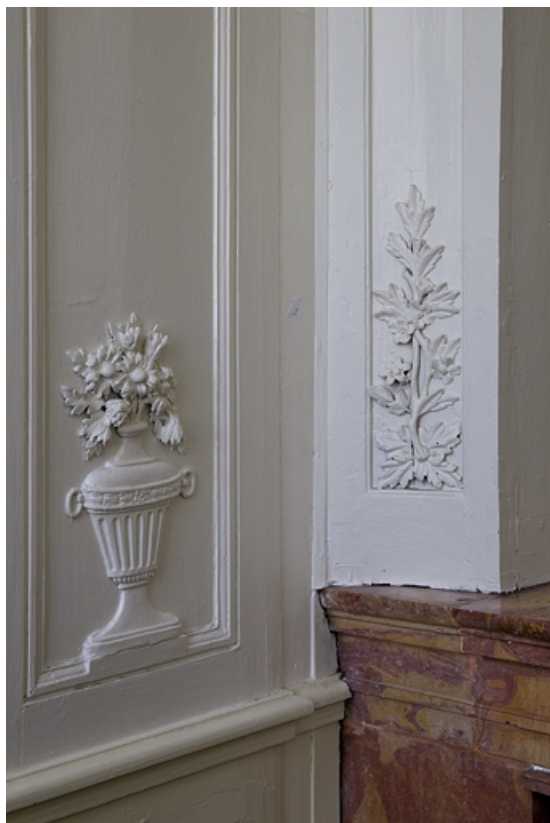
Intérieur, chambre à gauche du salon : lambris, détail d'un pot à fleurs et d'un motif végétal. 25, Besançon, 2, 4 rue des Granges, lieudit : îlot Bouteiller