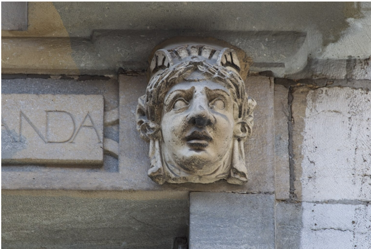
Façade antérieure, partie droite, cinquième fenêtre de l'étage à partir de la droite : détail du mascaron droit. 25, Besançon, 2, 4 rue des Granges, lieudit : îlot Bouteiller