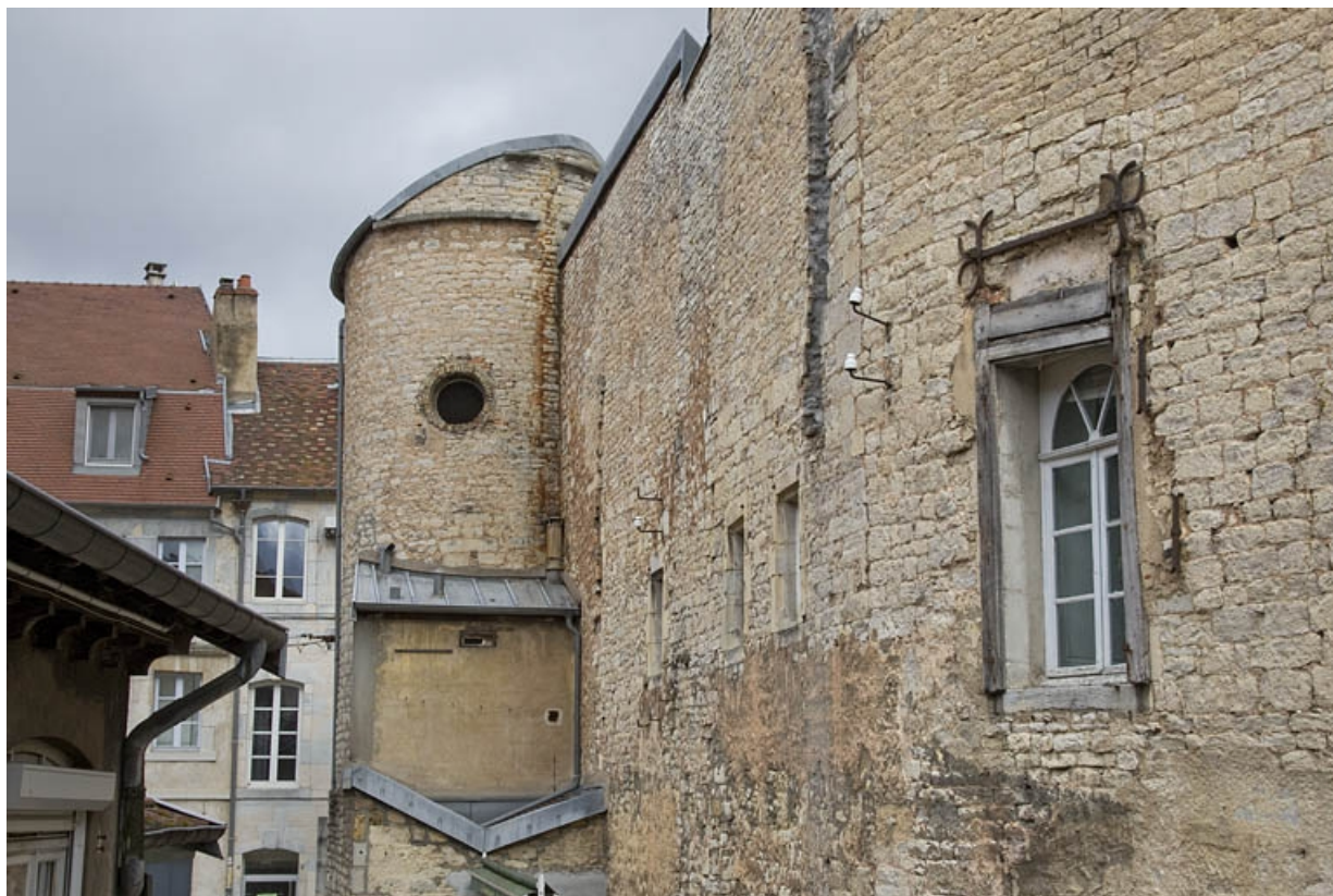
Partie droite : détail de la partie supérieure du pigeonnier depuis l'impasse, de profil.

25, Besançon, 2, 4 rue des Granges, lieudit : îlot Bouteiller