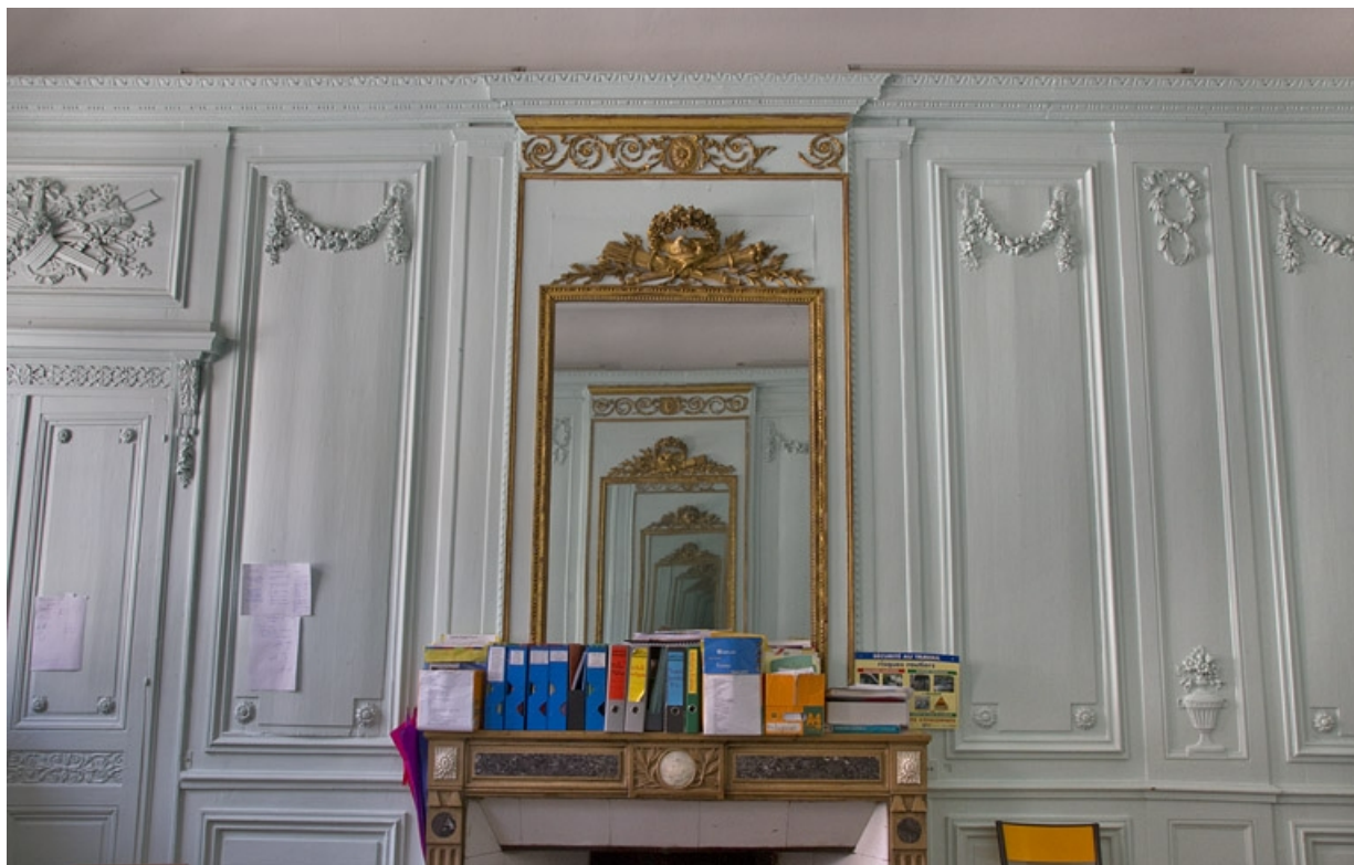
Intérieur, salon : détail de la glace sur la cheminée.

25, Besançon, 2, 4 rue des Granges, lieudit : îlot Bouteiller