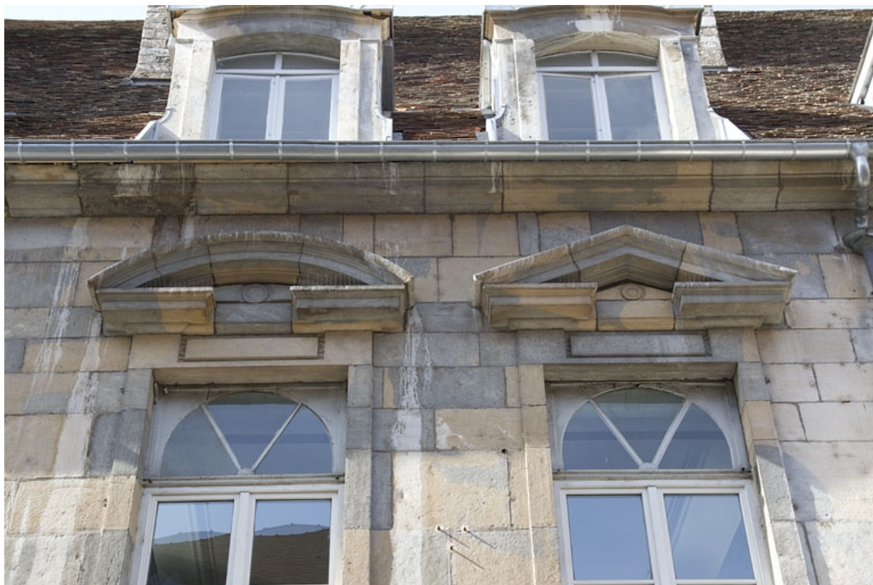
Façade antérieure, partie gauche, premier étage : détail des frontons de deux fenêtres.

25, Besançon, 2, 4 rue des Granges, lieudit : îlot Bouteiller