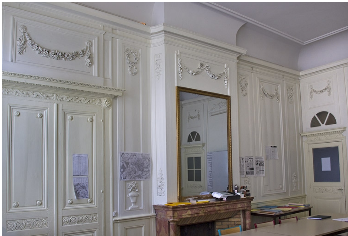
Intérieur, chambre à gauche du salon : lambris et cheminée, vue rapprochée.

25, Besançon, 2, 4 rue des Granges, lieudit : îlot Bouteiller