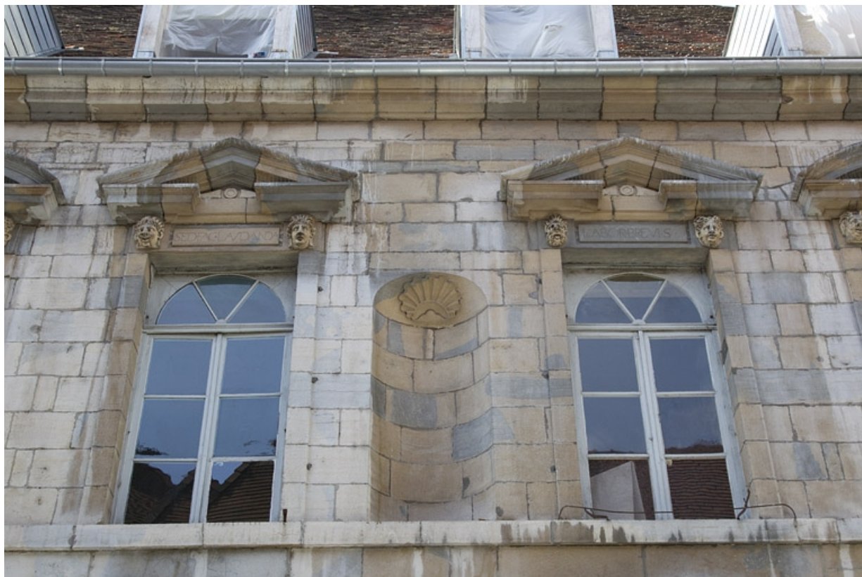
Façade antérieure, partie droite, premier étage : vue d'ensemble de la quatrième et cinquième fenêtres à partir de la droite. 25, Besançon, 2, 4 rue des Granges, lieudit : îlot Bouteiller