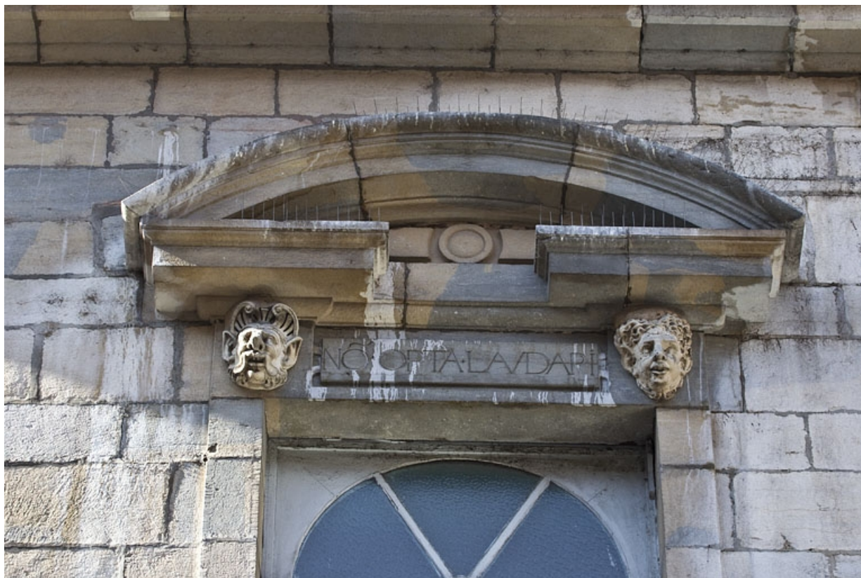
Façade antérieure, partie droite, sixième fenêtre de l'étage à partir de la droite : détail du fronton triangulaire. 25, Besançon, 2, 4 rue des Granges, lieudit : îlot Bouteiller