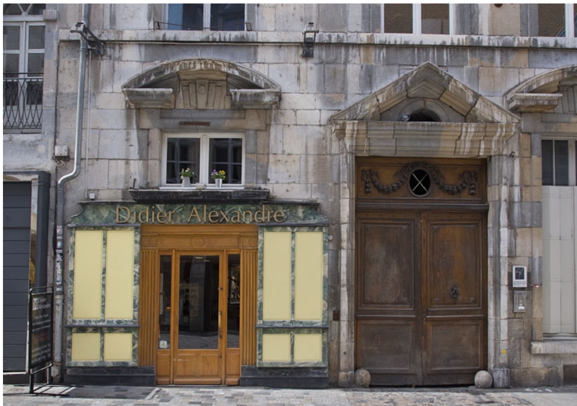
Façade antérieure, partie gauche : détail du portail d'entrée.

25, Besançon, 2, 4 rue des Granges, lieudit : îlot Bouteiller