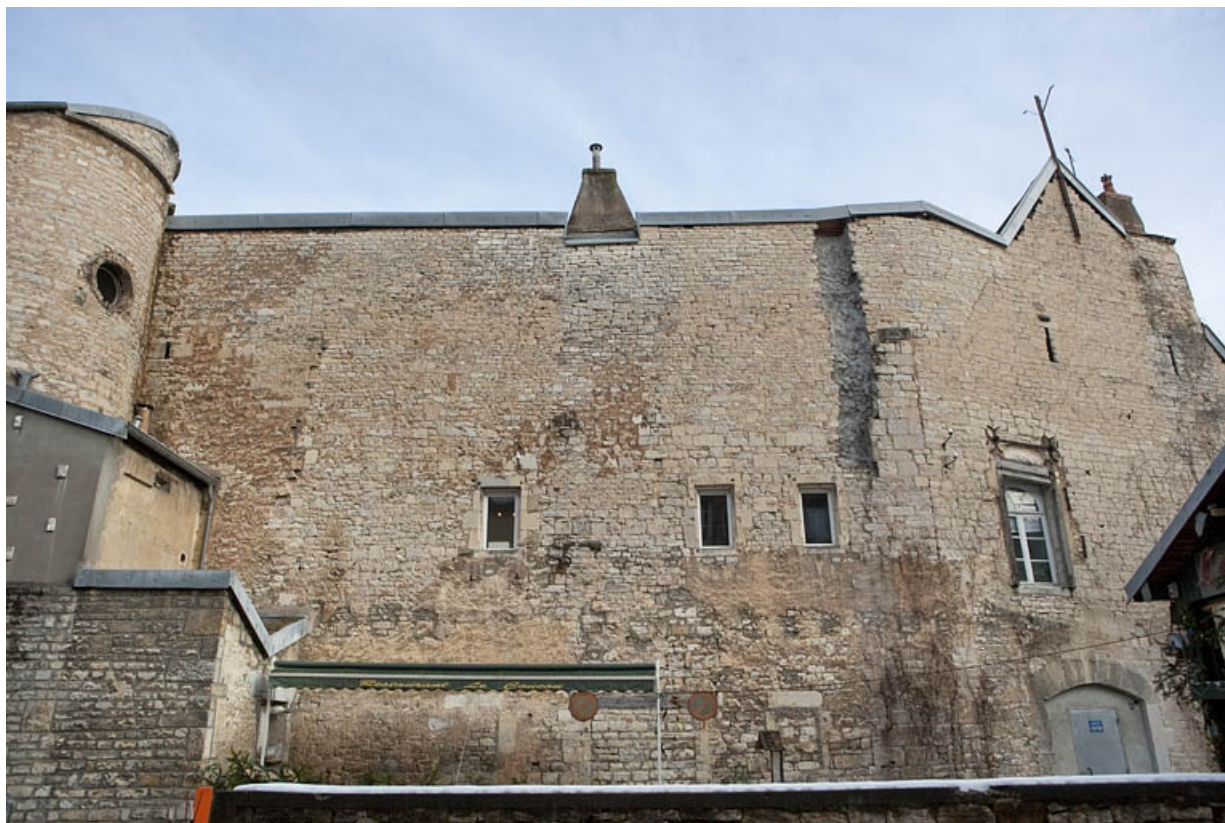
Façade postérieure donnant sur l'impasse : vue d'ensemble, de face.

25, Besançon, 2, 4 rue des Granges, lieudit : îlot Bouteiller