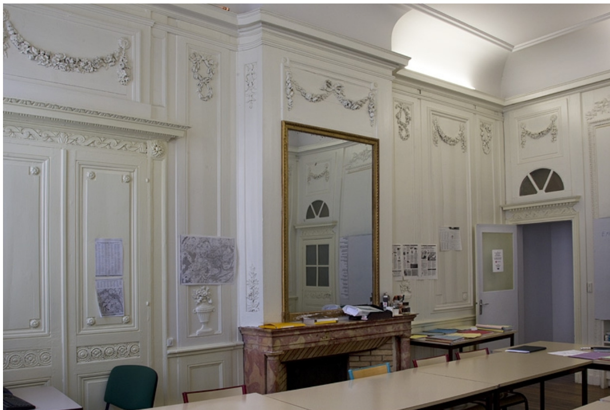
Intérieur, chambre à gauche du salon : lambris et cheminée.

25, Besançon, 2, 4 rue des Granges, lieudit : îlot Bouteiller