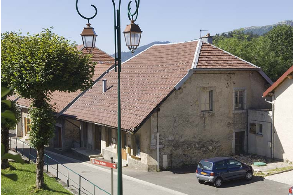
Façade antérieure et façade latérale droite. 25, Jougne, 17 Grande Rue