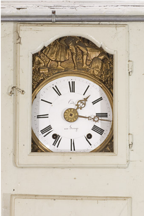
Boiseries de la première chambre : cadran de l'horloge comtoise.

25, Jougne, 6 rue de Jougne, lieudit : Entre-les-Fourgs