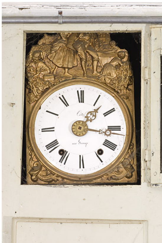
Boiseries de la première chambre : cadran de l'horloge comtoise (porte ouverte). 25, Jougne, 6 rue de Jougne, lieudit : Entre-les-Fourgs