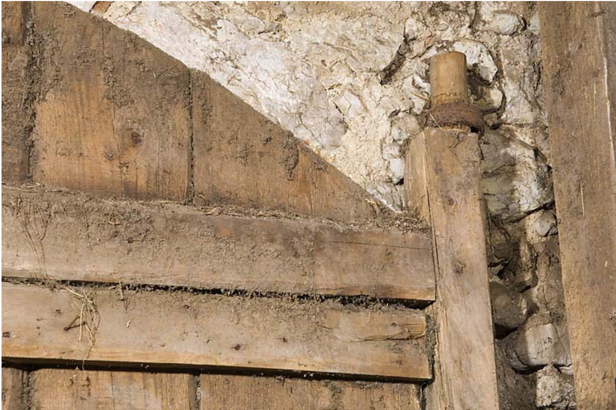
Façade antérieure, porte de grange : fixation de l'axe vertical du vantail de gauche (collier en partie haute). 25, Jougne, 1 place des Cloutiers, lieudit : Entre-les-Fourgs