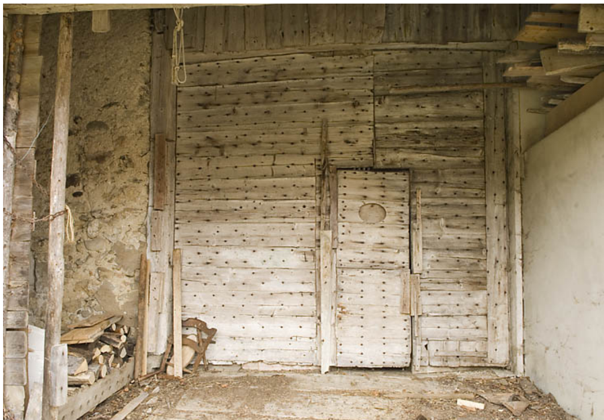
Façade postérieure : porte de la grange.

25, Jougne, 1 place des Cloutiers, lieudit : Entre-les-Fourgs