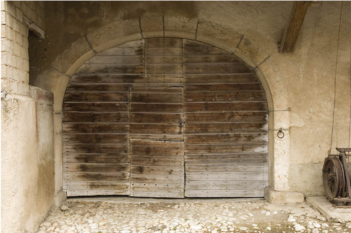
Façade antérieure : porte de la grange.

25, Jougne, 1 place des Cloutiers, lieudit : Entre-les-Fourgs