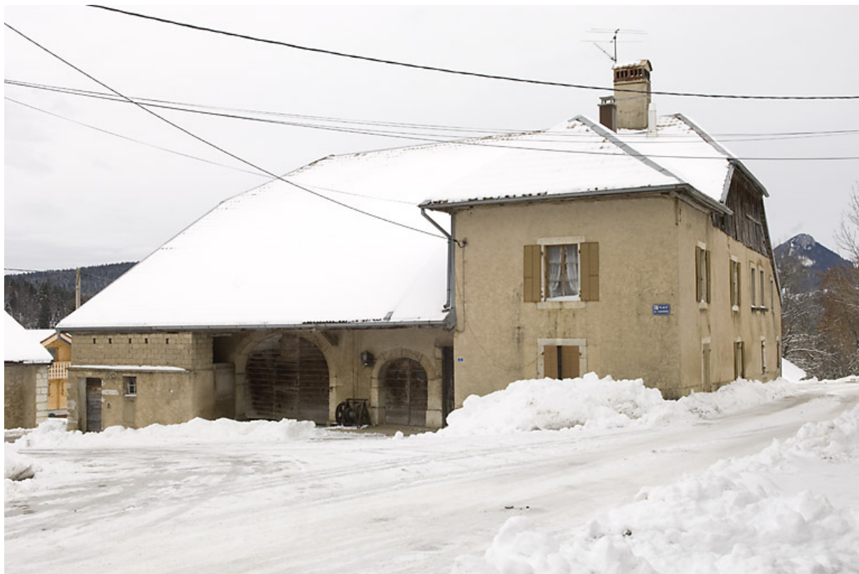
Ferme au 1 place des Cloutiers (Entre-les-Fourgs). 25, Jougne