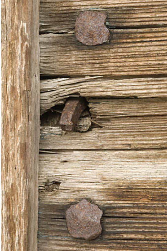
Façade postérieure : porte de la grange, clous à tête carrée.

25, Jougne, 1 place des Cloutiers, lieudit : Entre-les-Fourgs