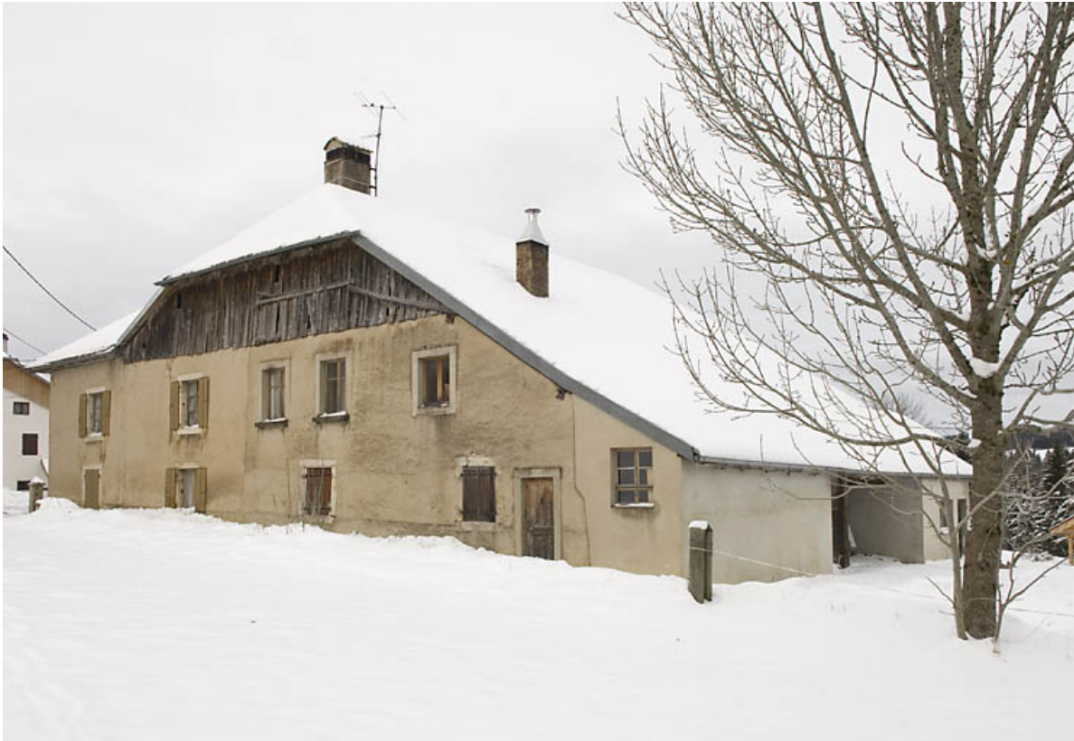
Façade latérale droite, de trois quarts droite.

25, Jougne, 1 place des Cloutiers, lieudit : Entre-les-Fourgs