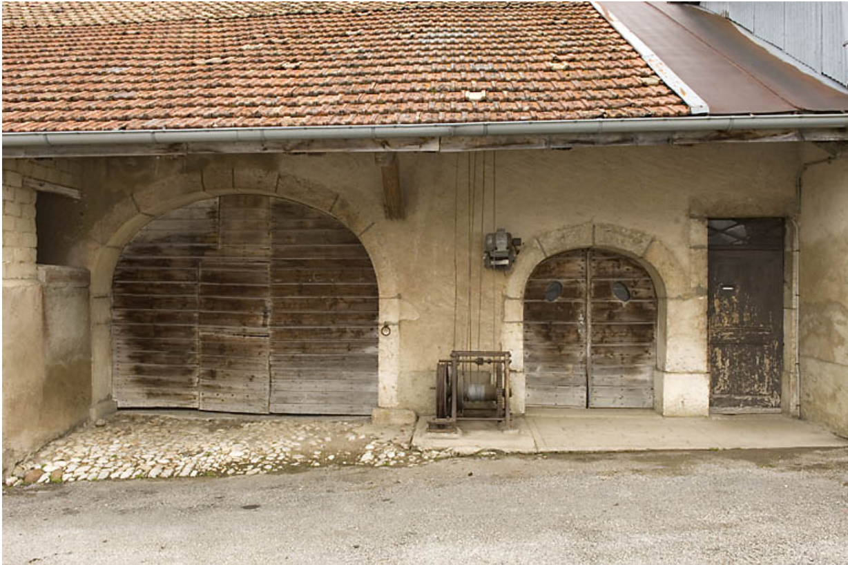
Ferme au 1 place des Cloutiers (Entre-les-Fourgs) : entrées protégées par un avant-toit, abritant aussi la déchargeuse à fourrage. 25, Jougne