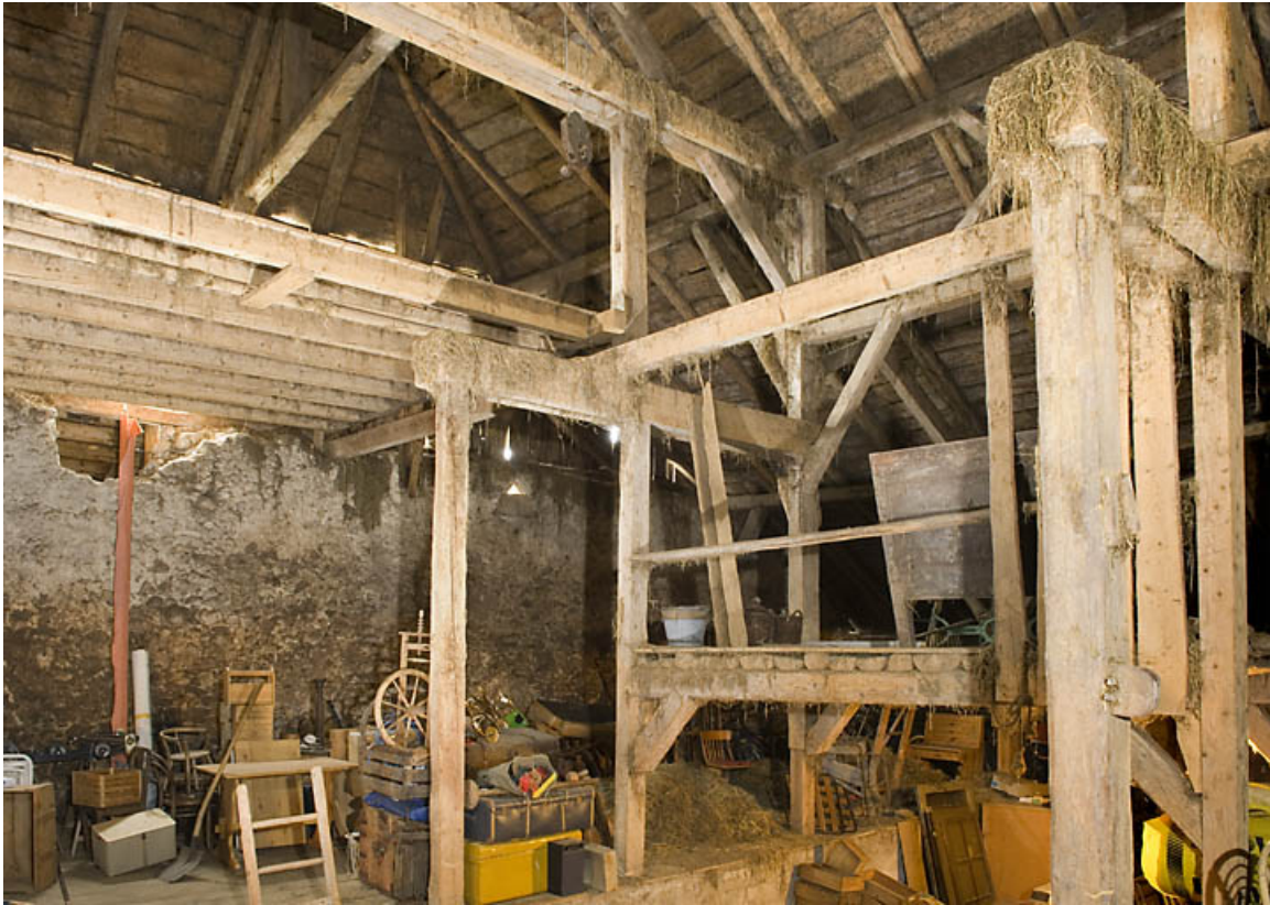
Déchargeuse : charpente et plateforme dans la grange.

25, Jougne, 1 place des Cloutiers, lieudit : Entre-les-Fourgs