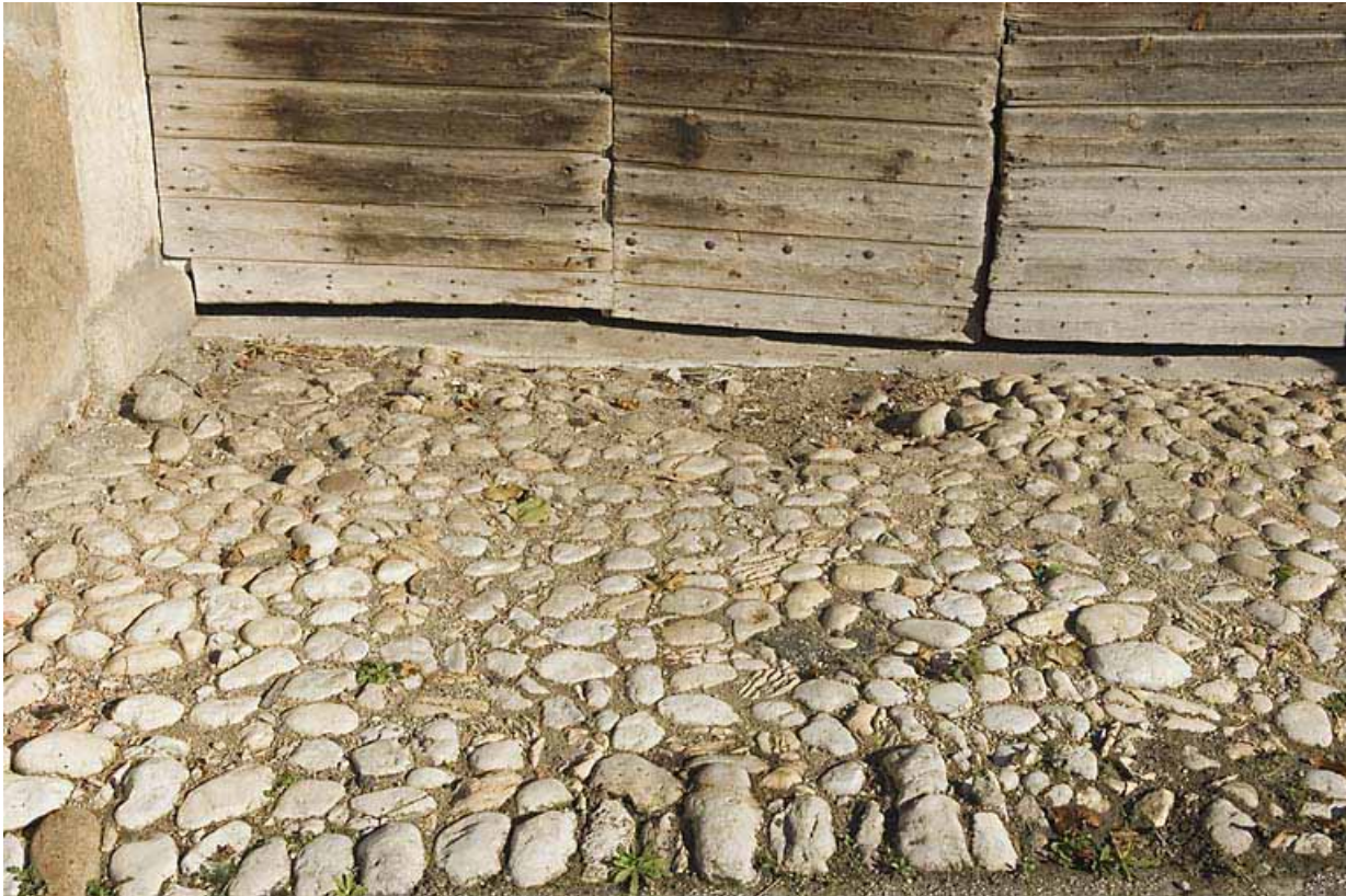
Façade antérieure : pavage devant la grange.

25, Jougue, 1 place des Cloutiers, lieudit : Entre-les-Fourgs