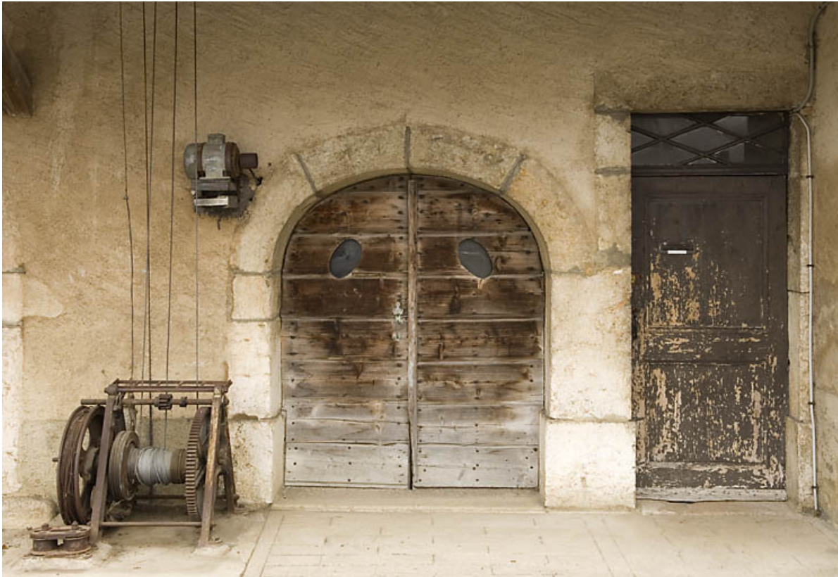
Façade antérieure : portes de l'étable et de l'habitation.

25, Jougne, 1 place des Cloutiers, lieudit : Entre-les-Fourgs