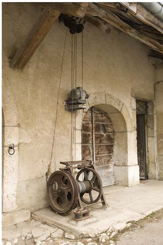
Déchargeuse : vue d'ensemble du treuil.

25, Jougne, 1 place des Cloutiers, lieudit : Entre-les-Fourgs