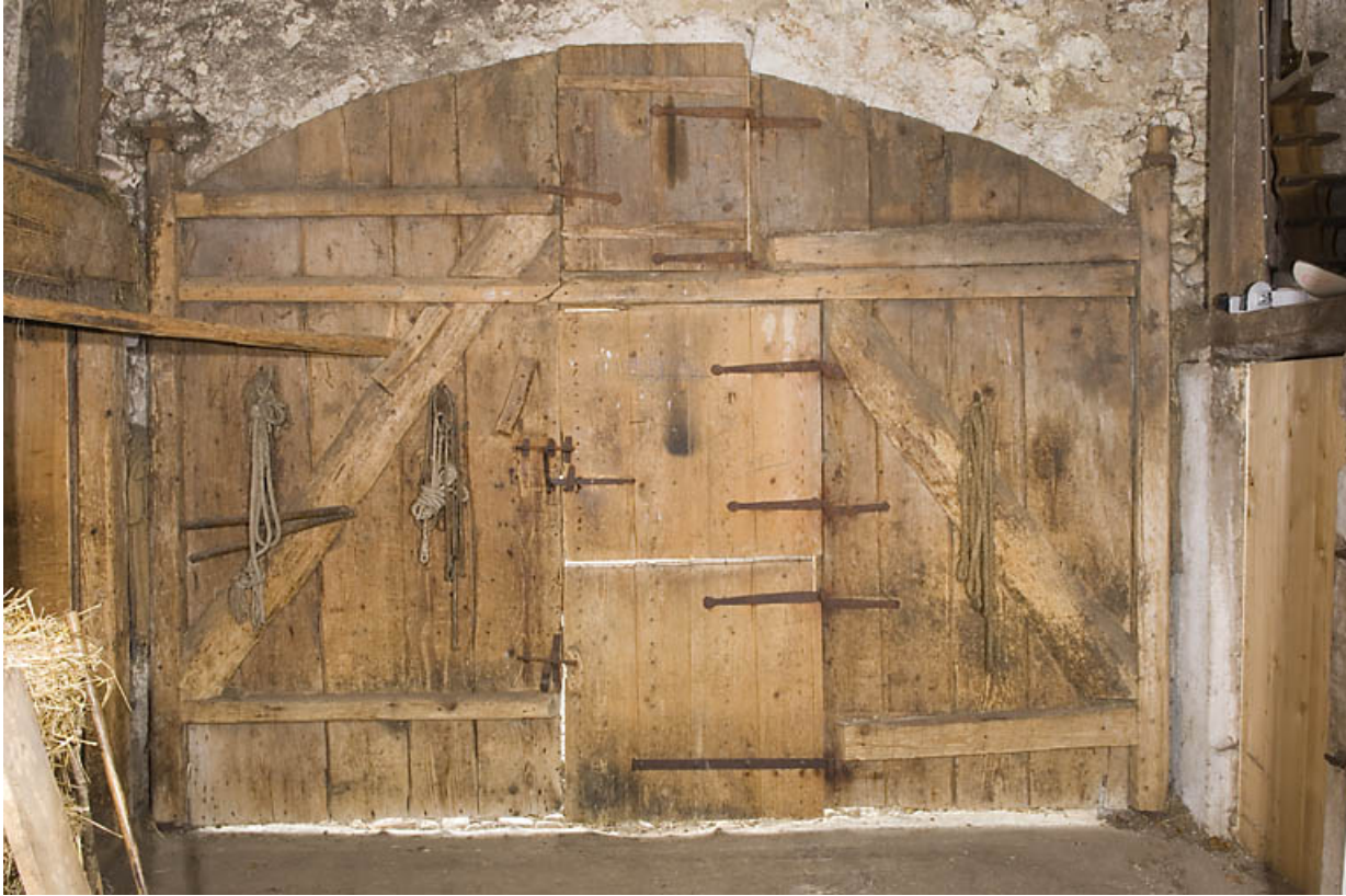
Façade antérieure : porte de la grange, depuis l'intérieur.

25, Jougue, 1 place des Cloutiers, lieudit : Entre-les-Fourgs