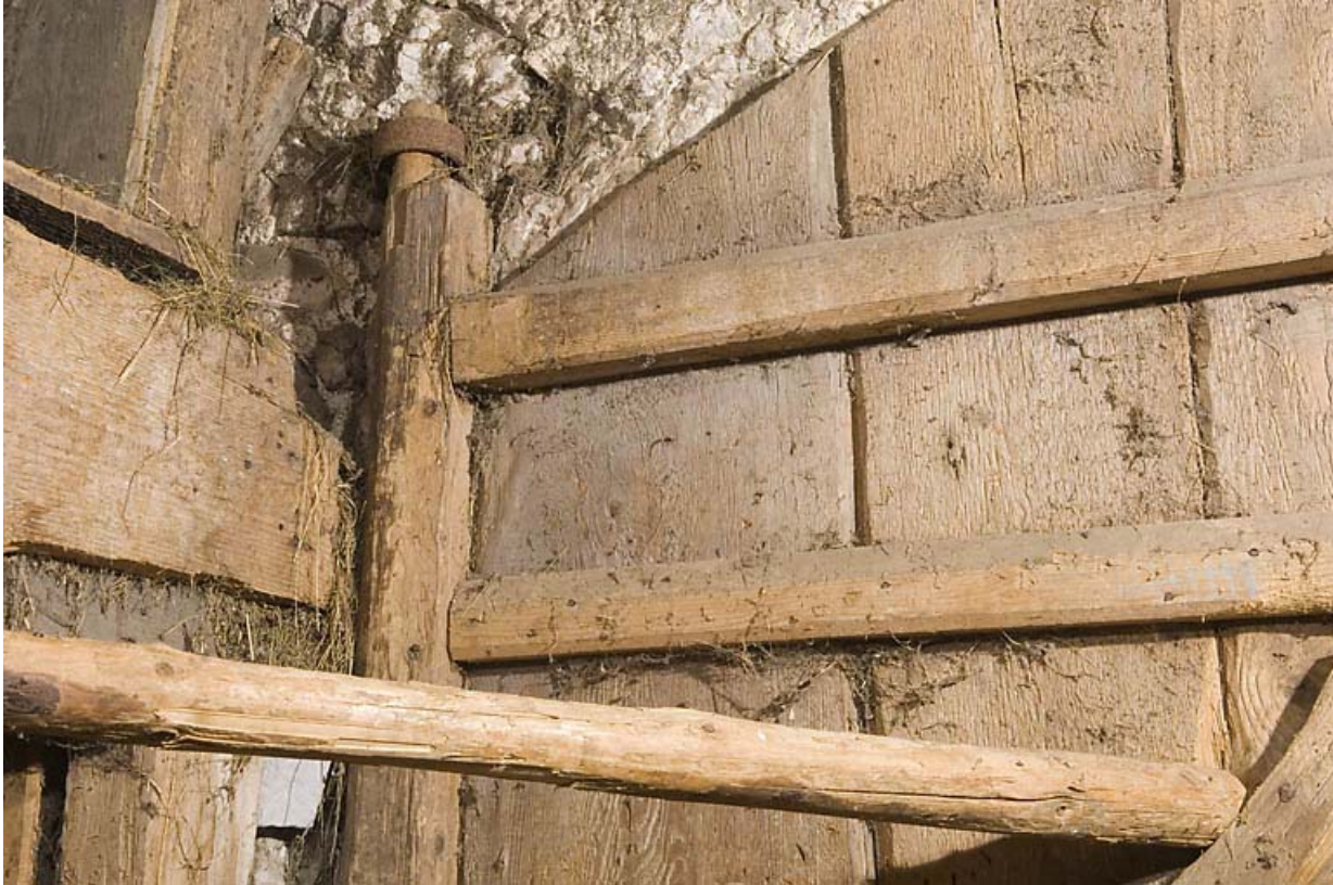
Façade antérieure, porte de grange : fixation de l'axe vertical du vantaill de droite (collier en partie haute). 25, Jougne, 1 place des Cloutiers, lieudit : Entre-les-Fourgs