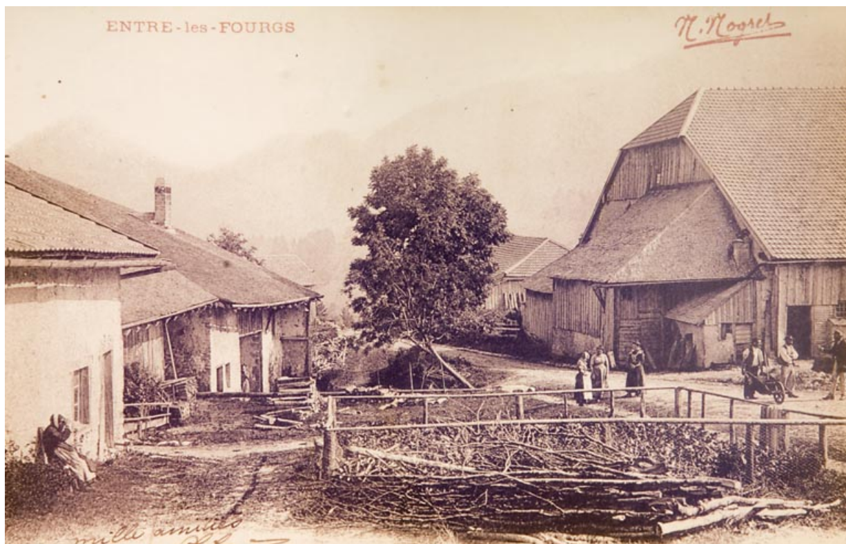
Entre-les-Fourgs [façade latérale gauche de la ferme], [1ère moitié 20e siècle].

25, Jougue, 1 place des Cloutiers, lieudit : Entre-les-Fourgs