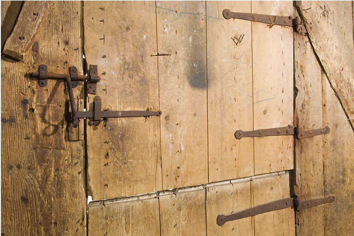
Façade antérieure, porte de grange : fermeture.

25, Jougne, 1 place des Cloutiers, lieudit : Entre-les-Fourgs