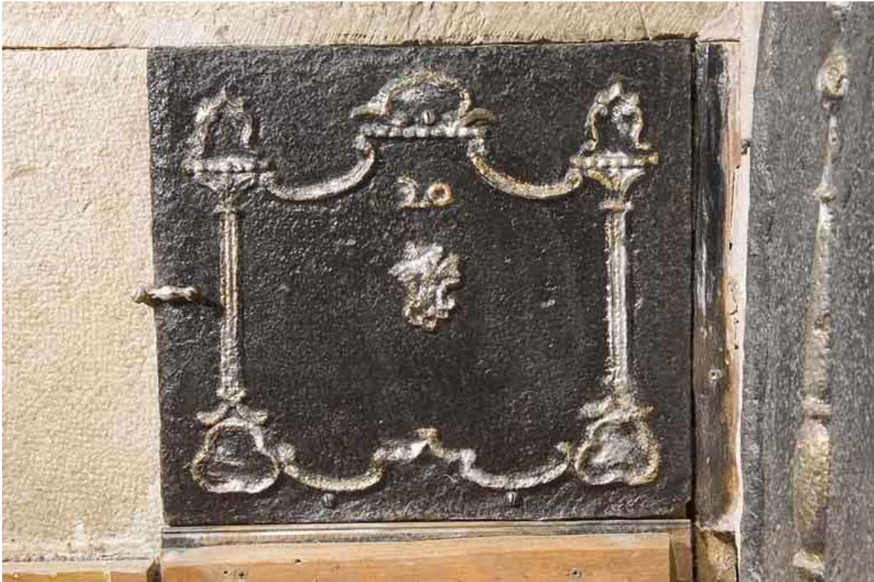
Plaque de cheminée.