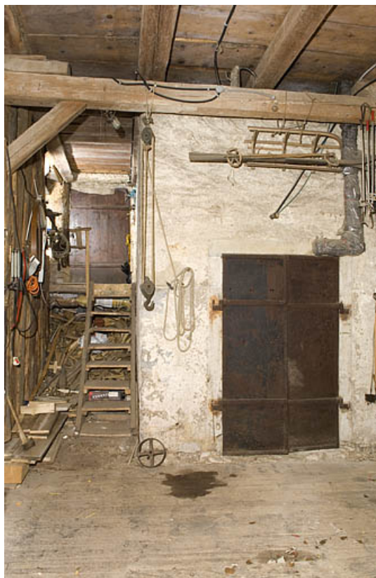
Porte coupe-feu à deux vantaux, vue du côté parties agricoles.