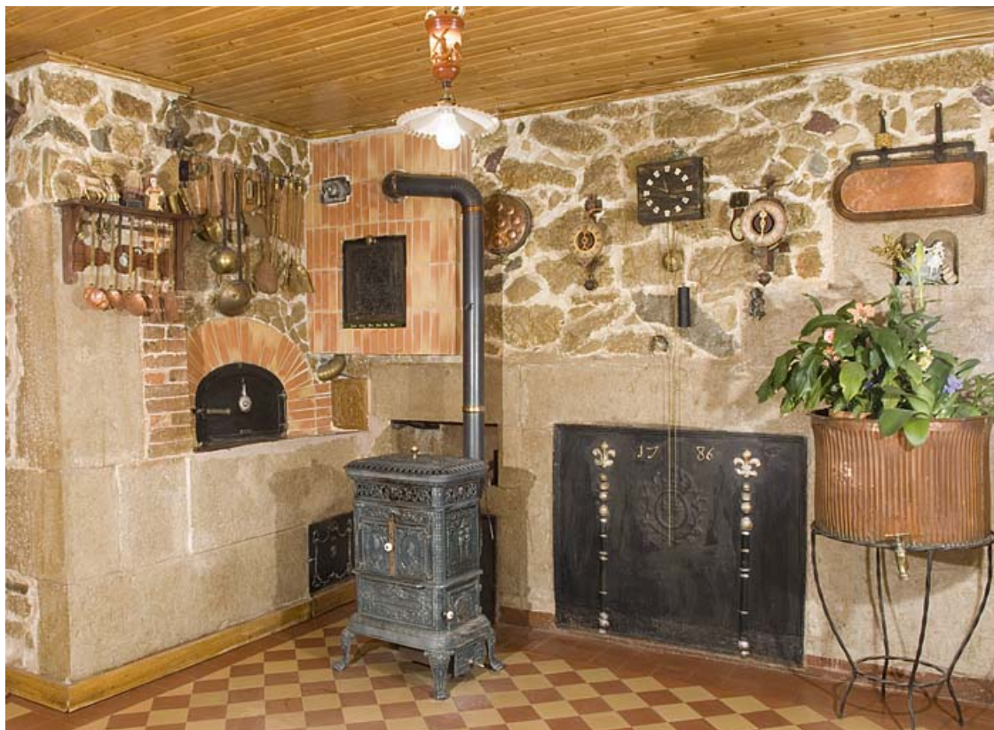
Cuisine du rez-de-chaussée : intérieur.