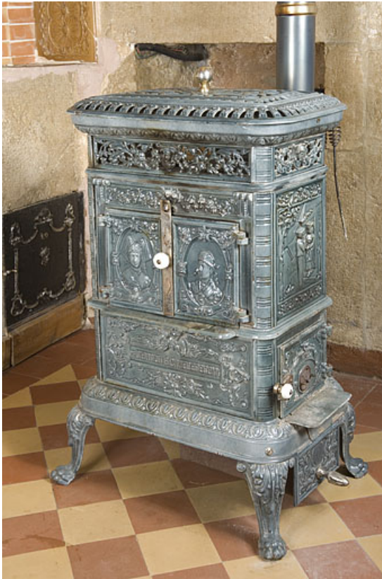
Poêle en faïence.