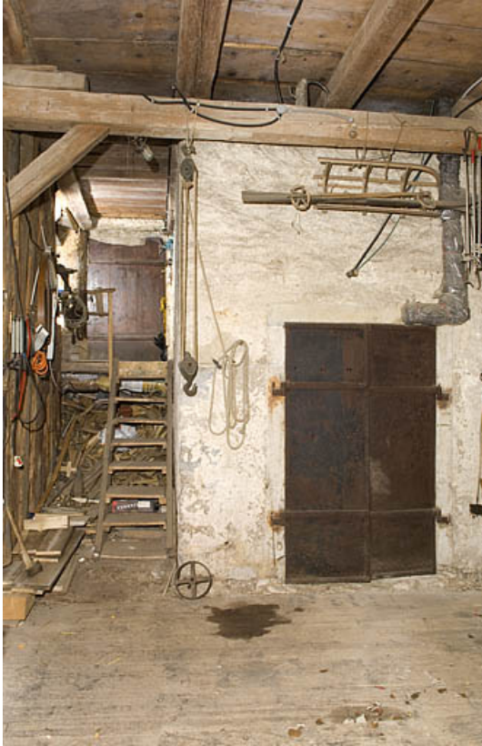
Porte coupe-feu à deux vantaux, vue du côté parties agricoles. 25, Jougne, 12 route des Alpes