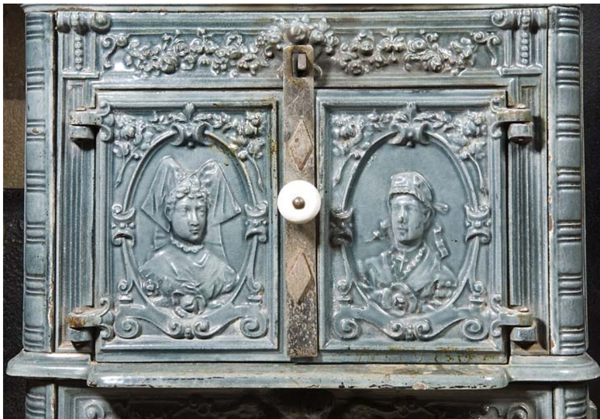
Poêle en faïence : décor de personnages alsaciens.