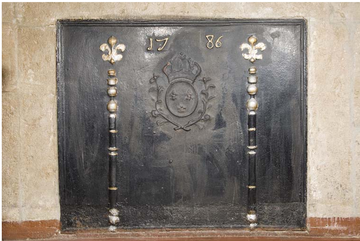
Plaque de cheminée portant la date 1786.