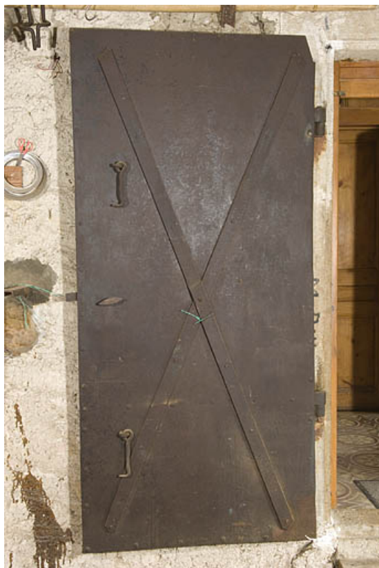
Porte coupe-feu ouverte.