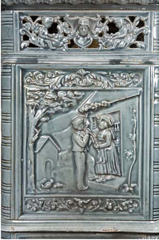
Poêle en faïence : décor de personnages alsaciens.