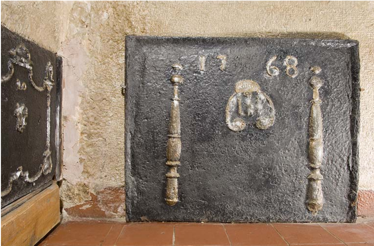
Plaque de cheminée portant la date 1768.