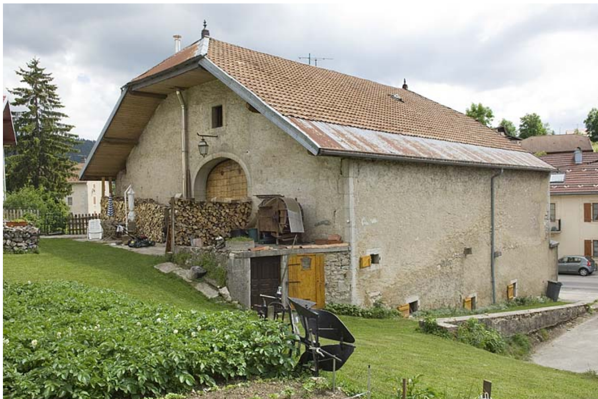
Façade postérieure et façade latérale gauche. 25, Jougne, 12 route des Alpes