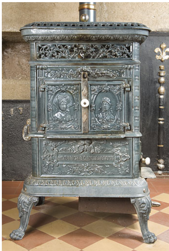
Poêle en faïence, de face.