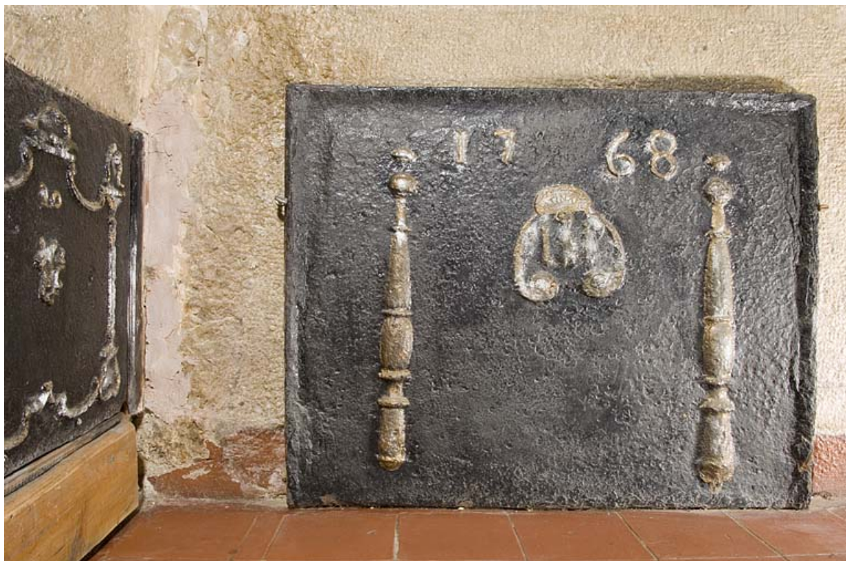
Plaque de cheminée portant la date 1768.