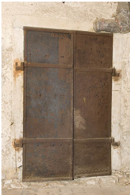
Porte coupe-feu à deux vantaux, fermée.