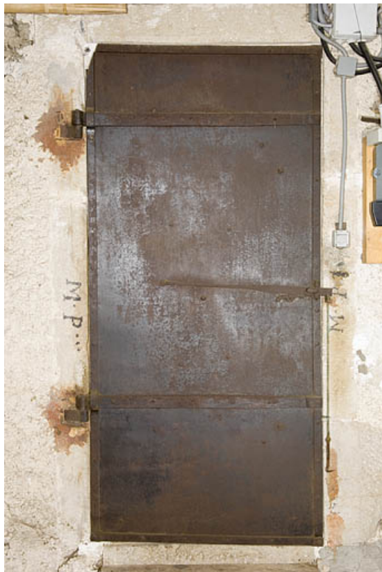
Porte coupe-feu fermée.