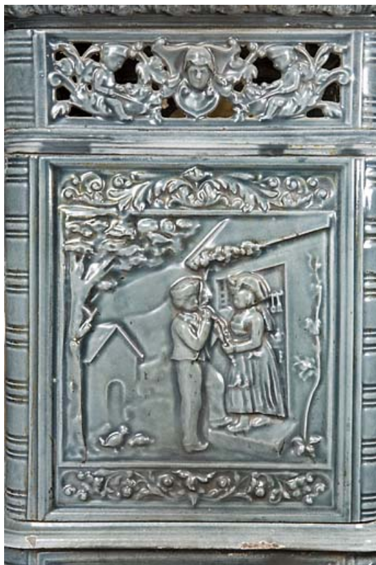
Poêle en faïence : décor de personnages alsaciens.