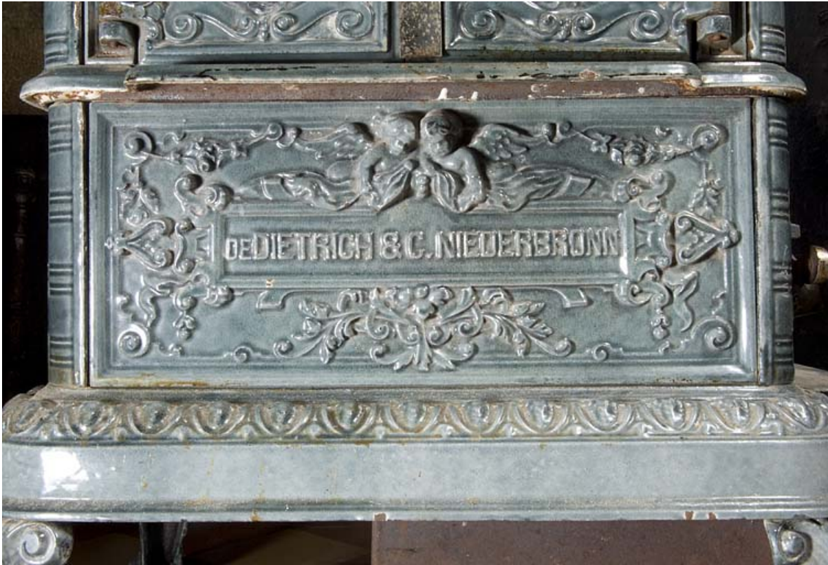
Poêle en faïence : inscription.