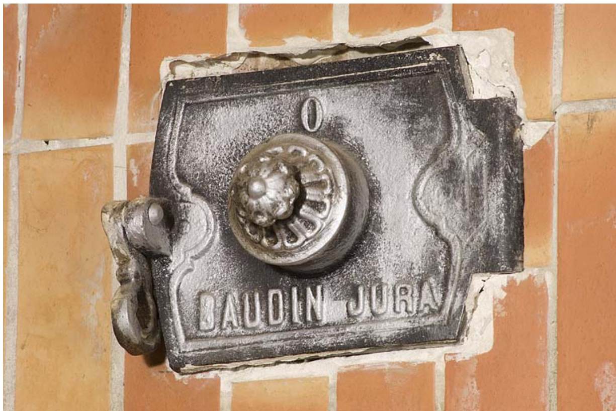
Plaque d'obturation marquée Baudin Jura.