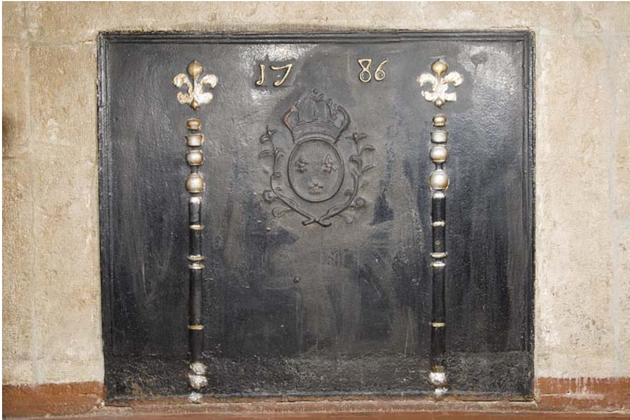
Plaque de cheminée portant la date 1786.