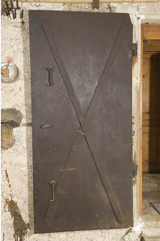
Porte coupe-feu ouverte.