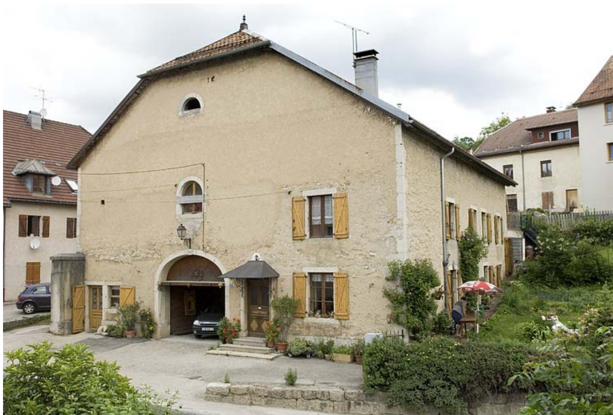
Façade antérieure, route des Alpes.