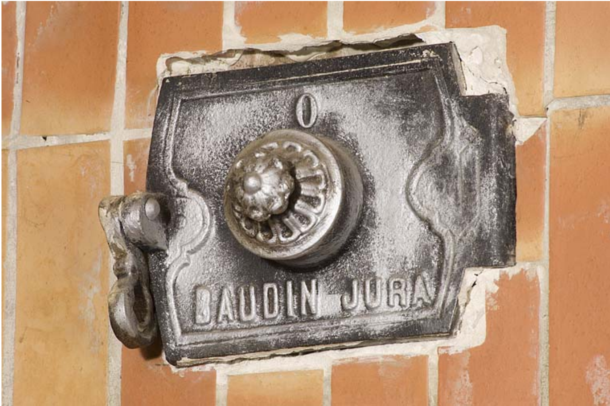
Plaque d'obturation marquée Baudin Jura.