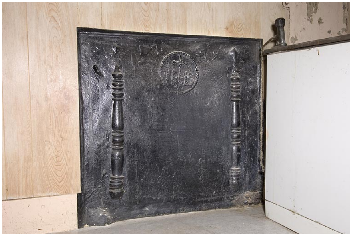
Cuisine à l'étage : plaque de cheminée datée 1779. 25, Jougne, 2 rue du Faubourg