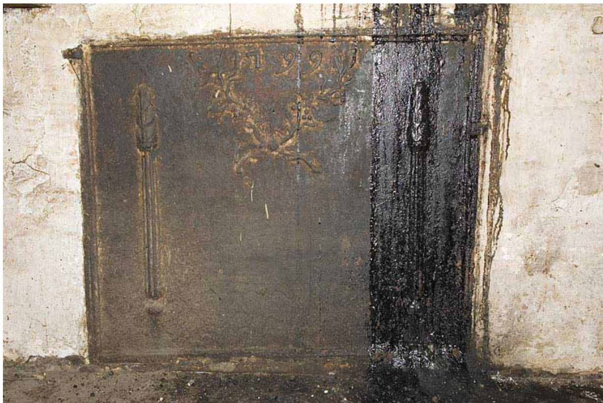
Cuisine au rez-de-chaussée : plaque de cheminée datée 1799. 25, Jougne, 2 rue du Faubourg