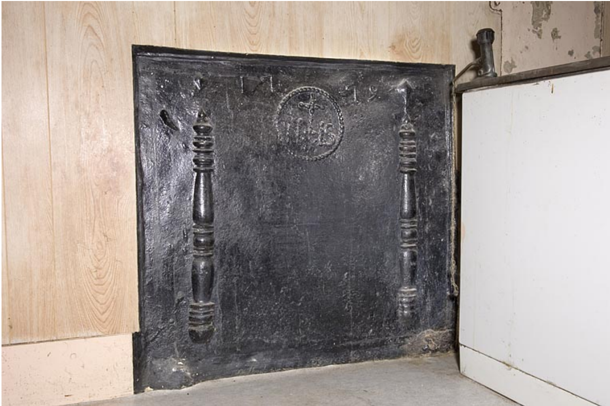
Cuisine à l'étage : plaque de cheminée datée 1779.