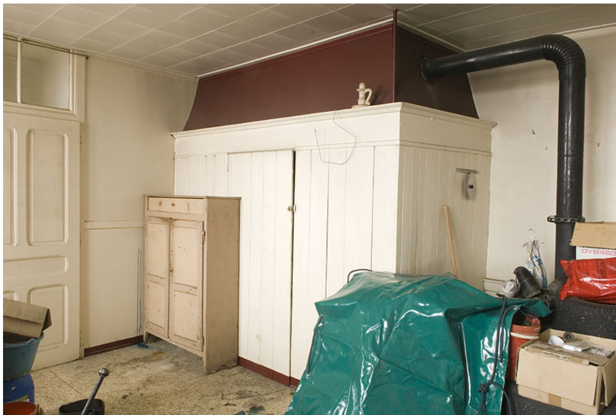
Cuisine au rez-de-chaussée : cheminée transformée en fumoir.