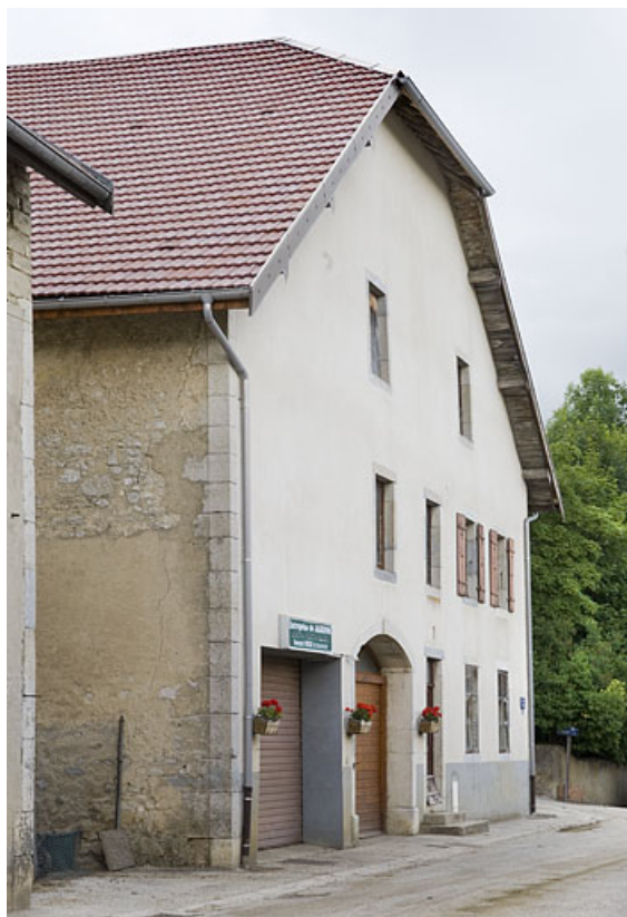
Façade antérieure, vue en enfilade.