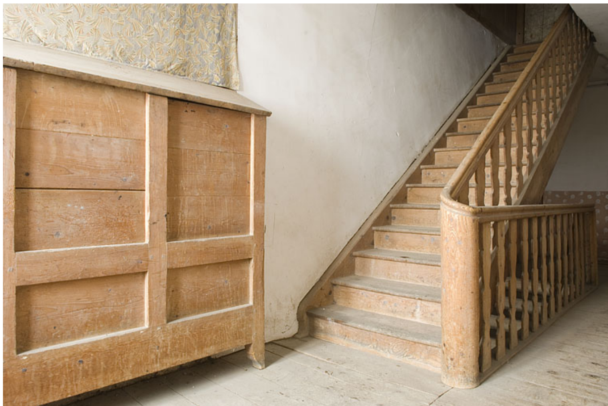
Escalier et coffre à grains.