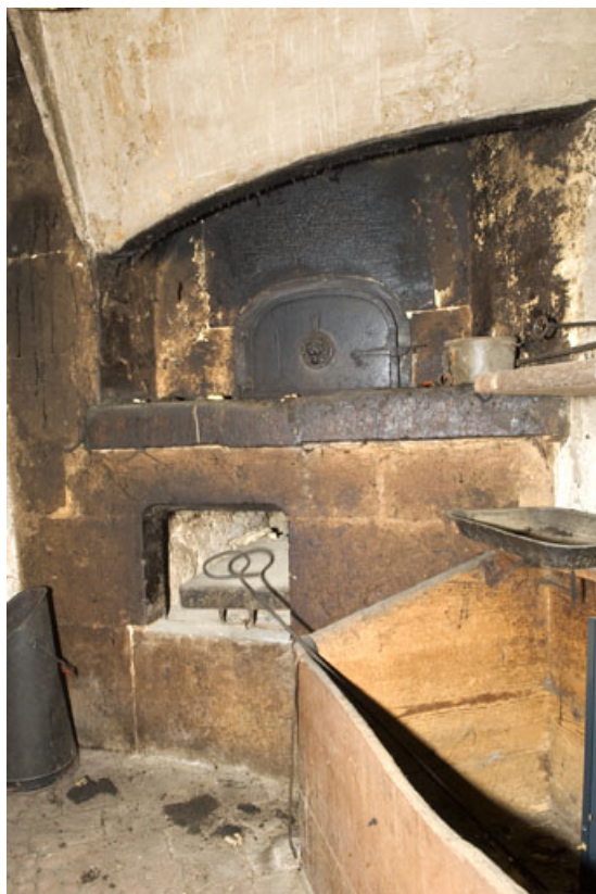
Cuisine au rez-de-chaussée : four à pain (cadrage vertical). 25, Jougne, 2 rue du Faubourg