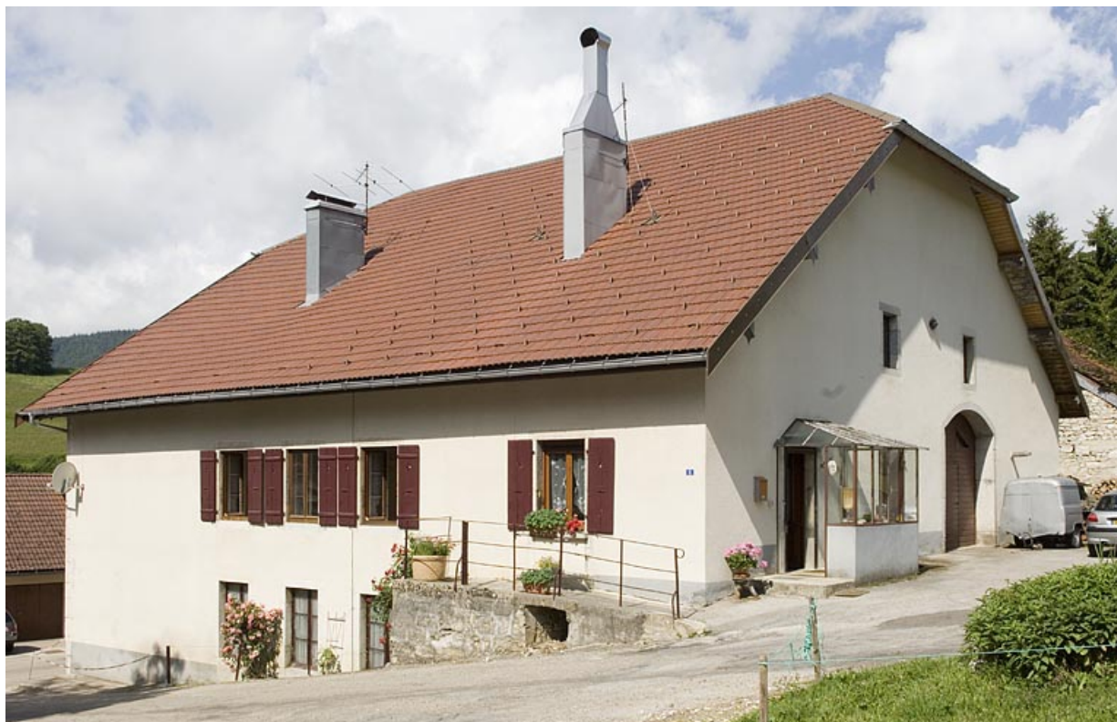
Façade postérieure et élévation latérale droite. 25, Jougne, 2 rue du Faubourg