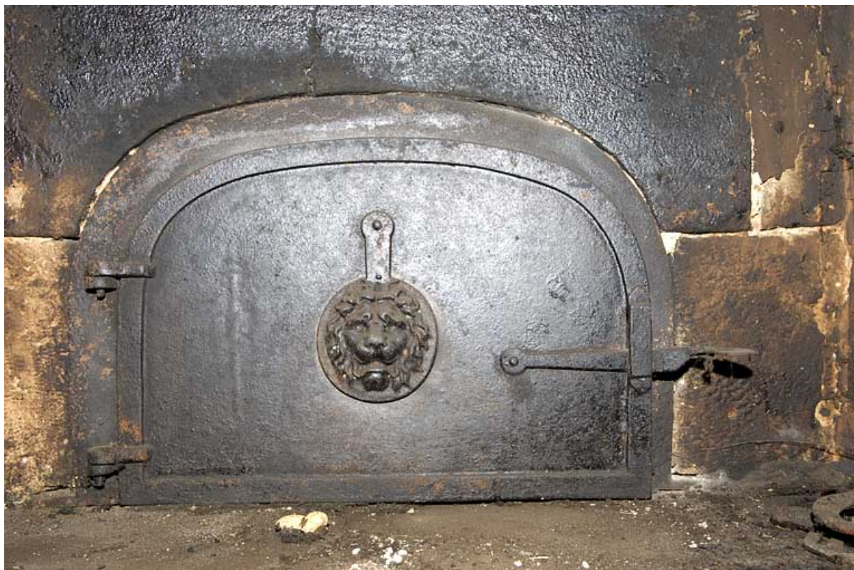
Cuisine au rez-de-chaussée : porte du four à pain. 25, Jougne, 2 rue du Faubourg