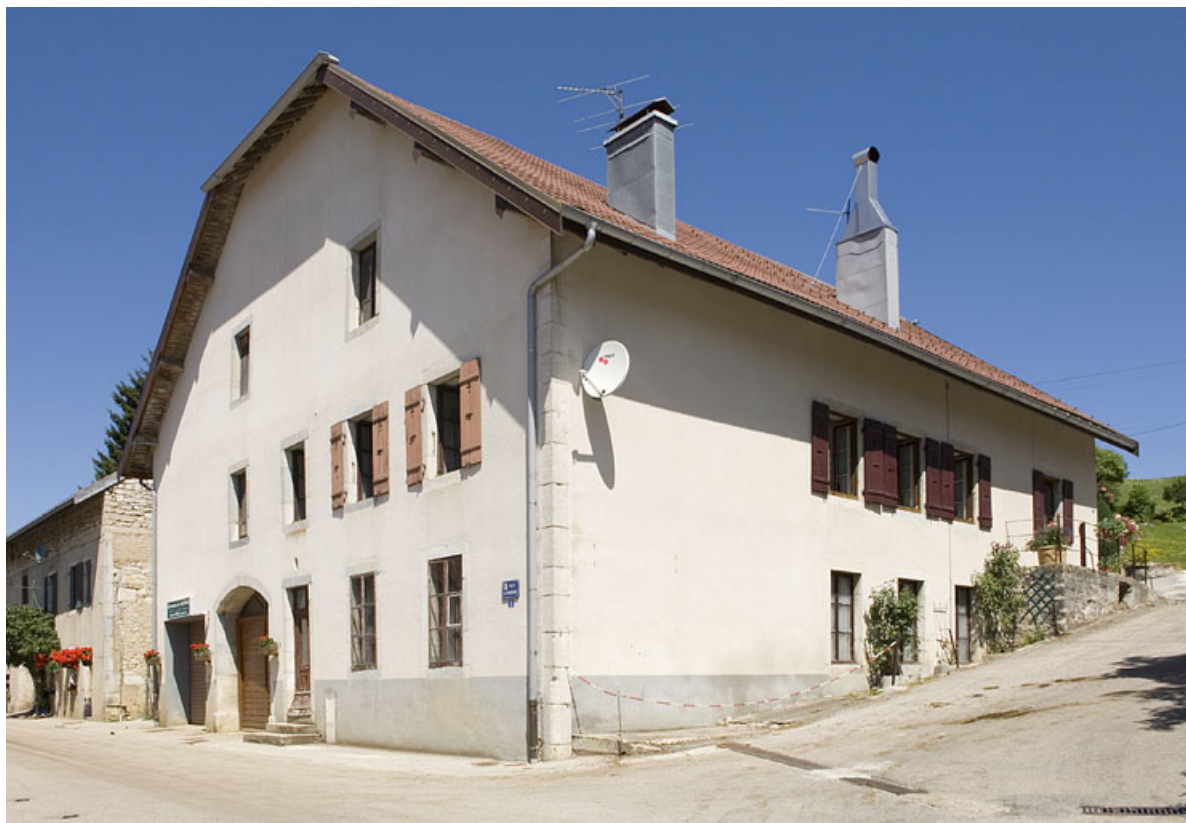
Façade antérieure et façade latérale droite depuis la rue du Faubourg. 25, Jougne, 2 rue du Faubourg