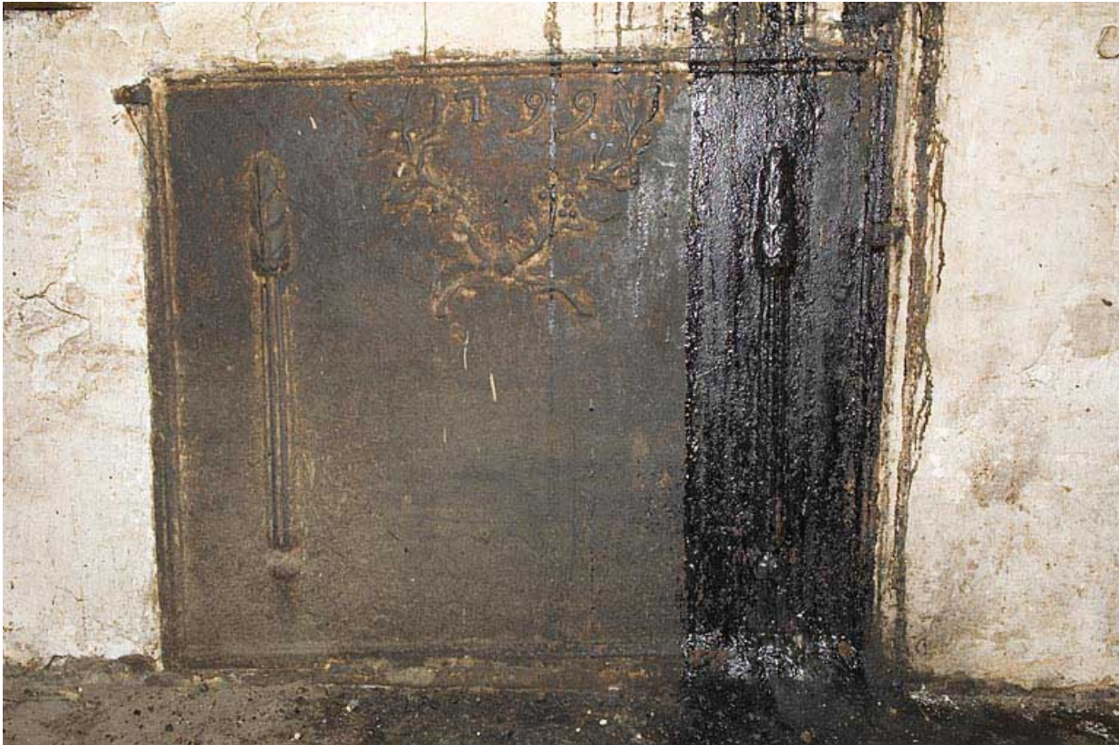
Cuisine au rez-de-chaussée : plaque de cheminée datée 1799.