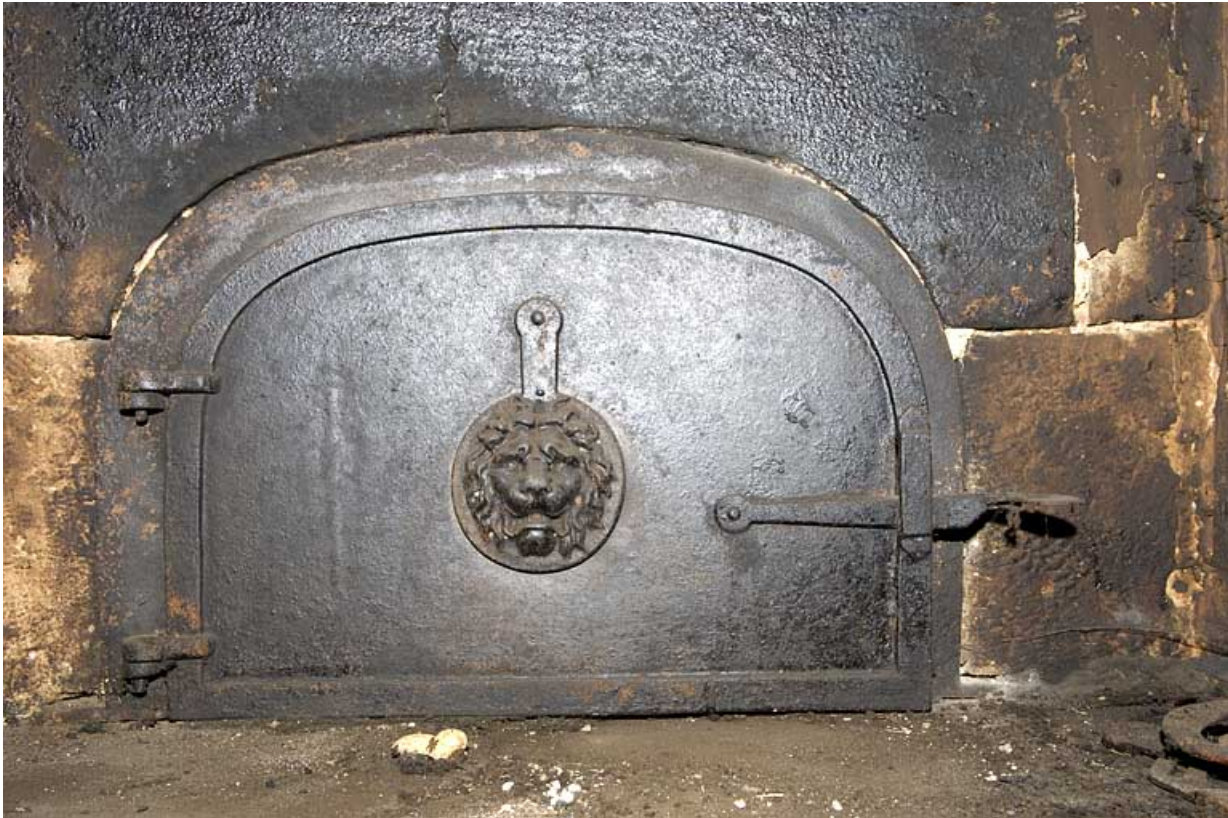
Cuisine au rez-de-chaussée : porte du four à pain. 25, Jougne, 2 rue du Faubourg