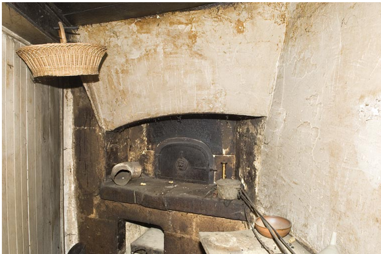
Cuisine au rez-de-chaussée : four à pain. 25, Jougne, 2 rue du Faubourg