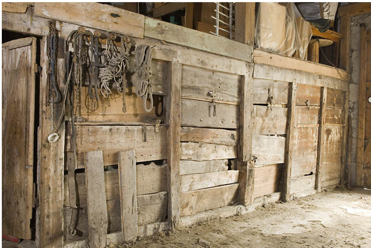
Ferme au 26 Grande Rue : cloison entre la "fourragère" et l'étable. 25, Jougne