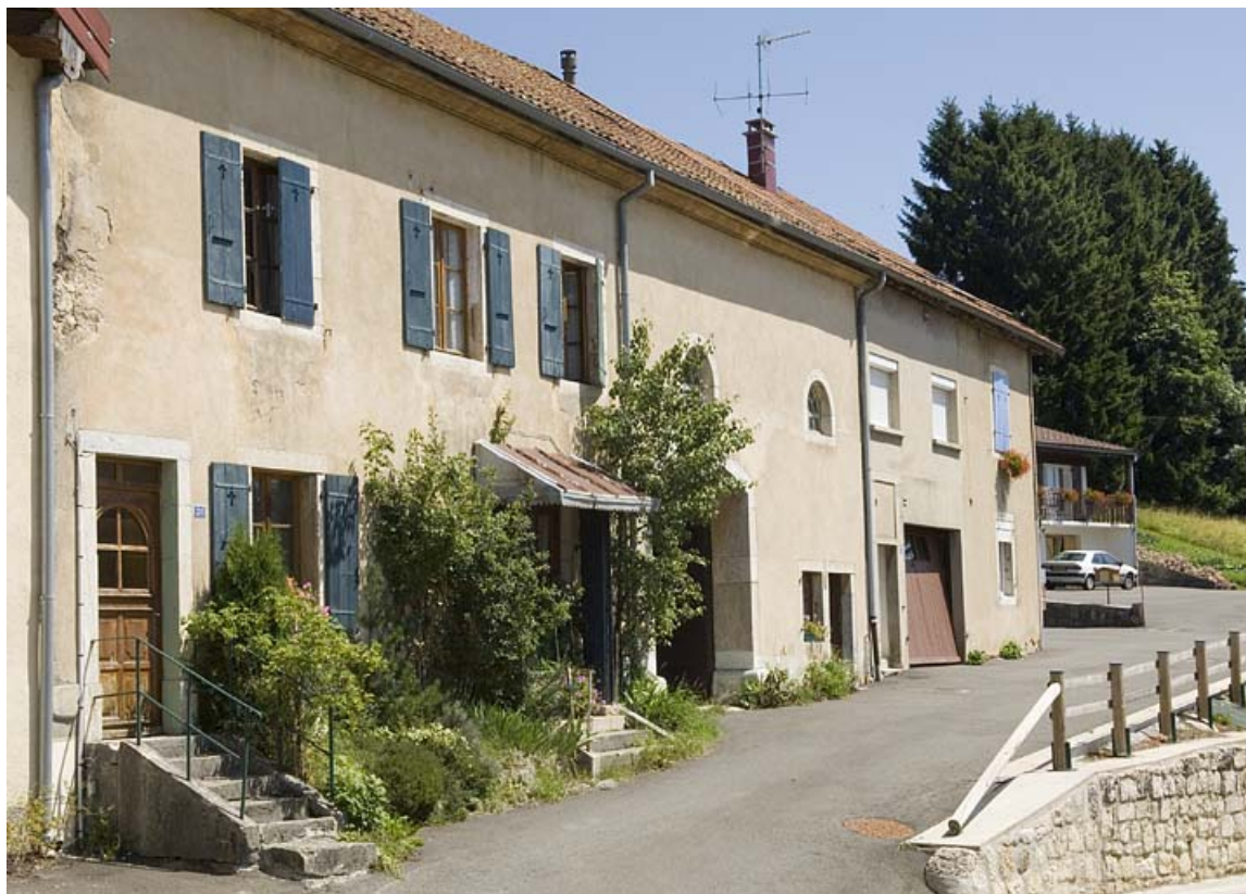
Vue de trois quart gauche 25, Jougne, 26 Grande Rue