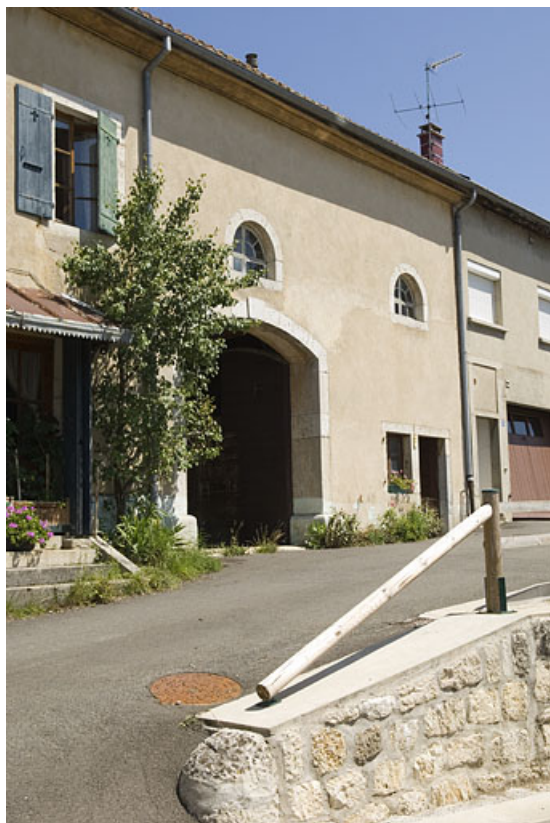
Vue de trois quart rapprochée.