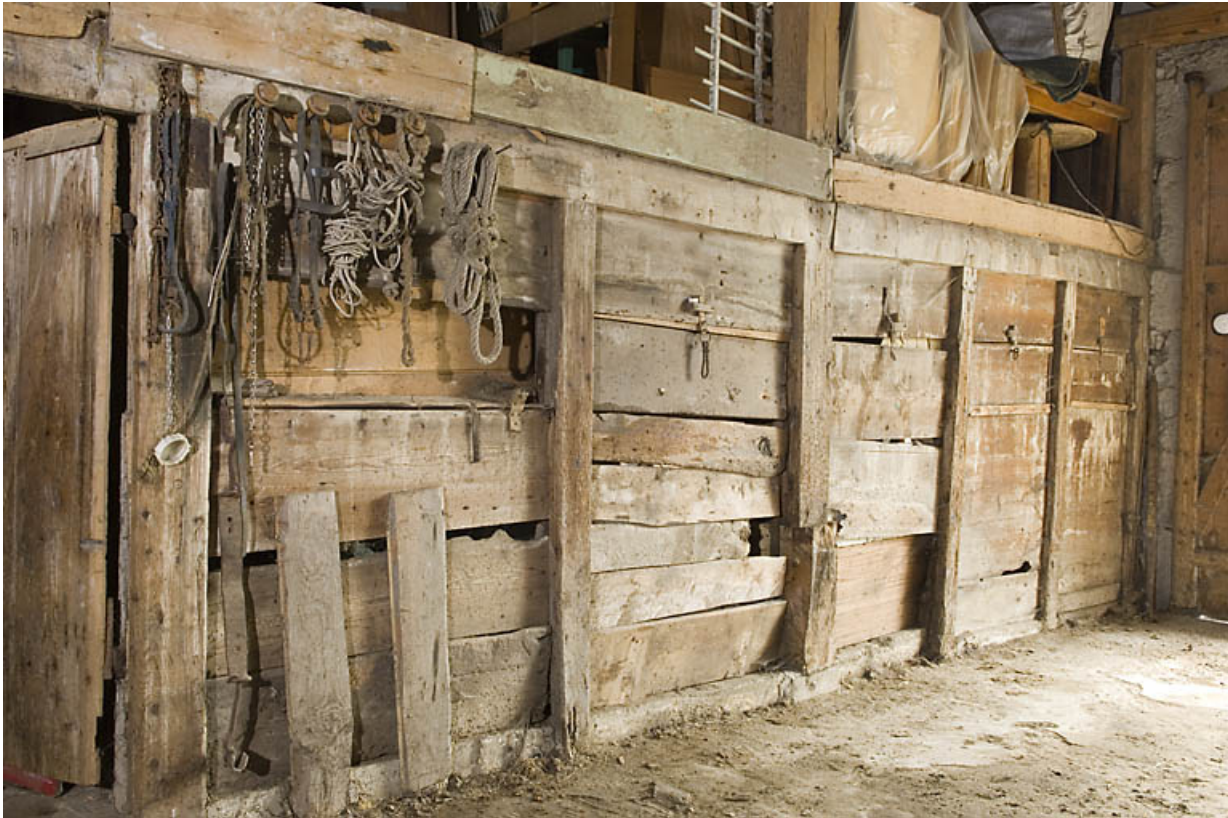
Ferme au 26 Grande Rue : cloison entre la "fourragère" et l'étable. 25, Jougne