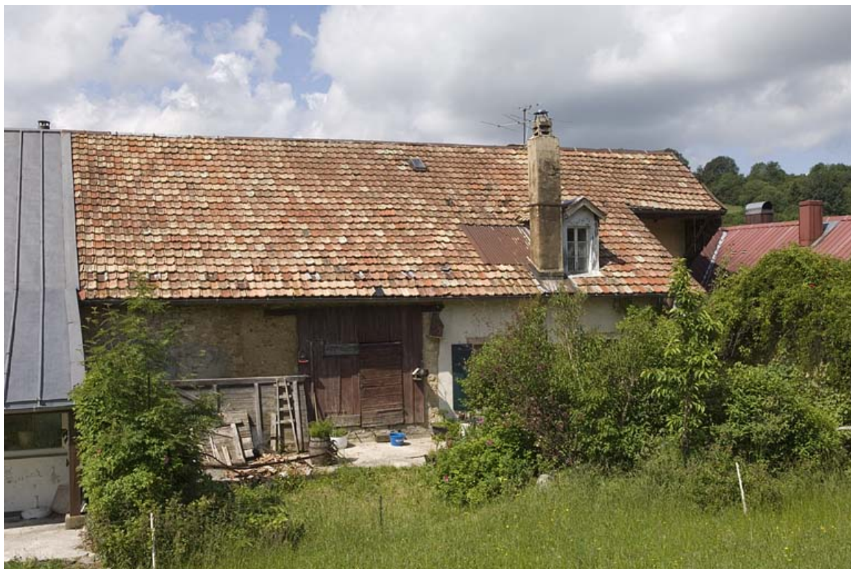
Vue du côté jardin.