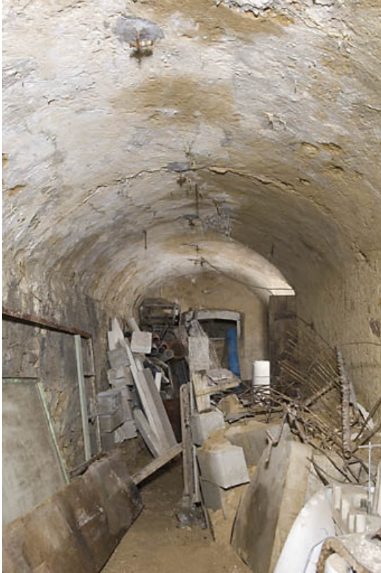
"Cave" derrière la grange.