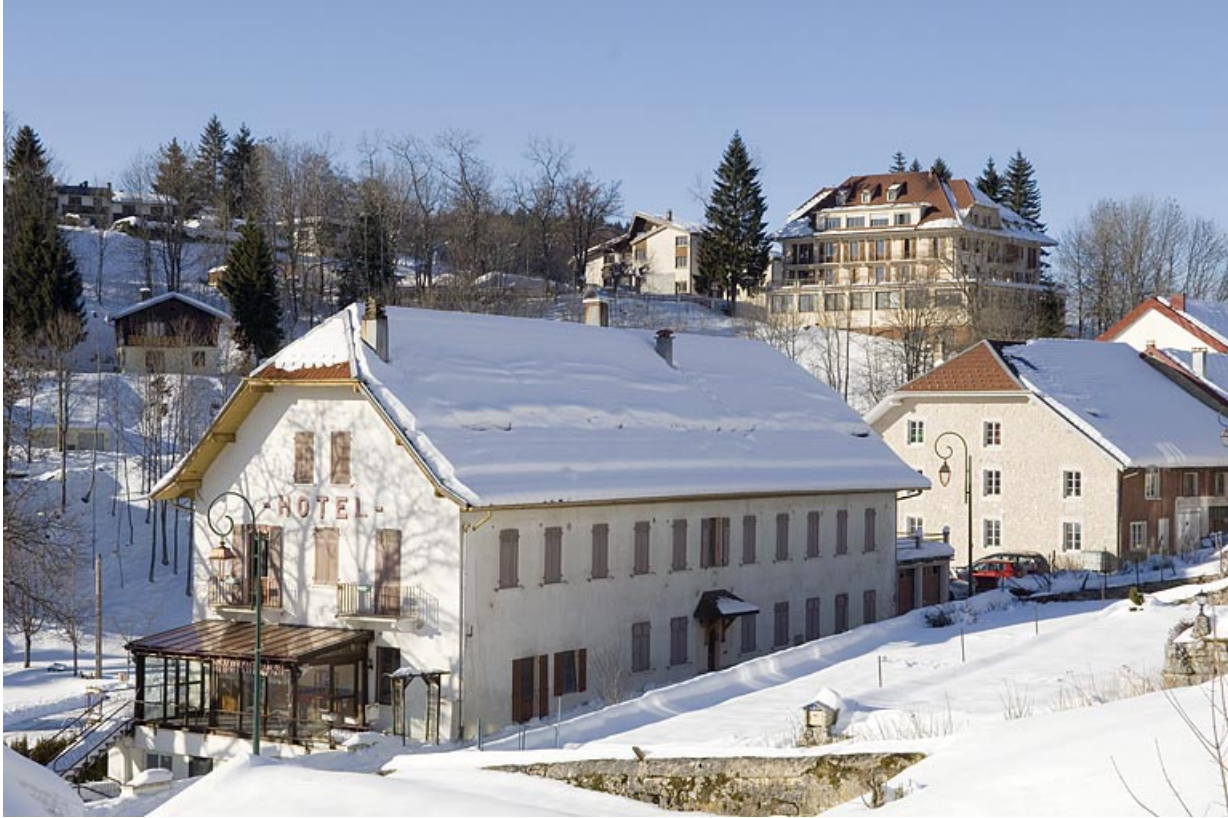
Façades antérieure et latérale gauche.