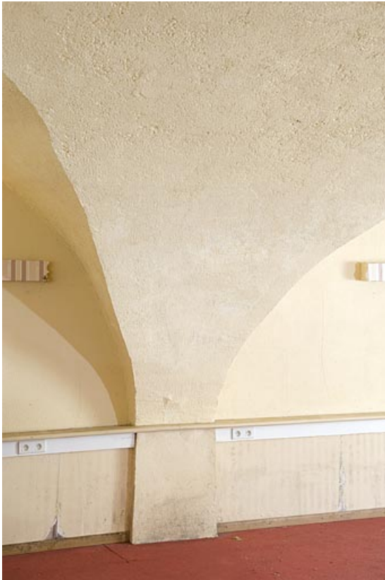
Départ de voûte d'arêtes.