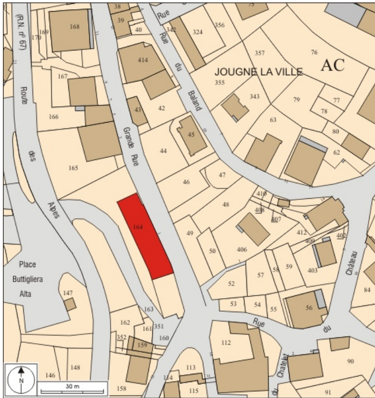
Plan-masse et de situation. Extrait du plan cadastral, 2008, section AC, échelle 1:1 000. 25, Jougne, 1 Grande Rue