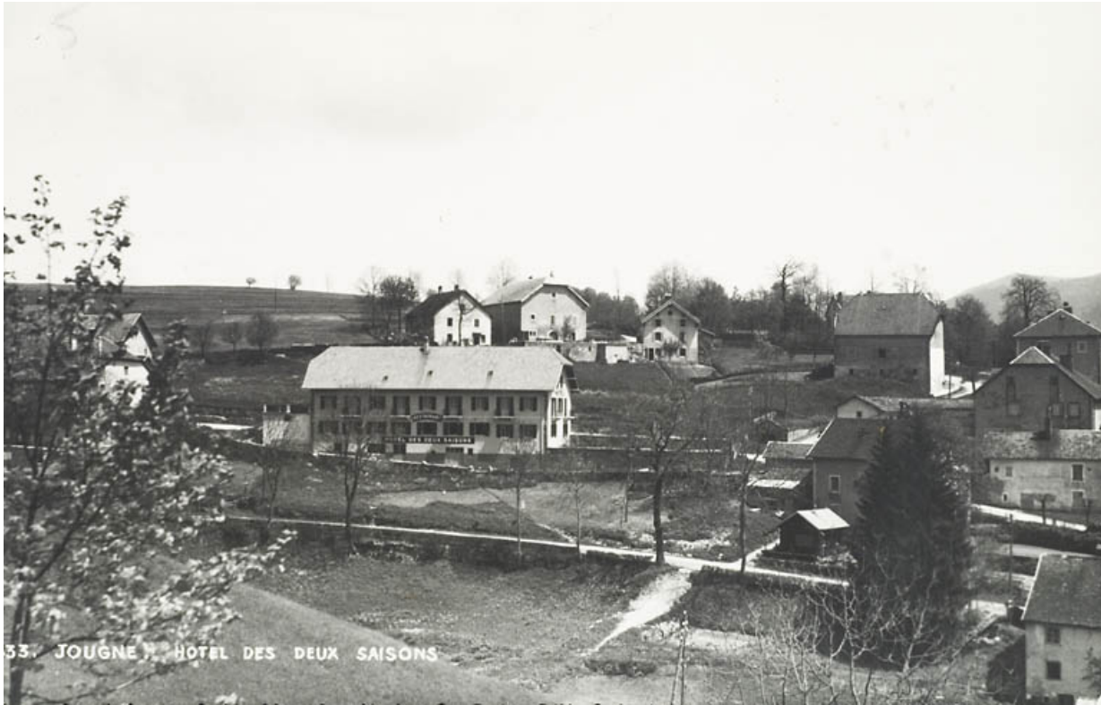
Jougne. Hôtel des Deux Saisons, [3e quart 20e siècle].