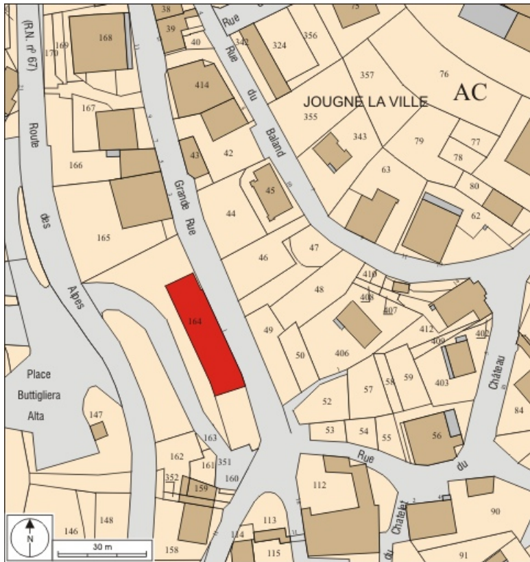
Plan-masse et de situation. Extrait du plan cadastral, 2008, section AC, échelle 1:1 000. 25, Jougne, 1 Grande Rue