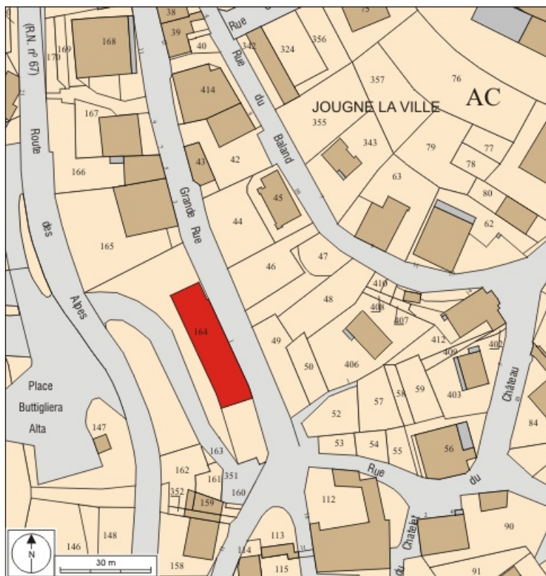
Plan-masse et de situation. Extrait du plan cadastral, 2008, section AC, échelle 1:1 000. 25, Jougne, 1 Grande Rue