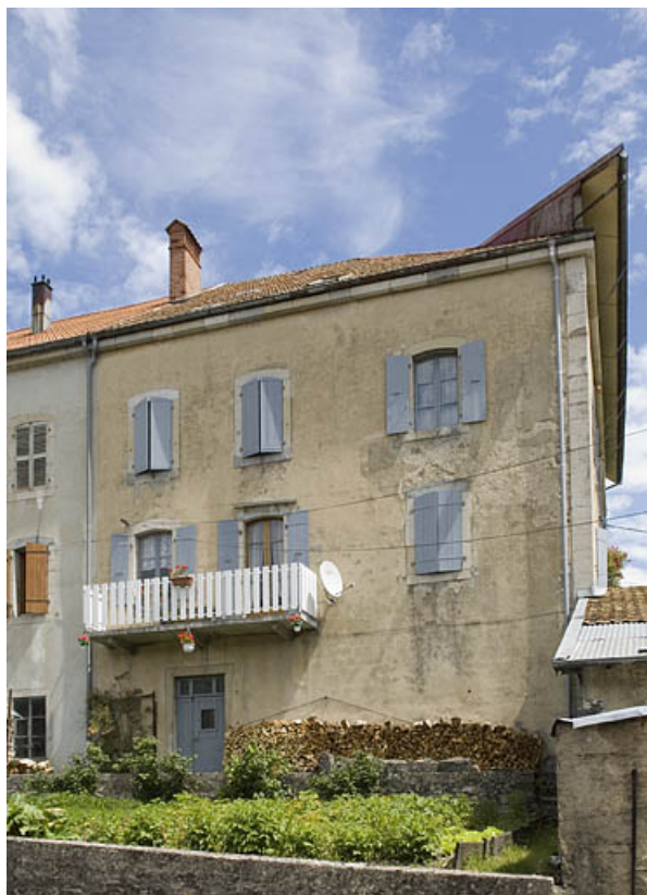
Façade postérieure de la partie sud.