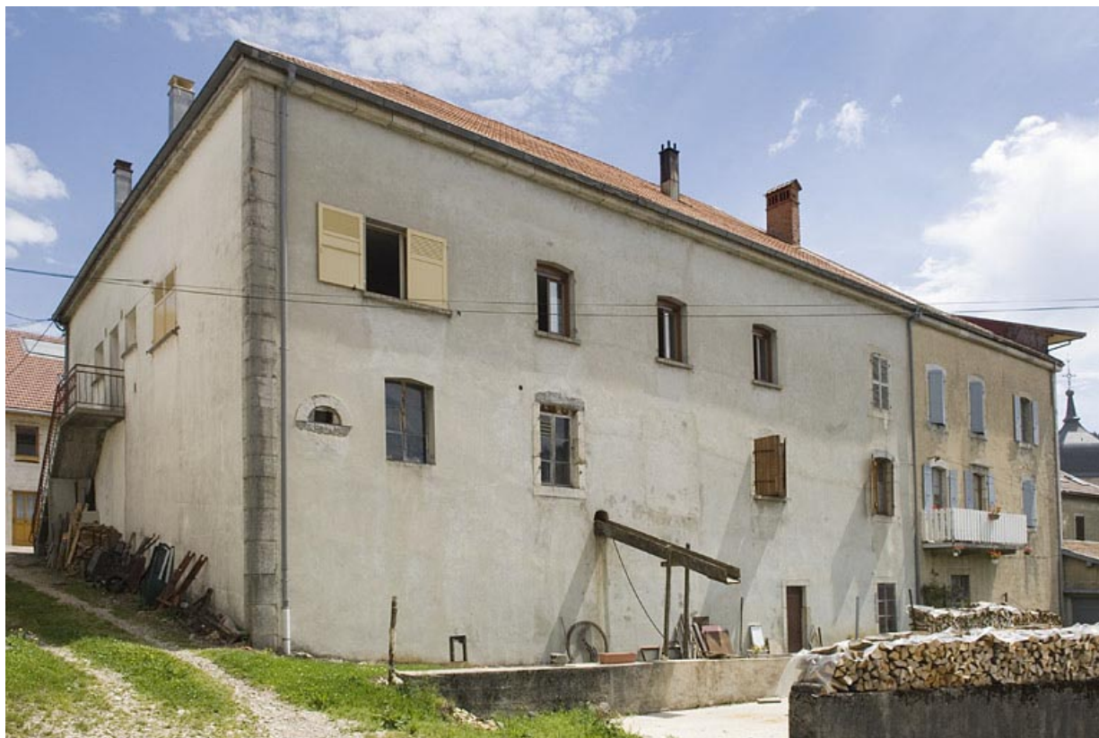
Façade postérieure, de trois quarts gauche.