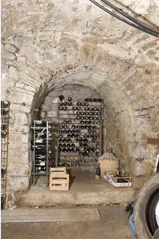
Sous-sol ("cave") : niche.