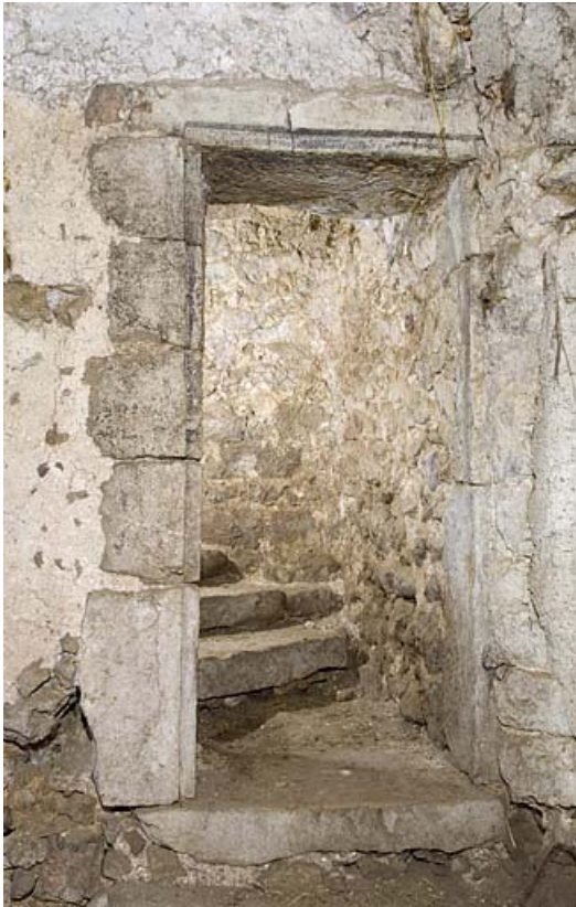
Porte donnant accès à l'escalier en pierre.