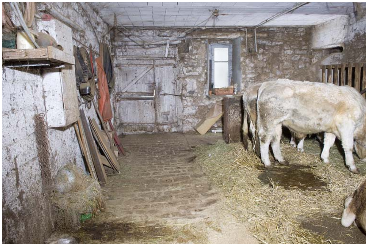
Etable : vue intérieure.