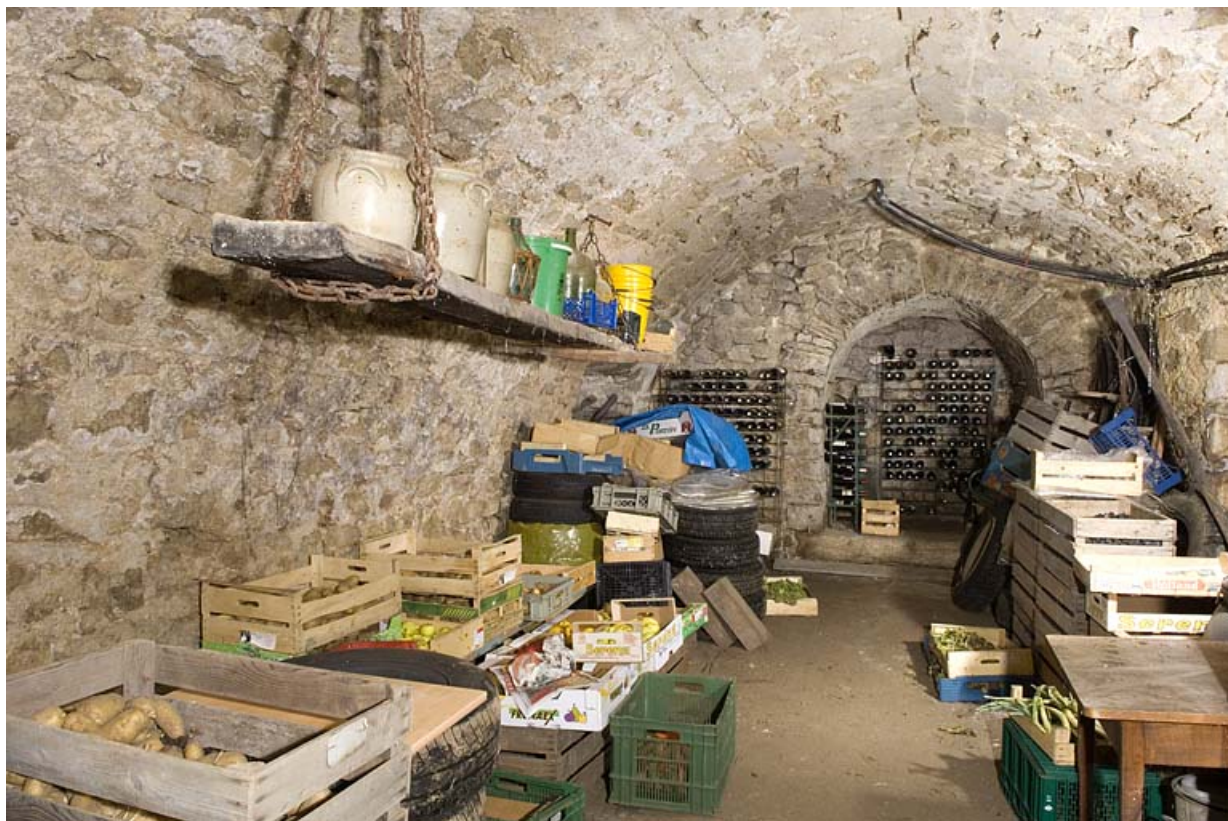
Sous-sol ("cave") voûté en berceau.