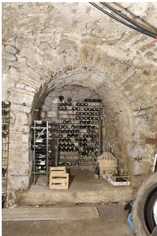
Sous-sol ("cave") : niche.