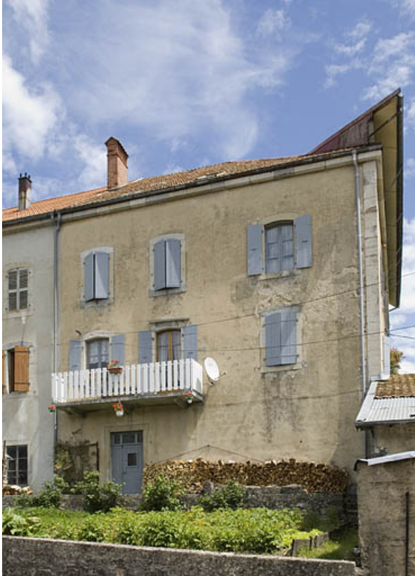
Façade postérieure de la partie sud.