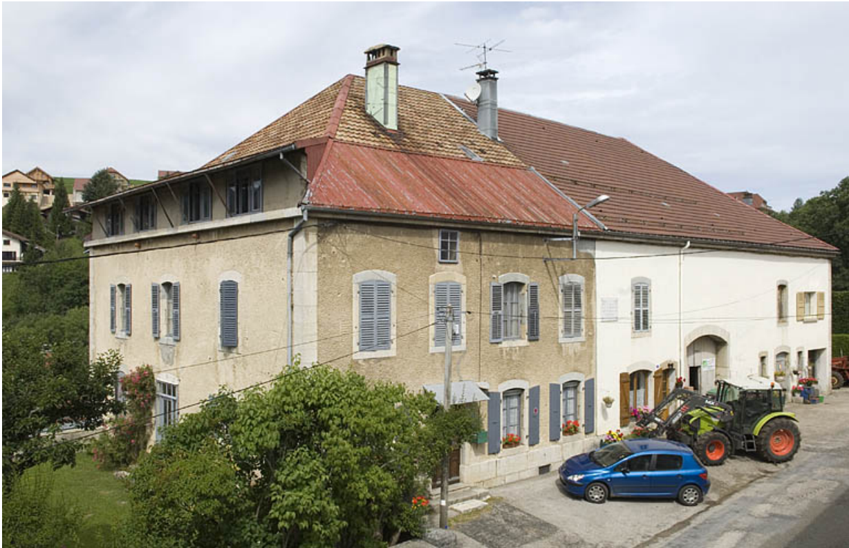
Façade antérieure, de trois quarts gauche. 25, Jougue, 5, 7 rue de l' Eglise