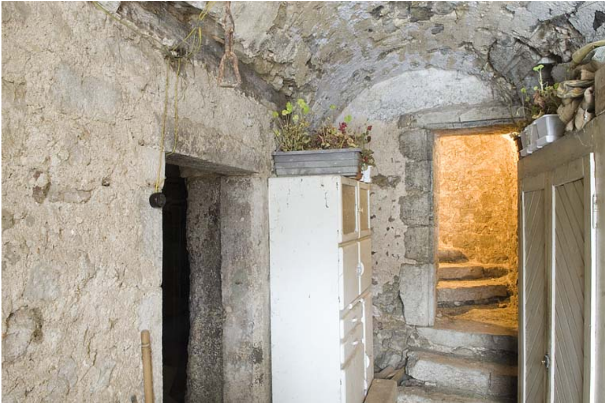
Couloir et départ de l'escalier en pierre.