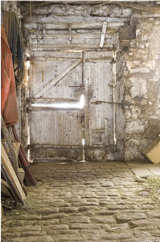
Etable : la porte vue de l'intérieur.