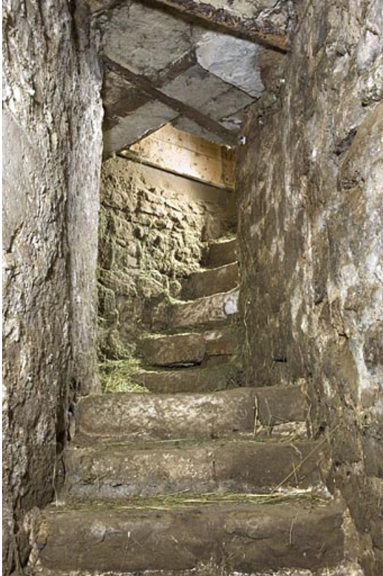
Escalier en pierre (cadrage vertical).