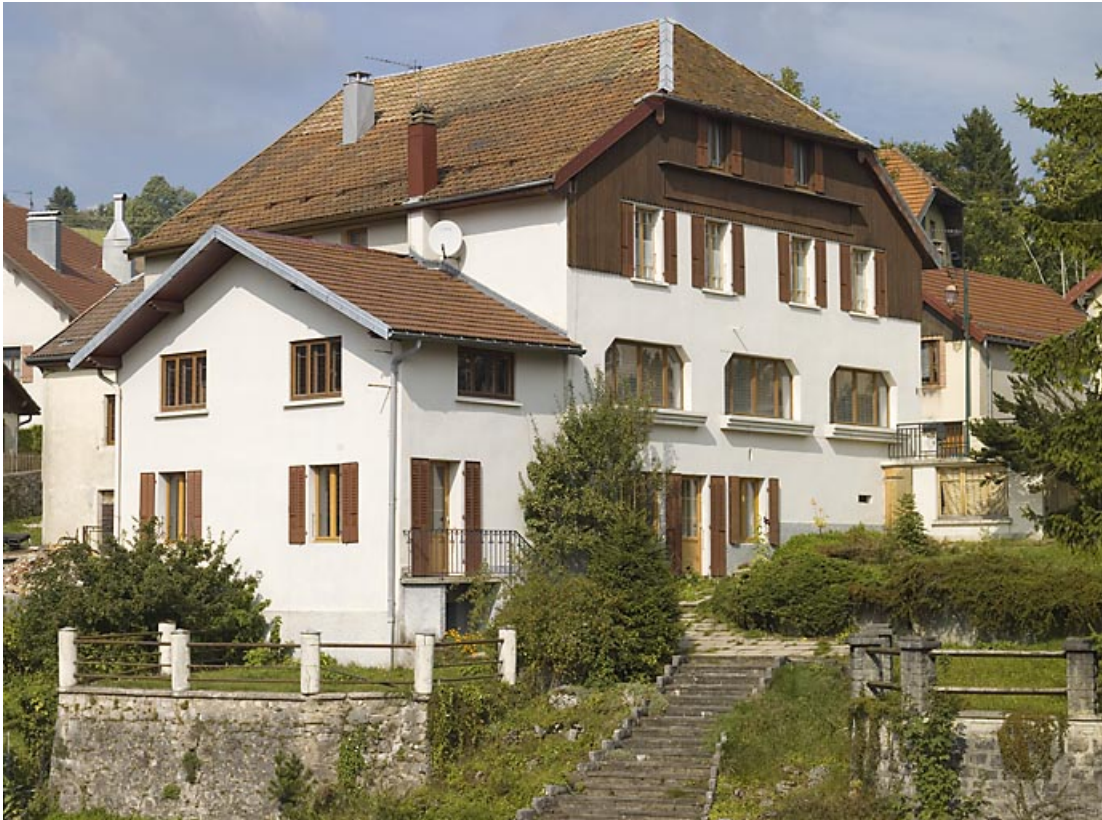
Façade postérieure et façade latérale gauche.