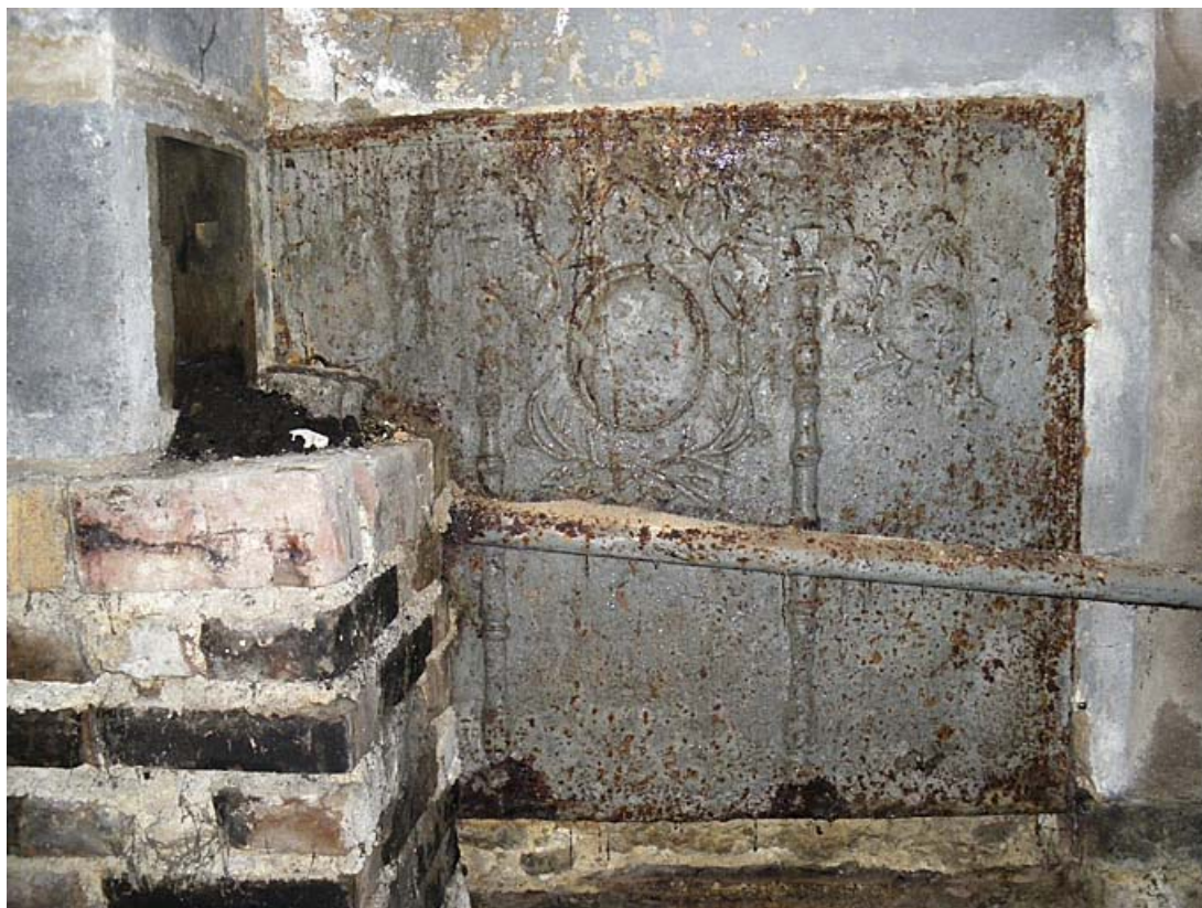
Plaque de cheminée.