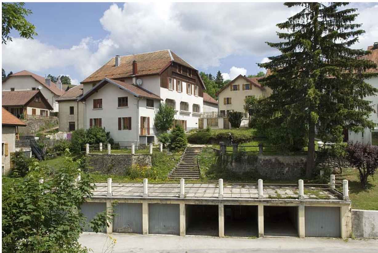
Vue générale depuis le route des Alpes.