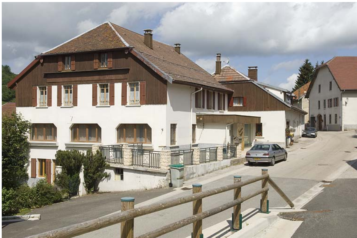
Façade antérieure et façade latérale gauche depuis la rue du Faubourg. 25, Jougne, 29-31 Grande Rue