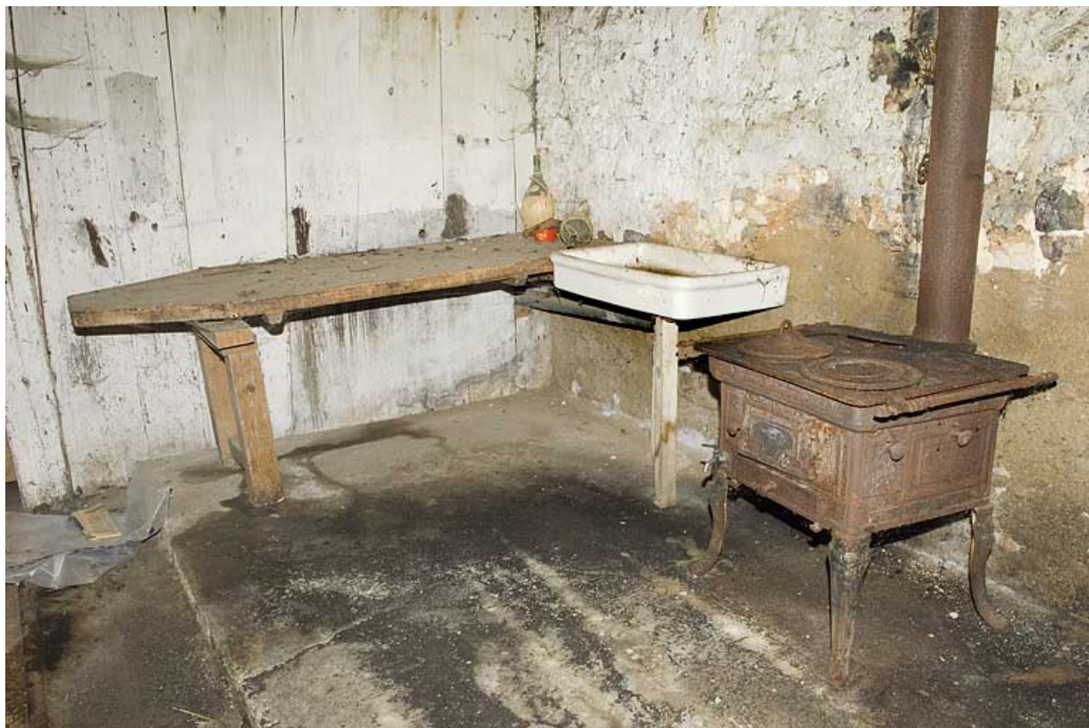
Intérieur de la ferme : la cuisine et le poêle en fonte.