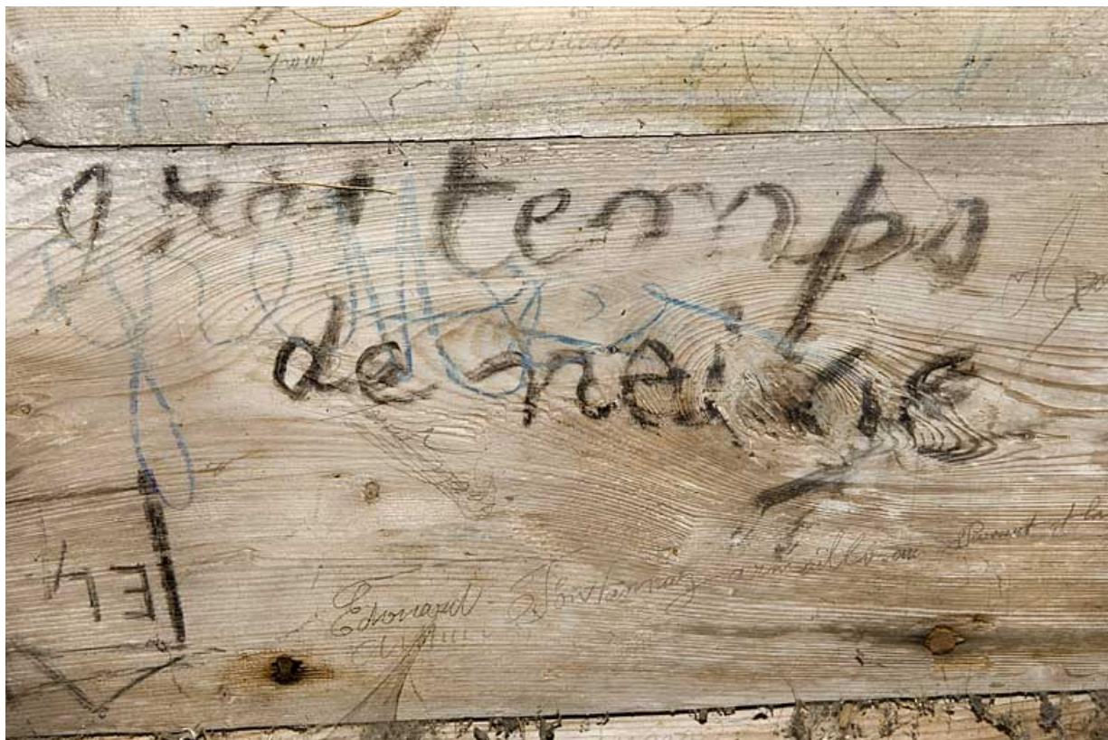
Intérieur, la chambre du berger, détail : inscription.