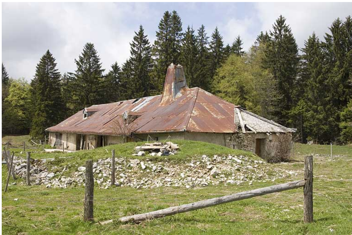
Vue générale de trois quart droit avec la citerne au premier plan.