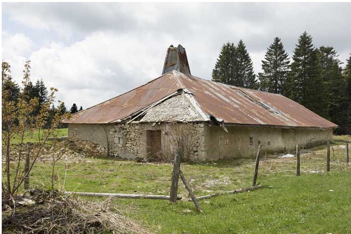
Façade latérale droite et façade postérieure.