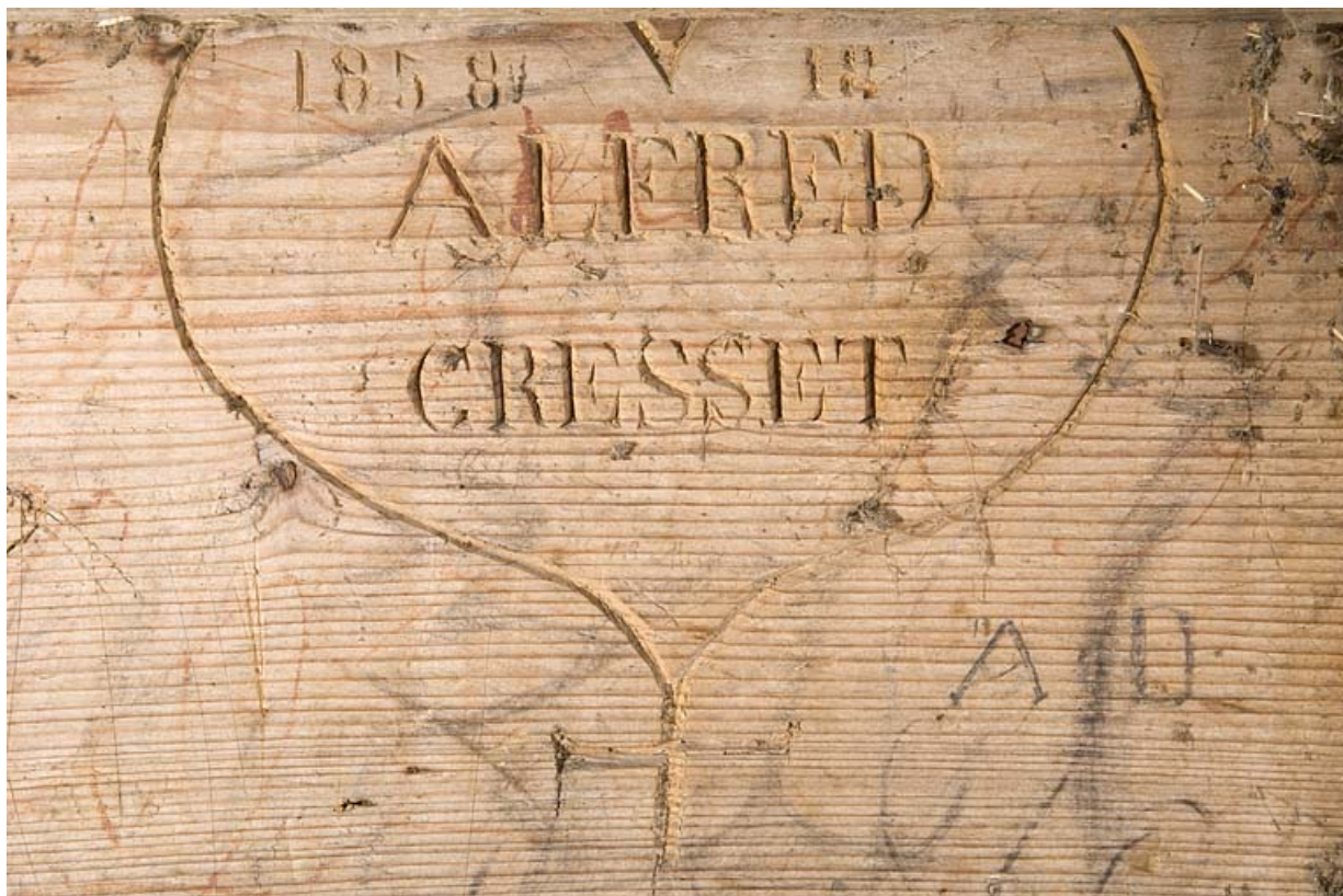
Intérieur, la chambre du berger, détail : inscription portant la date 1858. 25, Jougne, lieudit : la Bécasse