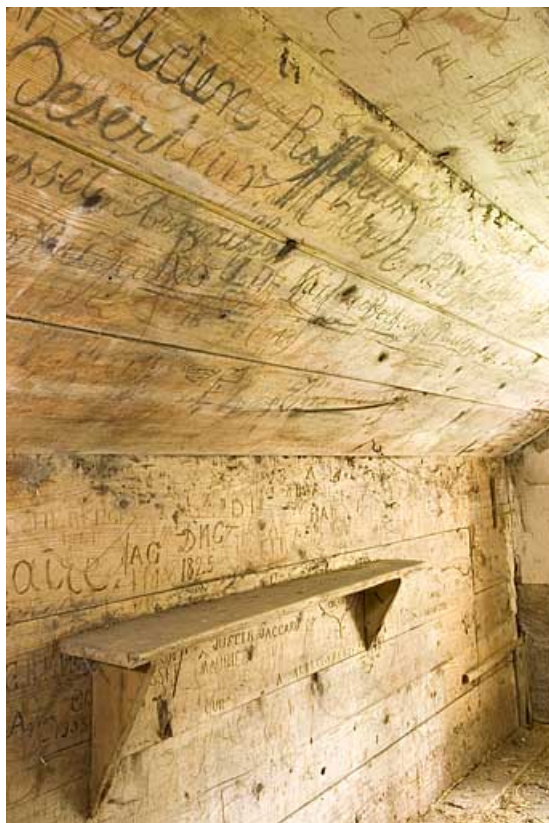
Intérieur, la chambre du berger, détail des inscriptions.