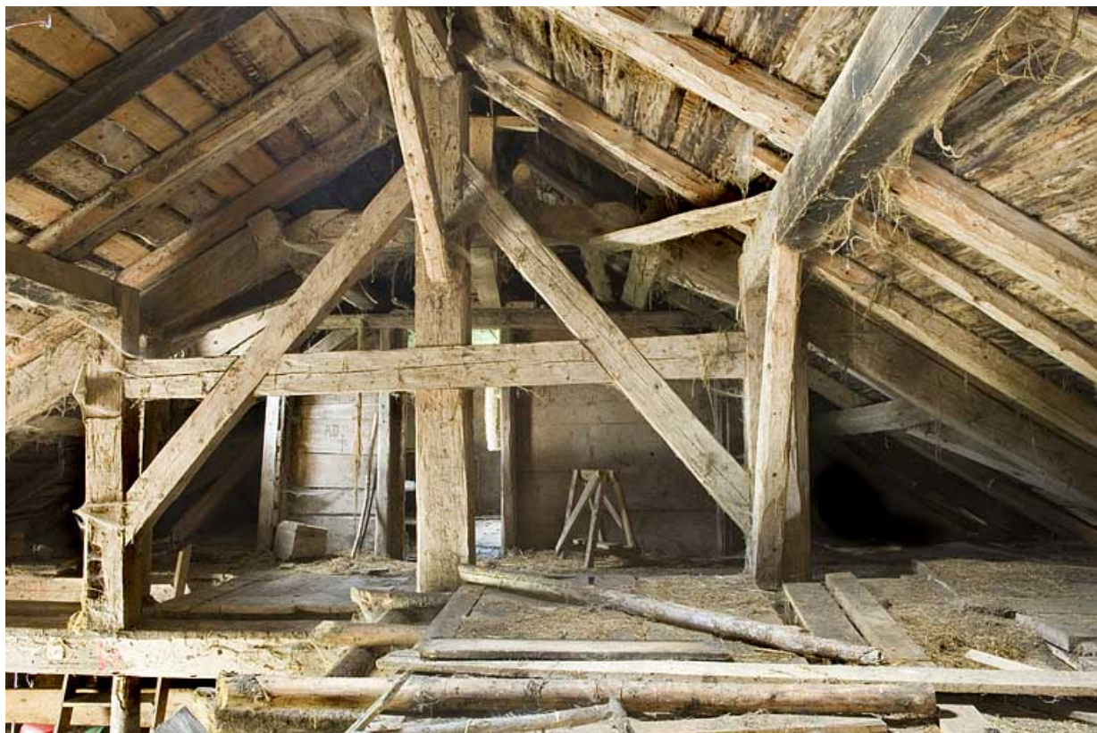
Vue générale de la charpente et, au fond, la porte ouvrant sur la chambre du berger. 25, Jougne, lieudit : la Bécasse