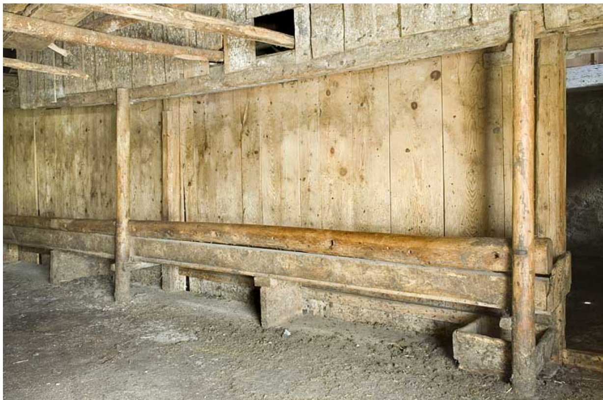
Intérieur, l'étable à vaches ou "écurie", détail : les mangeoirs ou "crèches."