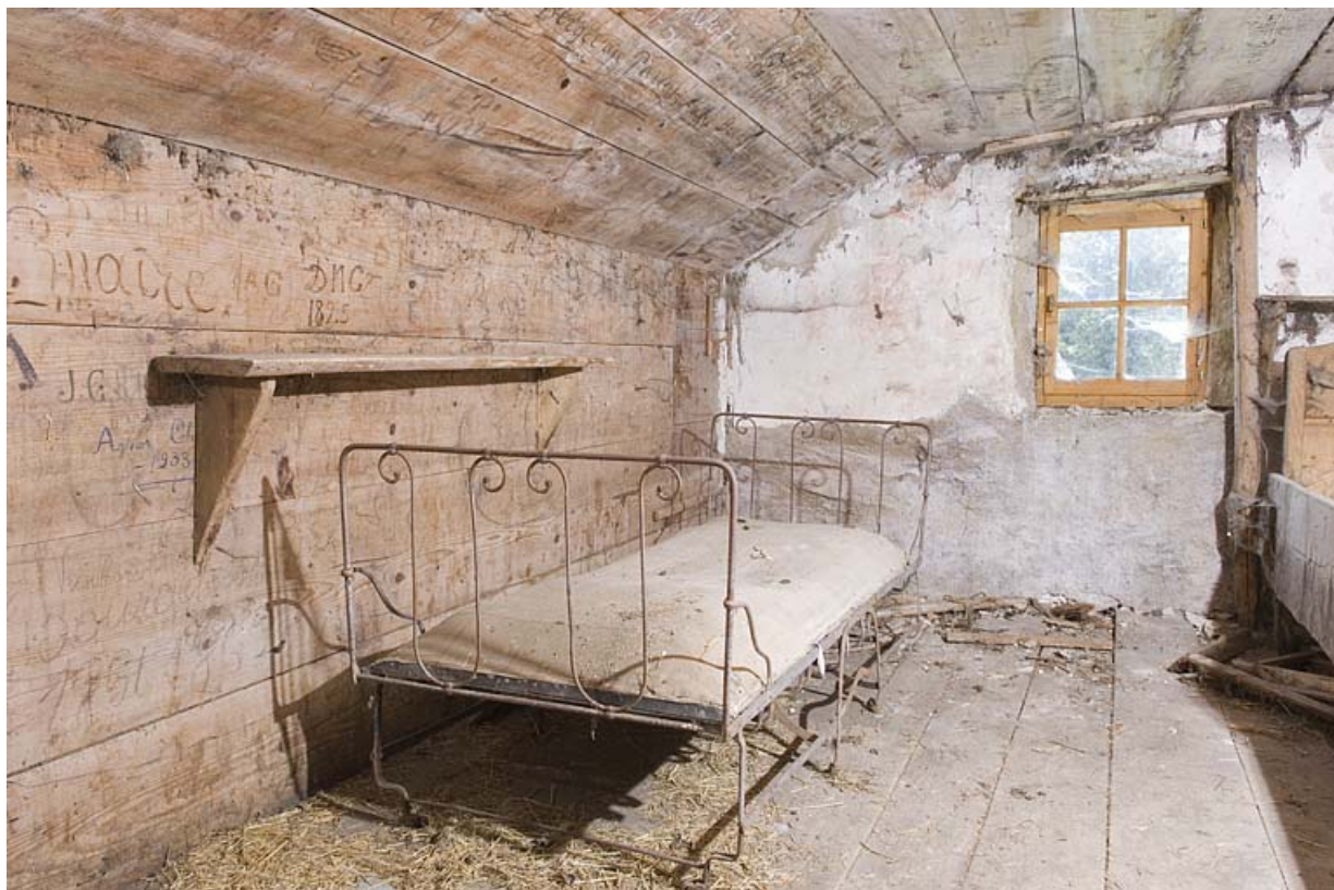
La chambre du berger.