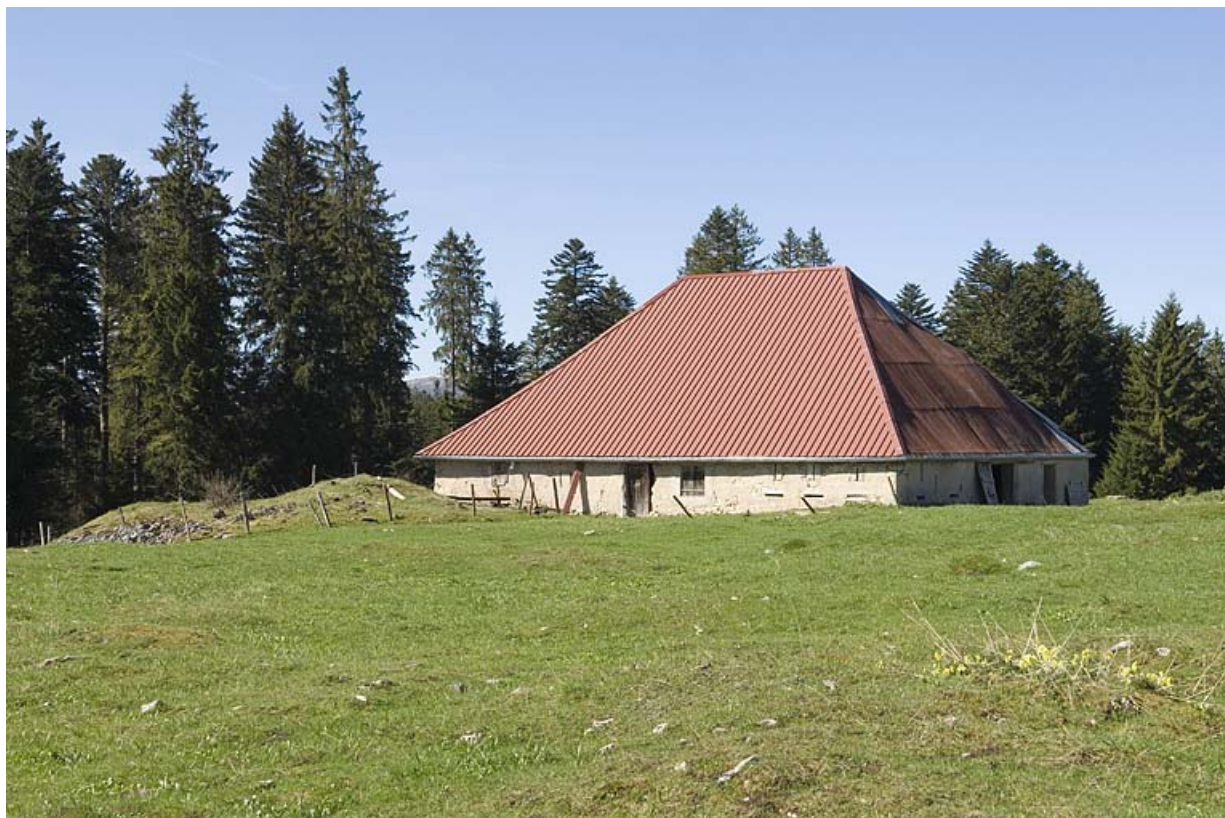
Ferme (chalet d'estive) de la Ravette. 25, Jougne