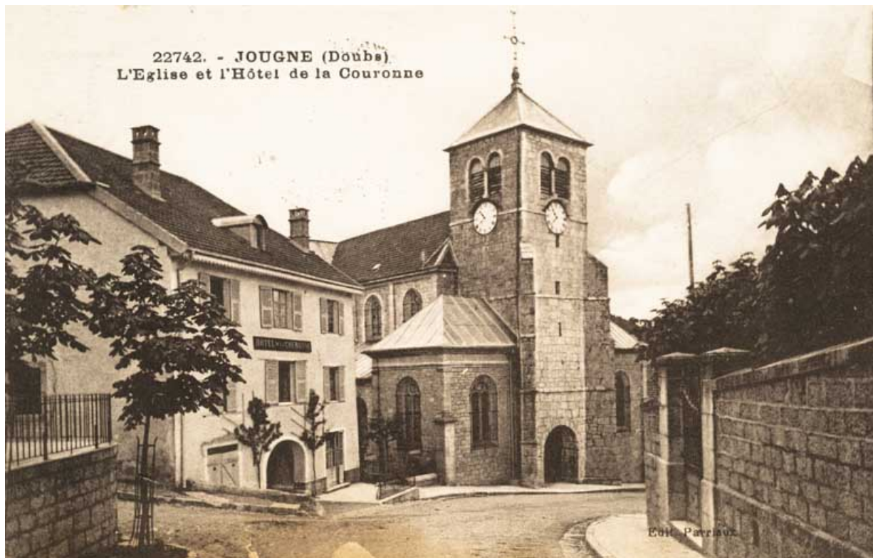
22742. - Jougne (Doubs). L'Eglise et l'Hôtel de la Couronne, [1ère moitié 20e siècle ?]. 25, Jougne