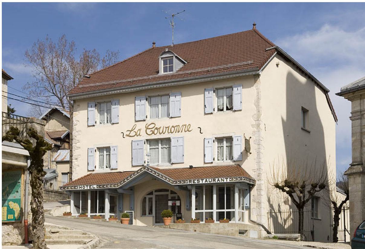
Façade antérieure et façade latérale droite. 25, Jougne, 6 rue de l' Église