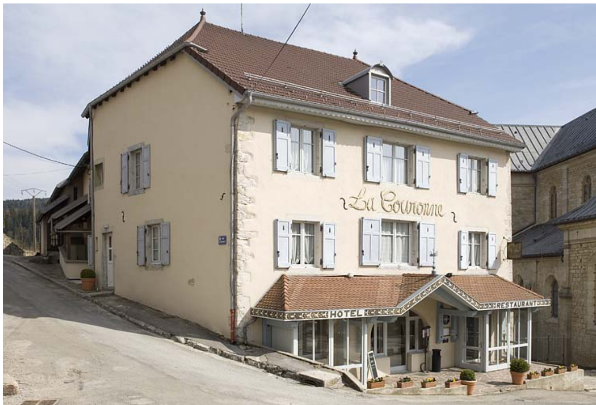
Façade antérieure et façade latérale gauche. 25, Jougne, 6 rue de l' Église