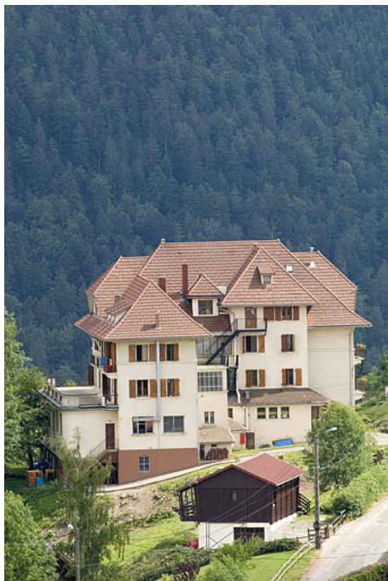
Vue plongeante, depuis le nord.