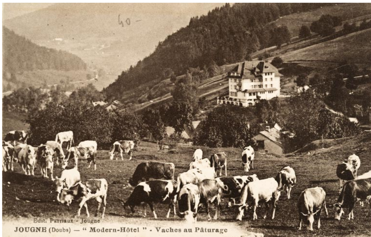
Jougne (Doubs)-"Modern-Hôtel"-Vaches au Pâturage.