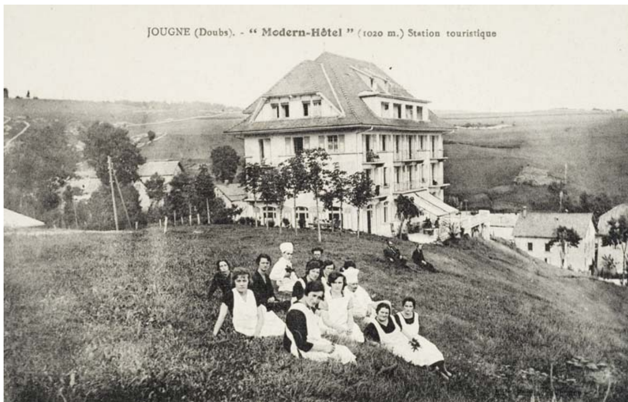
Jougne (Doubs). - "Modern'Hôtel" (1020 m.) Station touristique, [milieu 20e siècle]. 25, Jougne, 7 rue du Mont Ramey