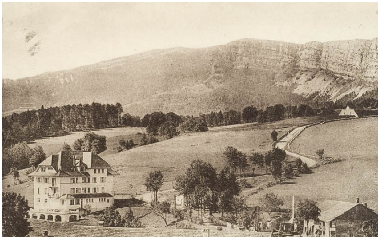
[Vue d'ensemble de l'hôtel, depuis le nord], s.d. [milieu 20e siècle].