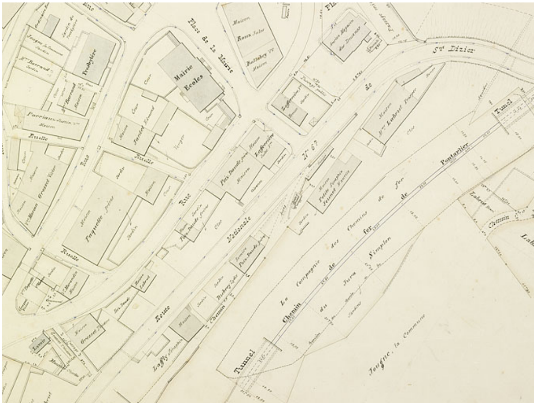
Village de Jougne. 3e feuille [détail : partie centrale, bas], [1903]. 25, Jougne