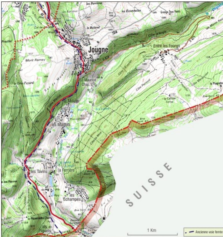
Carte de localisation de l'ancien tracé. 25, Jougne