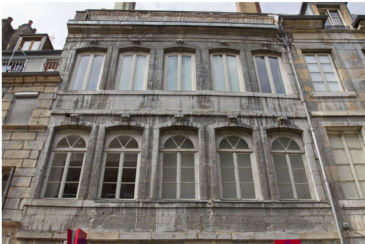
Logis principal, façade antérieure : détail des premier et deuxième étages, de face. 25, Besançon Grande Rue 28, lieudit : îlot Sainte-Ursule