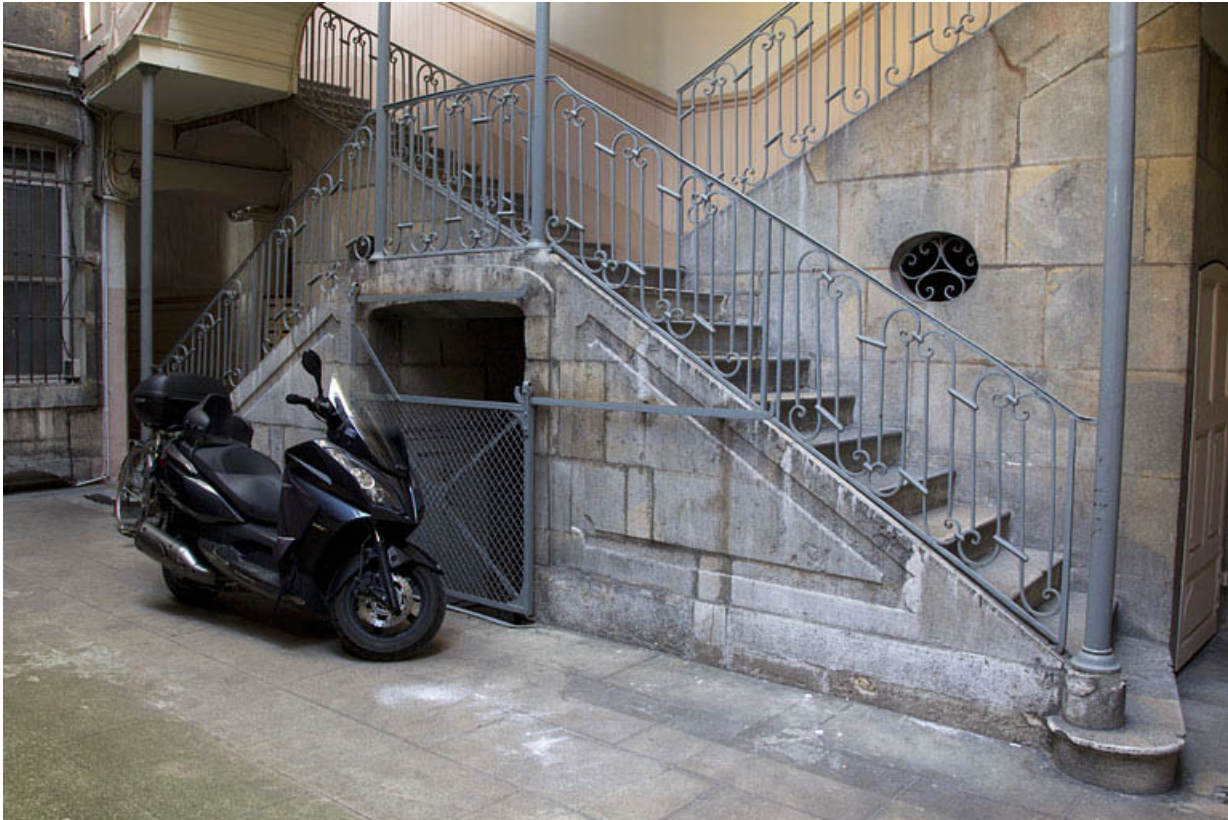
Vue des premières volées de l'escalier à cage ouverte, de trois quarts droit.

25, Besançon Grande Rue 28, lieudit : îlot Sainte-Ursule