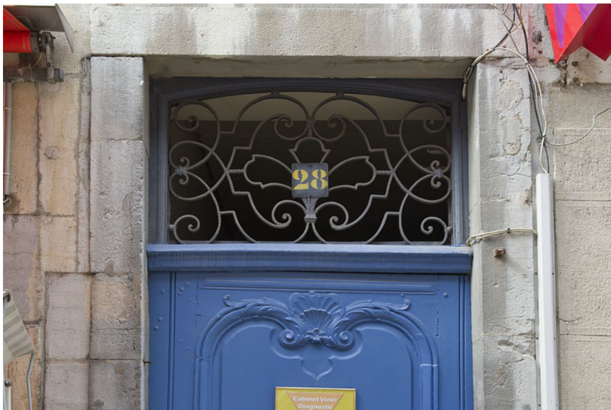
Façade antérieure de logis principal, porte du couloir : détail du dessus de porte en ferronnerie. 25, Besançon Grande Rue 28, lieudit : îlot Sainte-Ursule