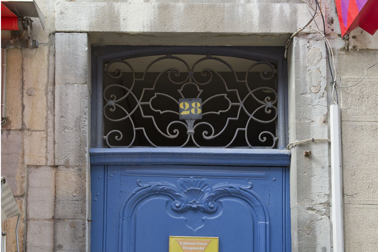
Façade antérieure de logis principal, porte du couloir : détail du dessus de porte en ferronnerie.

25, Besançon Grande Rue 28, lieudit : îlot Sainte-Ursule