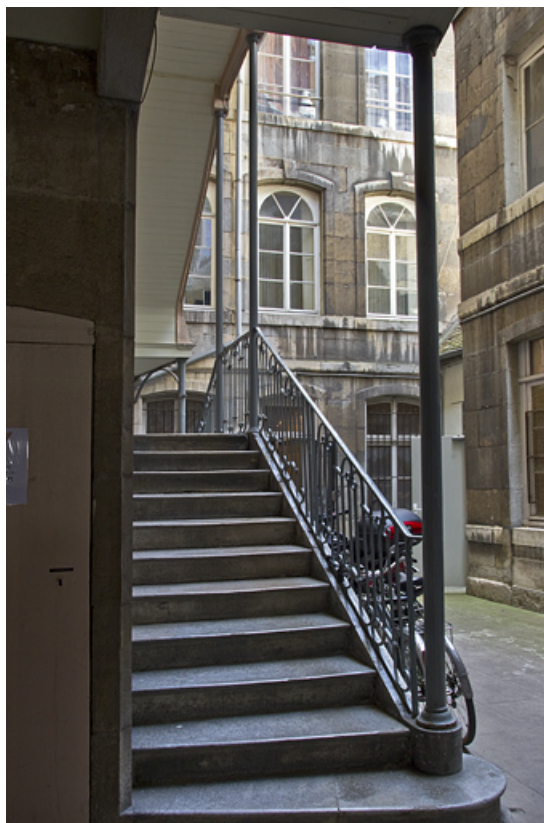
Vue du premier logis secondaire depuis le départ de l'escalier à cage ouverte. 25, Besançon Grande Rue 28, lieudit : îlot Sainte-Ursule