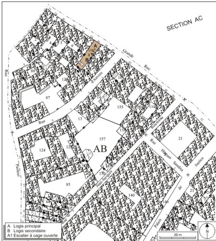
Plan masse et de situation. Extrait du plan cadastral, 1974, section AB. 25, Besançon Grande Rue 36, lieudit : îlot Sainte-Ursule